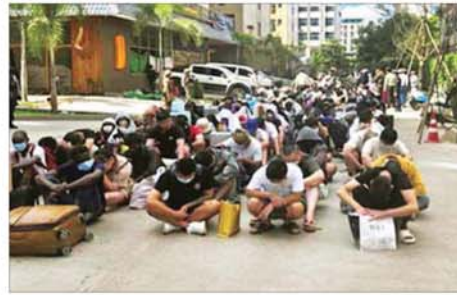
ထွက်ပြေးတိမ်းရှောင်နေသည့် နိုင်ငံခြားသား ၃၅၁ ဦး ဖမ်းဆီးထိန်းသိမ်းရရှိမှုကို တွေ့ရစဉ်။