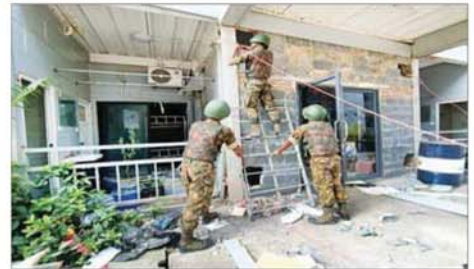
လူနေအဆောက်အအုံ လေးထပ် C 12 အား ဖောက်ခွဲရန် ယမ်း ၁၅၀ ကီလိုဂရမ် တပ်ဆင်နေစဉ်။