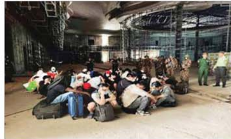
ထွက်ပြေးတိမ်းရှောင်နေသည့် နိုင်ငံခြားသား ၃၅၁ ဦး ဖမ်းဆီးထိန်းသိမ်းရရှိမှုကို တွေ့ရစဉ်။