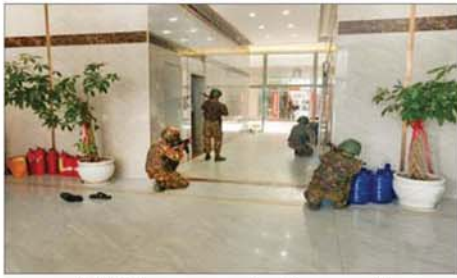
တရားမဝင် နိုင်ငံခြားသားများထားရှိသည့် အဆောက်အအုံအား ဝင်ရောက်ရှင်းလင်းနေမှုကို တွေ့ရစဉ်။