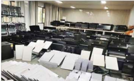
ရွှေကုက္ကိုလ်အဆောက်အအုံတစ်ခုအတွင်း ဖြတ်သိမ်းထားသည့် starlink များ တွေ့ရစဉ်။