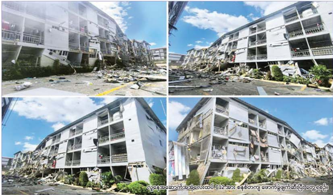
လူနေအဆောက်အအုံလေးထပ် (C12) အား စနစ်တကျ ဖောက်ခွဲဖျက်ဆီးပြီး တွေ့ရစဉ်။

နေပြည်တော် နိုဝင်ဘာ ၂၁ မြန်မာနိုင်ငံအစိုးရအနေဖြင့် နိုင်ငံတကာနှင့် တစ်ကမ္ဘာလုံးကိုအန္တရာယ်ပေးနေသည့် အွန်လိုင်းလိမ်လည်မှုများ၊ အွန်လိုင်းလောင်းကစားမှုများ တိုက်ဖျက်ရေးလုပ်ငန်းစဉ်များကို အမျိုးသားရေးတာဝန်တစ်ရပ်အနေဖြင့် အလေးထားတိုက်ဖျက်ဆောင်ရွက်လျက်ရှိပြီး အွန်လိုင်းလိမ်လည်လောင်းကစားမှုများကို အများဆုံး အခြေချလုပ်ကိုင်လျက်ရှိကြသည့် ရွှေကုက္ကိုလ်နယ်မြေနှင့် KK Park နယ်မြေများ၌ လုံခြုံရေးတပ်ဖွဲ့ဝင်များ၊ အုပ်ချုပ်ရေးအဖွဲ့အစည်းများအပါအဝင် အဖွဲ့စုံပါဝင်သည့် ပူးပေါင်းစစ်ဆင်ရေးအဖွဲ့များဖြင့် ဝင်ရောက်ရှင်းလင်းခြင်း၊ တရားမဝင်အဆောက်အအုံများအား ပြိုချပျက်ဆီးခြင်းများ ဆက်လက်ဆောင်ရွက်လျက်ရှိရာ ယနေ့အထိ မြဝတီ-မဲ့ထော်သလေး (KK Park) နယ်မြေအတွင်းရှိ တရားမဝင်အဆောက်အအုံ ၁၉၆ လုံးကို စနစ်တကျ ပြိုချပျက်ဆီးခဲ့ပြီး ရွှေကုက္ကိုလ်နယ်မြေအတွင်း၌ အွန်လိုင်းလောင်းကစားမှုနှင့် လိမ်လည်မှုများ ကျူးလွန်ခဲ့သည့် ပြည်ပ နိုင်ငံသား ၃၅၁ ဦးကို ထပ်မံဖော်ထုတ် ထိန်းသိမ်းနိုင်ခဲ့ကြောင်း သိရှိရသည်။ စာမျက်နှာ ၁၀ သို့ ၀