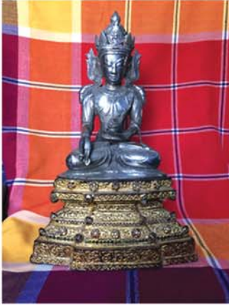
ကုန်းဘောင်ခေတ်ဦးအမြိုက်အိုးပိုက် ဆင်းတုတော်