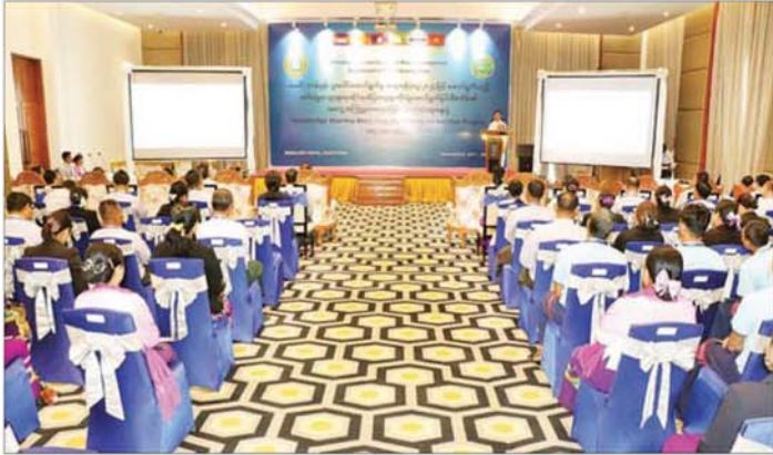
Clip ကို ကြည့်ရှုအားပေးသည်။

နေပြည်တော် နိုဝင်ဘာ ၂၁ သမဝါယမနှင့် ကျေးလက်ဖွံ့ဖြိုးရေးဝန်ကြီးဌာန ကျေးလက်ဒေသဖွံ့ဖြိုးတိုးတက်ရေးဦးစီးဌာနအနေဖြင့် “မြစ်ဝကျွန်းပေါ်ဒေသ မဲခေါင်-လန်ချန်းနိုင်ငံများ အကြား ကျေးရွာအဆင့် ဆင်းရဲမှုလျော့ချရေးဆိုင်ရာ စံပြုကျေးရွာတိုးချဲ့ဆောင်ရွက်ခြင်းစီမံကိန်း” ကို ၂၀၂၄ ခုနှစ် ဩဂုတ်လမှစတင်၍ စီမံကိန်းကာလ နှစ်နှစ်ဖြင့် ဆောင်ရွက်လျက်ရှိပြီး ယင်းစီမံကိန်း လုပ်ငန်းများ၏ အကျိုးသက်ရောက်မှု၊ ထိရောက်ကောင်းမွန်မှု၊ တွေ့ကြုံရသည့် အခက်အခဲများနှင့် အားသာချက် အားနည်းချက်များကို သုံးသပ်ဖော်ထုတ်ပြီး ပိုမိုပြည့်စုံကောင်းမွန်သည့် စီမံကိန်း ဒီဇိုင်းများ ပေါ်ပေါက်လာစေရန် ရည်ရွယ်၍ အသိပညာမျှဝေဖလှယ်ခြင်း အလုပ်ရုံဆွေးနွေးပွဲကို ယနေ့ နံနက်ပိုင်းက နေပြည်တော် M-Gallery Hotel ၌ ကျင်းပသည်။