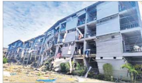
လူနေအဆောက်အအုံ လေးထပ် C 3 အား စနစ်တကျ ဖောက်ခွဲဖျက်ဆီးပြီး တွေ့ရစဉ်။