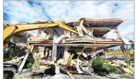
KK Park အတွင်း ယန္တရားဖြင့် ဖြိုဖျက်မည့်အဆောက်အအုံများ ဖြိုချနေမှုကို တွေ့ရစဉ်။