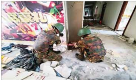
လူနေအဆောက်အအုံ လေးထပ် C 3 အား ဖောက်ခွဲရန် ယမ်း ၁၅၀ ကီလိုဂရမ် တပ်ဆင်နေစဉ်။

နိုင်ငံများသို့ ဥပဒေလုပ်ထုံး လုပ်နည်းများနှင့်အညီ စနစ်တကျ ပြည်နှင့်လွှဲပြောင်းပေးခဲ့ပြီး ကျန်ရှိသည့် ပြည်ပနိုင်ငံသား ၂၂၆၉ ဦးကို သက်ဆိုင်ရာနိုင်ငံများသို့ လွှဲပြောင်းပေးရန် အသင့်ဖြစ်နေပြီဖြစ်ကြောင်းနှင့် ၎င်းတို့ကို ကောင်းမွန်စွာ ထိန်းသိမ်း စောင့်ရှောက်ထားရှိကြောင်း သိရှိရသည်။ နိုင်ငံတော်အစိုးရ အနေဖြင့် အွန်လိုင်း လိမ်လည်လောင်းကစားမှု ကျူးလွန်မှုများကို အမျိုးသားရေးတာဝန်တစ်ရပ်အဖြစ် ခံယူကာ မြန်မာနိုင်ငံအတွင်း လုံ့ဝအခြေမပြုနိုင်ရေး ပြည်တွင်းအင်အားစုများအပြင် အိမ်နီးချင်းနိုင်ငံအစိုးရများနှင့်လည်း ပေါင်းစပ်ညှိနှိုင်း၍ ဆက်လက်ဆောင်ရွက်သွားမည်ဖြစ်ကြောင်း သတင်းရရှိသည်။ သတင်းစဉ်