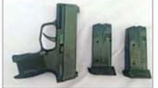
အမေရိကန်နိုင်ငံထုတ် SIG SAUER အမျိုးအစား ပစ္စတို တစ်လက်၊ ၎င်းကျည်အိမ် နှစ်ခု။