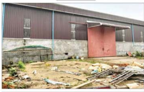
မူးယစ်ဆေးဝါးများဖမ်းဆီးရမိသည့် ဂိုဒေါင်၏ မှတ်တမ်းဓာတ်ပုံ။