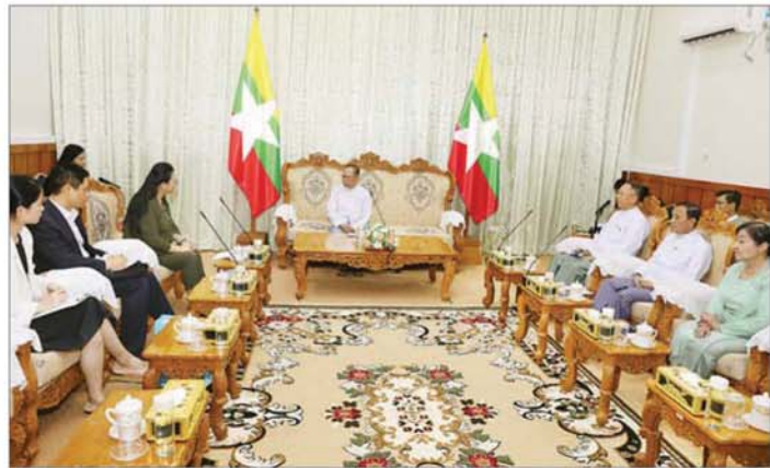
ခုံကြသည်။ အဖွဲ့ဝင်များနှင့် ကော်မရှင်ရုံးမှ တာဝန်ရှိသူများ တွေ့ဆုံပွဲသို့ပြည်ထောင်စုရွေးကောက်ပွဲကော်မရှင် တက်ရောက်ခဲ့ကြကြောင်း သိရသည်။ သတင်းစဉ်

ရင်းနှီးပွင့်လင်းစွာဆွေးနွေး ထို့နောက် ပြည်ထောင်စုရွေးကောက်ပွဲကော်မရှင် ဥက္ကဋ္ဌက ပြည်ထောင်စုရွေးကောက်ပွဲကော်မရှင် အနေဖြင့် လွတ်လပ်ပြီးတရားမျှတသော ရွေးကောက်ပွဲ အောင်မြင်စွာကျင်းပနိုင်ရေး ပြင်ဆင်ဆောင်ရွက်နေမှု များ၊ ပြည်တွင်း ပြည်ပမှ မဲဆန္ဒရှင်ပြည်သူများ ဥပဒေ နှင့်အညီ ကြိုတင်ဆန္ဒမဲပေးနိုင်ရေး ဆောင်ရွက်နေမှု များ၊ တရုတ်ပြည်သူ့သမ္မတနိုင်ငံအပါအဝင် နိုင်ငံ တကာမှ ရွေးကောက်ပွဲစောင့်ကြည့်လေ့လာရေးအဖွဲ့ များ၊ သံတမန်များအား ရွေးကောက်ပွဲစောင့်ကြည့် လေ့လာနိုင်ရေး ဆောင်ရွက်နေမှုများ၊ ရွေးကောက်ပွဲ တွင် ဝင်ရောက်ယှဉ်ပြိုင်ကြမည့် နိုင်ငံရေးပါတီများ၊ လွှတ်တော်ကိုယ်စားလှယ်လောင်းများနှင့် မဲရများ တွင် မဲဆန္ဒရှင်ပြည်သူများ လုံခြုံရေးအချမ်းအား မဲပေး နိုင်ရေးအတွက် စီစဉ်ဆောင်ရွက်ထားရှိမှု အခြေအနေ တို့ကို ရှင်းလင်းပြောကြားပြီး ရွေးကောက်ပွဲဆိုင်ရာ ကိစ္စရပ်များနှင့်စပ်လျဉ်း၍ ရင်းနှီးပွင့်လင်းစွာ ဆွေးနွေး