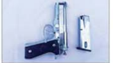
အီတလီနိုင်ငံထုတ် BERETTA အမျိုးအစား ပစ္စတို တစ်လက်၊ ၎င်းကျည်အိမ် တစ်ခု။