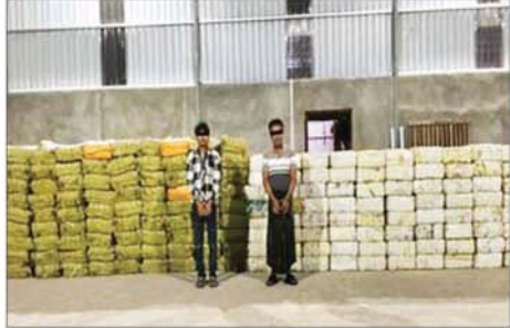
ပုသိမ်မြို့ (၁)ရပ်ကွက် ဆင်အိုးဖိုရပ် ကမ်းနားလမ်းရှိ ဂိုဒေါင်အမှတ်(၁၉)၌ တရားခံ နှစ်ဦးနှင့်အတူ မူးယစ်ဆေးဝါးများ ဖမ်းဆီးရမိမှု မှတ်တမ်းဓာတ်ပုံ။

အမေရိကန်နိုင်ငံထုတ် M-4, A-1 အမျိုးအစား သေနတ်တစ်လက်၊ ၎င်းကျည်အိမ် နှစ်ခု။