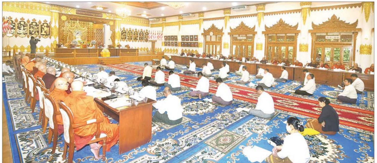
နဝမအကြိမ် နိုင်ငံတော်သံဃမဟာနာယကအဖွဲ့ ၄၇ ပါးစုံညီ တတိယအစည်းအဝေး ပထမနေ့ ကျင်းပစဉ်။