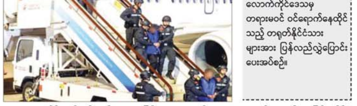
လောက်ကိုင်ဒေသမှ တရားမဝင် ဝင်ရောက်နေထိုင် သည့် တရုတ်နိုင်ငံသား များအား ပြန်လည်လွှဲပြောင်း ပေးအပ်စဉ်။