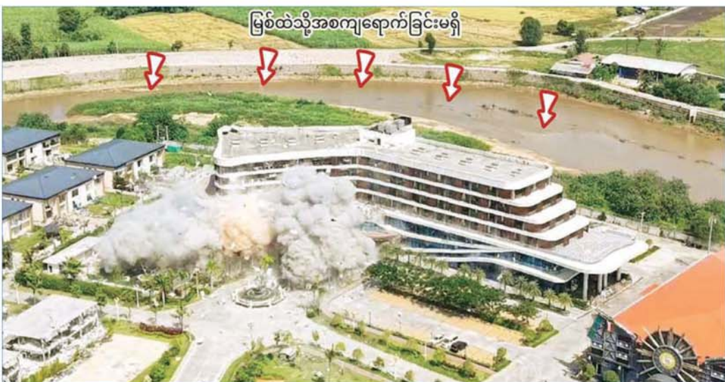
မြဝတီမြို့နယ် KK Park နယ်မြေအတွင်းရှိ အွန်လိုင်းလိမ်လည်လောင်းကစားမှုများ ပြုလုပ်နေသည့် အဆောက်အအုံများအား စနစ်တကျဖောက်ခွဲဖျက်ဆီးရှင်းလင်းနေမှုကို တွေ့ရစဉ်။

နေပြည်တော် နိုဝင်ဘာ ၁၈ မြန်မာနိုင်ငံအစိုးရအနေဖြင့် နိုင်ငံတကာနှင့် တစ်ကမ္ဘာလုံးကို အန္တရာယ်ပေးနေသည့် အွန်လိုင်းလိမ်လည်မှုများ၊ အွန်လိုင်းလောင်းကစားမှုများ တိုက်ဖျက်ရေးလုပ်ငန်းစဉ်များကို အမျိုးသားရေးတာဝန်တစ်ရပ်အဖြစ် အလေးထား တိုက်ဖျက်ဆောင်ရွက်လျက်ရှိပြီး လုံခြုံရေးတပ်ဖွဲ့ဝင်များ၊ အုပ်ချုပ်ရေးအဖွဲ့အစည်းများ၏ အသက်၊ သွေး၊ ချွေးများ၊ ယာဉ်ယန္တရားများ၊ ငွေကြေးများစွာ ကုန်ကျခံရင်းနှီးပေးဆပ်၍ ပူးပေါင်းပါဝင်တိုက်ဖျက်လျက်ရှိသည်။