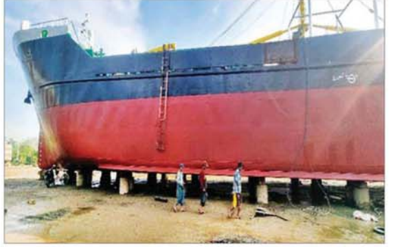
မူးယစ်ဆေးဝါးများ မလေးရှားနိုင်ငံသို့ ပို့ဆောင်ရာတွင် အသုံးပြုသည့် သိမ်းဆည်းရမိ "MV ရွှေလက်ဝါး" ကုန်တင်သင်္ဘောတစ်စင်း၏ မှတ်တမ်းဓာတ်ပုံ။