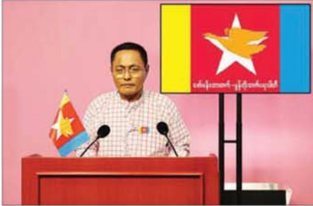
မင်္ဂလာပါခင်ဗျာ...

အဆိုပါ ဟောပြောတင်ပြချက် အပြည့်အစုံမှာ အောက်ပါအတိုင်း ဖြစ်ပါသည်-