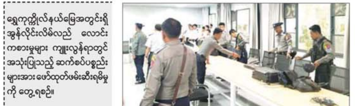
ရွှေကုက္ကိုလ်နယ်မြေအတွင်းရှိ အွန်လိုင်းလိမ်လည် လောင်း ကစားမှုများ ကျူးလွန်ရာတွင် အသုံးပြုသည့် ဆက်စပ်ပစ္စည်း များအား ဖော်ထုတ်ဖမ်းဆီးရမိမှု ကို တွေ့ရစဉ်။