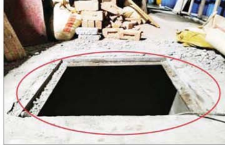
မူးယစ်ဆေးဝါးများသိမ်းဆည်းထားသည့် ဂိုဒေါင်မြေအောက်ခန်းမှတ်တမ်းဓာတ်ပုံ။