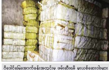
ဂိုဒေါင်မြေအောက်ခန်းအတွင်းမှ ဖမ်းဆီးရမိ မူးယစ်ဆေးဝါးများမှတ်တမ်းဓာတ်ပုံ။