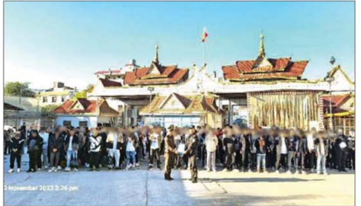
တရားမဝင် ဝင်ရောက်နေထိုင်သူများနှင့် တရားမဝင်အွန်လိုင်းလောင်းကစားနှင့် ငွေကြေးလိမ်လည်မှု လုပ်ငန်းများမှ ဖမ်းဆီးရရှိသူများအား သက်ဆိုင်ရာနိုင်ငံများသို့ ပြန်လည်လွှဲပြောင်းပေးအပ်စဉ်။

မြန်မာနိုင်ငံအစိုးရအနေဖြင့် အွန်လိုင်းလိမ်လည် လောင်းကစားမှုများ ကျူးလွန်မှုများကို နိုင်ငံတကာ နှင့်ပူးပေါင်း၍ တင်းတင်းကျပ်ကျပ် ပြတ်ပြတ်