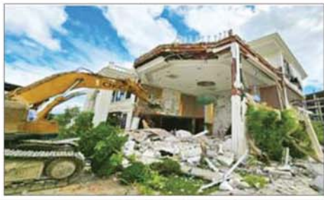
မြဝတီမြို့နယ် KK Park နယ်မြေအတွင်းရှိ ဓန့်အလိုက်မှ အဆောက်အအုံများအား ဖောက်ခွဲဖျက်ဆီးပြီးစီးမှုကို တွေ့ရစဉ်။