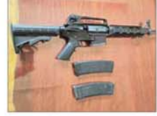
အမေရိကန်နိုင်ငံထုတ် M-4, A-1 အမျိုးအစား သေနတ်တစ်လက်၊ ၎င်းကျည်အိမ် နှစ်ခု။