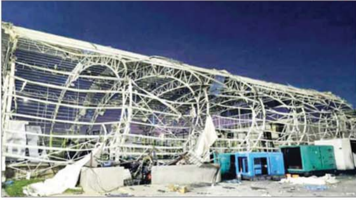
မြဝတီမြို့နယ် KK Park နယ်မြေအတွင်းရှိ စုန်အလိုက်မှ အဆောက်အအုံများအား ဖောက်ခွဲဖျက်ဆီးပြီးစီးမှုကို တွေ့ရစဉ်။