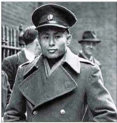
(၁၉၄၇ ခုနှစ်၊ မတ်လ ၁၃ ရက်နေ့တွင် ရွေးကောက်ပွဲနှင့်ပတ်သက်၍ ဗိုလ်ချုပ်အောင်ဆန်းပြောကြားခဲ့သည့် အသံလွှင့်မိန့်ခွန်းမှ ကောက်နုတ်ချက်)

ရွေးကောက်ပွဲဖျက်မယ်ဆိုတဲ့လူတွေကိုတော့ ကျုပ်တို့အစိုးရကလည်း ဒီတိုင်းကြည့်နေမှာ မဟုတ်ဘူး။ အပြင်းအထန်နှိပ်ကွပ်ရမှာပဲ။ ရွေးကောက်ပွဲမှာ လွတ်လပ်စွာ ယှဉ်ပြိုင်ရွေးကောက် တဲ့နေရာမှာတော့ ဘယ်သူ့ကိုမှ ကျုပ်တို့အစိုးရက နှောင့်ယှက်မှာမဟုတ်ဘူး။ သို့သော် ဖျက်လို ဖျက်ဆီးလုပ်တဲ့လူမှန်သမျှကိုတော့ အာဏာကုန်နှိမ်နင်းပစ်မှာပဲဆိုတာ ရှင်းရှင်းကြီး သတိပေး ထားပါရစေ။