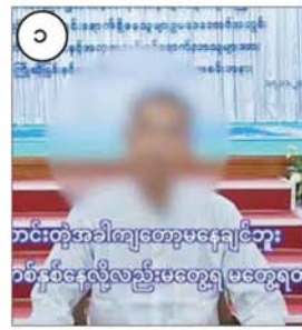
ချုပ်ထားတော့ ကျွန်တော်လည်း အချုပ် ထဲမှာ မနေချင်ဘူး။ သူတို့လက်အောက် ထဲမှာ AA တွေအထဲမှာ မနေချင်ဘူး။ မနေ ချင်တာနဲ့ ကျွန်တော်က ဖောက်ပြီးတော့ ပြေးလာခဲ့တယ်။ ထမင်းတွေလည်း အသုံး တွေ။ တစ်ခါတလေကျရင် စားမရလို့ ပစ်ခတ်ရတယ်။ ငါးခြောက်ဆို တစ်ကောင် သုံးကောင်ပဲပါတယ်။ တစ်ခါတလေကျ တာမှာမပါဘူး။ ဆားဖြူးပြီးတော့ စားရ တယ်။ ကြာလာတော့ စိတ်ပျက်လာတယ်။ အဲဒီအဖွဲ့အစည်းထဲမှာ မနေချင်တော့ဘူး။ အဲဒါနဲ့ ကျွန်တော်အလင်းဝင်ဖို့ ဆုံးဖြတ် လိုက်တယ်။

တင်စကား ပြန်လည်ပြောကြားသည်။ ထိုသို့ ဥပဒေဘောင်အတွင်း ပြန်လည် ဝင်ရောက်လာကြသူများအား ပြန်လည် ကြိုဆိုလက်ခံ၍ လိုအပ်သည့်ကူညီပံ့ပိုးမှု များ ဆောင်ရွက်ပေးကာ မိဘအုပ်ထိန်းသူ များထံသို့ စနစ်တကျ ပြန်လည်လွှဲပြောင်းပေး လျက်ရှိရာ ဥပဒေဘောင်အတွင်းသို့ ပြန်လည်ဝင်ရောက်ရန် ဆန္ဒရှိသူများ ကျန်ရှိနေသေးကြောင်း သိရှိရပြီး ဥပဒေ ဘောင်အတွင်း ပြန်လည်ဝင်ရောက်လိုသူ များအနေဖြင့် နီးစပ်ရာ ခရိုင်၊ မြို့နယ် အုပ်ချုပ်ရေးအဖွဲ့များ၊ တပ်စခန်းများနှင့် ရဲစခန်းများသို့ အမြန်ဆက်သွယ် သတင်း ပေးပို့လာပါက ကြိုဆိုလက်ခံကာ လိုအပ် သည့် ကူညီထောက်ပံ့မှုများ ပေးအပ်သွား မည်ဖြစ်ကြောင်းနှင့် လက်နက်/ခဲယမ်း များအတွက် ဆုကြေးငွေများ ပေးအပ်သွား မည်ဖြစ်ကြောင်း သိရှိရသည်။ ထိုသို့ ဥပဒေဘောင်အတွင်း ပြန်လည် ဝင်ရောက်လာသူများ၏ စကားသံများ ကိုလည်း ယခုကဲ့သို့ ကြားသိရပါသည်။ AA မှာနေတဲ့အခါကျတော့ အိမ်နဲ့ လည်း အဆက်အသွယ် မရဘူး။ ပုန်းလည်းမပြောရဘူး။ ပြီးတော့ အစား အသောက်လည်း မကောင်းဘူး။ မကောင်း တဲ့ အခါကျတော့ မနေချင်ဘူး။ တစ်လ လာလို့လည်း မမြင်ရ။ တစ်နှစ်နေလို့ လည်း မတွေ့ရတဲ့အခါ စိတ်ပျက်လာ တယ်။ နေတာထိုင်တာ စားတာ သောက် တာတွေ တဝတွေက ကြမ်းတမ်းတယ်။ တစ်ခါတလေကျရင် ရွံ့တွေ၊ ဗွက်တွေမှာ လည်း အိပ်ရတယ်။ နောက်ပြီး ငြင်းတွေ ကိုက်တယ်။ အဲဒါနဲ့ မနေချင်တာနဲ့ နောက်ကို ပြန်ပြီးတော့ဆင်းတယ်။ ဆင်းတာနဲ့ သူတို့က ကျွန်တော့်ကို ဖမ်းတယ်။ ဖမ်းပြီးတော့ ချုပ်ထားတယ်။