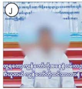
ဘယ်သူကိုမှလည်း မဆက်သွယ်ရဘူး။ အဲဒီတော့ ကျွန်တော်တို့ကအမှန်အတိုင်း ပြောရရင် ယူနီဖောင်းတွေဝတ်ထားတဲ့ ဟာမျိုးကိုပဲ ဆက်သွယ်ရပါတယ်။ အဲဒီတော့ အဲဒါမျိုးတွေတွေ့မှပဲ ပြောမယ် ဆိုပြီးတော့ ကျွန်တော်တို့ တောလမ်း အတိုင်းပဲ လျှောက်လာတယ်။ လျှောက် သာတော့ ကျွန်တော်တို့ကိုဆက်သွယ်ပေး တော့ ကျွန်တော်တို့ ဖြန့်အောင် ခလရ (၅၁)မှာ အလင်းဝင်ခဲ့ပါတယ်။ အခုဒီမှာ ပြန်ရောက်တော့ ကျွန်တော်တို့ ဘဝမှာ ရေခဲရေ သောက်လိုက်ရတာတောင် တော်တော်အကောင်းဆုံးဖြစ်နေပါတယ်။ ကျွန်တော်တို့က မထင်ထားဘူးပေါ့နော်။ ကျွန်တော်တို့ကိုတွေ့တာနဲ့ ကျွန်တော် တို့ကို သတ်မယ်လို့ပဲ ထင်ထားတာ။ ဒါပေမယ့် ကျွန်တော်တို့ထင်သလို မဟုတ် ပါဘူး။ ကျွန်တော်တို့ကို နွေးနွေးထွေးထွေး နဲ့ပဲ အားလုံးကကြိုဆိုကြပါတယ်။ စပြီး ကျွန်တော်တို့ကို လာအော်ကတည်းက ညီလင်းမင်းတို့ ဘာမှမဖြစ်ဘူး။ အေးအေး ဆေးဆေးနေ ညီလေး။ မင်းတို့အဆင်ပြေ အောင်လုပ်ပေးမယ်။ အနီးစပ်ဆုံးနဲ့ အကောင်းမွန်ဆုံးဖြစ်အောင် အစ်ကိုကြီး တို့ လုပ်ပေးမယ်လို့ ပြောပါတယ်။ အားပေးကား/အားခိုကားပဲ ကျွန်တော် တို့ကိုပြောပါတယ်။ ဒါတွေကို တွေ့ရတော့ ကျွန်တော်တို့အနေနဲ့ ဝမ်းလည်းဝမ်းသာ တယ်။ ဂုဏ်လည်း ဂုဏ်ယူတယ်။ ကျွန်တော်တို့ထင်ထားတာနဲ့ တလွဲတွေ ဖြစ်နေတယ်။ ကျွန်တော်တို့တွေ့ရလို့ ကျွန်တော်တို့ဒေသကိုလည်း ပြန်ဖို့ပေး တော့မယ်ဆိုတာ သိလိုက်တယ်။ ကျွန်တော်တို့ မိဘတွေလည်းခေါ်လို့ရ တယ်။ ကျွန်တော်တို့ နှစ်နဲ့ချီပြီးတော့ မမြင်ရ၊ မတွေ့ခဲ့ရတာကို အဆက်အသွယ် ရခဲ့ပါတယ်။ ဒါကြောင့် တပ်မတော်ကြီးကို လည်း ကျွန်တော်တို့က ကျေးဇူးတင်ပါ တယ်။ ကျွန်တော်တို့အများကို ကျွန်တော် တို့သိပြီးတော့ အလင်းလာဝင်တယ်။ ဝင်တဲ့အချိန်မှာ ကျွန်တော်တို့မိဘတွေနဲ့ ပေးတွေ့တဲ့အချိန်မှာ ဝမ်းလည်း ဝမ်းသာ တယ်။ ဒီလိုဆက်သွယ်ပေးတဲ့ တပ်မတော် ကိုရော ဆရာကြီးအကုန်လုံးကိုရော ကျွန်တော်တို့က အထူးပဲ ကျေးဇူးတင် ကြောင်း ပြောလိုပါတယ်။ သတင်းစဉ်

၂။ ကျွန်တော် PDF ထဲဝင်ရောက်တာ ကျတော့ ကရင်ပြည်နယ်ကနေစပြီးတော့ ဝင်သွားတာပါ။ ကရင်ပြည်နယ်ကနေ ဝင်ပြီးတော့ ကျွန်တော် စစ်ကိုင်းကို သွားရပါတယ်။ ကျွန်တော်တို့ စစ်တိုက် တာကအစ သူတို့ဘက်ကနေပြီးတော့ လက်ဆောင်ချက်တွေလဲပါတယ်။ ကျွန်တော် တို့ကို နိုင်ထက်စီးနင်းလုပ်တာတွေလည်း ပါတယ်။ နောက်အစားအသောက်ကအစ လူပေါပါတယ်။ အခုစစ်တိုက်တယ်ဆိုရင် လည်း ကျွန်တော်တို့ PDF တွေက ပထမစည်းမှာ စစ်တိုက်ရပါတယ်။ ကင်းစောင့်မယ်ဆိုရင်လည်း ကျွန်တော် တို့ PDF တွေကိုပဲ စောင့်ခိုင်းပါတယ်။ သူတို့က နောက်မှာပဲ နေပါတယ်။ အကြောင်းရှိလို့ရှိရင် ကျွန်တော်တို့ စစ်ပေါက်ပြီးတော့ ဒီမှာဒီထဲမှာရလို့ တာလို့ လှမ်းခေါ်လို့ရှိရင်လည်း မင်းတို့ ဘာမင်းတို့ဆုတ်လာခဲ့ ငါတို့တက်လို့မရ ဘူး။ အဲဒီလိုပြောပါတယ်။ မှန်တယ် အောက်မေ့လို့ ကျွန်တော်ဝင်ခဲ့ပါတယ်။ ဒါပေမယ့် မှန်မှန်မှန်တာ။ သူတို့ရဲ့လမ်းစဉ် က မမှန်တော့ ကျွန်တော်တို့က ဆုံးဖြတ် တယ်။ ကျွန်တော်တို့ ဒီ ၁၇ ယောက်ပြေး တယ်။ ဒီမှာ အလင်းလောင်ပြီဆိုလို့ရှိ ရင်လည်း ငါတို့နှစ်ယောက်ကလက်နက် ပါမဖြစ်မယ်။ ကျန်တဲ့သူတွေကတော့ အချုပ်ထဲမှာ။ အချုပ်ဖောက်ပြေးကြပါ တယ်။ အချုပ်ဖောက်ထွင်းပြီးတော့ အားလုံးကိုခေါ်လာပါတယ်။ ခေါ်လာ တော့ ဒီရောက်တော့ ဘယ်ရောက်လို့ ရောက်နေမှန်းတောင် မသိဘူး။ မသိတော့