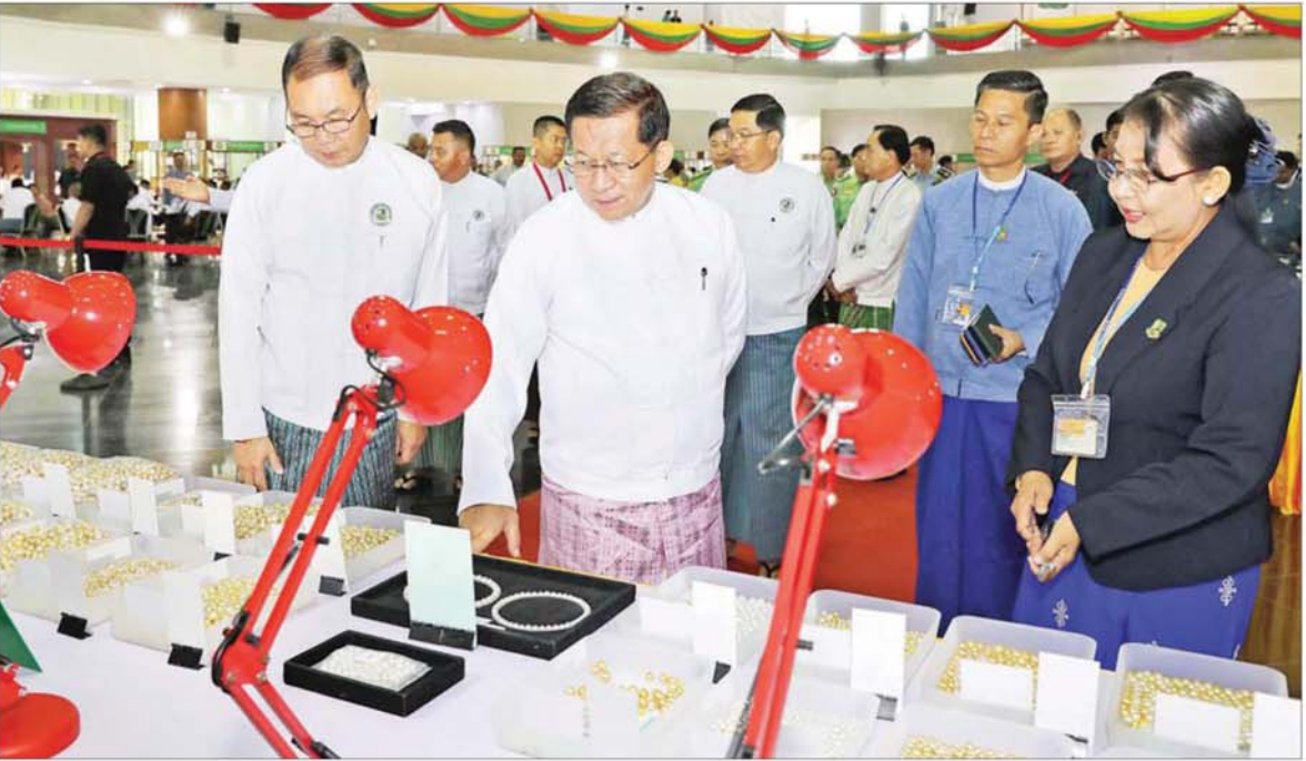
ပြည်ထောင်စုသမ္မတမြန်မာနိုင်ငံတော် ယာယီသမ္မတ နိုင်ငံတော်လုံခြုံရေးနှင့် အေးချမ်းသာယာရေးကော်မရှင်ဥက္ကဋ္ဌ ဗိုလ်ချုပ်မှူးကြီး မင်းအောင်လှိုင် မဏိရတနာ ကျောက်စိမ်းခန်းမအတွင်း ပြသထားသော ပုလဲအတွဲများကို လိုက်လံကြည့်ရှုစစ်ဆေးစဉ်။

ယင်းနောက်နိုင်ငံတော်ယာယီ သမ္မတ နိုင်ငံတော်လုံခြုံရေးနှင့် အေးချမ်းသာယာရေး ကော်မရှင် ဥက္ကဋ္ဌနှင့်အခမ်းအနားတက်ရောက် လာကြသူများသည် အကြိမ်(၆၀) မြောက် မြန်မာ့ကျောက်မျက် ရတနာပြပွဲ၌ ရောင်းချရန် မဏိ ရတနာ ကျောက်စိမ်းခန်းမအတွင်း ပြသထားသော ကျောက်စိမ်း၊ စာမျက်နှာ ၄ သို့