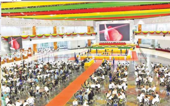
ပြည်ထောင်စုသမ္မတမြန်မာနိုင်ငံတော် ယာယီသမ္မတ နိုင်ငံတော်လုံခြုံရေးနှင့် အေးချမ်းသာယာရေးကော်မရှင်ဥက္ကဋ္ဌ ဗိုလ်ချုပ်မှူးကြီး မင်းအောင်လှိုင် မြန်မာ့ပုလဲများထုတ်လုပ်မှုနှင့် ရောင်းချနိုင်မှု၊ ကျောက်မျက်ရတနာ ပစ္စည်းများထုတ်လုပ်မှုနှင့် အကြိမ်(၆၀)မြောက် မြန်မာ့ကျောက်မျက်ရတနာပြပွဲ အခမ်းအနားကျင်းပနိုင်ရေး ပြင်ဆင်ဆောင်ရွက်ခဲ့မှု ဗီဒီယိုမှတ်တမ်းအား ကြည့်ရှုစဉ်။

စာမျက်နှာ ၃ မှ ကျောက်မျက်အတွဲများနှင့် ပုလဲ အတွဲများကို လိုက်လံကြည့်ရှု စစ်ဆေးပြီး တာဝန်ရှိသူများ၏ ရှင်းလင်းတင်ပြမှုအပေါ် နိုင်ငံတော် ယာယီသမ္မတ နိုင်ငံတော်လုံခြုံရေး နှင့် အေးချမ်းသာယာရေးကော်မရှင်