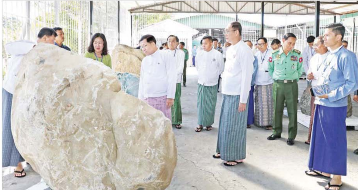
ပြည်ထောင်စုသမ္မတမြန်မာနိုင်ငံတော် ယာယီသမ္မတ နိုင်ငံတော်လုံခြုံရေးနှင့် အေးချမ်းသာယာရေးကော်မရှင်ဥက္ကဋ္ဌ ဗိုလ်ချုပ်မှူးကြီး မင်းအောင်လှိုင် မဏိရတနာကျောက်စိမ်းခန်းမ အပြင်ဘက်တွင် ခင်းကျင်းပြသထားသည့် ကျောက်စိမ်းရိုင်းအတွဲများကို လိုက်လံကြည့်ရှုစစ်ဆေးစဉ်။

“ အကြိမ် (၆၀) မြောက် မြန်မာ့ကျောက်မျက်ရတနာ ပြပွဲကို နိုဝင်ဘာ ၂၆ ရက်အထိ ကျင်းပပြုလုပ်သွားမည်ဖြစ် ပြီး ကျောက်စိမ်းရိုင်း အတွဲ ၅၀၆၄ တွဲ၊ ကျောက်စိမ်း အချောထည်အတွဲ ၂၁ တွဲ၊ ကျောက်မျက်ရိုင်းအတွဲ ၁၃ တွဲ၊ ကျောက်မျက်လက်ဝတ် ရတနာ အတွဲ ၁၄၄ တွဲ၊ ပုလဲ အတွဲ ၄၈၉ တွဲတို့ကို ပြည် တွင်း၊ ပြည်ပရတနာကုန်သည် များကို အိတ်ဖွင့်ဈေးပြိုင် တင်ဒါစနစ်ဖြင့် ရောင်းချ သွားမည် ”