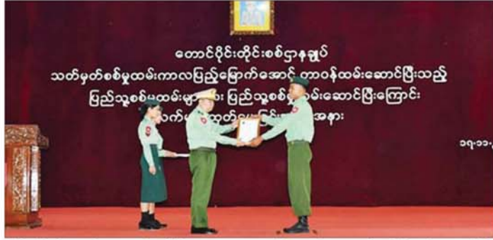
တောင်ပိုင်းတိုင်းစစ်ဌာနချုပ် သတ်မှတ်စစ်မှုထမ်းကာလပြည့်မြောက်အောင် တာဝန်ထမ်းဆောင်ပြီးသည့် ပြည်သူ့စစ်မှုထမ်းများအား ပြည်သူ့စစ်မှုထမ်းဆောင်ပြီးကြောင်း လက်မှတ်ထုတ်ပေးပွဲကျင်းပ အား ထုတ်ပေးပွဲကို ယနေ့မွန်းလွဲပိုင်းတွင် တောင်ပိုင်း တိုင်းစစ်ဌာနချုပ် အေးချမ်းဖြိုးခန်းမ၌ ပြုလုပ်ရာ

ထိုသို့ တာဝန်ထမ်းဆောင်လျက်ရှိသည့် ပြည်သူ့ စစ်မှုထမ်းစစ်သည်များအနက်မှ သုံးပုံတစ်ပုံ လျော့ပျော့ခွင့်ရရှိသည့် သတ်မှတ်စစ်မှုထမ်းကာလ