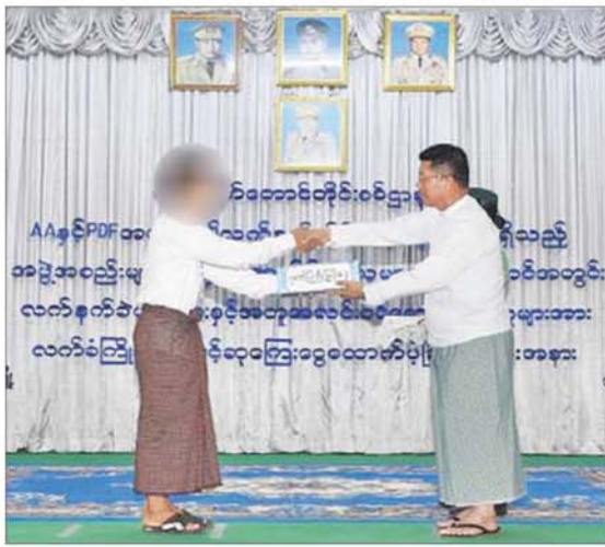
ဧရာဝတီတိုင်းဒေသကြီး ဝန်ကြီးချုပ် ဦးတင်မောင်ဝင်း၊ AA အဖွဲ့ဝင်များနှင့် PDF အဖွဲ့များမှ အလင်းဝင်ရောက်လာသူအား ချီးမြှင့်ငွေ ပေးအပ်စဉ်။

နေပြည်တော် နိုဝင်ဘာ ၁၇ နိုင်ငံတော်အစိုးရသည် PDF အပါအဝင် အဖွဲ့အစည်းအမျိုးမျိုး အမည်ခံ၍ လက်နက်ကိုင် ဆန့်ကျင်လျက်ရှိသည့် အဖွဲ့အစည်းများအတွင်း ရောက်ရှိနေသူ များအား ဥပဒေဘောင်အတွင်းသို့ ပြန်လည်ဝင်ရောက်ရန် ဖိတ်ခေါ်၍ ဥပဒေဘောင်အတွင်းသို့ ပြန်လည်ဝင်ရောက် လာကြသူများကိုလည်း လိုအပ်သည့် ကူညီပံ့ပိုးမှုများ ဆောင်ရွက်ပေးလျက်ရှိ ရာ နိုင်ငံတော်နှင့် တပ်မတော်၏ ငြိမ်းချမ်းရေးလုပ်ငန်းစဉ်များကို နားလည်သဘောပေါက်လာသည့် AA အဖွဲ့ဝင် အမျိုးသား ကိုးဦးနှင့် PDF အမည်ခံအဖွဲ့ဝင် အမျိုးသား ခြောက်ဦးတို့သည် လက်နက်၊ ခဲယမ်းများနှင့်အတူ ယနေ့တွင် ဥပဒေဘောင်အတွင်းသို့ ဝင်ရောက်လာကြသည်။