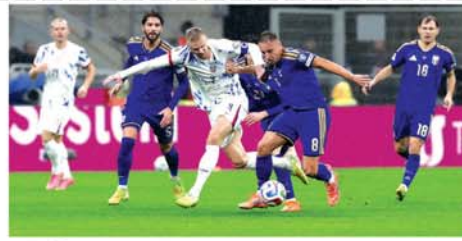
အကြိမ်ပြန်လည်ယှဉ်ပြိုင်ခွင့်ရရှိခဲ့ခြင်းဖြစ်သည်။ ၂၀၂၆ ကမ္ဘာ့ဖလား ဖြိုင်ပွဲအား ၂၀၂၆ခုနှစ် ဇွန်၊ ဇူလိုင်လ များတွင် ကျင်းပသွားမည်ဖြစ်သည်။ (အပေါ်ပုံ) (NGB)

လန်ဒန် နိုဝင်ဘာ ၁၇ - နော်ဝေလက်ရွေးစင်အသင်း ၂၀၂၆ ကမ္ဘာ့ဖလား ခြေစစ်ပွဲ အောင်မြင်နိုင်ခဲ့ပြီဖြစ်သည်။ ၂၀၂၆ ကမ္ဘာ့ဖလား ဥရောပ ဇုန် ခြေစစ်ပွဲအဖြစ် နော်ဝေ လက်ရွေးစင်အသင်းသည် အီ တလီလက်ရွေးစင်အသင်းအား လေးဂိုး၊ တစ်ဂိုးဖြင့် အနိုင်ရရှိခဲ့ပြီး နောက် ခြေစစ်ပွဲအောင်မြင်ခဲ့ခြင်း ဖြစ်သည်။ နော်ဝေလက်ရွေးစင်အသင်းသည် ၁၉၉၈ခုနှစ် ကမ္ဘာ့ဖလား ဖြိုင်ပွဲ နောက်ပိုင်း ပထမဆုံး