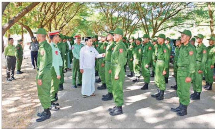
နေပြည်တော်ကောင်စီဥက္ကဋ္ဌ ဦးသန်းထွန်းဦး ပြည်သူ့စစ်မှုထမ်း သင်တန်းအမှတ်စဉ်(၁၉)သို့ တက်ရောက် ကြသည့် သင်တန်းသားများအား နှုတ်ဆက်အားပေးစဉ်။

နေပြည်တော် နိုဝင်ဘာ ၁၇ နိုင်ငံတော်ကာကွယ်ရေးနှင့် လုံခြုံရေးတာဝန် ထမ်းဆောင်နိုင်ရန် အတွက် ပြည်သူ့စစ်မှုထမ်း သင်တန်း အမှတ်စဉ်(၁၉)တွင် ပါဝင်တက်ရောက်ကြမည့် အရည်အချင်းကိုက်ညီသူ နိုင်ငံသား ကောင်းမွန်သည့် သက်ဆိုင်ရာ တိုင်းစစ်ဌာနချုပ် နယ်မြေများရှိ သင်တန်းကျောင်း အသီးသီးသို့ ရောက်ရှိ၍ လိုအပ်သည့် ကြိုတင် ပြင်ဆင်မှုများကို ဆောင်ရွက် ခဲ့ကြသည်။ ယနေ့နံနက်ပိုင်းတွင် အဆိုပါ သင်တန်းကျောင်း