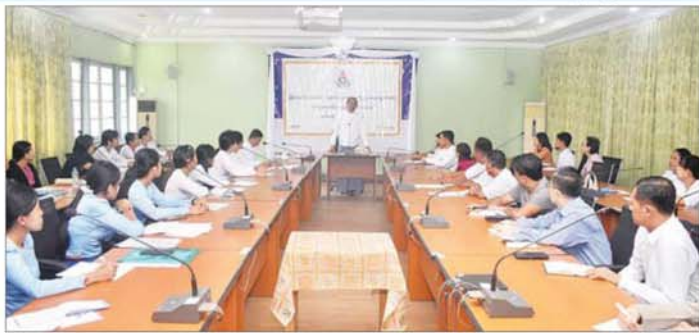
Assessor များအဖြစ် ၂၀၁၄ ခုနှစ်မှ စတင်အသိအမှတ်ပြုပေးခဲ့ရာ ယနေ့ အထိ Assessor ၉၁၄ ဦး အသိ အမှတ်ပြုနိုင်ခဲ့ပြီး ဖြစ်ကြောင်း၊ ယနေ့ တက်ရောက်လာသူများ အနေဖြင့် Assessor အသိအမှတ် ပြုလက်မှတ်ရရှိပါက NSSA ၏ လုပ်ငန်းစဉ်များတွင် ပူးပေါင်း ဆောင်ရွက်ပေးစေလိုကြောင်းနှင့် ခေတ်အလိုက် ပြောင်းလဲတိုးတက် သည့် နည်းပညာများကို အစီလိုက် နိုင်စေရေးစဉ်ဆက်မပြတ်လေ့လာ သွားရန် တိုက်တွန်းပြောကြားခဲ့ ကြောင်း သိရသည်။ သတင်းစဉ်

ဦးစွာ ဒုတိယဝန်ကြီးက NSSA ၏ ကျွမ်းကျင်မှုစစ်ဆေးအကဲဖြတ် ခြင်းလုပ်ငန်းစဉ်များတွင် ပါဝင် ဆောင်ရွက်မည့် စစ်ဆေးအကဲ ဖြတ်သူ(Assessor)များသည် Key Player များအဖြစ် ပါဝင်ဆောင် ရွက်ရသည့်အတွက် Assessor များ၏အခန်းကဏ္ဍ အလွန်အရေး ပါကြောင်း၊ စစ်ဆေးအကဲဖြတ်ရေး လုပ်ငန်းစဉ်များ ဆောင်ရွက်ရာ တွင် လက်တွေ့သုံးပစ္စည်းများကို ကြိုတင်စစ်ဆေးခြင်း၊ ဖြေဆိုသူ လက်စွဲစာအုပ်ပါ စည်းမျဉ်းစည်း ကမ်းများအား ရှင်းလင်းမှုပေးခြင်း၊ ဖြေဆိုရာတွင် တွေ့ကြုံနိုင်သော အခက်အခဲများမျှဝေခြင်း၊ စာတွေ့/ လက်တွေ့ နမူနာပုံစံများ မျှဝေ ခြင်း၊ ဖြေဆိုသူများ ဝင်ရောက် မြေဆိုရန် အရည်အချင်းပြည့်မီမှု ရှိ/မရှိ အကဲဖြတ်ခြင်း၊ ကြိုတင် စစ်ဆေးခြင်းတို့အပြင် ဖြေဆိုသူများ ကို အနီးကပ်ကြိုကြပ် ဆောင်ရွက် ပေးရသည့်လုပ်ငန်းစဉ်များ ဆောင် ရွက်ပေးရကြောင်း၊ သင်တန်း တက်ရောက်လာသူ ဘာသာရပ် ဆိုင်ရာ ကျွမ်းကျင်သူများအနေ ဖြင့် သင်တန်းတွင် ပို့ချပေးသည့် အသိပညာ၊ ဗဟုသုတများကို လက်တွေ့ လိုက်နာဆောင်ရွက် နိုင်ရေး သေချာမှတ်သားသွား စေလိုကြောင်း၊ NSSA အသိအမှတ်ပြု