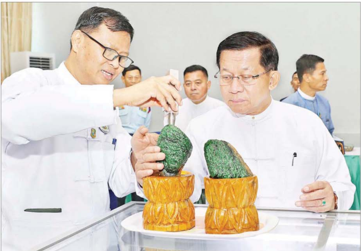
ပြည်ထောင်စုသမ္မတမြန်မာနိုင်ငံတော် ယာယီသမ္မတ နိုင်ငံတော်လုံခြုံရေးနှင့် အေးချမ်းသာယာရေး ကော်မရှင်ဥက္ကဋ္ဌ ဗိုလ်ချုပ်မှူးကြီး မင်းအောင်လှိုင် မဏိရတနာ ကျောက်စိမ်းခန်းမ အတွင်း ရောင်းချရန်ပြသထားသော ကျောက်စိမ်း၊ ကျောက်မျက်အတွဲများနှင့် ပုလဲအတွဲများကို လိုက်လံကြည့်ရှုစစ်ဆေးစဉ်။

နေပြည်တော် နိုဝင်ဘာ ၁၇ အကြိမ်(၆၀)မြောက် မြန်မာ့ ကျောက်မျက်ရတနာပြပွဲ ဖွင့်ပွဲ အခမ်းအနားကို ယနေ့နံနက်ပိုင်း တွင် နေပြည်တော်ရှိ မဏိရတနာ ကျောက်စိမ်းခန်းမ၌ ကျင်းပရာ ပြည်ထောင်စုသမ္မတမြန်မာနိုင်ငံ တော် ယာယီသမ္မတ နိုင်ငံတော် လုံခြုံရေးနှင့် အေးချမ်းသာယာရေး ကော်မရှင်ဥက္ကဋ္ဌ ဗိုလ်ချုပ်မှူးကြီး မင်းအောင်လှိုင် တက်ရောက်ချီးမြှင့် သည်။