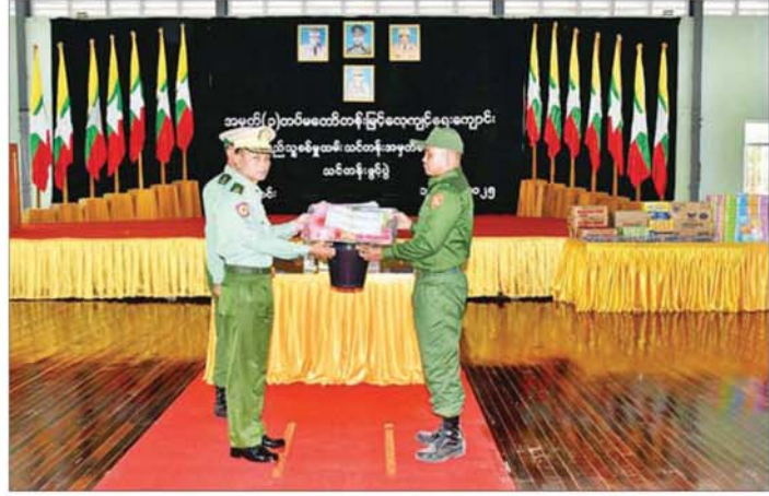
အရှေ့အလယ်ပိုင်းတိုင်းစစ်ဌာနချုပ် အမှတ်(၁) တပ်မတော်တန်းမြင့်လေ့ကျင့်ရေးသင်တန်းကျောင်း၌ ပြုလုပ်သည့် ပြည်သူ့စစ်မှုထမ်း သင်တန်းအမှတ်စဉ်(၁၉) သင်တန်းဖွင့်ပွဲတွင် တိုင်းမှူး ဗိုလ်ချုပ် စိုးမြတ်ထွဋ် သင်တန်းသားများအတွက် အသုံးအဆောင်ပစ္စည်းများ ပေးအပ်စဉ်။

ယနေ့တွင် ဖွင့်လှစ်လိုက်သည့် ပြည်သူ့စစ်မှုထမ်း သင်တန်း အမှတ်စဉ်(၁၉)မှ နိုင်ငံသားကောင်း လူငယ်များအဖြစ် နိုင်ငံတော် ကာကွယ်ရေးနှင့် လုံခြုံရေးတာဝန် များကို ဂုဏ်ယူစွာထမ်းဆောင် ရန် သင်တန်းတက်ရောက်ကြမည့် သင်တန်းသားများ၏ စကားသံ များကိုလည်း ယခုလိုပဲ ကြားသိရ ပါသည်-