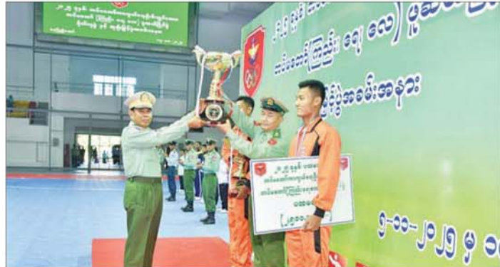
ဦးစီးချုပ်ဖလား တပ်မတော်(ကြည်း၊ ရေ၊ လေ) ဖူဆယ် ပြိုင်ပွဲ ဗိုလ်လုပွဲအဖြစ် ကာကွယ်ရေးဦးစီးချုပ်ရုံး(ရေ) ကိုယ်စားပြုအသင်းနှင့် ရန်ကုန်တိုင်းစစ်ဌာနချုပ် ကိုယ်စားပြုအသင်းတို့ ယှဉ်ပြိုင်ကစားကြရာ ရန်ကုန် တိုင်းစစ်ဌာနချုပ်ကိုယ်စားပြုအသင်းက ကာကွယ် ရေးဦးစီးချုပ်ရုံး(ရေ) ကိုယ်စားပြုအသင်းကို ၁၁ ဂိုး ၂ ဂိုးဖြင့် အနိုင်ရရှိခဲ့သည်။

နေပြည်တော် နိုဝင်ဘာ ၁၇ ၂၀၂၅ ခုနှစ် တပ်မတော်ကာကွယ်ရေးဦးစီးချုပ်ဖလား တပ်မတော်(ကြည်း၊ ရေ၊ လေ) ဖူဆယ်ပြိုင်ပွဲ ဗိုလ်လုပွဲ နှင့် ဆုချီးမြှင့်ပွဲအခမ်းအနားကို ယနေ့နံနက်ပိုင်းတွင် နေပြည်တော်ရှိ စေယျာသီရိ တပ်မတော်အားကစားရုံ (A) ရှိ ကျင်းပပြုလုပ်ရာ နိုင်ငံတော်လုံခြုံရေးနှင့် အေးချမ်းသာယာရေးကော်မရှင်ဥက္ကဋ္ဌ တပ်မတော် ကာကွယ်ရေးဦးစီးချုပ် ဗိုလ်ချုပ်မှူးကြီး မင်းအောင်လှိုင် ကိုယ်စား တပ်မတော်အားကစားနှင့် ကာယပညာ အုပ်ချုပ်ရေးအဖွဲ့ဥက္ကဋ္ဌ စစ်ရေးချုပ် ဒုတိယဗိုလ်ချုပ်ကြီး ဖုန်းမြတ် တက်ရောက်သည်။