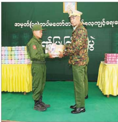
ကြိုက်ဒေသတိုင်းစစ်ဌာနချုပ် နယ်မြေခံလေ့ကျင့်ရေးကျောင်း၌ ပြုလုပ်သော ပြည်သူ့စစ်မှုထမ်း သင်တန်းအမှတ်စဉ်(၁၉) သင်တန်း ဖွင့်ပွဲ၌ တိုင်းမှူး ဗိုလ်ချုပ် ဦးလှိုင် အားကစားပစ္စည်းများ ထောက်ပံ့ ပေးအပ်စဉ်။

အတွက် စစ်ပညာသင်ကြားရန်နှင့် နိုင်ငံတော်၏ ကာကွယ်ရေးတာဝန် များကို ထမ်းဆောင်နိုင်ရန် ရည်ရွယ်၍ ပြည်သူ့စစ်မှုထမ်း ဥပဒေကို ၂၀၂၄ ခုနှစ်၊ ဖေဖော်ဝါရီ လ ၁၀ ရက်တွင် စတင်အာဏာ တည်စေခဲ့ပြီး ပြည်သူ့စစ်မှုထမ်း သင်တန်းများကို ဖွင့်လှစ်သင်ကြား ပေးခဲ့သည်။ အဆိုပါပြည်သူ့စစ်မှု ထမ်း သင်တန်းများမှ သင်တန်း ဆင်းခဲ့သည့် ပြည်သူ့စစ်မှုထမ်း နိုင်ငံသားကောင်းမွန်သည့် တာဝန် ကျရာ တပ်ရင်း/တပ်ဖွဲ့အသီးသီး တွင် နိုင်ငံတော်ကာကွယ်ရေးနှင့် လုံခြုံရေးတာဝန်များကို ဦးလည် မသုန် ကျေပွန်စွာ ထမ်းဆောင် နေကြပြီ ဖြစ်သည်။