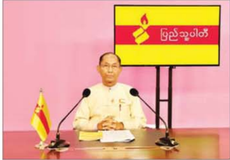
နိုင်ငံတော်ရဲ့ အချုပ်အခြာအာဏာပိုင်ရဲ့ အစစ်အမှန်ဖြစ်ကြတဲ့ မဲဆန္ဒရှင် ပြည်သူများ ခင်ဗျာ...

ပြည်သူ့ပါတီ ဥက္ကဋ္ဌ ဦးကိုကိုကြီး က ၎င်းတို့၏ မူဝါဒ၊ သဘောထား၊ လုပ်ငန်းစဉ် စသည်တို့ကို နိုဝင်ဘာ ၁၇ ရက် ညပိုင်းတွင် ရေဒီယိုနှင့် ရုပ်မြင်သံကြား အစီအစဉ်များမှ ဟောပြောတင်ပြခဲ့ပါသည်။ အဆိုပါ ဟောပြောတင်ပြချက် အပြည့်အစုံမှာ အောက်ပါအတိုင်း ဖြစ်ပါသည်-