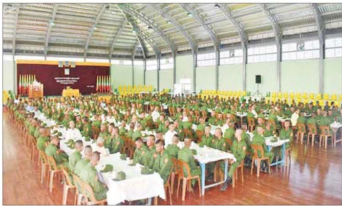
ရန်ကုန်တိုင်းဒေသကြီး ဝန်ကြီးချုပ် ဦးစိုးသိန်း နယ်မြေခံသင်တန်းကျောင်း၌ ပြုလုပ်သည့် ပြည်သူ့စစ်မှုထမ်း သင်တန်းအမှတ်စဉ်(၁၉) သင်တန်းဖွင့်ပွဲတွင် ဂုဏ်ပြုအမှာစကားပြောကြားစဉ်။