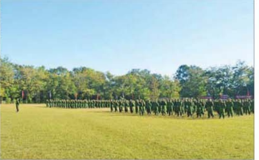
တောင်ပိုင်းတိုင်းစစ်ဌာနချုပ် အမှတ်(၆) တပ်မတော်တန်းမြင့်လေ့ကျင့်ရေးကျောင်း၌ ပြုလုပ်သည့် ပြည်သူ့စစ်မှုထမ်း သင်တန်းအမှတ်စဉ် (၁၉) ဖွင့်ပွဲအခမ်းအနားတွင် နယ်မြေခံသင်တန်းကျောင်းမှ ကျောင်းအုပ်ကြီး အမှာစကားပြောကြားစဉ်။