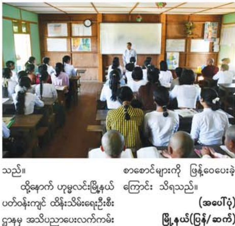
သည်။ ထို့နောက် ဟုမ္မလင်းမြို့နယ် ပတ်ဝန်းကျင် ထိန်းသိမ်းရေးဦးစီး ဌာနမှ အသိပညာပေးလက်ကမ်း စာစောင်များကို ဖြန့်ဝေပေးခဲ့ ကြောင်း သိရသည်။ (အပေါ်ပုံ) မြို့နယ်(ပြန်/ဆက်)