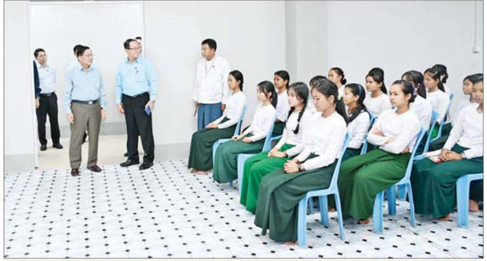
ပြည်ထောင်စုသမ္မတမြန်မာနိုင်ငံတော် ယာယီသမ္မတ နိုင်ငံတော်လုံခြုံရေးနှင့် အေးချမ်းသာယာရေးကော်မရှင်ဥက္ကဋ္ဌ ဝဋ်ဇာလှိုင်မြို့ကြီး မင်းအောင်လှိုင် ကရင်ပြည်နယ် လူငယ်စင်တာအတွင်း ကြည့်ရှုစစ်ဆေးစဉ်။

များအလိုက် လုပ်ငန်းခွင် ဝင်ရောက်နိုင်သည့် Polytechnic ကျောင်းများ ဖွင့်လှစ်သင်ကြားနိုင်ရေး စီစဉ်ဆောင်ရွက်နေကြောင်း။ တိုးတက်သည့် နိုင်ငံတိုင်းသည် ပညာတတ်များ ပေါကြွယ်ဝပြီး ရာနှုန်းပြည့်နီးပါးခန့် အဆင့်မြင့် ပညာများ တတ်မြောက်သည့် နိုင်ငံများဖြစ်သည်ကို တွေ့ရကြောင်း၊ မိမိတို့နိုင်ငံအနေဖြင့် အခြေခံပညာအဆင့်၊ အလယ်တန်းပညာအဆင့်၊ အထက်တန်းပညာအဆင့်နှင့် အဆင့်မြင့်ပညာအဆင့်များအလိုက် ပြီးဆုံးမှုများမှာ ရာခိုင်နှုန်းအလိုက် နည်းပါးမှု ရှိသည်ကို တွေ့ရကြောင်း၊ ကရင်ပြည်နယ်အတွင်း အလုပ်အကိုင် အခွင့်အလမ်းများစွာရှိပြီး အမှန်တကယ် လုပ်ကိုင်နိုင်ကြရန်နှင့် နည်းစနစ်တကျဖြင့် ဆောင်ရွက်နိုင်ရန်လိုအပ်ကြောင်း။