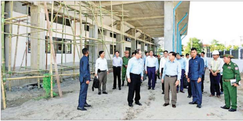
ပြည်ထောင်စုသမ္မတမြန်မာနိုင်ငံတော် ယာယီသမ္မတ နိုင်ငံတော်လုံခြုံရေးနှင့် အေးချမ်းသာယာရေးကော်မရှင်ဥက္ကဋ္ဌ ဗိုလ်ချုပ်မှူးကြီး မင်းအောင်လှိုင် ဇွဲကပင် မိုးလုံလေလုံအားကစားရုံ တည်ဆောက်နေမှုလုပ်ငန်းခွင်ကို ကြည့်ရှုစစ်ဆေးစဉ်။

ကရင်ပြည်နယ်သည် နိုင်ငံလွတ်လပ်ရေး ရပြီးချိန်ကတည်းက လက်နက်ကိုင်သောင်းကျန်းမှုများကြောင့် တည်ငြိမ်အေးချမ်းမှုများပျက်ယွင်းပြီး ပြည်နယ်အတွင်းနေထိုင်သည့် ပြည်သူများ ထိခိုက်သက်သာ နိုင်ငံတော်အနေဖြင့်လည်း ထိခိုက်မှုများရှိကြောင်း၊ ကရင်ပြည်နယ် တည်ငြိမ်အေးချမ်းမှု ပျက်ယွင်းအောင် လုပ်ဆောင်နေသူများသည် ကရင်ပြည်နယ်အတွင်းရှိ လက်နက်ကိုင်အဖွဲ့အစည်းများပင်ဖြစ်ကြောင်း၊ တည်ငြိမ်အေးချမ်းမှုရှိ မှသာလျှင် ပညာသင်ကြားနိုင်မည်၊ ပြည်သူများ၏ ကျန်းမာရေးစောင့်ရှောက်မှု လုပ်ငန်းများကို ဆောင်ရွက်နိုင်မည်၊ ဒေသဖွံ့ဖြိုးတိုးတက်ရေး လုပ်ငန်းများကို ဆောင်ရွက်နိုင်မည် ဖြစ်ကြောင်း၊ ထို့ကြောင့် ပြည်နယ်၏ ဖွံ့ဖြိုးတိုးတက်မှုကို ဖျက်ဆီးနေသည့် တည်ငြိမ်အေးချမ်းမှု ပျက်ယွင်းအောင် ဆောင်ရွက်နေမှုများကို ပြည်နယ်အတွင်း နေထိုင်ကြသူများအနေဖြင့် နည်းလမ်းပေါင်းစုံဖြင့် ကာကွယ်ဆောင်ရွက်သွားကြရန်လိုကြောင်း၊ နိုင်ငံတော်အနေဖြင့် ကရင်ပြည်နယ်အတွင်း ဒေသ တည်ငြိမ်အေးချမ်းမှု ပျက်ယွင်းအောင် လုပ်ဆောင်နေမှုများကို ရှင်းလင်းဆောင်ရွက်လျက် ရှိကြောင်း၊ အဖွဲ့လိုင်းငွေကြေး လိမ်လည်မှုနှင့် အဖွဲ့လိုင်း