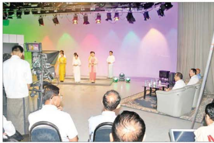
ပြည်ထောင်စုဝန်ကြီး ဦးမောင်မောင်အုန်း ရန်ကုန်မြို့၊ ပြည်လမ်းရှိ မြန်မာ့အသံနှင့် ရုပ်မြင်သံကြား၌ ရွေးကောက်ပွဲလှုံ့ဆော်တေး ရိုက်ကူးနေမှုကို ကြည့်ရှုအားပေးစဉ်။

အားပေးပြီး လိုအပ်သည်များ မှာကြားကာ ညှိနှိုင်းပေါင်းစပ် ဆောင်ရွက်ပေးသည်။ အဆိုပါလှုံ့ဆော်တေးသီချင်းကို မြန်မာနိုင်ငံ ဂီတအစည်းအရုံး(ဗဟို) နှင့် အကော်ဒီယံ အောင်မင်းနိုင်တို့ က ရေးသားပြီး ဂီတမျိုးအကယ်ဒမီ ဝင်းကိုနှင့်အဖွဲ့က တီးခတ် အသံသွင်းကာ ယနေ့တွင် ရိုက်ကူး ရေးဆောင်ရွက်ခြင်း ဖြစ်သည်။ ထို့နောက်ပြည်ထောင်စုဝန်ကြီး သည် မြန်မာနိုင်ငံ ဂီတအစည်း အရုံး (ဗဟို)ဥက္ကဋ္ဌ ဦးလွင်မြင့်နှင့် တာဝန်ရှိသူများ၊ ရွေးကောက်ပွဲ လှုံ့ဆော်တေးသီချင်း ဖျော်ဖြေကြ မည့် တေးသံရှင်များနှင့် တွေ့ဆုံ ပြီး ၂၀၂၅ ခုနှစ် ပါတီစုံဒီမိုကရေစီ အထွေထွေရွေးကောက်ပွဲကြီးတွင် ပြည်သူများ လွတ်လပ်မျှတစွာ ဆန္ဒမဲပေးနိုင်ရေးအတွက် မှန်ကန် စွာ အသိပညာပေးနိုင်ရေး၊ ဆန္ဒမဲ ပေးခွင့်ရှိသော ပြည်သူများအနေ ဖြင့် မဲပေးခွင့်မဆုံးရှုံးစေရေးနှင့် နိုင်ငံနှင့် ဒေသပွဲပြီးတိုးတက်ရေး ဆောင်ရွက်နိုင်မည့် သူများအား မှန်ကန်စွာ ရွေးချယ်မဲပေးနိုင်ရေး တို့အတွက် အနုပညာရှင်များက ယခုကဲ့သို့ ဆန္ဒအလျောက် တက်ကြွစွာ ပါဝင်ဆောင်ရွက်မှု အပေါ် ဂုဏ်ယူအသိအမှတ်ပြုပါ ကြောင်း၊ အနုပညာရှင်များအနေ ဖြင့်လည်း ပြည်သူချစ်သော အနု ပညာရှင်များအဖြစ် အစဉ်အမြဲ