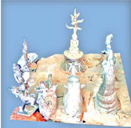
အောင်ခြင်းရှစ်ပါး ကြေးသွန်းဌာပနာရုပ်လေးများ