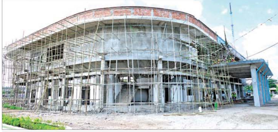
ဇွဲကပင် မိုးလုံလေလုံအားကစားရုံ တည်ဆောက်နေမှုကို တွေ့ရစဉ်။

လောင်းကစား လုပ်ငန်းများ လုပ်ဆောင်လျက်ရှိသည့် မြန်မာ-ထိုင်းနယ်စပ်အနီးရှိ KK park နေရာအား တပ်မတော်အနေဖြင့် ရှင်းလင်း ဆောင်ရွက်နေပြီး အမျိုးသားရေး တာဝန်တစ်ရပ်အနေဖြင့် အပြီးပြုတ်ရှင်းလင်း ဆောင်ရွက်သွားမည်ဖြစ်ကြောင်း၊ မကြာမီ ကာလအတွင်း လွတ်လပ်ပြီး တရားမျှတသည့် ပါတီဒီမိုကရေစီ အထွေထွေ ရွေးကောက်ပွဲ ကျင်းပပြုလုပ်သွားမည်ဖြစ်ကြောင်း၊ ရွေးကောက်ပွဲအား လုံခြုံရေးဆိုင်ရာအရာအပိုင်း သုံးပိုင်းခွဲ၍ ကျင်းပပြုလုပ်သွားမည် ဖြစ်ကြောင်း၊ ရွေးကောက်ပွဲကျင်းပပြုလုပ်ရာတွင် မဲမသမာမှုများ လုပ်ဆောင်၍ မရနိုင်သည့် မြန်မာအိတ်ထရော့နစ် မဲပေး