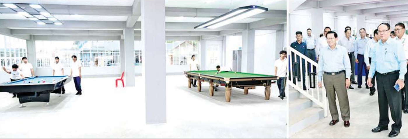
ပြည်ထောင်စုသမ္မတမြန်မာနိုင်ငံတော် ယာယီသမ္မတ နိုင်ငံတော်လုံခြုံရေးနှင့် အေးချမ်းသာယာရေးကော်မရှင်ဥက္ကဋ္ဌ ဗိုလ်ချုပ်မှူးကြီးမင်းအောင်လှိုင် ကရင်ပြည်နယ်လူငယ်စင်တာအတွင်း လူငယ်များ Indoor Game များ လေ့ကျင့်နေမှုကို ကြည့်ရှုစစ်ဆေးစဉ်။