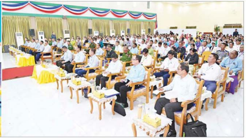
ပြည်ထောင်စုသမ္မတမြန်မာနိုင်ငံတော် ယာယီသမ္မတ နိုင်ငံတော်လုံခြုံရေးနှင့် အေးချမ်းသာယာရေးကော်မရှင်ဥက္ကဋ္ဌ ဗိုလ်ချုပ်မှူးကြီး မင်းအောင်လှိုင် ဘားအံမြို့ရှိ ပြည်နယ်အဆင့်ဌာနဆိုင်ရာတာဝန်ရှိသူများ၊ မြို့မိ မြို့ဖများနှင့်တွေ့ဆုံဆွေးနွေးစဉ်။