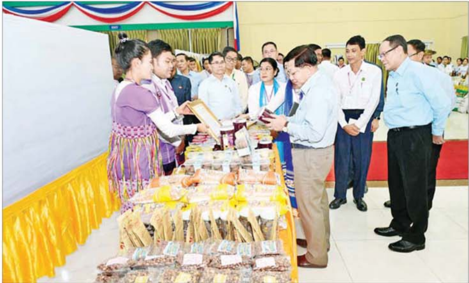
ပြည်ထောင်စုသမ္မတမြန်မာနိုင်ငံတော် ယာယီသမ္မတ နိုင်ငံတော်လုံခြုံရေးနှင့် အေးချမ်းသာယာရေးကော်မရှင်ဥက္ကဋ္ဌ ဝဋ်ဇာလှိုင်မြို့ကြီး မင်းအောင်လှိုင် ခင်းကျင်းပြသထားသည့် ကရင်ပြည်နယ်အတွင်းရှိ အသေးစား၊ အငယ်စားနှင့် အလတ်စားစီးပွားရေးလုပ်ငန်းများ (MSME) မှ ထွက်ရှိသည့် ထုတ်ကုန်ပစ္စည်းများအား ကြည့်ရှုစဉ်။

၂၁ စာမျက်နှာ ၃ မှ အလားတူ ပညာရည်မြှင့်တင်ရေး အစည်းအဝေးများ မပြုမီအစောပိုင်း အစည်းအဝေးများ နှိုင်းစာတော်လုံခြုံရေးနှင့် အေးချမ်းသာယာရေးကော်မရှင်ဖွဲ့စည်းပြီး ချိန်တွင် "နိုင်ငံတော်ရွှေသီးဖို ကုန်ထုတ်လုပ်မှု အားပေးစွဲ"၊ "နိုင်ငံတော်ဖွံ့ဖြိုးဖို့ ပညာရေးကို အားပေးစွဲ"၊ "နိုင်ငံတော်သာယာဖို့ သဘာဝပတ်ဝန်းကျင် ထိန်းသိမ်းစွဲ" ဆိုသည့် ဆောင်ပုဒ်များကို ချမှတ်ထားကြောင်း၊ ဒေသတစ်ခု၊ နိုင်ငံတစ်ခုအနေဖြင့် အလုပ်လုပ်ကိုင်မှုသာ ဖွံ့ဖြိုးတိုးတက်လာမည် ဖြစ်ကြောင်း၊ ကုန်ထုတ်လုပ်မှု လုပ်ငန်းကို ဆောင်ရွက်ခြင်းသည် ပုဂ္ဂလိကနှင့် နိုင်ငံတော်အတွက် အကျိုးရှိသည့် လုပ်ငန်းတစ်ခုဖြစ်ကြောင်း၊ ကုန်ထုတ်လုပ်မှုလုပ်ငန်းများ ဆောင်ရွက်နိုင်ရန်အတွက် အတတ်ပညာများ လိုအပ်ကြောင်း၊ အတတ်ပညာရှိရန် အတွက် အတန်းပညာများဖြင့် မားရန်လိုအပ်သဖြင့် ပညာရည်မြှင့်တင်ရေး လုပ်ငန်းများကို နိုင်ငံတော်အစိုးရ အနေဖြင့် ကြိုးပမ်းဆောင်ရွက်ပေးလျက်ရှိကြောင်း၊ ပညာရည်အားနည်းသူများကို ကုန်ထုတ်လုပ်ရေးနှင့် ပညာရေးလုပ်ငန်းများတွင် အသုံးချနိုင်ရန်အတွက် သင်တန်းများ ဖွင့်လှစ် သင်ကြားပေးနိုင်ရေး ဆောင်ရွက်လျက်ရှိကြောင်း။