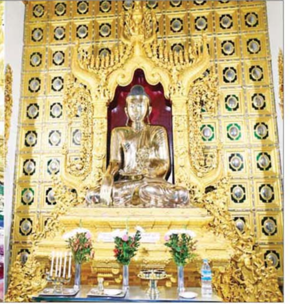
ပြည်ထောင်စုသမ္မတမြန်မာနိုင်ငံတော် ယာယီသမ္မတ နိုင်ငံတော်လုံခြုံရေးနှင့် အေးချမ်းသာယာရေးကော်မရှင်ဥက္ကဋ္ဌ ဗိုလ်ချုပ်မှူးကြီးမင်းအောင်လှိုင် မော်လမြိုင်မြို့ကျက်သရေဆောင် ကျိုက်သလ္လံစေတီတော်မြတ်ကြီးရှိ ဗုဒ္ဓရုပ်ပွားတော်မြတ်အား ဖူးမြော်ကြည်ညိုစဉ်။

ဖူးမြော်ကြည်ညို၍ ပန်း၊ ရေချမ်း၊ ဆီမီးများ ကပ်လှူပူဇော်ပြီး အလှူငွေများ ပေးအပ်လှူဒါန်းရာ