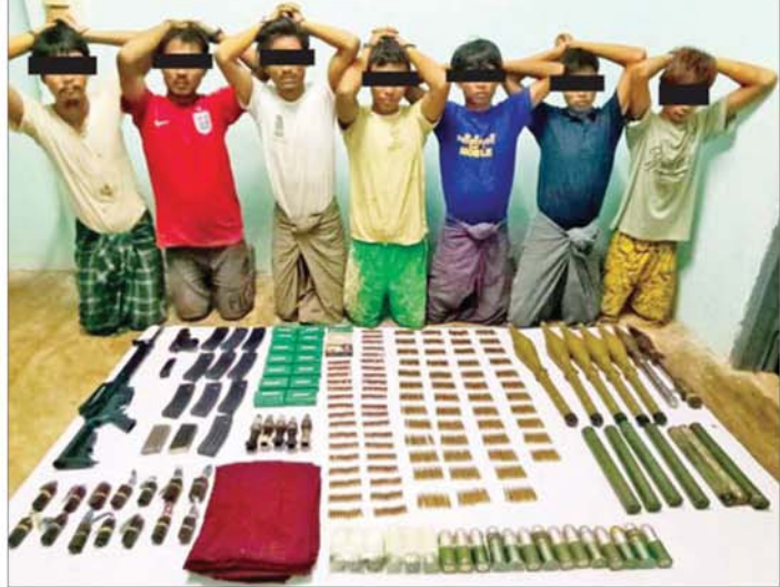
ကရင်ပြည်နယ် မြဝတီမြို့နယ်အတွင်းမှ ပြစ်မှုကျူးလွန်သူများနှင့်အတူ သိမ်းဆည်းရမိသည့် လက်နက်ခဲယမ်းများကို တွေ့ရစဉ်။

နေပြည်တော် နိုဝင်ဘာ ၁၃ ကရင်ပြည်နယ် မြို့ဝတီမြို့နယ်အတွင်း ၂၀၂၁ ခုနှစ်မှ ၂၀၂၅ ခုနှစ် အောက်တိုဘာ ၃၁ ရက်အထိ အကြမ်းဖက်မှုတိုက်ဖျက်ရေးဥပဒေဖြင့် အရေးယူဆောင်ရွက်ခဲ့သည့်အမှု ၂၅၆ မှု၊ မူးယစ်ဆေးဝါးနှင့် စိတ်ကိုပြောင်းလဲစေသောဆေးဝါးများဥပဒေဖြင့် အရေးယူဆောင်ရွက်ခဲ့သည့် အမှု ၃၇၇ မှု၊ လက်နက်ဥပဒေဖြင့် အရေးယူဆောင်ရွက်ခဲ့သည့် အမှု ၈၆ မှုကို အရေးယူဆောင်ရွက်ခဲ့ကြောင်း သိရသည်။