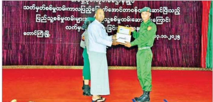
ရှမ်းပြည်နယ်ဝန်ကြီးချုပ် ဦးအောင်အောင် သတ်မှတ်စစ်မှန်ထမ်းကားလ ပြည်မြောက်အောင် တာဝန်ထမ်းဆောင်ပြီးသည့် ပြည်သူ့စစ်မှန်ထမ်းကားလ ပြည်သူ့စစ်မှန်ထမ်းဆောင်ပြီးကြောင်း၊ လက်မှတ်ပေးအပ်စဉ်။

ထို့အပြင် ပြည်သူ့စစ်မှန်ထမ်းကားလ ကျေးဇူးတမ်းဆောင်ခဲ့ကြသူများအား အလုပ်အကိုင်ရရှိရေး ၎င်းတို့ဆန္ဒပြုသော အလုပ်အကိုင်များကို သတ်မှတ်ချက်များနှင့်အညီ ခန့်အပ်ပေးနိုင်ရေးအတွက် သက်ဆိုင်ရာ တာဝန်ရှိသူများက ပြည်တွင်း/ပြည်ပ အလုပ်အကိုင်ခန့်အပ်ပေးနိုင်ရေး လုပ်ငန်းကော်မတီနှင့် ချိတ်ဆက်၍ လိုအပ်သည့်များ ဆက်လက်ဆောင်ရွက်ပေးသွားမည်ဖြစ်ကြောင်း သိရသည်။ သတင်းစဉ်