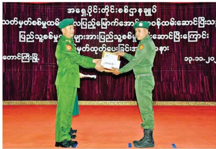
အရှေ့ပိုင်းတိုင်းစစ်ဌာနချုပ် တိုင်းမှူး ဗိုလ်မှူးချုပ်ကျော်နိုင်ဦး သတ်မှတ်စစ်မှုထမ်းကာလပြည့်မြောက်အောင် တာဝန်ထမ်းဆောင်ပြီးသည့် ပြည်သူ့စစ်မှုထမ်းများအား ပြည်သူ့စစ်မှုထမ်းဆောင်ပြီးကြောင်း လက်မှတ်ထုတ်ပေးပွဲစဉ်။

နေပြည်တော် နိုဝင်ဘာ ၁၃ နိုင်ငံတော်အနေဖြင့် ဖွဲ့စည်းပုံအခြေခံဥပဒေအရ နိုင်ငံသားများ၏အခွင့်အရေးကို ကာကွယ်စောင့်ရှောက် ပေးလျက်ရှိပြီး နိုင်ငံသားများ အနေဖြင့်လည်း နိုင်ငံတာဝန်များကို ထမ်းဆောင်ကြရမည်ဖြစ်သည်။ ယင်းတာဝန်များကို ကျေပွန်စွာထမ်းဆောင်ရန် ဆန္ဒရှိကြသည့် နိုင်ငံသားကောင်းများသည် ပြည်သူ့စစ်မှုထမ်း သင်တန်းများ တက်ရောက်ကာ တပ်ရင်း၊ တပ်ဖွဲ့အသီးသီးသို့ သွားရောက်၍ နိုင်ငံတော် ကာကွယ်ရေးနှင့် လုံခြုံရေး တာဝန်များကို ဂုဏ်ယူစွာ ထမ်းဆောင်လျက် ရှိသည်။