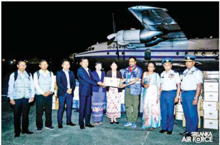
ညွှန်ကြားရေးမှူးချုပ် ဒေါ်လှလှအေးတို့ ဦးဆောင်သော မြန်မာကိုယ်စားလှယ်အဖွဲ့သည် ယမန်နေ့ညပိုင်းတွင် သီရိလင်္ကာနိုင်ငံ ကိုလံဘိုမြို့သို့ ရောက်ရှိကြသည်။ မြန်မာကိုယ်စားလှယ်အဖွဲ့ကို သီရိလင်္ကာနိုင်ငံ ဆိုင်ရာ မြန်မာသံအမတ်ကြီး ဒေါ်မာလာသန်းထိုက်၊ သီရိလင်္ကာနိုင်ငံခြားရေးဝန်ကြီးဌာန အရှေ့တောင်အာရှနှင့် အာရှအလယ်ပိုင်းရေးရာဦးစီးဌာန

သီရိလင်္ကာ ဒီဇင်ဘာ ၇ သီရိလင်္ကာနိုင်ငံ၌ ၂၀၂၅ ခုနှစ် နိုဝင်ဘာ ၂၈ ရက်တွင် တိုက်ခတ်ခဲ့သည့် ဆိုင်ကလုန်းမုန်တိုင်း ဒီဝါကြောင့် ခရိုင် ၂၅ ခုတွင် ရေကြီးရေလျှံမှုနှင့် မြေပြိုမှုများဖြစ်ပွားခဲ့ရာ လူပေါင်း ကိုးသိန်းကျော် ရေဘေးဒဏ်ခံစားခဲ့ရပြီး လမ်းတံတားများ၊ နေအိမ်များနှင့် အခြေခံအဆောက်အအုံများ ထိခိုက်ပျက်စီးမှုများ ရှိခဲ့ကြောင်း သိရသည်။ ထို့ကြောင့် အရေးပေါ်ကူညီကယ်ဆယ်ရေး လုပ်ငန်းများကို ဆောင်ရွက်လျက်ရှိကြောင်းနှင့် လူသားချင်းစာနာထောက်ထားမှု အကူအညီများ လိုအပ်ကြောင်း နိုင်ငံတကာသို့ ကမ်းလှမ်းဖိတ်ခေါ်ခဲ့သည့်အတွက် သီရိလင်္ကာနိုင်ငံနှင့် ချစ်ကြည်ရင်းနှီးသော နှစ်နိုင်ငံဆက်ဆံရေးရှိသည့် အားလျော်စွာ နိုင်ငံတော်အကြီးအကဲ၏ လမ်းညွှန်မှုနှင့်အညီ ပြည်ထောင်စုသမ္မတ မြန်မာနိုင်ငံတော်အစိုးရနှင့် ပြည်သူများက သီရိလင်္ကာနိုင်ငံ ဒီဝါဆိုင်ကလုန်းမုန်တိုင်းဒဏ်ခံခဲ့ရသော ပြည်သူများသို့ ကျန်းမာရေးစောင့်ရှောက်မှုနှင့် ဆေးဝါးကုသမှုလုပ်ငန်းများအတွက် အထောက်အကူဖြစ်စေမည့် ဆေးဝါးနှင့် ဆေးပစ္စည်းများ၊ တစ်ကိုယ်ရေကျန်းမာရေးသုံးပစ္စည်းများကို တပ်မတော်လေယာဉ်ဖြင့် သွားရောက်လှူဒါန်းပို့ဆောင်ရာ နိုင်ငံခြားရေးဝန်ကြီးဌာန ညွှန်ကြားရေးမှူးချုပ် ဦးဇော်ဖြူဝင်းနှင့် လူမှုဝန်ထမ်း ကယ်ဆယ်ရေးနှင့် ပြန်လည်နေရာချထားရေးဝန်ကြီးဌာနမှ