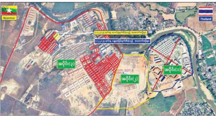
ကရင်ပြည်နယ်၊ မြဝတီမြို့နယ်အတွင်းရှိ KK Park အပိုင်း(၃) နယ်မြေအား ဖောက်ခွဲဖျက်ဆီးမှု

ရွှေကုက္ကိုလ်နယ်မြေအတွင်း အွန်လိုင်းလိမ်လည်လောင်းကစားမှုကျူးလွန်ရာတွင် အသုံးပြုသည့် ဆက်စပ်ပစ္စည်းများနှင့် အသုံးအဆောင်ပစ္စည်းများအား မီးရှို့ဖျက်ဆီးစဉ်။