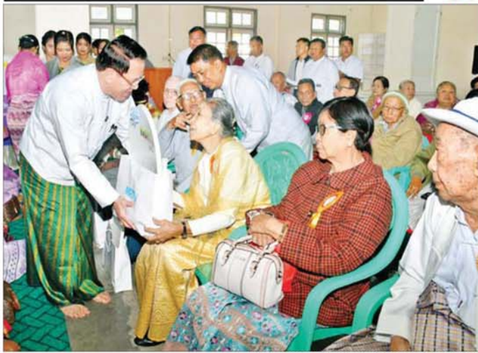
ပြည်ထောင်စုဝန်ကြီး ဦးမောင်မောင်အုန်းအသက် (၇၅)နှစ်နှင့် အထက်ဆရာကြီး ဆရာမကြီးများအား MRTV DTH စလောင်း၊ ဆက်စပ်ပစ္စည်းများနှင့် လက်ဆောင်ပစ္စည်းများ ပေးအပ်လှူဒါန်းစဉ်။