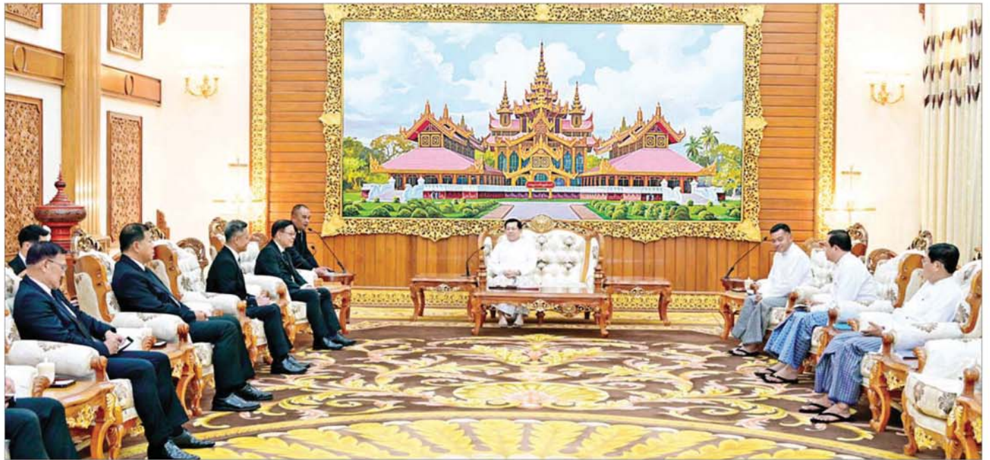
ပြည်ထောင်စုသမ္မတမြန်မာနိုင်ငံတော် ယာယီသမ္မတ နိုင်ငံတော်လုံခြုံရေးနှင့် အေးချမ်းသာယာရေးကော်မရှင်ဥက္ကဋ္ဌ ဗိုလ်ချုပ်မှူးကြီးမင်းအောင်လှိုင် ထိုင်းနိုင်ငံ နိုင်ငံခြားရေးဝန်ကြီး H.E. Mr.Sihesak Phuangketkeow ဦးဆောင်သည့် ကိုယ်စားလှယ်အဖွဲ့အား လက်ခံတွေ့ဆုံစဉ်။

ပြည်ထောင်စုသမ္မတမြန်မာနိုင်ငံတော် ယာယီသမ္မတ နိုင်ငံတော်လုံခြုံရေးနှင့် အေးချမ်းသာယာရေးကော်မရှင်ဥက္ကဋ္ဌ ဗိုလ်ချုပ်မှူးကြီးမင်းအောင်လှိုင်ထံ ထိုင်းနိုင်ငံ နိုင်ငံခြားရေးဝန်ကြီးဦးဆောင်သည့် ကိုယ်စားလှယ်အဖွဲ့ လာရောက်ဂါရဝပြုတွေ့ဆုံ နှစ်နိုင်ငံနယ်စပ်ဒေသကုန်သွယ်မှုများ ပြန်လည်ကောင်းမွန်ရေးအတွက် နယ်စပ်ဒေသတည်ငြိမ်အေးချမ်းရေးသည် မရှိမဖြစ်လိုအပ်သဖြင့် နှစ်နိုင်ငံအစိုးရနှင့် တပ်မတော်နှစ်ရပ်အကြားပူးပေါင်း၍ ထိန်းသိမ်းဆောင်ရွက်သွားရန်လိုအပ်မှုအခြေအနေများ ရင်းရင်းနှီးနှီးဆွေးနွေး