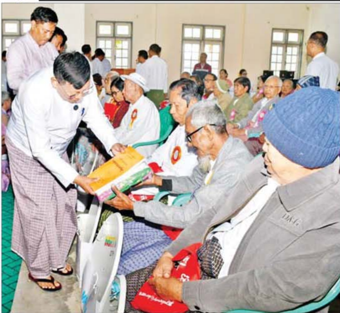
ပြည်ထောင်စုဝန်ကြီး ဦးတင်ဦးလွင် အသက် (၇၅)နှစ်နှင့် အထက်ဆရာကြီး ဆရာမကြီးများအား MRTV DTH စလောင်း၊ ဆက်စပ်ပစ္စည်းများနှင့် လက်ဆောင်ပစ္စည်းများ ပေးအပ်လှူဒါန်းစဉ်။