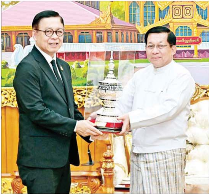
ပြည်ထောင်စုသမ္မတမြန်မာနိုင်ငံတော် ယာယီသမ္မတ နိုင်ငံတော်လုံခြုံရေးနှင့် အေးချမ်းသာယာရေး ကော်မရှင်ဥက္ကဋ္ဌ ဗိုလ်ချုပ်မှူးကြီးမင်းအောင်လှိုင်နှင့် ထိုင်းနိုင်ငံ နိုင်ငံခြားရေးဝန်ကြီး H.E. Mr.Sihasak Phuangketkeow တို့ အမှတ်တရလက်ဆောင်ပစ္စည်းများ အပြန်အလှန်ပေးအပ်စဉ်။

ထိုသို့တွေ့ဆုံရာတွင် မြန်မာ နိုင်ငံနှင့် ထိုင်းနိုင်ငံတို့သည် ရှည်လျားသည့် သမိုင်းကြောင်း ရှိပြီး အိမ်နီးချင်းကောင်း၊ မိတ်ဆွေ ကောင်းနိုင်ငံများဖြစ်မှု၊ နှစ်နိုင်ငံ အကြား သဘောတူညီချက်များ အား ဆက်လက်အကောင်အထည် ဖော်နိုင်ရေး ဆောင်ရွက်လျက်ရှိမှု နှင့် ပူးပေါင်းဆောင်ရွက်မှုများ တိုးတက် ကောင်းမွန်နေစေရေး ဆက်လက်ဆောင်ရွက်သွားမည့် အခြေအနေများ၊ နှစ်နိုင်ငံ နယ်စပ် ဒေသကုန်သွယ်မှုများ ပြန်လည်