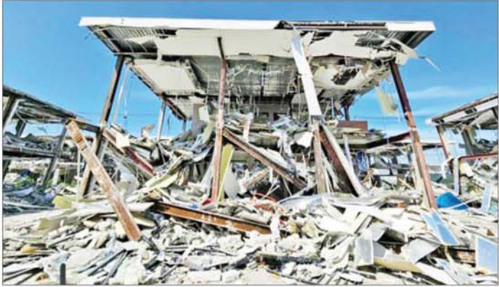
KK Park နယ်မြေအပိုင်း(၃)တွင် တရားမဝင်ဆောက်လုပ်ထားသည့် နှစ်ထပ်လူနေအဆောက်အအုံ မဖြိုဖျက်မီ(ဝဲပုံ)နှင့် ဖြိုဖျက်ပြီး(ယာပုံ)ကို တွေ့ရစဉ်။