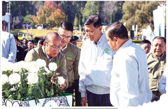
မန္တလေး ဒီဇင်ဘာ ၆

ပြင်ဦးလွင်မြို့ အမျိုးသားကန်တော်ကြီးဥယျာဉ် အထိမ်းအမှတ်(၁၈)ကြိမ်မြောက် ပန်းပွဲတော်ဖွင့်ပွဲ အခမ်းအနားကို ယနေ့နံနက်ပိုင်းက ကျင်းပရာ နိုင်ငံတော်လုံခြုံရေးနှင့်အေးချမ်းသာယာရေးကော်မရှင် အဖွဲ့ဝင် ပြည်ထဲရေးဝန်ကြီးဌာန ပြည်ထောင်စုဝန်ကြီး ဒုတိယဗိုလ်ချုပ်ကြီး ထွန်းထွန်းဇော်၊ ဝိသေသ ရေးနှင့်ဆက်သွယ်ရေးဝန်ကြီးဌာန ပြည်ထောင်စုဝန်ကြီး ဦးမြထွန်းဦး၊ စိုက်ပျိုးရေး၊ မွေးမြူရေးနှင့် ဆည်မြောင်းဝန်ကြီးဌာန ပြည်ထောင်စုဝန်ကြီး ဦးမင်းဇော်၊ သယံဇာတနှင့် သဘာဝပတ်ဝန်းကျင် ထိန်းသိမ်းရေးဝန်ကြီးဌာန ပြည်ထောင်စုဝန်ကြီးဦးခင်မောင်ရီ၊ စက်မှုဝန်ကြီးဌာန ပြည်ထောင်စုဝန်ကြီး ဒေါက်တာဘာလီသန်း၊ သိပ္ပံနှင့်နည်းပညာဝန်ကြီးဌာန ပြည်ထောင်စုဝန်ကြီး ဒေါက်တာမျိုးသိန်းကျော် နှင့် ဆောက်လုပ်ရေးဝန်ကြီးဌာန ပြည်ထောင်စုဝန်ကြီး ဦးမျိုးသန်း၊ ပြည်ထောင်စုရာထူးဝန်အဖွဲ့ဥက္ကဋ္ဌ ဦးစိုးမင်းဦး၊ မန္တလေးတိုင်းဒေသကြီးအစိုးရအဖွဲ့ ဝန်ကြီးချုပ် ဦးမျိုးအောင်နှင့်ဇနီး၊ ကာကွယ်ရေးဦးစီးချုပ်ရုံး မှ အဆင့်မြင့်တပ်မတော်အရာရှိကြီးများနှင့်ဇနီးများ၊ ပြင်ဦးလွင်တပ်နယ်မှ အရာရှိကြီးများနှင့်၎င်းတို့၏ ဇနီးများ၊ တိုင်းဒေသကြီးအဆင့်ဌာနဆိုင်ရာများ၊ ထူးကုမွန်များအုပ်စုမှတာဝန်ရှိသူများ၊ ဖိတ်ကြားထားသည့် ဧည့်ပရိသတ်များ တက်ရောက်ကြသည်။