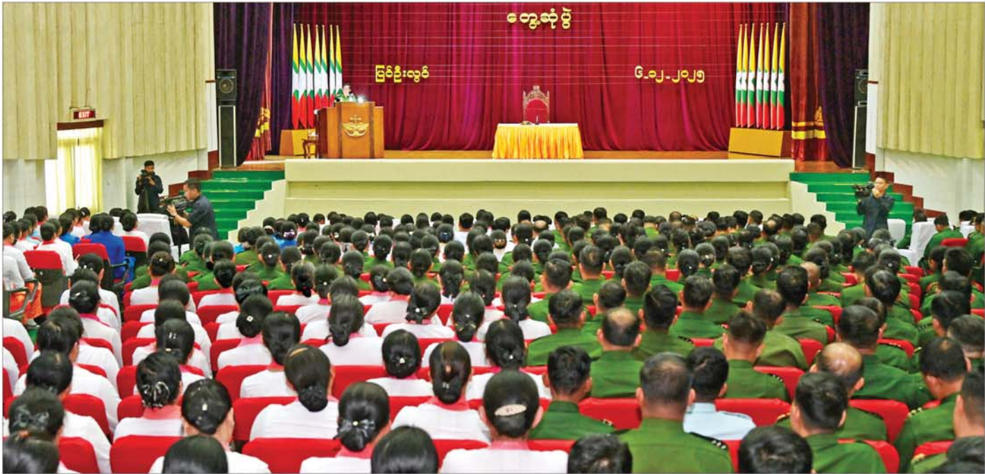
နိုင်ငံတော်လုံခြုံရေးနှင့် အေးချမ်းသာယာရေးကော်မရှင်ဥက္ကဋ္ဌ တပ်မတော်ကာကွယ်ရေးဦးစီးချုပ် ဗိုလ်ချုပ်မှူးကြီး မင်းအောင်လှိုင် ပြင်ဦးလွင်တပ်နယ်ရှိ အရာရှိ၊ စစ်သည်၊ မိသားစုများ၊ ဗိုလ်လောင်းများအား တွေ့ဆုံအမှာစကားပြောကြားစဉ်။