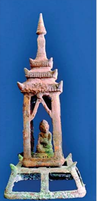
ပြာသာဒ်အတွင်းမှ ရှင်ဥပဂုတ္တမထေရ်

ဖန်တီးတဲ့အခါ အခြားရဟန်းသံဃာရုပ်လေးတွေ ဆို လက်အုပ်ချိမိဖို့ ကန်တော့နေကြပုံ ထုလုပ်ကြ လေ့ ရှိပေမယ့် ရှင်ဥပဂုတ္တမထေရ်ရှုပ်တုကိုတော့ ဘယ်လက်နဲ့ သပိတ်ပိုက်ထားပြီး ညာလက်နဲ့ ဆွမ်းကို နှိုက်နေဟန်၊ နောက်ခံသမိုင်းကြောင်းမှာ ထင်ရှားလှတဲ့ မွန်းတည့်တော့မယ့် နေကိုတောင် တားထားဟန်၊ နေရှိရာကို မော့ကြည့်နေဟန် ထုလုပ်ကြလေ့ရှိတာပါ။ ကျောင်းဆောင်ပြာသာဒ် ကိုလည်း အဖြစ်ထုလုပ်ခြင်း မဟုတ်ဘဲ အနား လေးဖက်ညီ စတုရန်းပုံ အမိုးများနဲ့ လည်ပေါ် စေပြီး ထိပ်မှာ ထုပ်ကာနဲ့ ကလပ်ခံကာ ထီး အထွတ်တင်ထားဟန် အပြည့်အစုံ ထုလုပ်လေ့ ရှိပါတယ်။ တချို့ ဌာပနာများမှာဆိုရင် ကျောင်း ဆောင်မှာ ကြေးကွေး စိုင်ပေါင်နဲ့ လင်းနို့တောင် များပင် အသေးစိတ် မွမ်းမံထားတာ တွေ့ရပါ တယ်။ စာရေးသူ အထူးတင်ပြလိုတာက ရှေးက ကျွန်တော်တို့ ဘိုးဘေးများဟာ ဘာသာရေးနဲ့ ပတ်သက်ပြီး ထည့်သွင်းဌာပနာဖို့ ရုပ်လုံးရုပ်တု လေးတွေ ဖန်တီးကြရာမှာ အလှသက်သက် မဟုတ်ဘဲ ရုပ်တုတိုင်းမှာ သူ့နောက်ခံအကြောင်း အရာလေးတွေ ရှိနေသလို ထည့်သွင်းရခြင်း အကြောင်းအရင်းခံလည်း သူ့အရပ်နဲ့သူ ရှိကြ ပါတယ်။ ယနေ့ခေတ် မျိုးဆက်သစ်အဖြစ် ဆက်ခံသူများအနေနဲ့လည်း ဌာပနာရုပ်တစ်ခုကို တွေ့လိုက်တာနဲ့ ဘာစာတင်ဝင်ခန်းလဲ၊ ဘာ အကြောင်းအရာလဲ၊ ဘာကြောင့် ထုလုပ်ထည့်သွင်း ထားတာလဲဆိုတာတွေ သိခဲ့မယ်ဆိုရင် ဖန်တီး သူလည်း ဖန်တီးရကျိုးနပ်ပြီး တွေ့ရှိသူလည်း အသိတစ်ခု ရရှိမယ်ဆိုရင် နှစ်ဦးနှစ်ဖက် အကျိုး ရှိမှာ ဖြစ်ပါကြောင်း။