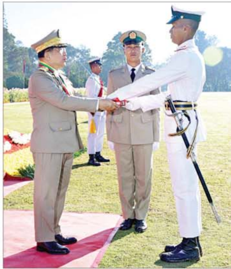
နိုင်ငံတော်လုံခြုံရေးနှင့် အေးချမ်းသာယာရေးကော်မရှင်ဥက္ကဋ္ဌ တပ်မတော်ကာကွယ်ရေးဦးစီးချုပ် ဗိုလ်ချုပ်မှူးကြီး သတိုးမဟာ သရေစည်သူ သတိုးသီရိသုဓမ္မ မင်းအောင်လှိုင် စာတေးချွန်ဆုရရှိသူ ဗိုလ်လောင်းအမှတ် ၈၄၈၀ ဗိုလ်လောင်း စွမ်းထက်အောင်အား ဆုပေးအပ်ချီးမြှင့်စဉ်။

၀ စာမျက်နှာ ၃ မှ မျက်မှောက်ခေတ် ကာလ စစ်ဘက်ဆိုင်ရာ သိပ္ပံနှင့် နည်းပညာများ အလျင်အမြန် ဖွံ့ဖြိုးတိုးတက်လာခြင်းကြောင့် ခေတ်သစ်စစ်ပွဲများတွင် ဦးဆောင် ကွပ်ကဲထိန်းချုပ်ရန် နည်းပညာ ကိုလူသားများအစား ဉာဏ်ရည်တူ နည်းပညာ(AI) အသုံးပြုသည် အထိ တိုးတက်ပြောင်းလဲလာကြ ပြီဖြစ်ကြောင်း၊ စစ်ပွဲများတွင် ဉာဏ်ရည်တူနည်းပညာ(AI) စနစ် များကို အသုံးပြုခြင်းဖြင့် အချိန် နှင့် တစ်ပြေးညီ သတင်းအချက် အလက်များ စုဆောင်းနိုင်သည့် အတွက် ရန်သူ၏လှုပ်ရှားမှုများကို ထိထိရောက်ရောက်ထောက်လှမ်း နိုင်မည်ဖြစ်ကြောင်း၊ ဉာဏ်ရည်တူ နည်းပညာ(AI)၏ အရေးပါသည့် အခန်းကဏ္ဍတစ်ခုမှာ ဆိုက်ဘာ လုံခြုံရေးပင်ဖြစ်ကြောင်း၊ ဆိုက်ဘာ တိုက်ခိုက်မှုများကို လျင်မြန်စွာ ဖော်ထုတ်နိုင်ပြီး အချိန်မီတုံ့ပြန် ကာကွယ်နိုင်ခြင်းကြောင့် စစ်ဘက် ကွန်ရက်များ၏ လုံခြုံရေးကို အခြေခံအထိ ဖြင့်တင်ပေးနိုင်မည် ဖြစ်ကြောင်း၊ ထို့ကြောင့် ရဲဘော်တို့ အနေဖြင့် ခေတ်နှင့်အညီ စဉ်ဆက်