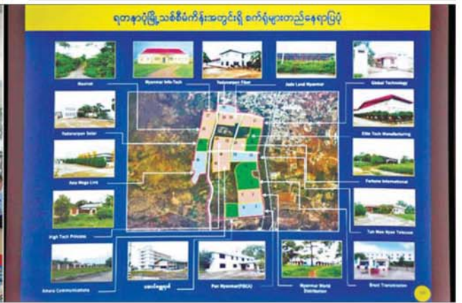
ပြည်ထောင်စုသမ္မတမြန်မာနိုင်ငံတော် ယာယီသမ္မတ နိုင်ငံတော်လုံခြုံရေးနှင့် အေးချမ်းသာယာရေးကော်မရှင်ဥက္ကဋ္ဌ ဗိုလ်ချုပ်မှူးကြီး မင်းအောင်လှိုင်အား ပြည်ထောင်စုဝန်ကြီး ဦးမြထွန်းဦးက ရတနာပုံမြို့သစ် စီမံကိန်းနှင့်ပတ်သက်၍ ရှင်းလင်းတင်ပြစဉ်။