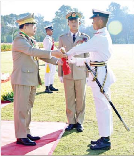
နိုင်ငံတော်လုံခြုံရေးနှင့် အေးချမ်းသာယာရေးကော်မရှင်ဥက္ကဋ္ဌ တပ်မတော်ကာကွယ်ရေးဦးစီးချုပ် ဗိုလ်ချုပ်မှူးကြီး သတိုးမဟာ သရေစည်သူ သတိုးသီရိသုဓမ္မ မင်းအောင်လှိုင် အောင်စစ်သည်ဆု ရရှိသူ ဗိုလ်လောင်းအမှတ် ၈၄၈၇ ဗိုလ်လောင်း ဉာဏ်လင်းထက်အား ဆုပေးအပ်ချီးမြှင့်စဉ်။