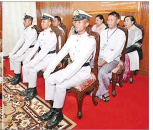
နိုင်ငံတော်လုံခြုံရေးနှင့် အေးချမ်းသာယာရေးကော်မရှင်ဥက္ကဋ္ဌ တပ်မတော်ကာကွယ်ရေးဦးစီးချုပ် ဗိုလ်လောင်းများနှင့် ၎င်းတို့၏ မိဘဆွေမျိုးများအား တွေ့ဆုံ၍ ဂုဏ်ပြုအမှာစကား ပြောကြားစဉ်။

၀ စာမျက်နှာ ၄ မှ လေ့ကျင့်ရေးပိုင်း အနေဖြင့် မိမိတို့နေ့စဉ် ဆောင်ရွက်ရမည့် လုပ်ငန်းတာဝန်များကို မှန်မှန် ကန့်ကွက် ဆောင်ရွက်နေခြင်းသည် လေ့ကျင့်ရေး ဆောင်ရွက်နေခြင်း ပင်ဖြစ်ကြောင်း၊ နေ့စဉ် အပတ်စဉ်၊ လစဉ်လုပ်ဆောင်ရမည့် ကြံ့ခိုင်ရေး လေ့ကျင့်ခန်းများကို တစ်ဦးချင်းစီ အလိုက်၊ အဖွဲ့အလိုက် မှန်မှန် ကန့်ကွက် လုပ်ဆောင်စေရေး အတွက်လည်း ကွပ်ကဲကြပ်မတ် ဆောင်ရွက်သွားရန် လိုကြောင်း၊ လေ့ကျင့်ရေးပိုင်းနှင့် ပတ်သက် ပါကစစ်သားကောင်းတစ်ယောက် ပီသအောင် နေထိုင်ကျင့်ကြံ လေ့ကျင့်ခြင်းဖြင့် မိမိကိုယ်ကိုနှင့် မိမိအဖွဲ့အစည်းကို အရည်အသွေး တိုးတက်လာအောင် ဆောင်ရွက် သွားရမည်ဖြစ်ကြောင်း။