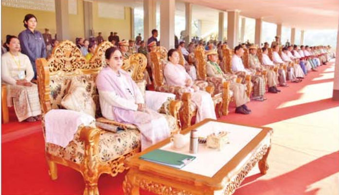
တပ်မတော်နည်းပညာတာဝန်သို့လ် ဗိုလ်လောင်းသင်တန်းအမှတ်စဉ်(၂၇) သင်တန်းဆင်းဂုဏ်ပြုစစ်ရေးပြ အခမ်းအနားသို့ တက်ရောက်လာကြသူများအား တွေ့ရစဉ်။