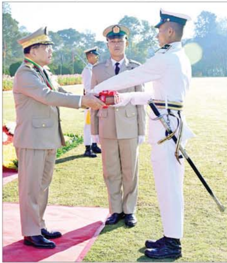
နိုင်ငံတော်လုံခြုံရေးနှင့် အေးချမ်းသာယာရေးကော်မရှင်ဥက္ကဋ္ဌ တပ်မတော်ကာကွယ်ရေးဦးစီးချုပ် ဗိုလ်ချုပ်မှူးကြီး သတိုးမဟာ သရေစည်သူ သတိုးသီရိသုဓမ္မ မင်းအောင်လှိုင် လေ့ကျင့်ရေးထူးချွန်ဆု ရရှိသူ ဗိုလ်လောင်းအမှတ် ၈၅၃၆ ဗိုလ်လောင်း အာကာဖြိုးအား ဆုပေးအပ်ချီးမြှင့်စဉ်။