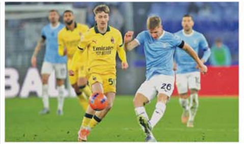
ကိုပါအီတာလီယာဖလား ကွာတားဖိုင်နယ်အဆင့်သို့ လာဇီယိုအသင်း တက်ရောက်

တူရင် ဒီဇင်ဘာ ၅ ၂၀၂၅-၂၀၂၆ ဘောလုံးရာသီတွင် ကိုပါအီတာလီယာဖလား ကွာတားဖိုင်နယ်အဆင့်သို့ လာဇီယိုအသင်း တက်ရောက်နိုင်ခဲ့သည်။