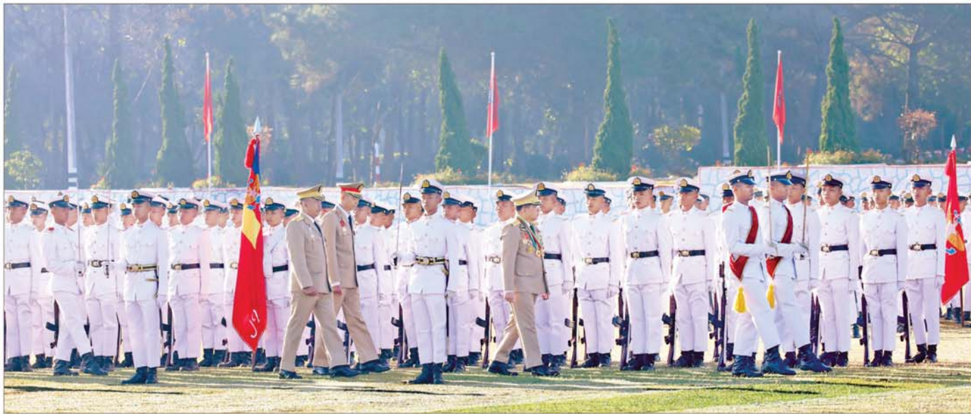
နိုင်ငံတော်လုံခြုံရေးနှင့် အေးချမ်းသာယာရေးကော်မရှင်ဥက္ကဋ္ဌ တပ်မတော်ကာကွယ်ရေးဦးစီးချုပ် ဗိုလ်ချုပ်မှူးကြီး သတိုးမဟာသရေစည်သူ သတိုးသိရီသုဓမ္မ မင်းအောင်လှိုင် တပ်မတော်နည်းပညာတက္ကသိုလ် ဗိုလ်လောင်းသင်တန်းအမှတ်စဉ်(၂၇) ကျောင်းဆင်း ဗိုလ်လောင်းတပ်ခွဲအား စစ်ဆေးစဉ်။