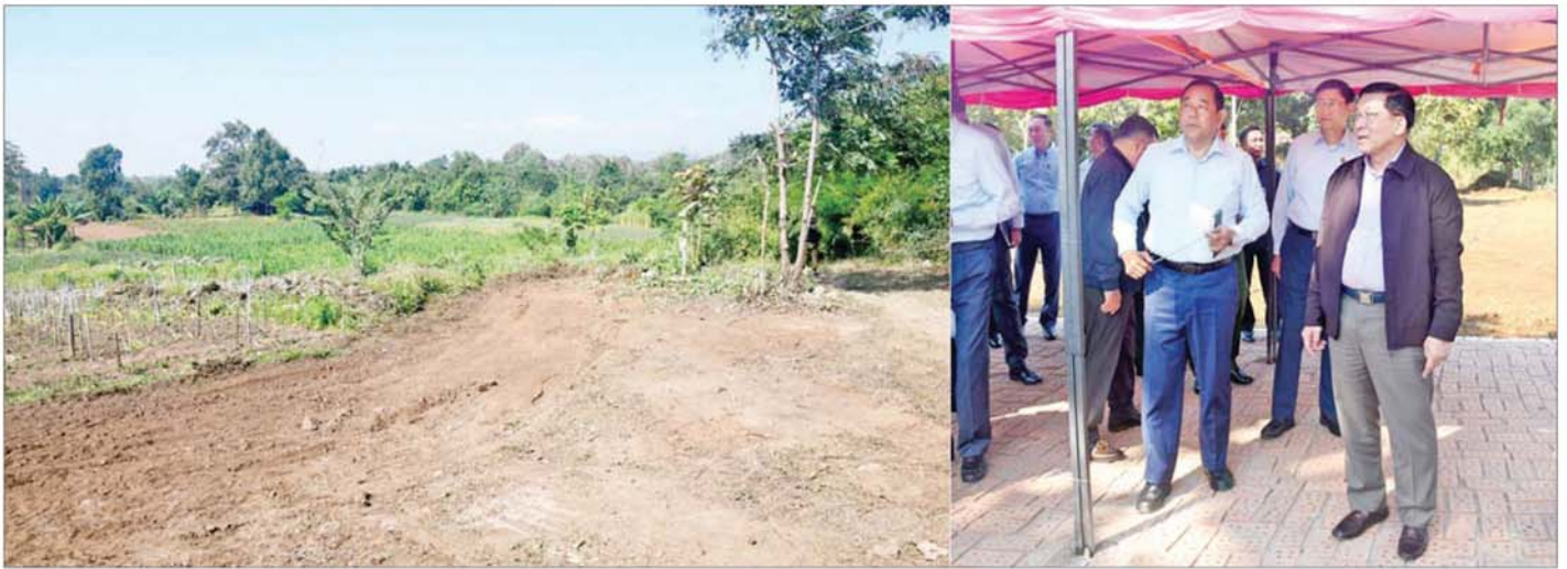
ပြည်ထောင်စုသမ္မတမြန်မာနိုင်ငံတော် ယာယီသမ္မတ နိုင်ငံတော်လုံခြုံရေးနှင့် အေးချမ်းသာယာရေးကော်မရှင်ဥက္ကဋ္ဌ ဗိုလ်ချုပ်မှူးကြီး မင်းအောင်လှိုင် မန္တလေး - လားရှိုးလမ်းမကြီးမှ စီးပင်ကြီးကျေးရွာနှင့် ဗဟိုမီးသတ်သင်တန်းကျောင်းသို့ ဝင်ရောက်သည့် လမ်းသစ်ဖောက်လုပ်မည့် လျာထားလမ်းအကြောင်းနေရာကို ကြည့်ရှုစစ်ဆေးစဉ်။