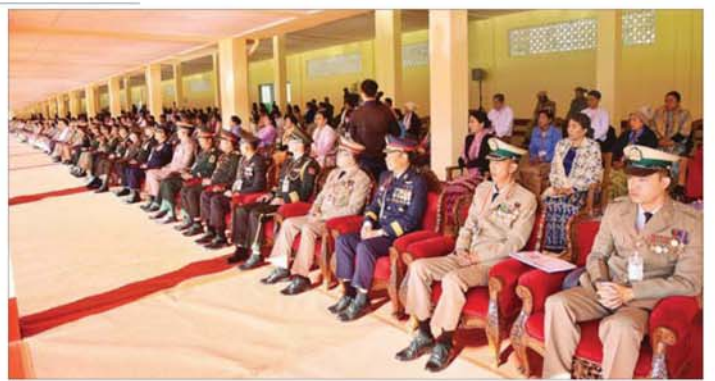
စစ်တက္ကသိုလ် ဗိုလ်လောင်းသင်တန်းအမှတ်စဉ် (၆၇) သင်တန်းဆင်း ဂုဏ်ပြုစစ်ရေးပြအခမ်းအနားသို့ တက်ရောက်လာကြသည့် ဧည့်သည်တော်များအား တွေ့ရစဉ်။