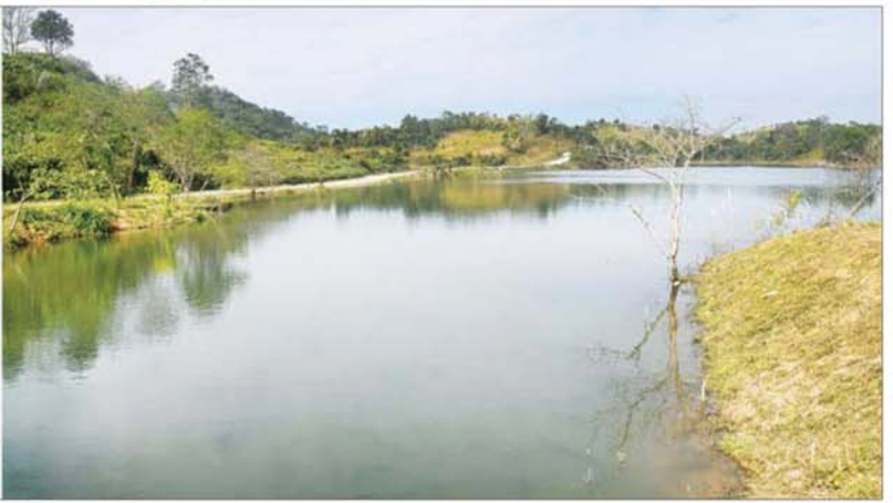
ပြည်ထောင်စုသမ္မတမြန်မာနိုင်ငံတော် ယာယီသမ္မတ နိုင်ငံတော်လုံခြုံရေးနှင့်အေးချမ်းသာယာရေးကော်မရှင်ဥက္ကဋ္ဌ ဗိုလ်ချုပ်မှူးကြီး မင်းအောင်လှိုင် ဆင်လမ်းရေလှောင်တံခံအတွင်း ရေသိုလှောင်ထားရှိမှုအား ကြည့်ရှုစစ်ဆေးစဉ်။