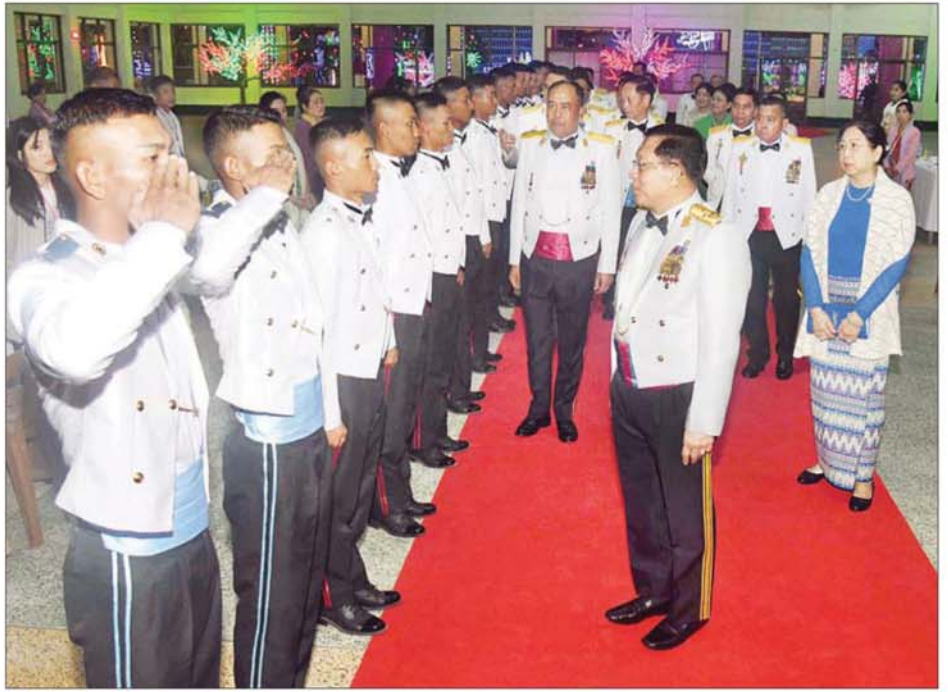
နိုင်ငံတော်လုံခြုံရေးနှင့် အေးချမ်းသာယာရေးကော်မရှင်ဥက္ကဋ္ဌ တပ်မတော်ကာကွယ်ရေးဦးစီးချုပ် ဗိုလ်ချုပ်မှူးကြီး မင်းအောင်လှိုင် စစ်တက္ကသိုလ် ဗိုလ်လောင်းသင်တန်း အမှတ်စဉ် (၆၇) သင်တန်းဆင်းအရာရှိများအား ရင်းရင်းနှီးနှီး လိုက်လံနှုတ်ဆက်စဉ်။

မန္တလေးတိုင်းဒေသကြီး ဝန်ကြီး ချုပ်၊ တိုင်းမှူးများ၊ စစ်တက္ကသိုလ် ကျောင်းအုပ်ကြီး၊ ပြင်ဦးလွင် တပ်နယ်မှ တာဝန်ရှိသူများ၊ ကျောင်းဆင်း ဗိုလ်လောင်းများ၏ မိဘဆွေမျိုးများနှင့် မိတ်ကြား ထားသည့် ဧည့်သည်တော်များ တက်ရောက်ကြသည်။ ဦးစွာ နိုင်ငံတော်လုံခြုံရေးနှင့် အေးချမ်းသာယာရေးကော်မရှင် ဥက္ကဋ္ဌ တပ်မတော်ကာကွယ်ရေး ဦးစီးချုပ်က သင်တန်းဆင်းအရာရှိ များအား တစ်ဦးချင်း ရင်းရင်းနှီးနှီး လိုက်လံ နှုတ်ဆက်သည်။ ထို့နောက် နိုင်ငံတော်လုံခြုံရေးနှင့် အေးချမ်းသာယာရေးကော်မရှင် ဥက္ကဋ္ဌ တပ်မတော်ကာကွယ်ရေး ဦးစီးချုပ်နှင့် အဖွဲ့ဝင်များသည် သင်တန်းဆင်း အရာရှိများ၊ ညစာ စားပွဲတက်ရောက်လာကြသူများ နှင့်အတူ ဂုဏ်ပြုညစာကို အတူတကွ သုံးဆောင်ကြသည်။ ညစာ မသုံးဆောင်မီနှင့် သုံးဆောင်စေခွင့်အတွင်း ပြည်သူ့ ဆက်ဆံရေးနှင့် စိတ်ဓာတ်စစ်ဆင် ရေး ညွှန်ကြားရေးမှူးရုံး ကွပ်ကဲ မှုအောက် ဖြတ်တီးကိတုအဖွဲ့ က တေးသီချင်းများ၊ တစ်ခန်းရပ်