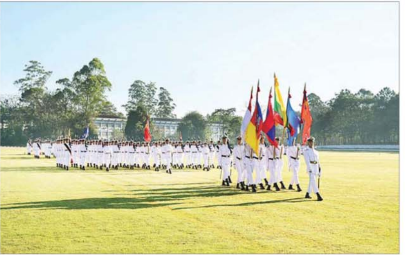
နိုင်ငံတော်လုံခြုံရေးနှင့် အေးချမ်းသာယာရေးကော်မရှင်ဥက္ကဋ္ဌ တပ်မတော်ကာကွယ်ရေးဦးစီးချုပ် ဗိုလ်ချုပ်မှူးကြီး သတိုးမဟာသရေစည်သူ သတိုးသိရိသုဓမ္မ မင်းအောင်လှိုင်အား ဗိုလ်လောင်းတပ်ခွဲများက အနွေးလျှောက်၊ အမြန်လျှောက်ဖြင့် ချီတက်အလေးပြုကြစဉ်။