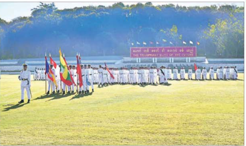
နိုင်ငံတော်လုံခြုံရေးနှင့် အေးချမ်းသာယာရေးကော်မရှင်ဥက္ကဋ္ဌ တပ်မတော်ကာကွယ်ရေးဦးစီးချုပ် ဗိုလ်ချုပ်မှူးကြီး သတိုးမဟာသရေစည်သူ သတိုးသီရိသုဓမ္မ မင်းအောင်လှိုင် စစ်တက္ကသိုလ် ဗိုလ်လောင်းသင်တန်း အမှတ်စဉ်(၆၇) သင်တန်းဆင်း ဂုဏ်ပြုစစ်ရေးပြအခမ်းအနားတွင် အမှာစကားပြောကြားစဉ်။