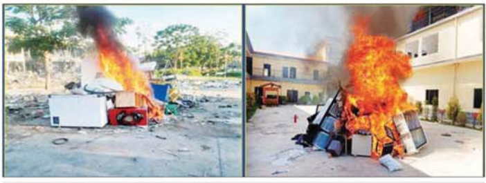
KK Park နယ်မြေအတွင်း တရားမဝင်ပစ္စည်းများ စီးရုံဖျက်ဆီးမှုမှတ်တမ်းဓာတ်ပုံ။