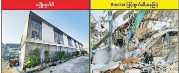
KK Park နယ်မြေအပိုင်း(၃)တွင် တရားမဝင်ဆောက်လုပ်ထားသည့် နှစ်ထပ်လူနေအဆောက်အအုံကို တွေ့ရစဉ်။