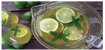
သံပရာသီးဓာတ်စွန်းစိမ်

ကိုယ်ရဲ့ ဇီဝဓာတ်ဖြစ်စဉ် (Metabolism)ကို လှုံ့ဆော်ပေးပြီး တစ်နေ့တာအတွက် လိုအပ်သော စွန့်အားနဲ့ စွမ်းအင်ကို သိသိသာသာ တိုးတက်ရရှိစေပါတယ်။