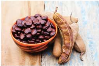
မန်ကျည်းစေ့

မန်ကျည်းစေ့ကို သန်ချတ်နေရာမှာ အသုံးပြုနိုင်ပါတယ်။ ခဏခဏ စေ့ခို ယားယံနေတတ်သူတွေအတွက် သတိထားရမယ့်အချက်ကတော့ အုတ်မှာ သန်ကောင်(အလုံးလိုက် သို့မဟုတ် အမျှင်လိုက်သန်ကောင်)တွေ ပုန်းအောင်းနေလို့ ဖြစ်နိုင်တာပါ။