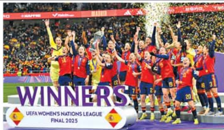
ယူစီပီတယ်။ အသင်းအတွက် အစွမ်းကုန် ကြိုးစားပေးခဲ့ကြတဲ့ နည်းပြအဖွဲ့ဝင်တွေနဲ့ ကစားသမားတွေအားလုံးကို အထူး

မရှိဖြင့် အနိုင်ရရှိကာ ချန်ပီယံဆုအား ဆွတ်ခူးခဲ့ခြင်းဖြစ်သည်။ စပိန်အသင်းသည် ယူအီးအက်မ်အေ အမျိုးသမီးနေရှင်းလိဂ်ပြိုင်ပွဲ ချန်ပီယံဆုကို နှစ်ကြိမ်ဆက်တိုက် ဆွတ်ခူးခဲ့ခြင်းလည်းဖြစ်သည်။ စပိန်အသင်း၏ ထုတ်ပြန်ချက်တွင် အခုလို ချန်ပီယံဆုကို ရယူနိုင်ခဲ့လို့ အတိုင်းမသိ ဂုဏ်