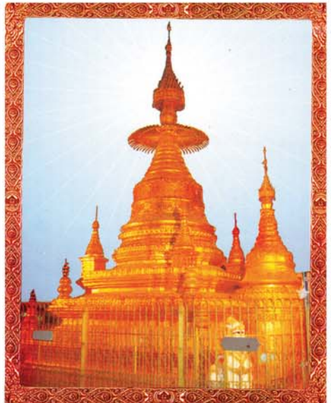
မန္တလေး၊ အရှေ့ပြင်နယ်လုံးဆိုင်ရာ မဟာလောကရန်နိမိအောင် တော်မူမြတ်စွာဘုရား (၁၄၄)ကြိမ်မြောက် ဗုဒ္ဓပူဇော်ယဘုရားပွဲတော် ကြီးတွင် ၁၃၈၇ ခုနှစ်၊ နတ်တော်လပြည့်ကျော် ၃ ရက်၊ ဒီဇင်ဘာ ၇ ရက်(တနင်္ဂနွေနေ့)တွင် ပဒေသာပင်နှင့် စာရေးတံမဲများ စင်းကျင်း၍ နတ်တော်လပြည့်ကျော် ၄ ရက်၊ ဒီဇင်ဘာ ၈ ရက်(တနင်္လာနေ့)နံနက်တွင် ဘုရားအစူးပြုပေသ ပင့်သယာ ၃၅၀ ပါးတို့အား ဆွမ်းသပိတ်နှင့် စာရေးတံမဲများ လောင်းလှူမည်ဖြစ်ရာ ဓဇတနာရှင်၊ ကုသိုလ်ရှင်များအနေဖြင့် ကြည်ညိုလောင်းလှူ ပူဇော်နိုင်ရန် နှိုးဆော်ထားစဉ်။ (ကဆ)