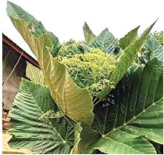
ကြာပက်ကြီးပင်

သရက်ရွက်မှာ ဓာတ်တိုးဆန့်ကျင်ပစ္စည်းတွေ ပါဝင်သောကြောင့် ခန္ဓာကိုယ်ထဲက ဆဲလ်တွေကို ကာကွယ်ပေးပါတယ်။