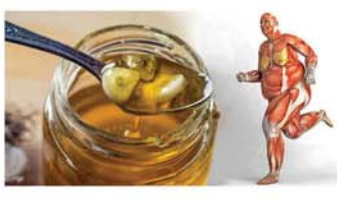
ကြက်သွန်ဖြူပျားရည်စိမ်

ပိုလီယိုဖြစ်နေတဲ့ကလေးတွေလည်း ကြာပက်ကြီးအမြစ် သို့မဟုတ် အရွက်သတ္တုရည်ကို လိမ်းပေးပါက သက်သာပျောက်ကင်းစေပါတယ်။