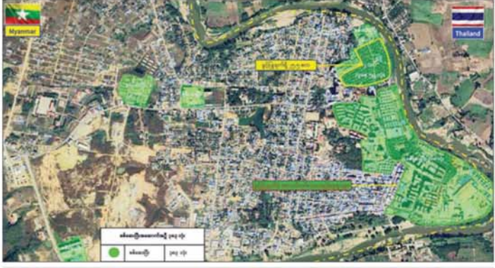
ကရင်ပြည်နယ် မြဝတီမြို့နယ် ရွှေကျိုလ်ကျေးရွာ စစ်ဆေးပြီးအဆောက်အအုံ အကွက်ချမြေပုံ။

နိုင်ငံတော်အစိုးရအနေဖြင့် အွန်လိုင်းလိမ်လည်လောင်းကစားမှုကျူးလွန်မှုများကို အမျိုးသားရေးတာဝန်တစ်ရပ်အဖြစ်ခံယူကာ မြန်မာနိုင်ငံအတွင်း လုံးဝအခြေမပြုနိုင်ရေး ပြည်တွင်းအင်အားစုများအပြင် အိမ်နီးချင်းနိုင်ငံ အစိုးရများနှင့်လည်း ပေါင်းစပ်ညှိနှိုင်း၍ ဆက်လက်ဆောင်ရွက်သွားမည် ဖြစ်ကြောင်း သတင်းရရှိသည်။ သတင်းစဉ်