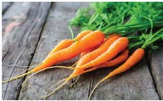
မုန်လာဥနီ