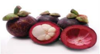
မင်းကွတ်သီးအခွံ

တစ်နေ့ တစ်ခွက် သောက်သုံးပေးပါက ပြောင်းလဲမှုတစ်ခုခုတော့ သင်ခံစားလာရပါလိမ့်မယ်။