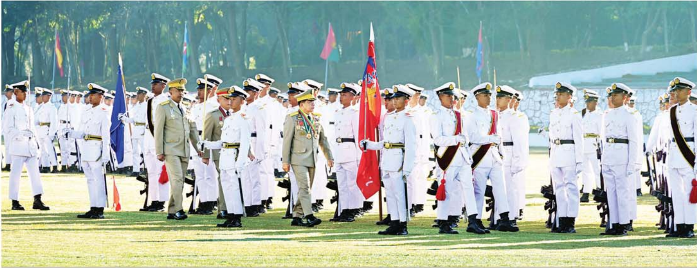
နိုင်ငံတော်လုံခြုံရေးနှင့် အေးချမ်းသာယာရေးကော်မရှင်ဥက္ကဋ္ဌ တပ်မတော်ကာကွယ်ရေးဦးစီးချုပ် ဗိုလ်ချုပ်မှူးကြီး သတိုးမဟာသရေစည်သူ သတိုးသီရိသုဓမ္မ မင်းအောင်လှိုင် စစ်တက္ကသိုလ် ဗိုလ်လောင်းသင်တန်း အမှတ်စဉ်(၆၇) သင်တန်းဆင်း ဂုဏ်ပြုစစ်ရေးပြအခမ်းအနားတွင် ကျောင်းဆင်းဗိုလ်လောင်းတပ်ခွဲအား စစ်ဆေးစဉ်။