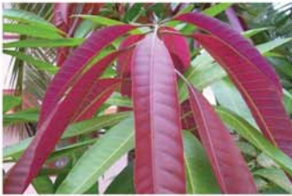
သရက်ရွက်

အထက်ပါနည်းလမ်းများအတိုင်း တစ်နေ့လျှင် တစ်ကြိမ် သုံးရက်ဆက်တိုက်သောက်ပေးမယ်ဆိုရင် အူလမ်းကြောင်းထဲက သန်ကောင်တွေကို အကုန်အစင် ဖယ်ရှားပေးနိုင်ပါတယ်။