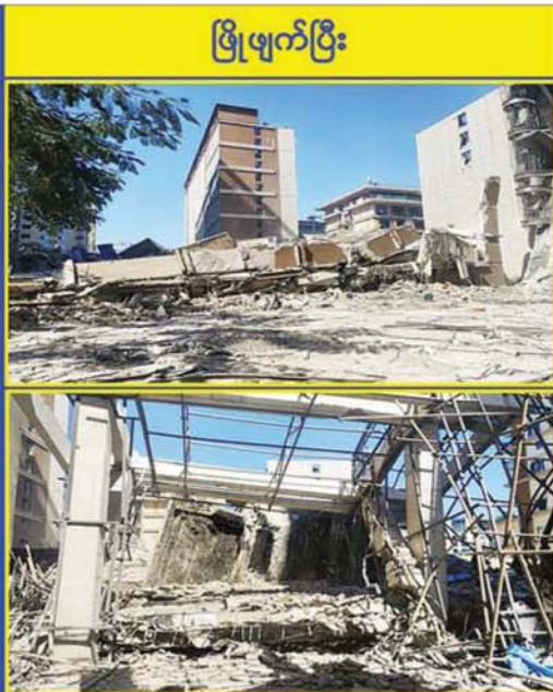
ဖြိုဖျက်ပြီး

နေပြည်တော် ၃ ဇူလိုင် - မြန်မာနိုင်ငံတော်အစိုးရအနေဖြင့် အွန်လိုင်းလိမ်လည်မှုများနှင့် အွန်လိုင်းလောင်းကစားမှုများ အများဆုံးအခြေချလုပ်ကိုင်လျက်ရှိကြသည့် ရွှေကုက္ကိုလ်နယ်မြေနှင့် မြဝတီ - မုံဇော်သလေး (KK Park) နယ်မြေများ၌ လုံခြုံရေးတပ်ဖွဲ့ဝင်များ အုပ်ချုပ်ရေးအဖွဲ့အစည်းများနှင့် ဒေသတွင်းတာဝန်ရှိသူများအပါအဝင် အဖွဲ့စုံပါဝင်သည့်ပူးပေါင်းအဖွဲ့ဖြင့် တရားမဝင်အဆောက်အအုံများအတွင်း ဝင်ရောက်ရှင်းလင်းခြင်း၊ အွန်လိုင်းလိမ်လည်လောင်းကစားမှုလုပ်ငန်းစဉ်များတွင်အသုံးပြုခဲ့သည့် သိမ်းဆည်းရမီပစ္စည်းများနှင့် တရားမဝင်အဆောက်အအုံများအား စနစ်တကျ ဖြိုချဖျက်ဆီးခြင်းနှင့် ချိပ်ပိတ်သိမ်းဆည်းခြင်းများ ဆောင်ရွက်လျက်ရှိရာ ယနေ့အထိ KK Park နယ်မြေအတွင်းရှိ တရားမဝင် အဆောက်အအုံ ၂၉၃ လုံးကို စနစ်တကျဖြိုချဖျက်ဆီးခဲ့ပြီး ရွှေကုက္ကိုလ်နယ်မြေအတွင်းရှိ တရားမဝင်အဆောက်အအုံ ၁၆၁ လုံးကို ချိပ်ပိတ် သိမ်းဆည်းခဲ့ပြီးဖြစ်ကြောင်း သိရှိရသည်။ စာမျက်နှာ ၁၀ သို့ ကရင်ပြည်နယ် မြဝတီမြို့နယ် ရွှေကုက္ကိုလ်နယ်မြေအတွင်း အဆောက်အအုံဖြိုချဖျက်ဆီးမှု မှတ်တမ်း ဓာတ်ပုံ။