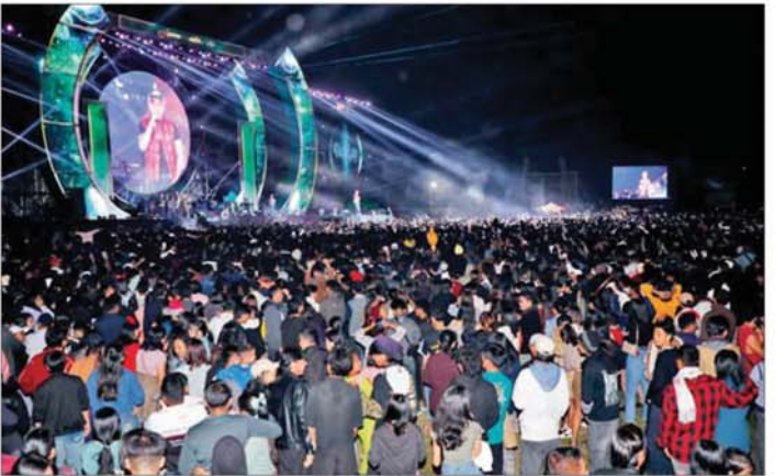
၂၀၂၆ ခုနှစ် နှစ်သစ်ကူးအကြို တေးဂီတဖျော်ဖြေပွဲ တတိယနေ့ကို နေပြည်တော်ရှိ ဝဏ္ဏသိဒ္ဓိအားကစားကွင်း၌ကျင်းပရာ ပါဝင်ဆင်နွှဲကြသူများဖြင့် အထူးစည်ကားလျက်ရှိသည်ကို တွေ့ရစဉ်။

၀ ရှေ့မှမှ ထိုသို့ တေးဂီတဖျော်ဖြေပွဲသို့ လာရောက်ပါဝင်ဆင်နွှဲကြသူများ ကို စိတ်လုံခြုံစွာ အမှတ်တရများ ဖြင့် ပျော်ပျော်ရွှင်ရွှင် ပါဝင်ဆင်နွှဲ နိုင်စေရန်အတွက် ကွင်းအတွင်းသို့ ဝင်ရောက်စဉ် တာဝန်ရှိသူများက ဝင်ပေါက်ဂီတများတွင် ဖျော်ဖြေပွဲ ဝင်ခွင့်လက်ပတ်များ စနစ်တကျ ရောင်းချ၍ လုံခြုံရေးအရလိုအပ် သည့် စစ်ဆေးမှုများ ပြုလုပ်ပေး သည့်အပြင် ဖျော်ဖြေပွဲဝန်းကျင် နေရာများ၌လည်း လိုအပ်သည့် လုံခြုံရေး စောင့်ကြည့်မှုများ ဆောင်ရွက်ပေးလျက် ရှိသည်ကို လည်း တွေ့ရသည်။