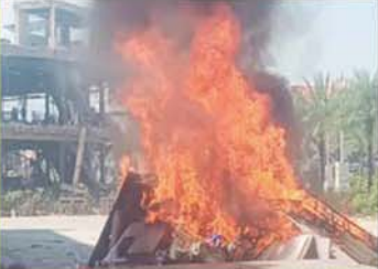
KK Park နယ်မြေအတွင်း အွန်လိုင်းလိမ်လည်လောင်းကစားမှု ကျူးလွန်သူများ အသုံးပြုခဲ့သည့် အသုံးအဆောင်ပစ္စည်းများအား မီးရှို့ဖျက်ဆီးမှုကို တွေ့ရစဉ်။

အဆိုများအနက် ယာဉ်ယန္တရားများ အသုံးပြု၍ ဖြိုချဖျက်ဆီးခြင်းများ ဆောင်ရွက်ပြီးစီးခဲ့သည့် တရားမဝင် အဆောက်အအုံများကို အလုံးစုံဖျက်ဆီးစေရန်အတွက် လေအိုးမီးအိုးဖြင့် ထပ်မံဖျက်ဆီးခြင်းများကိုလည်း ဒီဇင်ဘာ ၁၄ ရက်မှ စတင်ဆောင်ရွက်ခဲ့ရာ ယနေ့တွင် နှစ်ထပ် အဆောက်အအုံ ငါးလုံးကို ထပ်မံဖျက်ဆီးနိုင်ခဲ့သဖြင့် စုစုပေါင်းအဆောက်အအုံ