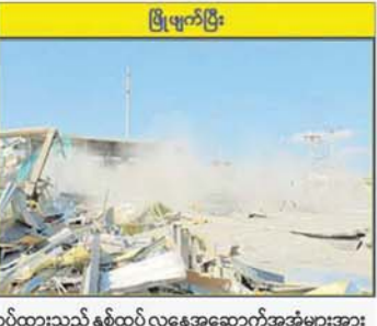
KK Park နယ်မြေအပိုင်း(၃)တွင် တရားမဝင် ဆောက်လုပ်ထားသည့် နှစ်ထပ် လူနေအဆောက်အအုံများအား လေအိုးမီးအိုးဖြင့် ဖျက်ဆီးမှု။

□ စာမျက်နှာ ၂၄ မှ ကျေးလက်ဖွံ့ဖြိုးရေးဝန်ကြီးဌာနအသင်းက ပညာရေးဝန်ကြီးဌာနအသင်းကို ၃၁ မှတ် - ၁၇ မှတ်ဖြင့်လည်းကောင်း၊ ဟိုတယ်နှင့် ခရီးသွားလာရေးဝန်ကြီးဌာနအသင်းက အလုပ်သမားဝန်ကြီးဌာနအသင်းကို ၂၈ မှတ် - ၂၂ မှတ်ဖြင့်လည်းကောင်း၊ ကာကွယ်ရေးဝန်ကြီးဌာနအသင်းက ပို့ဆောင်ရေးနှင့်ဆက်သွယ်ရေးဝန်ကြီးဌာနအသင်းကို ၁၀ မှတ် - ၃ မှတ်ဖြင့်လည်းကောင်း၊ ပြည်ထောင်စုရာထူးဝန်အဖွဲ့အသင်းက သယ်စာတင်ဆောင်ရေးဝန်ကြီးဌာနအသင်းကို ၁၀ မှတ် - ၄ မှတ်ဖြင့်လည်းကောင်း၊ ယှဉ်ပြိုင်အနိုင်ရရှိခဲ့သည်။ ဒီဇင်ဘာ ၃၁ ရက်တွင် ဝန်ကြီးဌာနပေါင်းစုံထုတ်ဆီးတိုး(အမျိုးသမီး)ပြိုင်ပွဲကို နံနက် ၈ နာရီတွင် ဝဏ္ဏသိဒ္ဓိအားကစားကွင်းရှိ လေ့ကျင့်ရေးကွင်းအမှတ်(၄)၌ ဆက်လက်ကျင်းပမည်ဖြစ်ပြီး လွန်ခဲ့(အမျိုးသား၊ အမျိုးသမီး)ပြိုင်ပွဲများကို နံနက် ၈ နာရီတွင် လေ့ကျင့်ရေးကွင်းအမှတ်(၃)၌ ယှဉ်ပြိုင်မည်ဖြစ်သည်။ ထုတ်ဆီးတိုးပွဲစဉ်များအဖြစ် စိုက်ပျိုးရေး၊ မွေးမြူရေးနှင့် ဆည်မြောင်းဝန်ကြီးဌာနအသင်းနှင့် ဥပဒေရေးရာ ဝန်ကြီးဌာနအသင်း၊ လျှပ်စစ်စွမ်းအားဝန်ကြီးဌာနအသင်းနှင့် အမျိုးသားစီမံကိန်းဝန်ကြီးဌာနအသင်း၊ တိုင်းရင်းသားလူမျိုးရေးရာဝန်ကြီးဌာနအသင်းနှင့် အားကစားနှင့် လူငယ်ရေးရာဝန်ကြီး