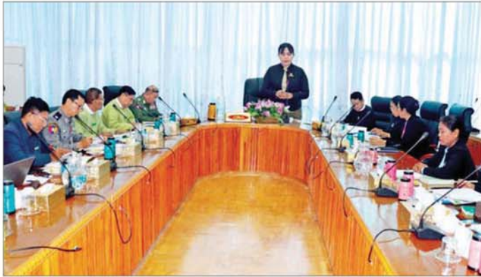
ဖြစ်စေရေးနှင့် ငွေကြေးဆိုင်ရာ အရေးယူဆောင်ရွက် ရေးအဖွဲ့ (Financial Action Task Force-FATF)၏ အကြံပြုချက်များနှင့်အညီ ဥပဒေကိုရေးဆွဲရခြင်းဖြစ် ကြောင်းနှင့် မြန်မာနိုင်ငံ ယစ်မျိုးအက်ဥပဒေ(THE MYANMAR EXCISE ACT)ကို ၂၀၂၄ ခုနှစ်ကတည်းက ပြဋ္ဌာန်းခဲ့ခြင်းဖြစ်၍ ပြောင်းလဲလာသည့် အခြေ အနေများနှင့် လိုက်လျောညီထွေဖြစ်စေရန် အသစ်

နေပြည်တော် ၃၀ ဇူလိုင် ၂၀၂၅ ခုနှစ် ငွေကြေးခဝါချမှု တိုက်ဖျက်ရေး ဥပဒေ(မူကြမ်း)နှင့် ယစ်မျိုးဥပဒေ (မူကြမ်း)တို့နှင့် စပ်လျဉ်းသည့် အပြီးသတ်ညှိနှိုင်း အစည်းအဝေးကို ယနေ့နံနက်ပိုင်းတွင် နေပြည်တော်ရှိ ဥပဒေရေးရာ ဝန်ကြီးဌာန အစည်းအဝေးခန်းမ၌ ကျင်းပသည်။ အစည်းအဝေးသို့ ဥပဒေရေးရာဝန်ကြီးဌာန ပြည်ထောင်စုဝန်ကြီးနှင့် ပြည်ထောင်စု ရှေ့နေချုပ် ဒေါက်တာသီတာဦး၊ ဒုတိယဝန်ကြီးနှင့် ဒုတိယရှေ့နေ ချုပ် ဒေါက်တာထိန်လင်းဦး၊ ပြည်ထောင်စုဝန်ကြီးဌာန ဒုတိယဝန်ကြီး ဝိုင်းချုပ်အောင်ကျော်ကျော်၊ ဥပဒေ မူကြမ်းစိစစ်ရေးဦးစီးဌာန၊ ဥပဒေအကြံဉာဏ်ပေးရေး ဦးစီးဌာန၊ တရားစွဲနှင့် အမှုလိုက်ဦးစီးဌာန၊ အထွေထွေ အုပ်ချုပ်ရေးဦးစီးဌာနနှင့် ငွေကြေးခဝါချမှုတားဆီး နှိမ်နင်းရေးရဲဘဲလ်တို့မှ တာဝန်ရှိသူများ တက်ရောက် ကြသည်။ အစည်းအဝေးတွင် ပြည်ထောင်စုဝန်ကြီးနှင့် ပြည်ထောင်စုရှေ့နေချုပ်က အမှာစကားပြောကြား ပြီး ဒုတိယဝန်ကြီး ဝိုင်းချုပ် အောင်ကျော်ကျော်က ငွေကြေးခဝါချမှုတိုက်ဖျက်ရေးဥပဒေကို ပြောင်းလဲ လာသည့်အခြေအနေများနှင့် လိုက်လျောညီထွေ