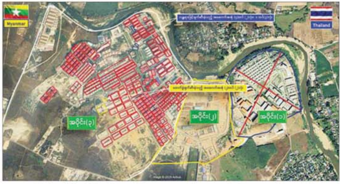
ကရင်ပြည်နယ် မြဝတီမြို့နယ်အတွင်းရှိ KK Park အပိုင်း (၃) နယ်မြေအား ဖောက်ခွဲဖျက်ဆီးမှု။

တရားမဝင် လေးထပ်အဆောက်အအုံ တစ်လုံး၊ နှစ်ထပ်အဆောက်အအုံ နှစ်လုံးနှင့် တစ်ထပ်အဆောက်အအုံ သုံးလုံး စုစုပေါင်း တရားမဝင် အဆောက်အအုံ ခြောက်လုံးတို့ကို ထပ်မံဖြိုချဖျက်ဆီးခဲ့သဖြင့် KK Park နယ်မြေအတွင်းရှိ တရားမဝင်အဆောက်အအုံ စုစုပေါင်း ၆၃၅ လုံးအနက် ၅၅၅ လုံးကို စနစ်တကျ ဖြိုချဖျက်ဆီးပြီးဖြစ်ကြောင်း သိရှိရသည်။ ထို့ပြင် KK Park နယ်မြေအတွင်းရှိ တရားမဝင်အဆောက်