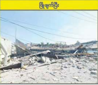
KK Park နယ်မြေအပိုင်း(၃)တွင် တရားမဝင်ဆောက်လုပ်ထားသည့် နှစ်ထပ်လူနေအဆောက်အအုံ။