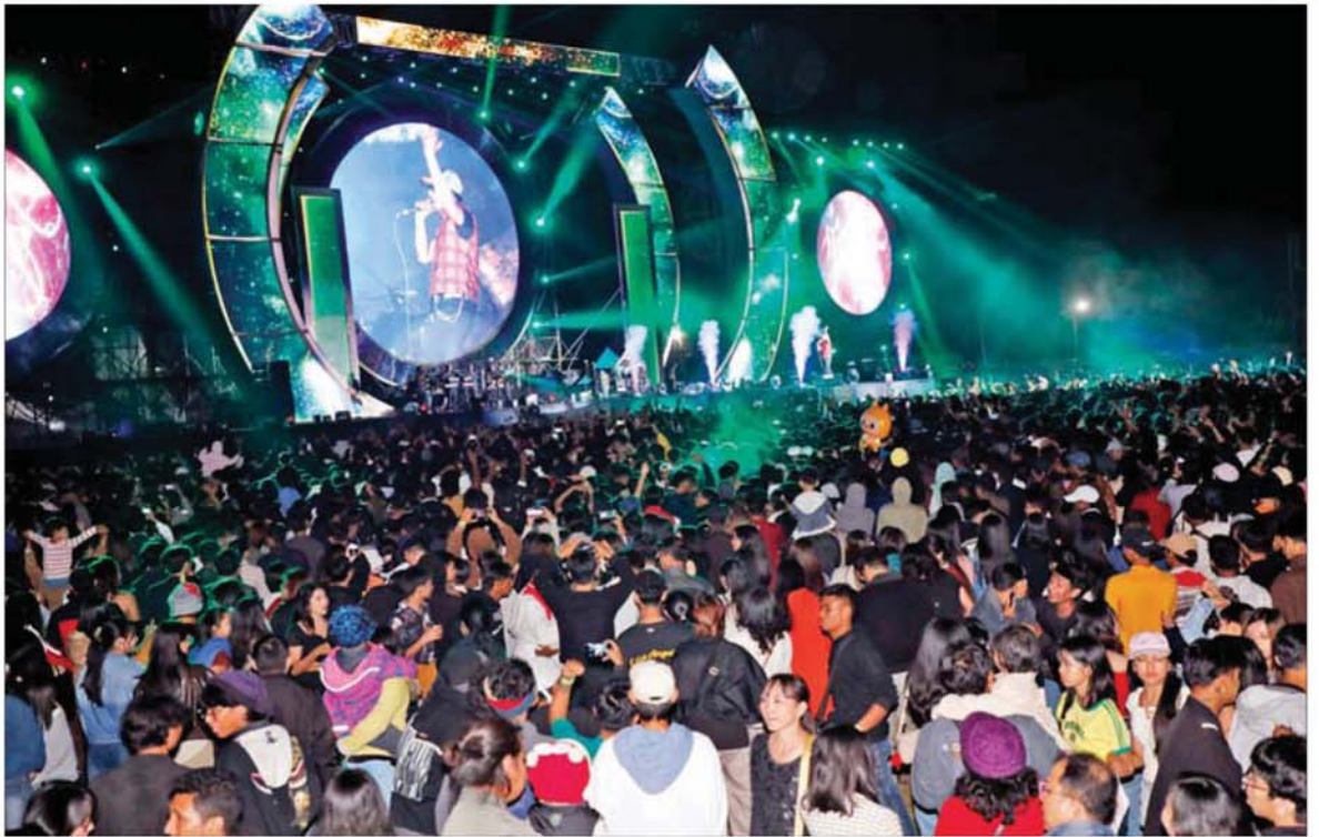
၂၀၂၆ ခုနှစ် နှစ်သစ်ကူးအကြို တေးဂီတဖျော်ဖြေပွဲ တော်ယနေ့ကို နေပြည်တော်ရှိ ဝဏ္ဏသိဒ္ဓိအားကစားကွင်း၌ ကျင်းပရာ ပါဝင်ဆင်နွှဲကြသူများဖြင့် အထူးစည်ကားလှက်ရှိသည်ကို တွေ့ရစေသည်။

နေပြည်တော် ဒီဇင်ဘာ ၁၀ ပြည်ထောင်စုနယ်မြေ နေပြည်တော်အတွင်းရှိ ဒေသခံပြည်သူများ၊ ဝန်ထမ်းများနှင့် ဝန်ထမ်းမိသားစုများ အဖမ်းပြေဖျော်စေရန် နှစ်သစ်ကို သာယာချမ်းမြေ့စွာ ကြိုဆိုနိုင်ရန်နှင့် စိတ်ရွှန်အားသစ်များ ရရှိရန် ရည်ရွယ်၍ ကျင်းပသည့် ၂၀၂၆ ခုနှစ် နှစ်သစ်ကူးအကြို တေးဂီတဖျော်ဖြေပွဲတော်ယနေ့ကို ယနေ့ညနေပိုင်းတွင် နေပြည်တော်ရှိ ဝဏ္ဏသိဒ္ဓိအားကစားလေ့ကျင့်ရေးကွင်းအမှတ်(၁)နှင့်(၂)၌ ကျင်းပရာ ပါဝင်ဆင်နွှဲကြသူများဖြင့် အထူးစည်ကားလှက်ရှိပါသည်။ ယနေ့ည ဖျော်ဖြေပွဲ တော်ယနေ့ ရောက်ရှိလာသည်နှင့်အညီ မွန်းလွဲပိုင်းမှစတင်၍ ဒေသခံပြည်သူများ၊ ဝန်ထမ်းများနှင့် ဝန်ထမ်းမိသားစုများသည် ဂီတဖျော်ဖြေပွဲကျင်းပမည့် ဝဏ္ဏသိဒ္ဓိအားကစားလေ့ကျင့်ရေးကွင်းများအတွင်းသို့ မိသားစုအလိုက်၊ မိတ်ဆွေသူငယ်ချင်းအစုအဖွဲ့အလိုက် ပါဝင်ဆင်နွှဲရန် ဖော်တော်ယာဉ်များ၊ သုံးဘီးဆိုင်ကယ်များ၊ ဆိုင်ကယ်များဖြင့် တွဲဖက်လာရောက်ကြသည်ကို တွေ့မြင်ရသည်။