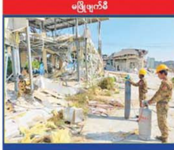
KK Park နယ်မြေအပိုင်း(၃)တွင် တရားမဝင်အဆောက်အအုံတစ်လုံးကို နှစ်ထပ်လှေနေအဆောက်အအုံများအား လေးအိုးမီးအိုးဖြင့် ဖျက်ဆီးနေမှုကို တွေ့ရစဉ်။

အသုံးပြု၍ ဖြိုချဖျက်ဆီးခြင်းများ ဆောင်ရွက်ပြီးစီးခဲ့သည့် တရားမဝင်အဆောက်အအုံများကို အလုံးစုံဖျက်ဆီးစေရန်အတွက် လေးအိုးမီးအိုးဖြင့် ထပ်မံဖျက်ဆီးခြင်းများကိုလည်း ဒီဇင်ဘာ ၁၄ ရက်မှ စတင်ဆောင်ရွက်ခဲ့ရာ ယနေ့တွင် နှစ်ထပ်အဆောက်အအုံ ငါးလုံးကို ထပ်မံဖျက်ဆီးနိုင်ခဲ့သဖြင့် စုစုပေါင်း အဆောက်အအုံ ၇၁ လုံးတို့ကို ရာခိုင်နှုန်းပြည့် ဖျက်ဆီးပြီးဖြစ်ကြောင်း သိရသည်။ ယင်းအပြင် KK Park နယ်မြေနှင့်ရွှေကုက္ကိုလ်နယ်မြေအတွင်းရှိ အွန်လိုင်းလိမ်လည်လောင်းကစားမှုကျူးလွန်ရာတွင် အသုံးပြုခဲ့သည့် ပစ္စည်းများအား ထပ်မံအသုံးပြုမရှိစေရေးအတွက် ယနေ့တွင်လည်း စနစ်တကျမီးရှို့ဖျက်ဆီးခဲ့ကြောင်းနှင့် နိုင်ငံတော်အစိုးရအနေဖြင့် အွန်လိုင်းလိမ်လည်လောင်းကစားမှုကျူးလွန်မှုများကို အမျိုးသားရေး တာဝန်တစ်ရပ်အဖြစ် ခံယူကာ မြန်မာနိုင်ငံအတွင်း လုံးဝအခြေမပြုနိုင်ရေး ပြည်တွင်းအင်အားစုများအပြင် အိမ်နီးချင်းနိုင်ငံ အစိုးရများနှင့်လည်း ပေါင်းစပ်ညှိနှိုင်း၍ ဆက်လက်ဆောင်ရွက်သွားမည်ဖြစ်ကြောင်း သိရသည်။ သတင်းစဉ်