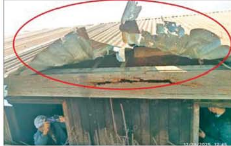
အကြမ်းဖက်အဖျက်သမား သောင်းကျန်းသူအုပ်စုက စစ်ကိုင်း တိုင်းဒေသကြီး တမူးမြို့ စော်ဘွား(၁)ရပ်ကွက် အမှတ်(၂) အခြေခံ ပညာအထက်တန်းကျောင်းရှိ မဲရုံအမှတ်(၃)အနီးသို့ Drop Bomb ချတိုက်ခိုက်မှုကြောင့် နေအိမ်များပျက်စီးမှုကို တွေ့ရစဉ်။