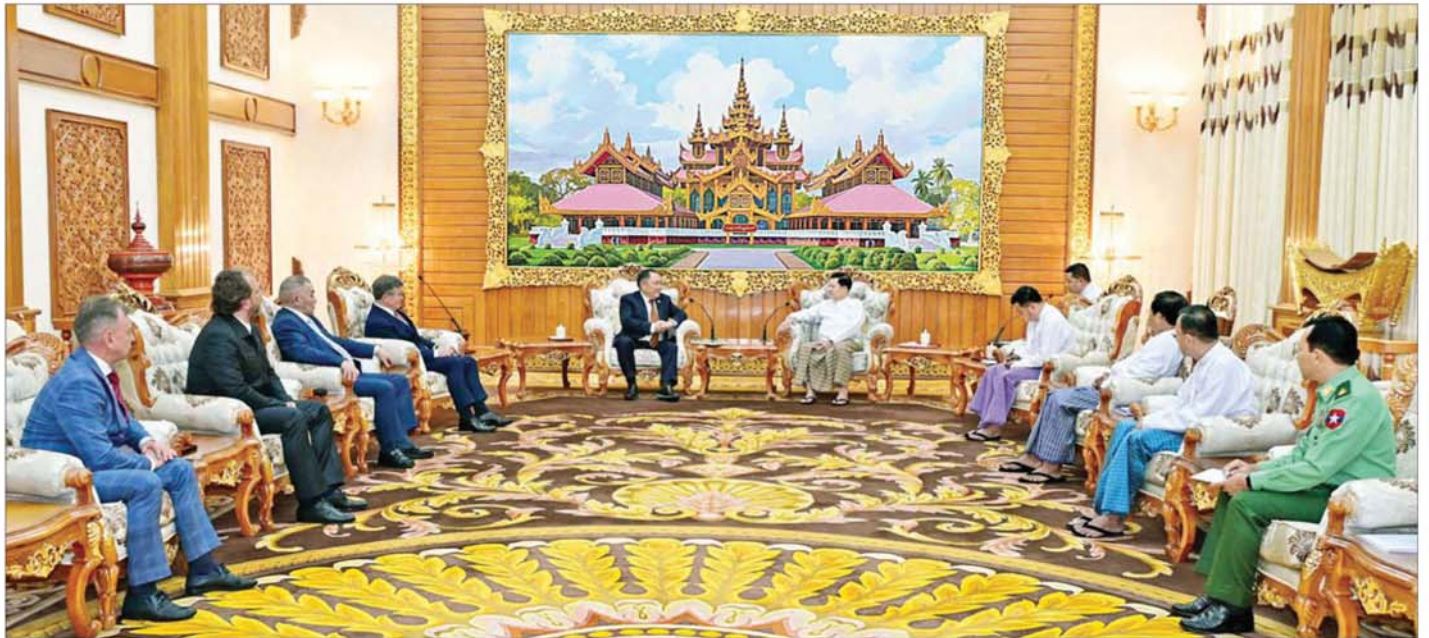
ပြည်ထောင်စုသမ္မတမြန်မာနိုင်ငံတော် ယာယီသမ္မတ နိုင်ငံတော်လုံခြုံရေးနှင့် အေးချမ်းသာယာရေးကော်မရှင်ဥက္ကဋ္ဌ ဗိုလ်ချုပ်မှူးကြီး မင်းအောင်လှိုင် ရှုရှားဖက်ဒရေးရှင်းနိုင်ငံ ဒူးမားလွတ်တော် ဒုတိယဥက္ကဋ္ဌ H.E. Mr. Sholban Kara-Ool ဦးဆောင်သည့် ကိုယ်စားလှယ်အဖွဲ့အား လက်ခံတွေ့ဆုံစဉ်။