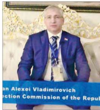
Mr . Alexei Bashan ၊ ဘယ်လာရုစ်သမ္မတနိုင်ငံ၊ ဗဟိုရွေးကောက်ပွဲကော်မရှင် ဒုတိယဥက္ကဋ္ဌ

ကို တွေ့ရပါတယ်။ အောင်မြင်တဲ့ရွေးကောက်ပွဲ ဖြစ်တဲ့အတွက် နောင်ကျင်းပမယ့် အပိုင်း (၂)နဲ့ အပိုင်း (၃)မှာလည်း အောင်မြင်အောင် ဆောင်ရွက် နိုင်မယ်လို့ ယူဆပါတယ်။ မဲဆန္ဒရှင်တွေမှာ မျှော်မှန်းချက်တွေ ရှိတယ်ဆိုတာကိုလည်း တွေ့ခဲ့ရ တယ်။ ရွေးကောက်ပွဲပြီးရင် သူတို့ဘဝတွေ ပိုကောင်း လာမယ်။ စီးပွားရေးတွေ ကောင်းလာမယ်။ အချို့ နေရာတွေမှာ ပဋိပက္ခတွေ လျော့ကျသွားပြီး အေးချမ်းတည်ငြိမ်သွားမယ်။ ယခုရွေးကောက်ပွဲဟာ မြန်မာနိုင်ငံရဲ့ ပြည်တွင်းရေးကိစ္စဖြစ်ပြီး တရုတ် နိုင်ငံအနေနဲ့ အောင်မြင်တယ်လို့ ယူဆပါတယ်။ အမျိုးသားပြန်လည်စည်းလုံးညီညွတ်ရေး၊ အတူ ယှဉ်တွဲနေထိုင်ရေးတို့ကို အကောင်အထည်ဖော် ဆောင်ရွက်နိုင်လိမ့်မယ်လို့ ကျွန်တော်ယုံကြည်ပါ တယ်။ တရုတ်နိုင်ငံနဲ့ မြန်မာနိုင်ငံဟာ ကောင်းမွန် တဲ့၊ ချစ်ကြည်ရင်းနှီးတဲ့ ဆက်ဆံရေးရှိသော နိုင်ငံ တွေ ဖြစ်ကြပါတယ်။ ကျွန်တော်တို့အနေနဲ့ မြန်မာ ကို အမြဲတမ်းကူညီပေးဖို့ အသင့်ရှိနေပါတယ်။ နှစ်နိုင်ငံကြား ဖွံ့ဖြိုးတိုးတက်မှုတွေကို ရရှိအောင် ထူထောင်သွားဖို့အတွက် ဆန္ဒရှိပါတယ်။ ဒါကြောင့်ပဲ ဒီရွေးကောက်ပွဲမှာ မြန်မာနိုင်ငံရဲ့ စီးပွားရေး၊ လူမှုရေး စတဲ့ ဖွံ့ဖြိုးတိုးတက်မှုတွေကို ပူးပေါင်း ဆောင်ရွက်သွားဖို့ ဆန္ဒရှိပါတယ်ခင်ဗျာ။