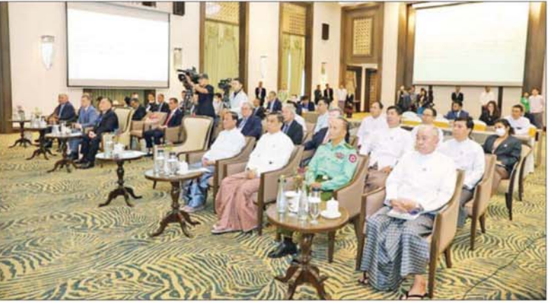
ပြည်ထောင်စု ရွေးကောက်ပွဲကော်မရှင်ဥက္ကဋ္ဌ ဦးသန်းစိုး၊ ၂၀၂၅ ခုနှစ် ပါတီစုံဒီမိုကရေစီအထွေထွေရွေးကောက်ပွဲသို့ နိုင်ငံတကာ ရွေးကောက်ပွဲစောင့်ကြည့် လေ့လာသူများ၏ စောင့်ကြည့်လေ့လာခဲ့မှုဆိုင်ရာ မှတ်ချက်ပြုအခမ်းအနားတွင် အမှာစကားပြောကြားစဉ်။

ကိုယ်စားလှယ်အဖွဲ့၊ အိန္ဒိယနိုင်ငံမှ အငြိမ်းစားဗိုလ်ချုပ် Mr. Sahni Arun Kumar ဦးဆောင်သော ကိုယ်စားလှယ် အဖွဲ့နှင့် ဂျပန် - မြန်မာအသင်းမှ Mr. Yusuke WATANABE ဦးဆောင်သော ကိုယ်စားလှယ်အဖွဲ့၊ သက်ဆိုင်ရာ ဝန်ကြီး ဌာနများမှ ညွှန်ကြားရေးမှူးချုပ်များနှင့် တာဝန်ရှိသူများ၊ ပြည်ထောင်စု ရွေးကောက်ပွဲကော်မရှင်ရုံး တာဝန်ရှိသူ များနှင့် ဖိတ်ကြားထားသည့် စည်သူညီ တော်များ တက်ရောက်ကြသည်။ ဦးစွာ ပြည်ထောင်စုရွေးကောက်ပွဲ ကော်မရှင်ဥက္ကဋ္ဌက အမှာစကားပြောကြား ရာတွင် နိုင်ငံတော်ယာယီသမ္မတနိုင်ငံတော် လုံခြုံရေးနှင့် အေးချမ်းသာယာရေး ကော်မရှင်ဥက္ကဋ္ဌ ဗိုလ်ချုပ်မှူးကြီးက လာရောက်လေ့လာမှုအတွက် ဝမ်းမြောက် ဂုဏ်ယူကျေးဇူးတင်ကြောင်း၊ ရွေးကောက်ပွဲ ကျင်းပပြုလုပ်ခြင်းသည် လွှတ်တော် အသီးသီး ခေါ်ယူဖွဲ့စည်းနိုင်ရန်နှင့် လွှတ်တော်မှတစ်ဆင့် နိုင်ငံတော်သမ္မတ၊ ဒုတိယသမ္မတ၊ အုပ်ချုပ်ရေးဆိုင်ရာအဖွဲ့ အစည်းများ၊ သမ္မတမှ တာဝန်ပေးအပ် သည့် ပြည်ထောင်စုအဆင့် အဖွဲ့အစည်း