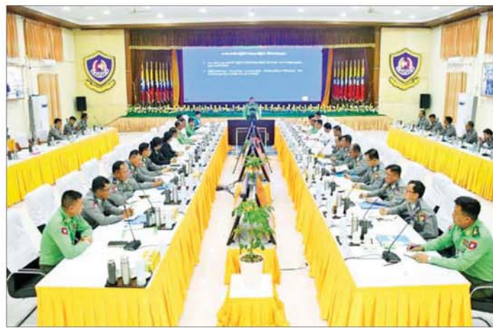
ကြောင်းနှင့် ၁၃၀၁၁ ဦး ဒဏ်ရာရရှိ ခဲ့ပါကြောင်း။

အကြမ်းဖက် သောင်းကျန်းသူ များသည် ၎င်းတို့ကို ဆန့်ကျင် ရွတ်ချသူများကို သာမက မထောက်ခံသူများ၊ အေးချမ်းစွာ နေထိုင်လိုသူများကိုလည်း ရန်သူ အဖြစ်သတ်မှတ်ပြီး လုပ်ကြံစွပ်စွဲ သတ်ဖြတ်ခဲ့ကြပါကြောင်း၊ သို့ဖြစ် ၍ ရဟန်းသံဃာများ၊ သီလရှင် များ၊ ရပ်/ကျေးအုပ်ချုပ်ရေးမှူး များ၊ ပညာရေး၊ ကျန်းမာရေး။