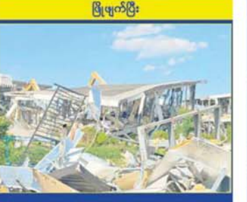
KK Park နယ်မြေအတွင်း တရားမဝင်ပစ္စည်းများ မီးရှို့ဖျက်ဆီးမှုကို တွေ့ရစဉ်။