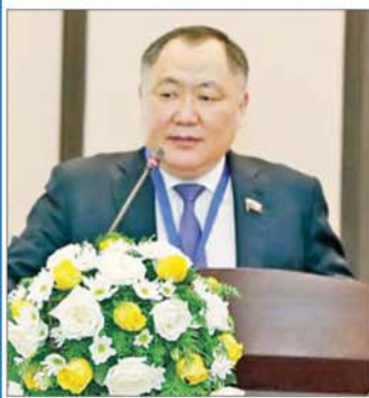
H.E. Mr. Sholban Kara-Ool ရုရှားဖက်အရေးရှင်းနိုင်ငံ ဒုတိယဥက္ကဋ္ဌ

ကြွေးကောက်ပွဲကြောင့် မြန်မာနိုင်ငံ ပြည်ထောင်စု ရွေးကောက်ပွဲကော်မရှင် ဥက္ကဋ္ဌကြီးနှင့် တကွ တာဝန်ရှိပုဂ္ဂိုလ်များ၊ နိုင်ငံတကာမှ ပညာသင်တော် များခင်ဗျာ။ မနေ့က ကျင်းပခဲ့တဲ့ ပြည်ထောင်စု သမ္မတမြန်မာနိုင်ငံရွေးကောက်ပွဲကို နိုင်ငံတကာက စောင့်ကြည့်လေ့လာရေး အဖွဲ့ဝင်များနှင့် ပူးပေါင်း ဆောင်ရွက်ပြီး လေ့လာခဲ့ပါတယ်။ ကျွန်တော်တို့ Delegation အဖွဲ့မှာ ရုရှားနိုင်ငံရဲ့ နိုင်ငံရေးပါတီ ကိုယ်စားလှယ်များသာမက ရွေးကောက်ပွဲကော်မရှင် က ကိုယ်စားလှယ်များပါ ပါဝင်ပါတယ်။ သူတို့က မြန်မာနိုင်ငံမှာ ကျင်းပတဲ့ ရွေးကောက်ပွဲသာမက အခြားနိုင်ငံများမှာ ကျင်းပတဲ့ ရွေးကောက်ပွဲတွေ ကိုပါ တစ်ကြိမ်ကလေး လေ့လာခဲ့ဖူးပါတယ်။ ကျွန်တော် တို့အဖွဲ့ဝင်တွေရဲ့ အတွေ့အကြုံများကိုလည်း မိတ်ဆက်ပေးပြီးဖြစ်ပါတယ်။ ဒါကြောင့်မို့လို့ ကျွန်တော်တို့ရဲ့ အတွေ့အကြုံတွေနဲ့ မြန်မာနိုင်ငံ ရဲ့ ရွေးကောက်ပွဲကို ချိန်ဆီးပြီး လာရောက်လေ့လာ နေတာဖြစ်ပါတယ်။ ကျွန်တော်တို့ မနေ့ကလေ့လာ ခဲ့တဲ့ အချိန်မှာ မြန်မာနိုင်ငံ ရွေးကောက်ပွဲကော်မရှင် ရဲ့ ကြိုးစားအားထုတ်မှုများကို မျက်စိထဲထင်ထင် တွေ့မြင်ခဲ့ရပါတယ်။ ဒီအလုပ်တွေဟာ တကယ်တော့ လွယ်ကူတဲ့အလုပ်တော့ မဟုတ်ပါဘူး။ တကယ် ကြိုးစားအားထုတ်နေတယ်ဆိုတာ သိသာမြင်သာ ပါတယ်။ ကျွန်တော်တို့ မနေ့က လေ့လာခဲ့တဲ့ အချိန် မှာ ရွေးကောက်ပွဲ မဲပေးနေကြတာဟာ အီလက် ထရောနစ်စက်တွေကို အသုံးပြုနေတာတွေ့ရပါ တယ်။ အီလက်ထရောနစ်စက်တွေဟာ တာဝန်ရှိသူ များ ရှင်းပြချက်များအရ ဖြစ်ပေါ်ကာ အီလက်ထရောနစ် နေရာဒီယိုမှတစ်ဆင့် လုံးဝ မပြုလုပ်နိုင်ဘူးဆိုတာလည်း သိရပါတယ်။ ကျွန်တော်တို့ မျက်စိကြည့်တဲ့အချိန်