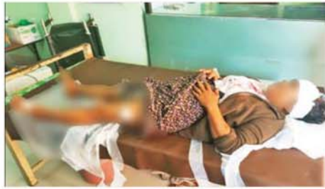
အကြမ်းဖက်အဖျက်သမား သောင်းကျန်းသူအုပ်စုက စစ်ကိုင်းတိုင်း ဒေသကြီး ရွှေဘိုမြို့ အမှတ်(၃)ရပ်ကွက်ရှိ မဲရုံအမှတ်(၂)အနီးသို့ Drop Bomb ချတိုက်ခိုက်မှုကြောင့် အရပ်သားပြည်သူများ ထိခိုက်ဒဏ်ရာ ရရှိမှုကို တွေ့ရစဉ်။