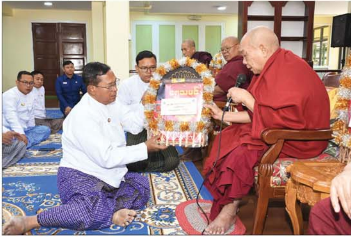
သတင်း-စာမျက်နှာ ၁၃