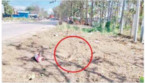
အကြမ်းဖက်အဖျက်သမား သောင်းကျန်းသူအုပ်စုက ကရင် ပြည်နယ် မြဝတီမြို့ အမှတ်(၅) ရပ်ကွက်ရှိ မြန်မာ-ထိုင်း ချစ်ကြည်ရေးအမှတ် (၂) တံတားအနီး၌ ဒေသန္တရ လက်လုပ်ဗုံးများ ဖောက်ခွဲမှုကို တွေ့ရစဉ်။

စနစ်ကို သက်ဝင်ယုံကြည်ကြသူများနှင့် နိုင်ငံတော်အစိုးရ၏ ရွေးကောက်ပွဲဆိုင်ရာစီမံဆောင်ရွက်မှုများအပေါ် သံသယကင်းရှင်းပြီး ထောက်ခံကြသည့် မဲပေးပိုင်ခွင့်ရှိသူပြည်သူများက တစ်ခဲနက် မိမိတို့ဆန္ဒ အလျောက် ဒီဇင်ဘာ ၂၈ ရက် နံနက် ၅ နာရီခွဲမှပင် စတင်စောင့်ဆိုင်း လျက် မဲရုံများ စာမျက်နှာ ၁၇ သို့