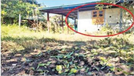
အကြမ်းဖက်အဖျက်သမား သောင်းကျန်းသူအုပ်စုက ကယားပြည်နယ် လှိုင်ကော်မြို့ ရွှေတောင်ရပ်ကွက်နှင့် မင်္ဂလာရပ်ကွက်အတွင်းသို့ ရှော့တိုက်ခွဲများဖြင့် ပစ်ခတ်မှုကြောင့် ပျက်စီးမှုကို တွေ့ရစဉ်။