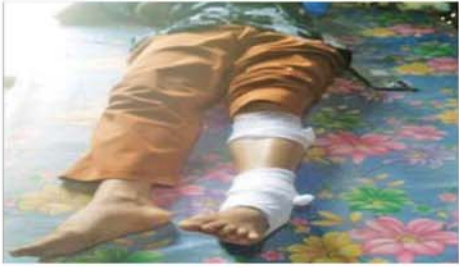
အကြမ်းဖက်အဖျက်သမား သောင်းကျန်းသူအုပ်စုက စစ်ကိုင်းတိုင်း ဒေသကြီး စစ်ကိုင်းမြို့ တိုင်းရင်းသားလူငယ်များစွမ်းရည်ပွဲပြီးရေး ဒီဂရီကောလိပ်သို့ လက်လုပ်ရှော့တိုက်ခွဲများ ပစ်ခတ်တိုက်ခိုက်မှု ကြောင့် အရပ်သားပြည်သူများ ထိခိုက်ဒဏ်ရာရမှုကို တွေ့ရစဉ်။