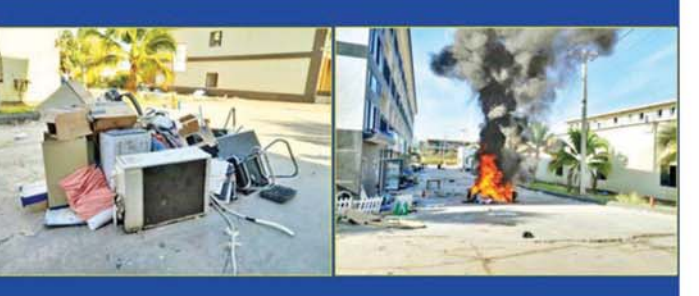
KK Park နယ်မြေအတွင်း တရားမဝင်ပစ္စည်းများ မီးရှို့ဖျက်ဆီးမှုကို တွေ့ရစဉ်။

■ စာမျက်နှာ ၁၆ မှ တစ်ပြိုင်နက်ဖွင့်လှစ်သည့် နံနက် ၆ နာရီမှ သက်မှတ်ချိန်မဲရပ်တံသည့် ညနေ ၄ နာရီအထိနှင့် ၄ နာရီနေ့ကပ်ရင်း မဲရပ်ရိုက်ကပ်အတွင်း ကျန်ရှိနေသည့် မဲဆန္ဒရှင်များကလည်း ဆက်လက်မဲပေးကြရာ ညနေ ၅ နာရီခွဲတွင် မြို့နယ် ၁၀၂ မြို့နယ်လုံးအနေဖြင့် ရွေးကောက်ပွဲအပိုင်း(၁)ကို အောင်မြင်စွာ ဆောင်ရွက်နိုင်ခဲ့သည်။ ထို့ပြင် အကြမ်းဖက်အဖျက်သမား သောင်းကျန်းသူအုပ်စုများ အနေဖြင့် ၂၀၂၅ ခုနှစ် ပါတီစုံဒီမိုကရေစီ အထွေထွေရွေးကောက်ပွဲအကြို