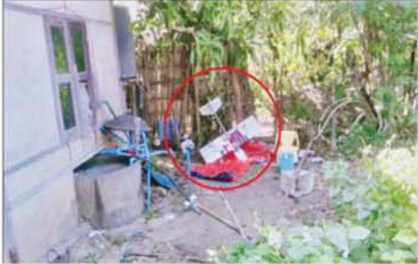
အကြမ်းဖက်အဖျက်သမား သောင်းကျန်းသူအုပ်စုက စစ်ကိုင်း တိုင်းဒေသကြီး ရွှေဘိုမြို့ အမှတ်(၃)ရပ်ကွက်ရှိ မဲရုံအမှတ်(၂)အနီးသို့ Drop Bomb ချတိုက်ခိုက်ရာတွင် အသုံးပြုခဲ့သည့် Drone ယာဉ် အား နည်းပညာအသုံးပြု၍ ဖမ်းဆီးရရှိမှုကို တွေ့ရစဉ်။