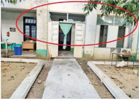
အကြမ်းဖက်အဖျက်သမား သောင်းကျန်းသူအုပ်စုက မန္တလေးတိုင်း ဒေသကြီး မြင်းခြံမြို့ ထွေ/အုပ်ရုံးအား Drop Bomb ချတိုက်ခိုက်မှုကြောင့် ပျက်စီးမှုကို တွေ့ရစဉ်။