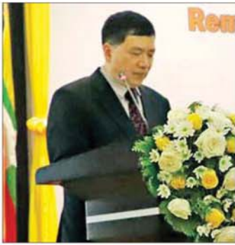
Mr. Deng Xijun ၊ တရုတ်ပြည်သူ့သမ္မတနိုင်ငံ၊ နိုင်ငံခြားရေးဝန်ကြီးဌာန၊ အာရှရေးရာ အထူးကိုယ်စားလှယ်

ကျွန်တော်တို့နိုင်ငံအနေနဲ့ အခုလိုမျိုး လာရောက်လေ့လာဖို့ ဖိတ်ခေါ်တဲ့အတွက် ကျေးဇူး တင်ကြောင်း ပြောကြားလိုပါတယ်။ ကျွန်တော်တို့ အနေနဲ့ အခုလို သုံးရက်အတွင်းမှာ လာရောက်ပြီး မြန်မာနိုင်ငံရဲ့ ရွေးကောက်ပွဲကို ဘယ်လိုမျိုးပြင်ဆင် ဆောင်ရွက်လျက်ရှိတယ်ဆိုတာကို လေ့လာခွင့်ရတဲ့ အတွက်လည်း အထူးပဲဝမ်းသာဂုဏ်ယူမိပါတယ်။