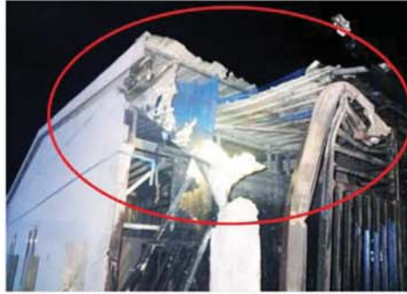
အကြမ်းဖက်အဖျက်သမား သောင်းကျန်းသူအုပ်စုက မန္တလေးတိုင်း ဒေသကြီး မတ္တရာမြို့နယ် နန်းတော်ကျွန်းကျေးရွာအတွင်းနှင့် အောင်မြေသာစံမြို့နယ်အတွင်းတို့သို့ ၁၀၇ မမ ရှော့တိုက်ခွဲများ ပစ်ခတ်တိုက်ခိုက်မှုကြောင့် ပျက်စီးမှုကို တွေ့ရစဉ်။