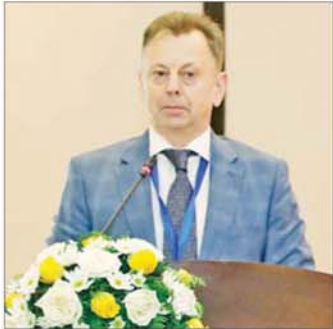
Mr. Igor Borisov (ရုရှားဖက်အရေးရှင်းနိုင်ငံ ဗဟိုရွေးကောက်ပွဲကော်မရှင် အဖွဲ့ဝင်)

ရွေးကောက်ပွဲအပေါ်မှာ ဥပဒေနဲ့ လျော်ညီစွာ ကြိုးပမ်းအားထုတ်မှုတွေဟာ မေ့ပျောက်လို့ ရမယ့် ကိစ္စတွေမဟုတ်ပါဘူး။ တာဝန်ရှိသူတွေအနေနဲ့ ဂရုတစိုက်နဲ့ လုပ်ဆောင်နေတယ်ဆိုတာ ကျွန်တော် ယုံကြည်ပါတယ်။ နိဂုံးချုပ်အနေနဲ့ ရွေးကောက်ပွဲ ကော်မရှင်က ဝန်ထမ်းတွေ ရွေးကောက်ပွဲအပေါ် တကယ်ကို ကြိုးစားအားထုတ်ခဲ့မှုတွေ၊ မြန်မာနိုင်ငံ အကြီးအကဲရဲ့ ရွေးကောက်ပွဲအပေါ် တကယ်ကို စိတ်ဆန္ဒအမှန်နဲ့ ကြိုးပမ်းခဲ့မှု၊ မြန်မာနိုင်ငံကပြည်သူ တွေ ပြင်းပြစွာဆန္ဒရှိမှုကို ဝမ်းသာဂုဏ်ယူကြောင်း ပြောလိုပါတယ်။ ရွေးကောက်ပွဲအပေါ် (၁) ကို အောင်မြင်စွာ ကျင်းပနိုင်ခဲ့မှုအပေါ် များစွာဂုဏ်ယူ ပါကြောင်း ပြောကြားလိုပါတယ်။