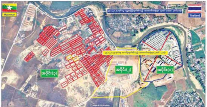
ကရင်ပြည်နယ် မြဝတီမြို့နယ် KK Park အတွင်းရှိ တရားမဝင်အဆောက်အအုံများအား ဖောက်ခွဲဖျက်ဆီးမှု။

နေပြည်တော် ၃၀ ဇူလိုင် ၂၀၂၅ မြန်မာနိုင်ငံအစိုးရအနေဖြင့် အွန်လိုင်းလိမ်လည်လောင်းကစားမှုများ အများဆုံးအခြေချလုပ်ကိုင်လျက်ရှိကြသည့် ရွှေကုက္ကိုလ်နယ်မြေနှင့် KK Park နယ်မြေများရှိ တရားမဝင်အဆောက်အအုံများအတွင်း ဝင်ရောက်ရှင်းလင်းခြင်း၊ အွန်လိုင်းလိမ်လည်လောင်းကစားမှုလုပ်ငန်းစဉ်များတွင် အသုံးပြုခဲ့သည့် သိမ်းဆည်းရမိပစ္စည်းများနှင့် တရားမဝင်အဆောက်အအုံများအား စနစ်တကျဖြိုချဖျက်ဆီးခြင်းများကို လုံခြုံရေးတပ်ဖွဲ့ဝင်များ၊ အုပ်ချုပ်ရေးအဖွဲ့အစည်းများနှင့် ဒေသတွင်းတာဝန်ရှိသူများအပါအဝင် အဖွဲ့စုံပါဝင်သည့် ပူးပေါင်းအဖွဲ့ဖြင့် ဆောင်ရွက်လျက်ရှိရာ အနေအထား KK Park နယ်မြေအတွင်းရှိ တရားမဝင်အဆောက်အအုံ လေးလုံးကို ထပ်မံဖြိုချဖျက်ဆီးခဲ့ကြောင်း သိရသည်။ ယနေ့တွင် မြဝတီ-မဲထွေးလမ်း(KK Park) အပိုင်း(၃)နယ်မြေအတွင်းရှိ အွန်လိုင်းလိမ်လည်လောင်းကစားမှုများ ကျူးလွန်ရာတွင် အသုံးပြုခဲ့သည့် တရားမဝင်လေးထပ်အဆောက်အအုံ တစ်လုံး