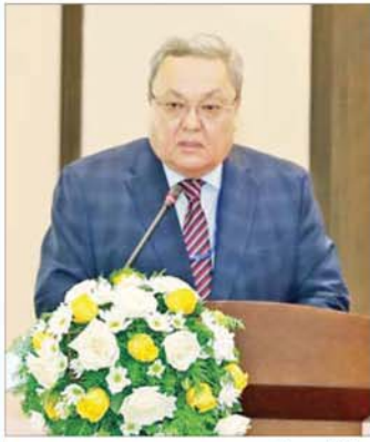
Mr. Yerman Mukhtar (ကစာဇာဇာတန်နိုင်ငံ ရွေးကောက်ပွဲကော်မရှင် ဒုတိယဥက္ကဋ္ဌ)

ကျွန်တော်အနေနဲ့ တက်ရောက်လာတဲ့ ဧည့်ပရိသတ်များအားလုံးကို မင်္ဂလာပါလို့ နှုတ်ခွန်း ဆက်သပါတယ်။ ပထမဆုံး ပြောကြားလိုတာကတော့ ဒီမှာတက်ရောက်လာကြတဲ့ ဧည့်သည်တော်များ အားလုံးဟာ မြန်မာနိုင်ငံနဲ့ ကစာဇာဇာတန်နိုင်ငံ နှစ်နိုင်ငံအကြားမှာ ရင်းနှီးတဲ့ဆက်ဆံရေးဖြစ်တဲ့ သံတမန် ဆက်ဆံရေးတည်ဆောက်ဖို့အတွက် အဓိကကျတဲ့ အခန်းကဏ္ဍကနေ ပါဝင်မှာဖြစ်တဲ့ အကြောင်း ပထမဦးစွာ ပြောကြားလိုပါတယ်။ ကျွန်တော်ကတော့ ကစာဇာဇာတန်နိုင်ငံ ရွေးကောက်ပွဲ ကော်မရှင် ဒုတိယဥက္ကဋ္ဌ ဖြစ်ပါတယ်။ ကျွန်တော်တို့ အဖွဲ့ ဒီကိုလာရတဲ့ အဓိကရည်ရွယ်ချက်ကတော့ မြန်မာနိုင်ငံမှာကင်းပတ်ရွေးကောက်ပွဲမှာလာရောက် ကြည့်ရှုလေ့လာဖို့နဲ့ ကျွန်တော်တို့ နှစ်နိုင်ငံအကြား သံတမန်ဆက်ဆံရေး ရှေ့ဆက်ပြီး ပူးပေါင်း လုပ်ဆောင်ဖို့နဲ့ နှစ်နိုင်ငံကြား ကိစ္စရပ်တွေကို ဆွေးနွေးဖို့အတွက် လာရောက်ရခြင်း ဖြစ်ပါတယ်။ မြန်မာနိုင်ငံရွေးကောက်ပွဲကော်မရှင်ကို ကျွန်တော် တို့လာရောက်လေ့လာတဲ့အခါမှာ လိုက်လံစွာကြည့်ဆို တဲ့အတွက်ရော လေ့လာဖို့အတွက် အကောင်းဆုံး အခြေအနေတစ်ခု ဖန်တီးပေးတာလည်း ကျေးဇူး တင်ကြောင်း ပြောကြားလိုပါတယ်။ ကျွန်တော်တို့ ရောက်လာတဲ့အချိန်ကနေစပြီးတော့ ရန်ကုန်မြို့မှာ ရော နေပြည်တော်မှာရော မြန်မာနိုင်ငံမှာ ပြုလုပ်တဲ့ ရွေးကောက်ပွဲနဲ့ပတ်သက်တဲ့ သက်ဆိုင်ရာ သတင်း အချက်အလက်ပေါင်းများစွာကို ရရှိခဲ့ပါတယ်။ အထူးသဖြင့် မြန်မာနိုင်ငံ ရွေးကောက်ပွဲကော်မရှင် ဥက္ကဋ္ဌကြီးပြောကြားခဲ့တဲ့ မိန့်ခွန်းဟာဆိုရင် မြန်မာ နိုင်ငံ ရွေးကောက်ပွဲကော်မရှင်ရဲ့ လုပ်ဆောင်နေတဲ့ Process တွေအားလုံးနဲ့ ရွေးကောက်ပွဲမှာ အသုံးပြု မယ် နည်းပညာပိုင်းဆိုင်ရာကိစ္စရပ်တွေကို ကျွန်တော်