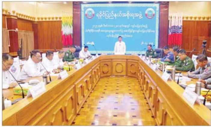
ရခိုင်ပြည်နယ်အစိုးရအဖွဲ့ရုံး အစည်းအဝေးခန်းမ၌ ၂၀၂၅ ခုနှစ် ပါတီစုံဒီမိုကရေစီ အထွေထွေ ရွေးကောက်ပွဲ အောင်မြင်စွာကျင်းပနိုင်ရေး လုပ်ငန်းညှိနှိုင်းအစည်းအဝေးကျင်းပစဉ်။