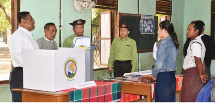
(ခဲပုံ) ဒီပီလင်း

ညောင်ဦး၊ ဒီဇင်ဘာ ၂၆ မန္တလေးတိုင်းဒေသကြီး၊ ညောင်ဦးခရိုင်၊ ညောင်ဦးမြို့နယ်တွင် ၂၀၂၅ ခုနှစ်၊ ဒီဇင်ဘာ ၂၈ ရက်တွင် ကျင်းပပြုလုပ်မည့် ပါတီစုံဒီမိုကရေစီအထွေထွေရွေးကောက်ပွဲကြီး အောင်မြင်စွာ ကျင်းပနိုင်ရေးအခြေခံပညာကျောင်းများ၊ ရပ်ကွက်ကျေးရွာမေ့ရုံများတွင် မဲရုံများ ကြိုတင်ပြင်ဆင်ဆောင်ရွက်ထားရှိမှု အခြေအနေအထား မန္တလေးတိုင်းဒေသကြီး အစိုးရအဖွဲ့ လူမှုရေးရာဝန်ကြီး ဦးအောင်ကျော်မိုးနှင့် တာဝန်ရှိသူများ ယနေ့ မွန်းလွဲ ၁ နာရီက ကွင်းဆင်းစစ်ဆေးခဲ့သည်။ ထိုသို့ ကွင်းဆင်းစစ်ဆေးရာ မန္တလေးတိုင်းဒေသကြီးအစိုးရ အဖွဲ့ လူမှုရေးရာဝန်ကြီး ဦးအောင်ကျော်မိုး၊ ညောင်ဦးခရိုင် စီမံခန့်ခွဲရေးနှင့်အုပ်ချုပ်ရေးကော်မတီ ဥက္ကဋ္ဌ ဦးကျော်မင်းညို၊ ကော်မတီဝင်များနှင့် တာဝန်ရှိသူများသည် ညောင်ဦးမြို့ အမှတ်(၃)ရပ်ကွက်ရှိ မဲရုံများ၊ အမှတ်(၄)ရပ်ကွက်ရှိ မဲရုံများ၊ အမှတ်(၅)ရပ်ကွက်ရှိ မဲရုံများ၊ အမှတ်(၆)ရပ်ကွက်ရှိ မဲရုံများ၊ မြေနဲ့လေးကျေးရွာအုပ်စု၊ မြေနဲ့လေးကျေးရွာရှိ မဲရုံ၊ မြင်းကပါကျေးရွာရှိ အခြေခံပညာအထက်တန်းကျောင်း(ခွဲ) မဲရုံအမှတ်(၃)၊ ကုန်းတန်းကြီး ကျေးရွာအုပ်စု၊ သန်စင်ကြယ်ကျေးရွာ၊ မဲရုံအမှတ်(၃)သို့ ကွင်းဆင်းစစ်ဆေးခဲ့ရာ မဲရုံတာဝန်ရှိသူများက မြန်မာအီလက်ထရောနစ် မဲပေးစက်(ME VM)နှင့် မဲပေးနိုင်ရေးကြိုတင်ပြင်ဆင်ဆောင်ရွက်ထားရှိမှု အခြေအနေများကို လိုက်လံကြည့်ရှုစစ်ဆေးခဲ့ပြီး တိုင်းဒေသကြီးအစိုးရအဖွဲ့ လူမှုရေးရာဝန်ကြီးက လိုအပ်သည်များ ပေါင်းစပ်ညှိနှိုင်းဆောင်ရွက်ပေးခဲ့ကြောင်း သိရသည်။