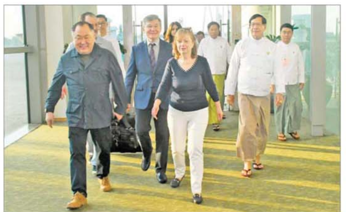
ရုရှားဖက်ဒရေရှင်းနိုင်ငံမှ Deputy Chairman (State Duma)ဖြစ်သူ Mr.Kara-ool Sholban ဦးဆောင်သော အဖွဲ့အား ရန်ကုန်တိုင်းဒေသကြီးဝန်ကြီးချုပ် ဦးစိုးသိန်းနှင့် တာဝန်ရှိသူများက ရန်ကုန် အပြည်ပြည်ဆိုင်ရာ လေဆိပ်တွင် ကြိုဆိုနှုတ်ဆက်ကြစဉ်။

လာကြခြင်းဖြစ်သည်။ အဆိုပါ အဖွဲ့များအား ရန်ကုန် တိုင်းဒေသကြီး ဝန်ကြီးချုပ် ဦးစိုးသိန်းနှင့် တိုင်းဒေသကြီး ဝန်ကြီးများ၊ မြန်မာနိုင်ငံဆိုင်ရာ ရုရှားနိုင်ငံသံရုံးမှ သံအမတ်ကြီး H.E.Mr. Iskander Azizov နှင့် တာဝန်ရှိသူများ၊ ပြည်ထောင်စု ရွေးကောက်ပွဲ ကော်မရှင်အဖွဲ့ဝင် ရန်ကုန်တိုင်းဒေသကြီး တာဝန်ခံ၊ ပြည်ထောင်စု ရွေးကောက်ပွဲ ကော်မရှင်ရုံးနှင့် ရန်ကုန် တိုင်းဒေသကြီး ရွေးကောက်ပွဲ ကော်မရှင်အဖွဲ့ခွဲရုံးတို့မှ တာဝန်ရှိ သူများက ရန်ကုန်အပြည်ပြည် ဆိုင်ရာ လေဆိပ်တွင် ကြိုဆို နှုတ်ဆက်ခဲ့ကြကြောင်း သိရ သည်။ သတင်းစဉ်