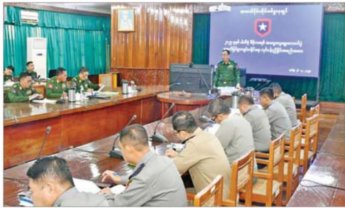
အလယ်ပိုင်းတိုင်းစစ်ဌာနချုပ် အစည်းအဝေးခန်းမ၌ ၂၀၂၅ ခုနှစ် ပါတီစုံဒီမိုကရေစီအထွေထွေ ရွေးကောက်ပွဲ အောင်မြင်စွာကျင်းပနိုင်ရေး လုပ်ငန်းညှိနှိုင်းအစည်းအဝေးကျင်းပစဉ်။