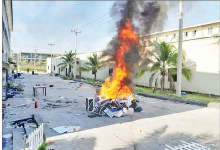
K K Park နယ်မြေအတွင်း အွန်လိုင်းလိမ်လည်လောင်းကစားမှုကျူးလွန်ရာတွင် အသုံးပြုသည့် ပစ္စည်းများအား မီးရှို့ဖျက်ဆီးထားရှိမှုကို တွေ့ရစဉ်။