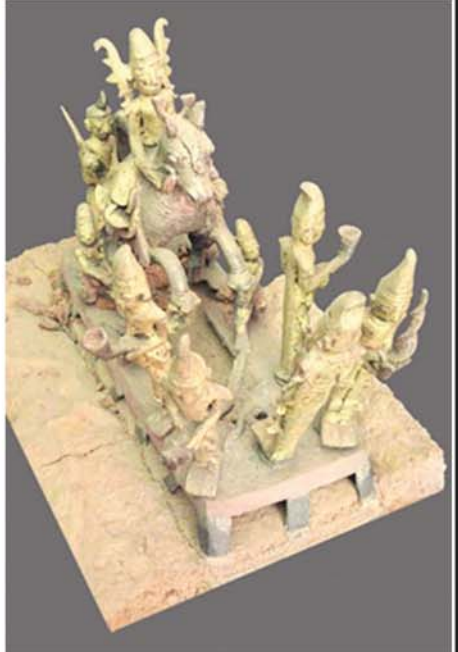
ဘုရားလောင်း တောထွက်ခန်း

အခုဆက်ပြီး အမရပူရမြို့ မှန်တန်းရပ်မှာ တည်ထားကိုးကွယ်တဲ့ ဆုတောင်းပြည့် စေတီတော်ငလျင်ကြီးကြောင့် ပြုပြင်ရာက ထွက်ပေါ်လာတဲ့ ဌာပနာတွေမှာ တောထွက်ခန်း ကြေးသွန်းရုပ်တုတဲ့ ပါရှိလာခဲ့ပါတယ်။ တခြားဘုရားစေတီဌာပနာတွေထဲကလည်း တောထွက်ခန်းရုပ်တုတဲ့ကို တွေ့ရလေ့ရှိပါတယ်။ ကွာခြားမှုက အခြားဘုရားတွေကတွေ့ရတဲ့ တောထွက်ခန်းရုပ်တုတဲ့မှာ အလောင်းတော်မင်းသားလေးရယ် ကဏ္ဍကမြင်းရယ် မြင်းခွာအောက်မှာ လက်နဲ့ခံထားတဲ့ နတ်သားလေးပါးရယ် တစ်ခါတစ်ရံ မာရ်နတ်ရယ် ဒါလောက်ပါပဲ။ အဲဒီမှာ