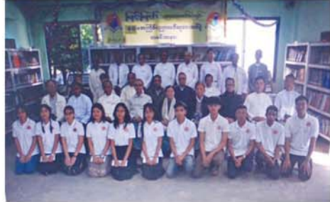
မျက်စိလျှာကြ မျက်ကြည်ရ မြတ်သည့်လှူဒါန။

ရန် အလှူရှင်များ လှူဒါန်းငွေကျပ် ၃၂ သိန်းနှင့် အဝေးအနီး လှူဒါန်းကြသော စာအုပ်မျိုးစုံ ၄၂၄ အုပ်တို့ကို လက်ခံရရှိခဲ့ကြောင်း သိရသည်။ (အောက်ပုံ) စောအောင်