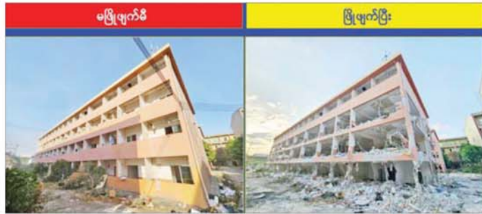
K K Park နယ်မြေ အပိုင်း(၃)တွင် တရားမဝင်ဆောက်လုပ်ထားသည့် လေးထပ်လူနေအဆောက်အအုံ။