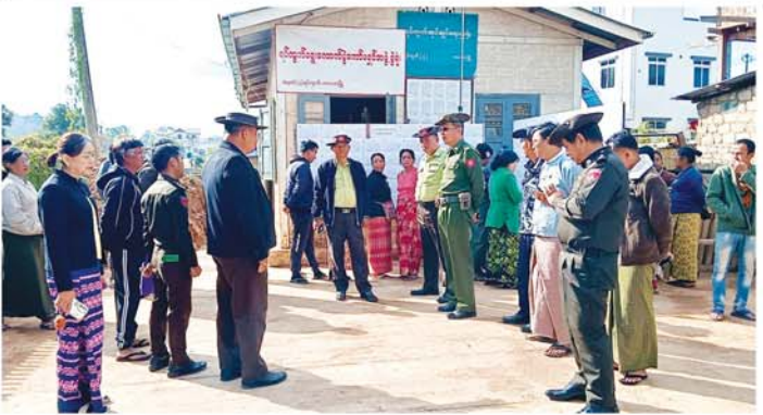
မဲဆန္ဒရှင်စာရင်းကြေညာထားရှိမှုကို တာဝန်ရှိသူများ ကွင်းဆင်းကြည့်ရှု

ကလေး ဒီစင်ဘာ ၂၆ ရှမ်းပြည်နယ်(တောင်ပိုင်း)၊ ကလေးခရိုင်၊ ကလေးမြို့နယ်တွင် ၂၀၂၅ ခုနှစ် ပါတီစုံဒီမိုကရေစီ အထွေထွေရွေးကောက်ပွဲကို မကြာမီကျင်းပတော့မည်ဖြစ်ရာ (တတိယ)အကြိမ် မဲဆန္ဒရှင်စာရင်းများအား ဒီစင်ဘာ ၂၄ ရက်က သက်ဆိုင်ရာမြို့နယ်၊ ရပ်ကွက်နှင့်ကျေးရွာအုပ်စုများတွင် ကြေညာထားရှိမှုကို တာဝန်ရှိသူများက ကွင်းဆင်းကြည့်ရှုခဲ့သည်။