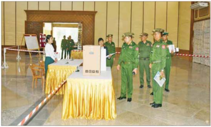
ရန်ကုန်တိုင်းဒေသကြီးတွင် မဲရုံကြိုတင်ပြင်ဆင်ထားရှိမှုကို တာဝန်ရှိသူများ ကြည့်ရှုစစ်ဆေးစဉ်။