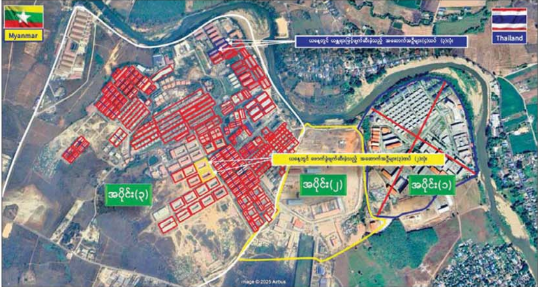
ကရင်ပြည်နယ် မြဝတီမြို့နယ်အတွင်းရှိ K K Park အား ဖောက်ခွဲဖျက်ဆီးမည့် အစီအစဉ် အပိုင်း(၃) (၂၆-၁၂-၂၀၂၅)