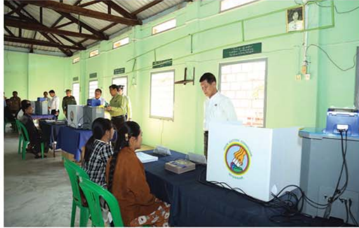
မန္တလေး၊ ဒီဇင်ဘာ ၂၆

၂၀၂၅ခုနှစ် ပါတီစုံဒီမိုကရေစီအထွေထွေရွေးကောက်ပွဲကို ဒီဇင်ဘာ ၂၈ရက်တွင် စတင်ကျင်းပမည်ဖြစ်ရာ မန္တလေးတိုင်းဒေသကြီးအစိုးရအဖွဲ့ ဝန်ကြီးချုပ် ဦးမျိုးအောင်သည် တိုင်းဒေသကြီးအစိုးရအဖွဲ့ဝင်ဝန်ကြီးများ၊ အတွင်းရေးမှူးနှင့် တာဝန်ရှိသူများလိုက်ပါပြီး ယနေ့နံနက်ပိုင်းက ရမည်းသင်းခရိုင်၊ မိတ္ထီလာခရိုင်နှင့် ကျောက်ဆည်ခရိုင်တို့အတွင်း ရွေးကောက်ပွဲဆိုင်ရာလုပ်ငန်းစဉ်များ ဆောင်ရွက်ထားရှိမှုတို့အား လိုက်လံကြည့်ရှုစစ်ဆေးခဲ့သည်။