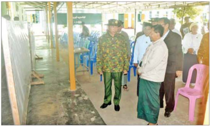
အရှေ့မြောက်တိုင်းစစ်ဌာနချုပ် တိုင်းမှူး မဲရုံကြိုတင်ပြင်ဆင်ထားရှိမှုကို ကြည့်ရှုစစ်ဆေးစဉ်။