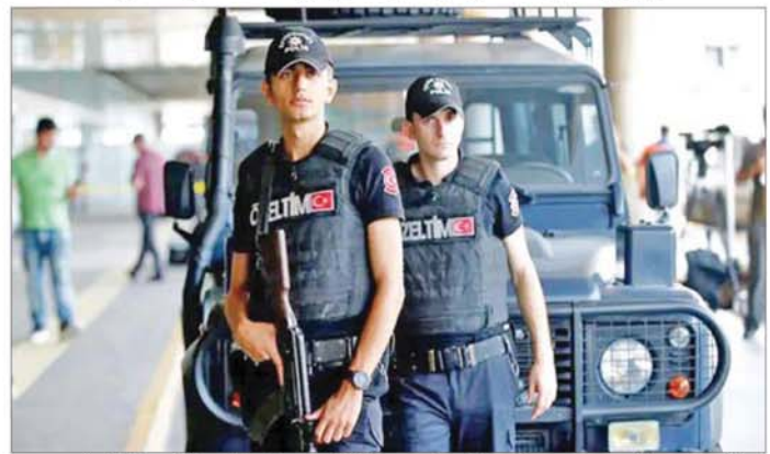
တူကီယိုနိုင်ငံက အိုင်အက်စ်အဖွဲ့အား အကြမ်း သတ်မှတ်ခဲ့သည်။ ကိုးကား - ဆင်ဟွာ ဖက်အဖွဲ့အဖြစ် ၂၀၁၃ ခုနှစ်တွင် တရားဝင် တာဝန်ပြန် - အောင်ကျော်ကျော်

တူကီယိုလိုမြို့ရေး တပ်ဖွဲ့ဝင်များက မာလာတီယာမြို့၌ ၎င်းကို ရှာဖွေဖမ်းဆီးခဲ့ခြင်းဖြစ်သည်။ စစ်ဆင်ရေးအတွင်း ဒစ်ဂျစ်တယ်ပစ္စည်းများနှင့် အခြားသောဆက်စပ်ပစ္စည်းများကို ၎င်း၏အိမ်မှ သိမ်းဆည်းရမိခဲ့ပြီး လက်ရှိတွင် စစ်ဆေးလျက်ရှိသည်။ ခရစ္စမတ်နှင့် နှစ်သစ်ကူး အားလပ်ရက်များတွင် အိုင်အက်စ်အဖွဲ့က အကြမ်းဖက်တိုက်ခိုက်မှုများ လုပ်ဆောင်နိုင်ကြောင်း ထောက်လှမ်းရေးအဖွဲ့က သတိပေးခဲ့ပြီးနောက် နိုင်ငံတစ်ဝန်း၌ အကြမ်းဖက်မှု တန်ပြန်ရေးကြိုးပမ်းမှုများ ဆောင်ရွက်လျက်ရှိစဉ် ယခုကဲ့သို့ ဖမ်းဆီးခဲ့ခြင်း ဖြစ်သည်။ အလားတူ ဒီဇင်ဘာ ၂၅ ရက်တွင် တူကီယို ရဲတပ်ဖွဲ့က အစ္စတန်ဘူလ်မြို့၌ အကြီးစားစစ်ဆင်ရေး တစ်ခုအတွင်း အိုင်အက်စ်အဖွဲ့ဟု သံသယရှိသူ ၁၁ ဦးကို ဖမ်းဆီးခဲ့သည်။