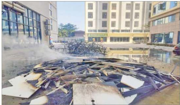
မြဝတီမြို့နယ် ရွှေကုက္ကိုလ်နယ်မြေအတွင်း အွန်လိုင်းလိမ်လည်လောင်းကစားမှုကျူးလွန်ရာတွင် အသုံးပြုသည့် ပစ္စည်းများအား မီးရှို့ဖျက်ဆီးမှုကို တွေ့ရစဉ်။