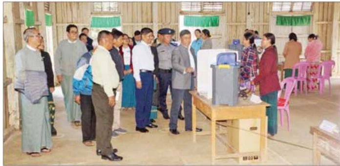
မဲညှိရွေးကောက်ပွဲကို ပွင့်လင်းမြင်သာစွာ ဘက်လိုက်မှုမရှိဘဲ ဥပဒေနှင့်အညီ ဆောင်ရွက်သွား မည်ဖြစ်ကြောင်း ပြောကြားသည်။ ထို့နောက် နိုင်ငံရေးပါတီများမှ ကိုယ်စားလှယ်

တွေ့ဆုံစဉ် ပြည်ထောင်စုရွေးကောက်ပွဲကော်မရှင် အဖွဲ့ဝင်က နိုင်ငံရေးပါတီများ၏ လိုအပ်ချက်များနှင့် ပေါင်းစပ်ညှိနှိုင်းဆောင်ရွက်ပေးရမည့် လုပ်ငန်းစဉ် များကို ပေါင်းစပ်ညှိနှိုင်းဆောင်ရွက်ပေးရန် လာရောက် ရခြင်းဖြစ်ကြောင်း၊ နိုင်ငံရေးပါတီများအနေဖြင့် ရွေးကောက်ပွဲ ဝင်ရောက်ယှဉ်ပြိုင်ရာတွင် တရား မျှတစွာ ယှဉ်ပြိုင်ရန်လိုအပ်ကြောင်း၊ မဲဆွယ်စည်းရုံး ရာတွင် ထုတ်ပြန်ထားသည့် ဥပဒေ၊ နည်းဥပဒေများ နှင့်အညီ ဆောင်ရွက်ရန်လိုအပ်ကြောင်း၊ ယခုကျင်းပ