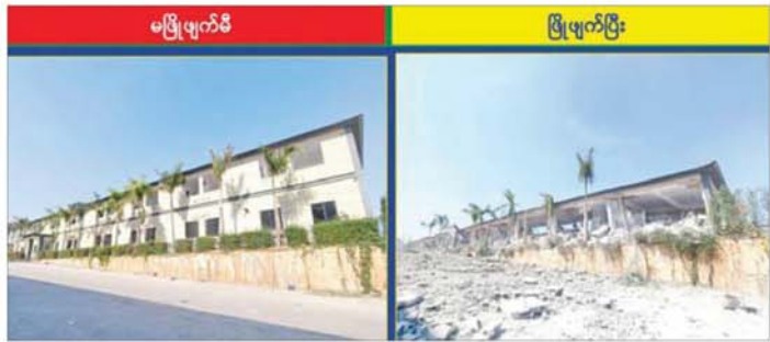
K K Park နယ်မြေ အပိုင်း(၃)တွင် တရားမဝင်ဆောက်လုပ်ထားသည့် သုံးထပ်လူနေအဆောက်အအုံ။