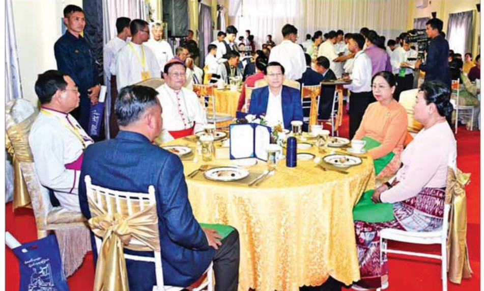
ပြည်ထောင်စုသမ္မတမြန်မာနိုင်ငံတော် ယာယီသမ္မတ နိုင်ငံတော်လုံခြုံရေးနှင့် အေးချမ်းသာယာရေးကော်မရှင်ဥက္ကဋ္ဌ ဗိုလ်ချုပ်မှူးကြီးမင်းအောင်လှိုင်နှင့်ဇနီး ဒေါ်ကြူကြူလှနှင့် အဖွဲ့ဝင်များ တက်ရောက်လာကြသည့် ဆည်ပရိသတ်များ မြန်မာနိုင်ငံ ခရစ်ယာန်အသင်းတော်ပေါင်းစုံအဖွဲ့ချုပ်ကြီးများက တည်ခင်းမည့်ခံသည့် မိတ်သဟာယ မိတ်ဆုံစားပွဲကို အတူတကွသုံးဆောင်ကြစဉ်။

သမ္မတ နိုင်ငံတော်လုံခြုံရေးနှင့် အေးချမ်းသာယာရေး ကော်မရှင်ဥက္ကဋ္ဌက ခရစ္စမတ် နှုတ်ခွန်းဆက်စကားပြောကြားရာတွင် ရာသီသဘာဝနှင့် အခါသမယတို့ပေါင်းစုံချိန်တွင် ယခုကဲ့သို့ကျရောက်လာသည့် ခရစ္စမတ်ပွဲတော်နှင့်အတူ ခရစ်ယာန်ဘာသာဝင်များ၊ နိုင်ငံသူ နိုင်ငံသားများနှင့် ကမ္ဘာသူ ကမ္ဘာသားအားလုံးဘာသာတရား၏ မေတ္တာအိုင်အောက်တွင် ချစ်ခြင်းမေတ္တာများနှင့် ငြိမ်းချမ်းသာယာခြင်း ရှိကြပါစေရန် ဆုမွန်ကောင်းဖြင့် ဆုတောင်းမေတ္တာပို့သအပ်ပါကြောင်း၊ ခရစ္စမတ်ပွဲတော်သည် လူသားများကြားတွင် ချစ်ခြင်းမေတ္တာတရားများကို လွှမ်းမိုးစေသည့်အပြင် ခရစ်ယာန်ဘာသာဝင်များ၏ မွန်မြတ်သည့် အနှစ်သာရတစ်ခုကို ထင်ဟပ်ပြသခြင်းလည်းဖြစ်သည်ကို ပြောကြားလိုကြောင်း။ ယနေ့ လူသားအားလုံး ခိုလှုံရာ ကမ္ဘာကြီးတွင် ကိုးကွယ်မှုဘာသာများစွာရှိပြီး ဗုဒ္ဓဘာသာ၊ ခရစ်ယာန်ဘာသာ၊ ဟိန္ဒူဘာသာ၊ အစ္စလာမ်ဘာသာဆိုသည့် အဓိကဘာသာကြီး လေးမျိုးအဖြစ် သတ်မှတ်ထားသည်ကို အားလုံးသိရှိကြပြီးဖြစ်ကြောင်း၊ ဘာသာတရားဆိုသည်မှာ အဆုံးအမတစ်ခုဖြစ်ပြီး ချစ်ခြင်းမေတ္တာ၊ ကရုဏာတရားနှင့် ကိုယ်ချင်းစာတရားများကို အခြေခံစည်းမျဉ်းများသဖွယ်