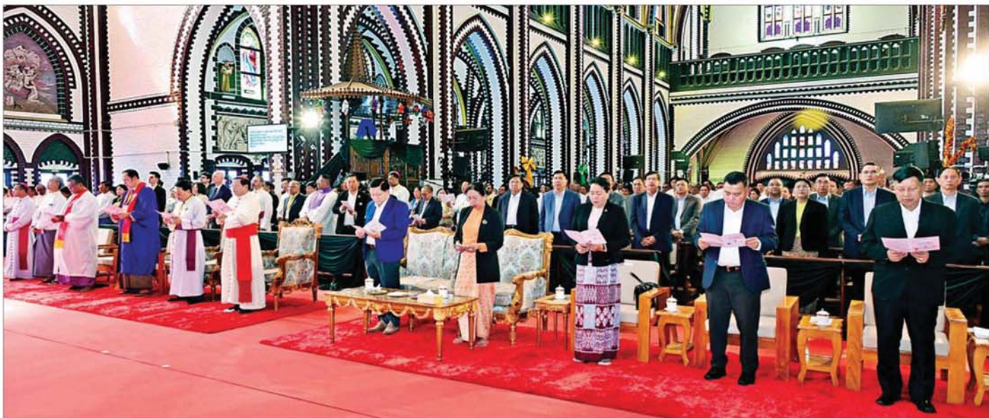
ပြည်ထောင်စုသမ္မတမြန်မာနိုင်ငံတော် ယာယီသမ္မတ နိုင်ငံတော်လုံခြုံရေးနှင့် အေးချမ်းသာယာရေးကော်မရှင်ဥက္ကဋ္ဌ ဗိုလ်ချုပ်မှူးကြီးမင်းအောင်လှိုင်နှင့် ဇနီး ဒေါ်ကြူကြူလှနှင့် အခမ်းအနားတက်ရောက်လာကြသူများ ဓမ္မတေးသီချင်းကျူးစေချင်း "ဆိုသာယာသော မြန်မာပြည်တော်ကျူး" ဓမ္မသီချင်းအား စုပေါင်းသီဆိုကြစဉ်။