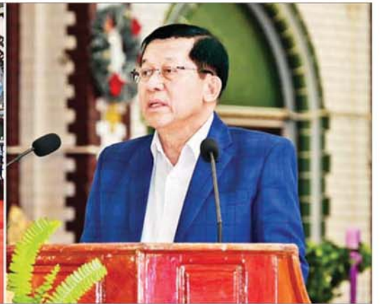
ပြည်ထောင်စုသမ္မတမြန်မာနိုင်ငံတော် ယာယီသမ္မတ နိုင်ငံတော်လုံခြုံရေးနှင့် အေးချမ်းသာယာရေးကော်မရှင်ဥက္ကဋ္ဌ ဗိုလ်ချုပ်မှူးကြီးမင်းအောင်လှိုင် ခရစ္စမတ်နှုတ်ခွန်းဆက်စကားပြောကြားစဉ်။