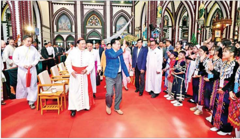
ပြည်ထောင်စုသမ္မတမြန်မာနိုင်ငံတော် ယာယီသမ္မတ နိုင်ငံတော်လုံခြုံရေးနှင့် အေးချမ်းသာယာရေးကော်မရှင်ဥက္ကဋ္ဌ ဗိုလ်ချုပ်မှူးကြီး မင်းအောင်လှိုင်နှင့် ဇနီး ဒေါ်ကြူကြူလူတို့ အခမ်းအနားတက်ရောက်လာကြသူများအား ရင်းရင်းနှီးနှီးနှုတ်ဆက်စဉ်။

ငြိမ်းချမ်းစွာ လျှောက်လှမ်းသွားနိုင်ရေး ကြိုးပမ်းဆောင်ရွက်သွားကြရန် တိုက်တွန်းလိုကြောင်း။ ယနေ့ကဲ့သို့ အခါသမယကောင်းဖြစ်သည့် ခရစ္စမတ်ကျေးဇူးတော်ချီးမွမ်းခြင်း အခမ်းအနားတွင် ဦးဆောင်ကျင်းပပေးကြသည့် ခရစ်ယာန်ဘာသာဝင် ဆရာတော်ကြီးများနှင့် ဘာသာဝင်များ၊ တက်ရောက်လာကြသည့် ဧည့်သည်တော်များ၊ နိုင်ငံသူနိုင်ငံသားများ၊ ကမ္ဘာတစ်ဝန်းတွင် နေထိုင်ကြသည့် ခရစ်ယာန်ဘာသာဝင်များအားလုံး မွေးနေ့တော်မှစ၍ ငြိမ်းချမ်းခြင်း အနှစ်သာရများကို ကိုယ်စီပိုင်ဆိုင်နိုင်ပြီး