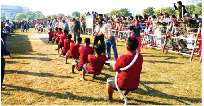
မန္တလေး၊ ဒီဇင်ဘာ ၂၃

မန္တလေးမြို့တော်စည်ပင်သာယာရေးကော်မတီ (၃၃)နှစ်မြောက် နှစ်ပတ်လည်နေ့အထိမ်းအမှတ် ပန်းဥယျာဉ်နှင့်ကစားကွင်းများဌာနမှ ကြီးမှူးကျင်းပသည့် လွန်ဆွဲပြိုင်ပွဲ(အမျိုးသား၊ အမျိုးသမီး) တတိယနေရာလုပွဲနှင့် ဗိုလ်လုပွဲများ ယှဉ်ပြိုင်ခြင်းနှင့် ဆုချီးမြှင့်ပွဲအခမ်းအနားကို ယနေ့နံနက်ပိုင်းက မန္တလေး၊ ချမ်းမြသာစည်မြို့နယ်၊ အားကစားနှင့်ကာယပညာသိပ္ပံ(မန္တလေး)လေ့ကျင့်ရေးကွင်းမြက်ခင်းပြင် ၌ ကျင်းပရာ မန္တလေးမြို့တော်စည်ပင်သာယာရေးကော်မတီဥက္ကဋ္ဌ မြို့တော်ဝန် ဦးကျော်ဆန်း တက်ရောက်ကြည့်ရှုအေးပေးသည်။