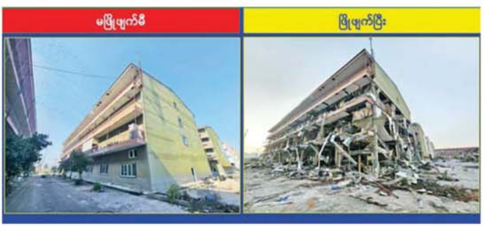
KK Park နယ်မြေ အပိုင်း(၃)တွင် တရားမဝင် ဆောက်လုပ်ထားသည့် (၄)ထပ်လူနေ အဆောက်အအုံ။

အတွင်း လုံးဝအခြေမပြုနိုင်ရေး အိမ်နီးချင်းနိုင်ငံ အစိုးရများနှင့်လည်း ဆောင်ရွက်သွားမည်ဖြစ်ကြောင်း ပြည်တွင်းအင်အားစုများအပြင် ပေါင်းစပ်ညှိနှိုင်း၍ ဆက်လက် သိရသည်။ သတင်းစဉ်