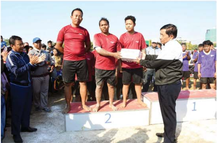
(မန္တလေးနေ့စဉ်)

ကစားကွင်းများဌာနအသင်းနှင့် (အမျိုးသား)လွန်ဆွဲပြိုင်ပွဲတွင် ပထမဆုရရှိသော စက်ရုံနှင့်မော်တော် ယာဉ်ဌာန(က)အသင်းတို့အား ဂုဏ်ပြုဆုများ ချီးမြှင့်ပေးအပ်ပြီးနောက် ဆုရပြိုင်ပွဲဝင်အသင်းများနှင့် အတူ အမှတ်တရစုပေါင်းမှတ်တမ်းတင်ဓာတ်ပုံရိုက်ခဲ့ကြောင်း သိရသည်။