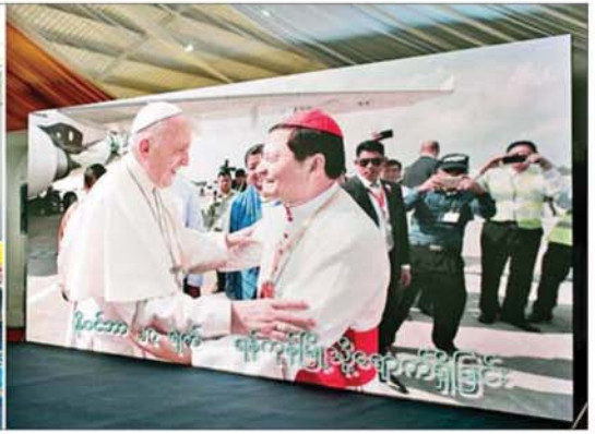
ပြည်ထောင်စုသမ္မတမြန်မာနိုင်ငံတော် ယာယီသမ္မတ နိုင်ငံတော်လုံခြုံရေးနှင့် အေးချမ်းသာယာရေးကော်မရှင်ဥက္ကဋ္ဌ ဗိုလ်ချုပ်မှူးကြီးမင်းအောင်လှိုင်၊ ဇနီးဒေါ်ကြူကြူလှနှင့်အဖွဲ့ဝင်များ မှတ်တမ်းဗီဒီယိုအား ကြည့်ရှုကြစဉ်။

❖ စာမျက်နှာ ၃ မှ မြန်မာနိုင်ငံ ဧဝဂေလီ ခရစ်ယာန် မဟာမိတ်အဖွဲ့ချုပ်မှ ဆရာတော်ကြီးများ၊ မြန်မာနိုင်ငံ ခရစ်တော်သာသနာပြန့်ပွားမှု ပူးပေါင်းဆောင်ရွက်ရေးအဖွဲ့ချုပ်မှ ဆရာတော်ကြီးများ၊ ဘာသာပေါင်းစုံ ချစ်ကြည်ရေးအဖွဲ့မှ တာဝန်ရှိသူများက ကြိုဆိုနှုတ်ဆက်ကြသည်။ ထို့နောက် အခမ်းအနားကို စတင်ကျင်းပပြုလုပ်ရာ ခရစ်တော်ကို မျှော်လင့်သော သတ္တမနေ့အသင်းတော်မြန်မာနိုင်ငံသာသနာအဖွဲ့ချုပ် သိက္ခာတော်ရ ဆရာဦးဖိုးလှက အဖွင့်ဆုတောင်းစကားပြောကြားသည်။ ယင်းနောက် နိုင်ငံတော် ယာယီသမ္မတ နိုင်ငံတော်လုံခြုံရေးနှင့် အေးချမ်းသာယာရေး ကော်မရှင်ဥက္ကဋ္ဌနှင့် ဇနီးနှင့် အခမ်းအနားတက်ရောက်လာကြသူများသည် မွေတေးသီချင်း ကျူးချွင်း "ဆိုသာယာသောမြန်မာပြည်တော်ကျူး" မွေသီချင်းအား စုပေါင်းသီဆိုကြသည်။ ဆက်လက်၍ မြန်မာနိုင်ငံ ခရစ်ယာန် အသင်းတော်များကောင်စီဥက္ကဋ္ဌ သာသနာပိုင်ချုပ်ကြီး စတီဗင် သန်းမြင့်ဦးက ကြိုဆိုနှုတ်ဆက်စကားပြောကြားပြီး တေးသံရှင် ပန်းရောင်ခြယ်က ဂုဏ်တော်ချီးမွမ်းခြင်း သီချင်းအား သီဆိုသည်။ ထို့နောက် နိုင်ငံတော် ယာယီ