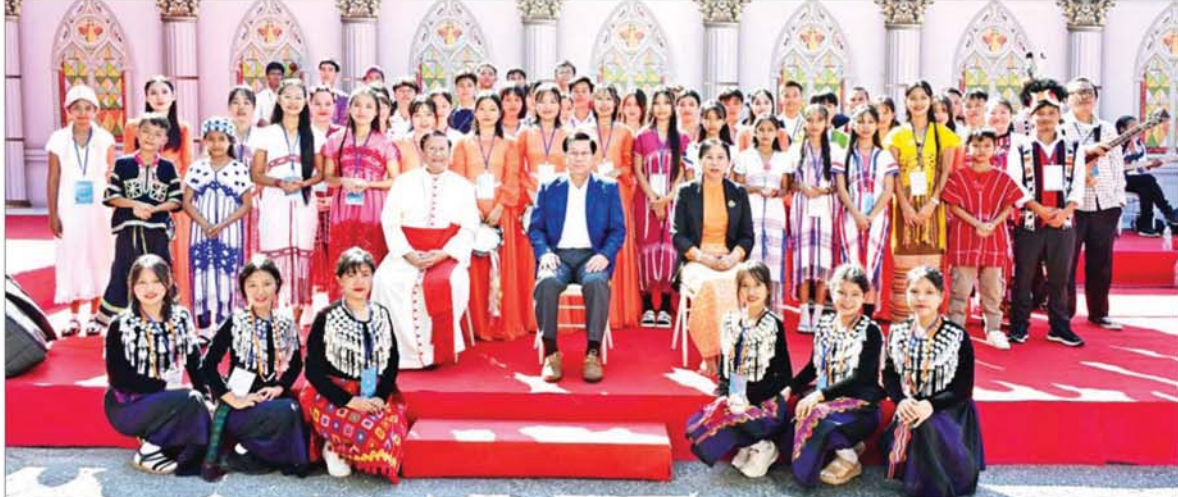
ပြည်ထောင်စုသမ္မတမြန်မာနိုင်ငံတော် ယာယီသမ္မတ နိုင်ငံတော်လုံခြုံရေးနှင့် အေးချမ်းသာယာရေးကော်မရှင်ဥက္ကဋ္ဌ ဗိုလ်ချုပ်မှူးကြီးမင်းအောင်လှိုင်နှင့် ဇနီးဒေါ်ကြူကြူလှနှင့် ကက်သလစ်ဂိုဏ်းချုပ်သာသနာ့ ဂိုဏ်းချုပ်ဆရာတော်ကြီး ကာဒီနယ်ချားလစ်ဘိုတို့ သီဆိုတီးမှုတ် ကပြဖျော်ဖြေခဲ့ကြသည့် ခရစ်ယာန်လူငယ်များနှင့်အတူ မှတ်တမ်းတင်ဓာတ်ပုံရိုက်ကြစဉ်။

ဥက္ကဋ္ဌနှင့်ဇနီး၊ အဖွဲ့ဝင်များသည် စိန်မေရီကာသီပြယ် ကက်သလစ်ဘုရားကျောင်းတော်ကြီးအတွင်းရှိ ပုပ်ရဟန်းမင်းကြီး ဖရန်စစ်မြန်မာနိုင်ငံသို့ လာရောက်စဉ် အသုံးပြုခဲ့သည့် လှည့်လည်ယာဉ်များကို ကြည့်ရှုပြီး ပုပ်ရဟန်းမင်းကြီးဖရန်စစ် ၂၀၁၇ ခုနှစ် နိုဝင်ဘာလအတွင်း မြန်မာနိုင်ငံသို့ လာရောက်စဉ် ဆောင်ရွက်ခဲ့မှု မှတ်တမ်းဗီဒီယိုနှင့် နိုင်ငံတော်ယာယီသမ္မတ နိုင်ငံတော်လုံခြုံရေးနှင့် အေးချမ်းသာယာရေး ကော်မရှင်