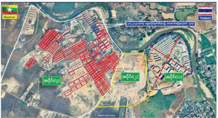
ကရင်ပြည်နယ် မြဝတီမြို့နယ်အတွင်းရှိ KK Park နယ်မြေ အပိုင်း(၃)အား ဖောက်ခွဲဖျက်ဆီးခဲ့မှု။

အတွက် လုံခြုံရေးတပ်ဖွဲ့ဝင်များ၊ အုပ်ချုပ်ရေး အဖွဲ့အစည်းများနှင့် ဒေသတွင်း တာဝန်ရှိသူများ အပါ အဝင် အဖွဲ့စုံပါဝင်သည့် ပူးပေါင်း အဖွဲ့ဖြင့် ဒီဇင်ဘာ ၈ ရက်မှ စတင်၍ ရှာဖွေရှင်းလင်းခြင်းများ ဆောင်ရွက်ခဲ့ရာ ယနေ့အထိ ရှာဖွေ စစ်ဆေးပြီးစီးသည့် အဆောက်အအုံ ၄၆၄ လုံးအနက် အွန်လိုင်း လိမ်လည်လောင်း ကစားမှုများ ကျူးလွန်ရာတွင် အသုံးပြုခဲ့သည့် အဆောက်အအုံ ၁၂၃ လုံးကို စစ်ဆေးဖော်ထုတ်နိုင်ခဲ့ ပြီး အဆိုပါ အဆောက်အအုံများ အား ပြန်လည်အသုံးပြုမှု မရှိစေ ရေးအတွက် ချိပ်ပိတ်သိမ်းဆည်း ခြင်းများ ဆောင်ရွက်ခဲ့သည်။ ယင်းအပြင် KK park နှင့် ရွှေကုက္ကိုလီနယ်မြေရှိ အွန်လိုင်း လိမ်လည် လောင်းကစားမှု ကျူးလွန်ရာတွင် အသုံးပြုခဲ့သည့် ပစ္စည်းများအား ထပ်မံအသုံးပြုမှု မရှိစေရေးအတွက် ယနေ့တွင် လည်း စနစ်တကျ မီးရှို့ဖျက်ဆီးခဲ့ ကြောင်းနှင့် နိုင်ငံတော်အစိုးရ အနေဖြင့် အွန်လိုင်းလိမ်လည် လောင်းကစားမှုကျူးလွန်မှုများကို အမျိုးသားရေး တာဝန်တစ်ရပ် အဖြစ်သို့ယူကာ မြန်မာနိုင်ငံ