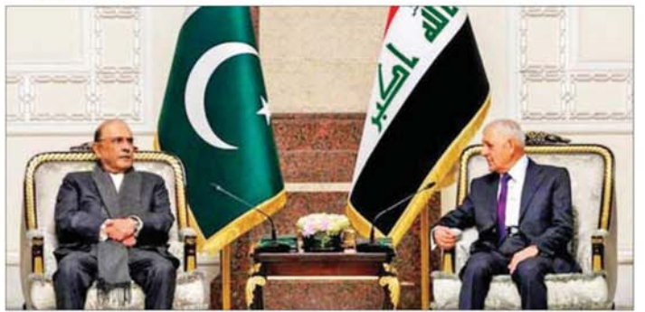
ပါကစ္စတန်သမ္မတ အဓိဗ်အလီဇာဒီရီသည် ဘဂ္ဂဒက်မြို့သို့ ဒီဇင်ဘာ ၂၀ ရက်တွင် ရောက်ရှိခဲ့သည်။ တရားဝင်အလည်အပတ်ခရီးအဖြစ် အီရတ်နိုင်ငံ ကိုးကား - ဆင်ပွား၊ ဘာသာပြန် - စိုးသူရ

ကာကွယ်ရေးဆိုင်ရာ ပူးပေါင်းဆောင်ရွက်ရေး နယ်ပယ်ကို မြှင့်တင်မည်ဖြစ်ကြောင်း သိရသည်။ မိမိတို့နှစ်နိုင်ငံကြား သမိုင်းတွင်သည့် ဆက်ဆံရေး တည်ရှိခဲ့ခြင်းကို ဂုဏ်ပြုကြောင်းနှင့် နှစ်နိုင်ငံ ပြည်သူများ၏ အကျိုးစီးပွားအတွက် အီရတ်နှင့် ပူးပေါင်းဆောင်ရွက်ခြင်းကိုမြှင့်တင်မည်ဟု ပါကစ္စတန်သမ္မတ အဓိဗ်အလီဇာဒီရီက ပြောသည်။