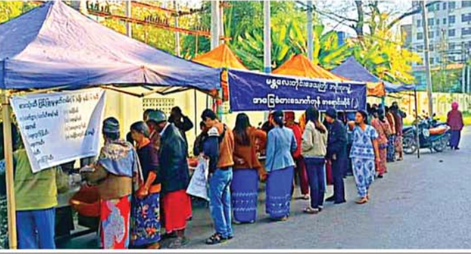
(မန္တလေးနေ့စဉ်-၆)

မန္တလေး ဒီဇင်ဘာ ၂၂ ပေါင်း၍ ဆန်၊ ဆီ၊ ကြက်ဥ၊ ဘဲဥ၊ ငါးများကို အထူးသက်သာသော ဈေးနှုန်းဖြင့် ရုံးဖွင့်ရက်များတွင် မြို့နယ်အလိုက် ရောင်းချပေးလျက်ရှိရာ ယနေ့ နံနက်ပိုင်းက အောင်မြေသာစံမြို့နယ်၊ မြန်မာ့စီးပွားရေးဘဏ်(၂)ရွာ၊ ၅၂ လမ်းနှင့် ၂၄ လမ်းထောင့်နှင့် ချမ်းအေးသာစံမြို့နယ်၊ ဟေမာဇလရပ်ကွက်၊ ၂၇ လမ်း၊ ၇၇ လမ်းနှင့် ၇၈ လမ်းကြားတို့တွင် ရောင်းချပေးခဲ့သည်။ (အောက်ပုံ) သက်သာဈေးရောင်းချမည့် အစီအစဉ်များကို ဒီဇင်ဘာ ၂၃ ရက်တွင် အောင်မြေသာစံမြို့နယ်၊ ညောင်ကွဲရပ်ကွက်၊ ၈၉ လမ်း၊ ၁၀ လမ်းနှင့် ၁၁ လမ်းကြား၊ ရှင်အရဟံသိမ်ရှေ့နှင့် ချမ်းမြသာစည်မြို့နယ်၊ မြို့သစ်(၄)ရပ်ကွက်၊ ၁၁၁ လမ်းနှင့် ၆၄ လမ်းထောင့်၊ ဓမ္မာရုံရွေ့တို့တွင်လည်းကောင်း၊ ဒီဇင်ဘာ ၂၄ ရက်တွင် အောင်မြေသာစံမြို့နယ်၊ အောင်မြေသာစံရပ်ကွက်၊ ၁၉ လမ်း၊ ၈၆ လမ်းနှင့် ၈၇ လမ်းကြားနှင့် ပြည်ကြီးတံခွန်မြို့နယ်၊ (ဃ)ရပ်ကွက်၊ ၁၁၇ လမ်း၊ ၅၉ လမ်းနှင့် ၆၀ လမ်းကြားတို့တွင်လည်းကောင်း၊ ဒီဇင်ဘာ ၂၅ ရက်တွင် ခရစ္စမတ်နေ့ရုံးပိတ်ရက်ဖြစ်သဖြင့် သက်သာဈေးရောင်းချမှုကို ရပ်နားထားပြီး ဒီဇင်ဘာ ၂၆ ရက်တွင် ချမ်းအေးသာစံမြို့နယ်၊ ရွှေလှုံရပ်ကွက်၊ ၂၇ လမ်း၊ ၇၁ လမ်းနှင့် ၇၂ လမ်းကြားတို့တွင် ရောင်းချပေးသွားမည်ဖြစ်သည်။