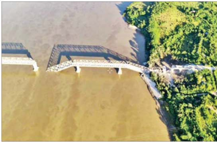
PDF အမည်ခံအကြမ်းဖက်သောင်းကျန်းသူ ပူးပေါင်းအဖွဲ့များ မိုင်းထောင်ဖောက်ခွဲမှုကြောင့် ပျက်စီးခဲ့သည့် ဧရာဝတီတံတား(ရတနာသီခံ)၏ မှတ်တမ်းဓာတ်ပုံ။