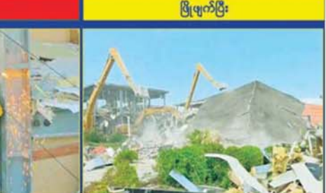
KK Park နယ်မြေ အပိုင်း(၃)တွင် တရားမဝင်ဆောက်လုပ်ထားသည့် နှစ်ထပ်လူနေအဆောက်အအုံအား မဖြိုဖျက်မီနှင့် ဖြိုဖျက်ပြီးနောက် တွေ့ရစဉ်။

အအုံ ၁၂ လုံးကို စစ်ဆေးဖော်ထုတ်နိုင်ခဲ့ပြီး အဆိုပါ အဆောက်အအုံများအား ပြန်လည်အသုံးပြုမှု မရှိစေရေးအတွက် ချိပ်ပိတ်သိမ်းဆည်းခြင်းများ ဆောင်ရွက်လျက်ရှိရာ ယနေ့တွင် အဆိုပါ တရားမဝင် အဆောက်အအုံအားလုံးကို ချိပ်ပိတ်သိမ်းဆည်းခဲ့ပြီးဖြစ်ကြောင်း သိရသည်။