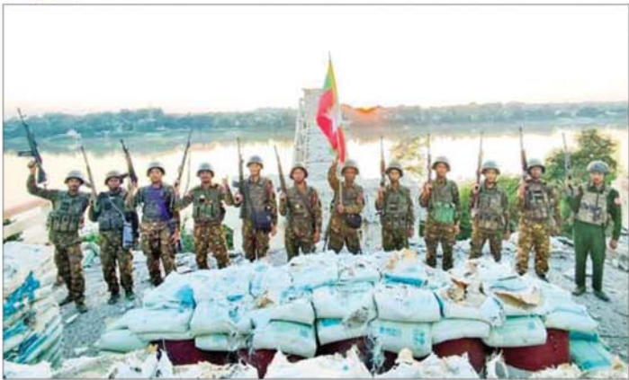
PDF အမည်ခံအကြမ်းဖက်သောင်းကျန်းသူ ပူးပေါင်းအဖွဲ့များ ယာယီစိုးမိုးပြီး မိုင်းထောင်ဖောက်ခွဲဖျက်ဆီးခဲ့သည့် ဧရာဝတီတံတား(ရတနာသီခံ)အား တပ်မတော်စစ်ကြောင်းများက ပြန်လည်သိမ်းပိုက်ရရှိမှု မှတ်တမ်းဓာတ်ပုံ။