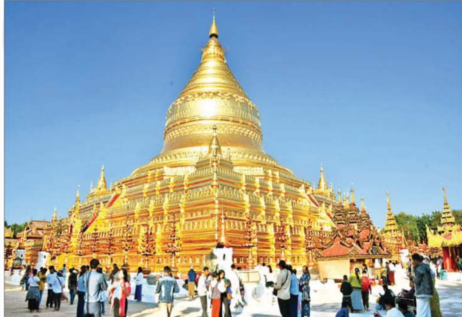
ရွှေစည်းခုံစေတီတော်မြတ်ကြီးသို့ လာရောက်ကြည့်ရှုသူများစုဝေးနေပုံ