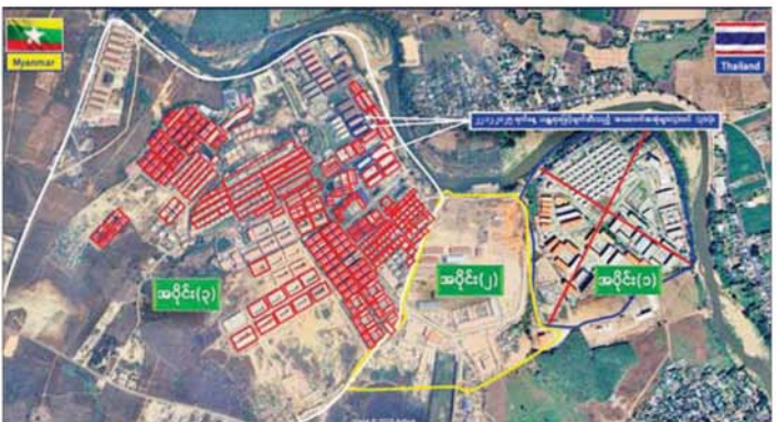
ကရင်ပြည်နယ် မြဝတီမြို့နယ်အတွင်းရှိ KK Park အပိုင်း (၃) နယ်မြေအတွင်းရှိ တရားမဝင်အဆောက်အအုံများအား ဖျက်ဆီးထားရှိမှုကို တွေ့ရစဉ်။

အထိ နှစ်ထပ်အဆောက်အအုံ ၃၆ လုံးကို ရာခိုင်နှုန်းပြည့်ဖျက်ဆီးပြီးဖြစ်ကြောင်း သိရသည်။ ထို့ပြင် ကရင်ပြည်နယ် မြဝတီမြို့နှင့် ပတ်ဝန်းကျင်ဒေသတစ်ဝိုက်ရှိ အဆောက်အအုံများ၌ တရားမဝင်ပြည်ပနိုင်ငံသားများ ဝင်ရောက်နေထိုင်ခြင်းနှင့် အွန်လိုင်းလိမ်လည်လောင်းကစားမှုများ လုံခြုံရေးတပ်ဖွဲ့ဝင်များ၊ အုပ်ချုပ်ရေးအဖွဲ့အစည်းများနှင့် ဒေသတွင်း တာဝန်ရှိသူများအပါအဝင် အဖွဲ့စုံပေါင်းအဖွဲ့ဖြင့် ဒီဇင်ဘာ ၈ ရက်မှ စတင်၍ ရာဇဝေရှင်းလင်းခြင်းများ ဆောင်ရွက်ခဲ့ရာ ယနေ့တွင်လည်း အဆောက်အအုံ ၁၉ လုံးကို ထပ်မံရှာဖွေစစ်ဆေးနိုင်ခဲ့ကြောင်း၊ ထိုသို့ရှာဖွေစစ်ဆေးပြီးစီးသည့်အဆောက်အအုံ ၄၆၄ လုံးအနက် အွန်လိုင်းလိမ်လည်လောင်းကစားမှုများ ကျူးလွန်ရာတွင် အသုံးပြုခဲ့သည့် အဆောက်