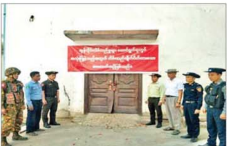
မြဝတီမြို့အတွင်း အွန်လိုင်းလိမ်လည်မှု လုပ်ငန်းတွင် အသုံးပြုခဲ့သော အဆောက်အအုံများ ချိပ်ပိတ်သိမ်းဆည်းမှုကို တွေ့ရစဉ်။