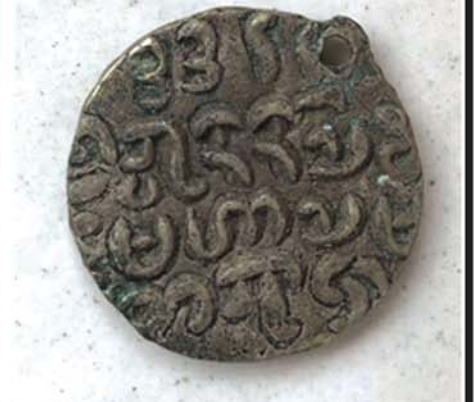
ရခိုင်ငွေဒင်္ဂါး၏ မျက်နှာပတ်

အဲဒီအချိန် မြန်မာတို့ရဲ့ အမရပူရ နေပြည်တော်မှာ ဘိုးတော် ဗဒုံမင်းနန်းစံနေချိန်ပေါ့။ နောက်ပြီး ဘိုးတော်ဟာ တတိယမြန်မာ နိုင်ငံကြီးကို စည်းရုံးတည်ထောင်တဲ့ အလောင်းဘုရားရဲ့ စတုတ္ထ သားတော်ပီပီ စစ်သွေးစစ်မာန် တက်ကြွနေသူလည်း ဖြစ်ပါတယ်။