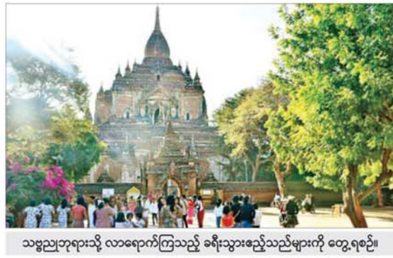
သဗ္ဗညုဘုရားသို့ လာရောက်ကြသည့် ခရီးသွားစည်သည်များကို တွေ့ရစဉ်။