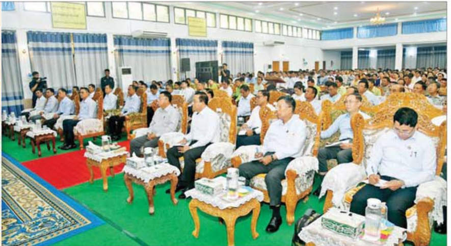
ပြည်ထောင်စုသမ္မတမြန်မာနိုင်ငံတော်ယာယီသမ္မတ နိုင်ငံတော်လုံခြုံရေးနှင့် အေးချမ်းသာယာရေးကော်မရှင်ဥက္ကဋ္ဌ ဗိုလ်ချုပ်မှူးကြီး မင်းအောင်လှိုင် ပြည်ခရိုင်အတွင်းရှိ ဌာနဆိုင်ရာတာဝန်ရှိသူများ၊ မြို့မိမြို့ဖများ၊ အသေးစား၊ အငယ်စားနှင့် အလတ်စား (MSME) စီးပွားရေးလုပ်ငန်းရှင်များနှင့်တွေ့ဆုံ၍ ဒေသဖွံ့ဖြိုးတိုးတက်ရေးဆိုင်ရာများ ဆွေးနွေးပြောကြားစဉ်။

ရှေ့မှ ဒေသဆိုင်ရာအချက်အလက်များနှင့် ဒေသဖွံ့ဖြိုးတိုးတက်ရေးအတွက် လိုအပ်ချက်များအား အသီးသီးတင်ပြ ဦးစွာ ပြည်ခရိုင်အုပ်ချုပ်ရေးမှူးက ဒေသဆိုင်ရာအချက်အလက်များ၊ နိုင်ငံတော်အကြီးအကဲ၏ လမ်းညွှန်မှာကြားချက်များအပေါ် လိုက်နာဆောင်ရွက်ပြီးစီးမှု၊ ခရိုင်အတွင်း ဖွံ့ဖြိုးတိုးတက်ရေးဆောင်ရွက်လျက်ရှိမှု၊ ပြည်မြို့သာယာလှပရေးဆောင်ရွက်ထားရှိမှု၊ ခရိုင်အတွင်း အသေးစား၊ အငယ်စားနှင့် အလတ်စား (MSME) စီးပွားရေးလုပ်ငန်းများ ဖွံ့ဖြိုးတိုးတက်ရေးဆောင်ရွက်လျက်ရှိမှု၊ စိုက်ပျိုးမွေးမြူရေးလုပ်ငန်းများ ဆောင်ရွက်လျက်ရှိမှုနှင့် စိုက်ပျိုးသီးနှံများ ပန်းတိုင်အထွက်နှုန်းရရှိရေး ကြိုးပမ်းဆောင်ရွက်လျက်ရှိမှု၊ မွေးမြူရေးလုပ်ငန်းများ အောင်မြင်မှုရှိစေရေး စုန်အလိုက်သတ်မှတ်၍ မွေးမြူဆောင်ရွက်လျက်ရှိမှု၊ အသေးစား၊ အငယ်စားနှင့် အလတ်စား (MSME) စီးပွားရေးလုပ်ငန်းများ ဆောင်ရွက်လျက်ရှိမှုနှင့် ထုတ်ကုန်များ ထုတ်လုပ်ဖြန့်ဖြူးရောင်းချပေးလျက်ရှိမှု၊ ခရိုင်အတွင်း ပညာရေးကဏ္ဍ ဖွံ့ဖြိုးတိုးတက်ရေး၊ တန်းစဉ်ကူးပြောင်းမှုများ ဖြင့်မားလာစေရေးဆောင်ရွက်လျက်ရှိမှု၊ မကြာမီကျင်းပပြုလုပ်မည့် ပါတီစုံဒီမိုကရေစီအထွေထွေရွေးကောက်ပွဲ အောင်မြင်စွာကျင်းပနိုင်ရေးဆောင်ရွက်လျက်ရှိမှုနှင့် ဒေသတွင်း လမ်းပန်းဆက်သွယ်မှုပိုမိုကောင်းမွန်စေ