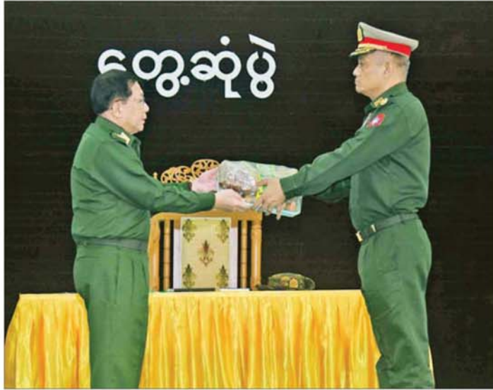
နိုင်ငံတော်လုံခြုံရေးနှင့် အေးချမ်းသာယာရေးကော်မရှင်ဥက္ကဋ္ဌ တပ်မတော်ကာကွယ်ရေးဦးစီးချုပ် ဗိုလ်ချုပ်မှူးကြီး မင်းအောင်လှိုင် ပြည်တပ်နယ်မှ အရာရှိ၊ စစ်သည်၊ မိသားစုများအတွက် စားသောက်ဖွယ်ရာ ပစ္စည်းများ ပေးအပ်စဉ်။