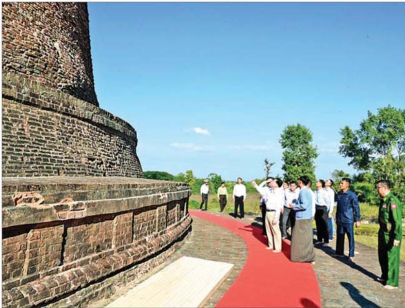
ပြည်ထောင်စုသမ္မတမြန်မာနိုင်ငံတော် ယာယီသမ္မတ နိုင်ငံတော်လုံခြုံရေးနှင့် အေးချမ်းသာယာရေးကော်မရှင်ဥက္ကဋ္ဌ ဗိုလ်ချုပ်မှူးကြီးမင်းအောင်လှိုင် ဘောဘောကြီးစေတီတော်မြတ်ကြီးအား လက်ယာရစ်လှည့်လည်ဖူးမြော်ကြည့်ပါစဉ်။

တင်ပြချက်များအပေါ် ပြန်လည်ဖြည့်စွက်ဆွေးနွေးပြောကြား တင်ပြချက်များနှင့် စပ်လျဉ်း၍ နိုင်ငံတော်ယာယီသမ္မတ နိုင်ငံတော် လုံခြုံရေးနှင့် အေးချမ်းသာယာရေး ကော်မရှင်ဥက္ကဋ္ဌက မိမိတို့စတင်တာဝန် ယူခဲ့ရသည့်အချိန်တွင် ပညာရေးဝန်ထမ်း အများစုသည် လုပ်ငန်းခွင်စွန့်ခွာမှုများကို သစ္စာစွဲစွာဖြင့် လုပ်ဆောင်ခဲ့ကြသော ကြောင့် နိုင်ငံအတွင်း ပညာရေးဝန်ထမ်း များ လိုအပ်ချက်ဖြစ်ပေါ်နေခြင်းဖြစ် ကြောင်း၊ အချို့ပညာရေးဝန်ထမ်းများ အနေဖြင့် ခြိမ်းခြောက်အကျပ်ကိုင်ခံရမှု၊ ဖိအားပေးခံရမှု၊ နိုင်ငံရေးဝါဒပိုင်း ရိုက်ခတ်မှုတို့ကြောင့် လုပ်ငန်းခွင်စွန့်ခွာခဲ့ ရမှုများရှိကြောင်း၊ ထို့ကြောင့် နိုင်ငံတော် အနေဖြင့် ထိုသို့စွန့်ခွာခဲ့ရသူများအား အခွင့်အရေးပေးသည့်အနေဖြင့် ပြန်လည် သတင်းပို့သူများကို လုပ်ငန်းခွင်စွန့်ခွာသူ များစာရင်းမှ ပယ်ဖျက်ပေးခဲ့ကြောင်း၊ နိုင်ငံ့ဝန်ထမ်းများအနေဖြင့် ပါတီနိုင်ငံရေး ကင်းရှင်းရမည်ဖြစ်ပြီး နိုင်ငံရေးနှင့် နိုင်ငံ့အရေးကို ကွဲပြားစွာသိမြင်၍