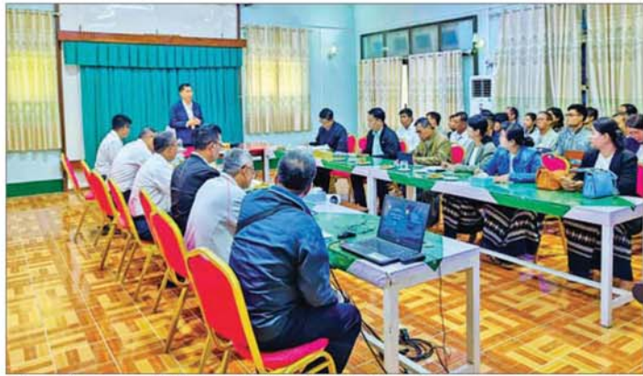
နစ်နာမှုမရှိစေရေးအတွက် မိမိတို့ဆောင်ရွက်ရမည့် လုပ်ငန်းတာဝန်များကို စေတနာထားပြီး ကြိုးပမ်း ဆောင်ရွက်သွားရန် လိုအပ်ပါကြောင်း မှာကြားပြီး ဝန်ထမ်းများ၏ စားဝတ်နေရေး၊ ပညာရေး၊ ကျန်းမာ ရေးဆိုင်ရာ လိုအပ်သည်များကိုဖြည့်ဆည်းဆောင်ရွက် ပေးခဲ့ကြောင်း သိရသည်။ သတင်းစဉ်

အစဉ်အလာကောင်းခဲ့သည့် ရေန်မြေဟောင်းတစ်ခု ဖြစ်ပြီး ရေန်နှင့်သဘာဝဓာတ်ငွေ့ နှစ်မျိုးလုံးထွက်ရှိ သည့် ရေန်မြေတစ်ခုဖြစ်ပါကြောင်း၊ ယခုအခါရေန်နှင့် သဘာဝဓာတ်ငွေ့ အထွက်တိုးစေရေးအတွက် သုတေသနလုပ်ငန်းများဆောင်ရွက်ခြင်းနှင့် တိုင်းရင်း သားလုပ်ငန်းရှင်များနှင့် ပူးပေါင်းဆောင်ရွက်ခြင်း လုပ်ငန်းများ ဆောင်ရွက်လျက်ရှိပါကြောင်း။ မှာကြား ပြည်ရေန်မြေသည် သဘာဝသဘာဝအရ ထုတ်ယူသုံးစွဲချိန် ကြာမြင့်လာသည့်အခါ အထွက် နှုန်းကျဆင်းလာသော်လည်း နိုင်ငံတကာတွင် နည်းပညာကိုအသုံးပြု၍ ရေန်မြေဟောင်းများမှ ရေန်နှင့်သဘာဝဓာတ်ငွေ့များ ဆက်လက်ထုတ်ယူနိုင် သည့်ကို တွေ့ရှိရသည့်အတွက် အတုယူအားကျပြီး ကြီးစားဆောင်ရွက်သွားကြရန် လိုအပ်ပါကြောင်း၊ ရေန်ထွက်ပစ္စည်း ကြီးကြပ်စစ်ဆေးရေးဦးစီးဌာနမှ ဝန်ထမ်းများအနေဖြင့် ပြည်သူလူထုအား ထိခိုက်