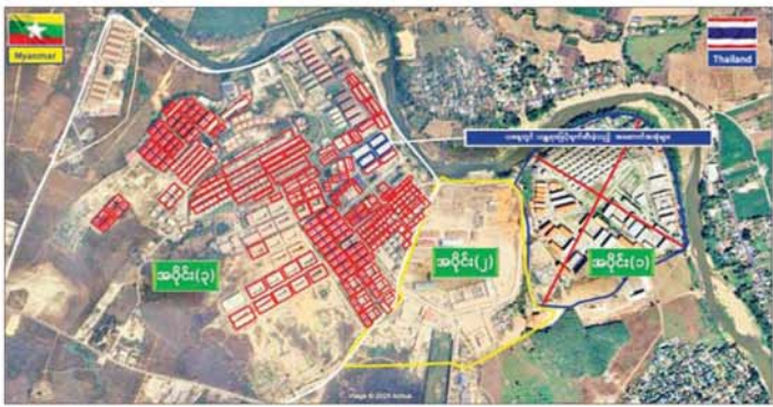
ကရင်ပြည်နယ် မြဝတီမြို့နယ်အတွင်းရှိ KK Park နယ်မြေ အပိုင်း (၃)မှ အဆောက်အအုံများအား ဖျက်ဆီးထားရှိမှုကို တွေ့ရစဉ်။

သည့်ပစ္စည်းများကို ထပ်မံ၍ အသုံးပြုနိုင်ခြင်း မရှိစေရန် အတွက် ယနေ့တွင်လည်း စနစ်တကျ မီးရှို့ဖျက်ဆီးခဲ့ ကြောင်း သိရသည်။ နိုင်ငံတော် အစိုးရအနေဖြင့် အွန်လိုင်းလိမ်လည်လောင်းကစား မှု ကျူးလွန်မှုများကို အမျိုးသား ရေးတာဝန်တစ်ရပ်အဖြစ်ယူကာ မြန်မာနိုင်ငံအတွင်း လုံးဝအခြေ မပြုနိုင်ရေး ပြည်တွင်းအင်အားစု များအပြင် အိမ်နီးချင်းနိုင်ငံအစိုးရ များနှင့်လည်း ပေါင်းစပ်ညှိနှိုင်း၍ ဆက်လက် ဆောင်ရွက်သွားမည် ဖြစ်ကြောင်း သိရသည်။ သတင်းစဉ်