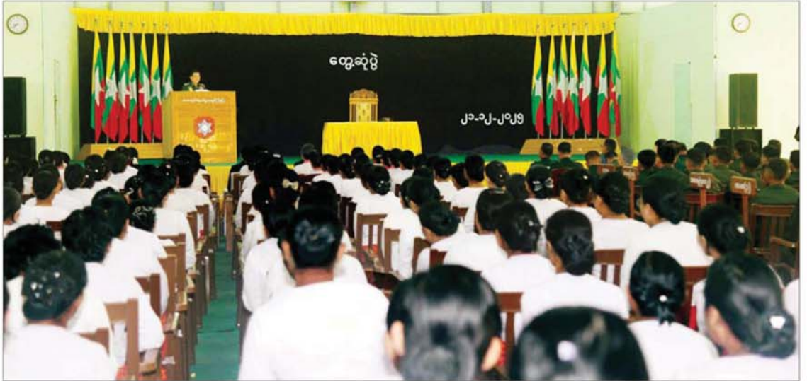
နိုင်ငံတော်လုံခြုံရေးနှင့် အေးချမ်းသာယာရေးကော်မရှင်ဥက္ကဋ္ဌ တပ်မတော်ကာကွယ်ရေးဦးစီးချုပ် ပိုလ်ချုပ်မှူးကြီး မင်းအောင်လှိုင် ပြည်တပ်နယ်မှ အရာရှိ၊ စစ်သည်၊ မိသားစုများအား တွေ့ဆုံအမှာစကားပြောကြားစဉ်။

ထိုသို့ တွေ့ဆုံစဉ် နိုင်ငံတော်လုံခြုံရေးနှင့် အေးချမ်းသာယာရေးကော်မရှင်ဥက္ကဋ္ဌ တပ်မတော်ကာကွယ်ရေးဦးစီးချုပ်က အမှာစကားပြောကြားရာ၌ တောင်ပိုင်းတိုင်းစစ်ဌာနချုပ်နယ်မြေသည် အစဉ်အလာရှိသည့် နယ်မြေတစ်ခု