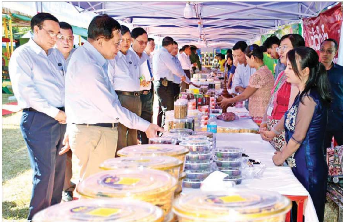
ပြည်ထောင်စုသမ္မတမြန်မာနိုင်ငံတော် ယာယီသမ္မတ နိုင်ငံတော်လုံခြုံရေးနှင့် အေးချမ်းသာယာရေးကော်မရှင်ဥက္ကဋ္ဌ ဗိုလ်ချုပ်မှူးကြီး မင်းအောင်လှိုင် ခင်းကျင်း ပြသထားသည့် ပြည်ခရိုင်အတွင်းရှိ အသေးစား၊ အငယ်စားနှင့် အလတ်စား (MSME) လုပ်ငန်းများမှ ထွက်ရှိသည့် ထုတ်ကုန်ပစ္စည်းများကို လှည့်လည်ကြည့်ရှုစဉ်။

နေပြည်တော် ၃၀ ဇူလိုင် ၂၀၂၅ - ပြည်ထောင်စုသမ္မတမြန်မာနိုင်ငံတော် ယာယီသမ္မတ နိုင်ငံတော်လုံခြုံရေးနှင့် အေးချမ်းသာယာရေးကော်မရှင် ဥက္ကဋ္ဌ ဗိုလ်ချုပ်မှူးကြီး မင်းအောင်လှိုင်သည် ပဲခူးတိုင်းဒေသကြီး ပြည်ခရိုင်အတွင်းရှိ ဌာနဆိုင်ရာတာဝန်ရှိသူများ၊ ရပ်မိရပ်ဖများ၊ အသေးစား၊ အငယ်စားနှင့် အလတ်စား (MSME) စီးပွားရေးလုပ်ငန်းရှင်များနှင့် ယနေ့နံနက်ပိုင်းတွင် ပြည်မြို့ သီရိဓမ္မရာ ရတနာမြို့တော်ခန်းမ၌ တွေ့ဆုံ၍ ဒေသဖွံ့ဖြိုးတိုးတက်ရေး ဆွေးနွေးပြောကြားသည်။ အဆိုပါတွေ့ဆုံပွဲသို့ နိုင်ငံတော်လုံခြုံရေးနှင့် အေးချမ်းသာယာရေးကော်မရှင် ဥက္ကဋ္ဌနှင့်အတူ ကော်မရှင်အတွင်းရေးမှူး ဗိုလ်ချုပ်ကြီး ရဲဝင်းဦး၊ ပြည်ထောင်စုဝန်ကြီးများ၊ ပဲခူးတိုင်းဒေသကြီးဝန်ကြီးချုပ်ဦးမျိုးဆွေဝင်း၊ ကာကွယ်ရေးဦးစီးချုပ်ရုံးမှ အဆင့်မြင့်တပ်မတော်အရာရှိကြီးများ၊ တောင်ပိုင်းတိုင်းစစ်ဌာနချုပ်တိုင်းမှူးနှင့်တာဝန်ရှိသူများ၊ ပြည်ခရိုင်အတွင်းရှိ ခရိုင်၊ မြို့နယ်အဆင့် ဌာနဆိုင်ရာ တာဝန်ရှိသူများ၊ မြို့မိ မြို့ဖများ၊ အသေးစား၊ အငယ်စားနှင့် အလတ်စား (MSME) စီးပွားရေးလုပ်ငန်းရှင်များ တက်ရောက်ကြသည်။