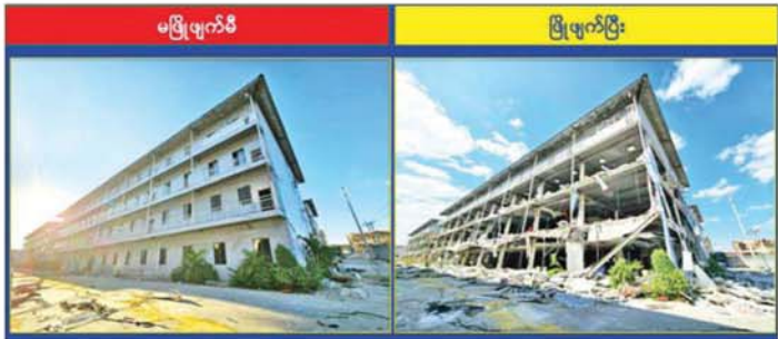
KK Park နယ်မြေ အပိုင်း(၃)တွင် တရားမဝင်ဆောက်လုပ်ထားသည့် လေးထပ်လူနေအဆောက်အအုံ ကို မဖြိုဖျက်မီနှင့် ဖြိုဖျက်ပြီးနောက် တွေ့ရစဉ်။