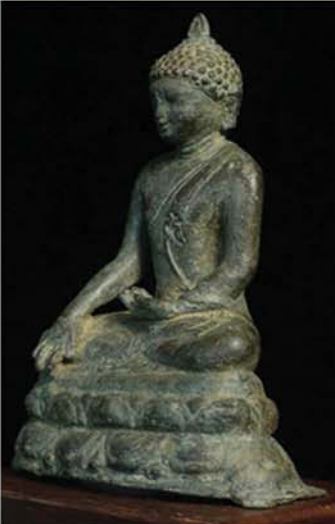
ပုဂံခေတ်ဟန် ကြေးဆင်းတု

မန္တလေးတစ်နိ ၂၀၂၅ခုနှစ်၊ မတ် ၂၈ ရက်က လှုပ်ခတ်ခဲ့တဲ့ အင်အားပြင်းငလျင်ကြီးကြောင့် ပြိုကျပျက်စီးခဲ့ရတဲ့ ဘုရားပုထိုးစေတီများထဲက ထွက်ပေါ်လာတဲ့ ဌာပနာအမွေအနှစ်များကို လေ့လာပြီး ထူးခြားတဲ့ လက်ရာလေးတွေအကြောင်း အများပြည်သူများ ဗဟုသုတဖြစ်စွာ ဆောင်းပါးအဖြစ် အစဉ်တစိုက် ရေးသားခဲ့ပါတယ်။ ပျက်စီးမှုများပြားတော့ တွေ့ရှိမှုကလည်း များသလို ထူးခြားမှုတွေကလည်း တစ်ခုနဲ့တစ်ခု မထပ်ရအောင် များပြားကြောင်း တကယ်လေ့လာတော့မှ သိလာခဲ့ရတာပါ။ အကောင်းမြင်တဲ့စိတ်နဲ့ တွေးမိတာလေးကို ပြောရရင် ငလျင်ကြီးကြောင့် အခုလို အသစ်အဆန်းတွေ သတိမဲ့တွေ့ရှိလာရတာဖြစ်တယ်ဆိုရင် အပြစ်ပြောကြမလားဘဲ။ ဒါကတော့ ကျွန်တော်ရဲ့ ပုဂ္ဂလိကအတွေးပါ။ လွတ်လပ်စွာ သဘောထား ကွဲလွဲနိုင်ပါတယ်။ အခုလည်း ကျောက်ဆည်မြို့ ဝေဘူတောင်ခြေက ပုဂံခေတ် အနော်ရထာမင်းကြီး တည်ထားကိုးကွယ်ခဲ့တဲ့ ဆည်တော်နဲ့ ရွှေမုဒ္ဒရာစေတီတော်ထဲက တွေ့လာရတဲ့ထူးခြားတဲ့ဆင်းတုတော်လေးတွေအကြောင်း တင်ပြချင်လို့ပါ။