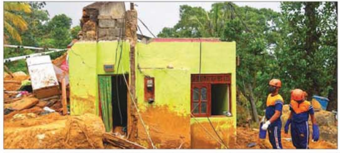
သီရိလင်္ကာနိုင်ငံ နာဂါလာတီတီယာမြို့တွင် ဆိုင်ကလုန်းမုန်တိုင်းတိုက်ခတ်ပြီးနောက် အပျက်အစီးများကို ဒီဇင်ဘာ ၁၁ ရက်က သီရိလင်္ကာတပ်မတော်ကယ်ဆယ်ရေးသမားများ ကူညီဖယ်ရှားနေစဉ်။

သဘာဝဘေးအန္တရာယ်နှင့် ရင်ဆိုင်ရချိန်တွင် သီရိလင်္ကာအစိုးရ၏ အလှူအမြန်တုံ့ပြန်ဆောင်ရွက်မှုများကို ချီးကျူးမှုနှင့်အတူ ခက်ခဲသောအချိန်ကာလအတွင်း အိုင်အမ်အက်ဖ်အနေဖြင့် သီရိလင်္ကာ