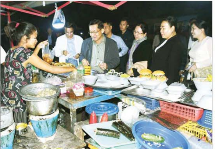
ပြည်ထောင်စုသမ္မတမြန်မာနိုင်ငံတော် ယာယီသမ္မတ နိုင်ငံတော်လုံခြုံရေးနှင့် အေးချမ်းသာယာရေး ကော်မရှင်ဥက္ကဋ္ဌ ဗိုလ်ချုပ်မှူးကြီး မင်းအောင်လှိုင်နှင့်ဇနီး ဒေါ်ကြူကြူလှ ပြည်မြို့ ကမ်းနားလမ်းရှိ ခေတ္တရာညဈေးတန်း၌ ဈေးဆိုင်ခန်းများဖွင့်လှစ်ရောင်းချနေမှုကို လိုက်လံကြည့်ရှုပြီး ဝယ်ယူအားပေးစဉ်။

ရောဝတီမြစ်ရေ လက်ရှိရေမှတ်အောက် ကျဆင်းနိုင် နေပြည်တော် ဒီဇင်ဘာ ၂၀ ရောဝတီမြစ်ရေသည် ယနေ့မွန်းလွဲ ၁၂ နာရီ၌ တိုင်းထွာချက်အရ မန္တလေးမြို့တွင် ၃၄၅ စင်တီမီတာသို့ ရောက်ရှိနေသည်။ အဆိုပါမြစ်ရေသည် ဒီဇင်ဘာလ တတိယ (၁၀)ရက်ပတ်အတွင်း လက်ရှိ ရေမှတ်အောက် တစ်ပေခန့် ကျဆင်းလာနိုင်ပြီး ယင်းမြို့၏ ရေနည်းသတ်ပေမှတ် ၃၆၀ စင်တီမီတာ အောက်တွင် ဆက်လက်တည်ရှိနိုင်သည်။ မိုး/ဇလ