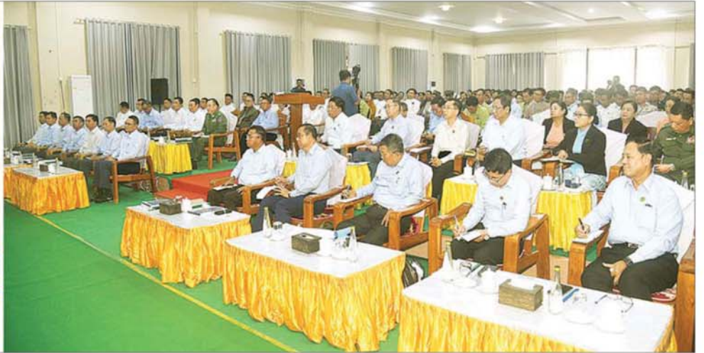
ပြည်ထောင်စုသမ္မတမြန်မာနိုင်ငံတော် ယာယီသမ္မတ နိုင်ငံတော်လုံခြုံရေးနှင့် အေးချမ်းသာယာရေးကော်မရှင်ဥက္ကဋ္ဌ ဗိုလ်ချုပ်မှူးကြီး မင်းအောင်လှိုင် မင်းဘူးမြို့ရှိ ဌာနဆိုင်ရာတာဝန်ရှိသူများ၊ မြို့မိမြို့ဖများ၊ အသေးစား၊ အငယ်စားနှင့် အလတ်စား (MSME) စီးပွားရေးလုပ်ငန်းရှင်များနှင့် တွေ့ဆုံ၍ ဒေသဖွံ့ဖြိုးတိုးတက်ရေးဆိုင်ရာများ ဆွေးနွေးပြောကြားစဉ်။