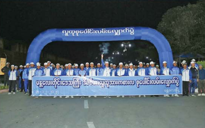
ချက်များဖြင့် နိုင်ငံတစ်ဝန်း၌ ဒီဇင်ဘာအားကစားလ လူထုစုပေါင်းလမ်းလျှောက်ပွဲကို ကျင်းပကြရာ တပျော်တပါး ပျော်ရွှင်စွာဆင်နွှဲလျက်ရှိကြောင်း သိရသည်။ (မန္တလေးနေ့စဉ်)

တစ်မျိုးသားလုံး သက်ရှည်ကျန်းမာကြံ့ခိုင်ရေးအတွက် ပြည်သူ့အားလုံးအကျိုးဝင်မည့် ကျန်းမာရေးနှင့် အားကစားကဏ္ဍမြှင့်တင်ဆောင်ရွက်နိုင်ရန်၊ တစ်မျိုးသားလုံး၏ ကာယ၊ ဉာဏ၊ စာရိတ္တ ဘက်စုံဖွံ့ဖြိုး တိုးတက်စေရန်၊ အားကစားကို လူအများ စိတ်ပါဝင်စားပြီး နိုင်ငံတော်သစ်တည်ဆောက်ရေးလုပ်ငန်းများကို စွမ်းစွမ်းတပ်ဆောင်ရွက်စေရန်၊ နိုင်ငံတော်၏ အားကစားအဆင့်အတန်း တိုးတက်မြှင့်တင်ပေးလာစေရန်နှင့် လူတစ်စုအားကစားမှ လူထုအားကစားသို့ဟူသော ရည်မှန်းချက်ကို အထောက်အကူပြုစေရန် ရည်ရွယ်