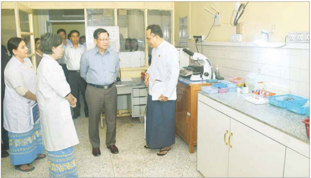
ပြည်ထောင်စုသမ္မတမြန်မာနိုင်ငံတော် ယာယီသမ္မတ နိုင်ငံတော်လုံခြုံရေးနှင့် အေးချမ်းသာယာရေးကော်မရှင်ဥက္ကဋ္ဌ ဗိုလ်ချုပ်မှူးကြီး မင်းအောင်လှိုင် မင်းဘူးမြို့ အထွေထွေရွေးကောက်ပွဲအတွင်း ကြည့်ရှုစစ်ဆေးစဉ်။

နိုင်ငံတော်အစိုးရအနေဖြင့် မင်းဘူးဒေသဖွံ့ဖြိုးတိုးတက်ရေးအတွက် တတိန်သည့်တက်မှ ဆောင်ရွက်ပေးလျက်ရှိကြောင်း၊ ဒေသတွင် နေထိုင်ကြသူ