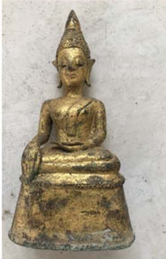
မမာဟန် ကြေးဆင်းတုတော်