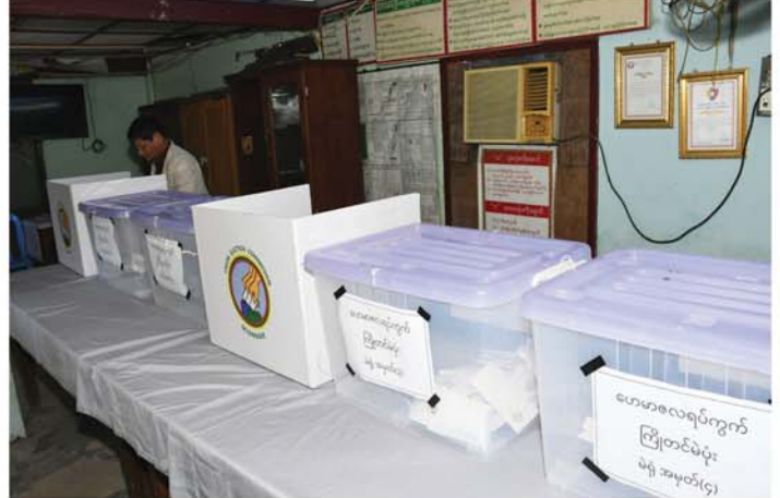
(မန္တလေးနေ့စဉ်)

ရွေးကောက်ပွဲကော်မရှင် တာဝန် ရှိသူတစ်ဦးက ပြောကြားကြောင်း သိရသည်။