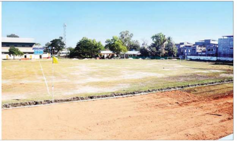
ပြည်ထောင်စုသမ္မတမြန်မာနိုင်ငံတော် ယာယီသမ္မတ နိုင်ငံတော်လိုမြို့ရေးနှင့် အေးချမ်းသာယာရေးကော်မရှင်ဥက္ကဋ္ဌ ဗိုလ်ချုပ်မှူးကြီး မင်းအောင်လှိုင် မင်းဘူးမြို့ ခရိုင်ဘောလုံးအားကစားကွင်း အဆင့်မြှင့်တင်ဆောင်ရွက်နေမှုအခြေအနေများ ကြည့်ရှုစစ်ဆေးစဉ်။