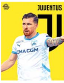
မှာ စိတ်ဝင်စားဖွယ် စောင့်ကြည့်ရမည်ဖြစ်သည်။ (အေပီပုံ) (NGB)

ဂျူဗင်တပ်အသင်းက ခေါ်ယူရန် စီစဉ်လာခြင်းဖြစ်သည်။ မာဆေးလ်အသင်းကလည်း အီမိုင်းဟိုဂျီဘတ်ဂျီအတွက် သင့်တော်သည့် ပြောင်းရွှေ့ဈေးနှုန်း ရရှိပါက မည်သည့်အသင်းကိုမဆို ရောင်းချသွားမည်ဖြစ်သည်။ ထို့ကြောင့် ဂျူဗင်တပ်အသင်းအနေဖြင့် ဆောင်းရာသီဈေးကွက်အတွင်းတွင် မာဆေးလ်အသင်းထံမှ အီမိုင်းဟိုဂျီဘတ်ဂျီကို ခေါ်ယူနိုင်မည်လားဆိုသည်