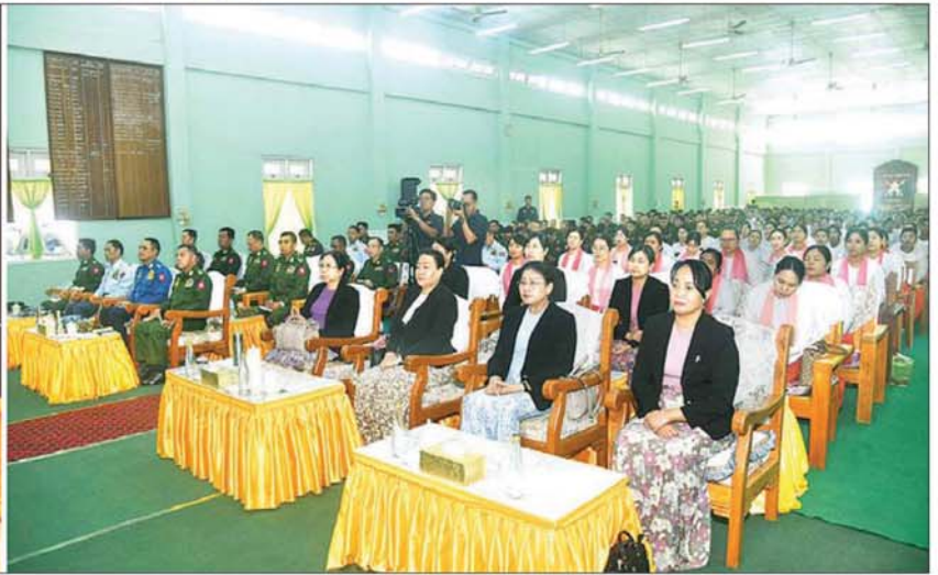
နိုင်ငံတော်လုံခြုံရေးနှင့် အေးချမ်းသာယာရေးကော်မရှင်ဥက္ကဋ္ဌ တပ်မတော်ကာကွယ်ရေးဦးစီးချုပ် ဗိုလ်ချုပ်မှူးကြီး မင်းအောင်လှိုင် မကွေးတပ်နယ်မှ အရာရှိ၊ စစ်သည် မိသားစုများအား တွေ့ဆုံအမှာစကား ပြောကြားစဉ်။