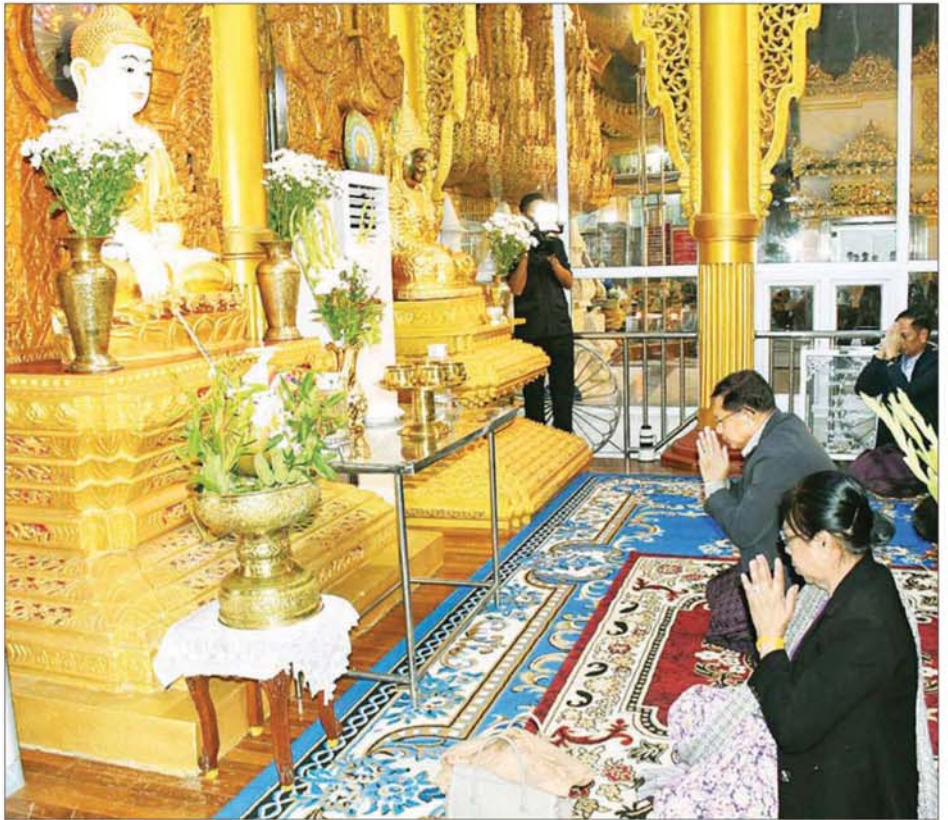
ပြည်ထောင်စုသမ္မတမြန်မာနိုင်ငံတော် ယာယီသမ္မတ နိုင်ငံတော်လုံခြုံရေးနှင့် အေးချမ်းသာယာရေးကော်မရှင်ဥက္ကဋ္ဌ ဗိုလ်ချုပ်မှူးကြီး မင်းအောင်လှိုင် နှင့်ဇနီး ဒေါ်ကြူကြူလှ ပြည်မြို့ကျက်သရေဆောင် လေးဆူဓာတ်ပျော် ရွှေဆံတော်စေတီတော်မြတ်ကြီးအား ဖူးမြော်ကြည့်ညိုစဉ်။

ရင်းရင်းနှီးနှီးနှုတ်ဆက် အလားတူ ယနေ့ညနေပိုင်း တွင် နိုင်ငံတော်ယာယီသမ္မတ နိုင်ငံတော်လုံခြုံရေးနှင့် အေးချမ်း သာယာရေးကော်မရှင် ဥက္ကဋ္ဌနှင့်