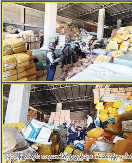
မြဝတီမြို့အတွင်း တရားမဝင်ကုန်ပစ္စည်းများ ဖမ်းဆီးရရှိမှု မှတ်တမ်းတင်ပုံ။

နေပြည်တော် ၂၀ ဇူလိုင် ၂၀၂၅ မြန်မာနိုင်ငံအစိုးရအနေဖြင့် အွန်လိုင်းလိမ်လည်လောင်းကစားမှုများ အများဆုံးအခြေချလုပ်ကိုင်လျက်ရှိကြသည့် ရွှေကုက္ကိုလ်နယ်မြေနှင့် KK Park နယ်မြေများရှိ တရားမဝင်အဆောက်အအုံများအတွင်း ဝင်ရောက်ရှင်းလင်းခြင်း၊ အွန်လိုင်းလိမ်လည်လောင်းကစားမှုလုပ်ငန်း စဉ်များတွင် အသုံးပြုခဲ့သည့် သိမ်းဆည်းရမိပစ္စည်းများနှင့် တရားမဝင် အဆောက်အအုံများအား