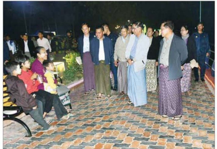
ပြည်ထောင်စုသမ္မတမြန်မာနိုင်ငံတော် ယာယီသမ္မတ နိုင်ငံတော်လုံခြုံရေးနှင့် အေးချမ်းသာယာရေး ကော်မရှင်ဥက္ကဋ္ဌ ဗိုလ်ချုပ်မှူးကြီး မင်းအောင်လှိုင်နှင့်ဇနီး ဒေါ်ကြူကြူလှ ပြည်မြို့ ကမ်းနားလမ်းရှိ ခေတ္တရာညဈေးတန်း၌ လာရောက်စားသုံးကြသည့် ပြည်သူလူထုများအား ရင်းရင်းနှီးနှီး နှုတ်ဆက်စဉ်။

တကျဖြစ်ရန်လိုသည့် အခြေအနေ များနှင့် ပတ်သက်၍ တာဝန်ရှိသူ များကို လိုအပ်သည့်ဖွဲ့စည်းမှု မှာကြားခဲ့ကြောင်း သတင်းရရှိ သည်။ သတင်းစဉ်