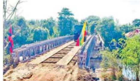
အကြမ်းဖက်သောင်းကျန်းသူများက ဖောက်ခွဲပျက်ဆီးခဲ့သည့် ကျောက်စရစ်ကုန်းတံတားအား ပြန်လည်ပြုပြင်ထားရှိမှုကို တွေ့ရစဉ်။

ရှိပြီး အဆိုပါအကြမ်းဖက် သောင်းကျန်းသူများကိုလည်း တပ်မတော် စစ်ကြောင်းများက မြေပြင်/ဝေဟင် ပေါင်းစပ်၍ ထက်ကြပ်လိုက်လံ ချေမှုန်းလျက် ရှိကြောင်းနှင့် စဉ့်ကူးမြို့နှင့် လက်မန်လှ ကျေးရွာအတွင်း ယာယီနေရပ်စွန့်ခွာ ပြည်သူများ