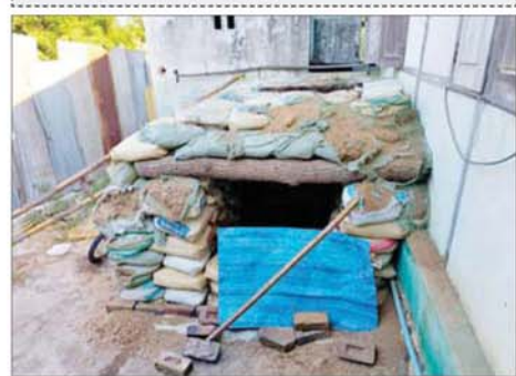
အကြမ်းဖက်သောင်းကျန်းသူများက လူနေအိမ်များအတွင်း ဘန်ကာများပြုလုပ်ထားရှိမှုကို တွေ့ရစဉ်။