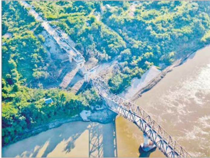
အကြမ်းဖက်သောင်းကျန်းသူများက ဧရာဝတီတံတား (ရတနာသီရိ)အား မိုင်းထောင်ဖောက်ခွဲ ပျက်ဆီး ခဲ့မှုကို တွေ့ရစဉ်။

နိုင်ငံတော်ပျက်စီးရာ ပျက်စီး ကြောင်းကို နည်းလမ်းမျိုးစုံဖြင့် အစဉ်တစိုက် ကြိုးပမ်းလုပ်ဆောင် နေသော CRPH၊ NUG အမည်ခံ အကြမ်းဖက် အဖွဲ့အစည်းများ၏ လက်ဝေခံ PDF အမည်ခံအကြမ်း ဖက်သမားများသည် အဆိုပါ ဒေသအား ယာယီစိုးမိုးထားစဉ် မြို့/ရွာများအတွင်း ဘာသာရေး ဆိုင်ရာ အဆောက်အအုံများ၊ စာသင်ကျောင်းများ၊ ဌာနဆိုင်ရာ အဆောက်အအုံများ၊ ဆေးရုံများ နှင့် လူနေအိမ်များအတွင်း ဝင်ရောက်နေရာယူ၍ ဘန်ကာများ ပြုလုပ်ခြင်း၊ ပြည်သူများ၏ အိုးအိမ်များကို ခံစစ်တိုင်းအဖြစ် အကာအကွယ်ရယူ၍ ပစ်ခတ် တိုက်ခိုက်ခြင်း၊ ပြည်သူများ အဓိက သွားလာအသုံးပြုလျက်ရှိ သည့် အဆိုပါဒေသရှိ ဧရာဝတီ တံတား (ရတနာသီရိ) ကျောက်စရစ်တံတား၊ ဧရပ်ကွင်း တံတားအပါအဝင် လမ်း၊ တံတား ကြီးများအား မိုင်းထောင်ဖောက်ခွဲ ပျက်ဆီးခြင်းများ၊ တိုင်းပြည်