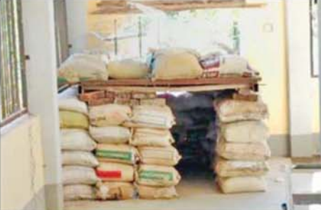
အကြမ်းဖက်သောင်းကျန်းသူများက ဧရပ်ကွင်းဆေးရုံအတွင်း ဘန်ကာများပြုလုပ်ထားရှိမှုကို တွေ့ရစဉ်။