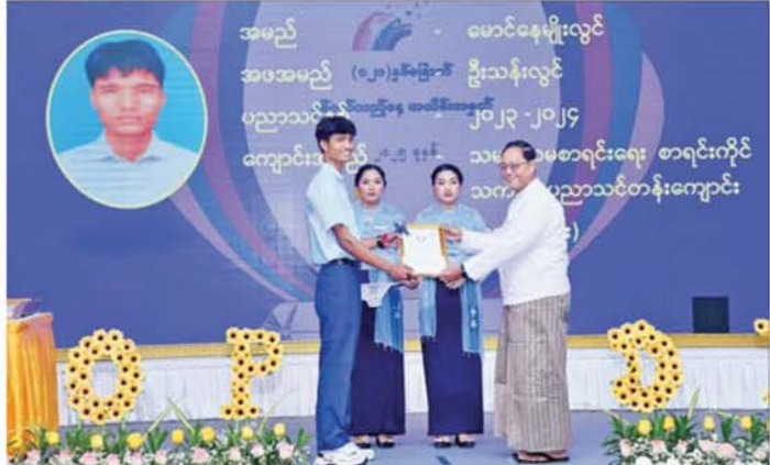
ပြည်ထောင်စုဝန်ကြီး ဦးလှစိုး သမဝါယမစာရင်းရေးစာရင်းကိုင် သက်မွေးပညာ သင်တန်းကျောင်းမှ အကောင်းဆုံးဆု ရရှိသူတစ်ဦးအား ဆုပေးအပ်ချီးမြှင့်စဉ်။

သည့် ကျပန်းစကားပြောပြိုင်ပွဲ တွင် ပထမဆုရရှိသူက သမဝါယမ အကြောင်း သိကောင်းစရာများကို ရှင်းလင်းတင်ပြသည်။ ယင်းနောက် ပြည်ထောင်စု ဝန်ကြီးက တာဝန်အဆက်ဆက် ထမ်းဆောင်ခဲ့သော ဂုဏ်ပြုခံ အငြိမ်းစားပုဂ္ဂိုလ်များ ကိုယ်စား (အငြိမ်းစား) ဒုတိယဝန်ကြီး ဦးမြင့်စိုးအား အမှတ်တရ လက်ဆောင် ပေးအပ်သည်။ ဆက်လက်၍ ပြည်ထောင်စု ဝန်ကြီးနှင့် တာဝန်ရှိသူများက ဦးစီးဌာနအတွင်း ဂုဏ်ထူးဆောင် ဆုရရှိကြသူများ၊ စွမ်းဆောင်ရည် ဆုရရှိကြသော ဝန်ထမ်းများနှင့် သမဝါယမအသင်းများ၊ နိုင်ငံ ဝန်ထမ်းတက္ကသိုလ်များတွင် ဆုရ ရှိကြသူများ၊ သမဝါယမစာရင်းရေး စာရင်းကိုင် သက်မွေးပညာ သင်တန်းကျောင်းများအကောင်း ဆုံးဆုရရှိကြသူများ၊ ၂၀၂၄-၂၀၂၅ ပညာသင်နှစ် တက္ကသိုလ်ဝင် စာမေးပွဲတွင် လေးဘာသာဂုဏ်ထူး ရရှိခဲ့ကြသည့် ဝန်ထမ်းသား သမီး များ၊ ကျပန်းစကားပြောပြိုင်ပွဲတွင် ဆုရရှိကြသူများနှင့် အထူးဆု ကမ်းမဲပေါက်ကြသော ဝန်ထမ်း များအား ဆုများပေးအပ်ချီးမြှင့်ကြ သည်။ ထို့နောက် သမဝါယမ စာရင်းရေးစာရင်းကိုင် သက်မွေး ပညာ သင်တန်းကျောင်း (မော်လမြိုင်)မှ ကျောင်းသူလေး များက "သာဓုဌာနနေရာမညမြေ" တေးသီချင်းဖြင့် ကပြဖော်ပြခဲ့ ကြောင်း သိရသည်။ သတင်းစဉ်