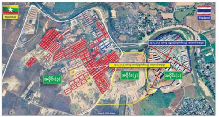
ကရင်ပြည်နယ် မြဝတီမြို့နယ်အတွင်းရှိ KK Park နယ်မြေအပိုင်း (၃)မှ အဆောက်အအုံများအား ဖျက်ဆီးထားရှိမှုကို တွေ့ရစဉ်။

ရှိကြောင်း သိရပါသည်။ ထို့ပြင် ကရင်ပြည်နယ် မြဝတီမြို့နှင့် ပတ်ဝန်းကျင်ဒေသတစ်ဝိုက်ရှိ အဆောက်အအုံများ၌ တရားမဝင် ပြည်ပနိုင်ငံသားများ နေထိုင်ခြင်းနှင့် အွန်လိုင်းလိမ်လည်လောင်းကစားမှုများ လုပ်ကိုင်ဆောင်ရွက်ခြင်းမရှိစေရေးအတွက် လုံခြုံရေးတပ်ဖွဲ့ဝင်များ၊ အုပ်ချုပ်ရေးအဖွဲ့အစည်းများနှင့် ဒေသတွင်းတာဝန်ရှိသူများအပါအဝင် အဖွဲ့စုံပါဝင်သည့် ပူးပေါင်းအဖွဲ့ဖြင့် ၃၀ ဇူလိုင် ၈ ရက်မှစတင်၍ ရှာဖွေရှင်းလင်းဆောင်ရွက်ခဲ့ရာ ယနေ့တွင်လည်း တရားမဝင် တစ်ထပ်အဆောက်အအုံနှစ်လုံး၊ နှစ်ထပ်အဆောက်အအုံသုံးလုံး စုစုပေါင်း တရားမဝင်အဆောက်အအုံ ၁၁ လုံးကို ထပ်မံစစ်ဆေးနိုင်ခဲ့ကြောင်း သိရပါသည်။ ယင်းအပြင် မြဝတီမြို့နယ်အတွင်းရှိ KK Park နယ်မြေ