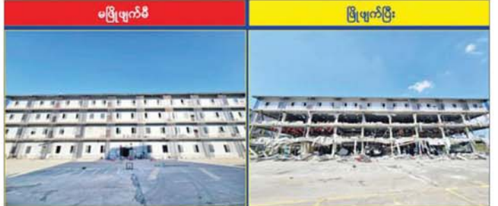
KK Park နယ်မြေ အပိုင်း(၁)တွင် တရားမဝင်အဆောက်အအုံများအား လေးထပ်လူနေအဆောက်အအုံအား မဖြိုဖျက်မီနှင့် ဖြိုဖျက်ပြီးနောက် တွေ့ရစဉ်။