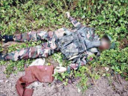
အကြမ်းဖက်သောင်းကျန်းသူများ၏ အလောင်းများကို တွေ့ရစဉ်။

ရှိပြီး အဆိုပါအကြမ်းဖက် သောင်းကျန်းသူများကိုလည်း တပ်မတော် စစ်ကြောင်းများက မြေပြင်/ဝေဟင် ပေါင်းစပ်၍ ထက်ကြပ်လိုက်လံ ချေမှုန်းလျက် ရှိကြောင်းနှင့် စဉ့်ကူးမြို့နှင့် လက်မန်လှ ကျေးရွာအတွင်း ယာယီနေရပ်စွန့်ခွာ ပြည်သူများ