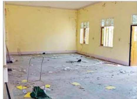
အကြမ်းဖက်သောင်းကျန်းသူများက ဧရပ်ကွင်းဆေးရုံအား ပျက်ဆီးခဲ့မှုကို တွေ့ရစဉ်။