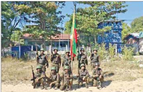
တပ်မတော်စစ်ကြောင်းများက စဉ့်ကူးမြို့အား ပြန်လည် သိမ်းပိုက်ထိန်းချုပ်ရရှိမှုကို တွေ့ရစဉ်။