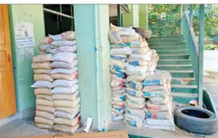
အကြမ်းဖက်သောင်းကျန်းသူများက စာသင်ကျောင်းအတွင်း ဘန်ကာများပြုလုပ်ထားရှိမှုကို တွေ့ရစဉ်။

ယခု ဆုတ်ခွာထွက်ပြေးစဉ်တွင် လည်း ၎င်းတို့ လုပ်ဆောင်နေကျ နည်းလမ်းများဖြစ်သည့် ပြည်သူ များပိုင်ဆိုင်သည့် အဖိုးတန်နှင့် အမြတ်တန်း သိမ်းဆည်းထား သော ပစ္စည်းများအား အတင်းအဓမ္မ ယူဆောင်ခြင်း၊ အဆိုပါဒေသ အတွင်းရှိနိုင်ငံတော်၏ သယံဇာတ ဖြစ်သော တရားဝင်ခွင့်ပြုထား သည့် ရွှေလုပ်ကွက်များအတွင်း အတင်းအဓမ္မ ဝင်ရောက်လုပ်ကိုင် တူးဖော်ခြင်း၊ ပြည်သူများပိုင်ဆိုင် သည့် အဖိုးတန်ပစ္စည်းများကို လက်နက်အားကိုးဖြင့် အနိုင်ကျင့် ယူဆောင်ခြင်းများ ပြုလုပ်ကာ ရွှေ/သတ္တု ရောရာမြေစာများနှင့် အဖိုးတန်ပစ္စည်းများအား ယာယီ နေရပ်စွန့်ခွာ ပြည်သူများထားရှိခဲ့ သည့် မော်တော်ယာဉ်များဖြင့် တင်ဆောင်ကာ ဧရာဝတီမြစ်အား ဖြတ်ကျူး၍ ဆုတ်ခွာထွက်ပြေးရန် လုပ်ဆောင် လျက် ရှိ ကြောင်း မြေပြင်သတင်း ဖော်ထုတ်ချက် အရ တပ်မတော်စစ်ကြောင်းများ က မြေပြင်၊ ဝေဟင် စစ်နည်းဗျူဟာ မြောက် ပေါင်းစပ်ချေမှုန်းခဲ့ရာ အကြမ်းဖက် သောင်းကျန်းသူများ သည် အထိနာစွာဖြင့် ဧရာဝတီမြစ် အနောက်ဘက်သို့ ဆုတ်ခွာ ထွက်ပြေးစဉ် အစီအစဉ်ပျက်ပြား ကာ ဦးတည်ရာမဲ့ ထွက်ပြေးလျက်