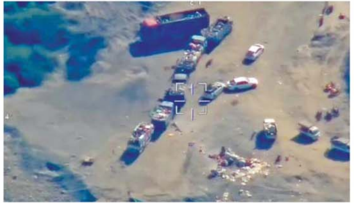
ဆုတ်ခွာထွက်ပြေးသွားသည့် အကြမ်းဖက်သောင်းကျန်းသူများအား တိုက်ခိုက်ချေမှုန်းခဲ့သည့် မှတ်တမ်းဓာတ်ပုံကို တွေ့ရစဉ်။