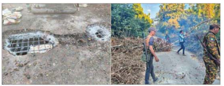
PDF အမည်ခံ အကြမ်းဖက်အဖွဲ့က မိုင်းထောင်ဖောက်ခွဲဖျက်ဆီးခဲ့သည့် ကန့်ဘလူ-စံပယ်နံ့သာ ကားလမ်းပေါ်ရှိ သံကူကွန်ကရစ်တံတား၏ မှတ်တမ်းဓာတ်ပုံ။

ယာဉ်များ ဖြတ်သန်းသွားလာမှု မရရှိစေရန် တံတားအား သစ်ကိုင်းများဖြင့် ပိတ်ဆို့ထားကြောင်း သိရပါသည်။ ထို့ကြောင့် လုံခြုံရေးတပ်ဖွဲ့ဝင်များပါဝင်သော ပူးပေါင်းအဖွဲ့က တံတားပျက်စီးမှုကို ပြုပြင်ကြပြီး ပိတ်ဆို့ထားသည့် သစ်ကိုင်းများကို ဖယ်ရှားရှင်းလင်းခြင်းများ ဆောင်ရွက်ခဲ့ရာ ၃၀ ဇူလိုင် ၂၀၂၀ ရက် ညနေ ၄ နာရီတွင် တံတား ပြုပြင်ခြင်းလုပ်ငန်းများ ပြီးစီးခဲ့ပြီး လူနှင့်ယာဉ်များ ပုံမှန်ဖြတ်သန်းသွားလာနိုင်ပြီဖြစ်ကြောင်း သိရပါသည်။ ထိုသို့ အများပြည်သူသွားလာ