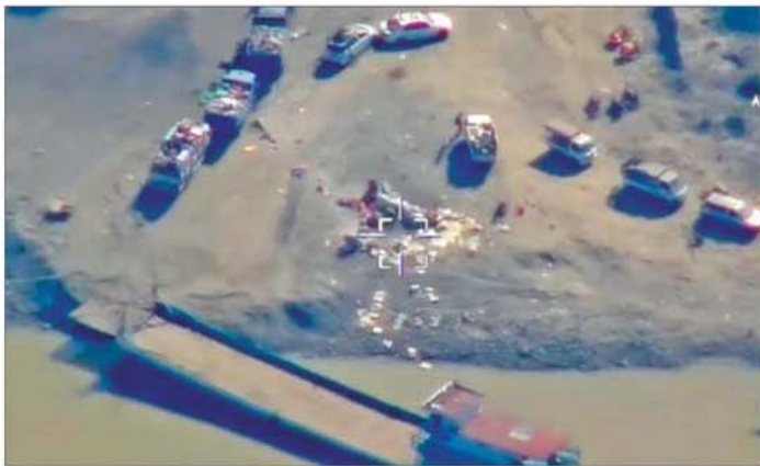
ဆုတ်ခွာထွက်ပြေးသွားသည့် အကြမ်းဖက်သောင်းကျန်းသူများအား တိုက်ခိုက်ချေမှုန်းခဲ့သည့် မှတ်တမ်းဓာတ်ပုံကို တွေ့ရစဉ်။