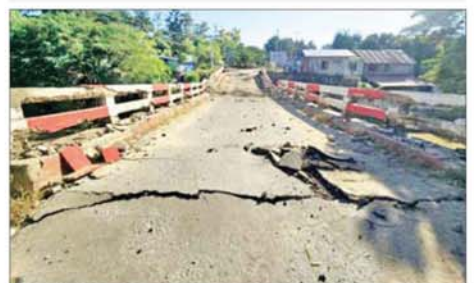
အကြမ်းဖက်သောင်းကျန်းသူများက ဖောက်ခွဲဖျက်ဆီးခဲ့သည့် ဧရပ်ကွင်းတံတားကို တွေ့ရစဉ်။

တစ်နေရာပြီး တစ်နေရာ ပြန်လည်သိမ်းပိုက်ထိန်းချုပ်နိုင်ခဲ့ သည်။ ထိုသို့အကြမ်းဖက်သောင်းကျန်း သူများ ယာယီစိုးမိုးထားသည့် ဒေသများအား တစ်ခုပြီးတစ်ခု ပြန်လည်သိမ်းပိုက်ထိန်းချုပ်နိုင်ခဲ့ ပြီး ဒေသခံပြည်သူများ၏အားပေး ထောက်ခံမှု ရရှိထားသည့် တပ်မတော်စစ်ကြောင်းများအနေ ဖြင့် မတ္တရာ၊ ပြင်ဦးလွင် PDF အမည်ခံအကြမ်းဖက်သောင်းကျန်း သူများ ဌာနချုပ်အဖြစ် ဖွင့်လှစ်၍ ယာယီစိုးမိုးထားသည့် စဉ့်ကူးမြို့ နှင့် လက်ပန်လှကျေးရွာဒေသတို့ အား ပြန်လည်သိမ်းပိုက်ထိန်းချုပ် နိုင်ရေးအတွက် လိုအပ်သည့် အုပ်ချုပ် ထောက်ပံ့မှုများကို ဖြည့်တင်း ဆောင်ရွက်ပြီး လေကြောင်းပစ်ကူးလက်နက်ကြီး