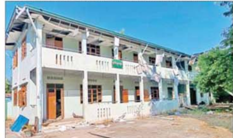
အကြမ်းဖက်သောင်းကျန်းသူများက ဌာနဆိုင်ရာအဆောက်အအုံ များအား ပျက်ဆီးခဲ့မှုကို တွေ့ရစဉ်။