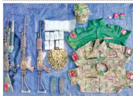
အကြမ်းဖက်သောင်းကျန်းသူများထံမှ လက်နက်၊ ခဲယမ်းများနှင့် ဆက်စပ်ပစ္စည်းများ သိမ်းဆည်းရမိမှုကို တွေ့ရစဉ်။