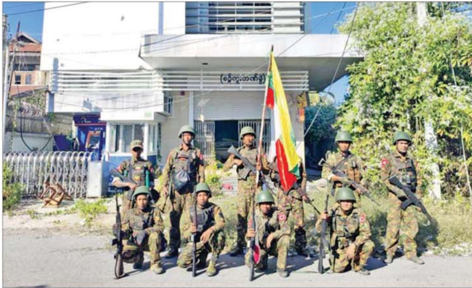
တပ်မတော်စစ်ကြောင်းများက စဉ့်ကူးမြို့၊ CB ဘဏ်အား ပြန်လည်သိမ်းပိုက်ထိန်းချုပ်ရရှိမှုကို တွေ့ရစဉ်။