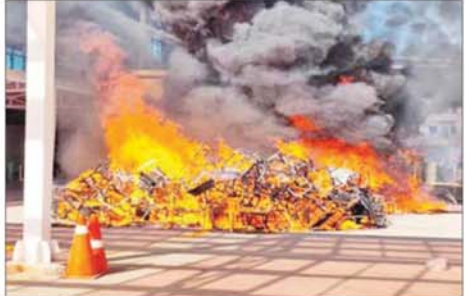
မြဝတီမြို့နယ် ရွှေကုက္ကိုလ်နယ်မြေအတွင်း အွန်လိုင်းလိမ်လည်လောင်းကစားမှုကျူးလွန်ရာတွင် အသုံးပြုသည့် ပစ္စည်းများ မီးရှို့ဖျက်ဆီးနေမှုကို တွေ့ရစဉ်။

နှင့် ရွှေကုက္ကိုလ်နယ်မြေတို့၌ ဖျက်ဆီးခဲ့ကြောင်း သိရပါသည်။ မပြုနိုင်ရေး ပြည်တွင်းအင်အားစု အွန်လိုင်းလိမ်လည်လောင်းကစားမှု ကျူးလွန်ရာတွင် အသုံးပြုသည့် အွန်လိုင်းလိမ်လည်လောင်းကစားမှုများအား ထပ်မံဖြိုချဖျက်ဆီးခြင်းမရှိစေရန်အတွက် ယနေ့တွင်လည်း စနစ်တကျစီမံ၍ မြန်မာနိုင်ငံအတွင်း လုံးဝအခြေ