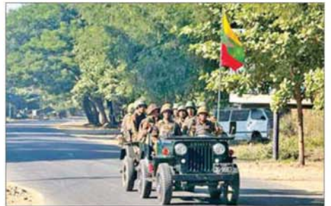
တပ်မတော်စစ်ကြောင်းများက စဉ့်ကူးမြို့အား ပြန်လည် သိမ်းပိုက်ထိန်းချုပ်ရရှိမှုကို တွေ့ရစဉ်။