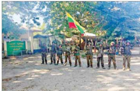
တပ်မတော်စစ်ကြောင်းများက စဉ့်ကူးမြို့နယ် လက်ပန်လှ ကျေးရွာအား ပြန်လည်သိမ်းပိုက်ထိန်းချုပ်ရရှိမှုကို တွေ့ရစဉ်။