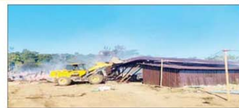
ကျောက်မဲမြို့နယ် တောင်ထိပ်ကျေးရွာအနီး အွန်လိုင်းငွေကြေး လိမ်လည်မှုနှင့် လောင်းကစားမှုများ လုပ်ဆောင်ခဲ့သည့်နေရာရှိ အဆောက်အအုံများကို မီးရှို့ဖျက်ဆီးနေစဉ်။