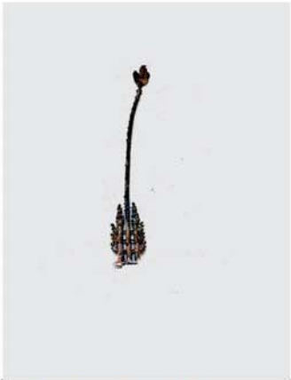
ခဲသွန်း ဟင်္သာတံခွန်တိုင် ဌာပနာ