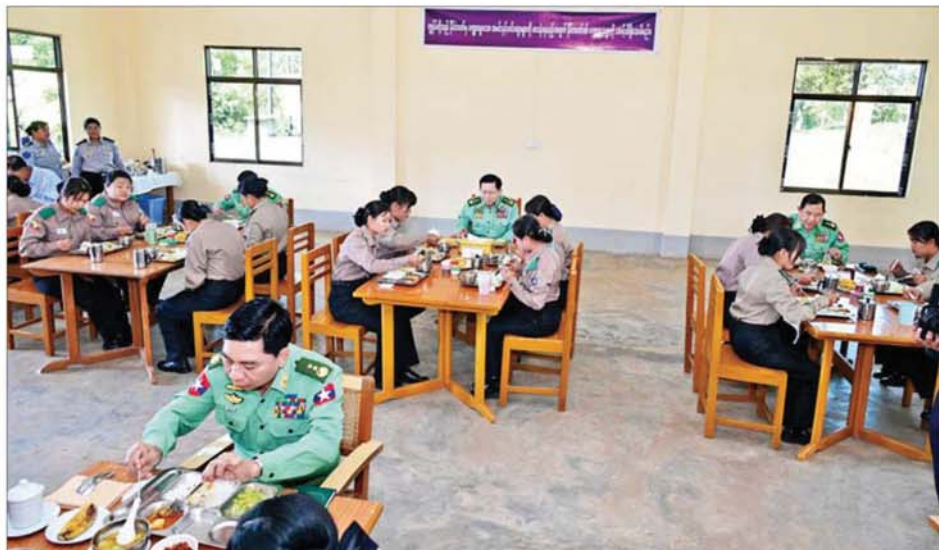
ပြည်ထောင်စုသမ္မတမြန်မာနိုင်ငံတော် ယာယီသမ္မတ နိုင်ငံတော်လုံခြုံရေးနှင့် အေးချမ်းသာယာရေးကော်မရှင်ဥက္ကဋ္ဌ ဗိုလ်ချုပ်မှူးကြီး မင်းအောင်လှိုင်နှင့် တာဝန်ရှိသူများ အခြေခံ ဆရာ ဆရာမ အထူးမွမ်းမံသင်တန်း အမှတ်စဉ်(၈၂) သင်တန်းသူ ဆရာမများနှင့်အတူ နေ့လယ်စာအတူတူ သုံးဆောင်စဉ်။

နေပြည်တော် ၃၊ ၁၁ - ၁၀ ပြည်ထောင်စုသမ္မတ မြန်မာနိုင်ငံတော် ယာယီသမ္မတ နိုင်ငံတော်လုံခြုံရေးနှင့် အေးချမ်းသာယာရေးကော်မရှင် ဥက္ကဋ္ဌ ဗိုလ်ချုပ်မှူးကြီး မင်းအောင်လှိုင်သည် ကော်မရှင်အတွင်းရေးမှူးတွဲ ဖက်ဆစ်ဆောင်ချုပ် ဗိုလ်ချုပ်ကြီး ရဲဝင်းဦးနှင့် ခရီးစဉ်တွင်လိုက်ပါလာသည့်အဖွဲ့ဝင်များ၊ မန္တလေးတိုင်းဒေသကြီး ဝန်ကြီးချုပ်နှင့် တာဝန်ရှိသူများ လိုက်ပါ၍ ယနေ့နံနက်ပိုင်းတွင် မန္တလေးတိုင်းဒေသကြီး ပြင်ဦးလွင်မြို့နယ် ဖီးပင်ကြီးရှိ နိုင်ငံ့ဝန်ထမ်းတက္ကသိုလ်(အထက်မြန်မာပြည်)၊ ရဲအရာရှိလေ့ကျင့်ရေးကျောင်း(ဖီးပင်ကြီး)နှင့် ဗဟိုမီးသတ် သင်တန်းကျောင်း(ပြင်ဦးလွင်)တို့သို့ သွားရောက်ကြည့်ရှုစစ်ဆေးသည်။ ဦးစွာ နိုင်ငံတော်ယာယီသမ္မတ နိုင်ငံတော်လုံခြုံရေးနှင့် အေးချမ်းသာယာရေးကော်မရှင်ဥက္ကဋ္ဌ နှင့် အဖွဲ့ဝင်များသည် နိုင်ငံ့ဝန်ထမ်းတက္ကသိုလ်(အထက်မြန်မာပြည်)၏ ဌာနများအလိုက် ဝန်ထမ်းများ ဖွဲ့စည်းခန့်အပ်ထားရှိမှု၊ သင်တန်းသားများအား သင်တန်းများလေ့ကျင့်သင်ကြားပေးလျက်ရှိမှု၊ မန္တလေး ငလျင်ကြီးလှုပ်ခတ်စဉ် ထိခိုက်ပျက်စီးခဲ့သည့် စာသင်ဆောင်များအား ပြန်လည်ပြင်ဆင်ဆောင်ရွက်လျက်ရှိမှု၊ နှစ်ရှည်သီးနှံများနှင့် ရာသီသီးနှံများ စိုက်ပျိုးထားရှိမှု၊ မွေးမြူရေးလုပ်ငန်းများဆောင်ရွက်ပြီး သင်တန်းသားများနှင့် ဝန်ထမ်းများအား သက်သာသောဈေးနှုန်းများဖြင့် ရောင်းချပေးလျက်ရှိမှု၊ နိုင်ငံ့ဝန်ထမ်းတက္ကသိုလ် နှစ်ခုတွင် သင်တန်းများအလိုက် သင်တန်းအချိန်ခွဲဝေမှု၊ သင်တန်းအဆင့်သတ်မှတ်ချက်များ၊ သင်ခန်းစာများ ခေတ်စနစ်နှင့် လျော်ညီမှုရှိစေရေးနှင့် တက္ကသိုလ်များ၏