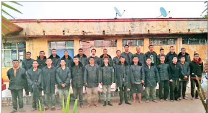
ဖမ်းဆီးရမိသည့် တရုတ်နိုင်ငံသားများကို တွေ့ရစဉ်။

ပါဝင်ပတ်သက်သူများအား စနစ်တကျ စိစစ်ဖော်ထုတ် နိုင်ငံတော်အနေဖြင့် အွန်လိုင်း လိမ်လည် လောင်းကစားမှု ကျူးလွန်ခြင်းများ ပပျောက်စေ ရေးကို မြန်မာနိုင်ငံအတွင်း ကျယ်ကျယ်ပြန့်ပြန့် ဆက်လက် နှိမ်နင်းသွားမည်ဖြစ်ပြီး ၎င်း လုပ်ငန်းများတွင် ပါဝင်ပတ်သက် နေသူများနှင့် နောက်ကွယ်မှ ကြိုးကိုင်နေသူများအား ဖော်ထုတ် ဖမ်းဆီး၍ ထိထိရောက်ရောက် ပြင်းပြင်းထန်ထန် အရေးယူ နိုင်ရေး အိမ်နီးချင်းနိုင်ငံများ၊ ဒေသတွင်းနိုင်ငံများ၊ နိုင်ငံတကာ အဖွဲ့အစည်းများနှင့် တက်ကြွစွာ ပူးပေါင်း ဆောင်ရွက်လျက်ရှိပါ သည်။ ထို့ကြောင့် အဆိုပါ သိမ်းဆည်းရမိ အွန်လိုင်းလိမ်လည် လောင်းကစားမှုများ ပြုလုပ်ရာ တွင်အသုံးပြုသည့် ဆက်စပ်ပစ္စည်း များ၊ လူနေအဆောက်အအုံများ၊ နေရာထိုင်ခင်းများအား မီးရှို့ ဖျက်ဆီးခဲ့ပြီး ဖမ်းဆီးရမိသူများနှင့် ပါဝင်ပတ်သက်သူများအား စနစ် တကျ စိစစ်ဖော်ထုတ်ကာ တရားဥပဒေနှင့်အညီ တရားစွဲဆို အရေးယူ ဆောင်ရွက်နိုင်ရေးနှင့် ပြည်ပ နိုင်ငံသားများအား လူသားချင်း စာနာထောက်ထားမှု နှင့် နိုင်ငံအချင်းချင်း ချစ်ကြည် ရင်းနှီးမှုတို့ကို ရှေးရှု၍ သက်ဆိုင် ရာနိုင်ငံများသို့ ပြန်လည် လွှဲပြောင်း ပေးအပ်နိုင်ရေး ဆောင်ရွက်သွားမည်ဖြစ်ကြောင်း သိရသည်။