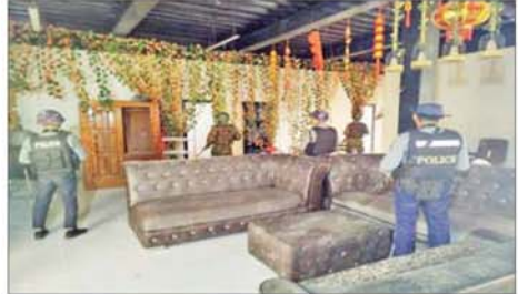
တရားမဝင် နိုင်ငံခြားသားများ ထားရှိသည့် တစ်ထပ်တိုက် အဆောက်အအုံကို ဝင်ရောက်ရှင်းလင်းစဉ်။