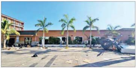
KK Park နယ်မြေအပိုင်း(၃)တွင် တရားမဝင်ဆောက်လုပ်ထားသည့် တစ်ထပ်လူနေအဆောက်အအုံ မဖြိုဖျက်မီ (ဝဲပုံ)နှင့် ဖြိုဖျက်ပြီး (ယာပုံ)ကို တွေ့ရစဉ်။