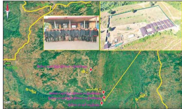
ကျောက်မဲမြို့အနီး အွန်လိုင်းလိမ်လည်လောင်းကစားမှု လုပ်ကိုင်နေသူများအား လူနေအဆောက် အအုံများ၊ လုပ်ငန်းသုံးပစ္စည်းများနှင့်အတူ ဖမ်းဆီးရမိနေရာပြပုံ။

ကျောက်မဲမြို့နယ် အတွင်း နယ်မြေလုံခြုံရေး ဆောင်ရွက် နေသည့် လုံခြုံရေးတပ်ဖွဲ့ဝင်များ သည် နိုဝင်ဘာ ၃၀ ရက်တွင် ကျောက်မဲမြို့နယ် တောင်ထိပ် ကျေးရွာ၏တောင်ဘက် ဒုဋ္ဌဝတီ မြစ်အနီးသို့ရောက်ရှိစဉ် မသင်္ကာ ဖွယ်ရာ အဆောက်အအုံများကို တွေ့ရှိရသဖြင့် ဝင်ရောက်ရှာဖွေ စစ်ဆေးခဲ့ရာ အွန်လိုင်းငွေကြေး လိမ်လည်မှုနှင့် လောင်းကစားမှု များ လုပ်ဆောင်နေသည့် နေရာ ဖြစ်ကြောင်း တွေ့ရှိရပြီး လုပ်ငန်း လုပ်ကိုင်နေကြသူများအား မတွေ့ ရှိရဘဲ အလျား ပေ ၆၀၊ အနံပေ ၃၀ ရှိ သွပ်မိုး သုံးထပ်သားကာ အိပ်ဆောင်ခြောက်လုံး၊ အလျား ပေ ၆၀၊ အနံပေ ၃၀ ရှိ သွပ်မိုး သုံးထပ်သားကာ လုပ်ငန်းဆောင် ငါးလုံး၊ အလျား ပေ ၆၀၊ အနံပေ ၃၀ ရှိ သွပ်မိုး သုံးထပ်သားကာ အစားအစာသိုလှောင်ရုံခြောက်လုံး၊ အလျား ပေ ၆၀၊ အနံပေ ၃၀ ရှိ ဆောက်လုပ်ဆဲ လုပ်ငန်းဆောင် တစ်လုံး၊ အလျား ပေ ၆၀၊ အနံပေ ၃၀ ရှိ ဆောက်လုပ်ဆဲ အိပ်ဆောင် တစ်လုံး၊ အလျား ပေ ၈၀၊ အနံ ၁၀ ပေ ရှိ သုံးထပ်သားကာ တန်းလျား