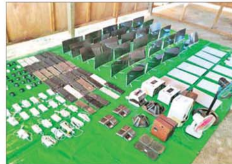
ကျောက်မဲမြို့နယ် တောင်ထိပ်ကျေးရွာအနီး အွန်လိုင်းငွေကြေး လိမ်လည်မှုနှင့် လောင်းကစားမှုများ လုပ်ဆောင်ရာနေရာတွင် အသုံးပြုခဲ့သည့် ဆက်စပ်ပစ္စည်းများကိုတွေ့ရစဉ်။