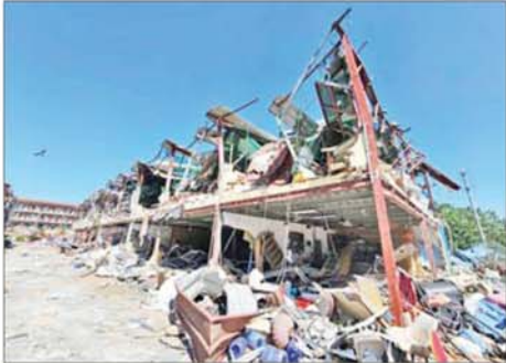
KK Park နယ်မြေအပိုင်း(၃)တွင် တရားမဝင်ဆောက်လုပ်ထား သည့် လေးထပ်တိုက်အမှတ် C 6 လူနေအဆောက်အအုံ မဖြိုဖျက်မီ (အပေါ်ပုံ)နှင့် ဖြိုဖျက်ပြီး (အောက်ပုံ)ကို တွေ့ရစဉ်။