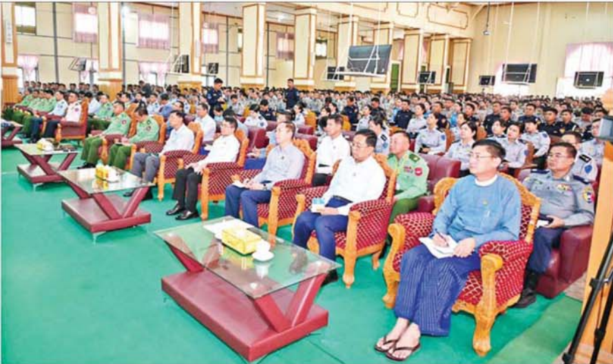
ပြည်ထောင်စုသမ္မတမြန်မာနိုင်ငံတော် ယာယီသမ္မတ နိုင်ငံတော်လုံခြုံရေးနှင့် အေးချမ်းသာယာရေးကော်မရှင်ဥက္ကဋ္ဌ ဗိုလ်ချုပ်မှူးကြီးမင်းအောင်လှိုင် နိုင်ငံဝန်ထမ်းတက္ကသိုလ်(အထက်မြန်မာပြည်)၊ ရဲအရာရှိ လေ့ကျင့်ရေးကျောင်း(စီးပင်ကြီး)နှင့် ဗဟိုစီးသတ်သင်တန်းကျောင်း(ပြင်ဦးလွင်)တို့မှ နည်းပြအရာရှိများနှင့် သင်တန်းသား သင်တန်းသူများအား အမှာစကားပြောကြားစဉ်။

နေပြည်တော် ဒီဇင်ဘာ ၁ ပြည်ထောင်စုသမ္မတမြန်မာနိုင်ငံတော် ယာယီသမ္မတ နိုင်ငံတော် လုံခြုံရေးနှင့် အေးချမ်းသာယာရေးကော်မရှင်ဥက္ကဋ္ဌ ဗိုလ်ချုပ်မှူးကြီး မင်းအောင်လှိုင်သည် မန္တလေးတိုင်းဒေသကြီး ပြင်ဦးလွင်မြို့နယ် စီးပင်ကြီးရှိ နိုင်ငံဝန်ထမ်းတက္ကသိုလ် (အထက်မြန်မာပြည်)၊ ရဲအရာရှိ လေ့ကျင့်ရေးကျောင်း(စီးပင်ကြီး)နှင့် ဗဟိုစီးသတ်သင်တန်းကျောင်း (ပြင်ဦးလွင်)တို့မှ နည်းပြအရာရှိများနှင့် သင်တန်းသား သင်တန်းသူ များအား ယနေ့မွန်းလွဲပိုင်းတွင် နိုင်ငံဝန်ထမ်းတက္ကသိုလ် (အထက် မြန်မာပြည်)ရှိ ရဲအရာရှိများနှင့် အမှာစကားပြောကြားသည်။