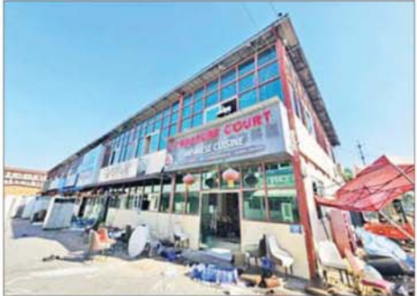
KK Park နယ်မြေအပိုင်း(၃)တွင် တရားမဝင်ဆောက်လုပ်ထားသည့် နှစ်ထပ်စားသောက်ခန်းအဆောက်အအုံ မဖြိုဖျက်မီ (ဝဲပုံ)နှင့် ဖြိုဖျက်ပြီး (ယာပုံ)ကို တွေ့ရစဉ်။