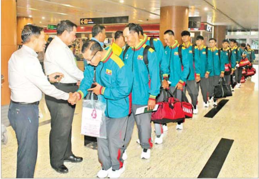
(၃၃)ကြိမ်မြောက် အရှေ့တောင်အာရှအားကစားပြိုင်ပွဲတွင် မြန်မာနိုင်ငံကိုယ်စားပြု ပါဝင်ယှဉ်ပြိုင်မည့် ကနူး/ကယက် လှေလှော်အားကစားသမားများ ထိုင်းနိုင်ငံသို့ထွက်ခွာစဉ်။