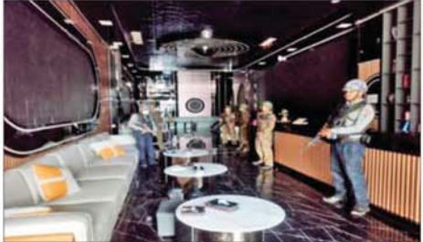
တရားမဝင် နိုင်ငံခြားသားများ ထားရှိသည့် ငါးထပ်တိုက် အဆောက်အအုံကို ဝင်ရောက်ရှင်းလင်းစဉ်။

ဖြိုချဖျက်ဆီးပြီးဖြစ် ထိုသို့ဆောင်ရွက်လျက်ရှိရာ ယနေ့ တွင် မြဝတီ-မဲထေရ်သလေး (KK Park) အပိုင်း (၃) နယ်မြေအတွင်းရှိ တရားမဝင် အဆောက်အအုံများဖြစ်သော တစ်ထပ် အဆောက်အအုံ တစ်လုံး၊ နှစ်ထပ် အဆောက်အအုံ လေးလုံး၊ လေးထပ် အဆောက်အအုံနှစ်လုံး စုစုပေါင်း တရား မဝင်အဆောက်အအုံ ခုနှစ်လုံးကို ထပ်မံ ဖြိုချဖျက်ဆီးခဲ့သဖြင့် အပိုင်း(၃)နယ်မြေ