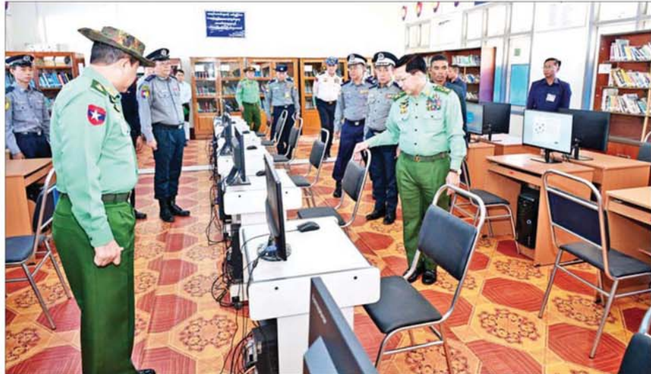
ပြည်ထောင်စုသမ္မတမြန်မာနိုင်ငံတော် ယာယီသမ္မတ နိုင်ငံတော်လုံခြုံရေးနှင့် အေးချမ်းသာယာရေးကော်မရှင်ဥက္ကဋ္ဌ ဗိုလ်ချုပ်မှူးကြီး မင်းအောင်လှိုင် ရံအရာရှိလေ့ကျင့်ရေးကျောင်း(ဖီးပင်ကြီး) စာကြည့်တိုက်အတွင်း ကြည့်ရှုစစ်ဆေးစဉ်။

သင်တန်းသားများ၏ စားသောက် နေထိုင်ရေးနှင့် ပတ်သက်၍ နိုင်ငံတော်မှ ထိုက်သင့်သည့် နှုန်းထားဖြစ်စေရေး တိုးမြှင့်ဆောင်ရွက်ပေးလျက်ရှိကြောင်း၊ နိုင်ငံဝန်ထမ်းတက္ကသိုလ်အနေဖြင့် သင်တန်းသားများနှင့် ဝန်ထမ်းများ၊ မိသားစုများ၏ စားရေးကို အထောက်အကူပြုစေမည့် ရာသီသီးနှံများကို စိုက်ပျိုးဆောင်ရွက်သွားရန် လိုကြောင်း၊ အလားတူ ဝန်ထမ်းများအနေဖြင့်လည်း တစ်ပိုင်းတစ်ခိုင်းစိုက်ပျိုးမွေးမြူရေး လုပ်ငန်းများကို ဆောင်ရွက်သွားမည် ဆိုပါက သက်သာချောင်ချိရေး အတွက် များစွာအထောက်အကူပြုစေမည် ဖြစ်ကြောင်း၊ မွေးမြူရေးနှင့် ပတ်သက်၍ သင်တန်းသားများနှင့် ဝန်ထမ်းများ၊ မိသားစုဝင်များအတွက် လိုအပ်သည့် ကြက်ဥများ။