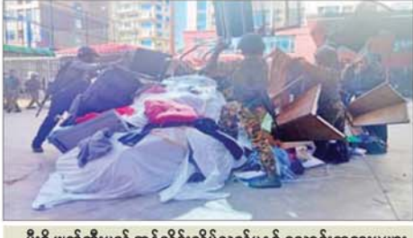
စီးရီးဖျက်ဆီးမည့် အွန်လိုင်းလိမ်လည်မှုနှင့် လောင်းကစားမှုများ ကျူးလွန်ရာတွင် အသုံးပြုခဲ့သည့် အသုံးအဆောင်ပစ္စည်းများကို တွေ့ရစဉ်။