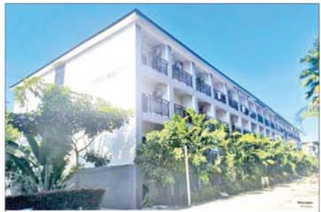
KK Park နယ်မြေအပိုင်း(၃)တွင် တရားမဝင်ဆောက်လုပ်ထား သည့် လေးထပ်တိုက်အမှတ် C 6 လူနေအဆောက်အအုံ မဖြိုဖျက်မီ (အပေါ်ပုံ)နှင့် ဖြိုဖျက်ပြီး (အောက်ပုံ)ကို တွေ့ရစဉ်။