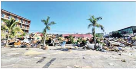
KK Park နယ်မြေအပိုင်း(၃)တွင် တရားမဝင်ဆောက်လုပ်ထားသည့် နှစ်ထပ်စားသောက်ခန်းအဆောက်အအုံ မဖြိုဖျက်မီ (ဝဲပုံ)နှင့် ဖြိုဖျက်ပြီး (ယာပုံ)ကို တွေ့ရစဉ်။