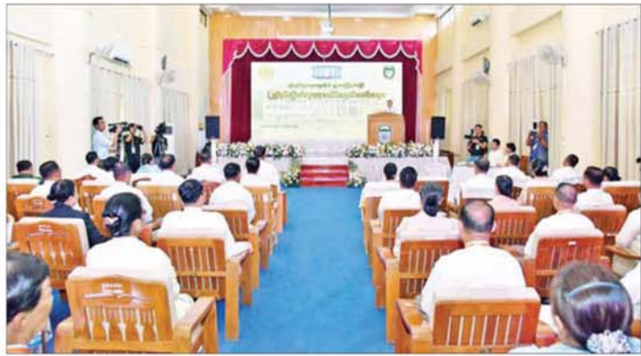
နိုင်ငံတော်ဝန်ကြီးချုပ် ဦးညိုစော ရန်ကုန်စီးပွားရေးတက္ကသိုလ်(ရွာသာကြီးနယ်မြေ) (၂၅)နှစ်မြောက် ငွေရတုအထိမ်းအမှတ်အခမ်းအနားတွင် အမှာစကားပြောကြားစဉ်။

ဝန်ကြီးချုပ်နှင့် တာဝန်ရှိသူများက ကမ္ဘာ့ကျေးဇူးတင်စာကို အမွှေး နံ့သာရည်များဖြင့် ပက်ဖျန်း ပေးပြီး နိုင်ငံတော်ဝန်ကြီးချုပ်က ငွေရတုအထိမ်းအမှတ် ကိုကော် ပင်ကို စိုက်ပျိုးပေးသည်။ ထို့နောက် နိုင်ငံတော်ဝန်ကြီးချုပ် သည် အခမ်းအနားသို့တက်ရောက် လာကြသူများနှင့်အတူ တက္ကသိုလ် ပင်မဆောင်ရွေ့တွင် စုပေါင်း မှတ်တမ်းတင်ဓာတ်ပုံ ရိုက်ကြ သည်။ ယင်းနောက် အခမ်းအနားကို တက္ကသိုလ် ပင်မဆောင်ခန်းမ၌ ဆက်လက်ကျင်းပရာ တက္ကသိုလ် ကျောင်းသူများက "ဂုဏ်ယူပါ သည့် ငွေရတုတိုင်ပီ" တေးသီချင်း ဖြင့် ကပြဖော်ပြကြသည်။ ဆက်လက်၍ နိုင်ငံတော် ဝန်ကြီးချုပ်က အမှာစကား ပြောကြားရာတွင် နိုင်ငံတစ်နိုင်ငံ