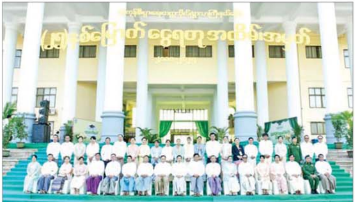
နိုင်ငံတော်ဝန်ကြီးချုပ် ဦးညိုစော အခမ်းအနားသို့ တက်ရောက်လာကြသူများနှင့်အတူ စုပေါင်း မှတ်တမ်းတင်ဓာတ်ပုံရိုက်စဉ်။

တက္ကသိုလ် ကျောင်းသား ကျောင်း သူဟောင်းများပူးပေါင်း၍ အလုပ် အကိုင် အခွင့်အလမ်းပြပွဲများ၊ ဆွေးနွေးပွဲများ၊ သုတေသန ပိုစတာပြိုင်ပွဲများ၊ သုတေသန စာတမ်းဖတ်ပွဲများ ချိတ်ဆက် ဆောင်ရွက်နေကြသည်ကိုလည်း သိရှိရသည့်အတွက် နိုင်ငံတော် ဖွံ့ဖြိုးတိုးတက်ရေး အတွက် များစွာ အထောက်အကူပြု ကြောင်း၊ တက္ကသိုလ်များတွင် အမျိုးသားယဉ်ကျေးမှုတက္ကသိုလ် တို့မှ ကျောင်းသူများ၏ "ငွေရတုမှ သည်ထာဝစဉ်တည်" တေးသီချင်း၊ "တောင်နွဲ့ပျော် ငွေရတုပွဲတော်" တေးသီချင်းများဖြင့် ကပြဖော်ပြ မှုကိုလည်းကောင်း ကြည့်ရှု အားပေးကြပြီး နိုင်ငံတော်ဝန်ကြီး ချုပ်က အကဲဖြတ်ပေးအပ် ဂုဏ်ပြု ပန်းခြင်းနှင့် ဂုဏ်ပြုဆုငွေများ ပေးအပ်ချီးမြှင့်သည်။