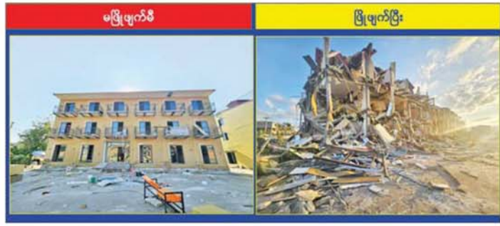
KK Park နယ်မြေ အပိုင်း(၃)တွင် တရားမဝင်အဆောက်အအုံထားသည့် နှစ်ထပ်လူနေအဆောက်အအုံအား မဖြိုဖျက်မီနှင့် မဖြိုဖျက်ပြီးနောက် တွေ့ရစဉ်။

အတွင်းရှိ အွန်လိုင်းလိမ်လည်လောင်းကစားမှုများ ကျူးလွန်ရာတွင် အသုံးပြုခဲ့သည့် အပိုင်း(၃) နယ်မြေအတွင်းရှိ တရားမဝင်သုံးထပ်အဆောက်အအုံ ၃ စနစ်၊ နှစ်ထပ်အဆောက်အအုံ ကိုးလုံးနှင့် တစ်ထပ်အဆောက်အအုံ တစ်လုံး စုစုပေါင်း တရားမဝင်အဆောက်အအုံ ၁၂ လုံးကို ထပ်မံဖြိုချဖျက်ဆီးခဲ့သဖြင့် KK Park နယ်မြေအတွင်းရှိ တရားမဝင်အဆောက်အအုံ စုစုပေါင်း ၆၃၇ လုံး အနက် ၄၇၈