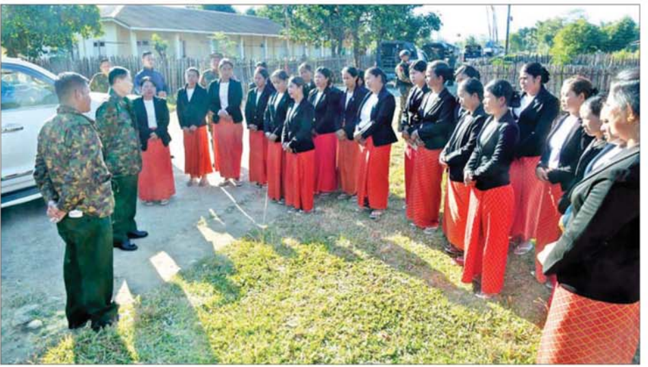
နိုင်ငံတော်လုံခြုံရေးနှင့် အေးချမ်းသာယာရေးကော်မရှင် ဒုတိယဥက္ကဋ္ဌ ဒုတိယတပ်မတော်ကာကွယ်ရေးဦးစီးချုပ် ကာကွယ်ရေးဦးစီးချုပ် (ကြည်း) ဒုတိယဗိုလ်ချုပ်မှူးကြီးစိုးဝင်း မချမ်းဘောတပ်နယ်နှင့် ပူတာအိုတပ်နယ်တို့ရှိ အိမ်ထောင်သည်အမျိုးသမီးများအား ရင်းရင်းနှီးနှီး တွေ့ဆုံ နှုတ်ဆက်စဉ်။

မွန်လွင်ပိုင်းတွင် ကော်မရှင် ဒုတိယဥက္ကဋ္ဌ ဒုတိယတပ်မတော် ကာကွယ်ရေးဦးစီးချုပ် ကာကွယ်