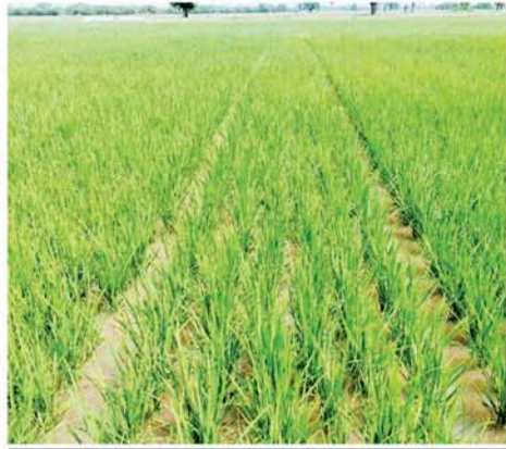
သစ်ပင်စိုက်ပျိုးမှု တို့ကမ္ဘာ သာယာလှပ စိမ်းမြမြ။

အုပ်စုတွင် ၉၅၀ ဧကနှင့် ချောင်း ကောက်ဆည်ရေဖြင့် မြာကျေးရွာ အုပ်စုတွင် ၈၈၀ တို့ကို စိုက်ပျိုးသွားရန် သတ်မှတ်လျာ ထားကြောင်း သိရ သည်။ (အောက်ပုံ) (၄၆၉)