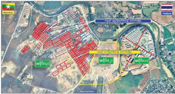
ကရင်ပြည်နယ် မြဝတီမြို့နယ်အတွင်းရှိ KK Park နယ်မြေအပိုင်း (၃)မှ အဆောက်အအုံများအား ဖျက်ဆီးထားရှိမှုကို တွေ့ရစဉ်။

နေပြည်တော် ၃၀ ဇူလိုင် ၂၀၂၀ - အစိုးရအနေဖြင့် အွန်လိုင်းလိမ်လည်လောင်းကစားမှုများ အများဆုံးအခြေချလုပ်ကိုင်လျက်ရှိကြသည့် ရွှေကုက္ကိုလ် နယ်မြေနှင့် KK Park နယ်မြေများရှိ တရားမဝင်အဆောက်အအုံများအတွင်း ဝင်ရောက်ရှင်းလင်းခြင်း၊ အွန်လိုင်းလိမ်လည်လောင်းကစားမှု လုပ်ငန်းစဉ်များတွင် အသုံးပြုခဲ့သည့် သိမ်းဆည်းရမိပစ္စည်းများနှင့် တရားမဝင်