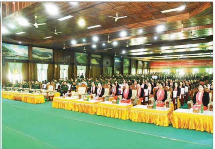
နိုင်ငံတော်လုံခြုံရေးနှင့် အေးချမ်းသာယာရေးကော်မရှင် ဒုတိယဥက္ကဋ္ဌ ဒုတိယတပ်မတော်ကာကွယ်ရေးဦးစီးချုပ် ကာကွယ်ရေးဦးစီးချုပ်(ကြည်း) ဒုတိယဗိုလ်ချုပ်မှူးကြီး စိုးဝင်း မြစ်ကြီးနားတပ်နယ်မှ အရာရှိ၊ စစ်သည်၊ မိသားစုဝင်များအား တွေ့ဆုံအမှာစကားပြောကြားစဉ်။