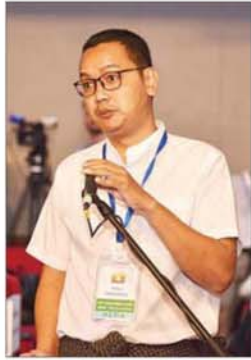
ဦးဇေယျာဦး

ရဲမှူးချုပ်ကျော်လင်းက အွန်လိုင်းလောင်းကစားမှုများနှင့်ပတ်သက်ပြီး အွန်လိုင်းပေါ်တွင် နည်းမျိုးစုံ၊ ကစားနည်းမျိုးစုံနှင့် လုပ်ဆောင်နေသည့် ကိုတွေ့ရမည်ဖြစ်ကြောင်း၊ ယင်းကဲ့သို့ တရားမဝင်ထိုင်းထိများ၊ ကားများ၊ မြေများ၊ အိမ် စသည့် ကံစမ်းမဲများ လိမ်လည်ရောင်းချသည့်သူများကို နည်းပညာပိုင်းအရဖော်ထုတ်ပြီးမှ လောင်းကစားဥပဒေနှင့် အရေးယူနေခြင်းများ ရှိပါကြောင်း၊ ၂၀၂၅ ခုနှစ်၊ ဒီဇင်ဘာလအထိ အွန်လိုင်းလောင်း