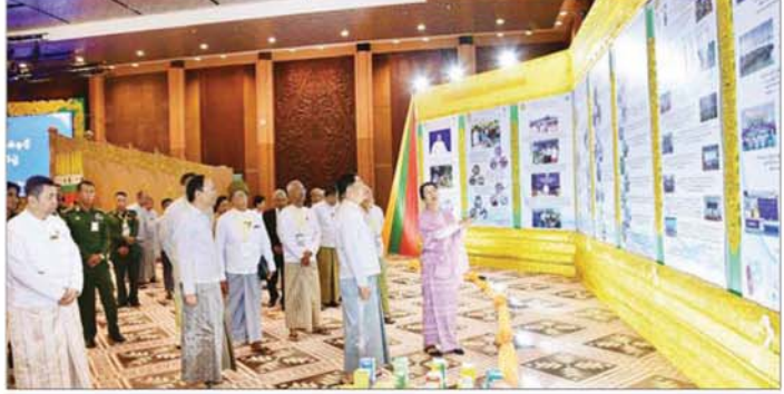
နိုင်ငံတော်လုံခြုံရေးနှင့် အေးချမ်းသာယာရေးကော်မရှင်အဖွဲ့ဝင် နိုင်ငံတော်ဝန်ကြီးချုပ် ဦးညိုစော ခင်းကျင်းပြသထားသည့် ဆေးဝါးဖြန့်ခွဲရေးအစီအစဉ် အဖွဲ့ဝင်များအား လှည့်လည်ကြည့်ရှုအားပေးစဉ်။

ကြရန် အထူးမှာကြားလိုကြောင်း၊ မြန်မာတို့၏ ကိုယ်ပိုင်တိုင်းရင်းဆေးအရင်းအမြစ်များ၊ တန်ဖိုးထားမှုစံနှုန်းများ မှေးမှိန်ကျဆင်းမသွားအောင် ဆက်လက်ထိန်းသိမ်းဖြှင့်တင်ကြရေးသည် မိမိတို့မျိုးဆက်သစ်များ၏ အမျိုးသားရေးတာဝန်နှင့် ဝတ္တရားပင်ဖြစ်ကြောင်း ပြောကြားသည်။ ယင်းနောက် တိုင်းရင်းဆေးပညာဖွံ့ဖြိုးတိုးတက်ရေး ဆောင်ရွက်မှုများမှတ်တမ်း Video Clip နှင့် "ပြည်ထောင်စုရဲ့အင်အား" တေးခန်းဖြင့် ကပြဖျော်ဖြေတင်ဆက်မှုကို ကြည့်ရှုကြသည်။ ဆက်လက်၍ နိုင်ငံတော်လုံခြုံရေးနှင့် အေးချမ်းသာယာရေး ကော်မရှင်အဖွဲ့ဝင် နိုင်ငံတော်ဝန်ကြီးချုပ်သည် အခမ်းအနားသို့ တက်ရောက် လာကြသူများနှင့် အတူ စုပေါင်းမှတ်တမ်းတင်ဓာတ်ပုံရိုက်သည်။