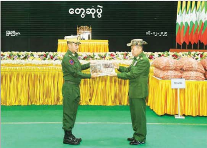
နိုင်ငံတော်လုံခြုံရေးနှင့် အေးချမ်းသာယာရေးကော်မရှင် ဒုတိယဥက္ကဋ္ဌ ဒုတိယတပ်မတော်ကာကွယ် ရေးဦးစီးချုပ် ကာကွယ်ရေးဦးစီးချုပ်(ကြည်း) ဒုတိယဗိုလ်ချုပ်မှူးကြီး စိုးဝင်း မြစ်ကြီးနားတပ်နယ်မှ အရာရှိ၊ စစ်သည်၊ မိသားစုဝင်များအတွက် စားသောက်ဖွယ်ရာများကို တိုင်းမှူးထံ ပေးအပ်စဉ်။

တပ်မတော်သားများသည် နိုင်ငံတော်ကို ကာကွယ်ရန် တာဝန်ရှိသည့်အတွက် မူလတာဝန်များ ကိုလည်း မလစ်ဟင်းအောင်၊ တရားသဖြင့် ပေးအပ် လာသည့် အမိန့်နှင့် တာဝန်များကိုလည်း ကျေနပ်စွာ