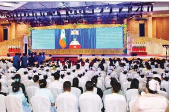
ပြည်ထောင်စုသမ္မတ မြန်မာနိုင်ငံတော် ယာယီသမ္မတ နိုင်ငံတော်လုံခြုံရေးနှင့် အေးချမ်းသာယာရေး ကော်မရှင်ဥက္ကဋ္ဌ ဗိုလ်ချုပ်မှူးကြီး မင်းအောင်လှိုင်က မြန်မာ့တိုင်းရင်းဆေးသမားတော်များ ညီလာခံနှင့် မြန်မာ့တိုင်းရင်းဆေးပညာနိုးနှောဖလှယ်ပွဲသို့ ပေးပို့သည့်ဂုဏ်ပြုမိန့်ခွန်း Video Message ကို ဖွင့်လှစ်ပြသစဉ်။

သမ္မတ နိုင်ငံတော်လုံခြုံရေးနှင့် အေးချမ်းသာယာရေးကော်မရှင်ဥက္ကဋ္ဌ ဗိုလ်ချုပ်မှူးကြီး မင်းအောင်လှိုင်က မြန်မာ့တိုင်းရင်းဆေးသမားတော်များ ညီလာခံနှင့် မြန်မာ့တိုင်းရင်းဆေးပညာနိုးနှောဖလှယ်ပွဲသို့ ပေးပို့သည့်ဂုဏ်ပြုမိန့်ခွန်း Video Message ကို ဖွင့်လှစ်ပြသသည်။ (ပြည်ထောင်စုသမ္မတမြန်မာနိုင်ငံတော် ယာယီသမ္မတ နိုင်ငံတော်လုံခြုံရေးနှင့် အေးချမ်းသာယာရေးကော်မရှင် ဥက္ကဋ္ဌ ဗိုလ်ချုပ်မှူးကြီး မင်းအောင်လှိုင်က မြန်မာ့တိုင်းရင်းဆေးသမားတော်များ ညီလာခံနှင့် မြန်မာ့တိုင်းရင်းဆေးပညာနိုးနှောဖလှယ်ပွဲသို့ ပေးပို့သည့်ဂုဏ်ပြုမိန့်ခွန်း Video Message ကို ဖွင့်လှစ်ပြသသည်။)