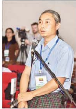
နောင်တော်လေး