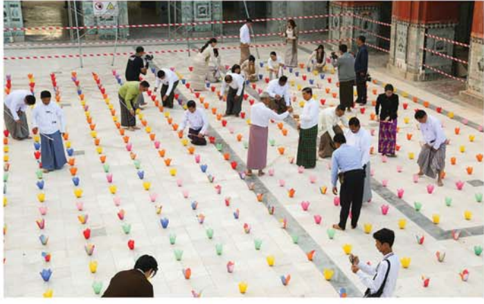
တက်ရောက်ကြသည်။

အခမ်းအနားသို့ မန္တလေးတိုင်းဒေသကြီးအစိုးရအဖွဲ့ ဝန်ကြီးချုပ် ဦးမျိုးအောင်၊ တိုင်းဒေသကြီး တရားလွှတ်တော်တရားသူကြီးချုပ်၊ တိုင်းဒေသကြီးအစိုးရအဖွဲ့ဝင် ဝန်ကြီးများနှင့်တာဝန်ရှိသူများ၊ မဟာမုနိဘုရားကြီးဂေါပကအဖွဲ့ ဥက္ကဋ္ဌနှင့် အဖွဲ့ဝင်များ၊ မြန်မာအနုပညာနှင့် ယဉ်ကျေးမှုဖွံ့ဖြိုးတိုးတက်ရေး အသင်း(MACDA) မှ ဥက္ကဋ္ဌနှင့်အသင်းဝင်များ၊ အသင်းအဖွဲ့အစည်းများနှင့် စည်ပင်သာယာမှုများ