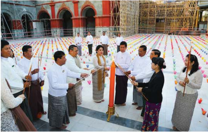
မန္တလေး ဒီဇင်ဘာ ၁၆

မန္တလေးမြို့ မဟာမုနိရုပ်ရှင်တော်မြတ်ကြီးအား ရည်မှန်း၍ မဟာမုနိဘုရားကြီးရင်ပြင်တော်တွင် မြန်မာအနုပညာနှင့် ယဉ်ကျေးမှုဖွံ့ဖြိုးတိုးတက်ရေးအသင်း (MACDA) မှ ကြီးမှူး၍ ဆီမီးတစ်သောင်း တစ်ထောင်ထွန်းညှိပူဇော်ပွဲအခမ်းအနားကို ယနေ့ညနေပိုင်းက မဟာမုနိဘုရားကြီးရင်ပြင်တော်တွင် ကျင်းပသည်။