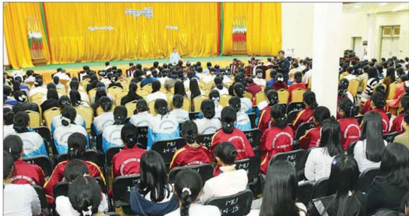
နိုင်ငံတော်လုံခြုံရေးနှင့် အေးချမ်းသာယာရေးကော်မရှင် ဒုတိယဥက္ကဋ္ဌ ဒုတိယတပ်မတော်ကာကွယ်ရေးဦးစီးချုပ် ကာကွယ်ရေးဦးစီးချုပ်(ကြည်း) ဒုတိယဗိုလ်ချုပ်မှူးကြီး စိုးဝင်း မြစ်ကြီးနားတက္ကသိုလ်၊ ပညာရေးဒီဂရီကောလိပ်နှင့် Polytechnic University မှ ပါမောက္ခချုပ်၊ ဒုတိယပါမောက္ခချုပ်များ၊ ဆရာ ဆရာမများ၊ ဝန်ထမ်းများနှင့် ကျောင်းသား ကျောင်းသူများအား အမှာစကားပြောကြားစဉ်။

နေပြည်တော် ၃၀ ဇူလိုင် ၂၀၂၄ နိုင်ငံတော်လုံခြုံရေးနှင့် အေးချမ်းသာယာရေးကော်မရှင် ဒုတိယဥက္ကဋ္ဌ ဒုတိယတပ်မတော်ကာကွယ်ရေး ဦးစီးချုပ် ကာကွယ်ရေးဦးစီးချုပ်(ကြည်း) ဒုတိယဗိုလ်ချုပ်မှူးကြီး စိုးဝင်းသည် ယနေ့တွင် ကချင်ပြည်နယ်အစိုးရအဖွဲ့ဝင်များ၊ ဌာနဆိုင်ရာ တာဝန်ရှိသူများ၊ မြို့မိမြို့ဖများနှင့် မြစ်ကြီးနားတက္ကသိုလ်၊ ပညာရေးဒီဂရီကောလိပ်နှင့် Polytechnic University မှ ပါမောက္ခချုပ်၊ ဒုတိယပါမောက္ခချုပ်များ၊ ဆရာ ဆရာမများ၊ ဝန်ထမ်းများနှင့် ကျောင်းသား ကျောင်းသူများအား သတိမှတ်နေရာအလိုက် တွေ့ဆုံ၍ အမှာစကားပြောကြားသည်။