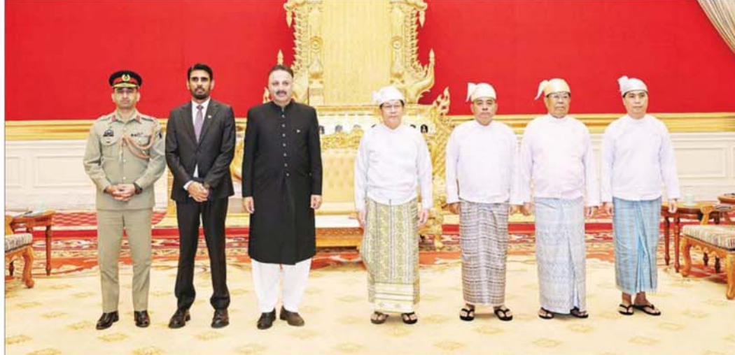
သံအမတ်ခန့်အပ်လွှာ ပေးအပ် ပြည်ထောင်စုသမ္မတမြန်မာနိုင်ငံတော် ယာယီသမ္မတ နိုင်ငံတော် လုံခြုံရေးနှင့် အေးချမ်းသာယာရေး ကော်မရှင်ဥက္ကဋ္ဌ ဗိုလ်ချုပ်မှူးကြီး မင်းအောင်လှိုင်ထံ မြန်မာနိုင်ငံဆိုင်ရာ ပါကစ္စတန် နိုင်ငံသံအမတ်ကြီး H.E. Mr. Tariq Karim က ငင်း၏သံအမတ်ခန့်အပ်လွှာ ပေးအပ်စဉ်။