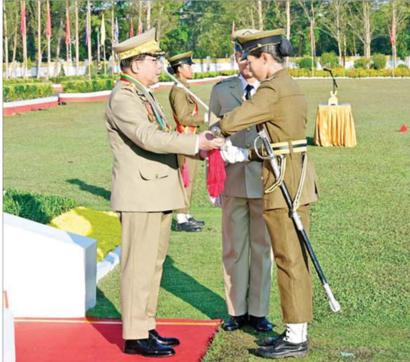
နေပြည်တော် ဒီဇင်ဘာ ၁၂

တပ်မတော်၏ အမျိုးသမီးစစ်မှန်ထမ်းများ၏ အခန်းကဏ္ဍကို အားသစ်လောင်းမည့် ဘွဲ့ရအမျိုးသမီးဗိုလ်လောင်းသင်တန်းအမှတ်စဉ်(၁၂) သင်တန်းဆင်းဂုဏ်ပြုစစ်ရေးပြအခမ်းအနားကို ယနေ့နံနက်ပိုင်းတွင် ရန်ကုန်မြို့ရှိ တပ်မတော်(ကြည်း) ဗိုလ်သင်တန်းကျောင်း(မှော်ဘီ)စစ်ရေးပြကျင်း၌ ကျင်းပပြုလုပ်ရာ နိုင်ငံတော်လုံခြုံရေးနှင့် အေးချမ်းသာယာရေးကော်မရှင်ဥက္ကဋ္ဌ တပ်မတော်ကာကွယ်ရေးဦးစီးချုပ် ဗိုလ်ချုပ်မှူးကြီး သတိုးမဟာသရေစည်သူ သတိုးသိရီသုဓမ္မ မင်းအောင်လှိုင် တက်ရောက်မိန့်ခွန်းပြောကြားသည်။