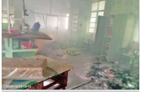
မြန်မာ့ဦးပွားရေးဘဏ်အတွင်း စာရွက်စာတမ်းများ မီးလောင်ပျက်စီးမှု။