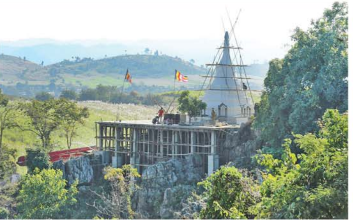
မန္တလေး၊ ဒီဇင်ဘာ ၁၂

မန္တလေးတိုင်းဒေသကြီးအစိုးရအဖွဲ့ဝန်ကြီးချုပ် ဦးမျိုးအောင်သည် ပြင်ဦးလွင်တပ်နယ်မှူး၊ တပ်မတော် နည်းပညာတက္ကသိုလ်ကျောင်းအုပ်ကြီး၊ တိုင်းဒေသကြီး အစိုးရအဖွဲ့ဝင် လုံခြုံရေးနှင့် နယ်စပ်ရေးရာဝန်ကြီးနှင့် အတွင်းရေးမှူး၊ တပ်နယ်မှူး တာဝန်ရှိသူများ၊ ခရိုင်/မြို့နယ်စီမံခန့်ခွဲရေးနှင့် အုပ်ချုပ်ရေးကော်မတီဥက္ကဋ္ဌနှင့် အဖွဲ့ဝင်များ၊ ဌာနဆိုင်ရာများမှ တာဝန်ရှိသူများ လိုက်ပါပြီး ယနေ့နံနက်ပိုင်းက ငှက်လေးကျေးရွာရှိ ရာဇအောင်မြေစေတီတော်တည်ဆောက်နေမှုနှင့် ထီးတော်တင်လှူနိုင်ရေး လုပ်ငန်းဆောင်ရွက်နေမှုများကို လိုက်လံကြည့်ရှု စစ်ဆေးခဲ့သည်။