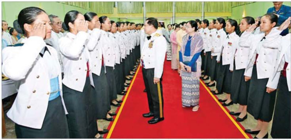
နိုင်ငံတော်လုံခြုံရေးနှင့် အေးချမ်းသာယာရေးကော်မရှင်ဥက္ကဋ္ဌ တပ်မတော်ကာကွယ်ရေးဦးစီးချုပ် ဗိုလ်ချုပ်မှူးကြီး မင်းအောင်လှိုင် သင်တန်းဆင်း အမျိုးသမီးအရာရှိများအား ရင်းရင်းနှီးနှီး နှုတ်ဆက်စဉ်။

နေပြည်တော် ၃၊ ဇူလိုင် ၂၀၂၅ - တပ်မတော်(ကြည်း) ဗိုလ်သင်တန်းကျောင်း(မှော်ဘီ) ဘွဲ့ရအမျိုးသမီးဗိုလ်လောင်း သင်တန်းအမှတ်စဉ်(၁၂) သင်တန်းဆင်း ဂုဏ်ပြုညစာစားပွဲအခမ်းအနားကို ယနေ့ညနေပိုင်းတွင် ရန်ကင်းမြို့၊ တပ်မတော်(ကြည်း) ဗိုလ်သင်တန်းကျောင်း(မှော်ဘီ)ရှိ ပြည်ထောင်စုခန်းမ၌ ကျင်းပရာ နိုင်ငံတော်လုံခြုံရေးနှင့် အေးချမ်းသာယာရေးကော်မရှင်ဥက္ကဋ္ဌ တပ်မတော်ကာကွယ်ရေးဦးစီးချုပ် ဗိုလ်ချုပ်မှူးကြီး မင်းအောင်လှိုင် တက်ရောက်ချီးမြှင့်သည်။