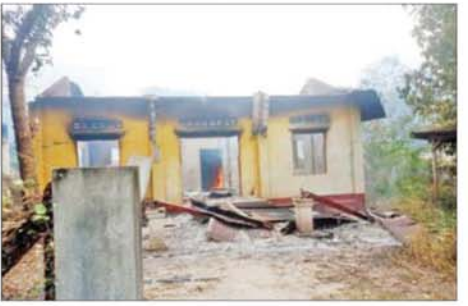
ဒုတိယမြို့နယ်အုပ်ချုပ်ရေးမှူး ဝန်ထမ်းနေအိမ် မီးလောင်ပျက်စီးမှု။