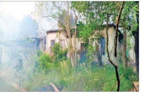
မြို့နယ်အထွေထွေအုပ်ချုပ်ရေးဦးစီးဌာန ဒုတိယမြို့နယ်ဦးစီးမှူး ဝန်ထမ်းနေအိမ် မီးလောင်ပျက်စီးမှု။