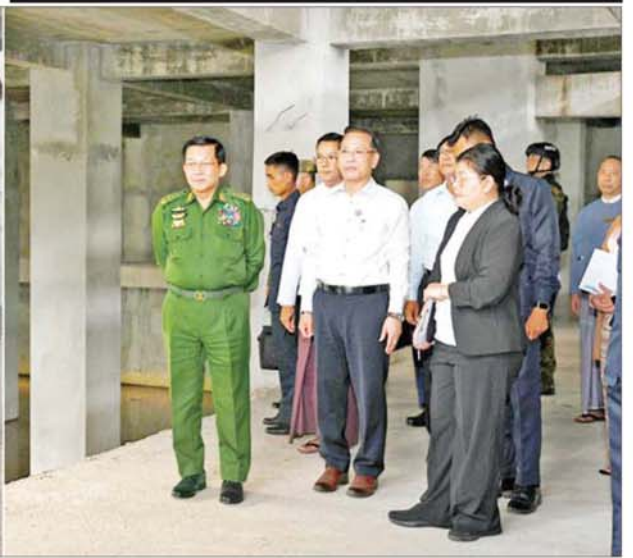
ပြည်ထောင်စုသမ္မတမြန်မာနိုင်ငံတော် ယာယီသမ္မတ နိုင်ငံတော်လုံခြုံရေးနှင့် အေးချမ်းသာယာရေးကော်မရှင်ဥက္ကဋ္ဌ ဗိုလ်ချုပ်မှူးကြီးမင်းအောင်လှိုင် နိုင်ငံတကာအဆင့်မီ အနုပညာဗဟိုဌာန(ရန်ကုန်) တည်ဆောက်ရေးလုပ်ငန်းခွင်အတွင်း ကြည့်ရှုစစ်ဆေးစဉ်။