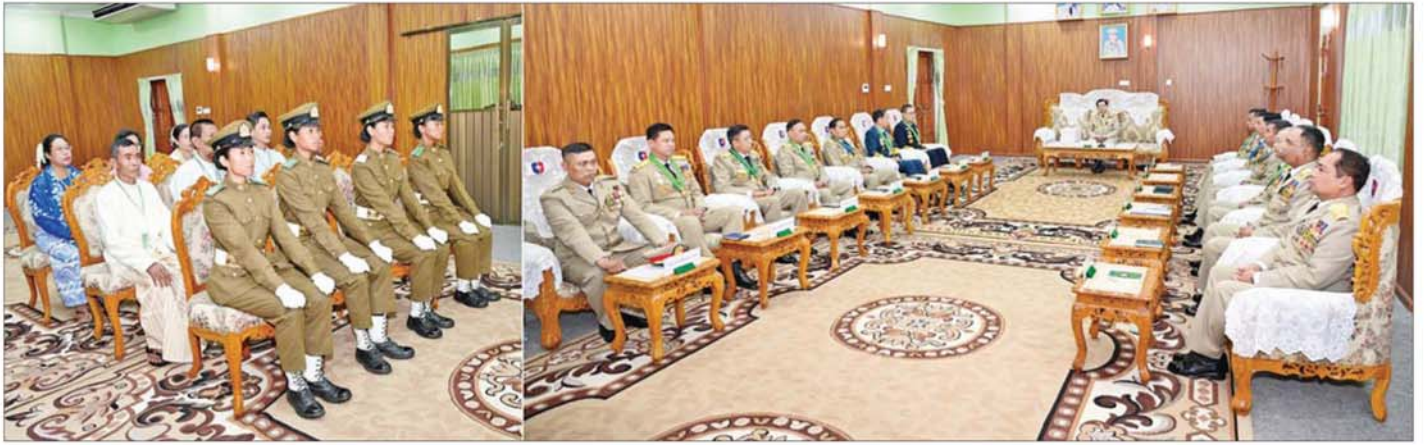
နိုင်ငံတော်လုံခြုံရေးနှင့် အေးချမ်းသာယာရေးကော်မရှင်ဥက္ကဋ္ဌ တပ်မတော်ကာကွယ်ရေးဦးစီးချုပ် ဗိုလ်ချုပ်မှူးကြီး သတိုးမဟာသရေစည်သူ သတိုးသီရိသုဓမ္မ မင်းအောင်လှိုင် ထူးချွန်ဆုရရှိကြသူများဖြစ်သည့် အကောင်းဆုံး ဗိုလ်လောင်းဆုရရှိသူ ဗိုလ်လောင်း ဆွေစင်ဖြိုးဝေ၊ သေနတ်ပစ်အကောင်းဆုံးဆုရ ဗိုလ်လောင်း သင်းကြူလှိုင်၊ စစ်ရေးပြအကောင်းဆုံးဆုရ ဗိုလ်လောင်း ယဉ်မင်းသန့်နှင့် ကြံ့ခိုင်ရေး အကောင်းဆုံးဆုရ ဗိုလ်လောင်း ခင်မြင့်မိုရ်ထွန်းတို့နှင့် ၎င်းတို့၏ မိဘဆွေမျိုးများအား တွေ့ဆုံ၍ ဂုဏ်ပြုအမှာစကားပြောကြားစဉ်။