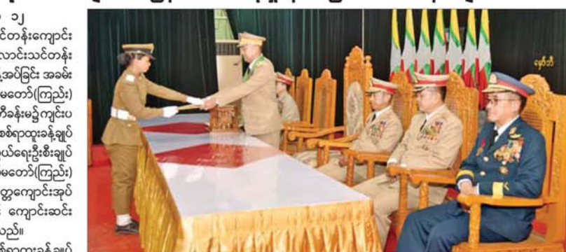
(မှော်ဘီ) ခေတ္တကျောင်းအုပ်ကြီးတို့သည် စင်မြင့်ထက်တွင် နေရာယူကြပြီး ဒုတိယဗိုလ်ချုပ်ကြီးထိန်ဝင်းက ကျောင်းဆင်းဗိုလ်လောင်း တစ်ဦးချင်းစီအား ပြန်တမ်းဝင်ခန့်အပ်လွှာများ ပေးအပ်သည်။

နေပြည်တော် ၃၊ ဇူလိုင် ၂၀၂၅ - တပ်မတော်(ကြည်း) ဗိုလ်သင်တန်းကျောင်း(မှော်ဘီ) ဘွဲ့ရအမျိုးသမီးဗိုလ်လောင်းသင်တန်းအမှတ်စဉ်(၁၂) ပြန်တမ်းဝင်အရာရှိခန့်အပ်ခြင်း အခမ်းအနားကို ယနေ့နံနက်ပိုင်းတွင် တပ်မတော်(ကြည်း) ဗိုလ်သင်တန်းကျောင်း(မှော်ဘီ) မြဝတီခန်းမ၌ ကျင်းပရာ ကာကွယ်ရေးဦးစီးချုပ်(ကြည်း) စစ်ရာထူးခန့်ချုပ် ဒုတိယဗိုလ်ချုပ်ကြီးထိန်ဝင်း၊ ကာကွယ်ရေးဦးစီးချုပ်မှူး တပ်မတော်အရာရှိကြီးများ၊ တပ်မတော်(ကြည်း) ဗိုလ်သင်တန်းကျောင်း(မှော်ဘီ) ခေတ္တကျောင်းအုပ်ကြီး ဗိုလ်မှူးကြီးသက်ဆွေဦးနှင့် ကျောင်းဆင်းဗိုလ်လောင်းများ တက်ရောက်ကြသည်။