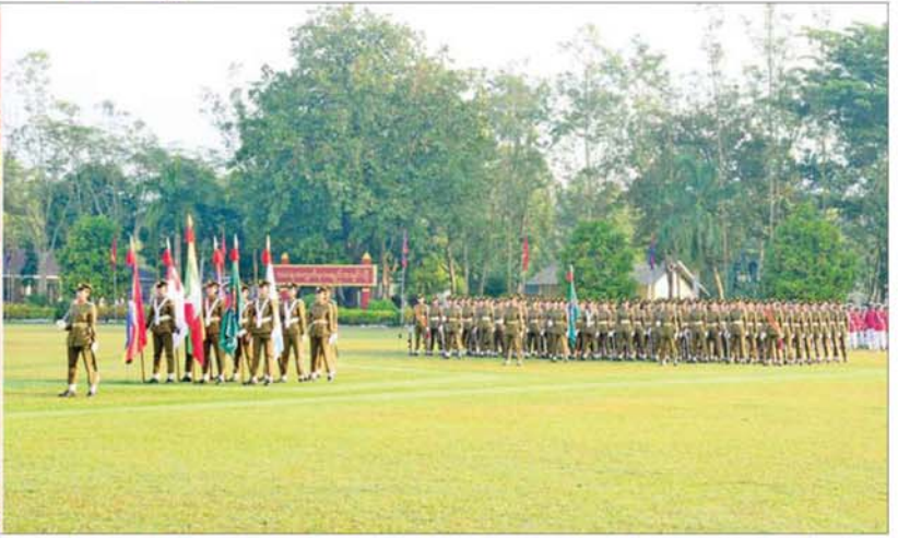
နိုင်ငံတော်လုံခြုံရေးနှင့် အေးချမ်းသာယာရေးကော်မရှင်ဥက္ကဋ္ဌ တပ်မတော်ကာကွယ်ရေးဦးစီးချုပ် ဗိုလ်ချုပ်မှူးကြီး သတိုးမဟာသရေစည်သူ သတိုးသီရိသုဓမ္မ မင်းအောင်လှိုင် ဘွဲ့ရအမျိုးသမီးဗိုလ်လောင်းသင်တန်းအမှတ်စဉ်(၁၂) သင်တန်းဆင်း ဂုဏ်ပြုစစ်ရေးပြအခမ်းအနားတွင် မိန့်ခွန်းပြောကြားစဉ်။

★ ရှေ့ဖုံးမှ ဦးစွာ နိုင်ငံတော်လုံခြုံရေးနှင့် အေးချမ်းသာယာရေး ကော်မရှင် ဥက္ကဋ္ဌ တပ်မတော် ကာကွယ်ရေး ဦးစီးချုပ် ဗိုလ်ချုပ်မှူးကြီး သတိုးမဟာသရေစည်သူ သတိုးသီရိသုဓမ္မ မင်းအောင်လှိုင်က ကျောင်းဆင်းဗိုလ်လောင်းတပ်ခွဲ၏ အလေးပြုခြင်းကိုခံယူပြီး ကျောင်းဆင်းဗိုလ်လောင်း တပ်ခွဲအား စစ်ဆေးသည်။ ထို့နောက် ကျောင်းဆင်းဗိုလ်လောင်းတပ်ခွဲက နိုင်ငံတော်လုံခြုံရေးနှင့် အေးချမ်းသာယာရေး ကော်မရှင်ဥက္ကဋ္ဌ တပ်မတော် ကာကွယ်ရေးဦးစီးချုပ် ဗိုလ်ချုပ်မှူးကြီး သတိုးမဟာသရေစည်သူ သတိုးသီရိသုဓမ္မ မင်းအောင်လှိုင်အား အနှေးလျှောက်အမြန်လျှောက်ဖြင့် ချီတက်အလေးပြုသည်။ ယင်းနောက် နိုင်ငံတော်လုံခြုံရေးနှင့် အေးချမ်းသာယာရေး ကော်မရှင်ဥက္ကဋ္ဌ တပ်မတော် ကာကွယ်ရေးဦးစီးချုပ် ဗိုလ်ချုပ်မှူးကြီး သတိုးမဟာသရေစည်သူ သတိုးသီရိသုဓမ္မ မင်းအောင်လှိုင်က တပ်မတော်(ကြည်း) ဗိုလ်သင်တန်းကျောင်း(မှော်ဘီ) ဘွဲ့ရ အမျိုးသမီး ဗိုလ်လောင်းသင်တန်း အမှတ်စဉ်(၁၂)မှ အကောင်းဆုံး ဗိုလ်လောင်းဆုရရှိသူ ဗိုလ်လောင်းဆွေဇင်ဖြူဝေ အား အကောင်းဆုံး ဗိုလ်လောင်းဆု ပေးအပ်ချီးမြှင့်