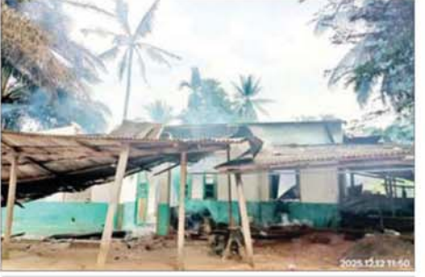
သစ်တောဦးစီးအရာရှိနေအိမ်အဆောက်အအုံ မီးလောင်ပျက်စီးမှု။