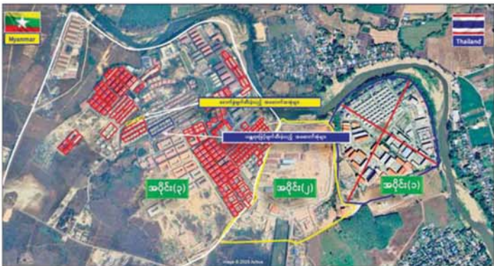
ကရင်ပြည်နယ် မြဝတီမြို့နယ်အတွင်း KK Park နယ်မြေအတွင်းရှိ တရားမဝင်အဆောက်အအုံများ အားဖောက်ခွဲ၊ ဖျက်ဆီး၊ ဖြိုချထားမှုကို တွေ့ရစဉ်။

မရှိစေရေးအတွက် လုံခြုံရေး တပ်ဖွဲ့ဝင်များ၊ အုပ်ချုပ်ရေး အဖွဲ့အစည်းများနှင့် ဒေသတွင်း တာဝန်ရှိသူများအပါအဝင် အဖွဲ့စုံ ပါဝင်သည့် ပူးပေါင်းအဖွဲ့ဖြင့် ဒီဇင်ဘာ ၈ ရက်မှစတင်၍ ရှာဖွေ ရှင်းလင်းဆောင်ရွက်ခဲ့ရာ ယနေ့ တွင်လည်း မြဝတီမြို့ အမှတ်(၅) ရပ်ကွက်အတွင်းရှိ အဆောက် အအုံ ၁၅ လုံးကို ထပ်မံစစ်ဆေးနိုင် ခဲ့ပြီး အဆိုပါအဆောက်အအုံများ အနက် လေးထပ်အဆောက် အအုံတစ်လုံးနှင့် ခြောက်ထပ် အဆောက်အအုံ တစ်လုံးတို့ အတွင်း၌ အွန်လိုင်းလိမ်လည် လောင်းကစားမှု ပြုလုပ်ရာတွင် အသုံးပြုသည့် ကွန်ပျူတာ ၅၅၀ နှင့်အတူ တရုတ်နိုင်ငံသား ၂၅၅ ဦး၊ ဗီယက်နမ်နိုင်ငံသား ၈၃ ဦး၊ မလေးရှားနိုင်ငံသား ကိုးဦး၊ ကင်ညာနိုင်ငံသား ၃၅ ဦး၊ အိသီယိုး ပီးယားနိုင်ငံသား ၁၂ ဦး၊ အင်ဒိုနီးရှား နိုင်ငံသား ၁၂ ဦး၊ ယူဂန်ဒါနိုင်ငံသား ၂၀၊ နီပေါနိုင်ငံသား ၁၇ ဦး၊ အိန္ဒိယ နိုင်ငံသားလေးဦး၊ ဖိလစ်ပိုင် နိုင်ငံသား ၇၇ ဦး၊ ဆီရီယာလီယွန် နိုင်ငံသား ၁၃ ဦး၊ ထိုင်းနိုင်ငံသား ၁၀ ဦး၊ မာဒါဂတ်စကာနိုင်ငံသား တစ်ဦး၊ တိုဂိုနိုင်ငံသားတစ်ဦး၊ အီဂျစ် တိုးရီးယား၊ ဂီနီနိုင်ငံသား နှစ်ဦး၊ တရုတ်(တိုင်ပေ)မှ နှစ်ဦး စုစုပေါင်း တရားမဝင်နိုင်ငံခြားသား ၅၁၆ ဦး တို့အား ဖော်ထုတ်ဖမ်းဆီးရမိခဲ့ ကြောင်း သိရပါသည်။ ထို့ပြင် မြဝတီမြို့နယ်အတွင်းရှိ KK Park နယ်မြေနှင့် ရွှေကုက္ကိုလ်