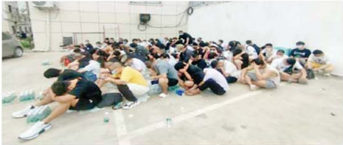
မြဝတီမြို့ အမှတ်(၅) ရပ်ကွက်အတွင်း၌ ဖမ်းဆီးရမိသည့် တရားမဝင်ပြည်ပနိုင်ငံသားများအား တွေ့ရစဉ်။