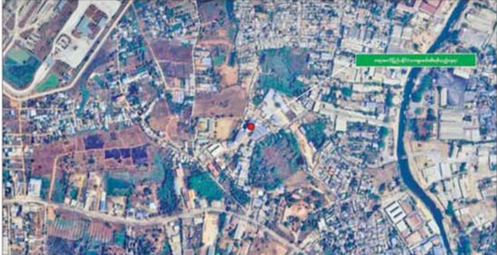
မြဝတီမြို့ အမှတ်(၅) ရပ်ကွက်အတွင်း၌ တရားမဝင်ပြည်ပနိုင်ငံသားများဖမ်းဆီးရမိသည့်နေရာပြမြေပုံ။

နယ်မြေတွင် အွန်လိုင်းလိမ်လည် လောင်းကစားမှု ကျူးလွန်ရာတွင် အသုံးပြုသည့် ပစ္စည်းများကို ထပ်မံဖြို အသုံးပြုခြင်းမရှိ စေရန်အတွက် ယနေ့တွင်လည်း စနစ်တကျ စီးရီးဖျက်ဆီးခဲ့ကြောင်း မြန်မာနိုင်ငံအတွင်း လုံးဝအခြေ သိရသည်။ နိုင်ငံတော် အစိုးရအနေဖြင့် အွန်လိုင်းလိမ်လည်လောင်းကစား မှုများအပြင် အိမ်နီးချင်းနိုင်ငံအစိုးရ များနှင့်လည်း ပေါင်းစပ်ညှိနှိုင်း၍ ဆက်လက် ဆောင်ရွက်သွားမည် ဖြစ်ကြောင်း သိရသည်။ သတင်းစဉ်