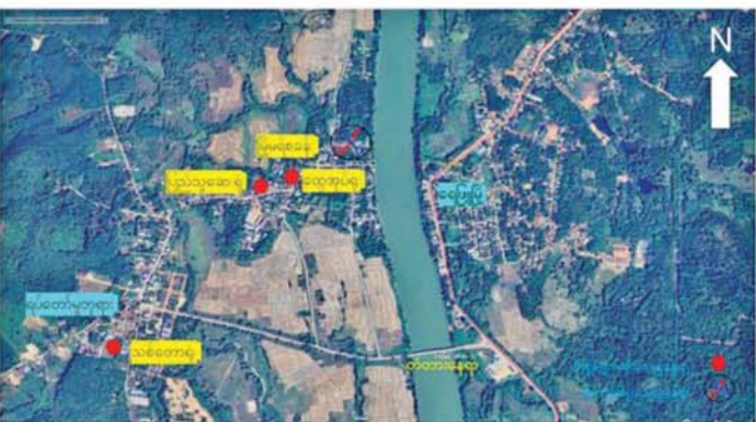
GNU နှင့် PDF အမည်ခံအကြမ်းဖက်သောင်းကျန်းသူများက ရေဖြူမြို့ရှိ ဌာနဆိုင်ရာအဆောက်အအုံများအား မီးရှို့ဖျက်ဆီးခဲ့သည့် ဖြစ်စဉ်နေရာပြပုံ။

ရောက်နိုင်ရေး ပူးပေါင်းအဖွဲ့နှစ်ဖွဲ့ဖြင့် နောင်ယုတ်ပစ်ခတ်၍ လည်းကောင်း၊ မြို့မရဲစခန်းအား သိမ်းပိုက်နိုင်ရေး ဆောင်ရွက်လာခဲ့ရာ မြို့မရဲစခန်းရှိ ရဲတပ်ဖွဲ့ဝင်များက ပြန်လည်ပစ်ခတ်ခြင်း၊ ရေဖြူမြို့၏အရှေ့တောင်ဘက်ရှိ လုံခြုံရေးတပ်ဖွဲ့ဝင်များက လက်နက်ကြီးပစ်ကူပေးခြင်းတို့ကြောင့် အကြမ်းဖက်သောင်းကျန်းသူအဖွဲ့များသည် မွန်းလွဲ ၁၂ နာရီခွဲခန့်တွင် မြို့၏မြောက်ဘက်သို့ ဆုတ်ခွာထွက်ပြေးသွားခဲ့သည်။