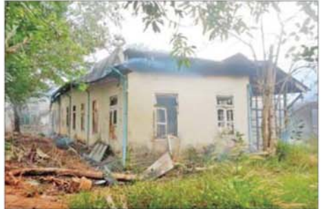
မြို့နယ်အထွေထွေအုပ်ချုပ်ရေးဦးစီးဌာနရုံး အဆောက်အအုံ မီးလောင်ပျက်စီးမှု။

ထိုသို့ ဆုတ်ခွာထွက်ပြေးသွားစဉ် လုံခြုံရေးတပ်ဖွဲ့ဝင်များက ၎င်းတို့၏နောက်သို့ ထက်ကြပ်လိုက်လံတိုက်ခိုက်ချမှန်းနိုင်ခြင်း မရှိစေရန်နှင့် တပ်မတော်အပေါ် ပြည်သူလူထုက အထင်အမြင်လွဲမှားစေရန်အတွက် ၎င်းတို့ ဆုတ်ခွာရာ လမ်းတစ်လျှောက်ရှိ ဌာနဆိုင်ရာ အဆောက်အအုံများဖြစ်သည့် အထွေထွေအုပ်ချုပ်ရေးမှူးရုံး၊ သစ်တောဦးစီးမှူးရုံး၊ စုပေါင်းဌာနဆိုင်ရာရုံး၊ ပြည်သူ့