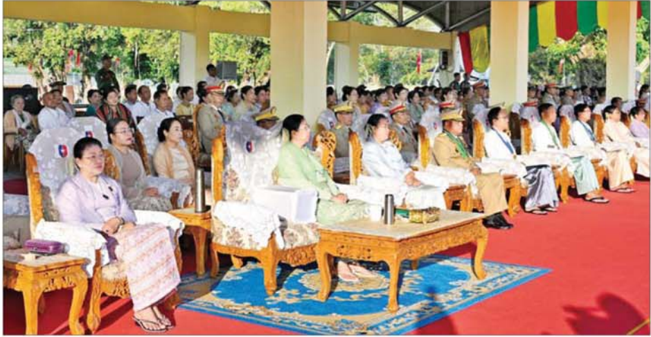
ဘွဲ့ရအမျိုးသမီးဗိုလ်လောင်းသင်တန်း အမှတ်စဉ်(၁၂) သင်တန်းဆင်း ဂုဏ်ပြုစစ်ရေးပြအခမ်းအနားသို့ တက်ရောက်လာကြသူများကို တွေ့ရစဉ်။

တိုင်းရင်းသားလက်နက်ကိုင် အဖွဲ့များသည် ပြင်ပမှ သွေးထိုးမှုများကြောင့် ငြိမ်းချမ်းရေးလမ်းကြောင်းပေါ်သို့ ရောက်ရှိလာခဲ့ခြင်း မရှိသည်ကိုလည်း တွေ့ရှိရကြောင်း၊ လက်နက်ကိုင် ပဋိပက္ခများကြောင့် ပညာရေး၊ ကျန်းမာရေးနှင့် စီးပွားရေးကဏ္ဍများတွင် အားနည်းချက်များ ဖြစ်ပေါ်ခဲ့ခြင်းကြောင့် မိမိတို့အနေဖြင့် တစ်နိုင်ငံလုံး ထာဝရငြိမ်းချမ်းရေးရရှိရန် ဆက်လက်ကြိုးပမ်း ဆောင်ရွက်သွားကြရမည်ဖြစ်ကြောင်း။ နိုင်ငံတော်ကို ဆန့်ကျင်တိုက်ခိုက်နေသည့် အဖွဲ့များအနေဖြင့် လက်နက်ကိုင် အကြမ်းဖက်တိုက်ခိုက်သည့် လမ်းစဉ်ကို စွန့်လွှတ်ကာ နိုင်ငံရေးပြဿနာကို နိုင်ငံရေးနည်းလမ်းဖြင့် ဖြေရှင်းကြရန် အချိန်တန်ပြန်ဖြစ်ကြောင်း၊ ထို့ကြောင့် အမျိုးသားကာကွယ်ရေးနှင့်လုံခြုံရေးကောင်စီအနေဖြင့် “ပြည်ထောင်စု အကျိုးအတွက် ထပ်မံဖိတ်ခေါ်ချက်” ဆိုသည့် ထုတ်ပြန်ချက်ကို ၂၀၂၅ ခုနှစ် စက်တင်ဘာ ၈ ရက်တွင် စာမျက်နှာ ၅ သို့ *