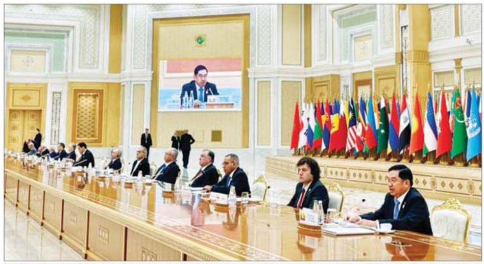
ပြည်ထောင်စုသမ္မတမြန်မာနိုင်ငံတော် နိုင်ငံတော်ဝန်ကြီးချုပ် ဦးညိုစော တာဝန်ခံနစ္စတန်နိုင်ငံ အက်ရှ်ဂါဘတ်မြို့၌ ကျင်းပသည့် အပြည်ပြည် ဆိုင်ရာ ငြိမ်းချမ်းရေးနှင့် ယုံကြည်မှုနှစ် အထိမ်းအမှတ် နိုင်ငံတကာဖိုရမ်သို့ တက်ရောက်စဉ်။

ဦးစွာ နိုင်ငံတော်ဝန်ကြီးချုပ် သည် တာဝန်ခံနစ္စတန်နိုင်ငံ၏ အမြဲတမ်းကြားနေမူဝါဒ နှစ် (၃၀) ပြည့်အထိမ်းအမှတ် ဂုဏ်ပြု ပန်းစည်းချ အခမ်းအနားသို့ ဖိတ်ကြားထားသည့် နိုင်ငံတကာမှ ခေါင်းဆောင်များ၊ ကုလသမဂ္ဂနှင့် နိုင်ငံတကာ အဖွဲ့အစည်းအသီးသီး မှ ကိုယ်စားလှယ်ခေါင်းဆောင် များ၊ ဖိတ်ကြားထားသည့် အပြည်ပြည်ဆိုင်ရာ ဝန်ကြီးချုပ် ဦးညိုစော တက်ရောက်သည်။