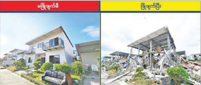
KK Park နယ်မြေ အပိုင်း(၃)တွင် တရားမဝင်ဆောက်လုပ်ထားသည့် နှစ်ထပ်လူနေအဆောက်အအုံ များအား မဖြိုဖျက်မီနှင့် ဖြိုဖျက်ပြီးနောက် တွေ့ရစဉ်။

နယ်မြေတွင် အွန်လိုင်းလိမ်လည် လောင်းကစားမှု ကျူးလွန်ရာတွင် အသုံးပြုသည့် ပစ္စည်းများကို ထပ်မံဖြို အသုံးပြုခြင်းမရှိ စေရန်အတွက် ယနေ့တွင်လည်း စနစ်တကျ စီးရီးဖျက်ဆီးခဲ့ကြောင်း မြန်မာနိုင်ငံအတွင်း လုံးဝအခြေ သိရသည်။ နိုင်ငံတော် အစိုးရအနေဖြင့် အွန်လိုင်းလိမ်လည်လောင်းကစား မှုများအပြင် အိမ်နီးချင်းနိုင်ငံအစိုးရ များနှင့်လည်း ပေါင်းစပ်ညှိနှိုင်း၍ ဆက်လက် ဆောင်ရွက်သွားမည် ဖြစ်ကြောင်း သိရသည်။ သတင်းစဉ်