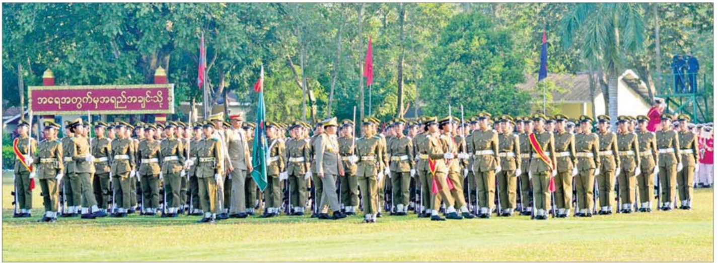
နိုင်ငံတော်လုံခြုံရေးနှင့် အေးချမ်းသာယာရေးကော်မရှင်ဥက္ကဋ္ဌ တပ်မတော်ကာကွယ်ရေးဦးစီးချုပ် ဗိုလ်ချုပ်မှူးကြီး သတိုးမဟာသရစည်သူ သတိုးသီရိသုဓမ္မ မင်းအောင်လှိုင် ကျောင်းဆင်းဗိုလ်လောင်းတပ်ခွဲ အား စစ်ဆေးစဉ်။

★ စာမျက်နှာ ၃ မှ တပ်မတော်၏ အဓိကလုပ်ငန်းကြီး(၃)ခုမှာ “ပြည်သူ့အကျိုးပြု လုပ်ငန်း တာဝန်” ဆိုသည့်အချက်ကို ဖော်ပြထားခြင်းကြောင့် ယင်းအချက်ကို လက်တွေ့ ဆောင်ရွက်ပေးခြင်းအားဖြင့် ပြည်သူလူထုကို စည်းရုံးပြီးသားဖြစ်စေကြောင်း၊ ထို့ကြောင့် ကျောင်းဆင်းအမျိုးသမီးအရာရှိများ အနေဖြင့် “တပ်နှင့်ပြည်သူ့ မြကြည်ဖြူ တယ်သူခွဲခွဲတို့မကွဲ အမြဲစည်းလုံးမည်” ဆိုသည့် အချက်ကို ကောင်းစွာနားလည် သဘောပေါက် ပြီးကုန်လျှင် ခိုင်မာသည့် တပ်တွင်း၊ တပ်ပြင်စည်းရုံးရေးကို ဆက်လက် တည်ဆောက်ကြရမည်ဖြစ်သည်ကို တိုက်တွန်းပြောကြားလိုကြောင်း။ ဖွဲ့စည်းပုံ အခြေခံဥပဒေဆိုင်ရာ သည်မှာ တိုင်းပြည်တစ်ပြည် အတွက် မရှိမဖြစ်လိုအပ်သည့် ဥပဒေဖြစ်ပြီး နိုင်ငံတစ်နိုင်ငံကို မည်သည့်ဝါဒဖြင့် အုပ်ချုပ်မည်၊ မည်သည့်စနစ်ဖြင့် မောင်းနှင်မည်၊ အုပ်ချုပ်ရေးအာဏာ၊ တရားစီရင်ရေးအာဏာနှင့် ဥပဒေပြုရေးအာဏာကို မည်သို့မည်ပုံခွဲဝေ