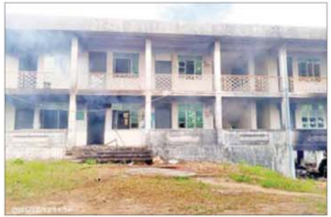
မြို့နယ်စုပေါင်းရုံး အဆောက်အအုံ မီးလောင်ပျက်စီးမှု။

ဆောင်ရွက်လျက်ရှိပြီး လုံခြုံရေးတပ်ဖွဲ့ဝင်များက အဆိုပါဆုတ်ခွာထွက်ပြေးသွားခဲ့သည့် PDF အမည်ခံအကြမ်းဖက်သောင်းကျန်းသူများအား လိုက်လံချေမှုန်းကာ လိုအပ်သည့် နယ်မြေလုံခြုံရေးလုပ်ငန်းများ ဆက်လက်ဆောင်ရွက်လျက်ရှိကြောင်း သိရသည်။ သတင်းစဉ်