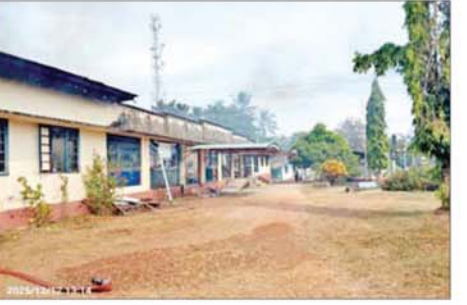
မြို့နယ်ဆေးရုံ(အဟောင်း)အဆောက်အအုံ မီးလောင်ပျက်စီးမှု။