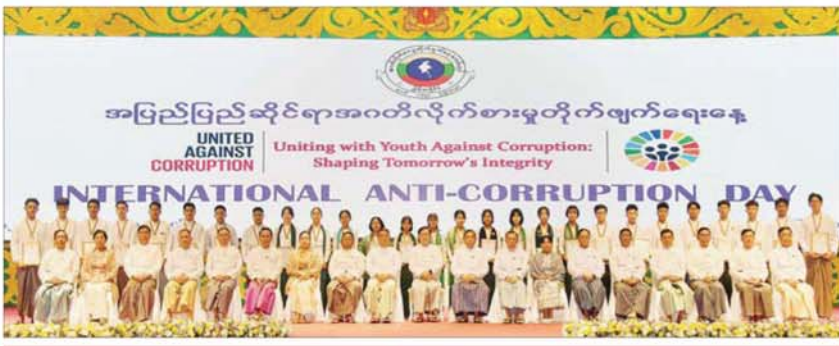
အမျိုးသားကာကွယ်ရေးနှင့် လုံခြုံရေးကောင်စီရုံး အမှုဆောင်ချုပ် ဦးအောင်လင်းဒွေး အခမ်းအနားသို့ တက်ရောက်လာကြသူများ နှင့်အတူ စုပေါင်းမှတ်တမ်းတင်ဓာတ်ပုံရိုက်စဉ်။

Video Message ကို ပြသ ဦးစွာ ပြည်ထောင်စုသမ္မတမြန်မာ နိုင်ငံတော်ယာယီသမ္မတ နိုင်ငံတော်လုံခြုံ ရေးနှင့် အေးချမ်းသာယာရေးကော်မရှင် ဥက္ကဋ္ဌ ဗိုလ်ချုပ်မှူးကြီး မင်းအောင်လှိုင်က အပြည်ပြည်ဆိုင်ရာ အဂတိလိုက်စားမှု တိုက်ဖျက်ရေးနေ့ အထိမ်းအမှတ် အခမ်း အနားအတွက် ပေးပို့သည့် Video Message ကို ပြသသည်။ (နိုင်ငံတော်ယာယီသမ္မတ နိုင်ငံတော် လုံခြုံရေးနှင့် အေးချမ်းသာယာရေး