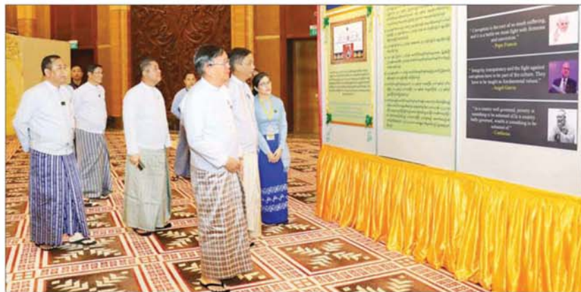
အမျိုးသားကာကွယ်ရေးနှင့် လုံခြုံရေးကောင်စီမှ အမှုဆောင်ချုပ် ဦးအောင်လင်းဒွေးနှင့်အဖွဲ့ဝင်များ အဂတိလိုက်စားမှု တိုက်ဖျက်ရေးလှုပ်ရှားမှု မှတ်တမ်းဓာတ်ပုံများကို လှည့်လည်ကြည့်ရှုစဉ်။