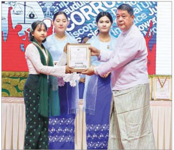
ပြည်ထောင်စုတရားသူကြီးချုပ် ဦးသာဌေး အဂတိလိုက်စားမှုတိုက်ဖျက်ရေး ဆိုင်ရာ အသိပညာပေးဝီစတာပြိုင်ပွဲ အသက်အုပ်စုအလိုက်ပြိုင်ပွဲတွင် ပထမဆု ရရှိသူအား ဂုဏ်ပြုဆုတံဆိပ်၊ ဂုဏ်ပြုမှတ်တမ်းလွှာနှင့် ဂုဏ်ပြုဆုငွေများ ပေးအပ် ချီးမြှင့်စဉ်။

ပေးအပ်ချီးမြှင့် ထိုနောက်ပြည်ထောင်စုတရားသူကြီး ချုပ်ဦးသာဌေးက အဂတိလိုက်စားမှုတိုက် ဖျက်ရေးဆိုင်ရာ အသိပညာပေးဝီစတာ ပြိုင်ပွဲတွင် အသက်အုပ်စုအလိုက် ပထမ၊ ဒုတိယနှင့် တတိယဆုရရှိကြသူများကို လည်းကောင်း၊ ကော်မရှင်ဥက္ကဋ္ဌက အဂတိလိုက်စားမှု တိုက်ဖျက်ရေးဆိုင်ရာ အသိပညာပေးပန်းချီပြိုင်ပွဲတွင် အသက် အုပ်စုအလိုက် ပထမ၊ ဒုတိယနှင့် တတိယ ဆုရရှိကြသူများကိုလည်းကောင်း၊ ဂုဏ်ပြု ဆုတံဆိပ်၊ ဂုဏ်ပြုမှတ်တမ်းလွှာနှင့် ဂုဏ်ပြုဆုငွေများ ပေးအပ်ချီးမြှင့်ကြ သည်။