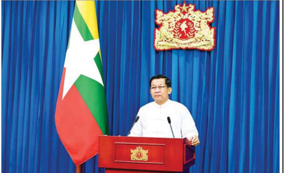
စာမျက်နှာ ၃ သို့ ❖

အားလုံး မင်္ဂလာပါ။ ယနေ့ ဒီဇင်ဘာလ ၉ ရက်နေ့မှာကျရောက်တဲ့ အပြည်ပြည်ဆိုင်ရာ အဂတိလိုက်စားမှုတိုက်ဖျက်ရေးနေ့ အထိမ်းအမှတ်အခမ်းအနားကို တက်ရောက်လာကြတဲ့ ပြည်ထောင်စုအဆင့် တာဝန်ရှိပုဂ္ဂိုလ်များ၊ တိုင်းဒေသကြီးနဲ့ ပြည်နယ်အစိုးရအဖွဲ့ ဝန်ကြီးချုပ်များ၊ အထူးဖိတ်ကြားထားတဲ့ ဧည့်သည်တော်များအားလုံး ကိုယ်စိတ်နှစ်ဖြာ ကျန်းမာချမ်းသာကြပါစေကြောင်း ဆုမွန်ကောင်းတောင်းရင်း နှုတ်ခွန်းဆက်သအပ်ပါတယ်။ နိုင်ငံတော်ဖွံ့ဖြိုးတိုးတက်ဖို့အတွက် ပြုပြင်ပြောင်းလဲရေးနဲ့ တည်ဆောက်ရေးလုပ်ငန်းတွေဆောင်ရွက်ရာမှာ အဂတိလိုက်စားမှု ပြဿနာဟာ ကြီးမားတဲ့အဟန့်အတား ဖြစ်ပါတယ်။ မိမိတို့အစိုးရအနေနဲ့ အမျိုးသားအကျိုးစီးပွားကို အလေးထားပြီး စစ်မှန်စည်းကမ်းပြည့်ဝတဲ့ ဒီမိုကရေစီနိုင်ငံတော်ကို တည်ဆောက်ရာမှာ တာဝန်ယူမှု၊ တာဝန်ခံမှု၊ ပွင့်လင်းမြင်သာမှု၊ ဖြောင့်မတ်တည်ကြည်မှု၊ မျှတမှု၊ တရားဥပဒေစိုးမိုးမှု စတဲ့ကောင်းမြတ်တဲ့အလေ့အထတွေ ပိုမိုဖြင့်မားလာစေရေးကို မျှော်မှန်းပြီး အဂတိလိုက်စားမှုတိုက်ဖျက်ရေးလုပ်ငန်းများကို နိုင်ငံရေးစိတ်ဆန္ဒပြင်းပြစွာနဲ့ အားသွန်ခွန်စိုက် ကြိုးပမ်းဆောင်ရွက်လျက်ရှိပါတယ်။