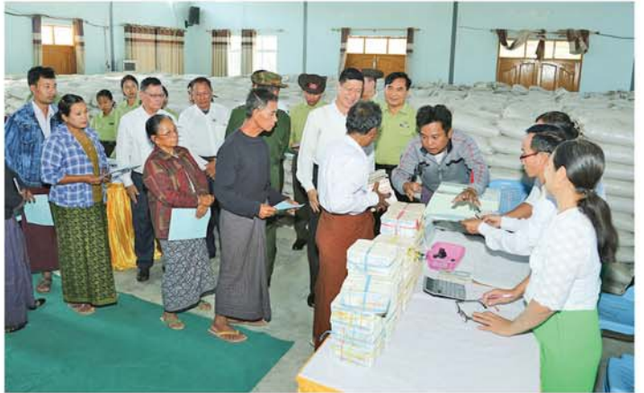
မန္တလေး ဒီဇင်ဘာ ၉

အမျိုးသားသဘာဝဘေးအန္တရာယ်ဆိုင်ရာ စီမံခန့်ခွဲမှုကော်မတီက ထောက်ပံ့သည့် မန္တလေးငလျင်ကြီးကြောင့် မန္တလေးတိုင်းဒေသကြီးအတွင်း တစ်စိတ်တစ်ပိုင်းနှင့် လုံးဝပျက်စီးခဲ့သည့် နေအိမ်များနှင့် တိုက်ခံအိမ်များအတွက် ဆောက်လုပ်ရေးသုံးပစ္စည်းများ၊ လူသေဆုံးသူများ၏ မိသားစုဝင်များအတွက် ထောက်ပံ့ငွေများ ပေးအပ်လျက်ရှိသည်။