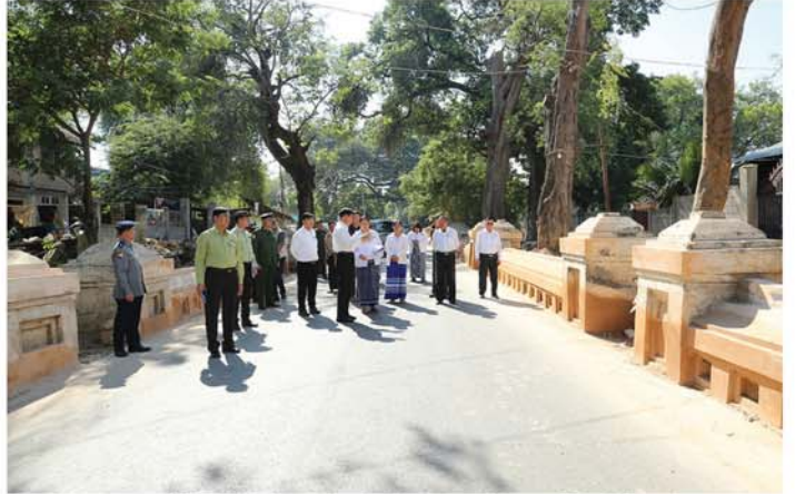
ဘုရားကြီးအား ဖူးမြော်ကြည့်ည့်၍ လိုက်လံကြည့်ရှုကာ တိုင်းဒေသကြီးဝန်ကြီးချုပ်က မန္တလေး ငလျင်ကြောင့် ထိခိုက်ပျက်စီးမှုများအား ပြန်လည်ပြုပြင်မွမ်းမံခြင်းလုပ်ငန်းများ အမြန်ဆုံးဆောင် ရွက်သွားနိုင်ရေး တာဝန်ရှိသူများအားမှာကြားပြီး လိုအပ်သည်များကို ပေါင်းစပ်ညှိနှိုင်းဖြည့်ဆည်း ဆောင်ရွက်ပေးခဲ့ကြောင်း သိရသည်။ (မန္တလေးနေ့စဉ်)

ဆက်လက်၍ အင်းဝမြို့ဟောင်းရှိ လောကသရဖူစေတီတော်ကြီးသို့ ရောက်ရှိပြီး လောကသရဖူ