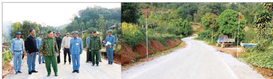
နိုင်ငံတော်လုံခြုံရေးနှင့် အေးချမ်းသာယာရေးကော်မရှင်အဖွဲ့ဝင် ပြည်ထောင်စုဝန်ကြီး ဒုတိယဗိုလ်ချုပ်ကြီး ရာပြည့် ဟိုပုံးမြို့နယ် ဟေ့ရှေ ခေါက်-ဒုံလီတန်ကျေးရွာချင်းဆက် ၁၂ မိုင် ၂ ဟာလုံ အနက် ၄ ဟာလုံ ကတ္တရာခင်းခြင်းလုပ်ငန်းကို ကြည့်ရှုစစ်ဆေးစဉ်။

ကွန်ကရစ်ခင်းခြင်း လုပ်ငန်း ဆောင်ရွက်နေမှုကို ကြည့်ရှု စစ်ဆေးပြီး သတ်မှတ်ခန့်ခွဲချိန်ညွှန်း အရည်အသွေး ပြည့်စုံရေးနှင့် ရေစီးရေလာ ကောင်းမွန်စေရေး အတွက် ရေနုတ်မြောင်းများ စနစ်တကျတူးဖော်ရန်မှာ ကြားပြီး ဒေသခံတိုင်းရင်းသားပြည်သူများ ၏ တင်ပြချက်များအပေါ် ညှိနှိုင်း ပြည့်ဆည်းဆောင်ရွက်ပေးသည်။ ယင်းနောက် ပင်လုံမြို့ရှိ လှိုင်လင်-လဲချား လမ်းမကြီးမှ မေတ္တာအေးရိပ်ဘုန်းတော်ကြီးသင် ပရဟိတ ပညာရေးကျောင်းသို့ ဆက်သွယ်ထားရှိသည့် ကျောက် ချောလမ်း တစ်မိုင် ကွန်ကရစ်လမ်း အဖြစ် အဆင့်မြှင့်တင်ဆောင်ရွက် နေမှုကို ကြည့်ရှုစစ်ဆေးပြီး လိုအပ်သည်များကို မှာကြားကာ ပင်လုံမြို့ ကျက်သရေဆောင် မဟာရဋ္ဌဘိဝံသမဂ္ဂ စေတီတော် မြတ်ကြီးအား ဖူးမြော်ကြည့်ညိ၍ နယ်စပ်ရေးရာ ဝန်ကြီးဌာနမှ တာဝန်ယူ ဆောင်ရွက်နေသည့် စေတီတော် ရင်ပြင်ပတ်လမ်း