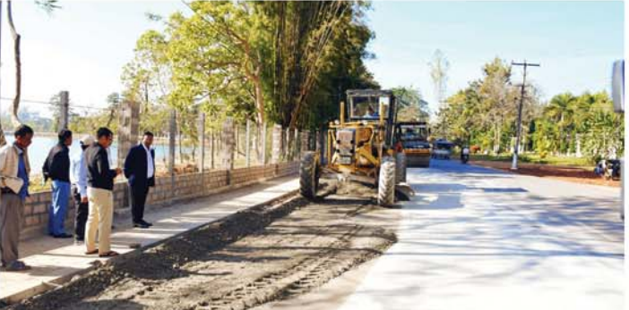
အဓိကလမ်းမကြီးများ ဘေး ဝဲ၊ ယာတွင် ရောင်စုံပန်းအလှစိုက်ခင်းများ ဆောင်ရွက်ပြီးစီးမှု၊ သန့်ရှင်းသာယာလှပရေး လုပ်ငန်းများ ဆောင်ရွက်ပြီးစီးမှုနှင့် သန့်ရှင်းကြောင်း သိရသည်။ (မန္တလေးနေ့စဉ်) ၀-၀-၀-၀-၀ ၀-၀-၀-၀-၀-၀

အန္တရာယ်ကင်းရှင်းရေး၊ လမ်းပိတ်ဆိုမှုမဖြစ်စေရေးအတွက် လမ်းတိုးချဲ့ခြင်းလုပ်ငန်းအား အမြန်ဆုံးပြီးစီးအောင် ဆောင်ရွက်ရေးကိစ္စရပ်များကို ကုမ္ပဏီတာဝန်ခံ အင်ဂျင်နီယာနှင့် အဖွဲ့အား ဖြည့်စွက်မှာကြားပြီး နောက် စက်ယန္တရားများ အသုံးပြု၍ အခြေခံမြေလွှာ ကျစ်လျစ်မာကျောစေရန် ကျောက်ရောမြေအား ရေဖျန်းစက်ကြိတ်ခြင်း လုပ်ငန်းဆောင်ရွက်နေမှုကို ကြည့်ရှုစစ်ဆေးခဲ့သည်။ ဆက်လက်၍ မြို့တော်ဝန်နှင့် အဖွဲ့သည် ပြင်ဦးလွင်မြို့တွင်