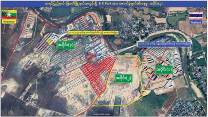
ကရင်ပြည်နယ် မြဝတီမြို့နယ်အတွင်းရှိ KK Park အား ဖောက်ခွဲဖျက်ဆီးနေမှု အပိုင်း(၃)။

တစ်ထပ်အဆောက်အအုံ လေးလုံး၊ နှစ်ထပ်အဆောက်အအုံ ၆၃ လုံး၊ သုံးထပ်အဆောက်အအုံ ၁၇ လုံး၊ လေးထပ်အဆောက်အအုံ သုံးလုံး၊ ငါးထပ်အဆောက်အအုံ လေးလုံး၊ ခြောက်ထပ် အဆောက်အအုံ တစ်လုံး၊ ခုနစ်ထပ်အဆောက်အအုံ နှစ်လုံး၊ ကိုးထပ်အဆောက်အအုံ နှစ်လုံး၊ ၁၆ ထပ် အဆောက်အအုံ တစ်လုံးနှင့် ၁၉ ထပ်အဆောက် အအုံတစ်လုံး စုစုပေါင်းတရားမဝင် အဆောက်အအုံ ၉၈ လုံးတို့ကို ထပ်မံစစ်ဆေးခဲ့ရာ အွန်လိုင်း လိမ်လည်မှုနှင့် လောင်းကစားမှု လုပ်ငန်းများ လုပ်ကိုင်နေသူများ ကို တွေ့ရှိရခြင်းမရှိဘဲ လုပ်ငန်း လုပ်ဆောင်ရာတွင် အသုံးပြုသည့် ပစ္စည်းများကိုလည်း တစ်ပါတည်း ပြုတ်သိမ်း ယူဆောင်သွားခဲ့ ကြောင်း သိရှိရသည်။ ထို့ပြင် ရွှေကုက္ကိုလ်နယ်မြေ အတွင်း အွန်လိုင်းလိမ်လည်မှုများ လုပ်ဆောင်ရာတွင် အသုံးပြုခဲ့ သည့် အဆောက်အအုံများအား နိုဝင်ဘာ ၁၈ ရက်မှ စတင်စစ်ဆေး ခဲ့ရာ ယနေ့အထိ တရားမဝင်