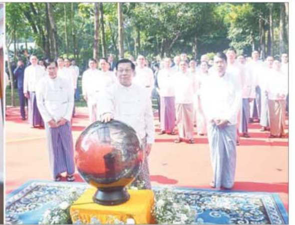
ပြည်ထောင်စုသမ္မတမြန်မာနိုင်ငံတော် ယာယီသမ္မတ နိုင်ငံတော်လုံခြုံရေးနှင့် အေးချမ်းသာယာရေးကော်မရှင်ဥက္ကဋ္ဌ ဗိုလ်ချုပ်မှူးကြီး မင်းအောင်လှိုင် အာကာသပြတိုက်(ရန်ကုန်)ဆိုင်ဘုတ်အား စက်လှေတံတိုက်၍ ဖွင့်လှစ်ပေးစဉ်။

အရှေ့တိုင်းဒေသကြီး ဦးစွာ နိုင်ငံတော်ယာယီသမ္မတ နိုင်ငံတော်လုံခြုံရေးနှင့် အေးချမ်းသာယာရေးကော်မရှင်ဥက္ကဋ္ဌသည် ဖွင့်ပွဲအခမ်းအနား ကျင်းပပြုလုပ်မည့်နေရာသို့ ရောက်ရှိကြရာ နိုင်ငံတကာသံတမန်များ၊ တာဝန်ရှိသူများနှင့် ကျောင်းသားကျောင်းသူများက ခရီးဦးကြိုဆို နှုတ်ဆက်ကြသည်။