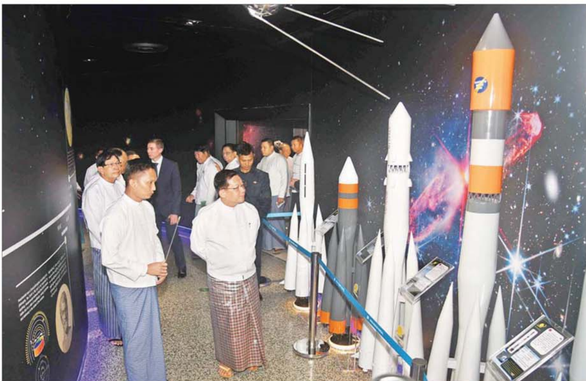
ပြည်ထောင်စုသမ္မတမြန်မာနိုင်ငံတော် ယာယီသမ္မတ နိုင်ငံတော်လုံခြုံရေးနှင့် အေးချမ်းသာယာရေးကော်မရှင်ဥက္ကဋ္ဌ ဗိုလ်ချုပ်မှူးကြီး မင်းအောင်လှိုင် ရှာဖွေ၊ တရုတ်၊ အိန္ဒိယနှင့် အမေရိကန်နိုင်ငံတို့မှ အာကာသအတွင်းသို့ ခေတ်အဆက်ဆက်လွှတ်တင်ခဲ့သည့် ခုံးပျံများနှင့် အာကာသယာဉ်ပုံစံငယ်များအား လိုက်လံကြည့်ရှုစဉ်။

နေပြည်တော် နိုဝင်ဘာ ၃၀ ရန်ကုန်မြို့၊ ပြည်သူ့ရင်ပြင်ရှိ အာကာသပြတိုက်(ရန်ကုန်)ဖွင့်ပွဲ အခမ်းအနားအား ယနေ့နံနက် ပိုင်းတွင် ကျင်းပပြုလုပ်ရာ ပြည်ထောင်စုသမ္မတ မြန်မာနိုင်ငံ တော် ယာယီသမ္မတ နိုင်ငံတော် လုံခြုံရေးနှင့်အေးချမ်းသာယာရေး ကော်မရှင်ဥက္ကဋ္ဌ ဗိုလ်ချုပ်မှူးကြီး မင်းအောင်လှိုင် တက်ရောက် ဖွင့်လှစ်ပေးသည်။