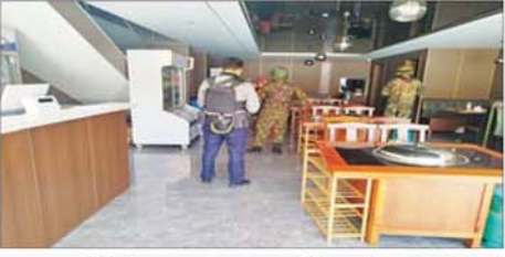
တရားမဝင်နိုင်ငံခြားသားများ ထားရှိနိုင်သည့် သုံးထပ်တိုက် အဆောက်အအုံကို ဝင်ရောက်ရှင်းလင်းစဉ်။