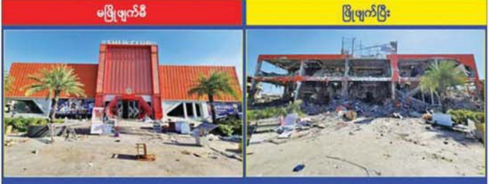
KK Park နယ်မြေအပိုင်း(၃)တွင် တရားမဝင်ဆောက်လုပ်ထားသည့် နှစ်ထပ်နိုက်ကလပ်အဆောက်အအုံ။

အဆောက်အအုံ အလုံး ၁၄၀ ကို စစ်ဆေးတွေ့ရှိရပြီး အဆိုပါ အဆောက်အအုံများကို ပြန်လည် အသုံးပြုမရီစေရေး အတွက် သိမ်းဆည်း ချိပ်ပိတ်ခြင်းများ ကို ဆက်လက်ဆောင်ရွက်လျက် ရှိရာ ယနေ့တွင် တရားမဝင် အဆောက်အအုံ ၁၈ လုံးကို ထပ်မံ ချိပ်ပိတ် သိမ်းဆည်းနိုင်ခဲ့ပြီး တရားမဝင်အဆောက်အအုံ စုစု ပေါင်း ၁၁၉ လုံး ချိပ်ပိတ်သိမ်းဆည်း ပြီးဖြစ်ကြောင်း သိရှိရသည်။ ရွှေကုက္ကိုလ် နယ်မြေအတွင်း စုစုပေါင်း ဖော်ထုတ်ရှင်းလင်းမှု များအရ ယနေ့အထိ မြန်မာနိုင်ငံ အတွင်းသို့ တရားမဝင် ဝင်ရောက် နေထိုင်သည့် ပြည်ပနိုင်ငံသား စုစုပေါင်း ၁၉၄၅ ဦးနှင့် အွန်လိုင်း လိမ်လည် လောင်းကစားမှု ကျူးလွန်ရာတွင် အသုံးပြုသည့်