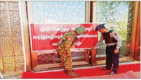
အွန်လိုင်းလိမ်လည်မှုများ ဆောင်ရွက်ရာတွင် အသုံးပြုခဲ့သည့် အဆောက်အအုံများကို ချိပ်ပိတ်သိမ်းဆည်းမှု မှတ်တမ်းပုံ။

နေပြည်တော် နိုဝင်ဘာ ၃၀ မြန်မာနိုင်ငံ အစိုးရအနေဖြင့် အွန်လိုင်း လိမ်လည်မှုများနှင့် အွန်လိုင်း လောင်းကစားမှုများ အများဆုံးအခြေချလုပ်ကိုင်လျက် ရှိကြသည့် ရွှေကုက္ကိုလ်နယ်မြေနှင့် KK Park နယ်မြေများ၌ လုံခြုံရေး တပ်ဖွဲ့ဝင်များ အုပ်ချုပ်ရေးအဖွဲ့ အစည်းများနှင့် ဒေသတွင်း တာဝန်ရှိသူများအပါအဝင် အဖွဲ့စုံ ပါဝင်သည့် ပူးပေါင်းအဖွဲ့ဖြင့် တရားမဝင် အဆောက်အအုံများ အတွင်း ဝင်ရောက်ရှင်းလင်းခြင်း၊ အွန်လိုင်းလိမ်လည်လောင်းကစား မှု လုပ်ငန်းစဉ်များတွင် အသုံးပြု ခဲ့သည့် သိမ်းဆည်းရမိပစ္စည်းများ နှင့် တရားမဝင် အဆောက်အအုံ များအား စနစ်တကျဖြိုချုတ်ဆီး ခြင်းများ ဆက်လက်ဆောင်ရွက် လျက်ရှိသည်။