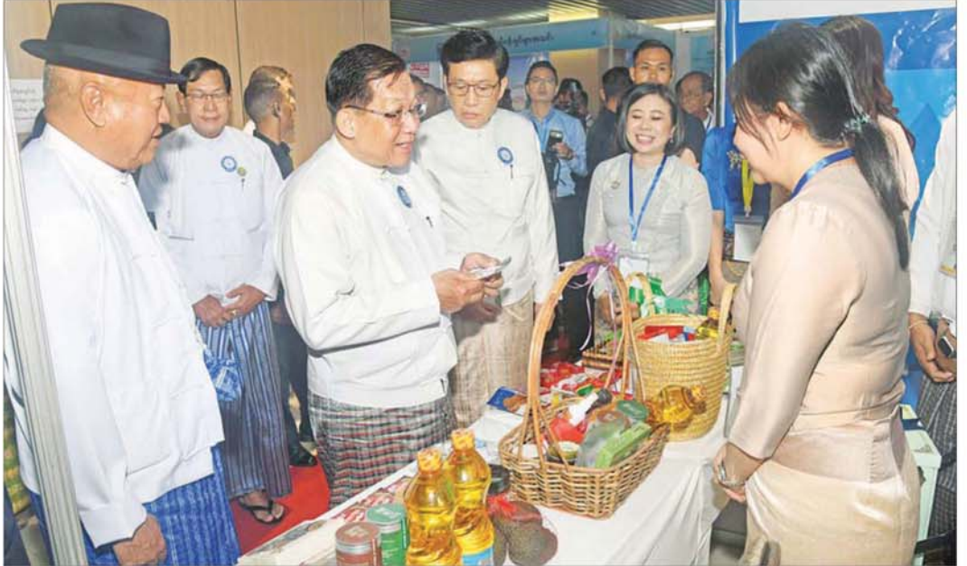
ပြည်ထောင်စုသမ္မတမြန်မာနိုင်ငံတော် ယာယီသမ္မတ နိုင်ငံတော်လုံခြုံရေးနှင့် အေးချမ်းသာယာရေးကော်မရှင်ဥက္ကဋ္ဌ ဗိုလ်ချုပ်မှူးကြီး မင်းအောင်လှိုင် ပြခန်းတစ်ခုချင်းစီအလိုက် လိုက်လံကြည့်ရှုအားပေးစဉ်။

ယနေ့ကျင်းပသည့် ကုန်သည်များနှင့် စက်မှု လက်မှုလုပ်ငန်းရှင်များ အသင်းချုပ်၏ (၃၄) ကြိမ် မြောက် နှစ်ပတ်လည်မူပိုင် ရွှေ့ရာ၊ စိန်ရတနာ၊ နှစ်ပေါင်းများစွာတိုင် နိုင်ငံစီးပွားတိုးတက်ရေးနှင့် တိုင်းပြည်သယံဇာတပြောရေးတို့အတွက် နိုင်ငံတော် နှင့် လက်တွဲပြီး ဆက်လက်တိုးဝန်းကြိုးပမ်း ဆောင်ရွက်သွားကြရန်၊ ပုဂ္ဂလိကကဏ္ဍ တောင်တင်း နိုင်ငံမာဖွံ့ဖြိုးပြီး နိုင်ငံတော်ဖွံ့ဖြိုးတိုးတက်မှုကို ဆတက်ထမ်းပိုး အထောက်အကူပြုဆောင်ရွက်