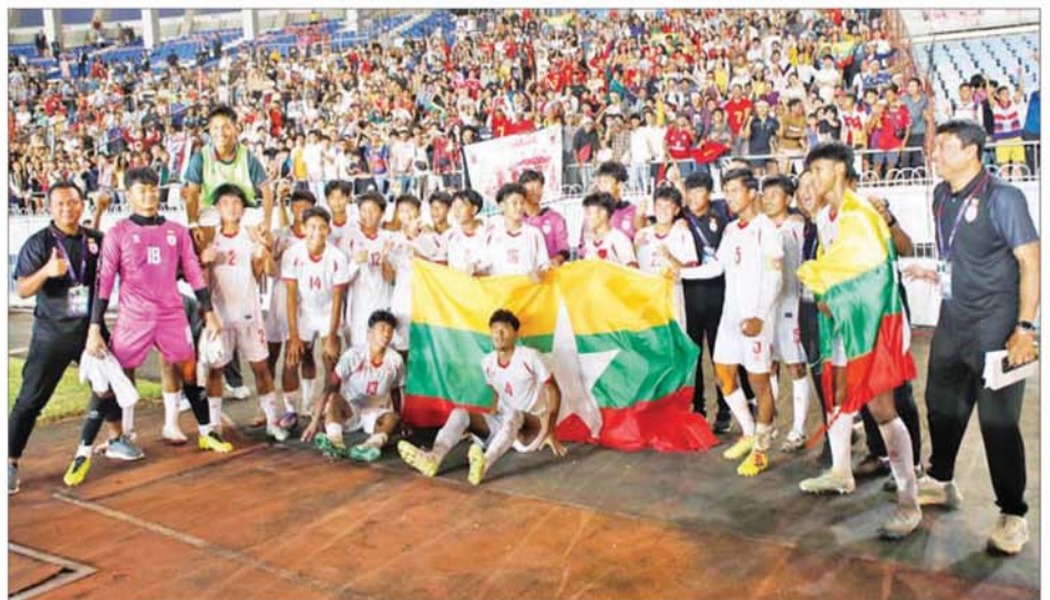
၂၀၂၆ ခုနှစ် အာရှဖလားခြေစစ်ပွဲ အောင်မြင်ခဲ့သည့် မြန်မာ U-17 အမျိုးသားဘောလုံးအသင်း အောင်ပွဲစဉ်။