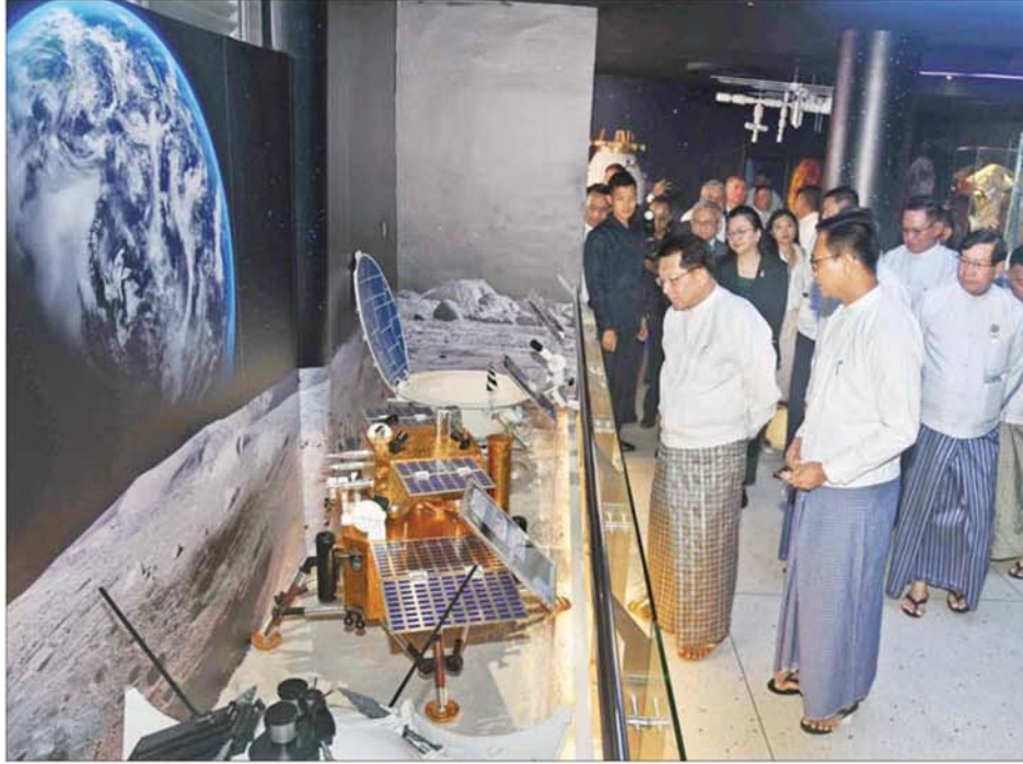
ပြည်ထောင်စုသမ္မတမြန်မာနိုင်ငံတော် ယာယီသမ္မတ နိုင်ငံတော်လုံခြုံရေးနှင့် အေးချမ်းသာယာရေးကော်မရှင်ဥက္ကဋ္ဌ ဗိုလ်ချုပ်မှူးကြီး မင်းအောင်လှိုင် အာကာသပြတိုက်(ရန်ကုန်)အတွင်း ပြသထားမှုများကို လိုက်လံကြည့်ရှုစဉ်။

က အာကာသပြတိုက်(ရန်ကုန်) ဧည့်သည်တော် မှတ်တမ်းစာအုပ် တွင် မှတ်တမ်းတင်လက်မှတ် ရေးထိုးကြသည်။