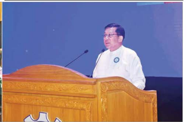
ပြည်ထောင်စုသမ္မတမြန်မာနိုင်ငံတော် ယာယီသမ္မတနိုင်ငံတော်လုံခြုံရေးနှင့်အေးချမ်းသာယာရေးကော်မရှင်ဥက္ကဋ္ဌ ဗိုလ်ချုပ်မှူးကြီး မင်းအောင်လှိုင် ကုန်သည်များနှင့် စက်မှုလက်မှုလုပ်ငန်းရှင်များအသင်းချုပ် (၃၄) ကြိမ်မြောက် နှစ်ပတ်လည်အသင်းသားစုံညီအစည်းအဝေးတွင် အမှာစကားပြောကြားစဉ်။