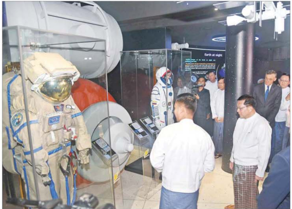
ပြည်ထောင်စုသမ္မတမြန်မာနိုင်ငံတော် ယာယီသမ္မတ နိုင်ငံတော်လုံခြုံရေးနှင့် အေးချမ်းသာယာရေးကော်မရှင်ဥက္ကဋ္ဌ ဗိုလ်ချုပ်မှူးကြီး မင်းအောင်လှိုင် အာကာသပြတိုက်(ရန်ကုန်)အတွင်း ပြသထားမှုများကို လိုက်လံကြည့်ရှုစဉ်။

တွင် သာဓကတစ်ခုအနေဖြင့် စက်တင်ဘာလက ရှေးဟောင်းရေး ရှင်းနိုင်ငံ ဆီးရီးယပ်မြို့တွင် ကျင်းပခဲ့သည့် Open World Astronomy Olympiad (OWAO-25) ဖြိုင်ပွဲသို့ ဖြိုင်ပွဲဝင်လူငယ် ခြောက်ဦးနှင့် International Olympiad on Climate Change and Environmental Issues (IOCE-2025) ဖြိုင်ပွဲသို့ ဖြိုင်ပွဲဝင် လူငယ်ငါးဦး စုစုပေါင်း လူငယ် ၁၁ဦးကို စေလွှတ်ယှဉ်ပြိုင်စေခဲ့ရာ သက်ဆိုင်ရာ ဖြိုင်ပွဲများအလိုက် ထိုက်တန်စွာ ယှဉ်ပြိုင်နိုင်ခဲ့ကြ ပြီး အောင်မြင်မှုအသီးသီးဖြင့် ဆုတံဆိပ်များ ဆွတ်ခူးနိုင်ခဲ့ကြ သည်ကို တွေ့ရှိရကြောင်း။ နည်းပညာခေတ် ဖြစ်သည့် ယနေ့ မျက်မှောက်ကာလတွင် အာကာသနှင့် ဂြိုဟ်တုနည်းပညာ များသည် အချိန်နှင့်အမျှ တစ်ဟုန် ထိုး ဖွံ့ဖြိုးတိုးတက်လျက်ရှိပြီး လူသားမျိုးနွယ်၏ အကျိုးကို ဖော်ဆောင်ပေးနိုင်မည့် အာကာသ သုတေသနလုပ်ငန်းများကို အပြိုင် အဆိုင် ပူးပေါင်းဆောင်ရွက်နေ ကြသည်ကို တွေ့ရှိရကြောင်း။ ထိုကဲ့သို့ သုတေသနလုပ်ငန်းများ မှ ရရှိလာသည့် အကျိုးရလဒ်များ ဖြစ်သည့် အာကာသသိပ္ပံနှင့် အသုံးချနည်းပညာ၊ ဂြိုဟ်တု