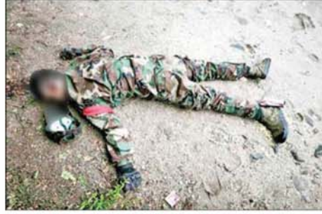
ဆည်တော်ကြီးရေလှောင်တံခါးနှင့် ဝန်းကျင်ဒေသတစ်ဝိုက်အား ပြန်လည်တိုက်ခိုက်သိမ်းပိုက်စဉ် PDF အမည်ခံ အကြမ်းဖက်သောင်းကျန်း သူများထံမှ သိမ်းဆည်းရရှိသည့် ရန်သူ့အလောင်းများကို တွေ့ရစဉ်။

တစ်ဖက်တစ်လမ်းမှ အထောက် အကူပြုလျက်ရှိသည်။ PDF အမည်ခံ အကြမ်းဖက် သောင်းကျန်းသူ ပူးပေါင်းအဖွဲ့များ အနေဖြင့် ဆည်တော်ကြီး ရေလှောင်တံခါးအား ထိန်းချုပ် ထားစဉ်အတွင်း ပြည်သူများ၏ လျှပ်စစ်စီးရရှိရေး၊ သောက်သုံးရေ ရရှိရေး၊ စိုက်ပျိုးရေးရရှိရေးများ အတွက် ထောက်ထားငှည့်မှု မရှိဘဲ ၎င်းတို့၏ ကိုယ်ကျိုးစီးပွား အတွက်သာ လိုအပ်သလိုအသုံးချ ခဲ့ပြီး ရေထိန်းတံခါးများအား ဖွင့်ခြင်း/ပိတ်ခြင်းများ ဆောင်ရွက် ခဲ့သည့်အတွက် ကျိုးရေလျော့နည်း