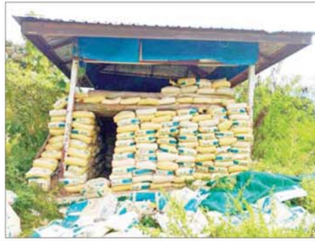
PDF အမည်ခံအကြမ်းဖက်သမားများက ဆည်တော်ကြီးရေလှောင်တံခါးကျင်နှင့် ရေထိန်းတံခါးတွင် အကာအကွယ်ဘန်ကာများ ပြုလုပ်ထားသည့် မှတ်တမ်းဓာတ်ပုံ။

» စာမျက်နှာ ၈ မှ ၂၀၂၅ ခုနှစ် အောက်တိုဘာ ၂၀ ရက်မှစတင်၍ အကြမ်းဖက် ချေမှုန်းရေး စစ်ဆင်ရေးအား ဆက်လက် ဆောင်ရွက်ခဲ့ရာ ဆည်တော်ကြီး ရေလှောင်တံခါး၏ အရှေ့ဘက် သပြေဒီးမှ စစ်ကြောင်းတစ်ကြောင်း၊ သံဘိုမှ စစ်ကြောင်း တစ်ကြောင်း၊ ဆည်တော်ကြီး ရေလှောင်တံခါး၏ တောင်ဘက်အယ်လ်ဖာဘီလပ်မြေ စက်ရုံအနီးရှိ စခန်းသာ-ကြာပင်- သန်းကုန်းမှ စစ်ကြောင်း၊ တစ်ကြောင်း၊ စခန်းသာ-သဖန်း ကိုင်း-တံတားကုန်းမှစစ်ကြောင်း တစ်ကြောင်း၊ ဆည်တော်ကြီး ရေလှောင်တံခါး၏ အနောက် တောင်ဘက် ကျောက်တံတား- မြောင်းသစ် - ရုံးပင် - အထက် တောင်ကိုင်းမှ အထောက်အကူပြု စစ်ကြောင်းတစ်ကြောင်း စသည့် စစ်ကြောင်း ငါးကြောင်းဖြင့် တန်ပြန်တိုက်စစ်အား အရှိန် အဟုန်ဖြင့် ဆောင်ရွက်ခဲ့သည်။ အကြမ်းဖက်သမားများ အနေဖြင့် လည်း ငှားတို့ခေတ္တထိန်းချုပ်ထား သည့် မြို့၊ ရွာများ၊ ရေလှောင် တံခါးတို့အား လက်မလွှတ်ရရေး ပြည်သူလူထု၏ လူနေအိမ် အဆောက်အအုံများ၊ ဆည်တော် ကြီးဆည်၏ ရေထိန်းတံခါးများ၊ ရေလှည့်စက်များကို အကာအကွယ် ရယူ၍လည်းကောင်း၊ ရေထိန်း တံခါးနှင့် ပတ်ဝန်းကျင်တွင် ကွန်ကရစ်ဘန်ကာများ၊ မြေခွေး ကျင်းများနှင့် ဆက်သွယ် ရေးမြောင်းများကို တည်ဆောက် ၍ လည်းကောင်း အခိုင်အမာ ခံစစ်ဆင်ဖြန့်ဖြူးလှည့်ပေးခဲ့သော်လည်း လုံခြုံရေးတပ်ဖွဲ့ဝင်များ အနေဖြင့် ဒေသခံပြည်သူများ၏ အပြည့်အဝ အားပေးထောက်ခံမှု၊ တိုက်ပွဲဝင် အရာရှိစစ်သည်များ၏ စိတ်ဓာတ် တက်ကြွ၍ တိုက်လှိုင်းလိုက်လိုက် ပြင်းပြမှု၊ မဆုတ်မနစ်သော စွဲ၊ လုံ့လ၊ ဝီရိယရှိမှု၊ စနစ်တကျ ရေးဆွဲထားသော စီမံချက် ဆောင်းမှန်မှုတို့ဖြင့် အဆိုပါ ဆည်တော်ကြီးအဆောက်အအုံများ၊ စက်ပစ္စည်း ကိရိယာများနှင့် ဆည်မြောင်းတာဝန် ရေထိန်း တံခါးများ ထိခိုက်ပျက်စီးမှုရှိစေ ရေး ကန့်သတ်ချက်များကြားမှ ထိန်းထိန်းသိမ်းသိမ်းဖြင့် တိုက်စစ်