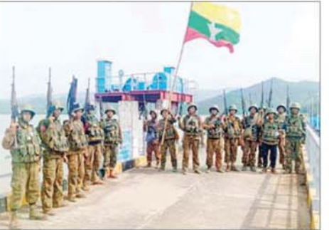
ဆည်တော်ကြီးရေလှောင်တံခံအား တပ်မတော်စစ်ကြောင်း များက ပြန်လည်ထိန်းချုပ်ခဲ့သည့် မှတ်တမ်းဓာတ်ပုံ။