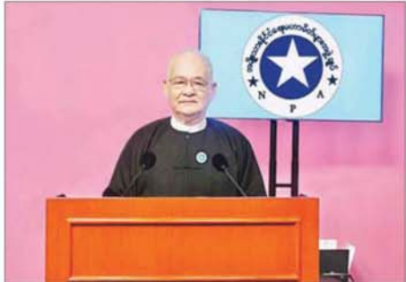
လေးစားအပ်ပါသော မဲဆန္ဒရှင်ပြည်သူများ ခင်ဗျာ

အမျိုးသားနိုင်ငံရေးမဟာမိတ်များအဖွဲ့ချုပ်ပါတီဥက္ကဋ္ဌ ဦးသိန်းကြည်က ၎င်းတို့၏ မူဝါဒ၊ သဘောထား၊ လုပ်ငန်းစဉ် စသည်တို့ကို နိုဝင်ဘာ ၇ ရက် ညပိုင်းတွင် ရေဒီယိုနှင့် ရုပ်မြင်သံကြားအစီအစဉ်များမှ ဟောပြောတင်ပြခဲ့ပါသည်။ အဆိုပါ ဟောပြောတင်ပြချက်အပြည့်အစုံမှာ အောက်ပါအတိုင်းဖြစ်ပါသည်-