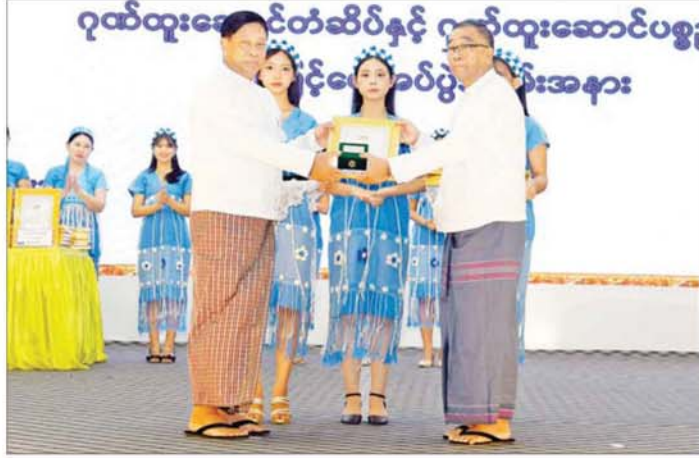
ပြည်ထောင်စုဝန်ကြီး ဦးတင်အောင်စန်း နှစ်(၇၀)ပြည့် ကရင်ပြည်နယ်နေ့အထိမ်းအမှတ် ကရင် ပြည်နယ် ဂုဏ်ထူးဆောင်လက်မှတ်နှင့် ဂုဏ်ထူးဆောင်ဆုများ ချီးမြှင့်ပေးအပ်စဉ်။

ကျင်းပသည့် ရိုးရာလှေလှော်ပြိုင်ပွဲ နှင့် ဆုချီးမြှင့်ပွဲအခမ်းအနားသို့ တက်ရောက်ကြပြီး ကျန်းမာရေး အဖွဲ့၊ ကြက်ခြေနီတပ်ဖွဲ့၊ ရေပြင် အသက်ကယ်အဖွဲ့၊ လူမှုကယ်ဆယ် ရေးအဖွဲ့တို့အား ဂုဏ်ပြုဆုငွေများ နှင့် ရိုးရာလှေလှော်ပြိုင်ပွဲတွင် ပထမ၊ ဒုတိယ၊ တတိယဆုရရှိကြ သူများအား ဂုဏ်ပြုဆုများ ပေးအပ် ချီးမြှင့်ကြကာ သီရိသံလွင်ကွင်း၌ ကျင်းပသည့် နှစ်(၇၀)ပြည့် ကရင် ပြည်နယ်နေ့အထိမ်းအမှတ် ရိုးရာ လက်ဝှေ့ပြိုင်ပွဲကို သွားရောက် ကြည့်ရှုအားပေးကြသည်။ ညပိုင်းတွင်ဘားအံမြို့သီရိကွင်း ၌ ကျင်းပသည့် နှစ်(၇၀)ပြည့် ကရင်ပြည်နယ်နေ့ အထိမ်းအမှတ် ကရင်ရိုးရာ ခုံးအကပြိုင်ပွဲတွင် ယှဉ်ပြိုင်လျက်ရှိသော ပြိုင်ပွဲဝင်ခုံးအဖွဲ့များ၏ ချွင်းမြူး တက်ကြွဖွယ် ကရင်ခုံးအက ယှဉ်ပြိုင်ကပြ ဖျော်ဖြေမှုများကို ကြည့်ရှုအားပေးကြပြီး ဂုဏ်ပြု ဆုငွေများ ပေးအပ်ချီးမြှင့်ခဲ့ကြ ကြောင်း သိရသည်။ သတင်းစဉ်