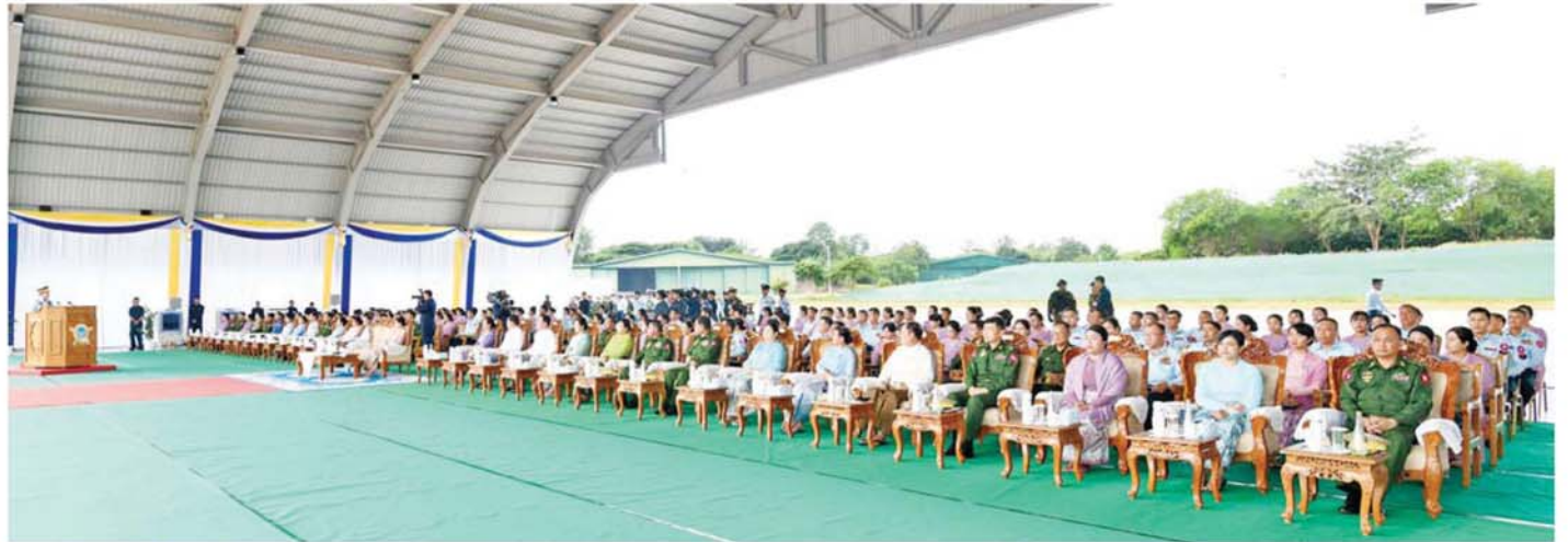
နိုင်ငံတော်လုံခြုံရေးနှင့် အေးချမ်းသာယာရေးကော်မရှင်ဥက္ကဋ္ဌ တပ်မတော်ကာကွယ်ရေးဦးစီးချုပ် ဗိုလ်ချုပ်မှူးကြီးမင်းအောင်လှိုင် လေယာဉ်/ရဟတ်ယာဉ်များ တပ်တော်ဝင်အခမ်းအနားတွင် အမှာစကား ပြောကြားစဉ်။

ရှေ့မှ ကာကွယ်ရေးဦးစီးချုပ် (လေ) ဗိုလ်ချုပ်ကြီးထွန်းအောင်နှင့် ဇနီး၊ ပြည်ထောင်စုအဆင့် ပုဂ္ဂိုလ်များ နှင့်ဇနီးများ၊ ကာကွယ်ရေးဦးစီး ချုပ်ရုံးမှ အဆင့်မြင့်တပ်မတော် အရာရှိကြီးများနှင့် ဇနီးများ၊ နေပြည်တော် တိုင်းစစ်ဌာနချုပ် တိုင်းမှူး၊ လေတပ်စခန်းဌာနချုပ် မှူးများ၊ တပ်မတော်(လေ)မှ အရာရှိ၊ စစ်သည်များနှင့် တာဝန်