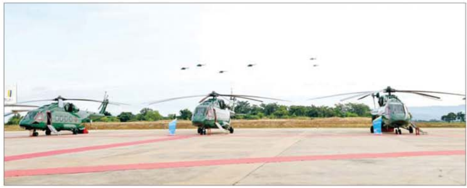
တပ်တော်ဝင် ရဟတ်ယာဉ်များကို တွေ့ရစဉ်။