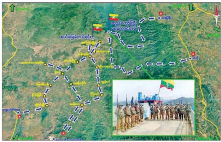
တပ်မတော်စစ်ကြောင်းများက ဆည်တော်ကြီးရေလှောင်တံခံအား ပြန်လည်ထိန်းချုပ်ခြင်း။

ရိုးသားစွာ နေထိုင်လုပ်ကိုင် စားသောက်နေကြသည့် ပြည်သူ များအား ဒီမိုကရေစီအရေးနှင့် ဒေသကောင်းစားရေးဟု နိုင်ငံရေး မက်လုံးများဖြင့် စည်းရုံးသိမ်းသွင်း ကာ အကြမ်းဖက်သင်တန်းများ ပို့ချပေးပြီး MDY-PDF အမည်ခံ အကြမ်းဖက်သမားများ အဖြစ် မွေးထုတ်ပေးကာ ဗြိတိ၊ ရွာများတွင် တိုက်ပွဲများ ဖော်ဆောင်ခြင်း၊ လုံခြုံရေးအားနည်းသော တပ်စခန်း ငယ်များကို အင်အားအလုံးအရင်း အသုံးပြု၍ တိုက်ခိုက်ခြင်း၊ နိုင်ငံ အကျိုးပြု စက်ရုံ၊ အလုပ်ရုံများအား တိုက်ခိုက်ခြင်းများ လုပ်ဆောင် လာကြရာ လုံခြုံရေးတပ်ဖွဲ့ဝင်များ လူတစ်ယောက်ကျန်သည်အထိ တိုက်ရဲသည့် စိတ်ဓာတ်၊ လေ့စွက် ချည်းကျန် အလံမလဲသည့် စိတ်ဓာတ်များဖြင့် အသက်ကို ပဓာနမထားဘဲ ရဲရဲဝံ့ဝံ့ဖြင့် ပြန်လည်ခုခံ တွန်းလှန်ခဲ့ကြသော် လည်း အကြမ်းဖက်သမားများ အနေဖြင့် အတင်းအဓမ္မ ခြိမ်းခြောက် လှသစ်စုဆောင်းခြင်း ဖြင့်ရရှိလာသော သာလွန်အင်အား