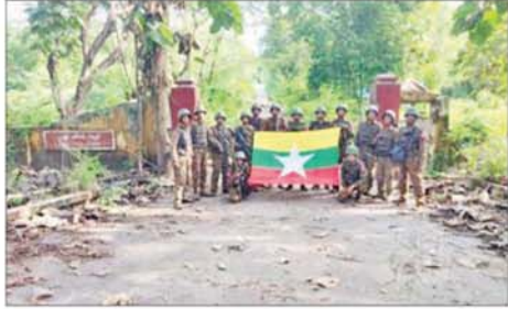
တပ်မတော်စစ်ကြောင်းများက PDF အမည်ခံ အကြမ်းဖက် ပူးပေါင်းအဖွဲ့များ ခေတ္တထိန်းချုပ်ခဲ့သည့် နယ်မြေခံတပ်ရင်းအား ပြန်လည်သိမ်းပိုက်ရရှိခဲ့သည့် မှတ်တမ်းဓာတ်ပုံ။

ရေလှောင်တံခံနှင့် နိုင်ငံအကျိုးပြု စက်ရုံ၊ အလုပ်ရုံတို့အား ထိခိုက် ပျက်စီးမှု အနည်းဆုံးဖြင့် ပြန်လည် ရရှိရေးအတွက် စီမံချက်များ အဆင့်ဆင့်ရေးဆွဲပြီး စစ်ကြောင်း များခွဲ၍ ပစ်ခတ်မှုနှင့် စစ်ကစားမှု ကို ဟန့်ချက်ညီညီ ပေါင်းစပ်ပြီး ချေမှုန်းခဲ့ရာ ၂၀၂၅ ခုနှစ် ဩဂုတ် ၂၄ ရက်တွင် ဖယောင်းတောင် သတ္တုတွင်း ဒေသတစ်ဝိုက်အား လည်းကောင်း၊ ဩဂုတ် ၂၈ ရက် တွင် အယ်လ်ဖာဘီလပ်မြေစက်ရုံ ကို လည်းကောင်း ပြန်လည် တိုက်ခိုက် သိမ်းပိုက်နိုင်ခဲ့ပြီး အကြမ်းဖက်သမားများအနေဖြင့် ထိခိုက်ကျဆုံးမှု များစွာဖြင့် မတ္တရာဒေသ မြောက်ဘက်ခြမ်းသို့ ကစဉ့်ကလျား ဆုတ်ခွာထွက်ပြေး သွားကြသည်။ ဆက်လက်၍ တပ်မတော် စစ်ကြောင်းများ အနေဖြင့် တိုက်စစ် အဟုန်မြှင့်တင်၍ အကြမ်းဖက် သမားများ ထိန်းချုပ်ထားသော နယ်မြေများ ပြန်လည်ရရှိရေး အတွက် လိုအပ်သည့် ပြင်ဆင် စုဖွဲ့များ အသေးစိတ်ဆောင်ရွက် ခဲ့ပြီး စာမျက်နှာ ၉ သို့။»