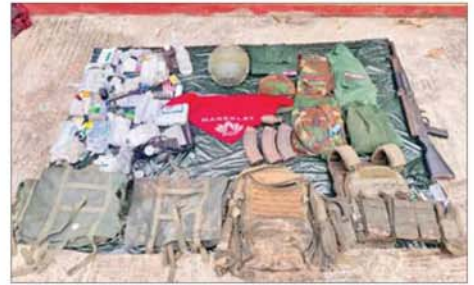
ဆည်တော်ကြီး ရေလှောင်တံခွန်နှင့် ဝန်းကျင်ဒေသတစ်ဝိုက်အား ပြန်လည်တိုက်ခိုက်သိမ်းပိုက်စဉ် PDF အမည်ခံ အကြမ်းဖက်သောင်းကျန်းသူ များထံမှ သိမ်းဆည်းရရှိသည့် လက်နက်၊ ခဲယမ်းနှင့် ဆက်စပ်ပစ္စည်းများကို တွေ့ရစဉ်။

» စာမျက်နှာ ၉ မှ PDF အမည်ခံ အကြမ်းဖက် သောင်းကျန်းသူပူးပေါင်းအဖွဲ့များ အနေဖြင့် ဆည်တော်ကြီးရေလှောင် တံခွန်အား ထိန်းချုပ်ထားစဉ် အတွင်း ရေလှောင်တံခွန်ကြီး၏ ရေပေးစေ့ကို ထိန်းချုပ်ထားခဲ့ သလို ရေလှောင်တံခွန်ကြီး၏ ဆည်ရေပိုလွှဲရေတံခါး အဖွင့်/ အပိတ်မောင်းခလုတ်၊ ဆည်တံခါး ပေါင်နှင့် ရေထိန်းတံခါးတို့အား မိုင်းထောင်၍ ဖောက်ခွဲဖျက်ဆီး ရန် ယုတ်မာရိုင်းစိုင်းစွာဖြင့် လုပ်ဆောင်ခဲ့သည်ကို တွေ့ရှိခဲ့ရ သည်။ ထိုသို့ အကြမ်းဖက် သောင်းကျန်းသူများက အဆိုပါ နေရာများအား မိုင်းထောင်