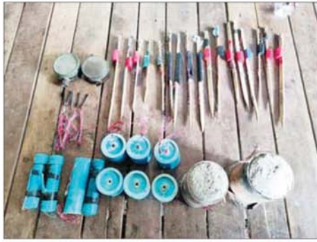
ဆည်တော်ကြီးရေလှောင်တံခါးအား ဖောက်ခွဲဖျက်ဆီးရန် PDF အမည်ခံ အကြမ်းဖက်သမားများ ထောင်ထားခဲ့သည့် မိုင်းနှင့် ဆက်စပ်ပစ္စည်းများ မှတ်တမ်းဓာတ်ပုံ။