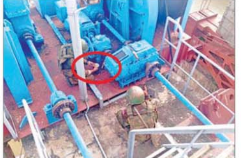
ဆည်တော်ကြီးရေလှောင်တံခံအား ဖောက်ခွဲဖျက်ဆီးရန် PDF အမည်ခံ အကြမ်းဖက်သမားများ ရေထိန်းတံခါးများပေါ်တွင် ထောင်ထားသည့် မိုင်းများအား လုံခြုံရေးတပ်ဖွဲ့ဝင်များက ဖယ်ရှား ရှင်းလင်းနေသည့် မှတ်တမ်းဓာတ်ပုံ။