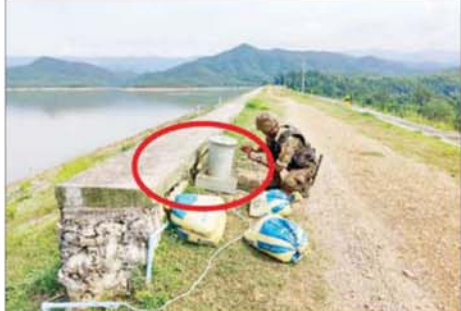
ဆည်တော်ကြီးရေလှောင်တံခံအား ဖောက်ခွဲဖျက်ဆီးရန် PDF အမည်ခံ အကြမ်းဖက်သမားများ ဆည်တံခံပေါင်ပေါ်တွင်ထောင်ထား သည့် မိုင်းများအား လုံခြုံရေးတပ်ဖွဲ့ဝင်များက ဖယ်ရှားရှင်းလင်း နေသည့် မှတ်တမ်းဓာတ်ပုံ။