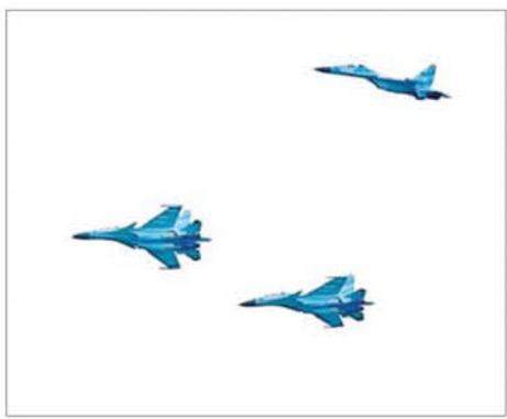
တိုက်လေယာဉ်များ သရုပ်ပြပျံသန်းစဉ်။