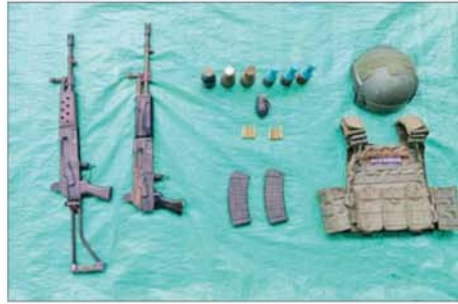
ဆည်တော်ကြီးရေလှောင်တံခါးနှင့် ဝန်းကျင်ဒေသတစ်ဝိုက်အား ပြန်လည်တိုက်ခိုက်သိမ်းပိုက်စဉ် PDF အမည်ခံ အကြမ်းဖက်သောင်းကျန်း သူများထံမှ သိမ်းဆည်းရရှိသည့် လက်နက်၊ ခဲယမ်းနှင့် ဆက်စပ်ပစ္စည်းများကို တွေ့ရစဉ်။