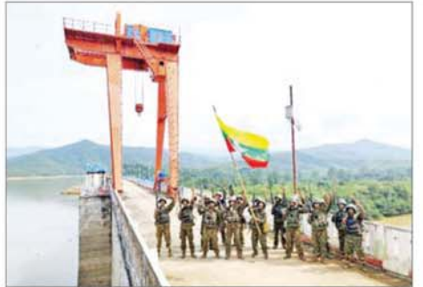
ဆည်တော်ကြီးရေလှောင်တံခံအား တပ်မတော်စစ်ကြောင်း များက ပြန်လည်ထိန်းချုပ်ခဲ့သည့် မှတ်တမ်းဓာတ်ပုံ။