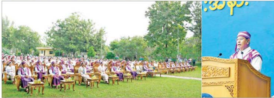
ပြည်ထောင်စုသမ္မတမြန်မာနိုင်ငံတော် ယာယီသမ္မတ နိုင်ငံတော်လုံခြုံရေးနှင့် အေးချမ်းသာယာရေးကော်မရှင်ဥက္ကဋ္ဌ ဗိုလ်ချုပ်မှူးကြီး သတိုးမဟာသရေစည်သူ သတိုးသိရီသုဓမ္မ မင်းအောင်လှိုင်ထံမှ ၂၀၂၅ ခုနှစ် နှစ် (၇၀) ပြည့် ကရင်ပြည်နယ်နေ့အခမ်းအနားသို့ ပေးပို့သည့် သဝဏ်လွှာကို ပြည်ထောင်စုဝန်ကြီး ဦးတင်အောင်စန်း ဖတ်ကြားစဉ်။

နေပြည်တော် နိုဝင်ဘာ ၇ ကရင်တိုင်းရင်းသားလူမျိုးတို့၏ နေ့ထူးနေ့မြတ်ဖြစ်သည့် နှစ်(၇၀)ပြည့် ကရင်ပြည်နယ်နေ့ အခမ်းအနားကို ယနေ့နံနက်ပိုင်းတွင် ပြည်နယ်အစိုးရအဖွဲ့ရုံးရှေ့ မြက်ခင်းပြင်၌ ကျင်းပရာ နိုင်ငံတော်သမ္မတရုံး ဝန်ကြီးဌာန(၁) ပြည်ထောင်စုဝန်ကြီး ဦးတင်အောင်စန်း တက်ရောက်သည်။