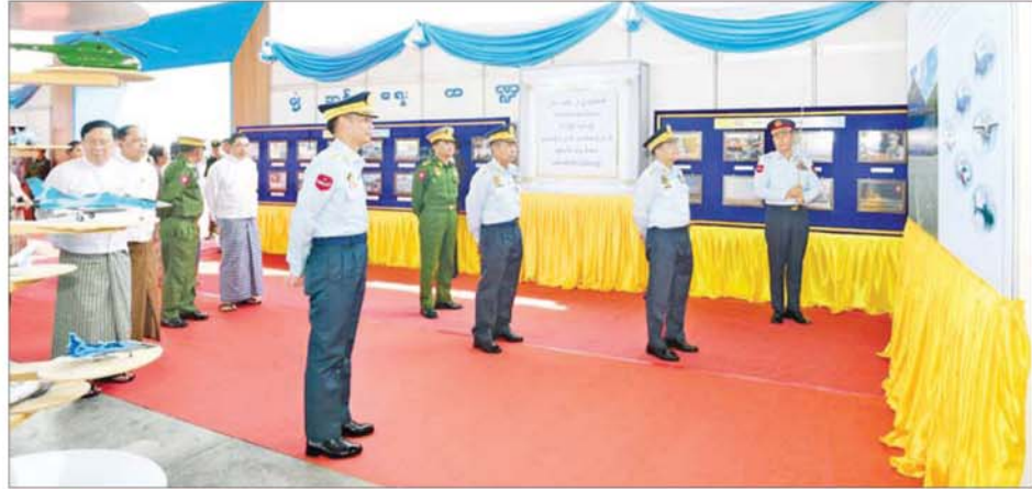
နိုင်ငံတော်လုံခြုံရေးနှင့် အေးချမ်းသာယာရေးကော်မရှင်ဥက္ကဋ္ဌ တပ်မတော်ကာကွယ်ရေးဦးစီးချုပ် ဗိုလ်ချုပ်မှူးကြီးမင်းအောင်လှိုင် တပ်မတော်(လေ) ၁၅ နှစ်တာကာလတိုးတက်ပြောင်းလဲမှု ပြခန်းအတွင်း ခင်းကျင်းပြသထားသည့် ပြခန်းများကို ကြည့်ရှုစဉ်။

အနေဖြင့် ပြည်သူလူထု၏ အကူ အညီကိုရယူကာ ဆက်လက် တိုးတက် ဆောင်ရွက်သွားမည်ကို အသိပေးပြောကြားလိုကြောင်း။ တပ်မတော်(လေ)ကို ၁၉၄၇ ခုနှစ် ဒီဇင်ဘာ ၁၅ ရက်တွင် စတင်ဖွဲ့စည်းခဲ့ပြီး လာမည့် ဒီဇင်ဘာလဆိုပါက သက်တမ်း ၇၈ နှစ်ပြည့်မြောက်တော်မူမည်ဖြစ် ကြောင်း၊ အဆိုပါ ကာလအတွင်း ဌ တပ်မတော်(လေ)သည် တပ်မတော်၏ အဓိကအစိတ် အပိုင်းတစ်ရပ်အနေဖြင့် ပေးအပ် လာသည့် တာဝန်အမျိုးမျိုးကို အစွမ်းကုန် ကျေပွန်ပြီးမြောက် အောင် ကြိုးပမ်းထမ်းဆောင်ခဲ့ သည့်ကို လူထုယူဖွယ်တွေ့ရှိရ ကြောင်း၊ လက်ရှိတွင်လည်း တပ်မတော်(လေ)သည် မိမိတို့ ဂရုပြိုင်ဆိုင်ထားသည့်လေကြောင်း စွမ်းအား အရင်းအမြစ်များကို အကျိုးအရှိဆုံး အသုံးချကာ ရည်မှန်းချက် တာဝန်များကို အောင်မြင်ထိရောက်စွာ ထမ်း ဆောင်လျက်ရှိသည်ကို အသိ အမှတ်ပြု ပြောကြားလိုကြောင်း၊ ထိုသို့ ထမ်းဆောင်နိုင်ခြင်းသည် တပ်မတော်(လေ)၏ အဓိက မဏ္ဍိုင်ကြီး(၃)ရပ်ဖြစ်သည့်ပုံသန်း ရေးကဏ္ဍမှ လေသူရဲနှင့် လေယာဉ်သားများ၊ စက်မှု လက်မှုကဏ္ဍမှ အင်ဂျင်နီယာနှင့် ကျွမ်းကျင် ပညာသည်များ၊ အုပ်ချုပ်ရေးကဏ္ဍမှ အုပ်ချုပ် ထောက်ပံ့မှုနှင့် ရုံးလုပ်ငန်းဆိုင်ရာ ပညာသည်များနှင့် စာရေးများ ဟန်ချက်ညီ ပူးပေါင်းလုပ်ဆောင် ခဲ့ကြခြင်းကြောင့် ဖြစ်ကြောင်း။