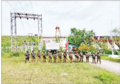
ဆည်တော်ကြီးရေလှောင်တံခံ၊ လျှပ်စစ်ဓာတ်အားပေးစက်ရုံနှင့် ဝန်းကျင်ဒေသအား တပ်မတော်စစ်ကြောင်းများက ပြန်လည်ထိန်းချုပ် ခဲ့သည့် မှတ်တမ်းဓာတ်ပုံ။