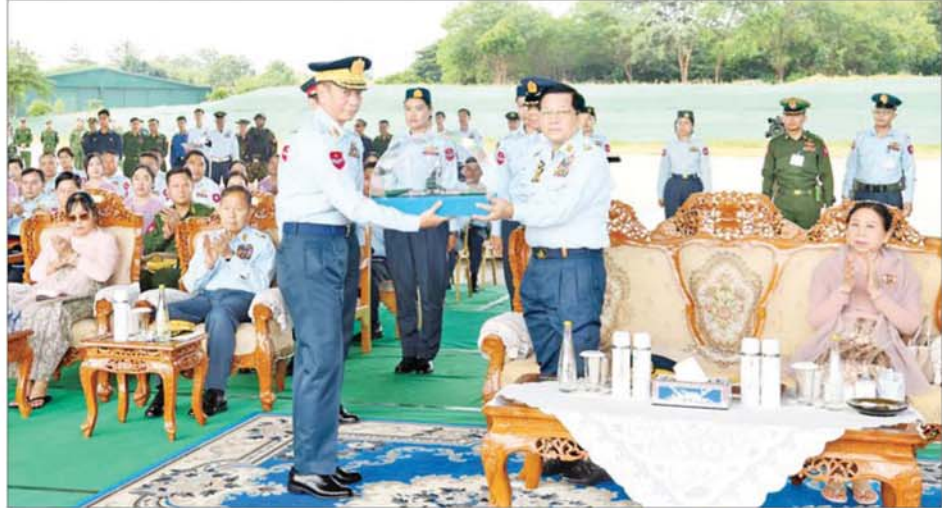
နိုင်ငံတော်လုံခြုံရေးနှင့် အေးချမ်းသာယာရေးကော်မရှင်ဥက္ကဋ္ဌ တပ်မတော်ကာကွယ်ရေးဦးစီးချုပ် ဗိုလ်ချုပ်မှူးကြီးမင်းအောင်လှိုင်ထံ ကာကွယ်ရေးဦးစီးချုပ်(လေ) ဗိုလ်ချုပ်ကြီး ထွန်းအောင်က လေယာဉ်များ တပ်တော်ဝင်အထိမ်းအမှတ် လေယာဉ်ပုံစံထိန်းကို ဂါရဝပြု ပေးအပ်စဉ်။

ဆောင်ကြဉ်းပေးလာမည်ဖြစ်သည် ကို ပြောကြားလိုကြောင်း၊ ထိုသို့ အကျိုးကျေးဇူးများ ရရှိလာစေရန် တပ်မတော်(လေ)တွင် ရှိသည့် လေသူရဲနှင့် လေယာဉ်သားများ၊ စက်မှုလက်မှု ပညာရှင်များ၊ အုပ်ချုပ်ထောက်ပံ့မှု တာဝန်ရှိသူ များကလည်း တပ်တော်ဝင် ဖြည့်ဆည်း ပေးထားသည့် လေယာဉ်/ ရဟတ်ယာဉ်များနှင့် အထောက်အကူပြု စနစ်များကို ကျွမ်းကျင်စနစ်ကျစွာ ယုံသန့် အသုံးပြုကြရန်၊ မိမိကျရာတာဝန် ကို ကျေကျ့ပွန်ပွန် အောင်အောင် မြင်မြင်ဖြင့် အစွမ်းကုန်ထမ်းဆောင် ကြရန် အလေးအနက်ထား တိုက်တွန်းမှာကြားလိုကြောင်း။ လတ်တလောကာလ နိုင်ငံ တကာတွင် ဖြစ်ပွားခဲ့သည့် ပဋိ ပက္ခများသာမက ပြည်တွင်းတွင် ဖြစ်ပေါ်ကြုံတွေ့ခဲ့ရသည့် အခြေ အနေ အရပ်ရပ်များတွင်ပါ လေယာဉ်/ ရဟတ်ယာဉ်များ၊ ဒရုန်းနှင့် ယူအေစီများအပါအဝင် လေကြောင်းစွမ်းအား အရင်း အမြစ်များသည် မရှိမဖြစ်လိုအပ် လာသည်ကို တွေ့ရှိရကြောင်း၊ ထို့ကြောင့် နိုင်ငံအသီးသီးသည် လေတပ်အပါအဝင် လေကြောင်း စွမ်းအား ထုတ်လုပ်ဖြန့်ဖြူး ကြက် ပေးနိုင်သည့် တပ်ဖွဲ့အမျိုးမျိုးကို စာမျက်နှာ ၄ သို့ ။