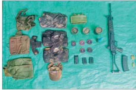
ဆည်တော်ကြီးရေလှောင်တံခါးနှင့် ဝန်းကျင်ဒေသတစ်ဝိုက်အား ပြန်လည်တိုက်ခိုက်သိမ်းပိုက်စဉ် PDF အမည်ခံ အကြမ်းဖက်သောင်းကျန်း သူများထံမှ သိမ်းဆည်းရရှိသည့် လက်နက်၊ ခဲယမ်းနှင့် ဆက်စပ်ပစ္စည်းများကို တွေ့ရစဉ်။

ဆင်ခဲ့ရာ နိုင်ငံဘာ ၇ ရက် ယနေ့ မွန်းလွဲပိုင်းတွင် ဆည်တော်ကြီး ရေလှောင်တံခါးနှင့် နယ်မြေခံ တပ်ဌာနချုပ် ပတ်ဝန်းကျင် အားလုံးကို ပြန်လည်တိုက်ခိုက် သိမ်းပိုက်နိုင်ခဲ့သည်။ ထိုသို့ ပြန်လည်တိုက်ခိုက် သိမ်းပိုက်ခဲ့ရာ စစ်ဆင်ရေးကာလ ၁၉ ရက်အတွင်း အကြမ်းဖက် သောင်းကျန်းသူများနှင့် တိုက်ပွဲ ကြီးငယ် (၄၂)ကြိမ် ဖြစ်ပွားခဲ့ပြီး အကြမ်းဖက်သောင်းကျန်းသူများ ထံမှ အလောင်း ၁၄ လောင်း၊ လက်နက်မီးစုံ ၆၀ နှင့် ဆက်စပ်ပစ္စည်းများ သိမ်းဆည်း ရမိခဲ့ပြီး လုံခြုံရေးတပ်ဖွဲ့ဝင်အချို့ နိုင်ငံတော်အတွက် မြင့်မြတ်စွာ အသက်ပေးလှူခဲ့ရသည်။ အဆိုပါ ဆည်တော်ကြီး ရေလှောင်တံခါးသည် မန္တလေး တိုင်းဒေသကြီး မတ္တရာမြို့နယ် စလေကျေးရွာအုပ်စုဆည်တော်ကြီး ရွာအနီးတွင် တည်ရှိပြီး မန္တလေးမြို့ ရေပေးဝေရေး၊ မတ္တရာဒေသနှင့် မန္တလေးပတ်ဝန်းကျင်ဒေသတွင်း စိုက်ပျိုးရေးပေးဝေရေး၊ ရေအား လျှပ်စစ်ထုတ်လုပ်ရေးတို့အတွက် ရည်ရွယ်ဆောက်လုပ်ထားသည့် တာဝန်ဖြစ်ပြီး ၁၉၇၆ ခုနှစ်မှ စတင်တည်ဆောက်ခဲ့ရာ ၁၉၈၇ ခုနှစ်တွင် အောင်မြင်စွာ ပြီးစီးခဲ့ သည့် မြေသာ၊ ကွန်ကရစ်၊ ကျောက်ဖြည့် တံခါးအမျိုးအစား ဖြစ်ကာ တံခါးအလျား ပေ ၄၁၂၊ တံခါးအမြင့် ၁၃၃ ပေနှင့် တံခါးထိပ် အကျယ်ပေ ၂၀ ရှိပြီး ကန်ရေပြည့် ရေလှောင်ပမာဏ အနေဖြင့် ဧကပေ ၃၆၃၀၀၀ ရှိပြီး အကျိုးပြု ရေလှောင်ပမာဏမှာ ဧကပေ ၂၇၉၀၀၀ ရှိသည်။ ယင်းအပြင် မန္တလေးတိုင်းဒေသကြီးအတွင်းရှိ မြို့၊ ရွာများအတွက် ဆည်ရေ ပေးဝေနိုင်သည့် လယ်မြေဧက ၁၂၇၀၀၀ ကို စိုက်ပျိုးရေးဖြန့်ဖြူး ပေးနိုင်ကြောင်း သိရသည်။ ထို့ပြင် ဆည်တော်ကြီး ရေလှောင်တံခါးမှ လျှပ်စစ်ဓာတ်အား ထုတ်လုပ်မှု အနေဖြင့် စက်တပ်စွမ်းအား ၂၅ မဂ္ဂါဝပ်ရှိပြီး တစ်နှစ်လျှင် လျှပ်စစ် ဓာတ်အား ထုတ်လုပ်နိုင်မှု နာရီ သန်းပေါင်း ၁၃၄ ကီလိုဝပ်ကို လည်း ထုတ်လုပ်ပေးသဖြင့် ဒေသခံပြည်သူလူထု၏ လူမှုစီးပွား ဘဝကို ဖွံ့ဖြိုးတိုးတက်အောင်