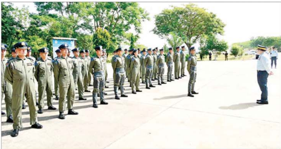
နိုင်ငံတော်လုံခြုံရေးနှင့် အေးချမ်းသာယာရေးကော်မရှင်ဥက္ကဋ္ဌ တပ်မတော်ကာကွယ်ရေးဦးစီးချုပ် ဗိုလ်ချုပ်မှူးကြီးမင်းအောင်လှိုင် သရုပ်ပြအုပ်ဖွဲ့ပျံသန်းမှုတွင် ပါဝင်သောလေယာဉ်များအား ဂုဏ်ပြုနှုတ်ဆက်စကား ပြောကြားစဉ်။

ယနေ့ တပ်တော်ဝင်ပေးလိုက်သည့် လေယာဉ်/ရဟတ်ယာဉ်များကို မြတ်နိုးတန်ဖိုးထားပြီး ကျွမ်းကျွမ်းကျင်ကျင် ထိထိရောက်ရောက် ပျံသန်းကိုင်တွယ်အသုံးပြုထိန်းသိမ်းပြီး စွမ်းရည်အဆင့်အတန်း မြင့်မားသည့် လေတပ်မတော် တစ်ခုဖြစ်ကြောင်း သက်သေပြကြရန်၊ နိုင်ငံတကာဆက်ဆံရေး၊ ပထဝီနိုင်ငံရေးဆိုင်ရာ ဖြစ်ပေါ်ပြောင်းလဲလာမှုများနှင့် သိပ္ပံနှင့်နည်းပညာ အဆင့်မြင့်တိုးတက်လာမှုအခြေအနေများကို စဉ်ဆက်မပြတ် လေ့လာသုံးသပ်ဖော်ထုတ်ပြီး တပ်မတော်(လေ)၏ တိုက်စွမ်းအား အစဉ်ထိရောက်မြင့်မားနေအောင် ကြိုးပမ်းတီထွင်လုပ်ဆောင်သွားကြရန်၊ ရရှိပိုင်ဆိုင်ထားပြီးဖြစ်သည့် လေကြောင်းစွမ်းအားအရင်းအမြစ်များကို အထိရောက်ဆုံး အသုံးချနိုင်စေရေး စဉ်ဆက်မပြတ် လေ့ကျင့်ခြင်း၊ သုတေသနပြု စမ်းသပ်တီထွင်ထုတ်လုပ်ခြင်း၊ အလဟဿဆုံးရှုံးပျက်စီးထိခိုက်မှုမရှိအောင် အလေးထား လုပ်ဆောင်ခြင်း စသည့် လုပ်ငန်းစဉ်များကို ပျံသန်းရေး၊ စက်မှုလက်မှုနှင့် အုပ်ချုပ်ရေး၊ မဏ္ဍိုင်ကြီး (၃) ရပ် ပေါင်းစပ်ညှိနှိုင်းကာ တာဝန်ရှိသူအဆင့်ဆင့်က အလေးထား ကြပ်မတ်စီမံလုပ်ဆောင်ကြရန်၊ တပ်မတော်၏ကောင်းမြတ်သည့် အစဉ်အလာများကို အသက်နှင့်ထပ်တူထိန်းသိမ်းစောင့်ရှောက်ပြီး ကမ္ဘာတည်သရွေ့ မြန်မာတည်အောင် ဝိုင်းဝန်းကြိုးပမ်းလုပ်ဆောင်သွားကြရန် တိုက်တွန်းမှာကြား