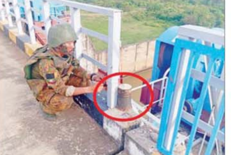
ဆည်တော်ကြီးရေလှောင်တံခံအား ဖောက်ခွဲဖျက်ဆီးရန် PDF အမည်ခံ အကြမ်းဖက်သမားများ ရေထိန်းတံခါးများအနီးတွင် ထောင်ထားသည့် မိုင်းများအား လုံခြုံရေးတပ်ဖွဲ့ဝင်များက ဖယ်ရှား ရှင်းလင်းနေသည့် မှတ်တမ်းဓာတ်ပုံ။