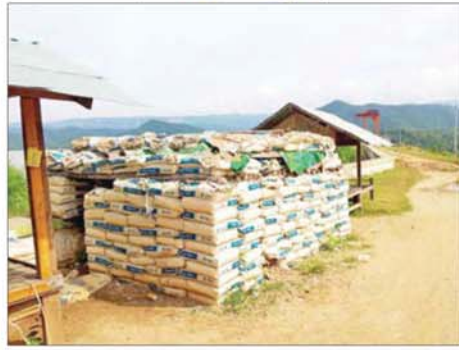
PDF အမည်ခံအကြမ်းဖက်သမားများက ဆည်တော်ကြီးရေလှောင်တံခါးကျင်နှင့် ရေထိန်းတံခါးတွင် အကာအကွယ်ဘန်ကာများ ပြုလုပ်ထားသည့် မှတ်တမ်းဓာတ်ပုံ။