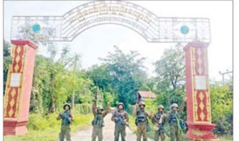
တပ်မတော်စစ်ကြောင်းများက PDF အမည်ခံ အကြမ်းဖက်ပူးပေါင်းအဖွဲ့များ ခေတ္တထိန်းချုပ်ခဲ့သည့် ကျေးရွာများအား ပြန်လည်သိမ်းပိုက် ရရှိခဲ့သည့် မှတ်တမ်းဓာတ်ပုံ။