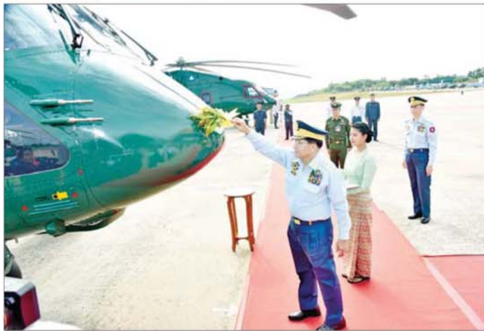
နိုင်ငံတော်လုံခြုံရေးနှင့် အေးချမ်းသာယာရေးကော်မရှင်ဥက္ကဋ္ဌ တပ်မတော်ကာကွယ်ရေးဦးစီးချုပ် ဗိုလ်ချုပ်မှူးကြီးမင်းအောင်လှိုင် တပ်တော်ဝင် လေယာဉ် ရဟတ်ယာဉ်များအား အမွှေးနှံသရုပ်များ ပတ်ဖျန်းပေးစဉ်။

ထူထပ်ပြီး မြစ်ချောင်းအင်းအိုင် များ ပေါများစွာတည်ရှိနေသည့် အတွက် သာမန်သွားလာ ကူးသန်း ရန် အကန့်အသတ်များရှိသည်ကို တွေ့ရမည်ဖြစ်ကြောင်း။ ပထဝီနိုင်ငံရေးအရော နိုင်ငံ ရေး ပထဝီအခြေအနေအရပါ ထူးခြားသည့် အခြေအနေများ ပိုင်ဆိုင်ထားသည့် မိမိတို့နိုင်ငံ အနေဖြင့် ယခုအခြေအနေများထဲ က မိမိနိုင်ငံအတွက် ကောင်းကျိုး များ အပြည့်အဝရရှိစေစား အသုံးချ နိုင်ရန် လေကြောင်းစွမ်းအားသည် မရှိမဖြစ် လိုအပ်သည့်အပြင် အင်အားကောင်းမွန်စေရန်၊ ခေတ်မီ အဆင့်မြင့်စေရန် မဖြစ်မနေ ကြိုးပမ်းတည်ဆောက်ရမည် ဖြစ် ကြောင်း၊ တပ်မတော်(လေ)သည် မိမိတို့နိုင်ငံ၏လေကြောင်းစွမ်းအား အရင်းအမြစ်များအနက် အဓိက