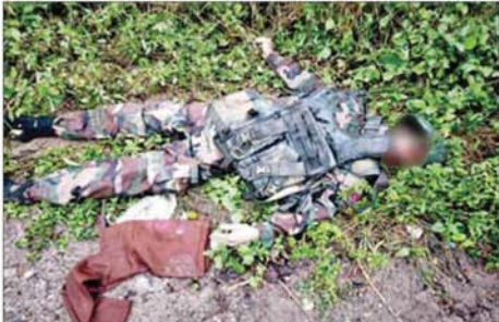
ဆည်တော်ကြီး ရေလှောင်တံခွန်နှင့် ဝန်းကျင်ဒေသတစ်ဝိုက်အား ပြန်လည်တိုက်ခိုက်သိမ်းပိုက်စဉ် PDF အမည်ခံ အကြမ်းဖက် သောင်းကျန်းသူများထံမှ သိမ်းဆည်းရရှိသည့် ရန်သူ့အလောင်းကို တွေ့ရစဉ်။