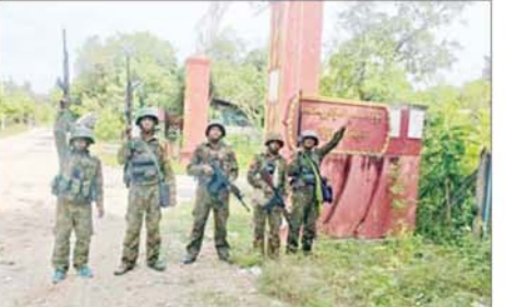
ဆည်တော်ကြီးရေလှောင်တံခံ၊ လျှပ်စစ်ဓာတ်အားပေးစက်ရုံနှင့် ဝန်းကျင်ဒေသအား တပ်မတော်စစ်ကြောင်းများက ပြန်လည်ထိန်းချုပ် ခဲ့သည့် မှတ်တမ်းဓာတ်ပုံ။