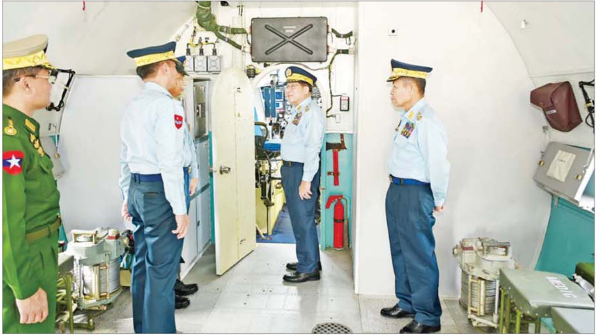
နိုင်ငံတော်လုံခြုံရေးနှင့် အေးချမ်းသာယာရေးကော်မရှင်ဥက္ကဋ္ဌ တပ်မတော်ကာကွယ်ရေးဦးစီးချုပ် ဗိုလ်ချုပ်မှူးကြီးမင်းအောင်လှိုင် တပ်တော်ဝင် လေယာဉ်တစ်စင်းပေါ်တွင် ကြည့်ရှုစစ်ဆေးစဉ်။

နေပြည်တော် နိုဝင်ဘာ ၇ တပ်မတော်(လေ)မှ လေယာဉ်/ရဟတ်ယာဉ်များ တပ်တော်ဝင်ခြင်း အခမ်းအနားကို ယနေ့ နံနက်ပိုင်းတွင် နေပြည်တော် လေတပ်စခန်း၌ ကျင်းပပြုလုပ်ရာ နိုင်ငံတော်လုံခြုံရေးနှင့် အေးချမ်းသာယာရေးကော်မရှင် ဥက္ကဋ္ဌ တပ်မတော်ကာကွယ်ရေးဦးစီးချုပ် ဗိုလ်ချုပ်မှူးကြီးမင်းအောင်လှိုင် တက်ရောက်ချီးမြှင့်သည်။ အဆိုပါ အခမ်းအနားသို့ နိုင်ငံတော်လုံခြုံရေးနှင့်အေးချမ်းသာယာရေးကော်မရှင် ဥက္ကဋ္ဌ ဗိုလ်ချုပ်မှူးကြီး မင်းအောင်လှိုင် နှင့်ဇနီး ဒေါ်ကြူကြူလှ၊ ကော်မရှင် ဒုတိယဥက္ကဋ္ဌ ဒုတိယတပ်မတော် ကာကွယ်ရေးဦးစီးချုပ် ကာကွယ်ရေးဦးစီးချုပ်(ကြည်း) ဒုတိယဗိုလ်ချုပ်မှူးကြီး စိုးဝင်းနှင့် ဇနီး ဒေါ်သန်းသန်းစွယ်၊ ညှိနှိုင်းကွပ်ကဲရေးမှူး (ကြည်း)ရေလေ ဗိုလ်ချုပ်ကြီး ကျော်စွာလင်းနှင့် ဇနီး၊ ကာကွယ်ရေးဦးစီးချုပ်(ရေ) ဗိုလ်ချုပ်ကြီး ထိန်ဝင်းနှင့် ဇနီး၊ စာမျက်နှာ ၃ သို့ ။