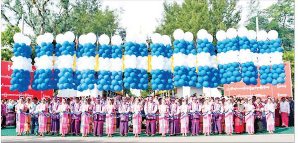
ပြည်ထောင်စုဝန်ကြီးများ၊ ကရင်ပြည်နယ်ဝန်ကြီးချုပ်၊ မွန်ပြည်နယ်ဝန်ကြီးချုပ်၊ အမျိုးသားကာကွယ်ရေးနှင့် လုံခြုံရေးကော်မီတီ၏ ဗဟိုအကြံပေးအဖွဲ့ အဖွဲ့ခေါင်းဆောင်နှင့်အဖွဲ့ဝင်များနှင့် တာဝန်ရှိသူများ၊ ပြည်နယ်ဝန်ကြီးများနှင့် တိုင်းရင်းသားလက်နက်ကိုင် ငြိမ်းချမ်းရေး အဖွဲ့အစည်းများမှ ကိုယ်စားလှယ်တို့က နှစ်(၇၀)ပြည့် ကရင်ပြည်နယ်နေ့အထိမ်းအမှတ် မှတ်တမ်းနှင့်အဖွဲ့ ချီးမြှင့်ငွေများကို ဖဲကြီးဖြတ်ဖွင့်လှစ်ပေးကြစဉ်။

ခန်းမ၌ ကျင်းပသည့် နှစ်(၇၀) ပြည့် ကရင်ပြည်နယ်နေ့ အထိမ်း အမှတ် ကရင်ပြည်နယ် ဂုဏ်ထူး ဆောင်လက်မှတ်နှင့် ဂုဏ်ထူး ဆောင်ဆုများ ချီးမြှင့်ပေးအပ်ပွဲ အခမ်းအနားသို့ တက်ရောက်ကြ ပြီး စီမံခန့်ခွဲရေး၊ စိုက်ပျိုးရေး၊ မွေးမြူရေး၊ ပညာရေး၊ သုတေသန၊ လူမှုရေးနှင့် အမျိုးဘာသာ၊ သာသနာဆိုင်ရာထူးချွန်ဆု စသည့် စုစုပေါင်း ဂုဏ်ထူးဆောင်ဆု ၈၆ ဆုကို ပေးအပ်ချီးမြှင့်ကြသည်။ ပေးအပ်ချီးမြှင့် ဆက်လက်၍ ပြည်ထောင်စု ဝန်ကြီးနှင့် အဖွဲ့ဝင်များသည် ကရင်ပြည်နယ် ဘားအံမြို့ အမှတ် (၅) ရပ်ကွက်ရှိ စိုက်ပျိုးရေးဝင်း၌ ကျင်းပသည့် နှစ်(၇၀)ပြည့် ကရင် ပြည်နယ်နေ့ အထိမ်းအမှတ် Avenue Park ပန်းခြံပွဲတွင် အခမ်း