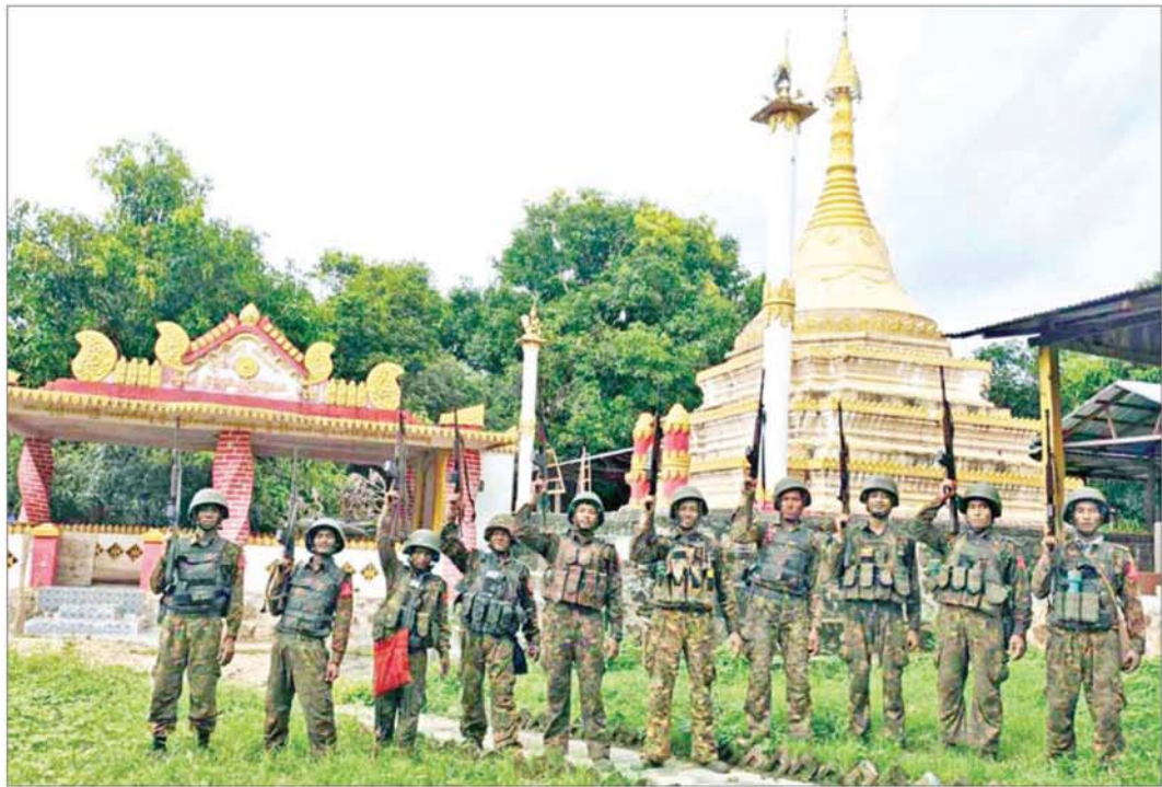
တပ်မတော်စစ်ကြောင်းများက PDF အမည်ခံအကြမ်းဖက်ပူးပေါင်းအဖွဲ့များ ခေတ္တထိန်းချုပ်ခဲ့သည့် ကျေးရွာများအား ပြန်လည်သိမ်းပိုက်ထိန်းချုပ်ခဲ့သည့် မှတ်တမ်းဓာတ်ပုံ။

နေပြည်တော် နိုဝင်ဘာ ၇ နိုင်ငံတော်ပျက်စီးရာ ပျက်စီးကြောင်းကို နည်းလမ်းမျိုးစုံဖြင့် အစဉ်တစိုက် ကြိုးပမ်းလုပ်ဆောင်နေသော CRPH၊ NUG အမည်ခံအကြမ်းဖက်အဖွဲ့အစည်းများသည် PDF အမည်ခံ အကြမ်းဖက်သမားများကို မွေးထုတ်ပေးကာ အစိုးရ၏အုပ်ချုပ်ရေးယန္တရားများ ပျက်စီးစေရန်နှင့် တိုင်းပြည်ဖွံ့ဖြိုးတိုးတက်မှုကို နှောင့်နှေးစေရန် ရည်ရွယ်၍ တိုင်းရင်းသား လက်နက်ကိုင်အဖွဲ့အချို့နှင့် ပူးပေါင်းကာ ၎င်းတို့အပေါ် အားပေးထောက်ခံမှုရရှိသည့် နိုင်ငံတော်က ပေးအပ်လာသော တာဝန်များကို ကျေပွန်စွာ ထမ်းဆောင်လျက်ရှိသော အစိုးရဝန်ထမ်းများ၊ ဆရာတော်၊ သံဃာတော်များနှင့် ဒေသခံပြည်သူများအား ခေါင်းစဉ်အမျိုးမျိုးတပ်၍ ဖမ်းဆီးနှိပ်စက်သတ်ဖြတ်ခြင်း၊ ပြည်သူများပိုင်ဆိုင်သည့် အဖိုးတန်ရန် အမြတ်တန်း သိမ်းဆည်းထားသော ပစ္စည်းများအား အတင်းအဓမ္မလုယက်ယူဆောင်ခြင်း၊ လက်နက်အားကိုး၍ ပြည်သူလူထုထံမှ အတင်းအဓမ္မ ဆက်ကြေးကောက်ခြင်း၊ လူသစ်စုဆောင်းခြင်း၊ တိုက်ပွဲဖြစ်ပွားရာ ဒေသများ၌ ဒေသခံပြည်သူများအား လူသားတိုင်းအဖြစ် အသုံးပြုခြင်းများ လုပ်ဆောင်လျက်ရှိသည့်အပြင် ဒေသခံပြည်သူများ၏ နေအိမ်များ၊ ဌာနဆိုင်ရာ အစိုးရအုပ်ချုပ်မှု အဆောက်အအုံများ၊ နိုင်ငံတော်၏ ပန်းပြောင်းတာဝန်များကို ထမ်းဆောင်ကြရမည့် ပညာတတ်လူငယ်လူရွယ်များအား မွေးထုတ်ပေးနေသည့် စာသင်ကျောင်းများ၊ တိုင်းပြည်ဖွံ့ဖြိုးတိုးတက်မှုကို တစ်ဖက်တစ်လမ်းမှ အထောက်အကူပြုနေသည့် စက်ရုံ၊ အလုပ်ရုံများနှင့် ပြည်သူများ စာမျက်နှာ ၈ သို့