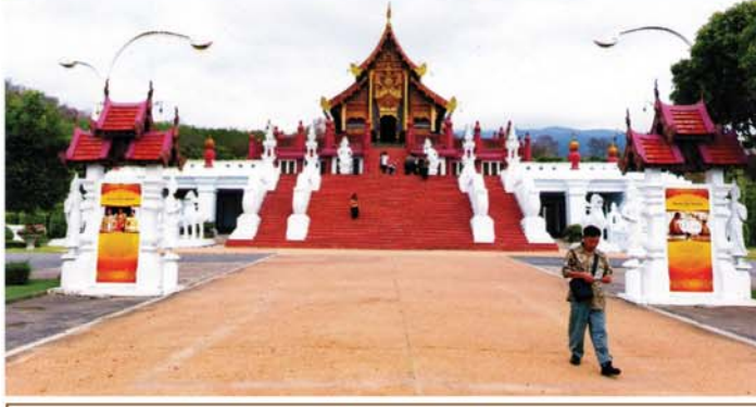
ချင်းမိုင်မြို့ တော်ဝင်မိမာန် (Royal Ravihan)။

တန်ဆာဆင်ကြသည်ကို တွေ့ရသည်။ ဤကား လန်နယဉ်ကျေးမှု ကူးစက်ခြင်း၏ ပြယုဂ်တစ်ခုပင် ဖြစ်သည်။)စကားချပ်။