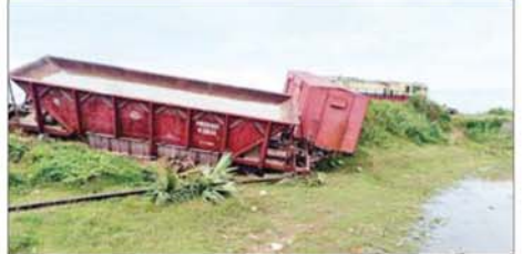
အကြမ်းဖက်သောင်းကျန်းသူအဖွဲ့၏ မိုင်းထောင်ဖောက်ခွဲမှုကြောင့် ပဲခူး-မော်လမြိုင်ရထားလမ်းပိုင်းအတွင်းရှိ သိမ်ဆိပ်နှင့် ဒုံဝန်းဘူတာအကြား (မိုင်တိုင်အမှတ် ၁၂၅/၁၉-၁၈) ကျောက်ရထားလမ်းချော့ကျမှုကို တွေ့ရစဉ်။

အဝင် စက်ခေါင်းနှင့် စက်ခေါင်းနောက် ကပ်လျက်တွဲသုံးတွဲလမ်းချော့ကျမှု ဖြစ်ပွားခဲ့သဖြင့် သိမ်ဆိပ်နှင့် ဒုံဝန်းအကြား ရထားလမ်းပိုင်းအား ယာယီပိတ်ထားခဲ့ရကြောင်း သိရသည်။ မိုင်းပေါက်ကွဲမှု ဖြစ်ပွားရာနေရာသို့ လုံခြုံရေးတပ်ဖွဲ့ဝင်များနှင့် နယ်မြေဒေသတာဝန်ရှိသူများက ယနေ့နံနက်ပိုင်းတွင် နယ်မြေ ရှင်းလင်းစစ်ဆေးခြင်းများဆောင်ရွက်ခဲ့ပြီး လမ်းပိုင်းအား အမြန်ဆုံးပြန်လည်ဖွင့်လှစ်နိုင်ရေးအတွက် မြန်မာ့မီးရထားဝန်ထမ်းများက လမ်းချော့ကျသောတွဲဆိုင်များအား ရှင်းလင်းဖယ်ရှားခြင်း၊ ပြတ်တောက်သွားသောသံလမ်းအား ဖြတ်တောက်လုပ်လယ်၍ အစားထိုးတပ်ဆင်ခြင်း