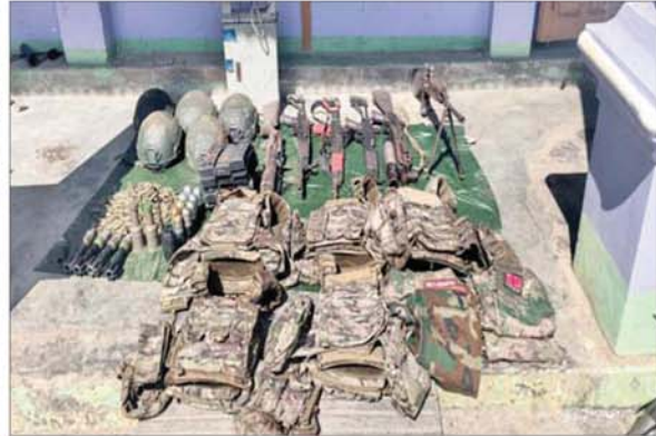
ဆည်တော်ကြီး ရေလှောင် တံခွန် ဝန်းကျင်ဒေသ တစ်ဝိုက်အား ပြန်လည် တိုက်ခိုက်သိမ်းပိုက်စဉ် PDF အမည်ခံ အကြမ်းဖက်သောင်း ကျန်းသူများထံမှ သိမ်းဆည်း ရရှိသည့် လက်နက်၊ ခဲယမ်းနှင့် ဆက်စပ်ပစ္စည်းများကို တွေ့ရ စဉ်။