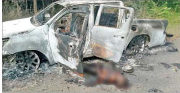
PDF အမည်ခံ အကြမ်းဖက်သမားများက သရက်မြို့ သရက်-ကံမလမ်း ပါးပွတ် ကျေးရွာအနီး၌ ယာဉ်တစ်စီးအား မိုင်းဆွဲတိုက်ခိုက်ခဲ့မှုကြောင့် အပြစ်မဲ့အရပ်သားပြည်သူ နှစ်ဦး မီးလောင်သေဆုံးခဲ့သည့် မှတ်တမ်းဓာတ်ပုံများ။

နေပြည်တော် နိုဝင်ဘာ ၇ အကြမ်းဖက်သမားများအနေဖြင့် နိုင်ငံတော်တည်ငြိမ်ရေးနှင့် တရားဥပဒေစိုးမိုးရေးလုပ်ငန်းများကို အနှောင့်အယှက်ဖြစ်စေရန်၊ အရပ်သားပြည်သူများအား ကြောက်ရွံ့ထိတ်လန့်မှုများ ဖြစ်ပေါ်စေရန် အတွက် အကြမ်းဖက်မှုလုပ်ရပ်များကို နည်းလမ်းပေါင်းစုံဖြင့် လုပ်ဆောင် လျက်ရှိကြရာ နိုဝင်ဘာ ၆ ရက် နံနက်ပိုင်းတွင် မကွေးတိုင်းဒေသကြီး သရက်မြို့ရှိ သရက်-ကံမကားလမ်းအတိုင်း အရပ်သားပြည်သူများ မောင်းနှင်လာသည့်ယာဉ်အား PDF အမည်ခံ အကြမ်းဖက်သမားများက မိုင်းဆွဲတိုက်ခိုက်ခဲ့သဖြင့် ယာဉ်ပေါ်ရှိ အပြစ်မဲ့အရပ်သားပြည်သူ အမျိုးသား နှစ်ဦး မီးလောင်သေဆုံးခဲ့ကြောင်း သိရသည်။