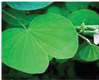
ရွယ်တော်

ရွယ်တော်ပင်၏ ရုက္ခဗေဒအမည်မှာ Bauhinia Acuminata L. ဖြစ်ပြီး မျိုးရင်း Fabaceae တွင် ပါဝင်သည်။