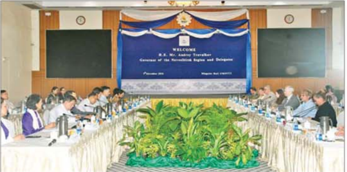
ရုရှားဖက်ဒရေးရှင်းနိုင်ငံ နိုဗိုဗစ်ဗစ်ဒေသအုပ်ချုပ်ရေးမှူး H.E.Mr. Andrey Aleksandrovich Travnikov နှင့် ပြည်ထောင်စုသမ္မတမြန်မာနိုင်ငံ ကုန်သည်များနှင့် စက်မှုလက်မှုလုပ်ငန်းရှင်များအသင်းချုပ်ဥက္ကဋ္ဌ ဦးအေးဝင်းတို့ တွေ့ဆုံဆွေးနွေးစဉ်။

ရန်ကုန် နိုဝင်ဘာ ၅ ထို့နောက် နိုဗိုဗစ်ဗစ်ဒေသ အုပ်ချုပ်ရေးမှူးနှင့် အဖွဲ့သည် ရန်ကုန်တိုင်းဒေသကြီးအစိုးရရုံး အစည်းအဝေးခန်းမ၌ တိုင်းဒေသကြီးဝန်ကြီးချုပ် ဦးစိုးသိန်းနှင့် တွေ့ဆုံပြီး ဒေသပွဲပြီးတိုင်းတက် ရေးနှင့် ရင်းနှီးမြှုပ်နှံရေးဆိုင်ရာ ကိစ္စရပ်များကို ဆွေးနွေးကာ အမှတ် တရ လက်ဆောင်ပစ္စည်းများ အပြန်အလှန်ပေးအပ်ကြသည်။ ဆက်လက်၍ ပြည်ထောင်စု သမ္မတမြန်မာနိုင်ငံ ကုန်သည်များနှင့် စက်မှုလက်မှုလုပ်ငန်းရှင်များအသင်းချုပ်ရုံး၊ မင်္ဂလာဒုံခန်းမ၌ မြန်မာနိုင်ငံ ကုန်သည်များနှင့် စက်မှုလက်မှု လုပ်ငန်းရှင်များအသင်းချုပ်ဥက္ကဋ္ဌ ဦးအေးဝင်း၊ အထွေထွေ အတွင်းရေးမှူးနှင့် အမှုဆောင် အဖွဲ့ဝင်များနှင့် တွေ့ဆုံပြီး စီးပွားရေးဆိုင်ရာများနှင့် ရင်းနှီးမြှုပ်နှံမှုဆိုင်ရာ ကိစ္စရပ်များကို ဆွေးနွေးကြသည်။ ရုရှားဖက်ဒရေးရှင်းနိုင်ငံ နိုဗိုဗစ်ဗစ်ဒေသအုပ်ချုပ်ရေးမှူး H.E.Mr. Andrey Aleksandrovich Travnikov နှင့် ပြည်ထောင်စုသမ္မတမြန်မာနိုင်ငံ ကုန်သည်များနှင့် စက်မှုလက်မှုလုပ်ငန်းရှင်များအသင်းချုပ်ဥက္ကဋ္ဌ ဦးအေးဝင်းတို့ တွေ့ဆုံဆွေးနွေးစဉ်။