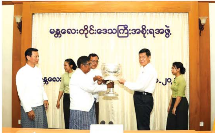
မန္တလေး နိုဝင်ဘာ ၅

၂၀၂၅ ခုနှစ်၊ မာရဝိဇယဗုဒ္ဓရုပ်ပွားတော်မြတ်ကြီး တန်ဆောင်တိုင်ပွဲတော် မသိုးရွှေကြာသင်္ကန်း ရက်လုပ်ပူဇော်ပွဲတွင် (၂)နှစ်ဆက်တိုက် ပထမဆုရရှိသည့် မန္တလေးတိုင်းဒေသကြီးကိုယ်စားပြု အမရရွှေပြည်ရက်ကန်းစင်အသင်းအား ဂုဏ်ပြုပွဲအခမ်းအနားကို ယနေ့မုန်းလွဲပိုင်းက မန္တလေးတိုင်း ဒေသကြီးအစိုးရအဖွဲ့ရုံးအစည်းအဝေးခန်းမတွင် ကျင်းပသည်။ အခမ်းအနား၌ မန္တလေးတိုင်းဒေသကြီးအစိုးရအဖွဲ့ ဝန်ကြီးချုပ် ဦးမျိုးအောင်က ဂုဏ်ပြု အမှာစကားပြောကြားရာတွင် ယခုလို ပထမဆုအား ၂ နှစ်ဆက်တိုက် ဆွတ်ခူးရရှိသည့်အပေါ် များစွာဂုဏ်ယူဝမ်းမြောက်ပါကြောင်း၊ ရက်လုပ်ပူဇော်ပွဲ အသင်းဝင်များ၏ တစ်ဦးတစ်ယောက်ချင်း မှအဖွဲ့လိုက် စည်းလုံးညီညွတ်မှုအင်အားဖြင့် တက်ညီလက်ညီဆောင်ရွက်ခဲ့မှု၏ ရလဒ်ကောင်း များဖြစ်ပါကြောင်း၊ မြန်မာ့ရိုးရာယဉ်ကျေးမှုအမွေ ဆက်လက်ရှင်သန်နေဆောင် လက်ဆင့်ကမ်းယူဆောင်