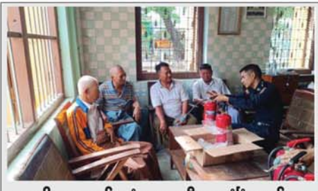
သာသနိကအဆောက်အအုံများအား မီးဘေးလုံခြုံရေးစစ်ဆေး

အရလည်းကောင်း၊ မြစ်ကြီးနားမြို့ ကျွန်းပင်သာရပ်ကွက်နှင့် ရွှေညောင်ပင်ရပ်ကွက်တို့ရှိ ဂိုဏ်းနှစ်လုံးအတွင်းမှ တရားဝင်စာရွက်စာတမ်းအထောက်အထားတင်ပြနိုင်ခြင်းမရှိသည့် လူသုံးကုန်ပစ္စည်းသုံးမျိုးကို အကောက်ခွန်လုပ်ထုံးလုပ်နည်းများအရလည်းကောင်း အမှုတွဲဖွင့်လှစ်ထားသည်။ ထို့အပြင် မန္တလေးတိုင်းဒေသကြီး တရားမဝင်ကုန်သွယ်မှုတိုက်ဖျက်ရေးအထူးအဖွဲ့၏ စီမံခန့်ခွဲမှုဖြင့် တာဝန်ကျပူးပေါင်းအဖွဲ့များက စစ်ဆေးမှုများဆောင်ရွက်ခဲ့ရာ အောက်တိုဘာ ၂၂ ရက်နှင့် ၂၇ ရက်တို့တွင် မဟာအောင်မြေမြို့နယ်နှင့် အမရပူရမြို့နယ်တို့