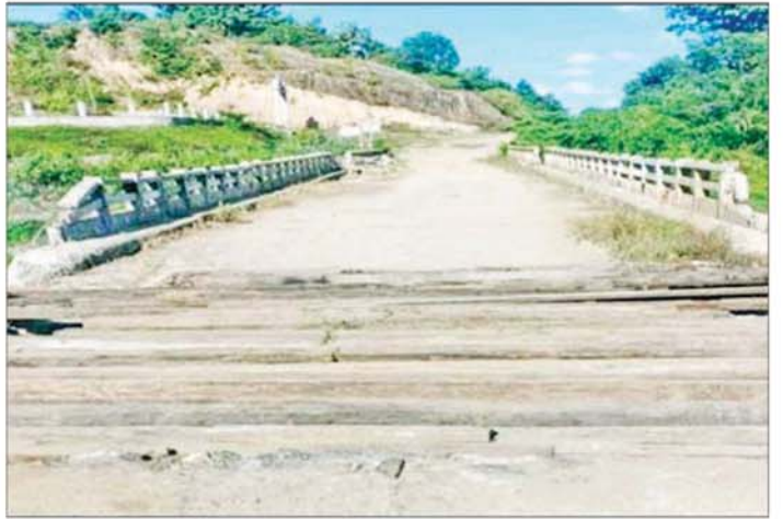
PDF အမည်ခံ အကြမ်းဖက်သမားများ၏ မီးရှို့ဖျက်ဆီးမှုကြောင့် ပျက်စီးသွားသည့် ကလေး-မော်လိုက်သွား ကားလမ်းမပေါ်ရှိ ပလူစတိတ်တားအား လုံခြုံရေးတပ်ဖွဲ့ဝင်များက ပြန်လည်ပြုပြင်ပေးခဲ့သည့် မှတ်တမ်းဓာတ်ပုံ။