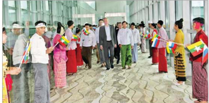
ရုရှားဖက်ဒရေးရှင်းနိုင်ငံ နိုဗိုဗစ်ဗစ်ဒေသအုပ်ချုပ်ရေးမှူး H.E.Mr. Andrey Aleksandrovich Travnikov နှင့်အဖွဲ့အား ရန်ကုန်တိုင်းဒေသကြီး ဝန်ကြီးချုပ်နှင့် တာဝန်ရှိသူများက ရန်ကုန်အပြည်ပြည်ဆိုင်ရာလေဆိပ်၌ ပို့ဆောင်နှုတ်ဆက်ကြစဉ်။

ရန်ကုန် နိုဝင်ဘာ ၅ ထို့နောက် နိုဗိုဗစ်ဗစ်ဒေသ အုပ်ချုပ်ရေးမှူးနှင့် အဖွဲ့သည် ရန်ကုန်တိုင်းဒေသကြီးအစိုးရရုံး အစည်းအဝေးခန်းမ၌ တိုင်းဒေသကြီးဝန်ကြီးချုပ် ဦးစိုးသိန်းနှင့် တွေ့ဆုံပြီး ဒေသပွဲပြီးတိုင်းတက် ရေးနှင့် ရင်းနှီးမြှုပ်နှံရေးဆိုင်ရာ ကိစ္စရပ်များကို ဆွေးနွေးကာ အမှတ် တရ လက်ဆောင်ပစ္စည်းများ အပြန်အလှန်ပေးအပ်ကြသည်။ ဆက်လက်၍ ပြည်ထောင်စု သမ္မတမြန်မာနိုင်ငံ ကုန်သည်များနှင့် စက်မှုလက်မှုလုပ်ငန်းရှင်များအသင်းချုပ်ရုံး၊ မင်္ဂလာဒုံခန်းမ၌ မြန်မာနိုင်ငံ ကုန်သည်များနှင့် စက်မှုလက်မှု လုပ်ငန်းရှင်များအသင်းချုပ်ဥက္ကဋ္ဌ ဦးအေးဝင်း၊ အထွေထွေ အတွင်းရေးမှူးနှင့် အမှုဆောင် အဖွဲ့ဝင်များနှင့် တွေ့ဆုံပြီး စီးပွားရေးဆိုင်ရာများနှင့် ရင်းနှီးမြှုပ်နှံမှုဆိုင်ရာ ကိစ္စရပ်များကို ဆွေးနွေးကြသည်။ ရုရှားဖက်ဒရေးရှင်းနိုင်ငံ နိုဗိုဗစ်ဗစ်ဒေသအုပ်ချုပ်ရေးမှူး H.E.Mr. Andrey Aleksandrovich Travnikov နှင့် ပြည်ထောင်စုသမ္မတမြန်မာနိုင်ငံ ကုန်သည်များနှင့် စက်မှုလက်မှုလုပ်ငန်းရှင်များအသင်းချုပ်ဥက္ကဋ္ဌ ဦးအေးဝင်းတို့ တွေ့ဆုံဆွေးနွေးစဉ်။