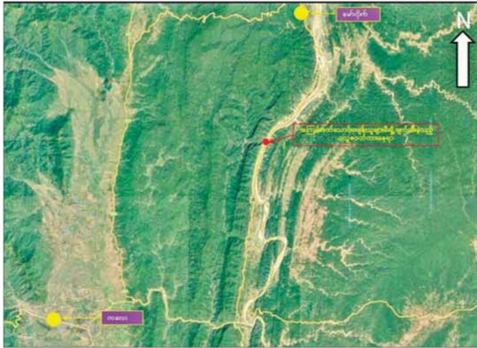
စစ်ကိုင်းတိုင်းဒေသကြီး ကလေး-မော်လိုက်သွား ကားလမ်းမပေါ်ရှိ ပလူစတိတ်တားအား PDF အမည်ခံ အကြမ်းဖက်သောင်းကျန်းသူများက မီးရှို့ဖျက်ဆီးခဲ့သည့် ဖြစ်စဉ်နေရာပြပုံ။