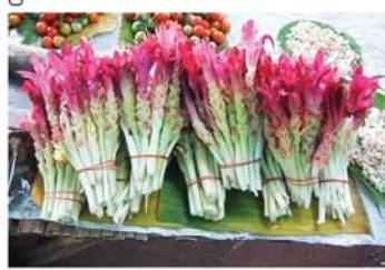
မာလာပွား

မီးယပ်ရောဂါအတွက် လက်ပံခေါက်ပြုတ်ပြီး သောက်ပေးပါ။