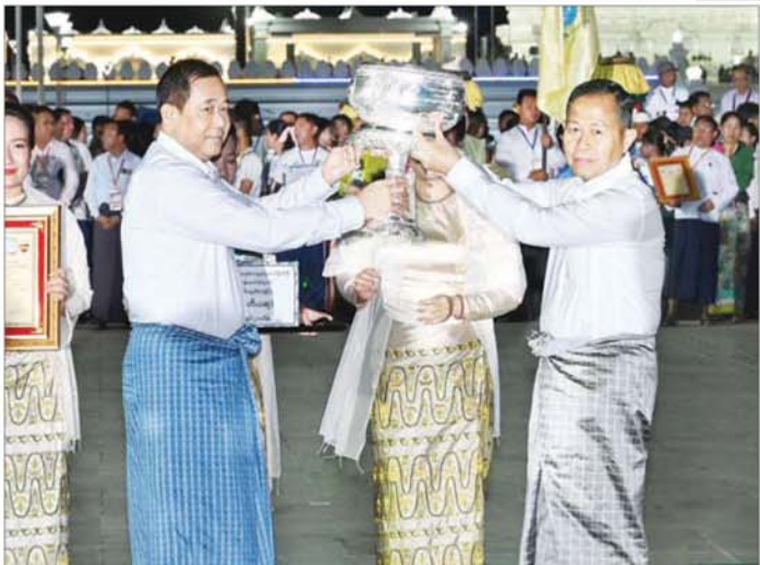
ကော်မရှင်ဒုတိယဥက္ကဋ္ဌ ဒုတိယဗိုလ်ချုပ်မှူးကြီး စိုးဝင်း ညမီးကြီး(ညမီးကျည်)မီးပုံးပျံလွှတ်တင် ပူဇော်ပြိုင်ပွဲ တွင် ဒုတိယဆုရရှိသည့် ပြည်ထဲရေးဝန်ကြီးဌာနကိုယ်စားပြုအသင်းအား ဆုပေးချီးမြှင့်စဉ်။