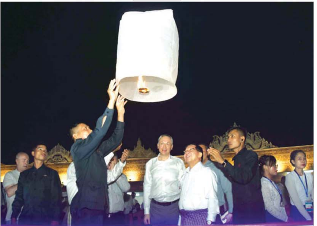
ပြည်ထောင်စုသမ္မတ မြန်မာနိုင်ငံတော် ယာယီသမ္မတ နိုင်ငံတော်လုံခြုံရေးနှင့် အေးချမ်းသာယာရေးကော်မရှင်ဥက္ကဋ္ဌ ဗိုလ်ချုပ်မှူးကြီး မင်းအောင်လှိုင်နှင့် ရုရှားဖက်ဒရေးရှင်းနိုင်ငံ နိုဗိုစီဗစ်ဒေသအုပ်ချုပ်ရေးမှူးတို့ ရုရှား- မြန်မာ ချစ်ကြည်ရေးအထိမ်းအမှတ် မီးပုံးပျံများ လွှတ်တင်ကြစဉ်။

ယင်းနောက် ဆုပေးပွဲအခမ်းအနားကို ကျင်းပ ပြုလုပ်ရာ ကော်မရှင်အဖွဲ့ဝင်များက ညမီးကြီး (ညမီးကျည်)၊ စိန်နားပန် မီးပုံးပျံလွှတ်တင်ပူဇော် ပြိုင်ပွဲနှင့် မသိုးရွှေကြာသက်နိုး ရက်လုပ်ပူဇော်ပြိုင်ပွဲ တို့တွင် စည်းကမ်းလိုက်နာမှု အကောင်းဆုံးဆုများနှင့် အဖွဲ့လိုက် စည်းကမ်းအကောင်းဆုံးဆု၊ စက္ခုပညာဒ အကောင်းဆုံးဆုများနှင့် အဖွဲ့လိုက် သင်္ကန်းအား ကြည်ညိုဖွယ်ရာဖြစ်အောင် ဖန်တီးမှုအကောင်းဆုံး ဆု၊ ဆန်းသစ်တီထွင်မှု အကောင်းဆုံးဆုများနှင့် အဖွဲ့လိုက်ဝတ်စားဆင်ယင်မှု အကောင်းဆုံးဆု၊ မီးပုံးပျံအတက် အကောင်းဆုံးဆုများနှင့် အဖွဲ့လိုက် ချိတ်ဆက်ယှဉ်ပြိုင်မှုအကောင်းဆုံးဆု၊ မီးပုံးပျံ စာမျက်နှာ ၈ သို့