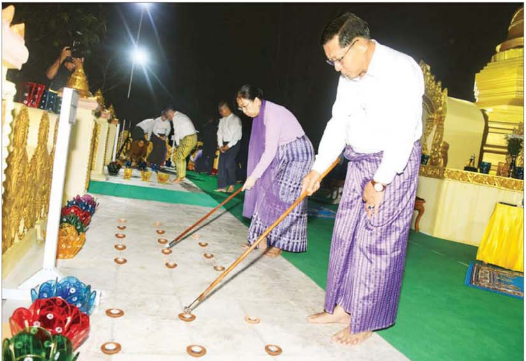
နိုင်ငံတော်လုံခြုံရေးနှင့် အေးချမ်းသာယာရေးတော်မရင်ဥက္ကဋ္ဌ တပ်မတော်ကာကွယ်ရေးဦးစီးချုပ် ဗိုလ်ချုပ်မှူးကြီး မင်းအောင်လှိုင်နှင့် ဇနီး ဒေါ်ကြူကြူလှ တန်ဆောင်မုန်းလပြည့် သာမညဖလအခါတော်နေ့၊ တန်ဆောင်တိုင်မီးထွန်းပွဲတော်ကို ပျော်ရွှင်ကြည်နူးစွာ ဆင်နွှဲကြစဉ်။

ထိုသို့ မြန်မာ့ယဉ်ကျေးမှုပွဲတော်ကို ထိန်းသိမ်းဆင်နွှဲလျက်ရှိကြရာ နေပြည်တော်ကောင်စီနယ်မြေ၊ ဧယျာသီရိမြို့နယ်အတွင်းရှိ ရွှေဘုန်းပွင့်စေတီတော် မြတ်ကြီးတွင်လည်း ယနေ့ညပိုင်းတွင် နိုင်ငံတော်လုံခြုံရေးနှင့် အေးချမ်းသာယာရေးတော်မရင်ဥက္ကဋ္ဌ တပ်မတော်ကာကွယ်ရေးဦးစီးချုပ် ဗိုလ်ချုပ်မှူးကြီး မင်းအောင်လှိုင်နှင့် ဇနီး ဒေါ်ကြူကြူလှ၊ ကော်မရှင်ဒုတိယဥက္ကဋ္ဌ ဒုတိယတပ်မတော်ကာကွယ်ရေးဦးစီးချုပ် ကာကွယ်ရေးဦးစီးချုပ်(ကြည်း) ဒုတိယဗိုလ်ချုပ်မှူးကြီး စိုးဝင်းနှင့် ဇနီး ဒေါ်သန်းသန်းနွယ်၊ ကော်မရှင်အဖွဲ့ဝင် အမှုဆောင်ချုပ် ဦးအောင်လင်းဌေးနှင့်ဇနီး၊ ကော်မရှင်အတွင်းရေးမှူး တွဲဖက်အမှုဆောင်ချုပ် ဗိုလ်ချုပ်ကြီး ရဲဝင်းဦးနှင့် ဇနီး၊ ကော်မရှင်အဖွဲ့ဝင် ညှိနှိုင်းကွပ်ကဲရေးမှူး(ကြည်း) ရေ(လေ) ဗိုလ်ချုပ်ကြီး ကျော်စွာလင်းနှင့် ဇနီး၊ ပြည်ထောင်စုအဆင့် ပုဂ္ဂိုလ်များနှင့် ဇနီးများ၊ ပြည်ထောင်စုဝန်ကြီးများနှင့် ဇနီးများ၊ ကာကွယ်ရေးဦးစီးချုပ်မှူးမှ အဆင့်မြင့်