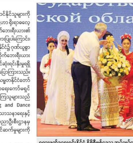
ရုရှားဖက်ဒရေရှင်းနိုင်ငံ နိုဗိုဗစ်ဗေဒ အုပ်ချုပ်ရေးမှူး H.E. Mr. Andrey Aleksandrovich Travnikov က အနုပညာဦးစီးဌာနမှ အနုပညာရှင်များအား ဂုဏ်ပြုပေးခြင်း ပေးအပ်စဉ်။

ဆိုက်ဘေးရီးယား၏ ပထမဆုံးအောင်နိုင်သူများကို ကိုယ်စားပြုပါကြောင်း၊ အဆိုပါ အဖွဲ့မှာ ရိုးရာဓလေ့များကို ဂုဏ်တစိုက် ထိန်းသိမ်းပြီး ဆိုက်ဘေးရီးယား၏ သီချင်းနှင့် ဂီတအမွေအနှစ်ကို ကိုယ်စားပြုပါကြောင်း၊ ယနေ့တွင် မိမိတို့အနေဖြင့် မြန်မာနိုင်ငံ၌ ဂုဏ်ယူစွာ ဖျော်ဖြေ တင်ဆက်ပေးမည်ဖြစ်ပြီး ဆိုက်ဘေးရီးယား ယဉ်ကျေးမှု၊ အနုပညာနှင့် အပျော်ရွှင်ဆုံးရင်းနှီးမှုရရှိပါစေရန် ဆုတောင်းအပ်ပါကြောင်း ပြောကြားသည်။ ဆက်လက်၍ နိုင်ငံတော်ယာယီသမ္မတ နိုင်ငံတော်လုံခြုံရေးနှင့် အေးချမ်းသာယာရေးကော်မရှင်ဥက္ကဋ္ဌနှင့်ဇနီး၊ တက်ရောက်လာကြသူများသည် နိုဗိုဗစ်ဗေဒ Chaldony State Song and Dance Ensemble အဖွဲ့မှ အနုပညာရှင်များ၊ သာသနာရေးနှင့် ယဉ်ကျေးမှုဝန်ကြီးဌာန အနုပညာဦးစီးဌာနမှ အနုပညာရှင်များ၏ ဖျော်ဖြေတင်ဆက်မှုများကို ကြည့်ရှုအားပေးကြသည်။