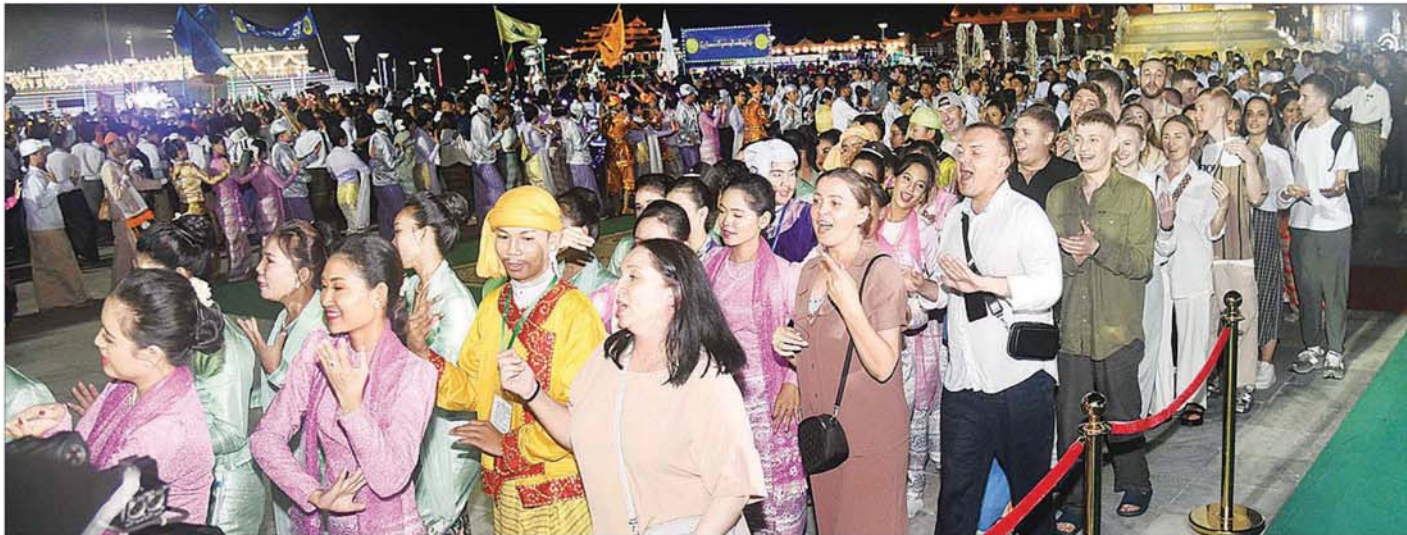
ရုရှားဖက်ဒရေရှင်းနိုင်ငံ နိုမိုစီဗစ်ဒေသမှ စည်သည်တော်များ ပြိုင်ပွဲဝင်အသင်းများမှ ဝိုင်းရံယဉ်ကျေးမှုအဖွဲ့များနှင့်အတူ လတ်တီးတေးသီချင်းဖြင့် အတူတကွ ပျော်ရွှင်စွာ ပါဝင်ဆင်နွှဲကြစဉ်။