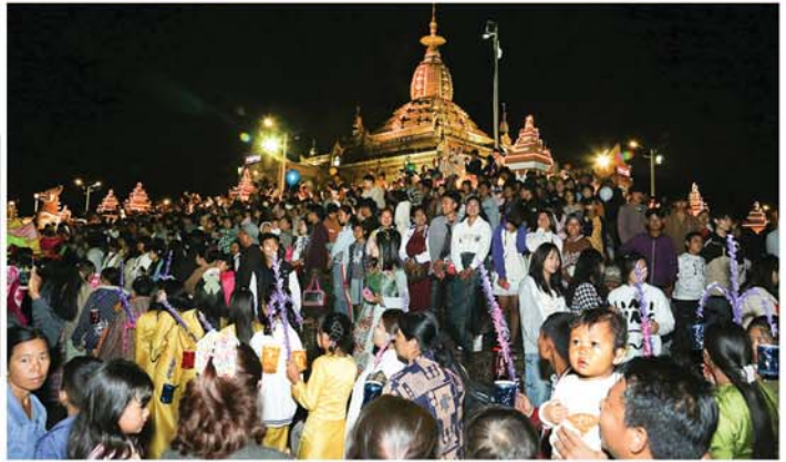
မန္တလေး နိုဝင်ဘာ ၄

ပြင်ဦးလွင်မြို့ တန်ဆောင်တိုင်ပွဲတော်ကို ပြင်ဦးလွင်မြို့ ဓမ္မရတီကုန်းတော်ပေါ်၌ တည်ထား ကိုးကွယ်လက်ရှိသော မဟာအံ့ထူးကံသာ ဆုတောင်းပြည့်ဘုရားစေတီရင်ပြင်တော်တွင် ဆီမီး ၉၀၀၀ ထွန်းညှိပူဇော်ပွဲနှင့် မြန်မာ့ရိုးရာမီးပုံးပျံ လွှတ်တင်ပူဇော်ပွဲအခမ်းအနားကို ယနေ့ညပိုင်းက မဟာအံ့ထူး ကံသာဆုတောင်းပြည့်ဘုရားရင်ပြင်တော်နှင့် သာသနာ့ဗိမာန်တော်ဝင်းအတွင်း စည်ကားသိုက်မြိုက်စွာ ကျင်းပသည်။