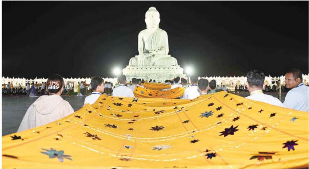
သာသနာရေးနှင့်ယဉ်ကျေးမှုဝန်ကြီးဌာနနှင့် တိုင်းဒေသကြီး၊ ပြည်နယ်များမှ တာဝန်ရှိပုဂ္ဂိုလ်များက မသိုးရွှေကြာသက်နိုးတော် ၁၅ ထည်ကို ဒေဝါဝင်း၊ ရာဇာဝင်းများ ခြံရံ၍ ရေပန်းရင်ပြင်တော်မှ မာရဝိဇယဗုဒ္ဓရုပ်ပွားတော်မြတ်ကြီးရင်ပြင်တော်သို့ ပင့်ဆောင်စဉ်။

ဦးစွာ အခမ်းအနားကို “နမောတဿ” သုံးကြိမ် ရွတ်ဆို ဘုရားရှိခိုး၍ ဖွင့်လှစ်ကြပြီး “ဗုဒ္ဓသာရဏံ ကစ္ဆာမိ” အစချီသည့် အရိယာသာဝိတို့ ဂါထာတော်ကို သံပြိုင်ညီညာ သုံးကြိမ်ရွတ်ဆို ပူဇော်ကြသည်။ ထို့နောက် သာသနာရေးနှင့်ယဉ်ကျေးမှုဝန်ကြီးဌာန နှင့် တိုင်းဒေသကြီး၊ ပြည်နယ်များမှ တာဝန်ရှိပုဂ္ဂိုလ် များက မသိုးရွှေကြာသက်နိုးတော် ၁၅ ထည်ကို ဒေဝါဝင်း၊ ရာဇာဝင်းများ ခြံရံ၍ ရေပန်းရင်ပြင်တော်မှ မာရဝိဇယဗုဒ္ဓရုပ်ပွားတော်မြတ်ကြီး ရင်ပြင်တော် သို့ ပင့်ဆောင်ကြပြီး ဗုဒ္ဓရုပ်ပွားတော်မြတ်ကြီးအား လက်ယာရစ်လှည့်လည်ကာ ဆက်ကပ်ပူဇော်မည့် နေရာသို့ ပင့်ဆောင်ကြသည်။ ထိုသို့ပင့်ဆောင်နေချိန် ၌ ဝတ်အသင်းအဖွဲ့များက ဘုရားဂုဏ်တော်ကိုးပါး ပါဠိကို ရွတ်ဆိုပူဇော်ကြသည်။