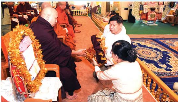
မန္တလေး နိုဝင်ဘာ ၄

မန္တလေးတိုင်းဒေသကြီးအစိုးရအဖွဲ့၏ ပဉ္စမအကြိမ် စုပေါင်းမိုးကျကထိန်အလှူတော်မင်္ဂလာ အခမ်းအနားကို ယနေ့မုန်းလွဲပိုင်းက အောင်မြေသာစံမြို့နယ်ရှိ မဟာအတုလဝေယန်(အတုမရှိ) ကျောင်းတော်ကြီး၌ ကျင်းပရာ မန္တလေးတိုင်းဒေသကြီး သံဃနာယကအဖွဲ့ဥက္ကဋ္ဌ(သုဓမ္မာ)၊ မဟာ အောင်မြေမြို့နယ် မစိုးရိမ်တိုက်သစ်၊ ဓမ္မဂါရဝကျောင်းဆရာတော် အဂ္ဂမဟာဂန္ထဝါစကပဏ္ဍိတ ဘဒ္ဒန္တတိက္ခိယာဘိဝံသ ဆရာတော်ကြီး အမှူးပြုသော ပင့်သံဃာတော်များနှင့် ကထိန်ခံဆရာတော်၊ သံဃာတော်များ ကြွရောက်ချီးမြှင့်တော်မူကြသည်။