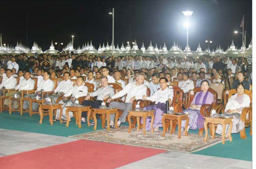
ပြည်ထောင်စုသမ္မတမြန်မာနိုင်ငံတော် ယာယီသမ္မတ နိုင်ငံတော်လုံခြုံရေးနှင့် အေးချမ်းသာယာရေးကော်မရှင်ဥက္ကဋ္ဌ ဗိုလ်ချုပ်မှူးကြီး မင်းအောင်လှိုင်နှင့် ဇနီး ဒေါ်ကြာကြာလှ၊ ရုရှားဖက်ဒရေးရှင်းနိုင်ငံ နိုဗိုစစ်ဒေသအုပ်ချုပ်ရေးမှူးနှင့် တက်ရောက်လာကြသူများ ညစီးကြီးမီးပုံးပျံလွှတ်တင်ပူဇော်ယှဉ်ပြိုင်ပွဲကို ကြည့်ရှုအားပေးကြစဉ်။