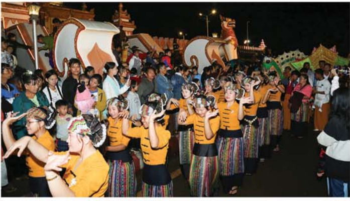
(မန္တလေးနေ့စဉ်)

ဖြင့် လွှတ်တင်ပူဇော်နေမှုများ ရိုးရာအကအလှများဖြင့် ပျော်ရွှင်မြူးတူးကပြနေမှုများကို ကြည့်ရှု အားပေးပြီး မီးပုံးပျံလွှတ်တင်ပူဇော်ပွဲတွင် ပါဝင်ဆင်နွှဲခဲ့ကြသည့် အသင်းများအား ဂုဏ်ပြုငွေများ ချီးမြှင့်ခဲ့ကြောင်း၊ ပွဲတော်လာစည်ပရိသတ်များ၊ ဒေသခံပြည်သူများ၊ အနယ်နယ်အရပ်ရပ်မှ ဘုရားဖူး လာသူများ စုစုပေါင်းအင်အား ၅၀၀၀၀ ခန့်ရှိကြောင်း၊ တန်ဆောင်တိုင်ကာလတွင် ပြင်ဦးလွင် မြို့နယ်အတွင်းရှိ တန်ခိုးကြီးဘုရားများ၊ စေတီများ၊ အထင်ကရနေရာများတွင် ပွဲတော်များဖြင့် စည်ကားသိုက်မြိုက်ခဲ့ပြီး အေးချမ်းပျော်ရွှင်စွာဖြင့် ဆင်နွှဲခဲ့ကြကြောင်း သိရသည်။