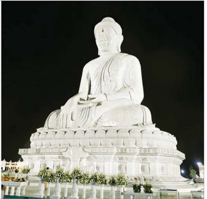
ပြည်ထောင်စုသမ္မတမြန်မာနိုင်ငံတော် ယာယီသမ္မတ နိုင်ငံတော်လုံခြုံရေးနှင့်အေးချမ်းသာယာရေးကော်မရှင်ဥက္ကဋ္ဌ ဗိုလ်ချုပ်မှူးကြီး မင်းအောင်လှိုင် မာရဝိဇယဗုဒ္ဓရုပ်ပွားတော်မြတ်ကြီးအား ဖူးမြော်ကြည့်ညို၍ နေ့ပြည်တော်ကောင်စီအပါအဝင် တိုင်းဒေသကြီးနှင့် ပြည်နယ်ကိုယ်စားပြု ရက်ကန်းအဖွဲ့ ၁၅ ဖွဲ့မှ ရက်လုပ်စပ်ချုပ်သီလွမ်းထားသည့် မသိုးရွှေကြာသင်္ကန်းတော် ၁၅ ထည်ကို ဆက်ကပ်လှူဒါန်းစဉ်။