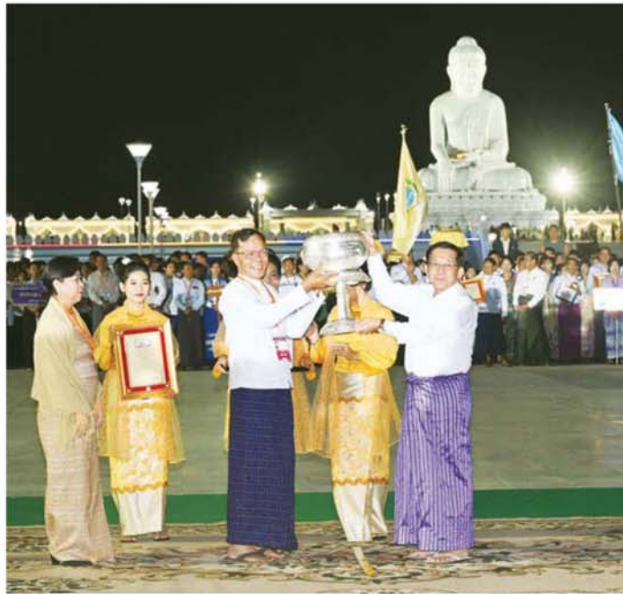
ပြည်ထောင်စုသမ္မတ မြန်မာနိုင်ငံတော် ယာယီသမ္မတ နိုင်ငံတော်လုံခြုံရေးနှင့် အေးချမ်းသာယာရေး ကော်မရှင်ဥက္ကဋ္ဌ ဗိုလ်ချုပ်မှူးကြီး မင်းအောင်လှိုင် မသိုးရွှေကြာသက်နန်းရက်လုပ်ပူဇော်ပြိုင်ပွဲတွင် ပထမဆု ရရှိသည့် မန္တလေးတိုင်းဒေသကြီးကိုယ်စားပြု အမရရွှေပြည်ရက်ကမ်းစင်အသင်းအား ဆုပေးပေး ချီးမြှင့်စဉ်။

ယင်းနောက် နိုင်ငံတော်ယာယီသမ္မတ နိုင်ငံတော် လုံခြုံရေးနှင့် အေးချမ်းသာယာရေးကော်မရှင်ဥက္ကဋ္ဌ က ညမီးကြီး(ညမီးကျည်)မီးပုံးပျံလွှတ်တင် ပူဇော် ပြိုင်ပွဲတွင် ပထမဆုရရှိသည့် နေပြည်တော်စည်ပင် သာယာရေးကော်မတီကိုယ်စားပြုအသင်း၊ စိန်နားပန်း မီးပုံးပျံလွှတ်တင်ပူဇော်ပြိုင်ပွဲတွင် ပထမဆုရရှိသည့် လူမှုဝန်ထမ်း၊ ကယ်ဆယ်ရေးနှင့် ပြန်လည်နေရာ ချထားရေးဝန်ကြီးဌာန ကိုယ်စားပြုအသင်းနှင့် မသိုးရွှေကြာသက်နန်း ရက်လုပ်ပူဇော်ပြိုင်ပွဲတွင်