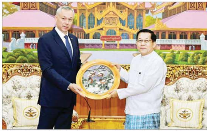
ပြည်ထောင်စုသမ္မတမြန်မာနိုင်ငံတော် ယာယီသမ္မတ နိုင်ငံတော်လုံခြုံရေးနှင့် အေးချမ်းသာယာရေးကော်မရှင်ဥက္ကဋ္ဌ ဝိုလ်ချုပ်မှူးကြီး မင်းအောင်လှိုင်နှင့် ရုရှားဖက်ဒရေရှင်းနိုင်ငံ နိုဗိုဗစ်ဗေဒအုပ်ချုပ်ရေးမှူး H.E. Mr. Andrey Aleksandrovich Travnikov တို့ လက်ဆောင်ပစ္စည်းများ အပြန်အလှန်ပေးအပ်စဉ်။

အနေဖြင့် ဒီမိုကရေစီလမ်းကြောင်းပေါ်တွင် ဆက်လက်လျှောက်လှမ်းသွားမည်ဖြစ်သည့် အခြေအနေများ၊ ရုရှားဖက်ဒရေရှင်းနိုင်ငံနှင့် နိုဗိုဗစ်ဗေဒအဖွဲ့အကြား ပူးပေါင်းဆောင်ရွက်မှုများကို ပိုမိုခိုင်မာစေခဲ့ပြီး အောင်မြင်သည့်ခရီးစဉ်တစ်ခုဖြစ်ခဲ့သည့် အခြေအနေများနှင့် ရွေးကောက်ပွဲကို အားပေးထောက်ခံလျက်ရှိသည့် အခြေအနေများနှင့် ပတ်သက်၍ ခင်မင်ရင်းနှီးစွာ အမြင်ချင်းဖလှယ်ဆွေးနွေးခဲ့ကြသည်။ တွေ့ဆုံပွဲအပြီးတွင် နိုင်ငံတော်ယာယီသမ္မတ နိုင်ငံတော်လုံခြုံရေးနှင့် အေးချမ်းသာယာရေးကော်မရှင်ဥက္ကဋ္ဌနှင့် နိုဗိုဗစ်ဗေဒအုပ်ချုပ်ရေးမှူးတို့သည် လက်ဆောင်ပစ္စည်းများ အပြန်အလှန်ပေးအပ်ခဲ့ပြီး စုပေါင်းမှတ်တမ်းတင် ဓာတ်ပုံရိုက်ခဲ့ကြကြောင်း သတင်းရရှိသည်။ သတင်းစဉ်