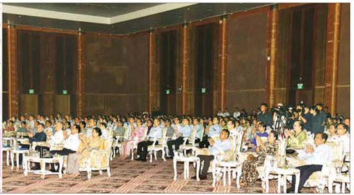
ပြည်ထောင်စုသမ္မတမြန်မာနိုင်ငံတော် ယာယီသမ္မတ နိုင်ငံတော်လုံခြုံရေးနှင့်အေးချမ်းသာယာရေးကော်မရှင်ဥက္ကဋ္ဌ ဗိုလ်ချုပ်မှူးကြီး မင်းအောင်လှိုင်နှင့်ဇနီး ဒေါ်ကြူကြူလှနှင့် အဖွဲ့ဝင်များ ရှုရှားဖက်ဒရေးရှင်းနိုင်ငံ နိုဗိုစီဗစ်ဒေသမှ နိုဗိုစီဗစ် "Chaldony" State Song and Dance Ensemble အဖွဲ့မှ "မဟာရုရှားနှင့်ဆိုက်ဘေးရီးယား" အမည်ရသည့် ပဒေသာကပွဲ ဖျော်ဖြေကပြနေမှုကို ကြည့်ရှုအားပေးစဉ်။