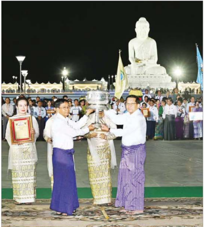
ပြည်ထောင်စုသမ္မတမြန်မာနိုင်ငံတော် ယာယီသမ္မတ နိုင်ငံတော်လုံခြုံရေးနှင့် အေးချမ်းသာယာရေးကော်မရှင် ဥက္ကဋ္ဌ ဗိုလ်ချုပ်မှူးကြီး မင်းအောင်လှိုင် ညစီးကြီး(ညစီးကျည်) မီးပုံးပျံလွှတ်တင်ပူဇော်ပြိုင်ပွဲတွင် ပထမဆု ရရှိသည့် နေပြည်တော်စည်ပင်သာယာရေးကော်မတီကိုယ်စားပြုအသင်းအား ဆုဖလားချီးမြှင့်စဉ်။

ပြည်သူများကလည်း စည်ကားများပြားစွာ လာရောက်ကြည့်ရှုကြသည်။ ဦးစွာ နိုင်ငံတော်ယာယီသမ္မတ နိုင်ငံတော် လုံခြုံရေးနှင့် အေးချမ်းသာယာရေးကော်မရှင်ဥက္ကဋ္ဌ နှင့် ဇနီး၊ အခမ်းအနားတက်ရောက်လာကြသူများ သည် မာရ်ဇီယာဗုဒ္ဓရုပ်ပွားတော်မြတ်ကြီး ရင်ပြင် တော်ပေါ်သို့ ရောက်ရှိကြရာ မာရ်ဇီယာဗုဒ္ဓရုပ်ပွား တော်မြတ်ကြီးအား မီးရှူးမီးပန်းများပစ်ဖောက်ပူဇော် ကြပြီး နိုင်ငံတော်ယာယီသမ္မတ နိုင်ငံတော်လုံခြုံရေး နှင့် အေးချမ်းသာယာရေးကော်မရှင်ဥက္ကဋ္ဌနှင့် ဇနီး