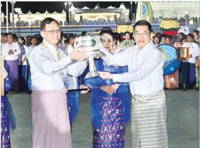
ကော်မရှင်အဖွဲ့ဝင် နိုင်ငံတော်ဝန်ကြီးချုပ် ဦးညိုစော စိန်နားပန် မီးပုံးပျံလွှတ်တင်ပူဇော်ပြိုင်ပွဲတွင် တတိယဆုရရှိသည့် လျှပ်စစ်စွမ်းအားဝန်ကြီးဌာန ကိုယ်စားပြုအသင်းအား ဆုပေးချီးမြှင့်စဉ်။