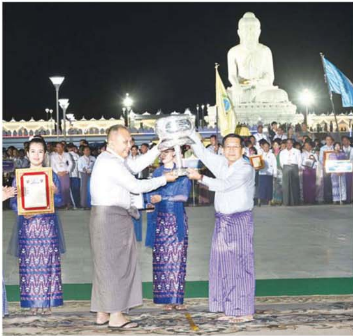
ပြည်ထောင်စုသမ္မတမြန်မာနိုင်ငံတော် ယာယီသမ္မတ နိုင်ငံတော်လုံခြုံရေးနှင့် အေးချမ်းသာယာရေးကော်မရှင် ဥက္ကဋ္ဌ ဗိုလ်ချုပ်မှူးကြီး မင်းအောင်လှိုင် စိန်နားပန်းမီးပုံးပျံလွှတ်တင်ပူဇော်ပြိုင်ပွဲတွင် ပထမဆုရရှိသည့် လူမှုဝန်ထမ်း၊ ကယ်ဆယ်ရေးနှင့် ပြန်လည်နေရာချထားရေးဝန်ကြီးဌာနကိုယ်စားပြုအသင်းအား ဆုပေးပေး ချီးမြှင့်စဉ်။