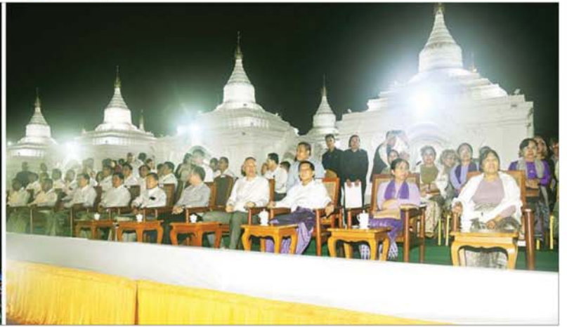
ပြည်ထောင်စုသမ္မတ မြန်မာနိုင်ငံတော် ယာယီသမ္မတ နိုင်ငံတော်လုံခြုံရေးနှင့် အေးချမ်းသာယာရေးကော်မရှင်ဥက္ကဋ္ဌ ဗိုလ်ချုပ်မှူးကြီး မင်းအောင်လှိုင်နှင့် စနီး ဒေါ်ကြူကြူလှ၊ ရုရှားဖက်ဒရေးရှင်းနိုင်ငံ နိုဗိုစီဗစ် ဒေသအုပ်ချုပ်ရေးမှူးနှင့် တက်ရောက်လာကြသူများ ရုရှား- မြန်မာ ချစ်ကြည်ရေးအထိမ်းအမှတ် မီးပုံးပျံလွှတ်တင်မှုကို ကြည့်ရှုအားပေးကြစဉ်။