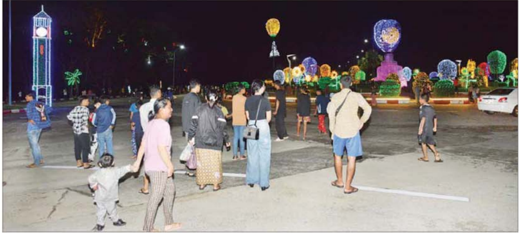
တန်ဆောင်တိုင်မီးထွန်းပွဲတော်တွင် ကာကွယ်ရေးဦးစီးချုပ်ရုံး(ကြည်း)ဝင်းအတွင်း၌ ရောင်စုံမီးအလှများဖြင့် သာယာလှပစွာ ထွန်းညှိထားသည်ကို တွေ့ရစဉ်။

အလားတူ တန်ဆောင်တိုင်ရုံးဝိတ်ရက်ကာလဖြစ်သည်နှင့်အညီ တိုင်းဒေသကြီးနှင့် ပြည်နယ်များရှိ အပန်းဖြေခန်းများ၊ ကမ်းခြေများ၊ အများပြည်သူနှင့် သက်ဆိုင်သည့် ပန်းခြံများ၌ လာရောက်အပန်းဖြေကြသူများနှင့် အထူးစည်ကားလျက်ရှိကာ တန်ဆောင်မုန်းလပြည့်နေ့ အခါသမယကို အများပြည်သူများအနေဖြင့် ပျော်ရွှင်ကြည်နူးစွာ ဆင်နွှဲခဲ့ကြကြောင်း သတင်းရရှိသည်။