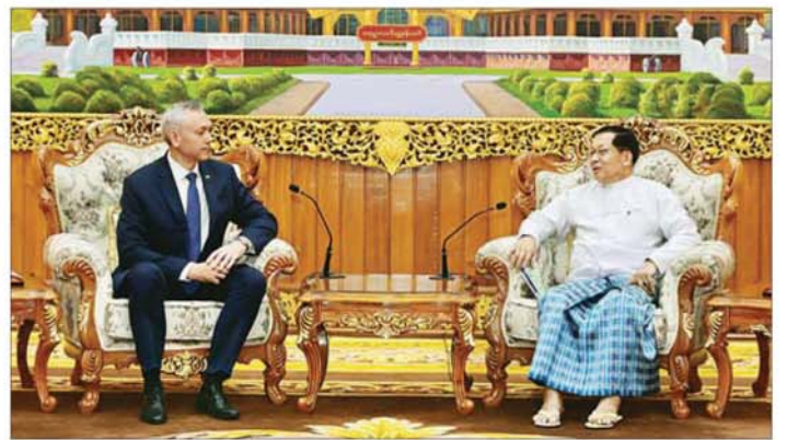
ပြည်ထောင်စုသမ္မတမြန်မာနိုင်ငံတော် ယာယီသမ္မတ နိုင်ငံတော်လုံခြုံရေးနှင့်အေးချမ်းသာယာရေးကော်မရှင်ဥက္ကဋ္ဌ ဝိုလ်ချုပ်မှူးကြီး မင်းအောင်လှိုင် ထံ ရုရှားဖက်ဒရေရှင်းနိုင်ငံ နိုဗိုဗစ်ဗေဒအုပ်ချုပ်ရေးမှူး H.E. Mr. Andrey Aleksandrovich Travnikov လာရောက် ဂါရဝပြုတွေ့ဆုံသည်။

ထုံးတမ်းစဉ်လာမြင့်မားပြီး ခမ်းနားထည်ဝါမှုတို့ကို လေ့လာတွေ့ရှိခဲ့ရသည့်အပြင် မြန်မာနိုင်ငံအစိုးရအဖွဲ့ တာဝန်ရှိသူများနှင့် တွေ့ဆုံဆွေးနွေးမှုများကိုလည်း ဆောင်ရွက်နိုင်ခဲ့သည့် အခြေအနေများ၊ နိုဗိုဗစ်ဗေဒအဖွဲ့အကြား ပူးပေါင်းဆောင်ရွက်မှုများကို နိုဗိုဗစ်ဗေဒအဖွဲ့အကြား ပူးပေါင်းဆောင်ရွက်သွားမည့် အခြေအနေများ၊ ရုရှားဖက်ဒရေရှင်းနိုင်ငံ သမ္မတ မစ္စတာ ဗလာဒီမာပူတင် အနေဖြင့်လည်း မြန်မာနိုင်ငံနှင့် ရုရှားဖက်ဒရေရှင်းနိုင်ငံအကြား၊ နိုဗိုဗစ်ဗေဒအဖွဲ့အကြား ပူးပေါင်း