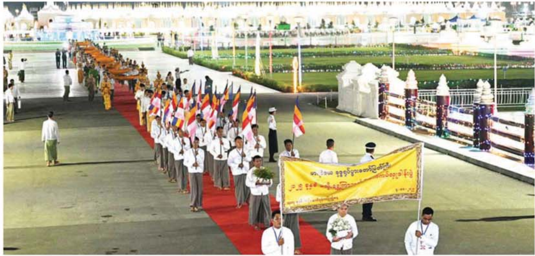
သာသနာရေးနှင့်ယဉ်ကျေးမှုဝန်ကြီးဌာနနှင့် တိုင်းဒေသကြီး၊ ပြည်နယ်များမှ တာဝန်ရှိပုဂ္ဂိုလ်များက မသိုးရွှေကြာသက်နိုးတော် ၁၅ ထည်ကို ဒေဝါဝင်း၊ ရာဇာဝင်းများ ခြံရံ၍ ရေပန်းရင်ပြင်တော်မှ မာရဝိဇယဗုဒ္ဓရုပ်ပွားတော်မြတ်ကြီးရင်ပြင်တော်သို့ ပင့်ဆောင်စဉ်။

ယာယီသမ္မတ နိုင်ငံတော်လုံခြုံရေးနှင့် အေးချမ်း သာယာရေးကော်မရှင်ဥက္ကဋ္ဌနှင့် ဇနီး ဦးဆောင်သော ဘုရားဒါယကာ၊ ဒါယိကာမများက ဘုရားဂုဏ်တော်၊ ပဋ္ဌာန်းပစ္စယုဒ္ဓေသပါဠိ၊ ပရိတ်၊ မေတ္တာပို့လက်များ ကို ရွတ်ဆိုပွားများ ပူဇော်ကြသည်။ ယင်းနောက် သမ္မာဒေဝနတ်ကောင်းနတ်မြတ် များနှင့် သုံးဆယ့်တစ်ဘုံသားတို့အား မေတ္တာပို့၍ ကုသိုလ်အမျှပေးဝေကြကာ အခမ်းအနားကို “ဗုဒ္ဓ သာသနံ စိရိတိဋ္ဌတု” သုံးကြိမ် ရွတ်ဆိုဆုတောင်း၍ ရုပ်သိမ်းလိုက်သည်။