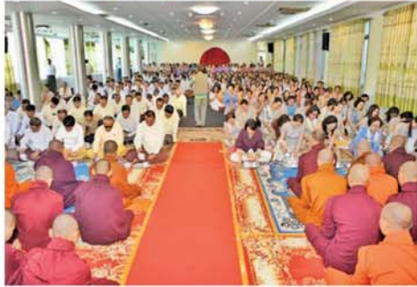
မန္တလေး နိုင်ငံဘာ ၁

မန္တလေး၊ မစိုးရိမ်တိုက် ဟောင်းအတွင်းရှိ ပုရိမဝါမှ ထုတ်ပို့ကြသော သံဃာတော် ၁၉၆ ပါးတို့အား အမှူးထား၍ ယူနန်ဗုဒ္ဓဘာသာဘုရားကျောင်း ဂေါပကအဖွဲ့က ကြီးပွားဦးဆောင် ၍ မန္တလေးမြို့နေ မြန်မာပြည်ဖွား တရုတ်အမျိုးသား၊ အမျိုးသမီး များ၊ ယူနန်၊ ကြင်းတောယန် ဗုဒ္ဓ ဘာသာပရဟိတအသင်း၊ ဖုကျင့်၊ ကွမ်းတုံး၊ လူမျိုးစုနှင့် တရုတ် အမျိုးသမီးရေးရာအသင်းတို့၏ ဒသမအကြိမ်မြောက် စုပေါင်း