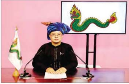
"တည်ငြိမ်အေးချမ်းဖွံ့ဖြိုးဖို့ 'နန်း'မဲကို ပေးကြမို့"

အဆိုပါ ဟောပြောတင်ပြချက် အပြည့်အစုံမှာ အောက်ပါအတိုင်း ဖြစ်ပါသည်-