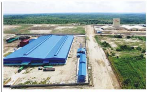
မြန်မာနိုင်ငံတွင် ရင်းနှီးမြှုပ်နှံမှု တိုးချဲ့ရန် တောင်ကိုရီးယားစီးပွားရေးလုပ်ငန်းရှင်များ စိတ်ဝင်စား

ရည်ရွယ်ချက်များအား ရှင်းလင်းတင်ပြသည်။ ထို့နောက် တာဝန်ရှိသူများက ပြည်ပပို့ကုန်သီးနှံထုတ်ကုန်များတွင် ပိုးသတ်ဆေးဓာတ်ကြွင်းကင်းစင်ရေးနှင့် ပန်းတိုင်အထွက်နှုန်းရရှိရေးအတွက် ဆောင်ရွက်ရမည့်အချက်များ၊ 'အင်းဆက်ဖျက်ပိုးပိုးများအား ဘက်စုံကာကွယ်ရေးနည်းလမ်းများအသုံးပြု၍ ကာကွယ်နှိမ်နင်းနည်းများ၊ သီးနှံရောဂါများအား ဘက်စုံကာကွယ်ရေးနည်းလမ်းများအသုံးပြု၍ ကာကွယ်နှိမ်နင်းနည်းများ၊ သီးနှံဖျက်ပေါင်းပင်များအား ဘက်စုံကာကွယ်ရေးနည်းလမ်းများအသုံးပြု၍ ကာကွယ်နှိမ်နင်းနည်းများ၊ မြေဆီလွှာစီမံခန့်ခွဲမှုနည်းလမ်းများနှင့် ဓာတ်မြေဩဇာစနစ်တကျ အသုံးပြုနည်းများနှင့် ပန်းတိုင်အထွက်နှုန်းရရှိစေရေးအတွက် မျိုးကောင်း၊ မျိုးသန့် သုံးစွဲရေး အကြောင်းအရာများကို ဆွေးနွေးခဲ့ကြပြီး တက်ရောက်လာသူများက ဆွေးနွေးချက်များအပေါ် အပြန်အလှန်ဆွေးနွေးခဲ့ကြသည်။