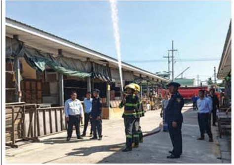
မီးလောင်မှုမဖြစ်ပေါ်စေရေး တာဝန်ရှိသူများ စစ်ဆေးဆောင်ရွက်

အောင်လံ နိုဝင်ဘာ ၁ မကွေးတိုင်းဒေသကြီး၊ အောင်လံမြို့နယ်၌ ကာရာအိုကေ လုပ်ငန်းဆိုင်ရာ မီးဘေးအန္တရာယ် ကွင်းဆင်းစစ်ဆေးဆောင်ရွက်ခြင်းကို ယနေ့နေ့ မွန်းလွဲ ၃ နာရီက လိုက်လံစစ်ဆေးဆောင်ရွက်ခဲ့သည်။ ထိုသို့ စစ်ဆေးဆောင်ရွက်ရာတွင် သက်ဆိုင်ရာဌာန တာဝန် ရှိသူများက မီးဘေးကြိုတင်ကာ ကွယ်ရေးပစ္စည်းများ အသင့်အသုံးပြုနိုင်ရေးနှင့် မီးလောင်မှု၊ မီးလန့်မှုမဖြစ်ပွား မပေါ်ပေါက်စေရေး မီးဘေးလုံခြုံရေး စစ်ဆေးအကြံပြုခြင်းနှင့် လုပ်ငန်းလိုင်စင်များ ရှိ၊ မရှိ ပူးပေါင်းစစ်ဆေးဆောင်ရွက်ခဲ့ကြောင်း သိရသည်။ (ဝဲပုံ) မျိုးသိန်း(ပြန်/ဆက်)