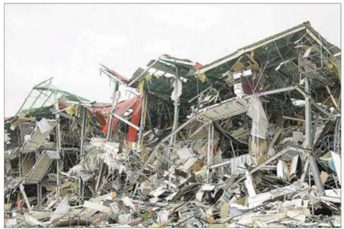
မြဝတီ-မဲ့ထော်သလေး KK Park နယ်မြေအတွင်းရှိ အဆောက်အအုံများ ဖြိုဖျက်ဆီးရှင်းလင်းနေမှုကို တွေ့ရစဉ်။