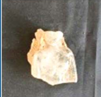
တစ်ခြမ်းပေးပေး ပန်ဆင်းတုအပွဲ။

မန္တလေးငလျင်ကြီးကြောင့် ပြုပျက်ခဲ့ရတဲ့ ဘုရားပုထိုးစေတီတွေထဲကနေ ထွက်လာတဲ့ ဌာပနာများ၊ ထူးခြားတဲ့ ရုပ်တုဆင်းတုတော်များကို သုတေသန ပြုပြီး ဆောင်းပါးတွေ ရေးသားတင်ပြလာလိုက်တာ အတော်များနေပါပြီ။ စာဖတ်သူများအနေနဲ့ ငြီးငွေ့နေကြပြီလား မသိပါ။ စာရေးသူအနေနဲ့ကတော့ အချိန်အခါအရ ဗဟုသုတရစေချင်တဲ့ စေတနာနဲ့ ဆက်လက်ရေးသားနေဆဲပါ။ အခုလည်း အမရပူရမြို့ဟောင်း မှန်တန်းရုပ်မှာတည်ထားပြီး ငလျင်ကြီးကြောင့် ပြုပျက်ခဲ့ရတဲ့ ဆုတောင်းပြည့်စေတီထဲက ထွက်ပေါ်လာတဲ့ ဌာပနာတွေထဲက ထူးခြားတဲ့ ဖန်ဆင်းတုတော်လေးတွေအကြောင်း ဗဟုသုတရစေရန် အလိုငှာ ဖွဲ့စပ်လိုပါတယ်။ ကိုယ်ရည်မသွေးဘဲ ပြောချင်တာက တချို့သော ဌာပနာဆင်းတုရုပ်တုလေးတွေဟာ အတွေ့အကြုံနည်းပါးရင်၊ စာဖတ်အား နည်းပါးရင် ဘာလဲဆိုတာ သိနိုင်ဖို့ခက်ပါတယ်။ ဆိုလိုတာက ရှေးဟောင်းသုတေသန ဘာသာရပ်ဆိုင်ရာ အတွေ့အကြုံသာမက စာပေဗဟုသုတဆိုင်ရာ အတွေ့အကြုံလည်း လိုအပ်လို့ပါ။ နောက်ပြီး သုတေသနဆိုတာ တောထဲတောင်ထဲသွားပြီး တူရွင်းနဲ့ ပေါက်ပြားတွေနဲ့တူးမှ သုတေသနမဟုတ်ပါ။ တွေ့နေမြင်နေကျ မဟုတ်ဘဲ ထူးခြားတဲ့ ပစ္စည်းကလေးတစ်ခုကို တွေ့ရရင်ပဲ ဘယ်ခေတ်ကာလ၊ ဘာလက်ရာဆိုတာမျိုးကို ဆက်စပ်စဉ်းစားတာမျိုးကလည်း သုတေသနတစ်မျိုးပါပဲ။ စဉ်းစားတယ်ဆိုတဲ့အခါမှာလည်း ကောက်ချက်ချဖို့၊ အဖြေရရှိဆိုရင် သဘာဝလည်းကျဖို့ လိုအပ်သလို ယုတ္တိရှိဖို့လည်း လိုအပ်ပြန်ပါသေးတယ်။ ဒါမှသာ စာဖတ်သူများ ဘဝင်ကျစေမှာပေါ့။