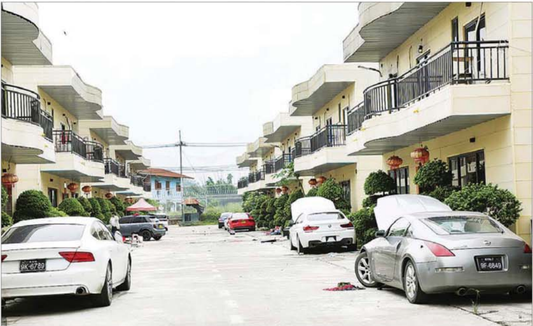
မြဝတီ-မှုထော်သလေး KK Park နယ်မြေအတွင်း အွန်လိုင်းလောင်းကစားမှုများ၊ အွန်လိုင်းလိမ်လည်မှုများနှင့် ဒုစရိုက်မှုပြုလုပ်သူများ၏ နေအိမ်လှိုင်းခန်း များအား ဖြိုချဖျက်ဆီးမှုများ မပြုလုပ်မီ တွေ့ရစဉ်။

နေပြည်တော် နိုဝင်ဘာ ၁၁ မြန်မာနိုင်ငံအတွင်းသို့ ထိုင်းနိုင်ငံအပါအဝင် အိမ်နီးချင်းနိုင်ငံအချို့ကို တစ်ဆင့်ခံ ဖြတ်သန်း၍ နယ်စပ်လမ်းကြောင်းများမှတစ်ဆင့် တရားမဝင် ဝင်ရောက်လာပြီး ကရင်ပြည်နယ် မြဝတီမြို့ မှုထော်သလေး KK Park နယ်မြေများတွင် အွန်လိုင်း လိမ်လည်မှုများ၊ အွန်လိုင်းလောင်းကစားမှုများနှင့် ဒုစရိုက်မှုများကျူးလွန်ခဲ့ကြသည့် ပြည်ပနိုင်ငံသား များကို စစ်ဆေးဖော်ထုတ်ကာ သက်ဆိုင်ရာနိုင်ငံ များသို့ ဥပဒေလုပ်ထုံးလုပ်နည်းများနှင့်အညီ စနစ်တကျ လွှဲပြောင်းပေးအပ်လျက်ရှိသည့်အပြင် ၎င်းတို့ စုဖွဲ့နေထိုင်ခဲ့ကြသည့် KK Park အတွင်း ဇုန်အလိုက် အဆောက်အအုံများ ဖြိုချဖျက်ဆီး ရှင်းလင်းလျက်ရှိသည်။ “KK Park စုန် (A) အတွင်းမှာ အဆောက်အအုံ စုစုပေါင်း ၁၄၈ လုံးရှိပါတယ်။ ဒီနေရာမှာ အွန်လိုင်း လိမ်လည်မှုတွေ၊ အွန်လိုင်းလောင်းကစားမှုတွေနဲ့ ဒုစရိုက်မှုတွေ ထပ်မံပြီး မလုပ်ဆောင်နိုင်အောင် အဆောက်အအုံအားလုံးကို ဖြိုချဖျက်ဆီးသွားမှာ ဖြစ်ပါတယ်။ အဆောက်အအုံ ၁၁၀ ကိုတော့ ဖြိုချ ဖျက်ဆီးပြီးပါပြီ။ ကျန်ရှိတဲ့ အဆောက်အအုံ ၅၅ လုံး ကိုလည်း ဆက်လက်ဖြိုချဖျက်ဆီးသွားမှာဖြစ်ပါတယ်” ဟု တာဝန်ရှိသူတစ်ဦးက ပြောပြသည်။ စာမျက်နှာ ၄ သို့ ◆