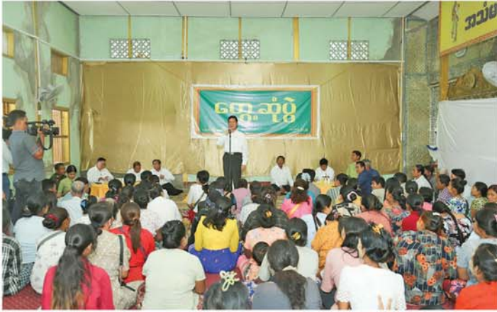
မန္တလေး နိုဝင်ဘာ ၁၁

မန္တလေးတိုင်းဒေသကြီးအစိုးရအဖွဲ့ ဝန်ကြီးချုပ် ဦးမျိုးအောင်သည် တိုင်းဒေသကြီးအစိုးရအဖွဲ့ဝင် ဝန်ကြီးများနှင့် တာဝန်ရှိသူများလိုက်ပါပြီး ယနေ့နံနက်ပိုင်းက အောင်မြေသာစံမြို့နယ်ရှိ ရွှေပြည်သာရပ်ကွက်နှင့် မင်းတဲအိကင်းရပ်ကွက်တို့ရှိ ပြည်သူ့လူထုနှင့် တွေ့ဆုံပွဲများသို့ တက်ရောက်ခဲ့သည်။ အဆိုပါ တွေ့ဆုံပွဲများကို ရွှေပြည်သာရပ်ကွက်ရှိ ရွှေပြည်ကြီးဓမ္မာရုံနှင့် မင်းတဲအိကင်းရပ်ကွက်ရှိ ပေါ်တော်မူဓမ္မာရုံတို့တွင် ကျင်းပခဲ့ပြီး တိုင်းဒေသကြီးဝန်ကြီးချုပ်က ဒေသဖွံ့ဖြိုးရေးလုပ်ငန်းများနှင့် စပ်လျဉ်း၍ တင်ပြချက်များအပေါ် ချက်ချင်းဆောင်ရွက်ပေး၍ရသည်များကို ချက်ချင်းဆောင်ရွက် ပေးနိုင်ရန်နှင့် ဘဏ္ဍာနှစ်အလိုက်ဆောင်ရွက်မည့်လုပ်ငန်းများကို ဘဏ္ဍာနှစ်အလိုက် ဆောင်ရွက်ပေးနိုင်ရန်