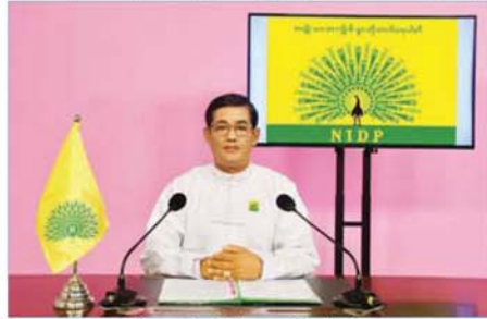
ရိုသေလေးစားအပ်ပါသော မိဘပြည်သူအပေါင်းတို့ ခင်ဗျား။ “ကျွန်းမှာ ရွှင်လန်း ချမ်းမြေ့ကြပါစေ” လို့ ဦးစွာပထမဆုံး စွတ်ခွန်းဆက်သ အပ်ပါတယ် ခင်ဗျား...

အမျိုးသားအကျိုးစီးပွားတိုးတက်ရေးပါတီ ဥက္ကဋ္ဌ ဦးသန်းဇော်က ၎င်းတို့၏ မူဝါဒ၊ သဘောထား၊ လုပ်ငန်းစဉ် စသည်တို့ကို နိုဝင်ဘာ ၁၁ ရက် ညပိုင်းတွင် ရေဒီယိုနှင့် ရုပ်မြင်သံကြားအစီအစဉ်များမှ ဟောပြောတင်ပြခဲ့ပါသည်။ အဆိုပါ ဟောပြောတင်ပြချက် အပြည့်အစုံမှာ အောက်ပါအတိုင်း ဖြစ်ပါသည်။