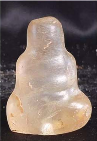
လေးဖက်ချ ဖန်ဆင်းတုပုံကြမ်း။