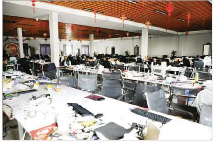
မြဝတီ-မဲ့ထော်သလေး KK Park နယ်မြေအတွင်းရှိ နှစ်ထပ် Club အဆောက်အအုံနှင့် အွန်လိုင်းလိမ်လည်မှုများပြုလုပ်သည့်အလုပ်ရုံတို့ကို ဖြိုဖျက်ဆီးမှုများ မပြုလုပ်မီ တွေ့ရစဉ်။