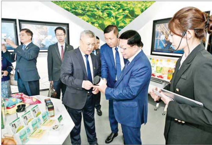
ပြည်ထောင်စုသမ္မတမြန်မာနိုင်ငံတော် ယာယီသမ္မတ နိုင်ငံတော်လုံခြုံရေးနှင့် အေးချမ်းသာယာရေးကော်မရှင်ဥက္ကဋ္ဌ ဗိုလ်ချုပ်မှူးကြီးမင်းအောင်လှိုင်နှင့်အဖွဲ့ Beidahaung Smart Agriculture Exhibition Center တွင် ကြည့်ရှုလေ့လာစဉ်။

* ရှေ့ဖုံးမှ ဦးစွာ ပြည်ထောင်စုသမ္မတ မြန်မာနိုင်ငံတော် ယာယီသမ္မတ နိုင်ငံတော်လုံခြုံရေးနှင့် အေးချမ်းသာယာရေးကော်မရှင်ဥက္ကဋ္ဌနှင့် အဖွဲ့ဝင်များသည် Beidahaung Smart Agriculture Exhibition Center သို့ရောက်ရှိကြရာ တာဝန်ရှိသူများက ကြိုဆိုနှုတ်ဆက်ကြသည်။