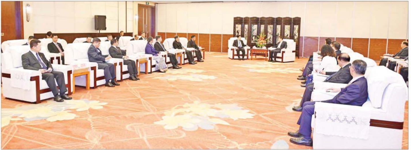
ပြည်ထောင်စုသမ္မတမြန်မာနိုင်ငံတော် ယာယီသမ္မတ နိုင်ငံတော်လုံခြုံရေးနှင့် အေးချမ်းသာယာရေးကော်မရှင်ဥက္ကဋ္ဌ ဗိုလ်ချုပ်မှူးကြီး မင်းအောင်လှိုင် စီချွမ်ပြည်နယ်ပါတီ အတွင်းရေးမှူး Mr. Wang Xiaohui နှင့် တွေ့ဆုံဆွေးနွေးစဉ်။