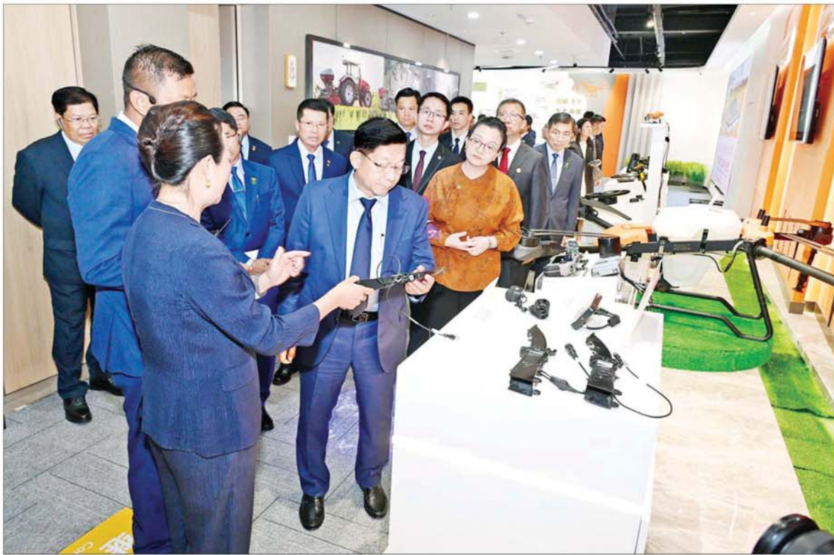
စာမျက်နှာ ၃ သို့ * ပြည်ထောင်စုသမ္မတ မြန်မာ နိုင်ငံတော် ယာယီသမ္မတ နိုင်ငံတော်လုံခြုံရေးနှင့် အေးချမ်း သာယာရေးကော်မရှင် ဥက္ကဋ္ဌ ဗိုလ်ချုပ်မှူးကြီး မင်းအောင်လှိုင် နှင့်အဖွဲ့ Heilongjing Huida Technology Co., Ltd. တွင် ကြည့်ရှုလေ့လာစဉ်။

နေပြည်တော် စက်တင်ဘာ ၅ တရုတ်ပြည်သူ့သမ္မတနိုင်ငံ ဟော်လုံကျွန်းပြည်နယ် ဟာဘင်း မြို့၌ အလုပ်သဘောခရီးရောက်ရှိ နေသည့် ပြည်ထောင်စုသမ္မတ မြန်မာနိုင်ငံတော် ယာယီသမ္မတ နိုင်ငံတော်လုံခြုံရေးနှင့် အေးချမ်း သာယာရေးကော်မရှင် ဥက္ကဋ္ဌ ဗိုလ်ချုပ်မှူးကြီး မင်းအောင်လှိုင် သည် ခရီးစဉ်တွင် လိုက်ပါလာ သည့် ကော်မရှင်အဖွဲ့ဝင်များ တွဲဖက်အမှုဆောင်ချုပ် ဗိုလ်ချုပ် ကြီး ရဲဝင်းဦးနှင့် အဖွဲ့ဝင်များ လိုက်ပါ၍ ယနေ့ဒေသစံတော်ချိန် နံနက် ၈ နာရီခွဲတွင် Beidahaung Smart Agriculture Exhibition Center သို့ သွားရောက်ကြည့်ရှု လေ့လာသည်။