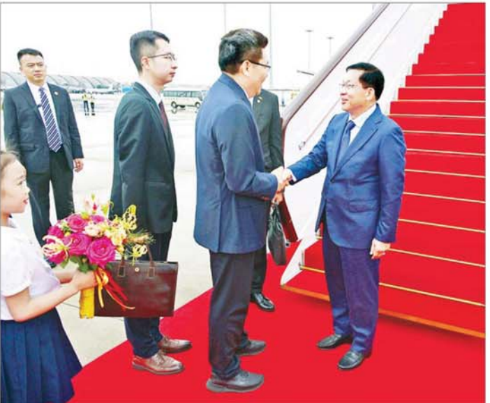
ပြည်ထောင်စုသမ္မတမြန်မာနိုင်ငံတော် ယာယီသမ္မတ နိုင်ငံတော်လုံခြုံရေးနှင့် အေးချမ်းသာယာရေးကော်မရှင်ဥက္ကဋ္ဌ ဗိုလ်ချုပ်မှူးကြီးမင်းအောင်လှိုင်အား စီချွမ်ပြည်နယ် အစိုးရအဖွဲ့မှ အဖွဲ့ဝင်များက ချန်ခူးမြို့ Chengdu Shuangliu International Airport တွင် ကြိုဆိုနှုတ်ဆက်ကြစဉ်။