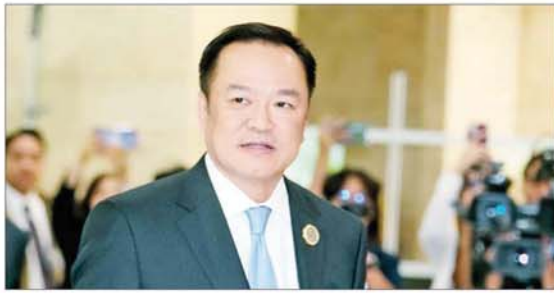
အနုတင်ချာဗီရာကူသည် ထိုင်းနိုင်ငံ၏ ၃၂ ယောက်မြောက် ဝန်ကြီးချုပ်အဖြစ်လာသည်။ ပါလီမန်အမတ်များမှတစ်ဆင့် ဝန်ကြီးချုပ်ရာထူးခန့်အပ်ရန် ထောက်ခံအားပေးမှုအတွက် ထိုင်းပြည်သူများအား ကျေးဇူးတင်ရှိကြောင်း အနုတင်ချာဗီရာကူ ပြောကြားခဲ့သည်။

ဗန်ကောက် စက်တင်ဘာ ၅ အတိုက်အခံ ဘူမိကျိုင်းထိုင်း (BJT) ပါတီခေါင်းဆောင် အနုတင်ချာဗီရာကူက ပါလီမန်တွင် ထောက်ခံခံအများစုရရှိပြီး ထိုင်းနိုင်ငံ၏ ဝန်ကြီးချုပ်သစ်အဖြစ် ယနေ့ရွေးချယ်ခံခဲ့ရသည်။