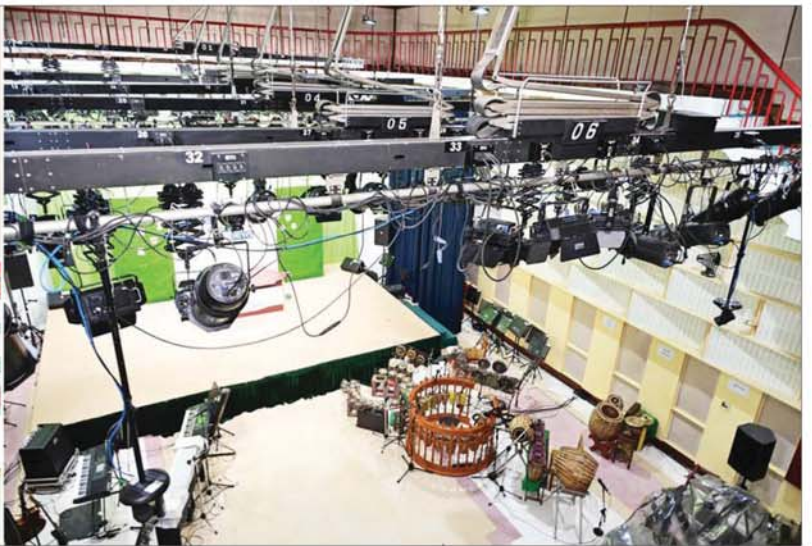
နိုင်ငံတော်လုံခြုံရေးနှင့် အေးချမ်းသာယာရေးကော်မရှင်ဥက္ကဋ္ဌ တပ်မတော်ကာကွယ်ရေးဦးစီးချုပ် ဗိုလ်ချုပ်မှူးကြီး မင်းအောင်လှိုင် တပ်မတော်ရုပ်မြင်သံကြားထုတ်လွှင့်ရေးတပ်(မှော်ဘီ)အတွင်း ကြည့်ရှုစစ်ဆေးစဉ်။

ရေပန်းမှ တပ်မတော်ရုပ်မြင်သံကြားထုတ်လွှင့်ရေးတပ်(မှော်ဘီ) မှ တာဝန်ရှိသူများနှင့် ဝန်ထမ်းများက လိုက်လံ နှေးထွေးစွာ ကြိုဆိုနှုတ်ဆက်ကြသည်။ ထို့နောက် အစည်းအဝေးခန်းမတွင် ပြည်သူ့ ဆက်ဆံရေးနှင့် စိတ်ဓာတ်စစ်ဆေးရေး ညွှန်ကြားရေး မှူးရုံး ညွှန်ကြားရေးမှူး ဗိုလ်ချုပ်ဇော်မင်းထွန်းနှင့် တပ်မတော် ရုပ်မြင်သံကြားထုတ်လွှင့်ရေးတပ် (မှော်ဘီ) တပ်မှူးတို့က တပ်သမိုင်းအကျဉ်း၊ နိုင်ငံတော် လုံခြုံရေးနှင့် အေးချမ်းသာယာရေးကော်မရှင်ဥက္ကဋ္ဌ တပ်မတော်ကာကွယ်ရေးဦးစီးချုပ် လာရောက် စစ်ဆေးစဉ် လမ်းညွှန်မှာကြားချက်များအား အကောင်အထည်ဖော် ဆောင်ရွက်ပြီးစီးမှု အခြေအနေ