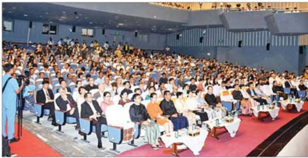
တရုတ်ပြည်သူ့သမ္မတနိုင်ငံထူထောင်ခြင်း (၇၆)နှစ်မြောက်နှင့် မြန်မာ-တရုတ် သံတမန်ဆက်ဆံရေးထူထောင်ခြင်း (၇၅)နှစ်မြောက် ဂုဏ်ပြုခြင်း အနုပညာဖျော်ဖြေပွဲအခမ်းအနားတွင် မြန်မာနိုင်ငံဆိုင်ရာ တရုတ်ပြည်သူ့သမ္မတနိုင်ငံ သံအမတ်ကြီး မစ္စ မာကျား ကြိုဆို နှုတ်ခွန်းဆက်စကား ပြောကြားစဉ်။

ရန်ကုန် စက်တင်ဘာ ၂၀ တရုတ်ပြည်သူ့ သမ္မတနိုင်ငံ ထူထောင်ခြင်း (၇၆) နှစ်မြောက် နှင့် မြန်မာ-တရုတ် သံတမန် ဆက်ဆံရေးထူထောင်ခြင်း (၇၅) နှစ်မြောက် ဂုဏ်ပြုခြင်းအနုပညာ ဖျော်ဖြေပွဲကို ယနေ့ညနေပိုင်းတွင် ရန်ကုန်မြို့၊ ဒဂုံမြို့နယ် မြို့မ ကျောင်းလမ်းရှိ အမျိုးသား ကဇာတ်ရုံ၌ ကျင်းပသည်။ အခမ်း အနားသို့ ပြန်ကြားရေးဝန်ကြီး ဌာန ပြည်ထောင်စုဝန်ကြီး ဦးမောင်မောင်အုန်းနှင့် ဇနီး၊ သာသနာရေးနှင့် ယဉ်ကျေးမှု ဝန်ကြီးဌာန ပြည်ထောင်စုဝန်ကြီး ဦးတင်ဦးလွင်နှင့် ဇနီး၊ ပညာရေး ဝန်ကြီးဌာန ပြည်ထောင်စုဝန်ကြီး ဒေါက်တာ ချောချောစိန်နှင့် တာဝန်ရှိသူများ၊ မြန်မာနိုင်ငံ ဆိုင်ရာ တရုတ်ပြည်သူ့သမ္မတ နိုင်ငံ သံအမတ်ကြီး မစ္စ မာကျား၊ မိတ်ဖက်အဖွဲ့အစည်းများ၊ တရုတ် နိုင်ငံ ဝုအေပီပရာအဖွဲ့သားများ၊ သာသနာရေးနှင့် ယဉ်ကျေးမှု ဝန်ကြီးဌာန အနုပညာဦးစီးဌာနမှ အနုပညာရှင်များ၊ ကျောင်းသား ကျောင်းသူများနှင့် ဖိတ်ကြား ထားသော ဧည့်သည်တော်များ တက်ရောက်ကြသည်။