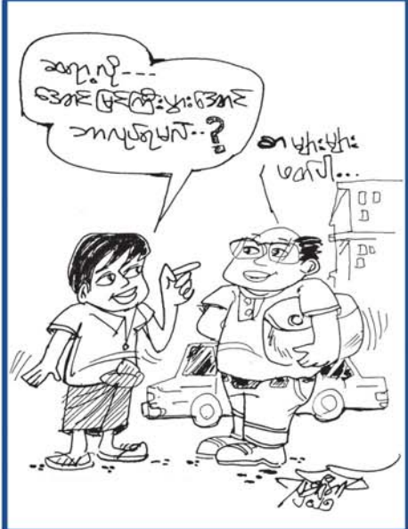
မျက်စိလှူကြ မျက်ကြည်ရ မြတ်သည့်လှူဒါန။