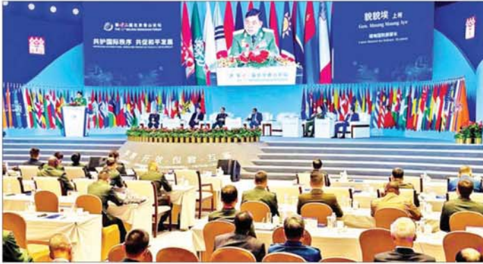
ပိုင်းတွင် ပေကျင်းမြို့ ပါယီခန်းမ (Bayi Hall) ၌ တရုတ်ပြည်သူ့ သမ္မတနိုင်ငံ အမျိုးသားကာကွယ် ရေးဝန်ကြီးဌာန ဝန်ကြီး ဗိုလ်ချုပ်ကြီး တွန်ကျွင်း (Admiral Dong Jun) နှင့် တွေ့ဆုံ၍ နှစ်နိုင်ငံ ကာကွယ်ရေးဆိုင်ရာ ကဏ္ဍခွဲ၌ ပူးပေါင်းဆောင်ရွက်မှုများ တိုးမြှင့် ရေး၊ နှစ်နိုင်ငံ နယ်စပ်ဒေသများ တည်ငြိမ်အေးချမ်းရေးနှင့် တရား ဥပဒေစိုးမိုးရေး၊ စစ်ဘက် နည်းပညာကဏ္ဍ ပူးပေါင်း ဆောင်ရွက်မှုများ ဆက်လက် တိုးမြှင့်ဆောင်ရွက်ရေး၊ လေ့ကျင့် ရေးနှင့် သင်တန်းသားများ စေလွှတ်

နေပြည်တော် စက်တင်ဘာ ၁၈ တရုတ်ပြည်သူ့ သမ္မတနိုင်ငံ President of China Association for Military Science နှင့် President of China Institute for International Strategic Studies တို့၏ ဖိတ်ကြားချက်အရ ပေကျင်းမြို့၌ ကျင်းပမည့် (၁၂) ကြိမ်မြောက် ပေကျင်းရုန်းစန်း ဖိုရမ် (12 th Beijing Xiangshan Forum) သို့ တက်ရောက်ရန် ပေကျင်းမြို့သို့ ရောက်ရှိနေသည့် နိုင်ငံတော်လုံခြုံရေးနှင့် အေးချမ်း သာယာရေးကော်မရှင် အဖွဲ့ဝင် ကာကွယ်ရေး ဝန်ကြီးဌာန ပြည်ထောင်စုဝန်ကြီး ဗိုလ်ချုပ်ကြီး မောင်မောင်အေး ဦးဆောင်သည့် ကိုယ်စားလှယ် အဖွဲ့သည် စက်တင်ဘာ ၁၇ ရက် မွန်းလွဲ