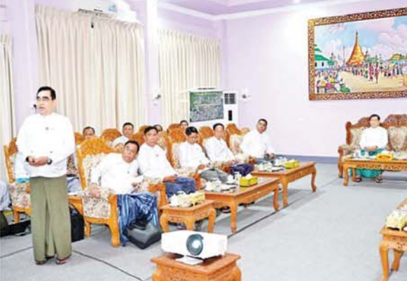
ပြည်ထောင်စုသမ္မတမြန်မာနိုင်ငံတော် ယာယီသမ္မတ နိုင်ငံတော်လုံခြုံရေးနှင့် အေးချမ်းသာယာရေးကော်မရှင် ဥက္ကဋ္ဌ ဗိုလ်ချုပ်မှူးကြီးမင်းအောင်လှိုင်အား ပို့ဆောင်ရေးနှင့် ဆက်သွယ်ရေးဝန်ကြီးဌာန ဒုတိယဝန်ကြီးက ထားဝယ်လေဆိပ်နှင့် လေယာဉ်ပြေးလမ်း အဆင့်မြှင့်တင်နိုင်ရေးနှင့်ပတ်သက်၍ ရှင်းလင်းတင်ပြစဉ်။

စိုက်ပျိုးမွေးမြူရေးကိုအခြေခံသည့် စက်မှုလုပ်ငန်းများ ဖွံ့ဖြိုးတိုးတက်ရေး စိုက်ပျိုးရေးကို အခြေခံသည့် စက်မှုလုပ်ငန်းများကိုလည်း တိုးတက်အောင် ဆောင်ရွက်သွားကြရန်လိုပြီး တနင်္သာရီတိုင်းဒေသကြီးအတွင်း မြေခိုမုံကော်မီဖြစ်သည့် Robesta ကော်ဖီကို စိုက်ပျိုးနိုင်ကြောင်း၊ ဒေသ၏အခြေခံကောင်းများကို အကျိုးရှိရှိ အသုံးချပြီး ဒေသတွင်းစိုက်ပျိုးဖြစ်ထွန်းသည့်ကော်ဖီ၊ ကိုကိုး၊ ဒူးရင်း၊ သီဟိုဠ်၊ အုန်း စသည့်အပင်များကို အောင်မြင်အောင်စိုက်ပျိုး၍ စိုက်ပျိုးရေးကို အခြေခံသည့် စက်မှုလုပ်ငန်းများကို အောင်မြင်အောင် ဆောင်ရွက်သွားကြစေလိုကြောင်း၊ အလားတူ တနင်္သာရီတိုင်းဒေသကြီးအတွင်း ဝါးနှင့် ကြိမ် သယ်စာတရားစွာထွက်ရှိသဖြင့် ဝါးနှင့် ကြိမ် ကုန်ကြမ်းများကို အခြေခံသည့်တန်ဖိုးမြင့်ကုန်ပစ္စည်းများ ထုတ်လုပ်ရောင်းချနိုင်မည်ဆိုပါက ဒေသစီးပွားရေး ဖွံ့ဖြိုးတိုးတက်မှုကို များစွာအထောက်အကူဖြစ်စေနိုင်မည်ဖြစ်ကြောင်း။ စာမျက်နှာ ၅ သို့ ✧