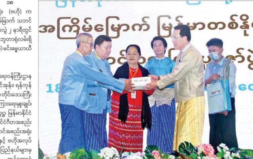
စကား ပြောကြားကြသည်။ ထို့နောက် အလှူငွေနှင့် ထောက်ပံ့ပစ္စည်းများ ပေးအပ်ကြရာ ပြည်ထောင်စုဝန်ကြီးဦးမောင်မောင်အုန်းက အလှူငွေကျပ်သိန်း ၃၀ နှင့် MRTV DTH အစုံ ၂၀ နှင့် Set Top Box အလုံး ၁၀၀ တို့အား လည်းကောင်း၊ တိုင်းဒေသကြီးဝန်ကြီးချုပ် ဦးစိုးသိန်းက အလှူငွေကျပ်သိန်း ၂၅၀ နှင့် ဆန်အိတ် ၅၀၀ အား လည်းကောင်း ပေးအပ်လှူဒါန်းကြသည်။ ယင်းနောက် မြန်မာနိုင်ငံသဘင်အစည်းအရုံး (ဗဟို) ဥက္ကဋ္ဌ ဦးစိုးချစ်က ယခုကဲ့သို့ မြန်မာနိုင်ငံ သဘင်အစည်းအရုံး (ဗဟို) အတွက် မြေနေရာ ခွင့်ပြုပေးခဲ့သည့် နိုင်ငံတော်အစိုးရနှင့် တာဝန်ရှိသူ

ရန်ကုန် စက်တင်ဘာ ၁၈ မြန်မာနိုင်ငံသဘင်အစည်းအရုံး (ဗဟို) က ကြီးမှူးကျင်းပသည့် စတုတ္ထအကြိမ်မြောက် သဘင် သက်ကြီးပူဇော်ပွဲကို ယနေ့မွန်းလွဲ ၂ နာရီတွင် ရန်ကုန်မြို့ အင်းစိန်မြို့နယ် အင်းစိန်ဘူတာရုံလမ်းရှိ မြန်မာနိုင်ငံသဘင်အစည်းအရုံး (ဗဟို) မင်းမွေယာယီ ရုံးသစ်၌ ကျင်းပသည်။