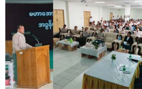
စိမ်းလန်းစိုပြည်လှပဖို့ သန့်ရှင်းသော ကမ္ဘာမြေကို စောင့်ရှောက်ဖို့။

ရှိလိုသည်များကို မေးမြန်းဆွေးနွေးခဲ့ကြကြောင်း သိရသည်။ (မန္တလေးနေ့စဉ် ၉)