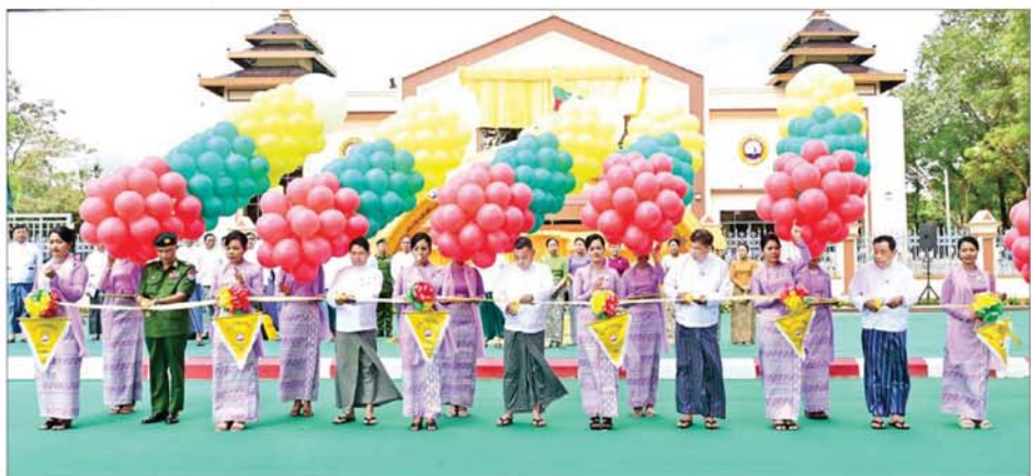
နိုင်ငံတော်လုံခြုံရေးနှင့် အေးချမ်းသာယာရေးကော်မရှင် တွဲဖက်အမှုဆောင်ချုပ် ဗိုလ်ချုပ်ကြီးရဲဝင်းဦး၊ ပြည်ထောင်စုဝန်ကြီး ဦးမင်းနောင်နှင့် ဒေါက်တာ မျိုးသိမ်းကျော်၊ တနင်္သာရီတိုင်းဒေသကြီးဝန်ကြီးချုပ် ဦးမြတ်ကို၊ ကမ်းရိုးတန်းဒေသ တိုင်းစစ်ဌာနချုပ် တိုင်းမှူး ဗိုလ်ချုပ်ကျော်ကျော်ဟန်တို့ ထားဝယ်မြို့ မြို့တော်ခန်းမ အဆောက်အအုံသစ်အား ဖဲကြီးဖြတ်ဖွင့်လှစ်ပေးကြစဉ်။

ဝင်တန်း အောင်ချက်များကို ကြည့်ပါက ၂၀၂၁ ခုနှစ်တွင် ၄၅ ဒသမ ဥြ ရာခိုင်နှုန်း၊ ၂၀၂၂-၂၀၂၃ ပညာသင်နှစ်တွင် ၆၈ ဒသမ ၀၃ ရာခိုင်နှုန်း၊ ၂၀၂၃-၂၀၂၄ ခုနှစ်တွင် ၄၈ ဒသမ ၃၈ ရာခိုင်နှုန်း ရှိခဲ့ကြောင်း၊ ယခု ၂၀၂၄-၂၀၂၅ ပညာသင်နှစ်တွင် ၅၀ ဒသမ ၅၈ ရာခိုင်နှုန်းရှိ အောင် ဆောင်ရွက်နိုင်ခဲ့ခြင်းကြောင့် ယခင်နှစ်ထက် အောင်မြင်မှု ရာခိုင်နှုန်း ပိုမိုတိုးတက်ခဲ့သည် ကို တွေ့ရှိရကြောင်း။ ဂုဏ်ထူးရရှိမှုများ အနေဖြင့် လေးနှစ်တာ ကာလအတွင်း ခြောက်ဘာသာဂုဏ်ထူးရှင် ၂၃ ဦး၊ ငါးဘာသာဂုဏ်ထူးရှင် ၆၂ ဦး၊ လေးဘာသာ ဂုဏ်ထူးရှင် ၁၁၀၊ သုံးဘာသာ ဂုဏ်ထူးရှင် ၁၆၄ ဦး၊ နှစ်ဘာသာဂုဏ်ထူးရှင် ၄၂၀၊ တစ်ဘာသာဂုဏ်ထူးရှင် ၁၆၆၃ ဦးရှိခဲ့ကြောင်း၊ ပြီးခဲ့သည့် လေးနှစ်တာ ကာလအတွင်း တက္ကသိုလ်ဝင်တန်း စာမေးပွဲ ဝိသုံဘာသာတွဲတွင် တစ်နိုင်ငံလုံး အပိုင်းအတာဖြင့် အဆင့်တစ် တစ်ဦးရရှိခဲ့သည်ကို တွေ့ရ ကြောင်း၊ ယခုကဲ့သို့ ပညာရေး ကဏ္ဍ ပိုမိုတိုးတက်လာခြင်းသည် မိဘ၊ ဆရာများ၏ စေတနာနှင့် ဝတ္တရားကျေပွန်စွာ ပူးပေါင်း ဆောင်ရွက်မှုအပြင် ကျောင်းသား ကျောင်းသူများ၏ ကြိုးစား ကျောင်းသား အားထုတ်မှုတို့ကြောင့်ပင် ဖြစ် ကြောင်း။ ၂၀၂၁ ခုနှစ်မှ ယနေ့၂၀၂၅ ခုနှစ် အထိ လေးနှစ်တာကာလအတွင်း တက္ကသိုလ်ဝင်တန်း အောင်မြင် ခဲ့ကြသူများအနက် ဆေး တက္ကသိုလ် တက်ရောက်နေသူ ၁၈ ဦး၊ နည်းပညာတက္ကသိုလ် တက်ရောက်နေသူ ၁၅၂ ဦး၊ ထားဝယ်မြို့ Polytechnic University တွင် ၁၉၆ ဦး ပညာ သင်ကြားလျက်ရှိသည်ဟု သိရ ကြောင်း၊ ထို့အပြင် စက်မှု၊ စိုက်ပျိုးမှု၊ မွေးမြူရေး အထက်တန်း ကျောင်းများကို တနင်္သာရီတိုင်း ဒေသကြီးအတွင်းရှိ ခရိုင်လေးခရိုင် လုံးတွင် စက်မှု၊ စိုက်ပျိုးမှု၊ မွေးမြူ ရေး အထက်တန်းကျောင်း လေးကျောင်း ဖွင့်လှစ်နိုင်ခဲ့ပြီး အသက်မွေးဝမ်းကျောင်း အခြေခံ ပညာရပ်များကိုလေ့ကျင့်သင်ကြား ပေးလျက်ရှိနေသည်ကို တွေ့ရ ကြောင်း။