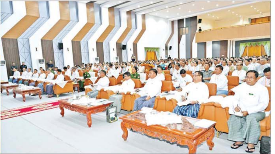
ပြည်ထောင်စုသမ္မတမြန်မာနိုင်ငံတော် ယာယီသမ္မတ နိုင်ငံတော်လုံခြုံရေးနှင့်အေးချမ်းသာယာရေးကော်မရှင်ဥက္ကဋ္ဌ ဗိုလ်ချုပ်မှူးကြီးမင်းအောင်လှိုင် တနင်္သာရီတိုင်းဒေသကြီး ထားဝယ်မြို့ရှိ ဌာနဆိုင်ရာ တာဝန်ရှိသူများ၊ ရပ်မိရပ်ဖများအား တွေ့ဆုံ၍ ဒေသဖွံ့ဖြိုးတိုးတက်ရေးဆိုင်ရာများဆွေးနွေးစဉ်။

ရှေ့ဖုံးမှ တနင်္သာရီတိုင်းဒေသကြီးဝန်ကြီးချုပ် ဦးမြတ်ကို၊ ကာကွယ်ရေးဦးစီးချုပ်ရုံးမှ အဆင့်မြင့်တပ်မတော် အရာရှိကြီးများ၊ ကမ်းရိုးတန်းဒေသ တိုင်းစစ်ဌာနချုပ် တိုင်းမှူး၊ ဒုတိယဝန်ကြီးများနှင့်တာဝန်ရှိသူများ၊ တိုင်းဒေသကြီးအစိုးရအဖွဲ့ဝင်များနှင့် ဌာနဆိုင်ရာ တာဝန်ရှိသူများ တက်ရောက်ကြသည်။ ဒေသဆိုင်ရာအချက်အလက်များ၊ ဖွံ့ဖြိုးတိုးတက်ရေးဆိုင်ရာများ ဆောင်ရွက်လျက်ရှိမှုနှင့် လိုအပ်ချက်များအား ဆွေးနွေးတင်ပြ ဦးစွာတိုင်းဒေသကြီးဝန်ကြီးချုပ်က တိုင်းဒေသကြီး ဆိုင်ရာအချက်အလက်များ၊ တိုင်းဒေသကြီးအတွင်း စိုက်ပျိုးရေးလုပ်ငန်းများ ဖြစ်ထွန်းအောင်မြင်လျက် ရှိမှုနှင့် တစ်စကပန်းတိုင်အထွက်နှုန်း တိုးတက်အောင် ဆောင်ရွက်လျက်ရှိမှု၊ ဆီဖုလုံမှုရရှိရေးအတွက် ဆီကြမ်းနှင့် ဆီချောစက်ရုံများ ဆက်လက်ဆောင်ရွက် လျက်ရှိမှု၊ ရော်ဘာနှင့် ကော်ဖီသီးနှံ စိုက်ပျိုးထုတ်လုပ် လျက်ရှိမှု၊ မွေးမြူရေးလုပ်ငန်းများ ပိုမိုဖွံ့ဖြိုးတိုးတက် ရေးဆောင်ရွက်လျက်ရှိမှု၊ ငါးသယ်စာတန်နှင့် ရေထွက် ကုန်ထုတ်လုပ်ရေးစက်ရုံများ တိုးမြှင့်ဆောင်ရွက် လျက်ရှိမှု၊ မြို့ပြနှင့်ကျေးလက်ဒေသများအားလုံး လျှပ်စစ်မီးရရှိရေးဆောင်ရွက်နိုင်မှု၊ တိုင်းဒေသကြီး အတွင်းရှိ ခရီးသွားဒေသများသို့ ပြည်ပခရီးသွား ဧည့် သည်များဝင်ရောက်လျက်ရှိမှု၊ တိုင်းဒေသကြီး အတွင်း အခြေခံပညာကျောင်းများ ဖွင့်လှစ်သင်ကြား ပေးလျက်ရှိမှုနှင့် တက္ကသိုလ်ဝင်စာမေးပွဲအောင်မြင် မှု၊ စက်မှု၊ စိုက်ပျိုး၊ မွေးမြူရေး အခြေခံပညာ အထက် တန်းကျောင်းများ ဖွင့်လှစ်သင်ကြားပေးလျက်ရှိမှု၊ ကျန်းမာရေးဆိုင်ရာပြည်ဆည်းဆောင်ရွက်ပေးနိုင် မှု၊ ဒီရေတာဝန်များထိန်းသိမ်းထားရှိမှုနှင့် တစ်အုပ် တစ်မသစ်ပီတိုက်ပျိုးပွားပြုလုပ်၍ သဘာဝပတ်ဝန်း