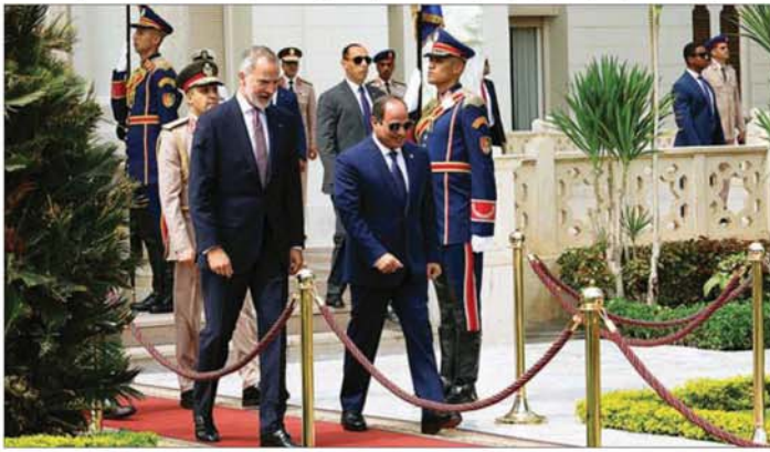
အိဂျစ်သမ္မတ အဗ္ဗဒယ်ဖာတာအယ်စီစီနှင့် စပိန်ဘုရင် ဖိလစ် ၆ တို့ကို အယ်-အစ်တီဟာဒီယာ သမ္မတနန်းတော်၌ တွေ့ရစဉ်။

ကိုင်းရို စက်တင်ဘာ ၁၈ အိဂျစ်သမ္မတ အဗ္ဗဒယ် ဖာတာ အယ်စီစီနှင့် စပိန်ဘုရင် ဖိလစ် ၆ တို့သည် ဂါဇာကမ်းခြေအပစ်အခတ်ရပ်စဲရေး၊ စားစာခံများ ပြန်လွှတ်ရေးနှင့် လူသားချင်းစာနာထောက်ထားမှု ဆိုင်ရာအကူအညီများ အတားအဆီးမရှိ ပေးပို့နိုင်ရေးအတွက် တောင်းဆိုခဲ့ကြသည်ဟု စက်တင်ဘာ ၁၇ရက်တွင် အိဂျစ်သမ္မတရုံးက ပြောသည်။