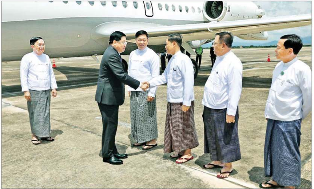
နိုင်ငံတော်ဝန်ကြီးချုပ် ဦးညိုစောအား နိုင်ငံတော်လုံခြုံရေးနှင့် အေးချမ်းသာယာရေးကော်မရှင်အဖွဲ့ဝင် အမှုဆောင်ချုပ် ဦးအောင်လင်းဌေး၊ ပြည်ထောင်စု ဝန်ကြီးများ၊ နေပြည်တော်ကောင်စီဥက္ကဋ္ဌနှင့် တာဝန်ရှိသူများက နေပြည်တော်တပ်မတော်လေဆိပ်၌ ကြိုဆိုနှုတ်ဆက်ကြစဉ်။

မွန်းလွဲပိုင်းတွင် နိုင်ငံတော်ဝန်ကြီးချုပ်နှင့် အဖွဲ့ဝင်များသည် နေပြည်တော်သို့ ပြန်လည်ရောက်ရှိ ကြရာ နိုင်ငံတော်လုံခြုံရေးနှင့် အေးချမ်းသာယာရေး ကော်မရှင်အဖွဲ့ဝင် အမှုဆောင်ချုပ် ဦးအောင်လင်းဌေး၊ ပြည်ထောင်စုဝန်ကြီးများ၊ နေပြည်တော်ကောင်စီ ဥက္ကဋ္ဌနှင့် တာဝန်ရှိသူများက နေပြည်တော် တပ်မတော်လေဆိပ်၌ ကြိုဆိုနှုတ်ဆက်ကြသည်။ စာမျက်နှာ ၆ သို့ *