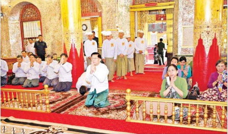
ပြည်ထောင်စုသမ္မတမြန်မာနိုင်ငံတော် ယာယီသမ္မတ နိုင်ငံတော်လုံခြုံရေးနှင့် အေးချမ်းသာယာရေးကော်မရှင် ဥက္ကဋ္ဌ ဗိုလ်ချုပ်မှူးကြီးမင်းအောင်လှိုင်၊ ဇနီး ဒေါ်ကြူကြူလှနှင့် အဖွဲ့ဝင်များ တနင်္သာရီတိုင်းဒေသကြီး ကျက်သရေဆောင်ထားဝယ်မြို့ လောကမာရဓိန်ရုပ်ပွားတော်မြတ်ကြီးအား ဖူးမြော်ကြည့်ညိကြစဉ်။

ဆောင်ရွက်ပေးသွားမည်ဖြစ်ကြောင်း၊ ထားဝယ်ဆိပ်ကမ်းနှင့်ပတ်သက်၍လည်း ထားဝယ်မြစ်အတွင်း သင်္ဘောများဝင်ထွက်မှုအဆင်ပြေစေရေး ဖြစ်ကြောင်း တူးဖော်ရေးလုပ်ငန်းများဆောင်ရွက်နိုင်ရန် စီမံဆောင်ရွက်လျက်ရှိကြောင်း၊ ထားဝယ်ဆိပ်ကမ်းအဆင့်မြှင့်တင်ရေးအတွက် အကောင်အထုံးဆောင်ရွက်ပေးသွားမည်ဖြစ်ကြောင်း။ မွေးမြူရေးလုပ်ငန်းများနှင့် ဖွံ့ဖြိုးတိုးတက်ရေးအတွက် နိုင်ငံတော်မှရင်းနှီးမတည်ငွေများ ထုတ်ပေးထားရှိပြီး လုပ်ငန်းများအောင်မြင်အောင် ဆောင်ရွက်ကြစေလိုကြောင်း၊ အသား၊ ငါးနှင့် အခြေခံစားကုန်ပစ္စည်းများ ဈေးနှုန်းကြီးမြင့်ခြင်းမှာ ထုတ်လုပ်မှုကုန်ကျစရိတ်မြင့်မားခြင်း၊ ဝယ်ယူအားနှင့် ရောင်းလိုအား မမျှခြင်းတို့ကြောင့်ဖြစ်ကြောင်း၊ ထို့ပြင် တရားမဝင်ကုန်သွယ်မှုများကြောင့်လည်း ကုန်ဈေးနှုန်းကြီးမြင့်မှုများကို ဖြစ်ပေါ်စေကြောင်း၊ မိမိတို့အနေဖြင့် ကုန်ဈေးနှုန်းများ ထိုက်သင့်သည့်ဈေးနှုန်းအတိုင်း ဖြစ်စေရေး ကြိုးပမ်းဆောင်ရွက်လျက်ရှိပြီး တရားမဝင် ကုန်စည်စီးဆင်းမှုများ မဖြစ်ပေါ်စေရေး