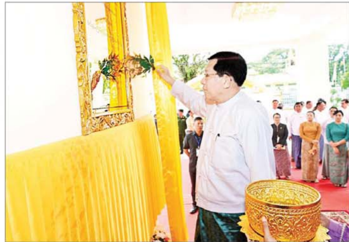
ပြည်ထောင်စုသမ္မတမြန်မာနိုင်ငံတော် ယာယီသမ္မတ နိုင်ငံတော်လုံခြုံရေးနှင့် အေးချမ်းသာယာရေး ကော်မရှင်ဥက္ကဋ္ဌ ဗိုလ်ချုပ်မှူးကြီးမင်းအောင်လှိုင် ထားဝယ်မြို့ မြို့တော်ခန်းမ အဆောက်အအုံသစ်ကမ္ဘည်း မော်ကွန်းအား အမွှေးနံ့သာရည်များဖြင့် ပက်ဖျန်းပေးစဉ်။

စတင်ကျင်းပပြုလုပ်ရာ ထားဝယ် မြို့မြို့တော်ခန်းမအဆောက်အအုံ သစ်အား တွဲဖက်အမှုဆောင်ချုပ် ဗိုလ်ချုပ်ကြီး ရဲဝင်းဦး၊ စိုက်ပျိုး ရေး၊ မွေးမြူရေးနှင့် ဆည်မြောင်း ဝန်ကြီးဌာန ပြည်ထောင်စုဝန်ကြီး ဦးမင်းနောင်၊ သိပ္ပံနှင့်နည်းပညာ ဝန်ကြီးဌာန ပြည်ထောင်စုဝန်ကြီး ဒေါက်တာ မျိုးသိမ်းကျော်၊ တနင်္သာရီ တိုင်းဒေသကြီး ဝန်ကြီးချုပ် ဦးမြတ်ကို၊ ကမ်းရိုး တန်းဒေသ တိုင်းစစ်ဌာနချုပ် တိုင်းမှူး ဗိုလ်ချုပ်ကျော်ကျော်ဟန် တို့က ဖဲကြီးဖြတ်ဖွင့်လှစ်ပေး ကြသည်။ ယင်းနောက် ပြည်ထောင်စု သမ္မတ မြန်မာနိုင်ငံတော် ယာယီ သမ္မတ နိုင်ငံတော်လုံခြုံရေး နှင့် အေးချမ်းသာယာရေး ကော်မရှင်ဥက္ကဋ္ဌ ဗိုလ်ချုပ်မှူးကြီး မင်းအောင်လှိုင်က ထားဝယ်မြို့ မြို့တော်ခန်းမ အဆောက်အအုံ သစ်အား စက်လှေတံဆိပ်ဖွင့်လှစ် ပေးသည်။ ထို့နောက် နိုင်ငံတော် လုံခြုံရေးနှင့် အေးချမ်းသာယာရေး ကော်မရှင်ဥက္ကဋ္ဌနှင့် အဖွဲ့ဝင်များ သည် ထားဝယ်မြို့ မြို့တော်ခန်းမ အဆောက်အအုံသစ်အား အမွှေး နံ့သာရည်များဖြင့် ပက်ဖျန်းပေး ကြသည်။ ဆက်လက်၍ အခမ်းအနား အစီအစဉ် ဒုတိယပိုင်းအဖြစ် ထားဝယ်မြို့ မြို့တော်ခန်းမ အဆောက်အအုံသစ် အတွင်း၌ ပညာရည်ချွန်ဆု ချီးမြှင့်ပွဲကို ဆက်လက် ကျင်းပပြုလုပ်ရာ တနင်္သာရီတိုင်းဒေသကြီးဝန်ကြီး