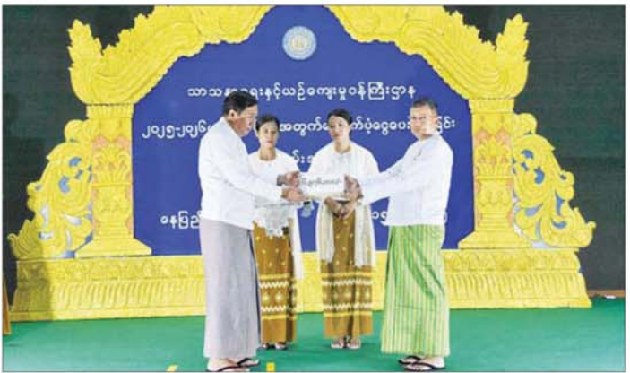
ကျောင်းနေအရွယ်ကလေးတိုင်း ပညာသင်ကြားနိုင်ရေး၊ အချိန်မတိုင်မီ အကြောင်းအမျိုးမျိုးကြောင့် ကျောင်းထွက်ရခြင်းများရှိစေရေးနှင့် တန်းစဉ် ကူးပြောင်းမှုတွင် အရေအတွက်သာမကဘဲ အရည်အချင်းပါ တိုးတက်လာစေရေးနှင့် မိဘများထက် သားသမီးများက ပိုမိုတော်တော်သည့် လူတော်များဖြစ်လာ

နေပြည်တော် ဇူလိုင် ၁၅ သာသနာရေးနှင့်ယဉ်ကျေးမှုဝန်ကြီးဌာနမှ ၂၀၂၅-၂၀၂၆ ပညာသင်နှစ် ကျောင်းသား ကျောင်းသူများ အတွက် ပညာသင်ထောက်ပံ့ငွေပေးအပ်ပွဲအခမ်းအနားကို ယနေ့နံနက် ၁၀ နာရီတွင် ရုံးအမှတ်(၃၁) သာသနာရေးနှင့်ယဉ်ကျေးမှုဝန်ကြီးဌာန စုပေါင်းအစည်းအဝေးခန်းမ၌ ကျင်းပသည်။