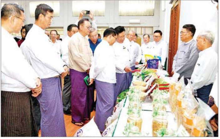
ထုတ်လုပ်တင်ပို့သည့် နိုင်ငံအဖြစ် ပေါ်ထွန်းလာစေရန် လိုအပ်သော ပြင်ဆင်မှု၊ ဖြေလျှော့မှု၊ ပိုမိုကျသည့် များများကို ဖန်တီးပေးခြင်း၊ မျိုးစေ့ထုတ်လုပ်ငန်း ဆောင်ရွက်နေကြသော အဖွဲ့အစည်းများ၊ ပုဂ္ဂလိကကုမ္ပဏီများ တောင်သူများအနေဖြင့်လည်း တည်ဆဲဥပဒေ၊ လုပ်ထုံးလုပ်နည်းများနှင့်အညီ လိုက်နာဆောင်ရွက်ပုံ၊ မျိုးစေ့ထုတ်လုပ်ငန်းများ ရေရှည်တည်တံ့စေရန်နှင့် စံချိန်စံညွှန်းနှင့်ကိုက်ညီပြီး ဒေသအလိုက်အောင်မြင်ဖြစ်ထွန်းမှုရှိသော အရည်အသွေးကောင်းမျိုးစေ့များ ထုတ်လုပ်ဖြန့်ဖြူးသွားနိုင်ရေး ကြိုးပမ်းကြရန် လိုကြောင်း၊ သို့မှသာ တောင်သူလယ်သမားများနှင့် မျိုးစေ့ထုတ်လုပ်ငန်းစဉ်တွင် ပါဝင်တတ်သက်သူများ သာမက နိုင်ငံတော်အတွက်ပါ များစွာအကျိုးကျေးဇူး

နေပြည်တော် ဇူလိုင် ၁၅ မြန်မာနိုင်ငံမျိုးစေ့ကဏ္ဍ ဖွံ့ဖြိုးတိုးတက်ရေး အလုပ်ရုံဆွေးနွေးပွဲကို ယနေ့နံနက်၀င်းက နေပြည်တော်ရှိစိုက်ပျိုးရေး၊ မွေးမြူရေးနှင့် ဆည်မြောင်း ဝန်ကြီးဌာန ပြည်ထောင်စုဝန်ကြီးရုံး စုဝေးဆောင်ခန်းမ၌ ကျင်းပသည်။