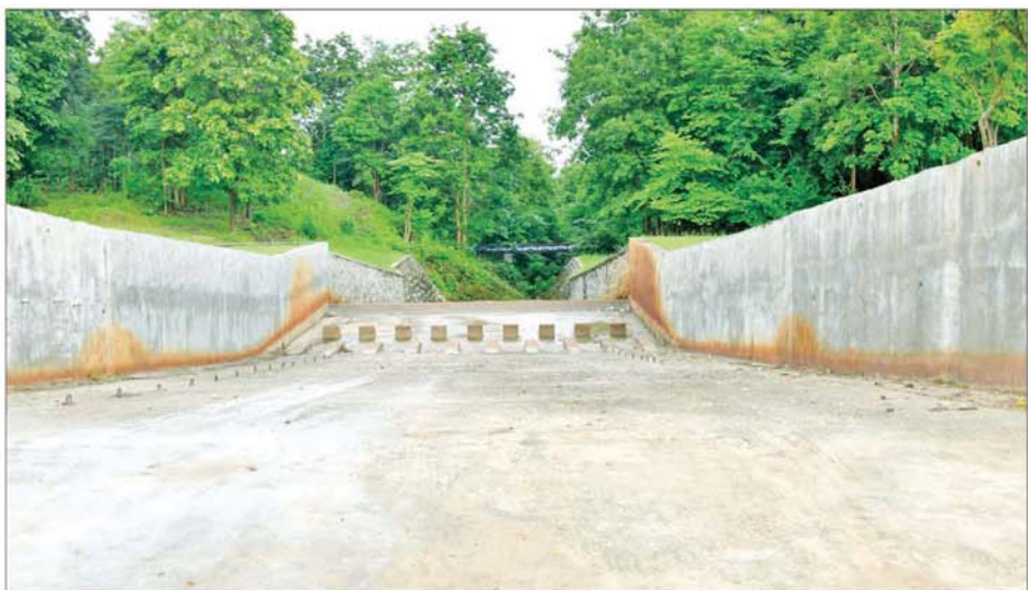
နေပြည်တော်ဥတ္တရသီရိ ရေလှောင်တံခံ ရေပိုလွှဲကို တွေ့ရစဉ်။

တို့က ငလျင်ကြောင့် ပျက်စီးခဲ့ သည့် ရုံးအဆောက်အအုံနှင့် ရုံးပတ်လမ်း ပြန်လည် တည်ဆောက်ရန် အတွက် မြေသားစမ်းသပ်ခြင်း၊ ကွန်ကရစ် လမ်း နိမ့်ကျွဲကွက်ပျက်စီးခဲ့ သောနေရာတွင် ၁၂ ပေအကျယ် မြေသားလမ်းခင်းခြင်း၊ သံကူ ကွန်ကရစ်နှင့် Bored Pile ကျောက်စီမြေကာနံရံ အသစ် တည်ဆောက်ခြင်း၊ ယာယီ ရေထုတ်မြောင်း တည်ဆောက် ခြင်းနှင့် ဆောင်ရွက်မည့်အခြေ အနေကို ရှင်းလင်းတင်ပြကြပြီး ဒုတိယဝန်ကြီးချုပ်က သိရှိလို သည့်များကို မေးမြန်းဆွေးနွေး ကာ လိုအပ်သည်များကို ပေါင်းစပ် ညှိနှိုင်းဆောင်ရွက်ပေးသည်။