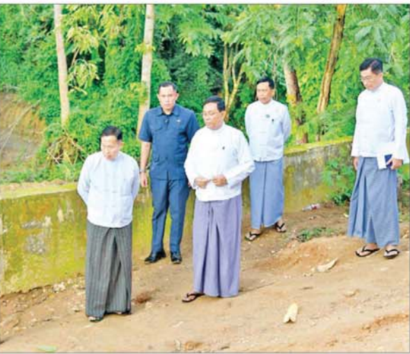
အမျိုးသားသဘာဝဘေးအန္တရာယ်ဆိုင်ရာ စီမံခန့်ခွဲမှုကော်မတီဥက္ကဋ္ဌ နိုင်ငံတော်စီမံအုပ်ချုပ်ရေးကောင်စီဒုတိယဥက္ကဋ္ဌ ဒုတိယဝန်ကြီးချုပ် ဒုတိယဗိုလ်ချုပ်မှူးကြီး စိုးဝင်း မန္တလေးလျှောက်ကြားရေး ထိခိုက်ပျက်စီးခဲ့သည့် အလုပ်သမားဝန်ကြီးဌာန မြေထိန်းနံရံ ပြန်လည်ပြုပြင်ခြင်းလုပ်ငန်းဆောင်ရွက်နေမှုကို ကြည့်ရှုစစ်ဆေးစဉ်။