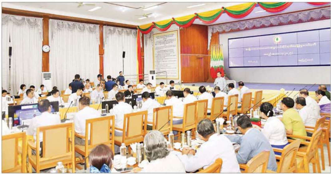
နိုင်ငံတော်စီမံအုပ်ချုပ်ရေးကောင်စီ ဒုတိယဥက္ကဋ္ဌ ဒုတိယဝန်ကြီးချုပ် ဒုတိယဗိုလ်ချုပ်မှူးကြီး စိုးဝင်း အမျိုးသားသဘာဝဘေးအန္တရာယ်ဆိုင်ရာကော်မတီ (၄/၂၀၂၅)အစည်းအဝေးတွင် အမှာစကားပြောကြားစဉ်။

နေပြည်တော် ၈ ဇူလိုင် အမျိုးသားသဘာဝဘေးအန္တရာယ်ဆိုင်ရာ စီမံခန့်ခွဲမှုကော်မတီအစည်းအဝေးကို ယနေ့နံနက် ၉ နာရီခွဲတွင် နေပြည်တော်ရှိ လူမှုဝန်ထမ်း၊ ကယ်ဆယ်ရေးနှင့် ပြန်လည်နေရာချထားရေးဝန်ကြီးဌာန၌ ကျင်းပပြုလုပ်ရာ အမျိုးသားသဘာဝဘေးအန္တရာယ်ဆိုင်ရာ စီမံခန့်ခွဲမှုကော်မတီဥက္ကဋ္ဌ နိုင်ငံတော်စီမံအုပ်ချုပ်ရေးကောင်စီဒုတိယဥက္ကဋ္ဌ ဒုတိယဝန်ကြီးချုပ် ဒုတိယဗိုလ်ချုပ်မှူးကြီး စိုးဝင်း တက်ရောက်အမှာစကားပြောကြားသည်။ အစည်းအဝေးသို့ အဆောက်အအုံများ ပြန်လည်ပြုပြင်အသုံးပြုရေးနှင့် အသစ်တည်ဆောက်ရေးကြိုးကြပ်မှုကော်မတီဥက္ကဋ္ဌ၊ နိုင်ငံတော်စီမံအုပ်ချုပ်ရေးကောင်စီအဖွဲ့ဝင်၊ ကာကွယ်ရေးဝန်ကြီးဌာန ပြည်ထောင်စုဝန်ကြီး ဗိုလ်ချုပ်ကြီး မောင်မောင်အေး၊ ကော်မတီ ဒုတိယဥက္ကဋ္ဌများနှင့် ကော်မတီဝင် ပြည်ထောင်စုဝန်ကြီးများ၊ နေပြည်တော်ကောင်စီဥက္ကဋ္ဌ၊ ကာကွယ်ရေးဦးစီးချုပ်ရုံးမှ တပ်မတော်အရာရှိကြီးများ၊ ဒုတိယဝန်ကြီးများ၊ ဌာနဆိုင်ရာအကြီးအကဲများနှင့် တာဝန်ရှိသူများတက်ရောက်ကြပြီး စစ်ကိုင်းတိုင်းဒေသကြီး၊ စာမျက်နှာ ၆ သို့ ၁