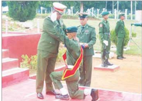
အရှေ့အလယ်ပိုင်းတိုင်းစစ်ဌာနချုပ် ဒုတိယတိုင်းမှူး ဝိုလ်မှူးချုပ် အောင်ကိုင်း ရှမ်းပြည်နယ်(တောင်ပိုင်း) နယ်မြေခံသင်တန်းကျောင်း တွင် ပြည်သူ့စစ်မှုထမ်းသင်တန်း အမှတ်စဉ် (၁၁/၂၀၂၅) သင်တန်း ဆင်းပွဲနှင့် ကတိသစ္စာခံယူပွဲအခမ်းအနား တက်ရောက်ချီးမြှင့်စဉ်။

သင်တန်းသားများကို ကြံ့ခိုင်ရေး ဘာသာရပ်၊ စစ်ရေးပြဘာသာ ရပ်၊ စစ်နည်းဗျူဟာဘာသာရပ် စသည့် ဘာသာရပ်များနှင့် အထွေထွေ ဘာသာရပ်များကို အဆင့်ဆင့် လေ့ကျင့်သင်ကြား ပေးခဲ့ကြကြောင်း သိရသည်။ ဖွဲ့စည်းပုံအခြေခံဥပဒေ (၂၀၀၈ ခုနှစ်)၊ ပုဒ်မ-၃၈၅ တွင် နိုင်ငံတော် ၏ လွတ်လပ်ရေး၊ အချုပ်အခြာ အာဏာနှင့်နယ်မြေတည်တံ့ခိုင်မြဲ ရေးအတွက် ကာကွယ်စောင့် ရှောက်ရေးသည် နိုင်ငံ့သားတိုင်း တွင် တာဝန်ရှိသည်ဟု ပြဋ္ဌာန်း ထားပြီး ပုဒ်မ-၃၈၆ တွင် နိုင်ငံ့သား တိုင်းသည် ဥပဒေပြဋ္ဌာန်းချက်များ