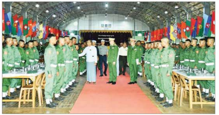
ဟိုပုံးတပ်နယ်နှင့် ဗထူးတပ်နယ်တို့ရှိ ပြည်သူ့စစ်မှုထမ်းသင်တန်းအမှတ်စဉ်(၁၁)သင်တန်းဆင်းပွဲ အခမ်းအနားတွင် ရှမ်းပြည်နယ်ဝန်ကြီးချုပ် ဦးအောင်အောင်နှင့် အရှေ့ပိုင်းတိုင်းစစ်ဌာနချုပ် တိုင်းမှူး ဝိုလ်ချုပ် ဇော်မင်းလတ်တို့က ရင်းရင်းနှီးနှီးလိုက်လံနှုတ်ဆက်စဉ်။