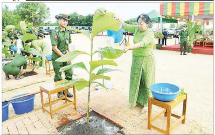
နိုင်ငံတော်စီမံအုပ်ချုပ်ရေးကောင်စီဒုတိယဥက္ကဋ္ဌ ဒုတိယတပ်မတော်ကာကွယ်ရေးဦးစီးချုပ် ကာကွယ်ရေးဦးစီးချုပ်(ကြည်း) ဒုတိယဗိုလ်ချုပ်မှူးကြီး စိုးဝင်းနှင့် ဇနီးဒေါ်သန်းသန်းနွယ် ရတနာတန်းဝင်ကျွန်းပင်ကို စိုက်ပျိုးပေးကြစဉ်။