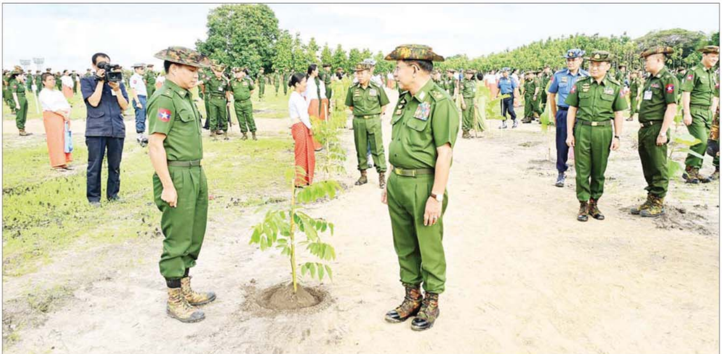
နိုင်ငံတော်စီမံအုပ်ချုပ်ရေးကောင်စီဥက္ကဋ္ဌ တပ်မတော်ကာကွယ်ရေးဦးစီးချုပ် ဗိုလ်ချုပ်မှူးကြီး မင်းအောင်လှိုင်နှင့် ဇနီးဒေါ်ကြာကြူးလှနှင့်အဖွဲ့ဝင်များ အရာရှိ စစ်သည်မိသားစုများ၏ စုပေါင်းသစ်ပင်စိုက်ပျိုးနေမှုအား လှည့်လည်ကြည့်ရှုအားပေးကြစဉ်။