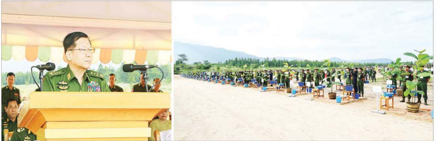
နိုင်ငံတော်စီမံအုပ်ချုပ်ရေးကောင်စီဥက္ကဋ္ဌ တပ်မတော်ကာကွယ်ရေးဦးစီးချုပ် ဗိုလ်ချုပ်မှူးကြီး မင်းအောင်လှိုင် ကာကွယ်ရေးဦးစီးချုပ်ရုံး(ကြည်း၊ ရေ၊ လေ) မိသားစုများ၏ ၂၀၂၅ ခုနှစ် ပထမအကြိမ် မိုးရာသီသစ်ပင် စိုက်ပျိုးပွဲအခမ်းအနားတွင် အမှာစကားပြောကြားစဉ်။

( ၉-၉-၂၀၂၄ ရက်နေ့တွင် နိုင်ငံတော်စီမံအုပ်ချုပ်ရေးကောင်စီဥက္ကဋ္ဌ နိုင်ငံတော်ဝန်ကြီးချုပ် ဗိုလ်ချုပ်မှူးကြီး မင်းအောင်လှိုင် ရှမ်းပြည်နယ်အစိုးရအဖွဲ့ဝင်များ၊ ပြည်နယ်နှင့် ခရိုင်အဆင့်ဌာနဆိုင်ရာတာဝန်ရှိသူများအား ပြောကြားသည့် အမှာစကားမှ ကောက်နုတ်ချက် )