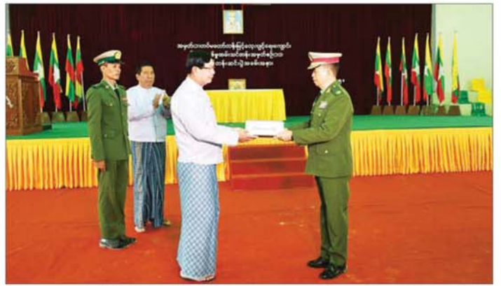
ဗဟိုဘာသာရပ်၊ စစ်မြေပြင်အင်ဂျင်နီယာဘာသာ ကာလမှာ ရက်သတ္တပတ် ၁၂ ပတ်ကြာ သင်ကြားရပါ။ စစ်မြေပြင်အုပ်ချုပ်မှုဘာသာရပ်နှင့် အထွေထွေပို့ချသွားခဲ့ကြောင်း သိရသည်။ သင်ကြားပို့ချခဲ့ပြီး သင်တန်း ခွဲထက်ကို(ပြန်/ဆက်)

သင်တန်းဆင်းမိန့်ခွန်း ပြောကြားသည်။ ထို့နောက် စံပြုတပ်သားချ၊ ကျင့်ဝတ်ဆု ၆၀၊ လက်ဖြောင့်တပ်သားချ၊ စစ်မြေပြင်မိုင်းကျွမ်းကျင်ဆု၊ တပ်စိတ်တိုက်ပွဲ အကောင်းဆုံးဆုနှင့် အိပ်ဆောင်အလိုက် အကောင်းဆုံးဆုရရှိသူများကို ကျောင်းအုပ်ကြီးက ဆုများပေးအပ်ချီးမြှင့်သည်။ ဆက်လက်၍ ရန်ကုန်တိုင်းဒေသကြီး ဝန်ကြီးချုပ် ဦးစိုးသိန်းသည် ၅၀၀ ဆဲ့ အားကစားခန်းမ၌ သင်တန်းသားများနှင့်တွေ့ဆုံအမှာစကား ပြောကြားပြီး သင်တန်းဆင်းတပ်ခွဲများကို ရင်းရင်းနှီးနှီး လိုက်လံနှုတ်ဆက်ကြကာ ဂုဏ်ပြုချီးမြှင့်ငွေများ ပေးအပ်ရာ ကျောင်းအုပ်ကြီးက လက်ခံရယူသည်။ အဆိုပါသင်တန်းတွင် သင်တန်းသား ၄၁၄ ဦးအား ကိုယ်လက်ကြံ့ခိုင်ရေးဘာသာရပ်၊ စစ်ရေးပြဘာသာရပ်၊ လက်နက်ငယ်ဘာသာရပ်၊ စစ်နည်း