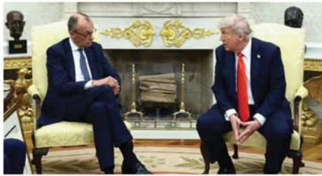
ဝါရှင်တန် ဇွန် ၆

အမေရိကန်သမ္မတ ဒေါ်နယ်လ်ထရပ်နှင့် ဂျာမနီဝန်ကြီးချုပ် ပရက်ဒရိုက်မားစ်တို့နှစ်ဦးသည် ဇွန် ၅ ရက်တွင် ကုန်သွယ်ရေးနှင့် ကာကွယ်ရေးအသုံးစရိတ်များအပေါ် ဆွေးနွေးမှုများဖြင့် အိမ်ပြုတော်၌တွေ့ဆုံမှုကို စတင်