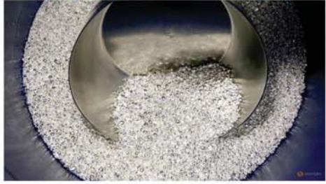
ဝါရှင်တန် ဇွန် ၆

ကမ္ဘာ့လက်ရှိဈေးကွက်တွင် ငွေဈေးသည် တစ်အောင်စလျှင် အမေရိကန်ဒေါ်လာ ၃၅ ဒေါ်လာအထိ ခုန်တက်လာကာ ယမန်နေ့က ၁၃နှစ်ကျော်အတွင်း အမြင့်ဆုံးအဆင့်သို့ ရောက်ရှိလာကြောင်း စီအင်အန်အိုင်းသတင်းဌာနက ဖော်ပြသည်။