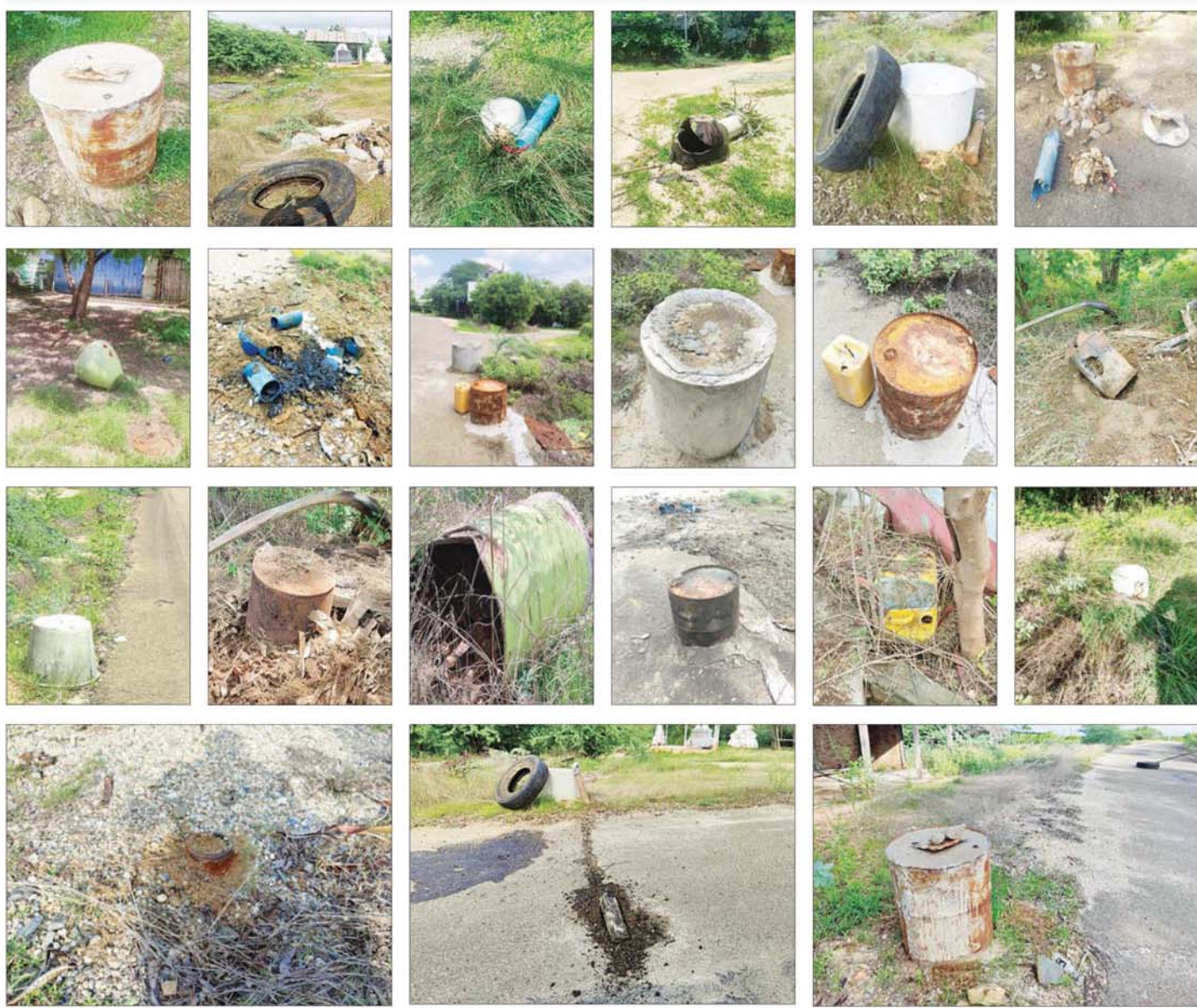
ပခုက္ကူမြို့နယ် ညောင်ဂျစ်ပင်ရွာနှင့် ကမ္မမြို့အကြား PDF အမည်ခံအကြမ်းဖက်သမားများထောင်ထားသည့် ဒေသန္တရ လက်လုပ်မိုင်းများအား တွေ့ရှိရစဉ်။