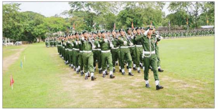
နယ်မြေခံစစ်သင်တန်းကျောင်းအသီးသီး၌ ပြည်သူ့စစ်မှုထမ်းသင်တန်း အမှတ်စဉ်(၁၁) သင်တန်းဆင်းပွဲအခမ်းအနားများ ကျင်းပစဉ်။