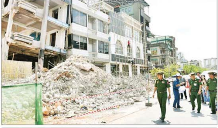
ကာကွယ်ရေးဦးစီးချုပ်ရုံး(ကြည်း)မှ ဒုတိယဗိုလ်ချုပ်ကြီး မျိုးမိုးအောင် မန္တလေးမြို့ မဟာအောင်မြေမြို့နယ် ရတနာဘုမ္မိအရှေ့ရပ်ကွက်ရှိ လျှင်ဒဏ်ကြောင့် ထိခိုက်ပျက်စီးခဲ့သော အန္တရာယ်ရှိလူနေအဆောက်အအုံများတွင် ဖြိုချရှင်းလင်းရန်ကုန် အဆောက်အအုံများအား ကြည့်ရှုစစ်ဆေးစဉ်။

မွန်လုံပိုင်းတွင် လျှင်ဒဏ်ကြောင့် ထိခိုက်ပျက်စီးမှုများ ဖြစ်ပေါ်ခဲ့သည့် စစ်ကိုင်းတောင်ရိုးရှိ ဆွမ်းဦးပညာရှင်စေတီတော်၊ စစ်ကိုင်းတောင်ရိုးပိတောက်ခေတ်ကျောင်းတိုက်၊ ထွဋ်ခေါင်ရပ်ကွက် မိုးညှင်းကျောင်းတိုက်၊ သောတပန်ရပ်ကွက် သီတဂူဗုဒ္ဓတက္ကသိုလ် ပရိဝုဏ်အတွင်းနှင့် သကျစိတသီလရှင်စာသင်တိုက်တို့၌ တပ်မတော်သားများနှင့် မြန်မာနိုင်ငံတော်ဖွဲ့ဝင်များက အပျက်အစီးများ ရှင်းလင်းဖယ်ရှားပေးနေမှု၊ သန့်ရှင်းရေးဆောင်ရွက်ပေးနေမှုနှင့် စက်ယန္တရားကြီးများဖြင့် အပျက်အစီး