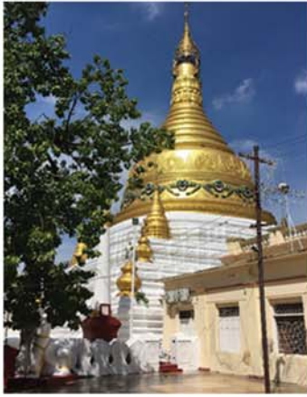
ငလျင်မလုပ်မီ ဘုရားနီ

ကျွန်တော်တို့ ရတနာပုံ မန္တလေးမြို့ဟာ မင်းတုန်းမင်းတည်ထောင်ခဲ့တဲ့ မြေပြည်တော် ဖြစ်သလို ယဉ်ကျေးမှု အမွေအနှစ် ပေါကြွယ်ဝတဲ့ မြို့တစ်မြို့လည်း ဖြစ်ပါတယ်။ ပေါလိုက်သမု ရတနာပုံခေတ်လက်ရာ ဘုရားစေတီကျောင်း ကန်တွေရာ၊ ရတနာပုံခေတ် မတိုင်မီ ရှေးခေတ် အဆက်ဆက်က ဘုရင်အပါအဝင် အဆင့် အတန်းမျိုးစုံရဲ့ ကုသိုလ်တွေပါ နေရာအနှံ့ပါပဲ။ တစ်ခါ နည်းနည်းထပ်ပြီး အကျယ်ချဲ့ပြောရရင် စေတီ၊ ပုထိုး၊ ဂူပုထိုးတွေသာမက အစဉ်အလာ ဘုန်းတော်ကြီးကျောင်းများအပြင် နေအိမ်နန်း ဆောင်တို့ကို အသွင်ပြောင်း လူဒါန်းခဲ့တဲ့ ဘုန်း ကြီးကျောင်းများအပြင် အနောက်တိုင်းဟန်လွမ်း တဲ့ ရှေးဟောင်းကျောင်းတော်ကြီးတွေနဲ့ ရသစုံ ပေးနိုင်တဲ့ အမွေအနှစ်တွေ နည်းမှမနည်းဘဲ။ ဒါတောင် သိပေါ့ဘုရင် ပါတော်မူပြီးနောက်ပိုင်း တည်ဆောက်လူဒါန်းကြတဲ့ ကိုလိုနီခေတ် လက်ရာနဲ့ ယနေ့ခေတ် လူဒါန်းတာတွေ ပေါင်း လိုက်ရင် ဘယ်လောက်တောင် ဂုဏ်ယူစရာ ကောင်းလိုက်သလဲဆိုတာ ပြောမကုန်နိုင်အောင် ပါပဲ။ အဲဒီလို ပေါကြွယ်ဝလှတဲ့ အမွေအနှစ်တွေ ဟာ ၂၀၂၅ ခုနှစ်၊ မတ် ၂၈ ရက်က လူ့ခေတ်ခွဲ တဲ့ အင်အားပြင်း ငလျင်ကြီးဒဏ်ကြောင့် အတော်များများ ပျက်စီးဆုံးရှုံးလိုက်ရပါတယ်။ ပြန်လည်ထူထောင်ဖို့ ထူထောင်ကြတဲ့ အခါမှာ လည်း ရေရှည်ခိုင်ခံ့အောင် သင့်တော်တဲ့ နည်း ပညာသုံးပြီး တည်ဆောက်ကြဖို့ ပညာရှင်တွေက ဆော်ဩနေကြပါတယ်။