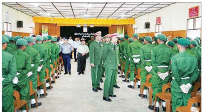
ရှမ်းပြည်နယ်(အရှေ့ပိုင်း) ကြိတ်ဒေသတိုင်းစစ်ဌာနချုပ် အမှတ်(၁၁) တပ်မတော်တန်းမြင့်လေ့ကျင့်ရေး ကျောင်း၌ ပြည်သူ့စစ်မှုထမ်းသင်တန်းဆင်းပွဲကျင်းပစဉ်။

ကြပြီး သင်တန်းသားများက နိုင်ငံတော်အလံကိုကိုင်၍ ကတိ သစ္စာခံယူကြသည်။ ထို့နောက် သင်တန်းကျောင်း များအလိုက် သင်တန်းဆင်း ထူးချွန်ဆုများဖြစ်သည့် စံပြ တပ်သားဆု၊ စစ်ရေးပြထူးချွန် ဆု၊ လက်ဖြောင့်တပ်သားဆု၊ စစ်သည်တော်ကျင့်ဝတ်ဆု၊ မိုင်း ကျွမ်းကျင်ဆု၊ တပ်စိတ်တိုက်နည်း ပထမဆု၊ ချေမှုန်းရေးပထမဆု၊ အိပ်ဆောင်အကောင်းဆုံးဆု ရရှိ သူများအား တာဝန်ရှိသူများက ဆုများ အသီးသီးပေးအပ်ချီးမြှင့် ပြီး သင်တန်းဆင်းအမှာစကား များ ပြောကြားကြသည်။ အဆိုပါ ပြည်သူ့စစ်မှုထမ်း သင်တန်း အမှတ်စဉ် (၁၁) မှ