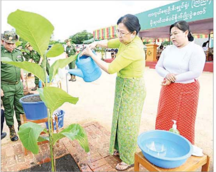
နိုင်ငံတော်စီမံအုပ်ချုပ်ရေးကောင်စီဥက္ကဋ္ဌ တပ်မတော်ကာကွယ်ရေးဦးစီးချုပ် ဗိုလ်ချုပ်မှူးကြီး မင်းအောင်လှိုင်နှင့် ဇနီးဒေါ်ကြူကြူလှ ရတနာတန်းဝင်ကျွန်းပင်ကို ဦးဆောင်စိုက်ပျိုးပေးကြစဉ်။