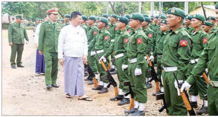
အနောက်တောင်တိုင်းစစ်ဌာနချုပ် နယ်မြေခံသင်တန်းကျောင်း၌ ပြည်သူ့စစ်မှုထမ်းသင်တန်း အမှတ်စဉ် (၁၁) သင်တန်းဆင်းပွဲအခမ်းအနားတွင် ဧရာဝတီတိုင်းဒေသကြီးဝန်ကြီးချုပ် ဦးတင်မောင်ဝင်းနှင့် တပ်မတော်အရာရှိကြီးများ သင်တန်းဆင်းစစ်သည်များအား ရင်းရင်းနှီးနှီး လိုက်လံနှုတ်ဆက်စဉ်။