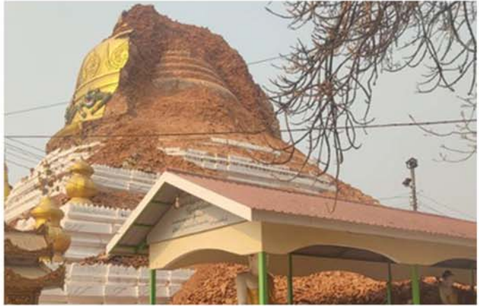
ငလျင်လုပ်ပြီး မူလစေတီတော်ပေါ်လာသော ဘုရားနီ