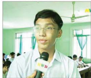
ကျောင်းသား

နေသည့် ကျောင်းသား ကျောင်းသူများကိုလည်း ဆက်လက် ကျောင်းအပ်လက်ခံပေးလျက်ရှိကြောင်း သိရသည်။ ယခုကဲ့သို့ အခြေခံပညာကျောင်းများ စနစ်တကျ ဖွင့်လှစ်နိုင်ရေးအတွက် ပညာရေးဝန်ကြီးဌာနနှင့် သက်ဆိုင်ရာအဖွဲ့အစည်းများမှ တာဝန်ရှိသူများက