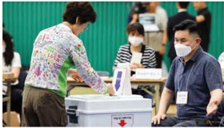
တောင်ကိုရီးယားနိုင်ငံ ဆိုးလ်မြို့တော်တစ်နေရာတွင် ကြားဖြတ်သမ္မတရွေးကောက်ပွဲအတွက် စွန့် ၃ ရက်က မဲပေးနေကြစဉ်။ Mon