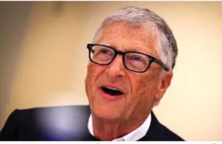
ဘီလ်ဂိတ်စ်က ထုတ်ဖော်ပြောကြားသည်။ အီသီယိုးပီးယားမြို့တော်

ဝါရှင်တန် စွန့် ၃ မိုက်ခရိုဆော့ပီကုမ္ပဏီတည်ထောင်သူ ဘီလ်ဂိတ်စ်က လာမည့်နှစ် ၂၀ အတွင်း ၎င်း၏ ပိုင်ဆိုင်မှုအများစုကို အာဖရိကတိုက်ရှိ ကျန်းမာရေးနှင့်ပညာရေးဝန်ဆောင်မှုများ မြှင့်တင်ရန်အတွက် အသုံးပြုရန် ရည်မှန်းထားကြောင်း စီအင်န်အိုင်သတင်းဌာနက ဖော်ပြသည်။ ကျန်းမာရေးနှင့်ပညာရေးမှ တစ်ဆင့် လူသားအရင်းအမြစ် ထွန်းကားစေခြင်းဖြင့် အာဖရိကရှိ နိုင်ငံတိုင်း ဖွံ့ဖြိုးတိုးတက်မှုလမ်းကြောင်းပေါ်ရောက်သင့်သည်”ဟု အသက် ၆၉ နှစ်ရှိပြီဖြစ်သော