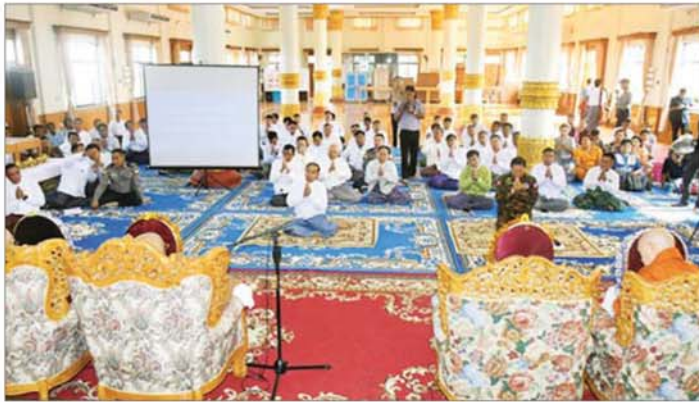
ဗိုလ်ချုပ်ကြီးသက်ပုံ၊ တိုင်းဒေသကြီးအစိုးရ အဖွဲ့ဝင် ဦးစွာ တိုင်းဒေသကြီး ဝန်ကြီးချုပ်၊ ဒုတိယဗိုလ်ချုပ်ကြီး သက်ပုံနှင့် တက်ရောက်လာကြသူများက သီတဂူဆရာတော်ကြီးထံမှ ငါးသီလ

ငလျင်ဒဏ်ကြောင့် ပြိုကျပျက်စီးခဲ့သော စစ်ကိုင်းတိုင်းဒေသကြီး စစ်ကိုင်းမြို့ စစ်ကိုင်းတောင်ရိုးရှိ ဆွမ်းဦးပုညရှင်စေတီတော်မြတ်ကြီးနှင့် သာသနိကအဆောက်အအုံများ ဘက်စုံပြုပြင်မွမ်းမံပြင်ဆင်ခြင်း လုပ်ငန်းများအတွက် ဆရာတော်ကြီးများအား လျှောက်ထားခြင်းနှင့် ဆုံးမဩဝါဒခံယူခြင်းကို ယနေ့ နံနက်ပိုင်းတွင် အဆိုပါစေတီတော်မြတ်ကြီး၌ ပြုလုပ်ရာ နိုင်ငံတော်ဩဝါဒစရိယ၊ ရွှေကျင်နိကာယဥက္ကဋ္ဌ သောဠသမ ရွှေကျင်သာသနာပိုင် သီတဂူကမ္ဘာ့ပုဒ္ဓိတက္ကသိုလ်များနှင့် သီတဂူဆေးရုံတော်များ၏ အဓိပတိ အဘိဓမ္မမဟာရဋ္ဌဂုရု အဘိဓမ္မ အဂ္ဂမဟာသဒ္ဓမ္မ စေတီက မဟာဓမ္မကထိက ဗဟုဇနဟိတစရ သီတဂူဆရာတော်ကြီး ဒေါက်တာဘဒ္ဒန္တဏီသရ အမှုပြီးပြသော သံဃာတော်များ ကြွရောက်တော်မူကြပြီး တိုင်းဒေသကြီး ဝန်ကြီးချုပ် ဦးမြတ်ကျော်၊ ကာကွယ်ရေးဦးစီးချုပ်ရုံး (ကြည်း)မှ ဒုတိယ