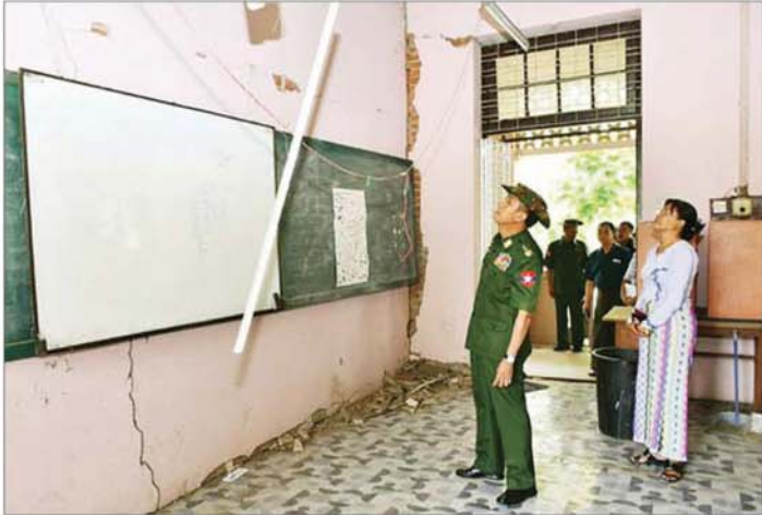
ကာကွယ်ရေးဦးစီးချုပ်ရုံး(ကြည်း)မှ ဒုတိယဗိုလ်ချုပ်ကြီး မျိုးမိုးအောင် မန္တလေးမြို့ မန္တလေးတက္ကသိုလ် အကယ်ဒမီဆောင်သို့ သွားရောက်၍ သတ္တဗေဒဌာန၊ ရာဇဝေဒဌာနနှင့် ဘူမိဗေဒဌာနတို့ရှိ ငလျင်ဒဏ်ကြောင့် ထိခိုက်ပျက်စီးခဲ့သည့် အပျက်အစီးနေရာများအား လိုက်လံကြည့်ရှုစစ်ဆေးစဉ်။

ထို့နောက် ဒုတိယဗိုလ်ချုပ်ကြီး သက်ပုံနှင့် တာဝန်ရှိသူများသည် စစ်ကိုင်းမြို့ရှိ ငလျင်ဒဏ်သင့်ပြည်သူများအတွက် တပ်မတော်ရေသန့်စက်ဖြင့် ရေသန့်ထုတ်ဝေပေးနေမှုများ၊ နန်းဦးမြို့သစ်ရှိ ဝန်ထမ်းအိမ်ရာများတွင် မိုးမကျမီ အမြန်ဆုံး ပြောင်းရွှေ့နေထိုင်နိုင်ရန် Modular House ဆောက်လုပ်ပြီးစီးမှုနှင့် ဆောက်လုပ်နေမှုများ၊ စစ်ကိုင်းမြို့အတွင်းရှိ နေအိမ်အဆောက်အအုံများနှင့် တကောင်းရပ်ကွက် စရာတီမြစ်ကူးတံတား (စစ်ကိုင်း)အောက် မြေနိမ့်ပိုင်းရှိ ရေဝင်သောနေရာများအား စက်ယန္တရားဖြင့် မြေမြှင့်ခြင်းဆောင်ရွက်