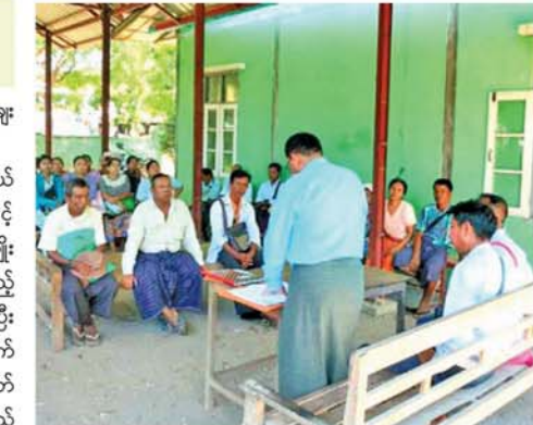
နှုန်းဖြင့် ထုတ်ချေးပေးလျက်ရှိပြီး ထုတ်ချေးပေးရန် ကျန်ရှိသည့် ကျေးရွာအုပ်စုများမှ ဒေသခံတောင်သူများကိုလည်း ချေးငွေပြေကြေစွာ ပေးဆပ်မှုအပေါ် မူတည်ပြီး ရုံးဖွင့်ရက်များတွင် ဆက်လက်ထုတ်ချေးဆောင်ရွက်ပေးသွားမည်ဖြစ်ကြောင်း မင်းဖြူမြို့နယ် မြန်မာ့လယ်ယာဖွံ့ဖြိုးရေးဘဏ်ခွဲမှ သိရသည်။ (အပေါ်) (၄၄၅)

ငွေကျပ် သိန်း ၈၅၀၀ ထုတ်ချေးဆောင်ရွက်ပြီးစီးပြီ ဖြစ်သည်။ မင်းဖြူမြို့နယ် မြန်မာ့လယ်ယာဖွံ့ဖြိုးရေးဘဏ်ခွဲအနေဖြင့် ၂၀၂၅ ခုနှစ် မိုးသီးနှံစိုက်ပျိုးစရိတ်ချေးငွေထုတ်ချေးပေးရမည့် ကျေးရွာအုပ်စု (၅၁)အုပ်စုရှိပြီး အဆိုပါ ကျေးရွာအုပ်စုများအနက် မှ ယခင်နှစ်က စိုက်ပျိုးစရိတ်ချေးငွေပြေကြေစွာ ပေးဆပ်သည့် ဒေသခံတောင်သူများကို မေ ၂၀ ရက်မှ စတင်၍ မိုးစပါးသီးနှံစိုက်ပျိုးရန်အတွက် တစ်ဧကလျှင် ငွေကျပ် တစ်သိန်းခွဲနှုန်း၊ အခြားသီးနှံ စိုက်ပျိုးရန်အတွက် တစ်ဧကလျှင် ငွေကျပ် တစ်သိန်း