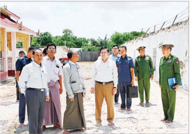
နိုင်ငံတော်စီမံအုပ်ချုပ်ရေးကောင်စီဥက္ကဋ္ဌ နိုင်ငံတော်ဝန်ကြီးချုပ် ဗိုလ်ချုပ်မှူးကြီး မင်းအောင်လှိုင် မန္တလေးငလျင်ဒဏ်ကြောင့် ထိခိုက်ပျက်စီးမှုများဖြစ်ပေါ်ခဲ့သည့် ဆွမ်းဦးပုညရှင်စေတီတော်၌ ရှင်းလင်းဆောင်ရွက် ထားရှိမှုကို ကြည့်ရှုစစ်ဆေးစဉ်။