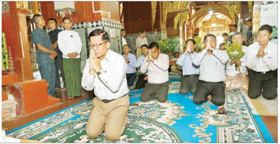
နိုင်ငံတော်စီမံအုပ်ချုပ်ရေးကောင်စီဥက္ကဋ္ဌ နိုင်ငံတော်ဝန်ကြီးချုပ် ဗိုလ်ချုပ်မှူးကြီး မင်းအောင်လှိုင်နှင့်အဖွဲ့ဝင်များ မဟာမြတ်မုနိဘုရားကြီးအား ဖူးမြော်ကြည်ညိုစဉ်။