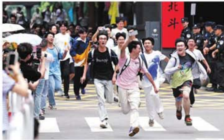
တရုတ်နိုင်ငံ၊ ဟုနန်ပြည်နယ်၊ ချန်ရှားမြို့ရှိ ချန်ရှားချန်ချန် အထက်တန်းကျောင်းမှ ကျောင်းသားများ ဇွန် ၉ ရက်က အမျိုးသား အဆင့် တက္ကသိုလ်ဝင်တန်း စာမေးပွဲအပြီးတွင် ကျောင်းထဲမှ ပြေးထွက်လာကြစဉ်။ Mon