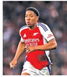
တိုင်ကလည်းအသင်းမှာ ပျော်ရွှင်နေပါတယ်' ဟု ထုတ်ပြန်သည်။ (အပေါ်ပုံ) (NGB)

စုံ ၃၉ ပွဲကစားပြီး တစ်ဂိုးသွင်းယူထားသလို အနာဂတ်တွင်လည်း ထွန်းတောက်လာမည့် ကစားသမားတစ်ဦးအဖြစ် သတ်မှတ်ခြင်းခံထားရသည်။ အာဆင်နယ်အသင်းထုတ်ပြန်ချက်တွင် 'လူးဝစ်စကယ်လီအသင်းမှာ ဆက်ရှိသွားမှာပါ။ သူဟာ အနာဂတ်မှာ ထွန်းတောက်လာဦးမှာပါ။ သူကိုယ်