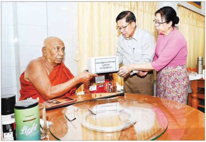
နိုင်ငံတော်စီမံအုပ်ချုပ်ရေးကောင်စီဥက္ကဋ္ဌ နိုင်ငံတော်ဝန်ကြီးချုပ် ဗိုလ်ချုပ်မှူးကြီး မင်းအောင်လှိုင်နှင့် စနိုး ဒေါ်ကြူကြူလှတို့ ငလျင်တားဒဏ်ကြောင့် ပြိုကျပျက်စီးမှုများ ဖြစ်ပေါ်ခဲ့သည့် ဘုရား၊ စေတီပုထိုးများ ပြုပြင်ရေးလုပ်ငန်းများတွင် အသုံးပြုရန်အတွက် တပ်မတော် (ကြည်း၊ ရေလေ) မိသားစုများက လှူဒါန်း သည့် ဘိလပ်မြေ တန်ချိန် ၁၅၀၀ ကို ဆရာတော်ကြီးထံ ဆက်ကပ်လှူဒါန်းစဉ်။

ထို့နောက် ပြန်လည်ပြုပြင်တည်ဆောက်ရန် လိုအပ်သည့် စာသင်ဆောင်များနှင့် ယာယီစာသင် ဆောင် ဆောက်လုပ်နေမှုတို့အား လှည့်လည်ကြည့်ရှု ချိတ်ဆက်ရန်ရှိသူများ၏ တင်ပြချက်များအပေါ် စာသင် ဆောင်များ ပြန်လည်ပြုပြင်တည်ဆောက်ရာတွင် ရေရှည်ခိုင်ခံ့ကောင်းမွန်ရေးအတွက် စနစ်တကျ ဆောင်ရွက်သွားရန်နှင့် အခြားလိုအပ်သည်များကို မှာကြားပြီး စာသင်ဆောင်များတွင် ကျောင်းသား ကျောင်းသူများ ပညာသင်ယူနေမှုအခြေအနေများကို လိုက်လံကြည့်ရှုအားပေးသည်။ ရာဇမဏိစူဠာ ကောင်းမှုတော်စေတီတော်မြတ်ကြီး ယင်းနောက် နိုင်ငံတော်စီမံအုပ်ချုပ်ရေး ကောင်စီဥက္ကဋ္ဌ နိုင်ငံတော်ဝန်ကြီးချုပ်နှင့် အဖွဲ့ဝင် များသည် ရာဇမဏိစူဠာကောင်းမှုတော်စေတီတော် မြတ်ကြီးသို့ ရောက်ရှိကြရာ ဂေါပကအဖွဲ့ဥက္ကဋ္ဌ ဦးသန်းထွန်းအောင်နှင့် အဖွဲ့ဝင်များက ကြိုဆို နှုတ်ဆက်ကြသည်။ ဆက်လက်၍ နိုင်ငံတော်စီမံ အုပ်ချုပ်ရေးကောင်စီဥက္ကဋ္ဌ နိုင်ငံတော်ဝန်ကြီးချုပ်နှင့် စနိုး၊ အဖွဲ့ဝင်များသည် စေတီတော်မြတ်ကြီးရှိ ဗုဒ္ဓရုပ်ပွားတော်မြတ်အား ဖူးမြော်ကြည့်ညိကာ ပန်း၊