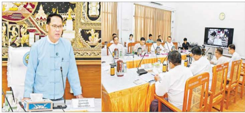
ပြည်ထောင်စုဝန်ကြီး ဦးမောင်မောင်အုန်း မြန်မာနိုင်ငံစာကြည့်တိုက်များဖွံ့ဖြိုးတိုးတက်ရေး ပူးပေါင်းဆောင်ရွက်မှုကော်မတီ လုပ်ငန်းညှိနှိုင်းအစည်းအဝေး(၁/၂၀၂၅)တွင် အမှာစကားပြောကြားစဉ်။

နေပြည်တော် ၉ ဇွန် ၁၀ မြန်မာနိုင်ငံ စာကြည့်တိုက်များ ဖွံ့ဖြိုးတိုးတက်ရေး ပူးပေါင်းဆောင်ရွက်မှုကော်မတီ လုပ်ငန်းညှိနှိုင်းအစည်းအဝေး(၁/၂၀၂၅)ကို ယနေ့ဇွန်လဆန်းတွင် နေပြည်တော်ရှိ ပြန်ကြားရေးဝန်ကြီးဌာန အစည်းအဝေးခန်းမ၌ ကျင်းပသည်။ အစည်းအဝေးသို့ မြန်မာနိုင်ငံ စာကြည့်တိုက်များ ဖွံ့ဖြိုးတိုးတက်ရေးပူးပေါင်းဆောင်ရွက်မှုကော်မတီ ဥက္ကဋ္ဌ ပြန်ကြားရေးဝန်ကြီးဌာန ပြည်ထောင်စုဝန်ကြီး ဦးမောင်မောင်အုန်း၊ အမြဲတမ်းအတွင်းဝန်၊ ဌာနဆိုင်ရာတာဝန်ရှိသူများ တက်ရောက်ကြပြီး သာသနာရေးနှင့် ယဉ်ကျေးမှုဝန်ကြီးဌာန ဒုတိယဝန်ကြီး ဒေါ်နန္ဒာ၊ နေပြည်တော်ကောင်စီဝင် ဦးမြင့်စိုး၊ ပြည်နယ်နှင့်တိုင်းဒေသကြီးများမှ လူမှုရေးရာဝန်ကြီးများ၊ မြန်မာနိုင်ငံ စာကြည့်တိုက်များမောင်အေးရှင်း ဥက္ကဋ္ဌ ဦးညွန့်ဆွေ၊ မြန်မာနိုင်ငံစာရေးဆရာအသင်းဥက္ကဋ္ဌ မြင်းမူမောင်နိုင်စိုးနှင့် တာဝန်ရှိသူများ