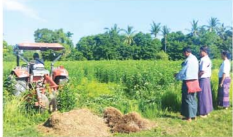
အောင်ပိုင်ပိုင်ကျော်

မြေဆီလွှာအာဟာရဖွံ့ဖြိုး ရေးအတွက် သစ်စိမ်းမြေဩဇာ ပိုက်ဆံလျှော်ကို စိုက်ပျိုးမည်ဆို ပါက မျိုးစေ့နှုန်း တစ်ဧကလျှင် ၆ ပြည်မှ ၁၂ ပြည်ထိ အသုံးပြု စိုက်ပျိုးရပြီး စိုက်ပျိုးပြီး ၄၅ ရက် သားမှ ၆၅ ရက်သားအကြားတွင် ထယ်ထိုးပြုပြင်ပေးခြင်းဖြင့် သစ် စိမ်းမြေဩဇာ ပိုက်ဆံလျှော်မှ (Biomass) ၇ တန်မှ ၁၀ တန် အထိရရှိပြီး နိုက်ထရိုဂျင်ပမာဏ ၁၅၀ ကီလိုဂရမ်၊ ဖော့ဖော့ရစ် ၁၀ ကီလိုဂရမ်၊ ပိုတာဆီယမ်ဓာတ် ၄၈ ကီလိုဂရမ်အထိ ရရှိပြီး မြေ တွင်း အာဟာရဓာတ် ကြွယ်ဝ၍ မြေဩဇာအဖြစ် အသုံးပြုနိုင်ခြင်း ကြောင့် တောင်သူများအနေဖြင့် ဓာတ်မြေဩဇာသုံးစွဲမှု လျော့နည်း ပြီး ကုန်ကျစရိတ် သက်သာစေ မည်ဖြစ်ကြောင်း သိရသည်။