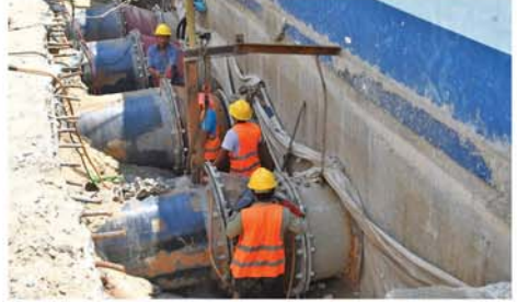
အရင်ကလည်း ရွှေခဲ Pum-

ကာ အပန်းဖြေခြင်းနှင့် ငှက်လှေ စီးခြင်းတံတားပေါ်လမ်းလျှောက် ခြင်းများဖြင့် အပန်းဖြေလာသူ များဖြစ်ပြီး ယခုရက်ပိုင်းတွင် ပြည်ပခရီးသွား လာရောက်မှု မရှိသလောက် နည်းပါးနေသည် ဟု သိရသည်။ တံတားက ငလျင်ဒဏ် ကြောင့် အရှေ့ဘက်အခြမ်းအထိ သွားလို့မရဘူး။ အလယ်ဧရပ် လောက်အထိပဲ သွားလို့ရတယ်။ အိမ်ကလာတဲ့သူတွေက တံတား ပေါ် လှေညှင်းခံ လမ်းလျှောက်ကြ ဓာတ်ပုံရိုက်ကြတာဟု ငှင်းက ဆက်လက်ပြောကြားသည်။ ငှက်လှေစီးခများမှာ တစ် ခေါက်လျှင် ငွေကျပ် ၁၅၀၀၀- ၂၀၀၀၀ ဖြစ်ပြီး ယခုကဲ့သို့ ရေတက်ချိန်နှင့် လေတိုက်ချိန်တွင် ငှက်လှေသမားများမှာ အားစိုက် လှော်ခတ်ကြရပြီး တစ်ရက်လျှင် တစ်ခေါက်ရရှိရန် ခက်ခဲနေကာ လာမည့် ဝါတွင်းကာလတွင် ငှက်လှေစီးသူများပြားလာရန် မျှော် လင့်လျက်ရှိသည်ဟု ဆိုသည်။