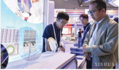
အကြား ချိတ်ဆက်ဖလှယ်ပေးသော ပလက်ဖောင်း တည်ဆောက်ပေးခြင်းမှတစ်ဆင့် အလင်းနှင့် အီလက်ထရွန်းနစ်လုပ်ငန်း ဖွံ့ဖြိုးတိုးတက်ရေးကို အားပေးကူညီခဲ့သည်။ (ဆင်ဟွာ)

ချန်ချမ်း ဇွန် ၁၀ နိုင်ငံတကာ အလင်းနှင့် အီလက်ထရွန်းနစ်ဆိုင်ရာ ကုန်စည်ပြပွဲ၊ Light နိုင်ငံတကာ ညီလာခံ (အတိုကောက်- ၂၀၂၅ ခုနှစ် ချန်ချမ်း အလင်းထုတ်ကုန်ဆိုင်ရာ ကုန်စည်ပြပွဲ)ကို တရုတ်နိုင်ငံ ချန်ချမ်းမြို့ အရှေ့မြောက်အာရှ နိုင်ငံတကာ ကုန်စည်ပြပွဲစင်တာ၌ ယနေ့တွင် ဖွင့်လှစ်ကျင်းပခဲ့သည်။ ယခုအကြိမ် ကုန်စည်ပြပွဲကို “အလင်းနှင့် အီလက်ထရွန်းနစ် အရည်အသွေးသစ်အနာဂတ်ကို ဦးဆောင်ခြင်း” ဟူသော ခေါင်းစဉ်ဖြင့်ကျင်းပခဲ့ရာ အလင်းနှင့် အီလက်ထရွန်းနစ် အချက်အလက်နယ်ပယ်ရှိ အဆင့်မြင့်နည်းပညာများနှင့် နောက်ဆုံးပေါ်ထုတ်ကုန်များကို အဓိကထားပြသခဲ့သည်။ သိပ္ပံနည်းပညာနှင့် ဈေးကွက်၊ စီမံကိန်းနှင့်ရင်းနှီးမြှုပ်နှံမှု၊ စက်မှုလုပ်ငန်းနှင့်လူ့ရည်ချွန်များ