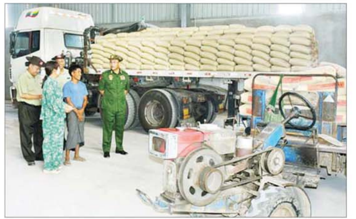
ကာကွယ်ရေးဦးစီးချုပ်ရုံး(ကြည်း) မှ ဒုတိယဗိုလ်ချုပ်ကြီး မျိုးသန့်နိုင် ကျောက်ဆည်မြို့ စဉ်ကိုင်မြို့နယ်အတွင်းရှိ လျှင်ဒေသကြောင့် ပျက်စီးသွားသော ဘုရားစေတီများ၊ သာသနိကအဆောက်အအုံများနှင့် လူနေအဆောက်အအုံများ ပြန်လည်ပြုပြင်တည်ဆောက်ရေးအတွက် လိုအပ်လျက်ရှိသော ဘီလပ်မြေ၊ သံချောင်းနှင့် အထပ်သားပြားများအား စက်ရုံထုတ် အထူးဈေးနှုန်းဖြင့် ရောင်းချပေးနေမှုအခြေအနေများ သွားရောက်ကြည့်ရှုစစ်ဆေးစဉ်။ သည်များ ညှိနှိုင်းဆောင်ရွက်ပေးပြီး ဥယျာဉ်လေး လှူဖွယ်ပစ္စည်းများ ဆက်ကပ်လှူဒါန်းခဲ့ကြောင်း ပရဟိတဘုန်းတော်ကြီးကျောင်း ဆရာတော်အား သတင်းရရှိသည်။ သတင်းစဉ်

ယင်းနောက် စဉ်ကိုင်မြို့နယ် တောင်ရင်းကျေးရွာရှိ TOP Myanmar ပီနီအိတ်စက်ရုံနှင့် KIYO-MYANMAR Healthy Friut & Veggie Chips စက်ရုံတို့၌ လျှင်ဒဏ်ကြောင့် ထိခိုက်ပျက်စီးမှု၊ ပြန်လည်ပြင်ဆင်ဆောင်ရွက်ပြီးစီးမှုနှင့် လုပ်ငန်းများပြန်လည်လည်ပတ်နေမှုများ၊ ဘဲလင်းကျေးရွာရှိ မြင်မိရိတောင်ဘုရားနှင့် နှစ်ဆူတောင်ဘုန်းတော်ကြီးကျောင်းတို့ရှိ လျှင်ဒဏ်ကြောင့် ထိခိုက်ပျက်စီးမှုများ၊ စဉ်ကိုင်မြို့နယ်အတွင်းရှိ လျှင်ဒေသကြောင့် ပျက်စီးသွားခဲ့သည့် ဘုရားစေတီများ၊ သာသနိကအဆောက်အအုံများနှင့် နေအိမ်အဆောက်အအုံများ ပြန်လည်ပြုပြင်တည်ဆောက်ရေးအတွက် လိုအပ်လျက်ရှိသော ဘီလပ်မြေ၊ သံချောင်းနှင့် အထပ်သားပြားများကို စက်ရုံထုတ်အထူးဈေးနှုန်းဖြင့် ရောင်းချပေးနေမှုများနှင့် ဥယျာဉ်ငယ်ကျေးရွာ ဥယျာဉ်လေးပရဟိတဘုန်းကြီးကျောင်းရှိ လျှင်ဒဏ်ကြောင့် ထိခိုက်ပျက်စီးမှုများနှင့် ပြန်လည်ပြုပြင်ရေး ဆောင်ရွက်နေမှုများကို သွားရောက်ကြည့်ရှုစစ်ဆေး၍ လိုအပ်