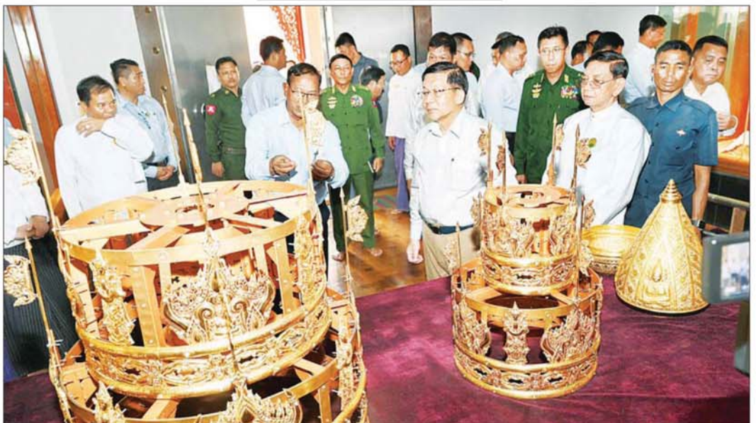
နိုင်ငံတော်စီမံအုပ်ချုပ်ရေးကောင်စီဥက္ကဋ္ဌ နိုင်ငံတော်ဝန်ကြီးချုပ် ဗိုလ်ချုပ်မှူးကြီး မင်းအောင်လှိုင် ငလျင်ဘေးဒဏ်ဖြစ်ပေါ်ချိန်တွင် ပြင်းထန်သောလှုပ်ခတ်မှုများကြောင့် မြေခဲခဲ့ရသည့် စိန်ဖူးတော်၊ ငှက်မြတ်နားတော်တို့ကို ကြည့်ရှုစစ်ဆေးစဉ်။

ငလျင်ဘေးဒဏ်ကြောင့် ပြိုကျပျက်စီးမှုများ ဖြစ်ပေါ်ခဲ့ရသည့် ဘုရား၊ စေတီပုထိုးများ ပြုပြင်ရေးလုပ်ငန်းများတွင် အသုံးပြုရန်အတွက် တပ်မတော်(ကြည်း၊ ရေလေ) မိသားစုများက တီလပ်မြေတန်ချိန် ၁၅၀၀ လှူဒါန်း ထိုနောက် နိုင်ငံတော်စီမံအုပ်ချုပ်ရေးကောင်စီဥက္ကဋ္ဌ နိုင်ငံတော်ဝန်ကြီးချုပ်နှင့် အဖွဲ့ဝင်များသည် သီတဂူဝိသုသနာကျောင်းတိုက်သို့ ရောက်ရှိပြီး နိုင်ငံတော်ဩဝါဒါစရိယ သောဠသမ ရွှေကျင်သာသနာပိုင် ဆရာတော်၊ သီတဂူကမ္ဘာ့ဗုဒ္ဓတက္ကသိုလ်များ၏ အမိတ် အဘိဓမ္မာ ရတနာရုံ