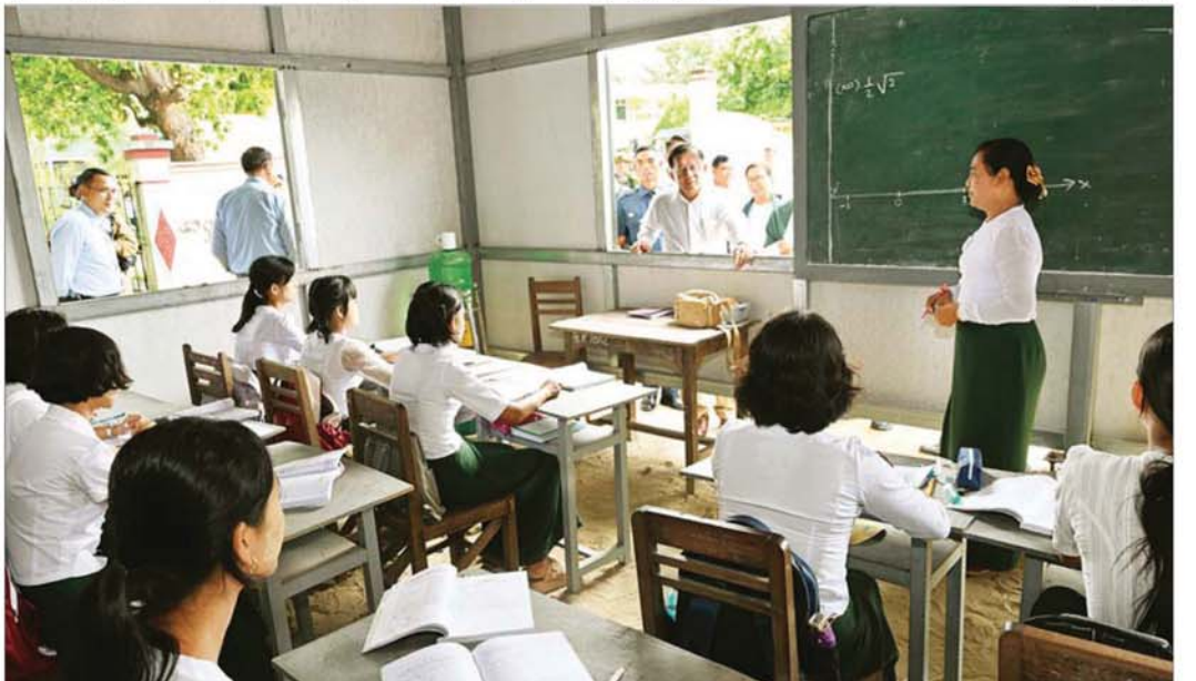
နိုင်ငံတော်စီမံအုပ်ချုပ်ရေးကောင်စီဥက္ကဋ္ဌ နိုင်ငံတော်ဝန်ကြီးချုပ် ဗိုလ်ချုပ်မှူးကြီး မင်းအောင်လှိုင် စစ်ကိုင်းမြို့ အမှတ်(၁) အခြေခံပညာအထက်တန်းကျောင်း စာသင်ဆောင်၌ ကျောင်းသား ကျောင်းသူများ ပညာသင်ယူနေမှုအခြေအနေကို ကြည့်ရှုအားပေးစဉ်။

ရေးလုပ်ငန်းများ ဆောင်ရွက်ထားရှိမှုတို့ကို လိုက်လံ ကြည့်ရှုစစ်ဆေးပြီး တာဝန်ရှိသူများ၏ တင်ပြချက် များအပေါ် လိုအပ်သည်များ လမ်းညွှန်မှာကြားသည်။ စာမျက်နှာ ၄ သို့