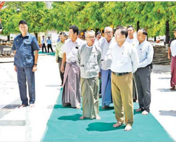
နိုင်ငံတော်စီမံအုပ်ချုပ်ရေးကောင်စီဥက္ကဋ္ဌ နိုင်ငံတော်ဝန်ကြီးချုပ် ဗိုလ်ချုပ်မှူးကြီးမင်းအောင်လှိုင် စစ်ကိုင်းကောင်းမှုတော်စေတီတော်မြတ်ကြီးတွင် ကြည့်ရှုစစ်ဆေးစဉ်။