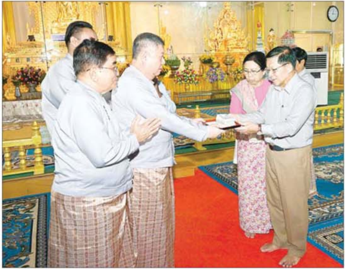
နိုင်ငံတော်စီမံအုပ်ချုပ်ရေးကောင်စီဥက္ကဋ္ဌ နိုင်ငံတော်ဝန်ကြီးချုပ် ဗိုလ်ချုပ်မှူးကြီး မင်းအောင်လှိုင်နှင့် ဇနီး ဒေါ်ကြာကြာ(လှ မဟာအတုလဝေယန်(အတုမရှိ)ကျောင်းတော်ကြီး၌ ဂေါပကအဖွဲ့ထံ ဘက်စုံစုပေါင်း အလှူတော်ငွေများ ပေးအပ်လှူဒါန်းစဉ်။