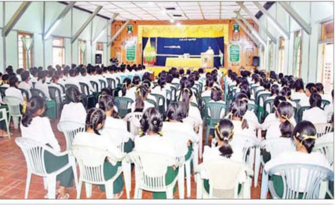
ဒုတိယဝန်ကြီး ဦးရဲတင် ပြင်ဦးလွင်မြို့ အမှတ်(၃) အခြေခံပညာအထက်တန်းကျောင်း၌ ကျောင်းသား ကျောင်းသူများအား တွေ့ဆုံအမှာစကား ပြောကြားစဉ်။

စစ်ဆေးပြီး စာဖတ်သူ၊ စာသားသူ တိုးတက်ရေးနှင့် စာအုပ်စာစောင် များ ပျောက်ဆုံးပျက်စီးမှုမရှိစေ ရေးတို့ကို မှာကြားသည်။ လုပ်ငန်းနှင့် ဝန်ထမ်းရေးရာ ကိစ္စရပ်များမှာကြား ယင်းနောက် ခရိုင်ပြန်ကြား ရေးနှင့် ပြည်သူ့ဆက်ဆံရေးဦးစီး ဌာနရုံးတွင် ခရိုင်ဦးစီးမှူးနှင့် ဝန်ထမ်းများ၊ မြန်မာ့အသံနှင့် ရုပ်မြင်သံကြား ထပ်ဆင့်လွှင့် စက်ရုံဇန်နယ်မှူးနှင့် စက်ရုံမှူးတို့ အားတွေ့ဆုံ၍ လုပ်ငန်းဆိုင်ရာများ နှင့် ဝန်ထမ်းရေးရာကိစ္စရပ်များ ကို မှာကြားသည်။ ထို့နောက် မြန်မာ့အသံနှင့် ရုပ်မြင်သံကြား ထပ်ဆင့်လွှင့် စက်ရုံသို့ရောက်ရှိပြီး စက်ပစ္စည်း များ စနစ်တကျ ထိန်းသိမ်းအသုံး