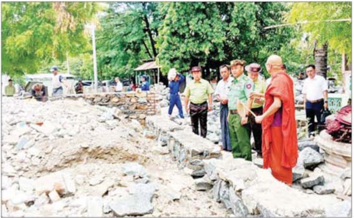
ကာကွယ်ရေးဦးစီးချုပ်ရုံး(ကြည်း)မှ ဒုတိယဗိုလ်ချုပ်ကြီး မျိုးသန့်နိုင် ကျောက်ဆည်မြို့၊ ကြက်မင်းတွန် ရပ်ကွက်ရှိ ရွှေစေတီစာသင်တိုက်၌ ငလျင်ဒဏ်ကြောင့် ထိခိုက်ပျက်စီးမှုအခြေအနေများနှင့် ပြန်လည်ပြုပြင် ဆောင်ရွက်နေမှုအခြေအနေများ ကြည့်ရှုစစ်ဆေးစဉ်။

သည်များ ပေါင်းစပ်ညှိနှိုင်းဆောင်ရွက်ပေးသည်။ ထို့ပြင် ကာကွယ်ရေးဦးစီးချုပ်ရုံး(ကြည်း)မှ ဒုတိယဗိုလ်ချုပ်ကြီး မျိုးသန့်နိုင်နှင့် တာဝန်ရှိသူများ သည် ငလျင်ဒဏ်ကြောင့် ထိခိုက်ပျက်စီးမှုများဖြစ်ပေါ် ခဲ့သည့် ကျောက်ဆည်မြို့၊ ကြက်မင်းတွန်ရပ်ကွက်ရှိ ရွှေစေတီစာသင်တိုက်၊ ကုလားကျောင်းကျေးရွာ အုပ်စုရှိ ရွာဦးဘုန်းကြီးကျောင်း၊ ကိုးပင်ကျေးရွာ အုပ်စုရှိ မြန်မာ့လယ်ယာသုံးစက်ကိရိယာစက်ရုံ (အင်းကုန်း)သို့ သွားရောက်၍ ငလျင်ဒဏ်ကြောင့် ဖြစ်ပေါ်ခဲ့သည့် ထိခိုက်ပျက်စီးမှုများအား ရှင်းလင်း ဖယ်ရှားနေမှုနှင့် ပြန်လည်ပြုပြင်တည်ဆောက်ရေး လုပ်ငန်းများ ဆောင်ရွက်နေမှု၊ ကုလားကျောင်း ကျေးရွာအုပ်စုရှိ အခြေခံပညာမူလတန်းလွန်ကျောင်း ၌ မြန်မာသံတော်မြတ် ကုမ္ပဏီလီမိတက်၊ ကြံ့ခံစံကောင် ဘီလပ်မြေစက်ရုံမှ လျှပ်ဒါနသည့် RC တစ်ထပ်စာသင်ကျောင်းဆောင် ဆောက်လုပ် နေမှုနှင့် ကျောင်းသား ကျောင်းသူများ ပညာ သင်ကြားနေမှုတို့ကို သွားရောက်ကြည့်ရှုစစ်ဆေးပြီး လိုအပ်သည်များ ပေါင်းစပ်ညှိနှိုင်းဆောင်ရွက်ပေး သည်။