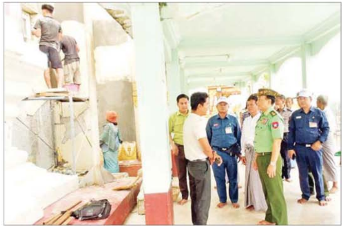
ကာကွယ်ရေးဦးစီးချုပ်ရုံး(ကြည်း)မှ ဒုတိယဗိုလ်ချုပ်ကြီး စိုးတင်နိုင် မန္တလေးမြို့၊ အမရပူရမြို့နယ်ရှိ ရွှေကြက်ကျ ဆုတောင်းပြည့်မြတ်စွာဘုရား ထိခိုက်ပျက်စီးခဲ့သော စေတီတော်၏ အနောက်မြောက် ထောင့်ရှိ ဂန္ဓကုဋ်တိုက်အနီးများ ပြန်လည်ပြုပြင်ဆောင်ရွက်နေမှုအခြေအနေများအား ကြည့်ရှု စစ်ဆေးစဉ်။

အလားတူ ကာကွယ်ရေးဦးစီးချုပ်ရုံး(ကြည်း)မှ ဒုတိယဗိုလ်ချုပ်ကြီး စိုးတင်နိုင်နှင့် တာဝန်ရှိသူများ သည် ငလျင်ဒဏ်ကြောင့် ထိခိုက်ပျက်စီးမှုများဖြစ်ပေါ် ခဲ့သည့် မန္တလေးမြို့၊ အမရပူရမြို့နယ်ရှိ ရွှေကြက်ယောင် ဆုတောင်းပြည့်မြတ်စွာဘုရား၊ ရွှေကြက်ကျဆုတောင်း ပြည့်မြတ်စွာဘုရား၊ နန်းဦးကျောင်းတိုက်နှင့် အောင်မြေသာစံမြို့နယ် ဥပုသ်တော်ရပ်ကွက်ရှိ အာယာရာမမိုးထိကျောင်းတိုက်များသို့ သွားရောက် ၍ ငလျင်ဒဏ်ကြောင့် ထိခိုက်ပျက်စီးခဲ့သော ဘုရား စေတီများနှင့် သာသနိကအဆောက်အအုံများရှိ အပျက်အစီးများအား ဖယ်ရှားရှင်းလင်းဆောင်ရွက် နေမှု၊ ပြန်လည်ပြုပြင်ရေးလုပ်ငန်းများ ဆောင်ရွက် နေမှုများနှင့် ရှေးမှပျက် ပြင်ဆင်ဆောင်ရွက်နေမှု များကို ကြည့်ရှုစစ်ဆေးပြီး လုပ်ငန်းများအမြန်ဆုံး ပြီးစီးဆောင်ရွက်နိုင်ရန် တာဝန်ရှိသူများနှင့် လိုအပ်