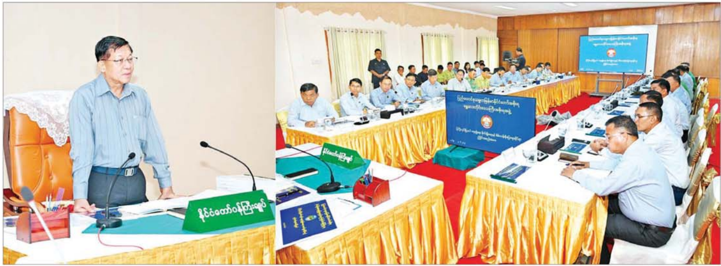
နိုင်ငံတော်စီမံအုပ်ချုပ်ရေးကောင်စီဥက္ကဋ္ဌ နိုင်ငံတော်ဝန်ကြီးချုပ် ဗိုလ်ချုပ်မှူးကြီးမင်းအောင်လှိုင် မန္တလေးတိုင်းဒေသကြီး ပြင်ဦးလွင်ခရိုင် ပြင်ဦးလွင်မြို့နယ်အတွင်း ရေရရှိရေး၊ စိုက်ပျိုးရေးနှင့် စိမ်းလန်းစိုပြည် ရေးဆိုင်ရာလုပ်ငန်းညှိနှိုင်းအစည်းအဝေးတွင် အမှာစကားပြောကြားစဉ်။