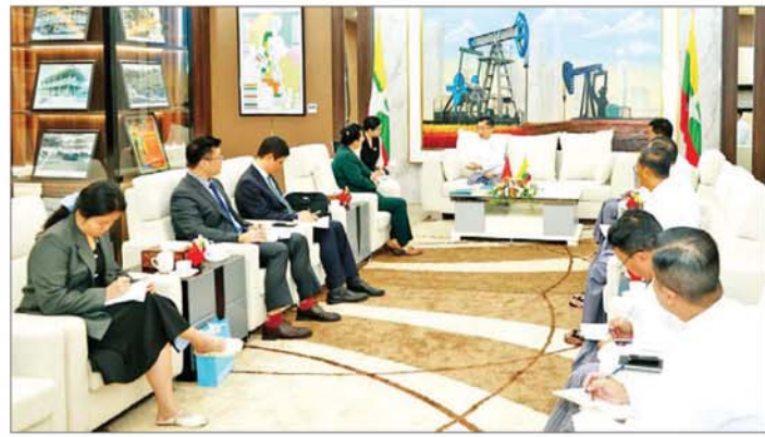
ပိုက်လိုင်းမှ ရေနံစိမ်းများရယူပြီး ပူးပေါင်း အကောင်အထည်ဖော် ပြည်သူ့သမ္မတနိုင်ငံမှ အကောင် ရေနံချက်စက်ရုံသစ် စီမံကိန်း ဆောင်ရွက်ရေးကိစ္စနှင့် တရုတ် အထည်ဖော် ဆောင်ရွက်လျက်ရှိ

ရွှမ်းအင်ကဏ္ဍတွင် ပူးပေါင်း ဆောင်ရွက်မှုများ ယခင်ထက်ပိုမို တိုးမြှင့်ဆောင်ရွက်ရေး၊ မြန်မာ နိုင်ငံ၏ အလားအလာကောင်း သော ကမ်းလှန်လုပ်ကွက်များတွင် ရေနှင့် သဘာဝဓာတ်ငွေ့ ရှာဖွေ၊ တူးဖော် ထုတ်လုပ်ခြင်းတို့အတွက် တရုတ်နိုင်ငံမှ ကုမ္ပဏီများ လာရောက် ရင်းနှီးမြှုပ်နှံရေး၊ ဆောင်ရွက်ဆဲ ကမ်းလှန်လုပ်ကွက် တွင် ဆက်လက်ဆောင်ရွက်မည့် ရှာဖွေ၊ တူးဖော်ရေးလုပ်ငန်းများ အတွက် ပူးပေါင်းဆောင်ရွက်သွား မည့် တရုတ်ကုမ္ပဏီများအား တွန်းအားပေး ကူညီဆောင်ရွက် ရေး၊ အရှေ့တောင်အာရှ ရေနံစိမ်း