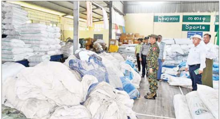
ကာကွယ်ရေးဦးစီးချုပ်ရုံး(ကြည်း)မှ ဒုတိယဗိုလ်ချုပ်ကြီး သက်ဝံ စစ်ကိုင်းမြို့၊ မြို့မအားကစားခန်းမ၌ ငလျင်ဒဏ်ဒဏ်ပျက်စီးမှုများ ကူညီကယ်ဆယ်ရေးပစ္စည်းများရရှိ/ထုတ်ပေးနေမှု ကြည့်ရှုစစ်ဆေးစဉ်။

ယင်းနောက် စစ်ကိုင်းတောင်ရိုး ငလျင်ဒဏ် ကြောင့် ပြိုကျပျက်စီးခဲ့သော ဘုန်းကြီးကျောင်း၊ သီလရှင်ကျောင်းအချို့ ပြန်လည်နေရာချထားနိုင်ရေး