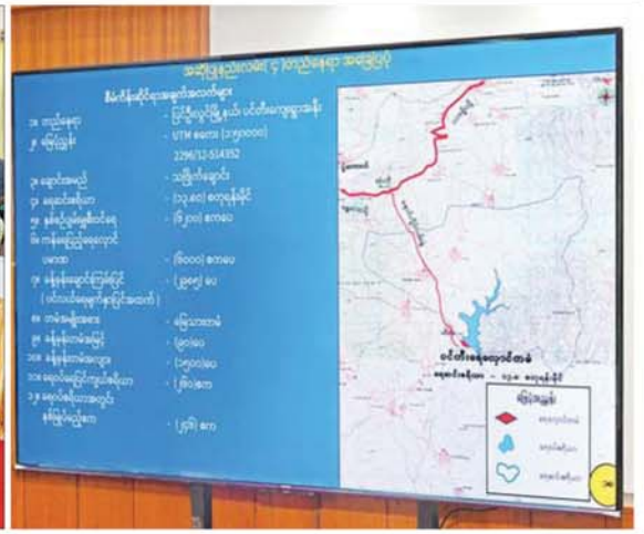
နိုင်ငံတော်စီမံအုပ်ချုပ်ရေးကောင်စီဥက္ကဋ္ဌ နိုင်ငံတော်ဝန်ကြီးချုပ် ဗိုလ်ချုပ်မှူးကြီး မင်းအောင်လှိုင် အား စိုက်ပျိုးရေး၊ မွေးမြူရေးနှင့် ဆည်မြောင်းဝန်ကြီးဌာန ပြည်ထောင်စုဝန်ကြီး ဦးမင်းနောင်က ပြင်ဦးလွင်ခရိုင် ပြင်ဦးလွင်မြို့နယ်အတွင်း သောက်သုံးရေဖူလုံစွာရရှိရေးနှင့် ပတ်သက်၍ အကောင်အထည်ဖော်ဆောင်ရွက်လျက်ရှိမှုအခြေအနေများကို ရှင်းလင်းတင်ပြခဲ့ပါ။