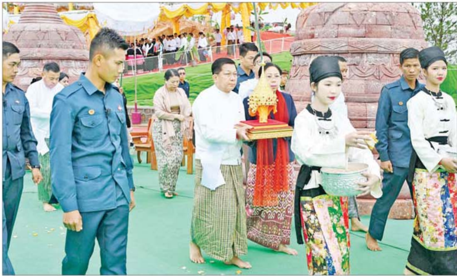
နိုင်ငံတော်စီမံအုပ်ချုပ်ရေးကောင်စီဥက္ကဋ္ဌ နိုင်ငံတော်ဝန်ကြီးချုပ် ဗိုလ်ချုပ်မှူးကြီးမင်းအောင်လှိုင်နှင့်ဇနီး ဒေါ်ကြူကြူလှ၊ အဖွဲ့ဝင်များ ရတနာသရဖူတော်ကြီးနှင့် ဌာပနာတော်များကို လက်ဆင့်ကမ်းပင့်ဆောင်၍ လောကသရဖူစေတီတော်မြတ်ကြီးအား လက်ယာရစ်ပင့်ဆောင်ပူဇော်ကြစဉ်။

ထို့နောက် ဆရာတော်၊ သံဃာ တော်များ ဦးဆောင်၍ “ဓယန္တော ဗောဓိယာ မုလေ” အစချီသည့်