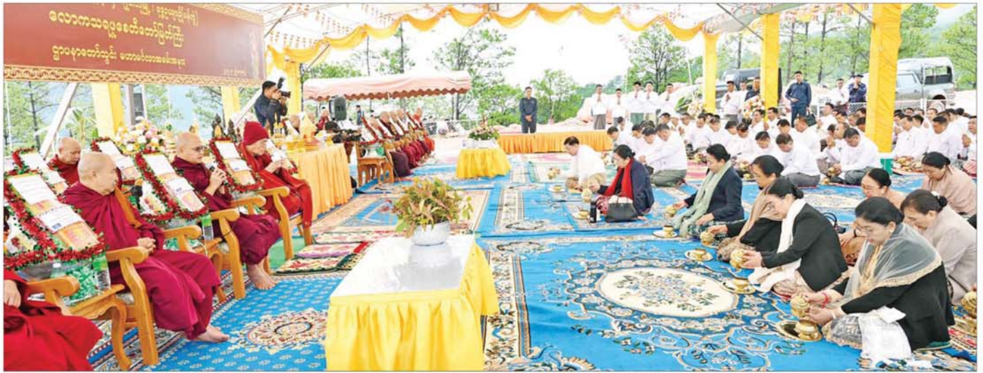
နိုင်ငံတော်စီမံအုပ်ချုပ်ရေးကောင်စီဥက္ကဋ္ဌ နိုင်ငံတော်ဝန်ကြီးချုပ် ဗိုလ်ချုပ်မှူးကြီး မင်းအောင်လှိုင်နှင့် ဇနီးဒေါ်ကြူကြူလှ၊ အခမ်းအနားတက်ရောက်လာကြသူများ ရှမ်းပြည်နယ် ဗုဒ္ဓတက္ကသိုလ် (တောင်ကြီး) ဒုတိယပိမောက္ခချုပ် ဆရာတော် သဒ္ဓမ္မဇောတိကဓဇ ဘဒ္ဒန္တ ဝိစိတ္တာဘိဝံပါလ ဆရာတော်ထံမှ အနုမောဒနာတရားနာယူ၍ လှူဒါန်းမှုအစုစုအတွက် ရေစက်သွန်းချ အမျှပေးကြောင်း။