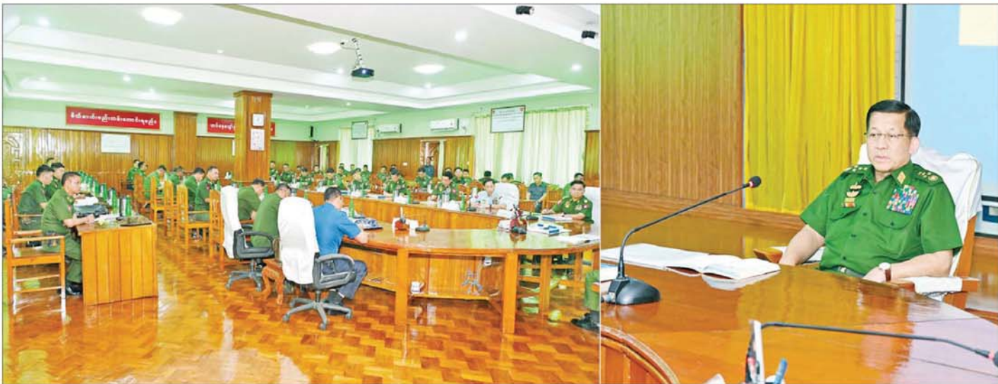
နိုင်ငံတော်စီမံအုပ်ချုပ်ရေးကောင်စီဥက္ကဋ္ဌ တပ်မတော်ကာကွယ်ရေးဦးစီးချုပ် ဗိုလ်ချုပ်မှူးကြီး မင်းအောင်လှိုင် ကြိုဂံဒေသတိုင်းစစ်ဌာနချုပ်၏ စစ်ဦးစီး၊ စစ်ရေး၊ စစ်ထောက်ဆိုင်ရာ ဆောင်ရွက်နေမှုအခြေအနေများကို စစ်ဆေးမှာကြားစဉ်။