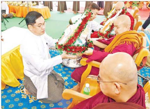
နိုင်ငံတော်စီမံအုပ်ချုပ်ရေးကောင်စီဥက္ကဋ္ဌ နိုင်ငံတော်ဝန်ကြီးချုပ် ဗိုလ်ချုပ်မှူးကြီး မင်းအောင်လှိုင်၏ ဇနီး ဒေါ်ကြူကြူလှ သီလဓမ္မဆေးရုံတော် မင်္ဂလာမော်ကွန်းကမ္မည်းတော်ကို အမွှေးနံ့သာရည်များ ပက်ဖျန်းပေးစဉ်။

ထို့နောက် နိုင်ငံတော်စီမံအုပ်ချုပ်ရေးကောင်စီဥက္ကဋ္ဌ နိုင်ငံတော်ဝန်ကြီးချုပ်နှင့်ဇနီး၊ အခမ်းအနားတက်ရောက်လာကြသူများသည် ရှမ်းပြည်နယ် ဗုဒ္ဓတက္ကသိုလ် (တောင်ကြီး) ဒုတိယပိမောက္ခချုပ် လှူဒါန်းမှုအစုစုအတွက် ရေစက်သွန်းချ အမျှပေးကြောင်း။