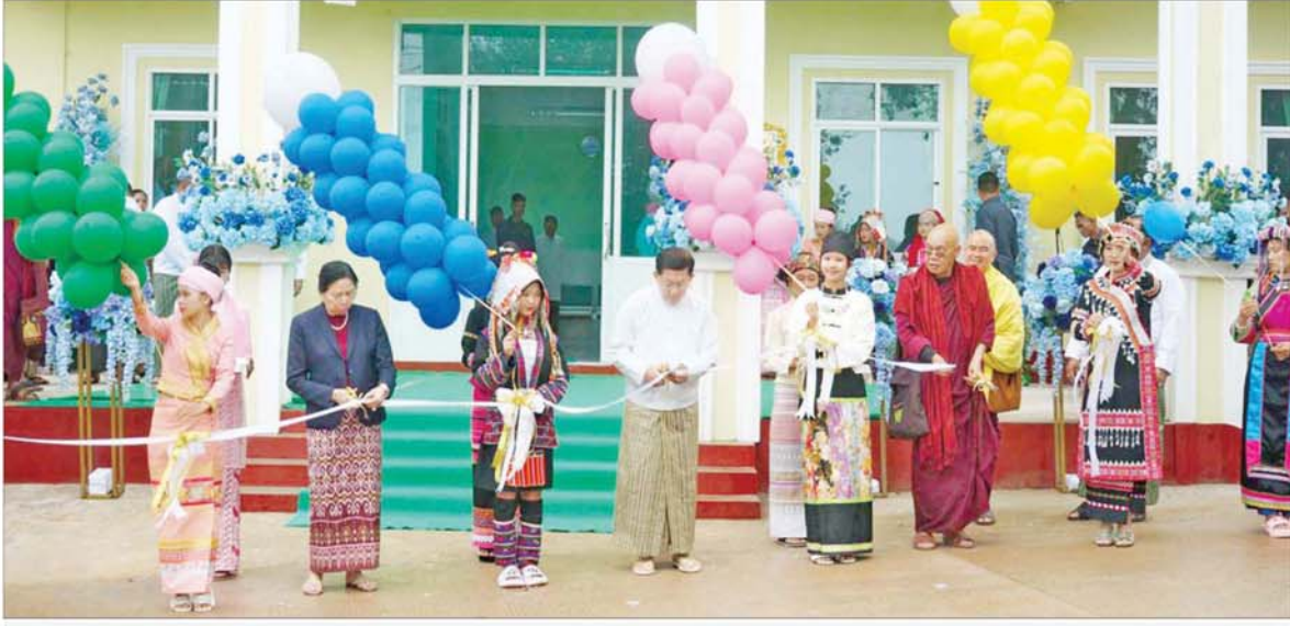
ဝစီပိတ်ဆရာတော်ကြီး၊ နိုင်ငံတော်စီမံအုပ်ချုပ်ရေးကောင်စီဥက္ကဋ္ဌ နိုင်ငံတော်ဝန်ကြီးချုပ် ဗိုလ်ချုပ်မှူးကြီးမင်းအောင်လှိုင်နှင့် ဇနီးဒေါ်ကြူကြူလှတို့က သီလဓမ္မဆေးရုံ တော်ကို မင်္ဂလာဖွဲ့ကြီးဖြတ်၍ ဖွင့်လှစ်ပေးကြစဉ်။

လင်းတင်ပြပြီး ကျိုင်းတုံဒေသခံ အာခေါ်တိုင်းရင်းသားလူမျိုး အကြီး အကဲ ဦးမင်းညိုက ကျေးဇူးတင် စကား ပြန်လည်ပြောကြားသည်။ ယင်းနောက် မင်္ဂလာအချိန် ရောက်သည့်အချိန်တွင် ဝစီပိတ် ဆရာတော်ကြီး၊ နိုင်ငံတော်စီမံ