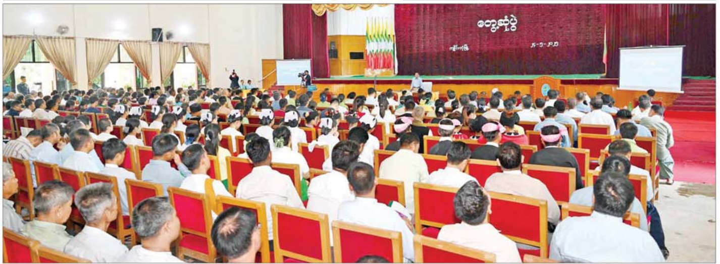
နိုင်ငံတော်စီမံအုပ်ချုပ်ရေးကောင်စီဥက္ကဋ္ဌ နိုင်ငံတော်ဝန်ကြီးချုပ် ဗိုလ်ချုပ်မှူးကြီးမင်းအောင်လှိုင် ရှမ်းပြည်နယ်(အရှေ့ပိုင်း) ကျင်းပတဲ့မြို့ရိုးပြည်နယ်အဆင့်ဌာနဆိုင်ရာ တာဝန်ရှိသူများ မြို့မိ၊ မြို့ဖများနှင့် တွေ့ဆုံအမှာစကားပြောကြားစဉ်။