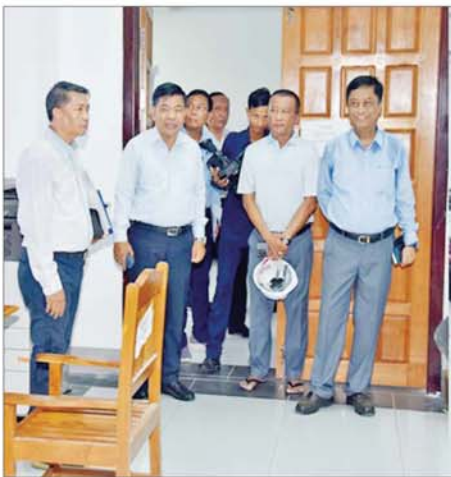
ထို့နောက် နိုင်ငံခြားရေးဝန်ကြီးဌာနသို့သွားရောက်၍ ယာယီရုံး Prefabricated Office များ ဆောက်လုပ်ပြီးစီးမှု၊ ရုံးအဆောက်အအုံ နှစ်လုံးပြင်ဆင်ပြီးစီးမှုများကို ကြည့်ရှုပြီး ထပ်မံရောက်ရှိလာမည့် ယာယီရုံး Prefabricated Office များကို ကြိုတင်နေရာသတ်မှတ်

ထို့နောက် အလုပ်သမားဝန်ကြီးဌာန ဝန်ကြီးရုံးအဆောက်အအုံ ပြန်လည်ပြင်ဆင်ရန်ဆောင်ရွက်နေမှု၊ မြေထိန်းနံရံများဖြင့် ကြံ့ခိုင်ရန် ဆောင်ရွက်မည့်အခြေအနေ၊ ယာယီရုံး Prefabricated Office များ ဆောက်လုပ်ပြီး ရုံးခန်းများဖွင့်လှစ်၍ လုပ်ငန်းဆောင်ရွက်နေမှု အခြေအနေများကို လှည့်လည်ကြည့်ရှုစစ်ဆေးပြီး ထပ်မံဆောက်လုပ်မည့် ယာယီရုံး Prefabricated Office များ ဆောက်လုပ်ရန် ကြိုတင်လျာထား၍ ရောက်ရှိလာပါက အမြန်တပ်ဆင်တည်ဆောက်သွားရန်တို့ကို မှာကြားသည်။