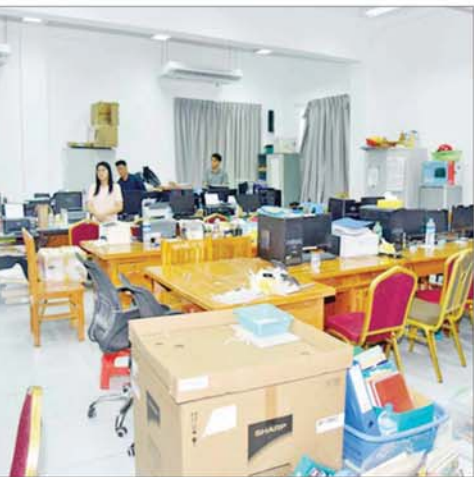
တည်ဆောက်သွားရန်နှင့် ရွှေပြောင်မည့်အစီအမံ အသေးစိတ်ကို ကြိုတင်စီစဉ်ဆောင်ရွက်သွားရန်တို့ကို မှာကြားကာ တာဝန်ရှိသူများ၏ တင်ပြချက်များအပေါ် လိုအပ်သည်များပေါင်းစပ်ညှိနှိုင်း ဆောင်ရွက်ပေးခဲ့ကြောင်း သိရသည်။ သတင်းစဉ်