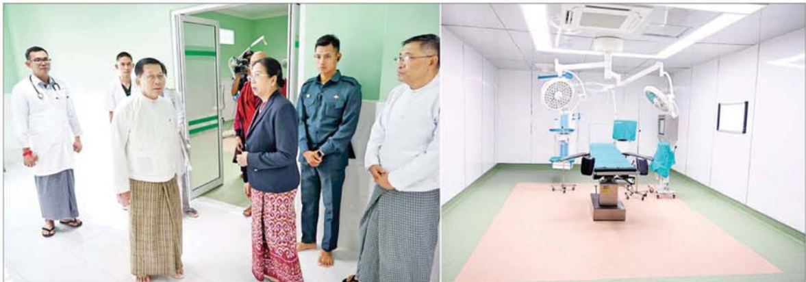
နိုင်ငံတော်စီမံအုပ်ချုပ်ရေးကောင်စီဥက္ကဋ္ဌ နိုင်ငံတော်ဝန်ကြီးချုပ် ဗိုလ်ချုပ်မှူးကြီးမင်းအောင်လှိုင်နှင့်ဇနီး ဒေါ်ကြူကြူလှ သီလဓမ္မဆေးရုံတော်အတွင်း လှည့်လည်ကြည့်ရှုစဉ်။

ယင်းနောက် အခမ်းအနားမှူး က “အောင်ဆုမင်္ဂလာအမျှဝေ စာတမ်း”ကို ဖတ်ကြား၍ အမျှပေး ဝေခြင်းနှင့် နတ်မြဟာများအား ပြန်လည် ပို့ဆောင်ပြီးနောက် လောကသရဖူစေတီတော်ဌာပနာ တော်သွင်းလှူပူဇော်ခြင်း မဟာ မင်္ဂလာအခမ်းအနားကို “ဗုဒ္ဓ သာသနံစိရံတိဂ္ဂတ” သုံးကြိမ်ရွတ်ဆို ဆုတောင်း၍ ရုပ်သိမ်းခဲ့သည်။ ဆက်လက်၍ နိုင်ငံတော်စီမံ အုပ်ချုပ်ရေးကောင်စီဥက္ကဋ္ဌ နိုင်ငံ