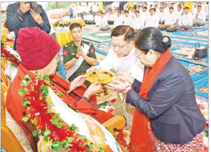
နိုင်ငံတော်စီမံအုပ်ချုပ်ရေးကောင်စီဥက္ကဋ္ဌ နိုင်ငံတော်ဝန်ကြီးချုပ် ဗိုလ်ချုပ်မှူးကြီး မင်းအောင်လှိုင်နှင့် ဇနီး ဒေါ်ကြူကြူလှ သဗ္ဗညုဘုရားရှင်အား ရည်မှန်းထား၍ ရတနာသရဗုဇောတီကြီးနှင့် ဌာပနာတော်များကို သံဃာတော်များထံ သာဟတ္ထိကဒါနမြောက် လက်ရောက်ဆက်ကပ်ပူဇော်စဉ်။

တရားတော်တို့ကို နာယူကြည်ညိုကြသည်။ ယင်းနောက် ဥပါသကာများက ပရိတ်ပန်း၊ ပရိတ်ရေ၊ ပရိတ်ချည်၊ ပရိတ်သံများကို ယူဆောင်၍ စေတီတော် ပရိဝုဏ်တော်၌ ပက်ဖျန်းကြပြန်၍ ချည်နှောင်တားဆီးကာရံကြသည်။ ဆက်လက်၍ နိုင်ငံတော်စီမံအုပ်ချုပ်ရေးကောင်စီ ဥက္ကဋ္ဌ နိုင်ငံတော်ဝန်ကြီးချုပ်နှင့် ဇနီးတို့က သဗ္ဗညုဘုရားရှင်အား ရည်မှန်းထား၍ ရတနာသရဗုဇောတီကြီးနှင့် ဌာပနာတော်များကို သံဃာတော်များထံ သာဟတ္ထိကဒါနမြောက်လက်ရောက် ဆက်ကပ်ပူဇော်ပြီး ဆရာတော်ကြီးများအား လှူဖွယ်ပစ္စည်းများ ဆက်ကပ်လှူဒါန်းကြသည်။ ဆက်လက်ပြီး ကောင်စီတွဲဖက်အတွင်းရေးမှူး၊ ကောင်စီဝင်များ၊ ပြည်ထောင်စုဝန်ကြီးများနှင့် အခမ်းအနားတက်ရောက်လာကြသူများက လှူဖွယ်ပစ္စည်းများအား သံဃာတော်အရှင်သူမြတ်များထံ ဆက်ကပ်လှူဒါန်းကြသည်။