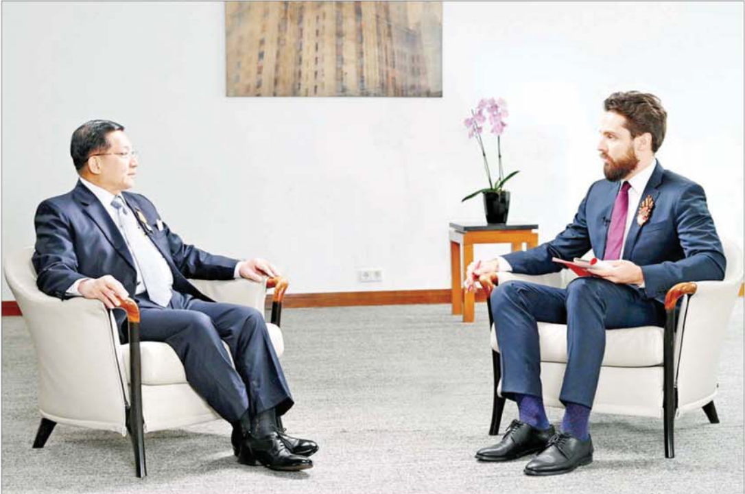
နိုင်ငံတော်စီမံအုပ်ချုပ်ရေးကောင်စီဥက္ကဋ္ဌ နိုင်ငံတော်ဝန်ကြီးချုပ် ဗိုလ်ချုပ်မှူးကြီးမင်းအောင်လှိုင် မေ ၈ ရက်က ရုရှားနိုင်ငံ RT သတင်းဌာန၏ မေးမြန်းမှုများကို ဖြေကြားစဉ်။

မေး။ လေးစားအပ်ပါသော အဆွေတော် နိုင်ငံတော်ဝန်ကြီးချုပ် ခင်ဗျာ။ ကျွန်တော့်အနေနဲ့ အဆွေတော်နဲ့ အခုလိုမျိုး အင်တာဗျူးခွင့်ရတဲ့အတွက် ဂုဏ်ယူကြောင်း ဦးစွာပထမ ပြောကြားလိုပါတယ်။ အခုလိုမျိုး ကျွန်တော်တို့ရုရှားနိုင်ငံရဲ့ နှစ်(၈၀)ပြည့် မဟာမျိုးချစ်အောင်ပွဲအခမ်းအနားကို တက်ရောက်လာတဲ့အတွက်လည်း ကျေးဇူးတင်ကြောင်း ပြောကြားလိုပါတယ်။ ဒီအောင်ပွဲဟာ ကျွန်တော်တို့ရုရှားနိုင်ငံအတွက်လည်း များစွာတန်ဖိုးရှိသလို ဒီအောင်ပွဲနဲ့ပတ်သက်ပြီးတော့ ဖက်ဆစ်ဝါဒကိုတွန်းလှန်နိုင်ခဲ့တဲ့ မြန်မာနိုင်ငံအတွက်လည်း များစွာတန်ဖိုးရှိတယ်လို့ ကျွန်တော်သိရှိရပါတယ်။ တစ်ဆက်တည်းမှာပဲ မြန်မာနိုင်ငံမှာ လူ့ဝန်ထမ်းလျှင်ကြောင့် မြန်မာနိုင်ငံထိခိုက်ပျက်စီးဆုံးရှုံးသွားတယ်ဆိုတာလည်း သိရှိရပါတယ်။ ဒါနဲ့ပတ်သက်ပြီးတော့လည်း ဝမ်းနည်းကြောင်း ပြောကြားလိုပါတယ်။ ကျွန်တော်ပထမဆုံး မေးချင်တဲ့မေးခွန်းကတော့ ဒီလူငယ်နဲ့ ပတ်သက်ပြီး ဝန်ကြီးချုပ်ကြီးအနေနဲ့အကူအညီပေးမှု၊ အားထုတ်မှုတွေနဲ့ ပတ်သက်ပြီးတော့ ဘယ်လိုမျိုး မှတ်ချက်တွေ ပေးချင်ပါသလဲ။ ကယ်ဆယ်ရေး လုပ်ငန်းတွေကရော ဘယ်လောက်ထိ အထောက်အကူပြုပါသလဲ။ အများကြီးလျှင်မြန်မှုတွေရှိပါသလား။ အစစအရာရာရော အဆင်ပြေပါသလား။ အဲဒါလေး သိချင်ပါတယ်ခင်ဗျာ။