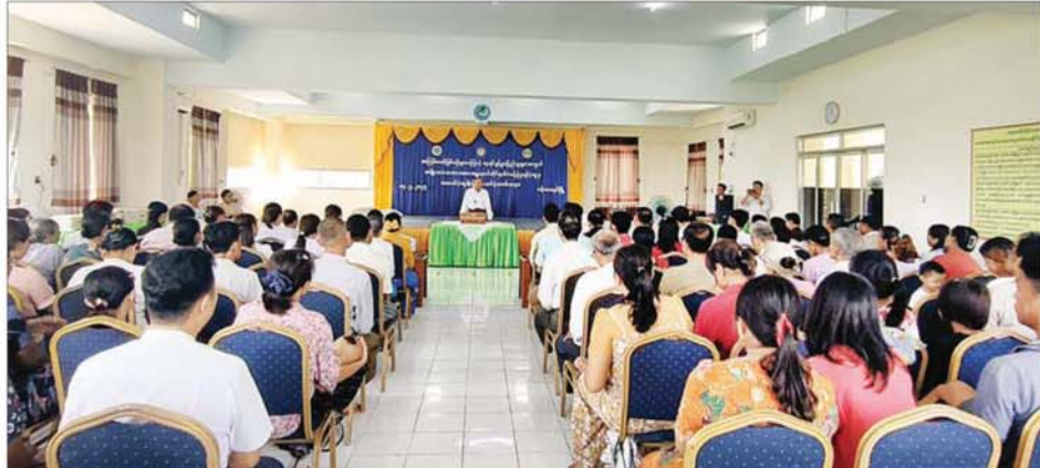
နိုင်ငံတော်စီမံအုပ်ချုပ်ရေးကောင်စီအဖွဲ့ဝင် မန်းငြိမ်းမောင် ပန်းတနော်မြို့နယ်အတွင်း ဒေသအသီးသီးမှ အကြမ်းဖက်ဖြစ်စဉ်များကြောင့် ယာယီနေရပ်စွန့်ခွာပြည်သူများအတွက် အမျိုးသားသဘာဝဘေးအန္တရာယ်ဆိုင်ရာစီမံခန့်ခွဲမှုအဖွဲ့မှ ထောက်ပံ့ငွေ ပေးအပ်ပို့အခမ်းအနားတွင် အမှာစကား ပြောကြားစဉ်။

နေပြည်တော် မေ ၁၄ နိုင်ငံတော်စီမံအုပ်ချုပ်ရေးကောင်စီအဖွဲ့ဝင် မန်းငြိမ်းမောင်၊ ရောဝတီ တိုင်းဒေသကြီးအစိုးရအဖွဲ့ဝင် ဝန်ကြီးများသည် ယနေ့ မွန်းလွဲ ၁၂ နာရီ ခွဲတွင် ပန်းတနော်မြို့နယ် လူထုအခြေပြုဗဟိုဌာန (Community Centre) ရွှေနော်သီရိခန်းမ၌ ကျင်းပပြုလုပ်သည့် ပန်းတနော်မြို့နယ် အတွင်း ဒေသအသီးသီးမှ အကြမ်းဖက်ဖြစ်စဉ်များကြောင့် ယာယီနေရပ် စွန့်ခွာပြည်သူများအတွက် အမျိုးသားသဘာဝဘေးအန္တရာယ်ဆိုင်ရာ စီမံခန့်ခွဲမှုအဖွဲ့မှ ထောက်ပံ့ငွေ ပေးအပ်ပို့အခမ်းအနားသို့ တက်ရောက် သည်။ ဦးစွာ နိုင်ငံတော်စီမံအုပ်ချုပ်ရေးကောင်စီအဖွဲ့ဝင် မန်းငြိမ်းမောင် က အဖွင့်အမှာစကားပြောကြားပြီး ပန်းတနော်မြို့နယ်အတွင်း ဒေသ အသီးသီးမှ ယာယီနေရပ်စွန့်ခွာနေရသည့် ပြည်သူများအတွက် ထောက်ပံ့ ငွေများကို နိုင်ငံတော်စီမံအုပ်ချုပ်ရေးကောင်စီအဖွဲ့ဝင် မန်းငြိမ်းမောင်၊ ရောဝတီတိုင်းဒေသကြီးအစိုးရအဖွဲ့ လုံခြုံရေးနှင့် နယ်စပ်ရေးရာဝန်ကြီး ဗိုလ်မှူးကြီး မိုးမင်းနိုင်၊ တိုင်းရင်းသားရေးရာဝန်ကြီး ဦးစောလင်းခယ်နှင့် မအူပင်ခရိုင်စီမံအုပ်ချုပ်ရေးအဖွဲ့ဥက္ကဋ္ဌ ဦးမြင့်နိုင်တို့က တစ်ဦးလျှင် ငွေကျပ် ၄၀၀၀ နှင့် ဆန်တစ်ပြည်နွန်းဖြင့် ယာယီနေရပ်စွန့်ခွာသူ စုစုပေါင်း ၂၇၃ ဦး အတွက် ပေးအပ်ခဲ့ကြောင်း သိရသည်။ သတင်းစဉ်