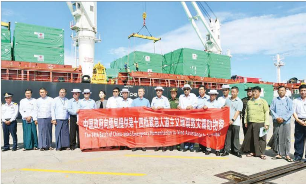
တရုတ်ပြည်သူ့သမ္မတနိုင်ငံမှ (၁၄)ကြိမ်မြောက် လှူဒါန်းသည့် Operation Room ၉၅ လုံးနှင့် Modular(prefabricated) house ၁၈၀၄ လုံးတို့ကို တာဝန် ရှိသူများ လွှဲပြောင်းလက်ခံစဉ်။