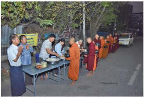
လက်လောင်းလှူကြမည်ဖြစ်၍ အလှူခံနိုင်ပါရန် ပင့်ဖိတ်ထားလေးပြင်လေးရပ်မှ ဆရာတော်၊ သံဃာတော်များအား ကြွရောက် (မန္တလေးနေ့စဉ်-၃)

မန္တလေး မတ် ၁၆ မန္တလေးမြို့တော်စည်ပင်သာယာရေးကော်မတီ၊ မဟာမြိုင်စည်ပင်ဝန်ထမ်းအိမ်ရာပွဲလမ်း၊ မိလမ်းနှင့် လမ်း၇၀ကြားတွင် နေထိုင်သည့် ဝန်ထမ်းမိသားစုများ စုပေါင်း၍ အပတ်စဉ်တန်ခိုးနေ့တိုင်း လေးပြင်လေးရပ်မှ ကြွရောက်အလှူခံတော်မူကြသော ဆရာတော်၊သံဃာတော်များအား ဘုံဆွမ်းလောင်းလှူ ကုသိုလ်ပြုကြသည်။ ဘုံဆွမ်းလောင်းလှူရာတွင် ဝန်ထမ်းမိသားစုဝင်များက လေးပြင်လေးရပ်မှ ကြွရောက်တော်မူကြသော ဆရာတော်၊ သံဃာတော်၊ ပဲတီက (၁၂၂)ကြိမ်မြောက်အဖြစ်ဆွမ်း၊ ငါးကြင်းခြစ်ချက်၊ ပဲတီချည်သုပ်တို့ကို ၃၆လမ်းနှင့် မြေလမ်းထောင့်တွင် ပြင်ဆင်၍ ကြွရောက်လာကြသော ဆရာတော်၊ သံဃာတော် ၂၅၀ ကျော်တို့အား နံနက် ၅နာရီခွဲမှစတင်၍ လောင်းလှူကြည့်ည့်ခဲ့ကြပြီး အပတ်စဉ်တန်ခိုးနေ့တိုင်း ဆက်လက်လောင်းလှူကြမည်ဖြစ်၍ လေးပြင်လေးရပ်မှ ဆရာတော်၊ သံဃာတော်များအား ကြွရောက်