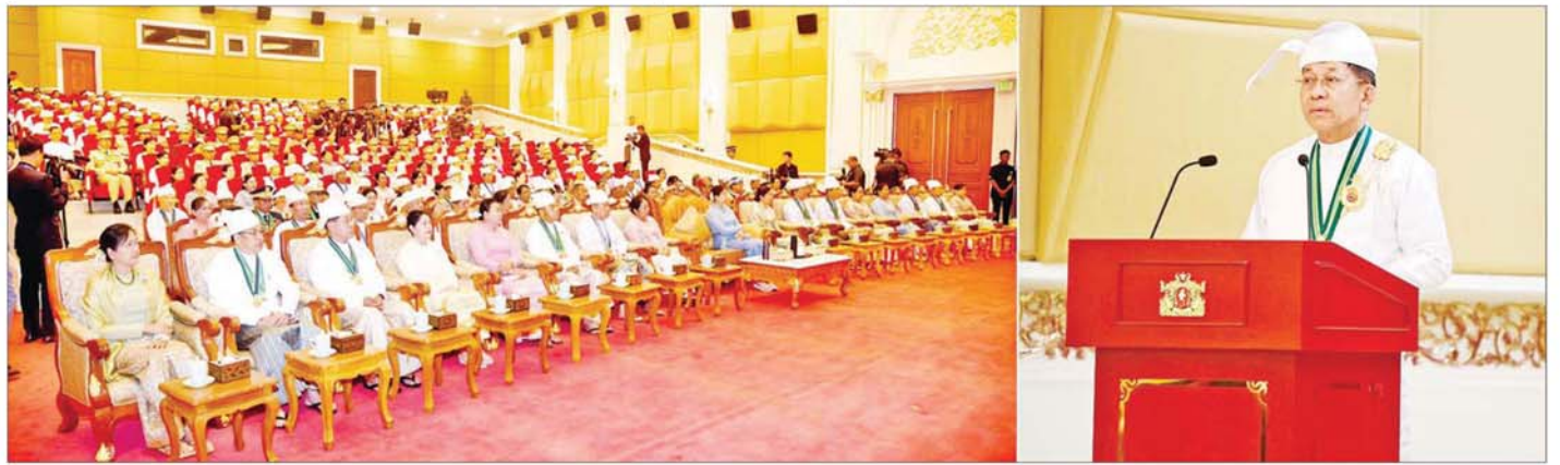
နိုင်ငံတော်စီမံအုပ်ချုပ်ရေးကောင်စီဥက္ကဋ္ဌ နိုင်ငံတော်ဝန်ကြီးချုပ် ဗိုလ်ချုပ်မှူးကြီး သတိုးမဟာသရေစည်သူ သတိုးသီရိသုဓမ္မ မင်းအောင်လှိုင် ၂၀၂၅ ခုနှစ်၊ ဂုဏ်ထူးဆောင်ဘွဲ့များ ချီးမြှင့်အပ်နှင်းခြင်းအခမ်းအနားတွင် ဂုဏ်ပြုအမှာစကားပြောကြားစဉ်။