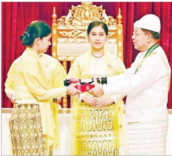
နိုင်ငံတော်စီမံအုပ်ချုပ်ရေးကောင်စီဥက္ကဋ္ဌ နိုင်ငံတော်ဝန်ကြီးချုပ် ဗိုလ်ချုပ်မှူးကြီး သတိုးမဟာသရေစည်သူ သတိုးသီရိသုဓမ္မ မင်းအောင်လှိုင် သူရဘွဲ့ ရရှိသူ ကာကွယ်ရေးဝန်ကြီးဌာနမှ ဗိုလ်မှူးကြီး သက်ပိုင်မြင့်အတွက် ဂုဏ်ထူးဆောင်ဘွဲ့ ချီးမြှင့်ရာ ဇနီးဒေါ်နှင်းဦးလှိုင်က လက်ခံစဉ်။