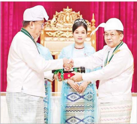
နိုင်ငံတော်စီမံအုပ်ချုပ်ရေးကောင်စီဥက္ကဋ္ဌ နိုင်ငံတော်ဝန်ကြီးချုပ် ဗိုလ်ချုပ်မှူးကြီး သတိုးမဟာသရေစည်သူ သတိုးသီရိသုဓမ္မ မင်းအောင်လှိုင် စည်သူဘွဲ့ ရရှိသူ ပြည်ထောင်စုအဆင့် ငြိမ်းချမ်းရေးဆွေးနွေးရေးအဖွဲ့ အဖွဲ့ခေါင်းဆောင်(အငြိမ်းစား) ဦးအောင်သောင်းအတွက် ဂုဏ်ထူးဆောင်ဘွဲ့ ချီးမြှင့်ရာ သား ဗိုလ်ချုပ်ကြီးမိုးအောင်က လက်ခံစဉ်။