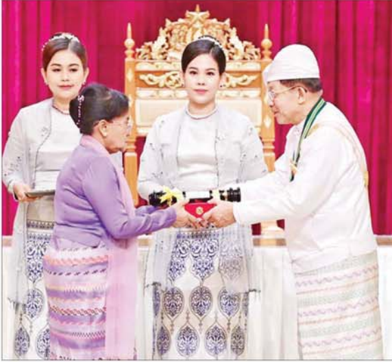
နိုင်ငံတော်စီမံအုပ်ချုပ်ရေးကောင်စီဥက္ကဋ္ဌ နိုင်ငံတော်ဝန်ကြီးချုပ် ဗိုလ်ချုပ်မှူးကြီး သတိုးမဟာသရေစည်သူ သတိုးသီရိသုဓမ္မ မင်းအောင်လှိုင် ဝဏ္ဏကျော်ထင်ဘွဲ့ ရရှိသူ နိုင်ငံတော် ဖွဲ့စည်းပုံအခြေခံဥပဒေဆိုင်ရာခုံရုံးအဖွဲ့ဝင် (အငြိမ်းစား) ဦးတင်မြင့်အတွက် ဂုဏ်ထူးဆောင်ဘွဲ့ ချီးမြှင့်ရာ စနိုး ဒေါ်သန်းနုက လက်ခံစဉ်။

ထို့နောက် နိုင်ငံတော်စီမံအုပ်ချုပ် ရေးကောင်စီဥက္ကဋ္ဌ နိုင်ငံတော် ဝန်ကြီးချုပ်သည် ဂုဏ်ထူးဆောင် ဘွဲ့ ရရှိကြသူများနှင့်အတူ မှတ်တမ်း တင် စုပေါင်းဓာတ်ပုံရိုက်သည်။ အခမ်းအနားအပြီးတွင် နိုင်ငံ တော် စီမံအုပ်ချုပ်ရေးကောင်စီ ဥက္ကဋ္ဌ နိုင်ငံတော်ဝန်ကြီးချုပ်သည် အခမ်းအနားသို့ တက်ရောက်လာ ကြသူများ၊ ဂုဏ်ထူးဆောင်ဘွဲ့ ရရှိ ကြသူများနှင့် ၎င်းတို့၏ မိသားစု ဝင်များကို ရင်းရင်းနှီးနှီး နှုတ်ခေါက် ခဲ့ကြောင်း သိရသည်။ သတင်းစဉ်