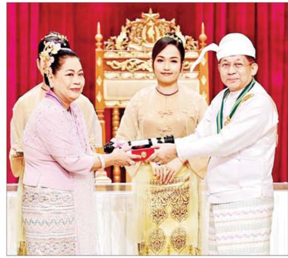
နိုင်ငံတော်စီမံအုပ်ချုပ်ရေးကောင်စီဥက္ကဋ္ဌ နိုင်ငံတော်ဝန်ကြီးချုပ် ဗိုလ်ချုပ်မှူးကြီး သတိုးမဟာသရေစည်သူ သတိုးသီရိသုဓမ္မ မင်းအောင်လှိုင် သိပ္ပံကျော်စွာဘွဲ့ ရရှိသူ ကျန်းမာရေးဝန်ကြီးဌာန မြန်မာနိုင်ငံ သူနာပြုနှင့် သားဖွားကောင်စီဥက္ကဋ္ဌ ဒေါ်နွဲ့နွဲ့ခင် အား ဂုဏ်ထူးဆောင်ဘွဲ့ ချီးမြှင့်အပ်နှင်းစဉ်။