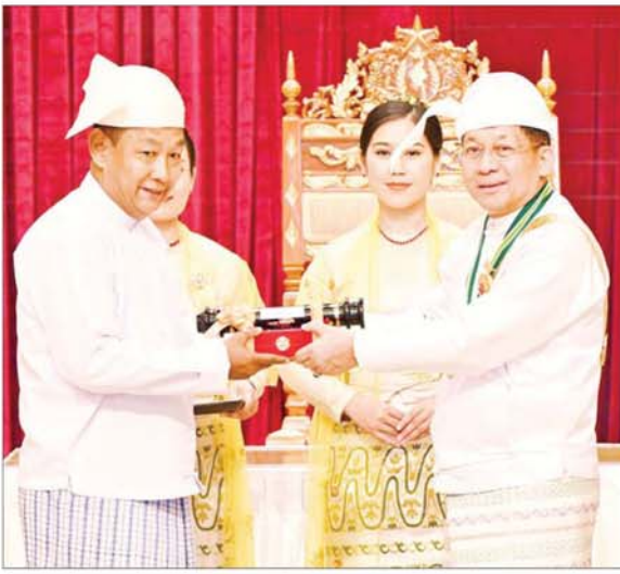
နိုင်ငံတော်စီမံအုပ်ချုပ်ရေးကောင်စီဥက္ကဋ္ဌ နိုင်ငံတော်ဝန်ကြီးချုပ် ဗိုလ်ချုပ်မှူးကြီး သတိုးမဟာသရေစည်သူ သတိုးသီရိသုဓမ္မ မင်းအောင်လှိုင် အလင်္ကာကျော်စွာဘွဲ့ ရရှိသူ အဆိုပညာရှင် ဗိုလ်မှူး ခင်မောင်လှ (အငြိမ်းစား) (ရဲဘော် ခင်မောင်လှ) အတွက် ဂုဏ်ထူးဆောင်ဘွဲ့ ချီးမြှင့်ရာ သား ဦးနိုင်နိုင်ထွန်းက လက်ခံစဉ်။