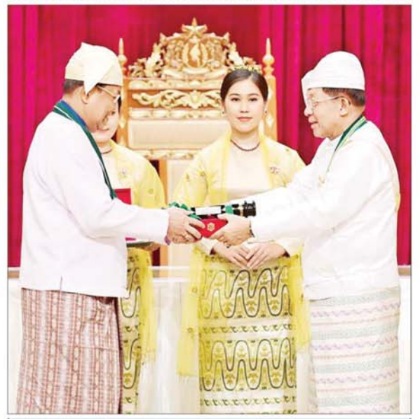
နိုင်ငံတော်စီမံအုပ်ချုပ်ရေးကောင်စီဥက္ကဋ္ဌ နိုင်ငံတော်ဝန်ကြီးချုပ် ဗိုလ်ချုပ်မှူးကြီး သတိုးမဟာသရေစည်သူ သတိုးသီရိသုဓမ္မ မင်းအောင်လှိုင် စည်သူဘွဲ့ ရရှိသူ ဒုတိယဝန်ကြီးချုပ်နှင့် နိုင်ငံခြားရေးဝန်ကြီးဌာန ပြည်ထောင်စုဝန်ကြီး ဦးသန်းဆွေအား ဂုဏ်ထူးဆောင်ဘွဲ့ ချီးမြှင့်အပ်နှင်းစဉ်။