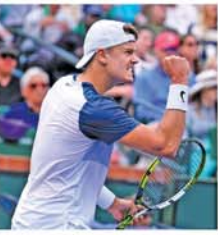
မိုင်ယာမီ မတ် ၁၆

အမေရိကန်နိုင်ငံတွင် ကျင်းပပြုလုပ်လျက်ရှိသော အမျိုးသားတန်းနှစ်ပြိုင်ပွဲဖြစ်သည့် 2025 BNP Paribas Open တန်းနှစ်ပြိုင်ပွဲ ဗိုလ်လုပွဲအဆင့်သို့ ဒီနီးမတ် တင်နစ်ကစားသမား Holger Rune တက်ရောက်နိုင်ခဲ့သည်။ (အပေါ့ပုံ)