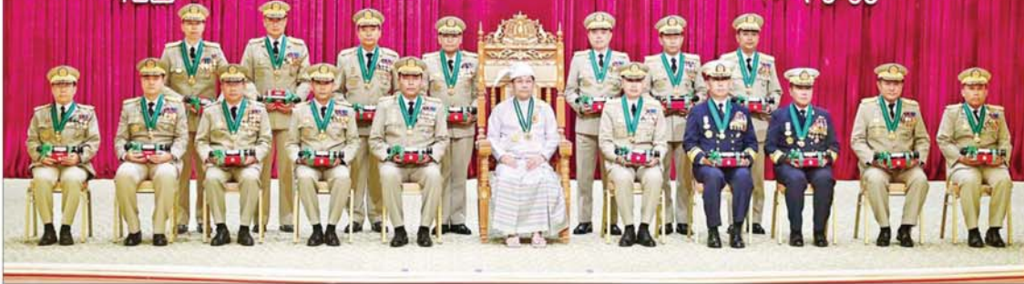
နိုင်ငံတော်စီမံအုပ်ချုပ်ရေးကောင်စီဥက္ကဋ္ဌ နိုင်ငံတော်ဝန်ကြီးချုပ် ဗိုလ်ချုပ်မှူးကြီး သတိုးမဟာသရေစည်သူ သတိုးသီရိသုဓမ္မ မင်းအောင်လှိုင် ဝေယျကျော်ထင်ဘွဲ့ ရရှိကြသူများနှင့်အတူ စုပေါင်းမှတ်တမ်းတင်ဓာတ်ပုံရိုက်စဉ်။

မိမိတို့၏ ဘဝတစ်သက်တာ အတွင်း တိုင်းပြည်အတွက် ကြိုးပမ်း ဆောင်ရွက်ခဲ့မှုများကို ယခုကဲ့သို့ မှတ်တမ်းတင်ဂုဏ်ပြု ချီးမြှင့်ခြင်း ခံရသကဲ့သို့ ဆက်လက်ပြီး နိုင်ငံတော်ကြီး ရေရှည်တည်တံ့ ခိုင်မြဲရေး၊ အေးချမ်းသာယာရေး၊ ခေတ်မီ ဖွံ့ဖြိုးတိုးတက်ရေးအတွက် မိမိတို့၏ သားစဉ်မြေးဆက်များကိုပါ ယခုကဲ့သို့ ကြိုးပမ်းဆောင်ရွက်စေ ရန် စံနမူနာကောင်းများပြုကြပါဟု တိုက်တွန်းမှာကြား။