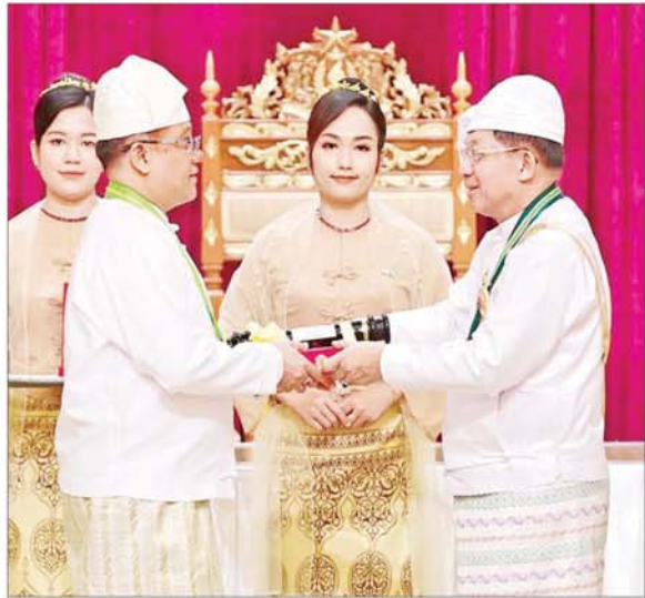
နိုင်ငံတော်စီမံအုပ်ချုပ်ရေးကောင်စီဥက္ကဋ္ဌ နိုင်ငံတော်ဝန်ကြီးချုပ် ဗိုလ်ချုပ်မှူးကြီး သတိုးမဟာသရေစည်သူ သတိုးသိရီသုဓမ္မ မင်းအောင်လှိုင် ဝဏ္ဏကျော်ထင်ဘွဲ့၊ ရရှိသူ ပြည်ထဲရေးဝန်ကြီးဌာန အမြဲတမ်းအတွင်းဝန် ဦးခိုင်ထွန်းဦးအား ဂုဏ်ထူးဆောင်ဘွဲ့ ချီးမြှင့်အပ်နှင်းစဉ်။

● အားလုံး သိရှိပြီးဖြစ်သည့်အတိုင်း ပါတီစုံဒီမိုကရေစီ အထွေထွေရွေးကောက်ပွဲကြီး ကျင်းပနိုင်ရန်အတွက် လိုအပ်သည့်ပြင်ဆင်မှုများကိုလည်း စီစဉ်ဆောင်ရွက်နေပြီဖြစ်ကြောင်း၊ လွတ်လပ်ပြီး တရားမျှတသည့် အထွေထွေရွေးကောက်ပွဲကို မဖြစ်မနေ ကျင်းပပြုလုပ်ပေးသွားမည်ဖြစ်သည့်အတွက် ရွေးကောက်ပွဲအောင်မြင်စွာကျင်းပနိုင်ရေး အစိုးရနှင့် ပြည်သူ တက်ညီလက်ညီ ဝိုင်းဝန်းပူးပေါင်းဆောင်ရွက်