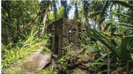
ဒေသခံသုတေသီများ ရိုမေးနီးယားနိုင်ငံ၊ နေယမ့်စရိုင်ရှိ သစ်တောများအတွင်း မကြာသေးမီက တွေ့ရှိခဲ့သည့် နှစ်ပေါင်း ၅၀၀၀ သက်တမ်းရှိ ရှေးဟောင်းခဲတပ်တစ်ခုကို တွေ့ရစဉ်။ Mon

ရောမ မတ် ၁၆ ဖော်ပြချက်အရ ၈၈ နှစ်အရွယ် ပုပ်ရဟန်းမင်းကြီး ပရန်စစ် သည် အဆုတ်အဆေးမိရောဂါ အတွက် ဆေးရုံတက်ကုသခဲ့ပြီး နောက် ၅ ပတ်အကြာတွင် ၎င်း၏ ပြန်လည်သက်သာမှုလက္ခဏာများ အပြုသဘောဆောင်နေခဲ့ခြင်း ဖြင့် ပုပ်ရဟန်းမင်းကြီးဆိုင်ရာ တာဝန်များကို စတင်ထမ်းဆောင် နေပြီဖြစ်ကြောင်း ဘီဘီစီသတင်း ဌာနက ဖော်ပြသည်။