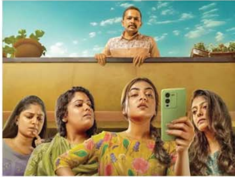
အိန္ဒိယတောင်ပိုင်းရုပ်ရှင် ဆန်းသော အိမ်နီးချင်းအကြောင်း Sook Shma Darshini မှာ ထူး ဖြစ်ပြီး သည်းထိတ်ရင်ဖိုရိုက်ကူး

တင်ဆက်ထားသည်ဟု ဘောလီ ဝုဒ်ဝက်ဘ်ဆိုက်တွင် ဖော်ပြ သည်။ အဆိုပါ ဇာတ်ကားတွင် ဇာတ်အိမ်တစ်ခုချင်းစီကို တစ် ထပ်ချင်းစီ ဖြေပြသွားပြီး သည်း ထိတ်ရင်ဖိုရိုက်ကူးတင်ဆက်ထား သည်။ အသေးစိတ်စမ်းတတ်သည့် ဉာဏ်ရှိသည့် အမျိုးသမီးတစ်ဦး ၏ မိသားစုနေထိုင်ရာ ရုပ်ကွက် သို့ ပြောင်းရွှေ့လာသော လူတစ် ဦးမှာ ရုပ်ကွက်နှင့် မစိမ်းဘဲ ငယ်စဉ်က နေထိုင်ဖူးသဖြစိပြီး မိခင်အယ်လ်ဒိုင်းမား အမေ အိုကြီးနှင့်အတူ အိမ်နီးချင်းဖြစ် လာခဲ့သည်။ အများအပြင်တွင် လူရိုးလူ အေးလေးအဖြစ် မြင်တွေ့ရသော သူမှာ ထူးဆန်းသော အိမ်နီးချင်း ဖြစ်နေသည်ကို အရာရာစူးစမ်း တတ်သည့် အမျိုးသမီးက တစ်စ ချင်းဆွဲထုတ်ဖော်ပြရာမှ သည်း ထိတ်ရင်ဖိုဇာတ်ကားအဖြစ် မြင် တွေ့ကြရသည်။ (SKY)