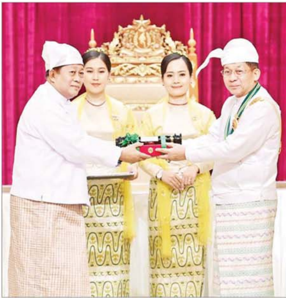
နိုင်ငံတော်စီမံအုပ်ချုပ်ရေးကောင်စီဥက္ကဋ္ဌ နိုင်ငံတော်ဝန်ကြီးချုပ် ဗိုလ်ချုပ်မှူးကြီး သတိုးမဟာသရေစည်သူ သတိုးသီရိသုဓမ္မ မင်းအောင်လှိုင် စည်သူဘွဲ့ ရရှိသူ ကျန်းမာရေးဝန်ကြီးဌာန ပြည်ထောင်စုဝန်ကြီး(အငြိမ်းစား) ဗိုလ်မှူးကြီး ကြည်မောင် အတွက် ဂုဏ်ထူးဆောင်ဘွဲ့ချီးမြှင့်ရာ သား ဦးကြည်မော်က လက်ခံစဉ်။

အေးချမ်းသာယာပြီး ခေတ်မီဖွံ့ဖြိုးတိုးတက်သည့် နိုင်ငံတော်ကို တည်ဆောက်ရာတွင် စွမ်းစွမ်းတစ်ဆောင်ရွက်ကြသည့် ပုဂ္ဂိုလ်များ၊ အမျိုးသားရေးမူဝါဒဖြစ်သည့် ဒို့တာဝန်အရေးသုံးပါးကို ကာကွယ်စောင့်ရှောက်ရာတွင် သက်စွန့်ကြိုးပမ်း ဆောင်ရွက်ကြသည့် ပုဂ္ဂိုလ်များ၊ ရပ်ရွာအေးချမ်းသာယာရေးနှင့် တရားဥပဒေစိုးမိုးရေး၊ ခေတ်မီဖွံ့ဖြိုးတိုးတက်သည့် နိုင်ငံတော်ဖြစ်ပေါ်လာစေရေးအတွက် နိုင်ငံရေး၊ စီးပွားရေး၊ လူမှုရေး စာမျက်နှာ ၄ သို့ ၀