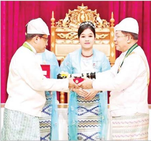
နိုင်ငံတော်စီမံအုပ်ချုပ်ရေးကောင်စီဥက္ကဋ္ဌ နိုင်ငံတော်ဝန်ကြီးချုပ် ဗိုလ်ချုပ်မှူးကြီး သတိုးမဟာသရေစည်သူ သတိုးသိရီသုဓမ္မ မင်းအောင်လှိုင် ဝဏ္ဏကျော်ထင်ဘွဲ့၊ ရရှိသူ နိုင်ငံတော်စွဲစည်းပုံအခြေခံဥပဒေဆိုင်ရာနံရံ အမြဲတမ်းအတွင်းဝန် ဦးလှဌေးအား ဂုဏ်ထူးဆောင်ဘွဲ့ ချီးမြှင့်အပ်နှင်းစဉ်။