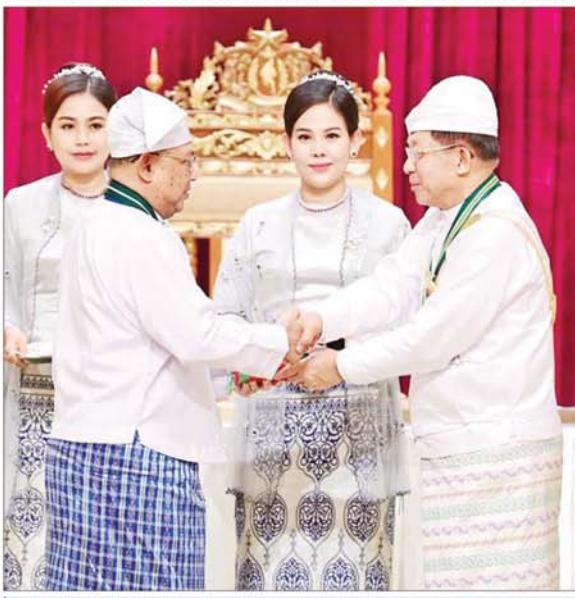
နိုင်ငံတော်စီမံအုပ်ချုပ်ရေးကောင်စီဥက္ကဋ္ဌ နိုင်ငံတော်ဝန်ကြီးချုပ် ဗိုလ်ချုပ်မှူးကြီး သတိုးမဟာသရေစည်သူ သတိုးသီရိသုဓမ္မ မင်းအောင်လှိုင် စည်သူဘွဲ့ ရရှိသူ နိုင်ငံတော်စီမံအုပ်ချုပ်ရေးကောင်စီအဖွဲ့ဝင် ဦးဝဏ္ဏအောင်လွင်လွင် ဂုဏ်ထူးဆောင်ဘွဲ့ ချီးမြှင့်အပ်နှင်းစဉ်။