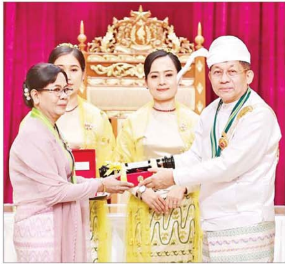
နိုင်ငံတော်စီမံအုပ်ချုပ်ရေးကောင်စီဥက္ကဋ္ဌ နိုင်ငံတော်ဝန်ကြီးချုပ် ဗိုလ်ချုပ်မှူးကြီး သတိုးမဟာသရေစည်သူ သတိုးသိရီသုဓမ္မ မင်းအောင်လှိုင် ဝဏ္ဏကျော်ထင်ဘွဲ့၊ ရရှိသူ စစ်ကိုင်းတိုင်းဒေသကြီး ဥပဒေချုပ်ရုံး တိုင်းဒေသကြီးဥပဒေချုပ် ဒေါ်လှလှဝင်းအား ဂုဏ်ထူးဆောင်ဘွဲ့ ချီးမြှင့်အပ်နှင်းစဉ်။