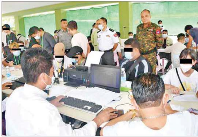
ထိန်းသိမ်းထားသည့် ပြည်ပနိုင်ငံသားများကို သက်ဆိုင်ရာနိုင်ငံများသို့ ပြန်လည်လွှဲပြောင်းပေးနိုင်ရေး လိုအပ်သည်ကိုယ်ရေးအချက်အလက်များနှင့် စာရင်းကောက်ယူခြင်းများ ဆောင်ရွက်စဉ်။

ထိုသို့ ဆောင်ရွက်လျက်ရှိရာ ထိုင်းနိုင်ငံအပါအဝင် အိမ်နီးချင်းနိုင်ငံအချို့ကို တစ်ဆင့်ခံပြတ်သန့်၍ မြန်မာနိုင်ငံအတွင်းသို့ နယ်စပ်လမ်းကြောင်းများမှ တရားမဝင် ဝင်ရောက်လာပြီး ကရင်ပြည်နယ် မြဝတီမြို့- မယ်ထော်သလေးနှင့် KK Park နယ်မြေတို့၌ အွန်လိုင်းလောင်းကစားမှုများ၊ အွန်လိုင်းလိမ်လည်မှုများ ကျူးလွန်ခဲ့ကြသည့် တရုတ်နိုင်ငံသား ၁၆၃ ဦးကို ယနေ့တွင် ထပ်မံစစ်ဆေးဖော်ထုတ်ထိန်းသိမ်းနိုင်ခဲ့ပြီး သက်ဆိုင်ရာနိုင်ငံသို့ အမြန်ဆုံး ပြန်လည်လွှဲပြောင်းပေးနိုင်ရေးအတွက် ၎င်းတို့၏ ကိုယ်ရေးအချက်အလက်များနှင့် မှတ်တမ်းများ