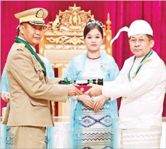
နိုင်ငံတော်စီမံအုပ်ချုပ်ရေးကောင်စီဥက္ကဋ္ဌ နိုင်ငံတော်ဝန်ကြီးချုပ် ဗိုလ်ချုပ်မှူးကြီး သတိုးမဟာသရေစည်သူ သတိုးသီရိသုဓမ္မ မင်းအောင်လှိုင် ဇေယျကျော်ထင်ဘွဲ့ ရရှိသူ ကာကွယ်ရေးဝန်ကြီးဌာနမှ ဗိုလ်ချုပ်မိုးမင်းထွန်းအား ဂုဏ်ထူးဆောင်ဘွဲ့ ချီးမြှင့်အပ်နှင်းစဉ်။