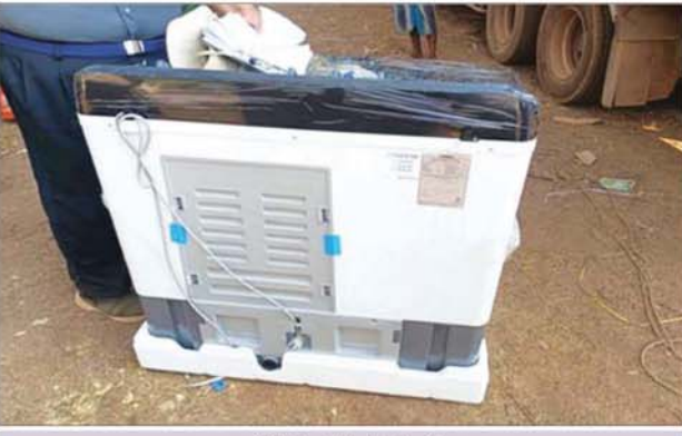
ကရင်ပြည်နယ်၌ ဖမ်းဆီးရမိမှု။

နေပြည်တော် မတ် ၁၆ တရားမဝင်ကုန်သွယ်မှုတိုက်ဖျက်ရေး ဦးဆောင်ကော်မတီ၏ ကြီးကြပ်ကွပ်ကဲမှုဖြင့် တရားမဝင်ကုန်သွယ်မှုများကို ဥပဒေနှင့်အညီ ထိရောက်စွာ တားဆီးအရေးယူနိုင်ရေး ဆောင်ရွက်လျက်ရှိသည်။