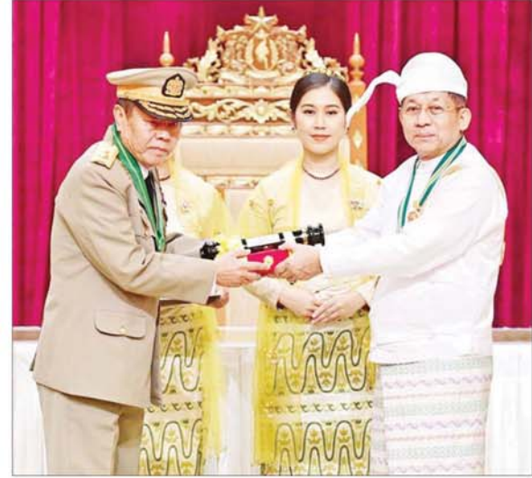
နိုင်ငံတော်စီမံအုပ်ချုပ်ရေးကောင်စီဥက္ကဋ္ဌ နိုင်ငံတော်ဝန်ကြီးချုပ် ဗိုလ်ချုပ်မှူးကြီး သတိုးမဟာသရေစည်သူ သတိုးသီရိသုဓမ္မ မင်းအောင်လှိုင် ဝဏ္ဏကျော်ထင်ဘွဲ့ ရရှိသူ ပြည်ထောင်စုရာထူးဝန်အဖွဲ့ အဖွဲ့ဝင် (အငြိမ်းစား) ဦးမောင်လှအတွက် ဂုဏ်ထူးဆောင် ဘွဲ့ ချီးမြှင့်ရာ သား ဗိုလ်ချုပ်လှဝင်း (အငြိမ်းစား) က လက်ခံစဉ်။