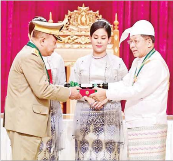
နိုင်ငံတော်စီမံအုပ်ချုပ်ရေးကောင်စီဥက္ကဋ္ဌ နိုင်ငံတော်ဝန်ကြီးချုပ် ဗိုလ်ချုပ်မှူးကြီး သတိုးမဟာသရေစည်သူ သတိုးသိရီသုဓမ္မ မင်းအောင်လှိုင် ဇေယျကျော်ထင်ဘွဲ့၊ ရရှိသူ ကာကွယ်ရေးဝန်ကြီးဌာနမှ ဗိုလ်ချုပ်အောင်ကျော်ကျော်အား ဂုဏ်ထူးဆောင်ဘွဲ့ ချီးမြှင့်အပ်နှင်းစဉ်။

နိုင်ငံတော်အတွက် ထူးထူးချွန်ချွန် ဆောင်ရွက်ခဲ့ကြသူများ၊ စွန့်လွှတ်စွန့်စားမှု အနစ်နာခံမှု တို့ဖြင့် တာဝန်ကျေခံခဲ့ကြသူများကို နိုင်ငံတော်အစိုးရအနေဖြင့် ကျေးဇူးတင်ရှိပါကြောင်း၊ ဂုဏ်ယူပါကြောင်းကို ထပ်လောင်းပြောကြားလိုကြောင်း။ စာမျက်နှာ ၆ သို့ ○