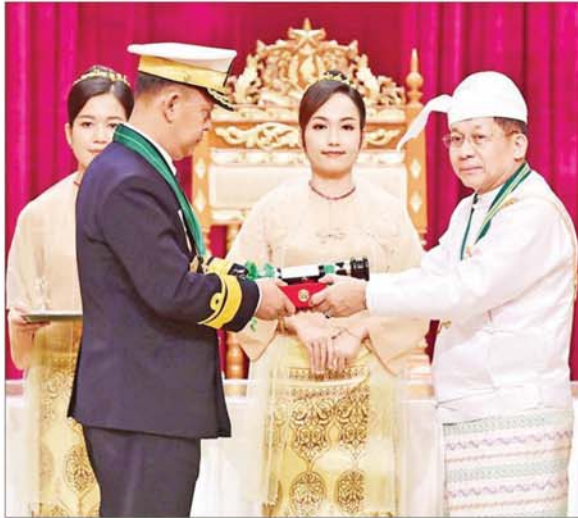
နိုင်ငံတော်စီမံအုပ်ချုပ်ရေးကောင်စီဥက္ကဋ္ဌ နိုင်ငံတော်ဝန်ကြီးချုပ် ဗိုလ်ချုပ်မှူးကြီး သတိုးမဟာသရေစည်သူ သတိုးသီရိသုဓမ္မ မင်းအောင်လှိုင် ဇေယျကျော်ထင်ဘွဲ့ ရရှိသူ ကာကွယ်ရေးဝန်ကြီးဌာနမှ ဗိုလ်ချုပ်နိုင်မင်းကျော်အား ဂုဏ်ထူးဆောင်ဘွဲ့ ချီးမြှင့်အပ်နှင်းစဉ်။