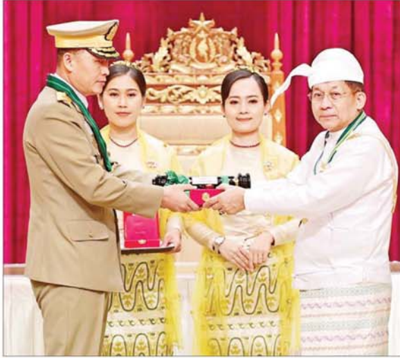
နိုင်ငံတော်စီမံအုပ်ချုပ်ရေးကောင်စီဥက္ကဋ္ဌ နိုင်ငံတော်ဝန်ကြီးချုပ် ဗိုလ်ချုပ်မှူးကြီး သတိုးမဟာသရေစည်သူ သတိုးသီရိသုဓမ္မ မင်းအောင်လှိုင် ဇေယျကျော်ထင်ဘွဲ့ ရရှိသူ ကာကွယ်ရေးဝန်ကြီးဌာနမှ ဗိုလ်ချုပ်စောမင်းလတ်အား ဂုဏ်ထူးဆောင်ဘွဲ့ ချီးမြှင့်အပ်နှင်းစဉ်။