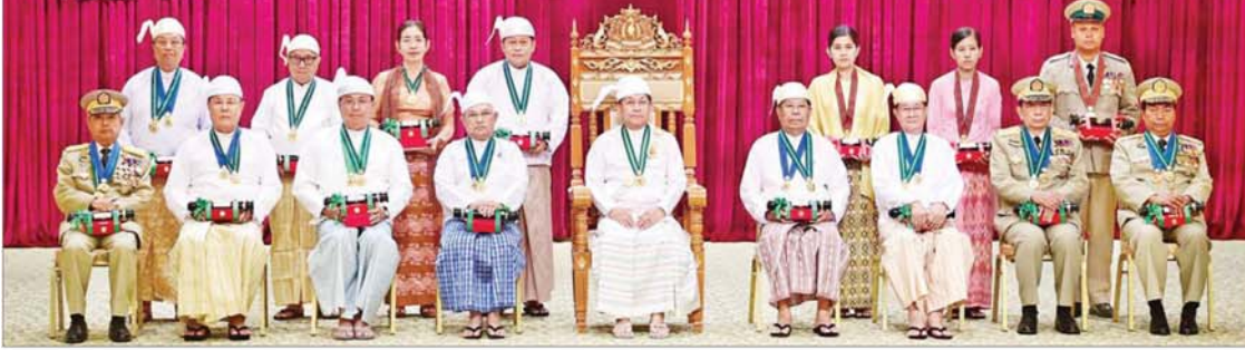
နိုင်ငံတော်စီမံအုပ်ချုပ်ရေးကောင်စီဥက္ကဋ္ဌ နိုင်ငံတော်ဝန်ကြီးချုပ် ဗိုလ်ချုပ်မှူးကြီး သတိုးမဟာသရေစည်သူ သတိုးသိရီသုဓမ္မ မင်းအောင်လှိုင် စည်သူဘွဲ့၊ သူရဘွဲ့၊ ရရှိသူများနှင့်အတူ စုပေါင်းမှတ်တမ်းတင် ဓာတ်ပုံရိုက်စဉ်။