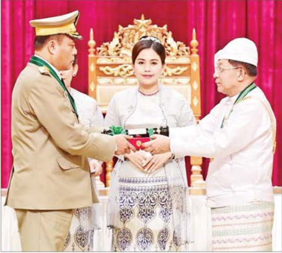
နိုင်ငံတော်စီမံအုပ်ချုပ်ရေးကောင်စီဥက္ကဋ္ဌ နိုင်ငံတော်ဝန်ကြီးချုပ် ဗိုလ်ချုပ်မှူးကြီး သတိုးမဟာသရေစည်သူ သတိုးသီရိသုဓမ္မ မင်းအောင်လှိုင် ဇေယျကျော်ထင်ဘွဲ့ ရရှိသူ ကာကွယ်ရေးဝန်ကြီးဌာနမှ ဗိုလ်ချုပ်သန်းထိုက်အား ဂုဏ်ထူးဆောင်ဘွဲ့ ချီးမြှင့်အပ်နှင်းစဉ်။