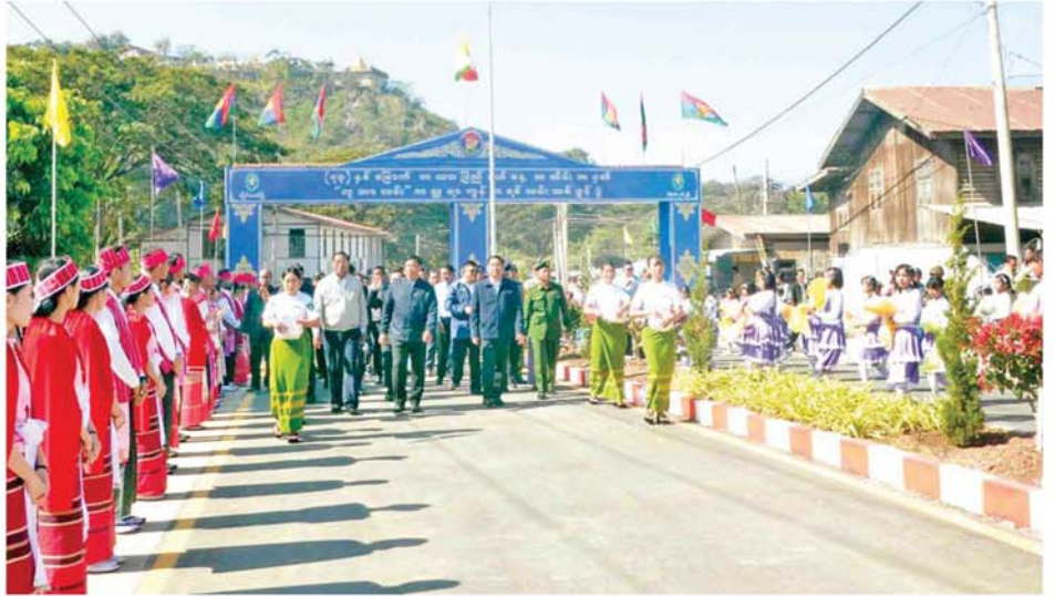
နိုင်ငံတော်စီမံအုပ်ချုပ်ရေးကောင်စီအဖွဲ့ဝင် ဒုတိယဝန်ကြီးချုပ်နှင့် ပြည်ထောင်စုဝန်ကြီး ဗိုလ်ချုပ်ကြီးတင်အောင်စန်းနှင့် အဖွဲ့ဝင်များ (၇၃)နှစ်မြောက် ကယားပြည်နယ်နေ့အထိမ်းအမှတ်အဖြစ် ဖွင့်လှစ်ခဲ့သည့် လှိုင်ကော်မြို့ လောစမွရပ်ကွက်နှင့် ဒေါတမရပ်ကွက်ရှိ ဘူတာလမ်း ကတ္တရာကွက်ကရစ်လမ်းသစ်ကို ဖြတ်သန်းကြည့်ရှုစဉ်။

ယမန်နေ့ကလည်း ဒုတိယ ဝန်ကြီးချုပ်နှင့် ပြည်ထောင်စု ဝန်ကြီးနှင့် အဖွဲ့ဝင်များသည် (၇၃)နှစ်မြောက် ကယားပြည်နယ် နေ့အထိမ်းအမှတ်အဖြစ် လှိုင်ကော် မြို့ လောစမွရပ်ကွက်နှင့် ဒေါတမ ရပ်ကွက်ရှိ ဘူတာလမ်း ကတ္တရာ ကွန်ကရစ် လမ်းသစ်ဖွဲ့သည့် တက် ရောက်ပြီး ဒုတိယဝန်ကြီးချုပ်နှင့် ပြည်ထောင်စုဝန်ကြီးက ဘူတာ လမ်း ကတ္တရာကွန်ကရစ်လမ်းသစ် ဖွင့်ပွဲမှစဉ်စဉ်စဉ်စဉ်စဉ်စဉ် ဖွင့်လှစ်ပေးပြီး အကအဖွဲ့များကို ဂုဏ်ပြုချီးမြှင့်ငွေများ ပေးအပ်၍ လမ်းသစ်ကို ဖြတ်သန်းကြည့်ရှု ကာ တက်ရောက်လာသော တိုင်း ရင်းသားရိုးရာအကအဖွဲ့များနှင့် ဒေသခံပြည်သူများအား ရင်းရင်း