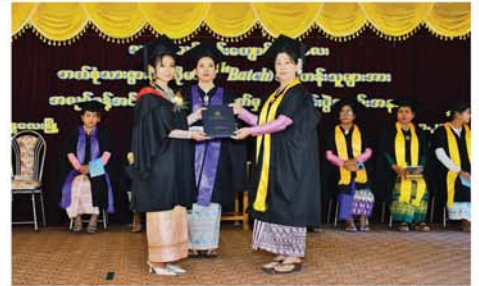
ကျောင်းအုပ်ကြီးနှင့် သင်ကြား၊ စီမံဆရာမများ၊ သင်တန်းသူ ၃၃ ဦးနှင့်၎င်းတို့၏ မိဘဆွေမျိုးများ တက်ရောက်ကြကြောင်း သိရသည်။ (အပေါ်ပုံ) (၀၉၃)

အောင်လက်မှတ်များအပ်နှင်းပြီး သင်တန်းဆင်းမိန့်ခွန်းပြောကြား ကာ အခမ်းအနားကို ရုပ်သိမ်း ခဲ့သည်။ အခမ်းအနားသို့ တိုင်းဒေသ ကြီးပြည်သူ့ကျန်းမာရေးနှင့်ကုသ ရေးဦးစီးမှူး၊ သားဖွားသင်တန်း ကျောင်း(မန္တလေး)၏ စီမံခန့်ခွဲရေး အဖွဲ့နှင့် ပညာရေးအဖွဲ့ဝင်များ၊