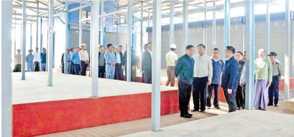
နိုင်ငံတော်စီမံအုပ်ချုပ်ရေးကောင်စီအဖွဲ့ဝင် ဒုတိယဝန်ကြီးချုပ်နှင့် ပြည်ထောင်စုဝန်ကြီး ဗိုလ်ချုပ်ကြီးတင်အောင်စန်း လှိုင်ကော်မြို့ သီရိမင်္ဂလာဈေးသစ် တည်ဆောက်ပြီးစီးမှုအခြေအနေများကို ကြည့်ရှုစစ်ဆေးစဉ်။