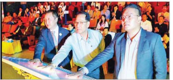
ပြည်ထောင်စုဝန်ကြီး ဦးမောင်မောင်အုန်း၊ Borderless Broadcast Co.,Ltd. CEO နှင့် Lao Asia Pacific Satellite Co.,Ltd. မှ Deputy CEO တို့က MYANSAT DTH ရုပ်သံလိုင်းထုတ်လွှင့်မှုကို စက်ခလုတ်နှိပ်ဖွင့်လှစ်ပေးကြစဉ်။

ကြည့်ရှုအားပေး ဦးစွာ ပင်မအဆောက်အအုံရှိ Auditorium ခန်းမ၌ MYANSAT DTH ရုပ်သံလိုင်း စတင်ထုတ်လွှင့်မှု ဖွင့်လှစ်ခြင်းအခမ်းအနားကို Animation ဖြင့် ဖွင့်လှစ်ပြသပြီး “အသစ်အဆန်းများစေသော DTH ကမ္ဘာ” အမည်ပေးထားသည့် Video Clip ပြသမှုကိုဆက်လက်၍ ကြည့်ရှုအားပေးကြသည်။ ထို့နောက် ပြည်ထောင်စုဝန်ကြီး ဦးမောင်မောင်အုန်းက အဖွင့်အမှာစကား ပြောကြားရာတွင် အများပြည်သူအတွက် ပျော်ရွှင်ကြည့်ရှု ချမ်းမြေ့မှုနှင့် စိတ်နှစ်နှစ်အားသစ်များ ပေးစွမ်းနိုင်မည့် DTH ရုပ်သံလိုင်းသစ်တစ်ခုကို ထပ်မံတိုးချဲ့ ဖွင့်လှစ်ပေးနိုင်မည်ဖြစ်၍ အဓိပ္ပာယ်ရှိပြီး အနှစ်သာရပြည့်ဝသော မင်္ဂလာရှိသည့် အခမ်းအနားတစ်ခု ဖြစ်ပါကြောင်း၊ ပြန်ကြားရေးဝန်ကြီးဌာန အနေဖြင့် ပြည်သူများ၏ သိရှိ၊ ခံစားပိုင်ခွင့်ဖြစ်သည့် သတင်းအချက်အလက် အသိပညာ ဗဟုသုတများကို ဖြည့်ဆည်းပေးနိုင်ရန် နည်းလမ်းမျိုးစုံဖြင့် စဉ်ဆက်မပြတ် ကြိုးပမ်းဆောင်ရွက်လျက်ရှိရာတွင် နိုင်ငံပိုင်မီဒီယာများအပြင် ပုဂ္ဂလိက