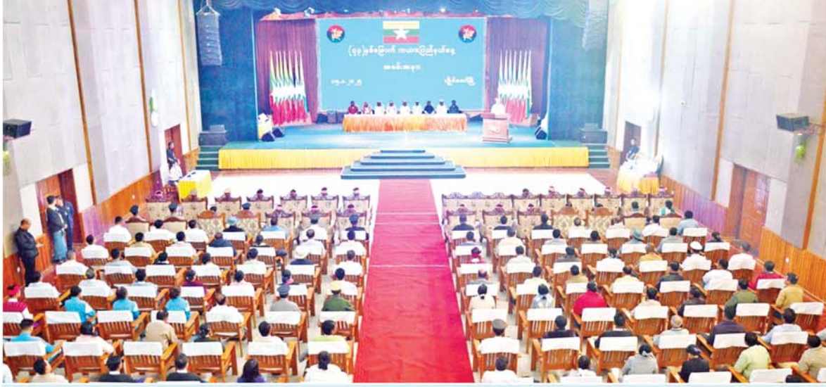
နိုင်ငံတော်စီမံအုပ်ချုပ်ရေးကောင်စီဥက္ကဋ္ဌ နိုင်ငံတော်ဝန်ကြီးချုပ် ဗိုလ်ချုပ်မှူးကြီး သတိုးမဟာသရေစည်သူ သတိုးသီရိသုဓမ္မ မင်းအောင်လှိုင်ထံမှ ပေးပို့သော (၇၃)နှစ်မြောက် ကယားပြည်နယ်နေ့အထိမ်းအမှတ် သဝဏ်လွှာကို နိုင်ငံတော်စီမံအုပ်ချုပ်ရေးကောင်စီအဖွဲ့ဝင်၊ ဒုတိယဝန်ကြီးချုပ်နှင့် ပြည်ထောင်စုဝန်ကြီး ဗိုလ်ချုပ်ကြီး တင်အောင်စန်းက ဖတ်ကြားစဉ်။

လွိုင်ကော် ဇန်နဝါရီ ၁၅ ၂၀၂၅ ခုနှစ် ဇန်နဝါရီ ၁၅ ရက်တွင် ကျရောက်သည့် (၇၃) နှစ်မြောက် ကယားပြည်နယ်နေ့ အခမ်းအနားကို ယနေ့ နံနက်ပိုင်းတွင် လွိုင်ကော်မြို့ ပြည်နယ်ခန်းမ၌ ကျင်းပရာ နိုင်ငံတော်စီမံအုပ်ချုပ်ရေးကောင်စီအဖွဲ့ဝင်၊ ဒုတိယဝန်ကြီးချုပ်နှင့် နိုင်ငံတော်ဝန်ကြီးချုပ်ရုံး ပြည်ထောင်စုဝန်ကြီး ဗိုလ်ချုပ်ကြီး တင်အောင်စန်း တက်ရောက်သည်။