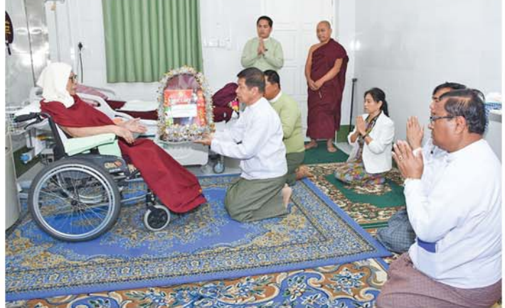
ကျန်းမာရေးစောင့်ရှောက်မှုပေးလျက်ရှိကြောင်း သိရသည်။ (မန္တလေးနေ့စဉ်) ၀-၀-၀-၀

ရှင်းလင်းတင်ပြရာ တိုင်းဒေသကြီးဝန်ကြီးချုပ်က ဆရာတော်ကြီးအား ကျန်းမာရေးစောင့်ရှောက်ပေးရာတွင် လစ်ဟင်းမှုမရှိစေရန် အထူးကြပ်မတ်ဆောင်ရွက်ပေးရေးတို့ကိုတာဝန်ရှိသူများအား မှာကြားပြီးလိုအပ်သည်များကို ဖြည့်ဆည်းဆောင်ရွက်ပေးခဲ့သည်။ နိုင်ငံတော်ဩဝါဒါစရိယ၊ မဟာဂန္ဓာရုံကျောင်းတိုက်ကြီး၏ မဟာနာယကချုပ် ဆရာတော်ကြီးမှာ မန္တလေးအထွေထွေကျောင်းကြီး ကိုးထပ်ဆောင်ရှိ အထူးသီးသန့်ခန်းတွင် သီတင်းသုံးကာ လိုအပ်သည့် ဆေးဝါးကုသမှုများ ခံယူလျက်ရှိပြီး ဆရာတော်ကြီး၏ ကျန်းမာရေး စောင့်