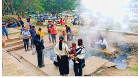
ကျိုင်းတုံမြို့နယ်(ပြန်/ဆက်)

တွင် ပြည်သူများ စိတ်အေးချမ်းသာစွာ လာရောက်အပန်းဖြေလည်ပတ်ကြသူများဖြင့် စည်ကားလျက်ရှိကြောင်း သိရသည်။ (အပေါ်ပုံ)