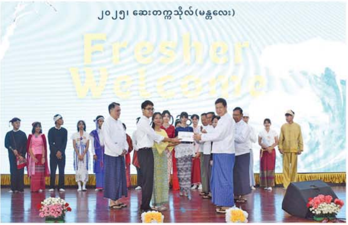
၂၀၂၅၊ ဆေးတက္ကသိုလ်(မန္တလေး) သား၊ ကျောင်းသူများ ရိုက်ကူးထားသည့် ဆေးတက္ကသိုလ်(မန္တလေး)သမိုင်းကြောင်း video clip တို့ကို ကြည့်ရှုအားပေးပြီး တိုင်းဒေသကြီးဝန်ကြီးချုပ်က ဂုဏ်ပြုငြေများ ချီးမြှင့်ခဲ့ကြောင်းနှင့် အခမ်းအနားကို အစီအစဉ်အတိုင်း ဆက်လက်ကျင်းပခဲ့ကြောင်း သိရသည်။ (မန္တလေးနေ့စဉ်)

သဘောထားမှန်ကန်၍ ကျင့်ဝတ်သိက္ခာများကို လေးစားလိုက်နာပြီး ပြည်သူလူထုအားကိုးရထိုက်သည့် ကျန်းမာရေးစောင့်ရှောက်မှုပေးနိုင်သူများဖြစ်အောင်၊ လူသားများ၏အကျိုး၊ တိုင်းပြည်အကျိုးတို့ကို ဆောင်ရွက်နိုင်သော နိုင်ငံသားကောင်းများဖြစ်သည်အထိ ကြိုးစားသွားကြရမည်ဖြစ်ပါကြောင်း ပြောကြားခဲ့သည်။ ဆက်လက်၍ ကျောင်းသား၊ ကျောင်းသူတစ်ဦးစီက ကြိုဆိုနှုတ်ခွန်းဆက်စကားနှင့် ကျေးဇူးတင်စကားများကို ပြောကြားပြီးနောက် တိုင်းဒေသကြီးဝန်ကြီးချုပ်နှင့်အဖွဲ့သည် ကျောင်းသား၊ ကျောင်းသူများမှ ကြိုဆိုဂုဏ်ပြုဖော်ဖြေမှုများနှင့် ကျောင်း