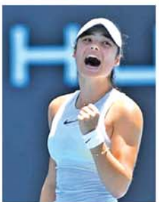
ပြိုင်ကစားသွားမည်ဖြစ်သည်။ (အပေါ်ပုံ)

လန်ဒန် ဇန်နဝါရီ ၁၄ ဩစတြေးလျနိုင်ငံတွင် ကျင်းပပြုလုပ်လျက်ရှိသော အမျိုးသမီး ၂၀၂၅ Australian Open တင်းနစ်ပြိုင်ပွဲ ဒုတိယအဆင့်သို့ တရုတ်တင်းနစ်မယ် Wang Yafan တက်ရောက်ခဲ့သည်။ အဆိုပါ တရုတ်တင်းနစ်မယ် Wang Yafan သည် 2025 Australian Open တွင် ဟန်ဒရီကတ်နစ်မယ် Anna Bondar အား ၃-၆၊ ၆-၃၊ ၆-၄ ဖြင့် အနိုင်ရရှိကာ ဒုတိယအဆင့်သို့ တက်ရောက်ခဲ့ခြင်းဖြစ်သည်။ 2025 Australian Open တွင် ဟန်ဒရီကတ်နစ်မယ် Wang Yafan နှင့် ရုရှားတင်းနစ်မယ် Daria Kasatkina တို့ ယှဉ်