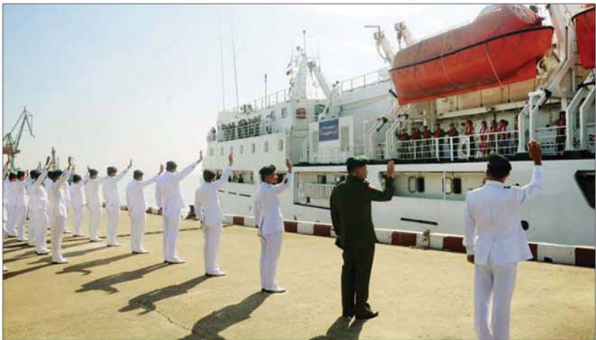
တပ်မတော်ပင်လယ်သွားဆေးရုံရေယာဉ်(သံလွင်) အမှတ်(၂) ရေတပ်ဆိပ်ခံတံတားမှထွက်ခွာရာ တပ်မတော်(ရေ)မှ အရာရှိကြီးများနှင့် အရာရှိ၊ စစ်သည်မိသားစုများ ပို့ဆောင်ပေးဆောင်ကြသည်။

နေပြည်တော် ၈နိုဝင်ဘာ ၁၄ ရောဝတီတိုင်းဒေသကြီးအတွင်း ရောဝတီမြစ်ကြောင်းတစ်လျှောက်ရှိမြစ်ဝကျွန်းပေါ် နေကျေးရွာများမှ ဒေသခံပြည်သူများအား ကျန်းမာရေးစောင့်ရှောက်မှုလုပ်ငန်းများ ဆောင်ရွက်ပေးရန်အတွက် တပ်မတော် နယ်လှည့်အထူးကုဆေးအဖွဲ့မှ ပါရဂူများ၊ ဆေးမှူးများနှင့် သူနာပြုများ ပါဝင်သည့် တပ်မတော်မြစ်တွင်းသွားဆေးရုံရေယာဉ် (ရွှေပုဇွန်)နှင့် မြစ်ရေယာဉ် (စက)တို့သည် ယနေ့နံနက်ပိုင်းတွင် ရန်ကုန်မြို့ အမှတ် (၄)ရေတပ်ဗေတတံတားမှလည်းကောင်း၊ ရန်ကုန်တိုင်းဒေသကြီး ကိုကိုးကျွန်းမြို့နယ်၊ တနင်္သာရီတိုင်းဒေသကြီးအတွင်းရှိ ကမ်းရိုးတန်းတစ်လျှောက်မှ မြို့နယ်၊ ကျေးရွာများနှင့် ရောဝတီတိုင်းဒေသကြီး ဟိုင်းကြီးကျွန်းမြို့နယ်အတွင်းရှိ ပတ်ဝန်းကျင်ကျေးရွာများမှ ဒေသခံပြည်သူများအား ကျန်းမာရေးစောင့်ရှောက်မှုလုပ်ငန်းများ ဆောင်ရွက်ပေးရန်အတွက် တပ်မတော် နယ်လှည့်အထူးကုဆေးအဖွဲ့မှ ပါရဂူများ၊ ဆေးမှူးများနှင့် သူနာပြုများပါဝင်သည့် တပ်မတော်ပင်လယ်သွားဆေးရုံရေယာဉ် (သံလွင်)သည် ယနေ့ နေ့လယ်ပိုင်းတွင် ရန်ကုန်မြို့အမှတ်(၂)ရေတပ်ဆိပ်ခံတံတား (သန်လျင်)မှလည်းကောင်း၊ အသီးသီး ထွက်ခွာကြရာ တပ်မတော်(ရေ)မှ အရာရှိကြီးများနှင့် အရာရှိ၊ စစ်သည် မိသားစုများက ပို့ဆောင်ပေးဆောင်ကြသည်။ အဆိုပါ တပ်မတော်မြစ်တွင်းသွား