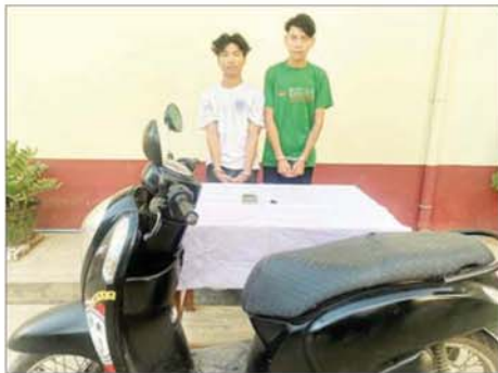
ဝဲမှယာ တရားခံ ကောင်စီခန့်စေ့(ခ)ဆင်ပေါက်၊ တရားခံ ဝေဠုကျော်

၂၀၂၅ ခုနှစ် ဇန်နဝါရီ ၇ ရက်က နေပြည်တော်ကောင်စီ ပျဉ်းမနားမြို့နယ် သဲကျွန်းကျေးရွာရှိ PNPT ကလေးအားကစားကွင်းအနီး ယာခင်းလှည့်သွားလမ်းပေါ်တွင် အမျိုးသားတစ်ဦး (စိစစ်ဆဲ)မှာ ပါးစပ်အတွင်း ကျွန်းရွက်ခြောက်များဆွဲသွင်းထားပြီး လက်နှစ်ဖက်နှင့် ခြေထောက်နှစ်ဖက်တို့အား အင်္ကျီ/ပလတ်စတစ်ကြိုးများဖြင့် ချည်နှောင်လျက် ဦးခေါင်း နောက်စေ့တွင် ပြတ်ရှည်ရာ တစ်ချက်၊ ခန္ဓာကိုယ်၌ ပွန်းခြစ်ဒဏ်ရာများ၊ ဝဲဘက်နား သွေးထွက်ဒဏ်ရာများဖြင့် သေဆုံးနေကြောင်းသတင်းအရ လုံခြုံရေးတပ်ဖွဲ့ဝင်များက သက်သေများနှင့်အတူ သွားရောက်စစ်ဆေးခဲ့ပြီး ပြစ်မှုကျူးလွန်သူများအား ဖော်ထုတ်ဖမ်းဆီးရမိနိုင်ရေး ရွာကောက်နယ်မြေရဲစခန်း(၁)/၂၀၂၅ ရာဇသတ်ကြီးပုဒ်မ ၃၀၂ ဖြင့် အမှုရေးဖွင့် စုံစမ်းဆောင်ရွက်ခဲ့သည်။