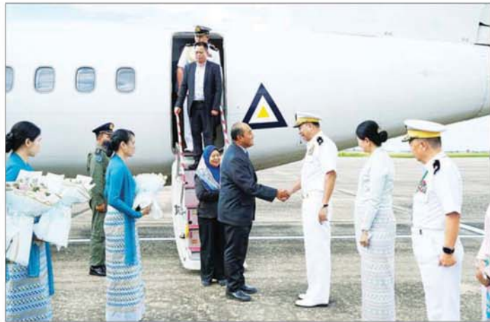
အာဆီယံနိုင်ငံများမှ ရေတပ်ဦးစီးချုပ်များနှင့် ကိုယ်စားလှယ်အဖွဲ့များအား နေပြည်တော်လေဆိပ်၌ စစ်ဦးစီးအရာရှိချုပ် (ရေ) ဗိုလ်ချုပ်အေးမင်းထွေး၊ တပ်မတော်(ရေ)မှ အရာရှိကြီးများနှင့် တာဝန်ရှိသူများက ကြိုဆိုနှုတ်ဆက်စဉ်။

ရေတပ်ဦးစီးချုပ်များ အစည်းအဝေးသို့ တက်ရောက်လာကြသည့်အာဆီယံရေတပ် အကြီးအကဲများ၊ ကိုယ်စားလှယ်အဖွဲ့ ခေါင်းဆောင်များနှင့်အတူ စုပေါင်း မှတ်တမ်းတင်ဓာတ်ပုံရိုက်ကြသည်။ အမှတ်တရလက်ဆောင်ပေးအပ် ထို့နောက် နိုင်ငံတော်စီမံအုပ်ချုပ်ရေး ကောင်စီအဖွဲ့ဝင်၊ ညှိနှိုင်းကွပ်ကဲရေးမှူး (ကြည်း၊ ရေ၊ လေ) ထံသို့ အာဆီယံ ရေတပ်အကြီးအကဲများ၊ ကိုယ်စားလှယ် အဖွဲ့ ခေါင်းဆောင်များကိုယ်စား ကာကွယ် ရေးဦးစီးချုပ်(ရေ) မှ 18 th ASEAN Navy Chief's Meeting အထိမ်းအမှတ် အမှတ် တရ လက်ဆောင်ပေးအပ်ခဲ့ကြကြောင်း သတင်းရရှိသည်။ သတင်းစဉ်