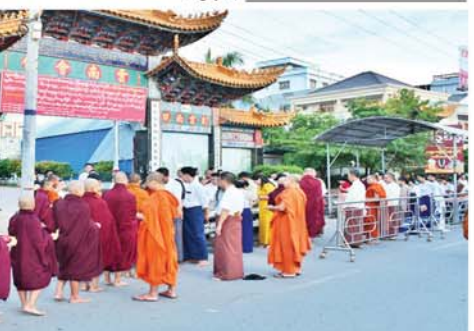
(အပေါ်ပုံ) (ရွှေမုန့်)

နှင့် မန္တလေး၊ အင်းဝကိုယ်ပိုင် အထက်တန်းကျောင်းက ဆွမ်း၊ ဆွမ်းဟင်းများ၊ လှူဖွယ်ပစ္စည်း များနှင့် နဝကမ္မဝတ္ထုငွေများ ဆက်ကပ်လောင်းလှူကြောင်း သိရသည်။ (အောက်ပုံ) (၀၉၃)