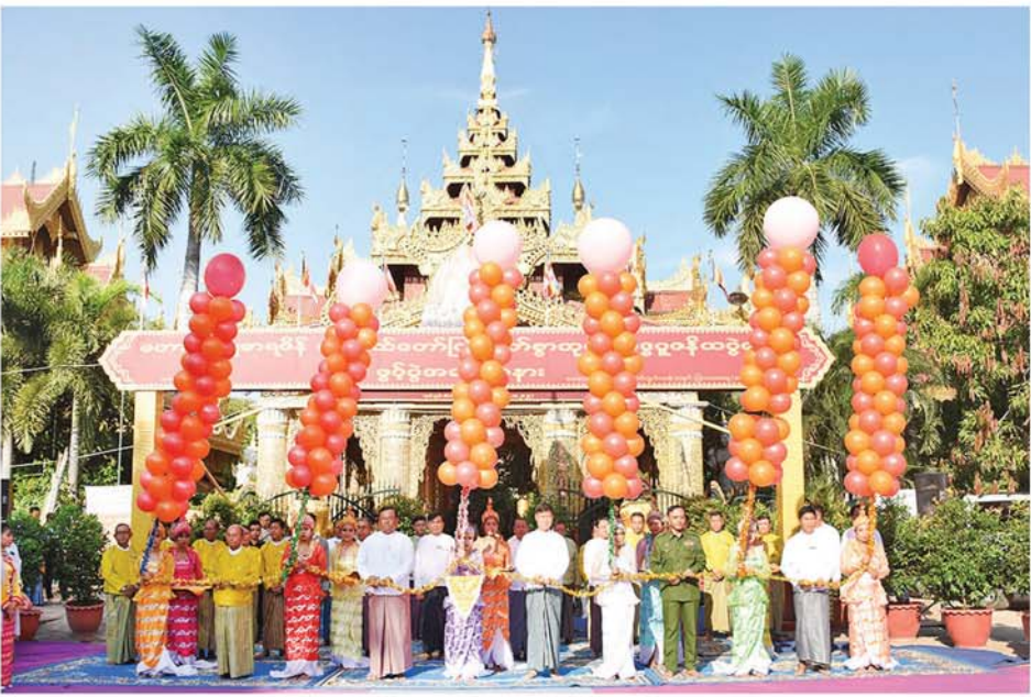
ပင်သံဃာ ၂၅၆၈ပါးတို့အား ဆွမ်း၊ ဆွမ်းဟင်းနှင့်တကွ ဒါတပဝတ္ထု အစုစုတို့ဖြင့် လောင်းလှူသွားမည် ဖြစ်ကြောင်း သိရသည်။ (မန္တလေးနေ့စဉ်) ၀-၀-၀-၀-၀

မဟာသကျမာရဇိန်ကျောက် တော်ကြီးမြတ်စွာဘုရား၏(၁၃၆) ကြိမ်မြောက် ဗုဒ္ဓပူဇနိယပွဲတော် သံဃာ့ဒါနဆွမ်းတော်ကြီး လောင်းလှူပွဲကို အောက်တိုဘာ ၂၀ရက် (သီတင်းကျွတ်လပြည့် ကျော် ၃ ရက်)နေ့ နံနက်ပိုင်းတွင် စည်ကားသိုက်မြိုက်စွာ ကျင်းပ သွားမည်ဖြစ်ပြီး သာသနာတော် နှစ် ၂၅၆၈ ကို အမွှေးထား၍ မန္တလေးမြို့လေးပြင်လေးရပ်မှ