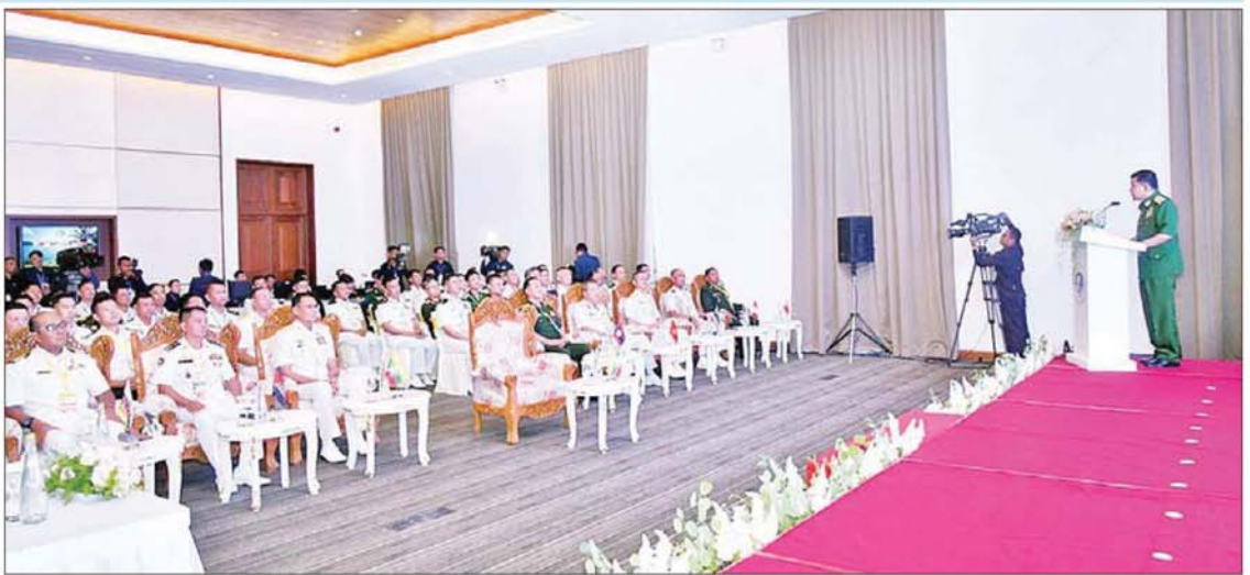
နိုင်ငံတော်စီမံအုပ်ချုပ်ရေးကောင်စီအဖွဲ့ဝင် ညှိနှိုင်းကွပ်ကဲရေးမှူး (ကြည်း၊ ရေ၊ လေ) ဗိုလ်ချုပ်ကြီး မောင်မောင်အေး (၁၈)ကြိမ်မြောက် အာဆီယံရေတပ်ဦးစီးချုပ်များ အစည်းအဝေး (18 th ASEAN Navy Chief's Meeting) ဖွင့်ပွဲအခမ်းအနားတွင် အဖွင့်အမှာစကားပြောကြားစဉ်။