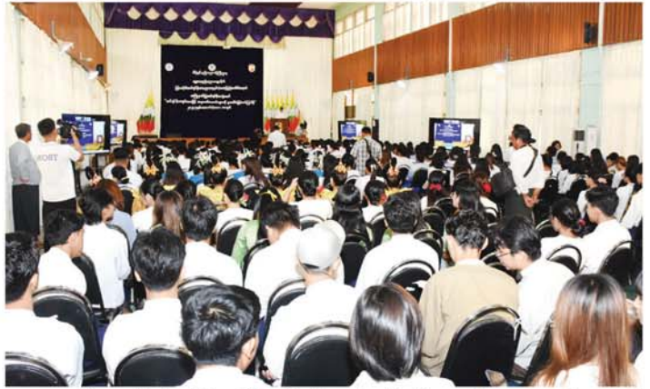
ပညာရေး နှစ် ၁၀၀ ပြည့် အကြိုဂုဏ်ပြု အင်ဂျင်နီယာပွဲတော်တွင် ကျောင်းသား၊ ကျောင်းသူများ၏ ဖျော်ဖြေတင်ဆက်မှုများကို ကြည့်ရှုအားပေး၍ ဂုဏ်ပြုငွေများချီးမြှင့်ပြီး နည်းပညာအမျိုးအစား အလိုက် ပြသထားသည့်ပြခန်းများအတွင်း လှည့်လည်ကြည့်ရှုအားပေးခဲ့ကြောင်းနှင့် အခမ်းအနား ဒုတိယပိုင်းကို မွန်းလွဲပိုင်းတွင် ဆက်လက်ကျင်းပခဲ့ကြောင်း သိရသည်။ (မန္တလေးနေ့စဉ်)