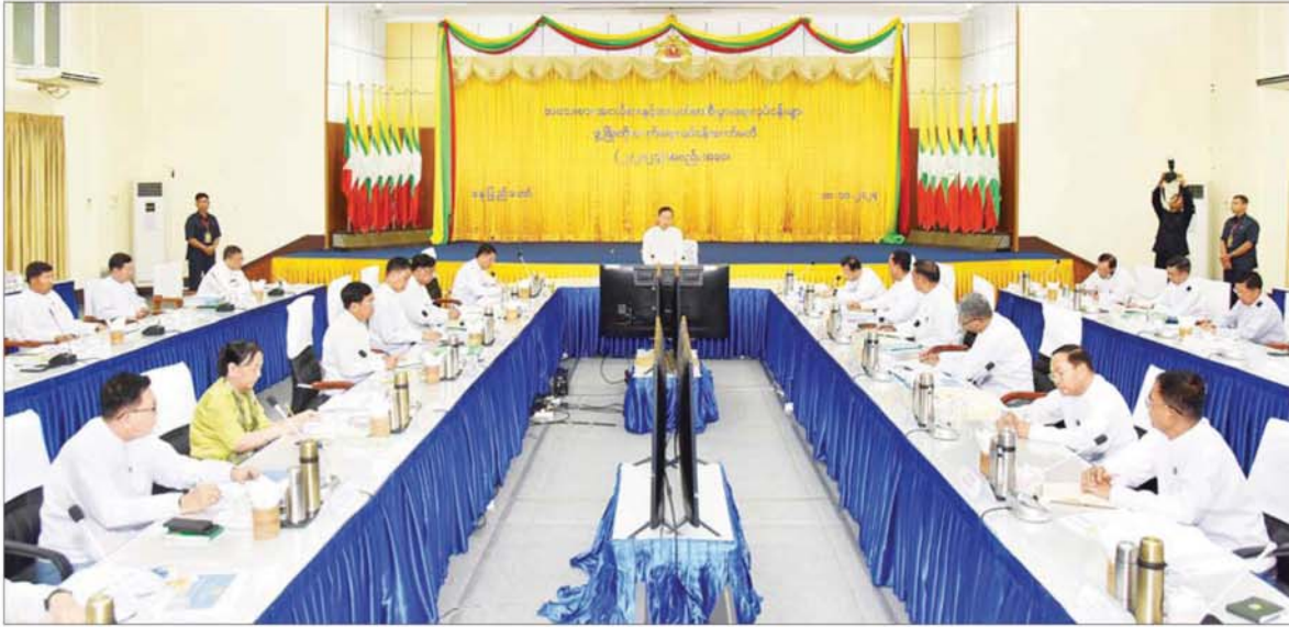
နိုင်ငံတော်စီမံအုပ်ချုပ်ရေးကောင်စီ ဒုတိယဥက္ကဋ္ဌ ဒုတိယဝန်ကြီးချုပ် ဒုတိယဗိုလ်ချုပ်မှူးကြီး စိုးဝင်း အသေးစား၊ အငယ်စားနှင့် အလတ်စား စီးပွားရေးလုပ်ငန်းများ ဖွံ့ဖြိုးတိုးတက်ရေးလုပ်ငန်းကော်မတီအစည်းအဝေး(၂/၂၀၂၄)တွင် အမှာစကားပြောကြားစဉ်။

နေပြည်တော် အောက်တိုဘာ ၁၀ အသေးစား၊ အငယ်စားနှင့် အလတ်စား စီးပွားရေးလုပ်ငန်းများ ဖွံ့ဖြိုးတိုးတက်ရေး လုပ်ငန်းကော်မတီ အစည်းအဝေး(၂/၂၀၂၄)ကို ယနေ့ မွန်းလွဲပိုင်းတွင် နေပြည်တော်ရှိ စက်မှုဝန်ကြီးဌာန အစည်းအဝေးခန်းမ၌ ကျင်းပရာ အသေးစား၊ အငယ်စားနှင့် အလတ်စားစီးပွားရေးလုပ်ငန်းများ ဖွံ့ဖြိုးတိုးတက်ရေး လုပ်ငန်းကော်မတီဥက္ကဋ္ဌ နိုင်ငံတော်စီမံအုပ်ချုပ်ရေးကောင်စီ ဒုတိယဥက္ကဋ္ဌ ဒုတိယဝန်ကြီးချုပ် ဒုတိယဗိုလ်ချုပ်မှူးကြီး စိုးဝင်း တက်ရောက် အမှာစကားပြောကြားသည်။ အစည်းအဝေးသို့ပြည်ထောင်စုဝန်ကြီးများဖြစ်ကြသည့် ဦးဝင်းရှိန်၊ ဒေါက်တာကဇော်၊ ဦးလှစိုး၊ ဒေါက်တာချာလီသန်း၊ ဦးထွန်းအုံနှင့် ဒေါက်တာ မျိုးသိန်းကျော်၊ စာမျက်နှာ ၅ သို့