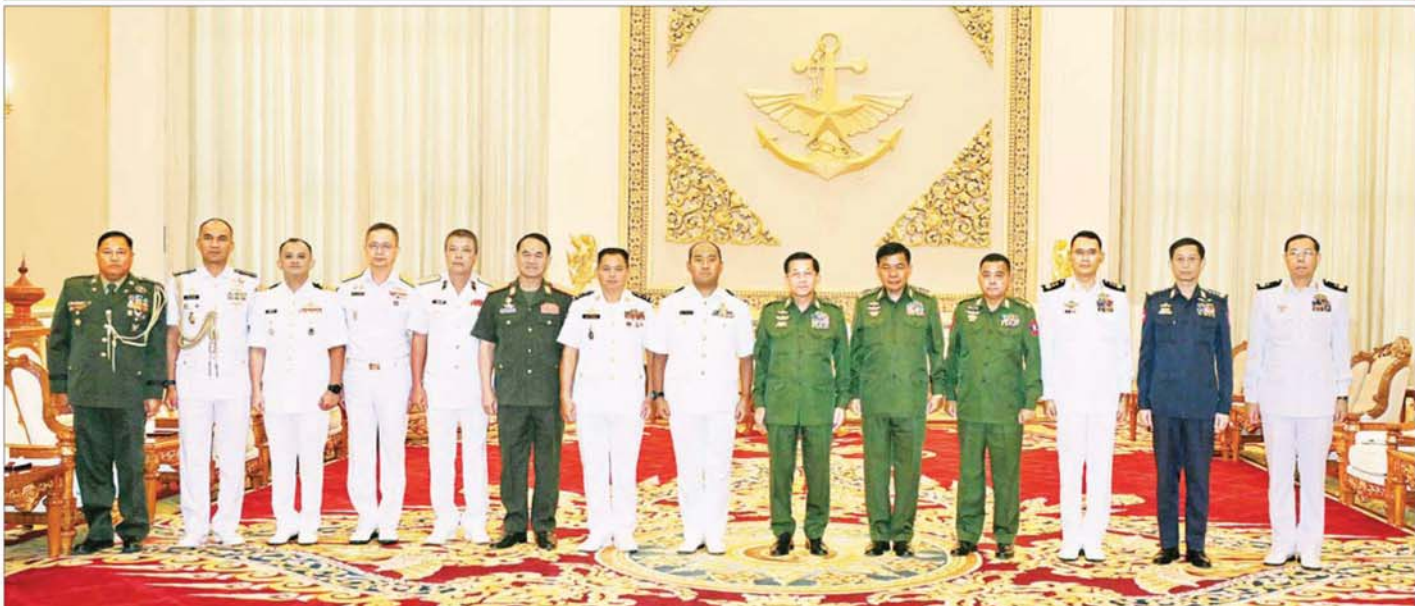
နိုင်ငံတော်စီမံအုပ်ချုပ်ရေးကောင်စီဥက္ကဋ္ဌ တပ်မတော်ကာကွယ်ရေးဦးစီးချုပ် ဗိုလ်ချုပ်မှူးကြီး မင်းအောင်လှိုင်နှင့်အဖွဲ့ဝင်များ (၁၈)ကြိမ်မြောက် အာဆီယံရေတပ်ဦးစီးချုပ်များ အစည်းအဝေးသို့တက်ရောက်မည့် အာဆီယံရေတပ် အကြီးအကဲများနှင့် ကိုယ်စားလှယ်အဖွဲ့ခေါင်းဆောင်များနှင့်အတူ စုပေါင်းမှတ်တမ်းတင်ဓာတ်ပုံရိုက်စဉ်။