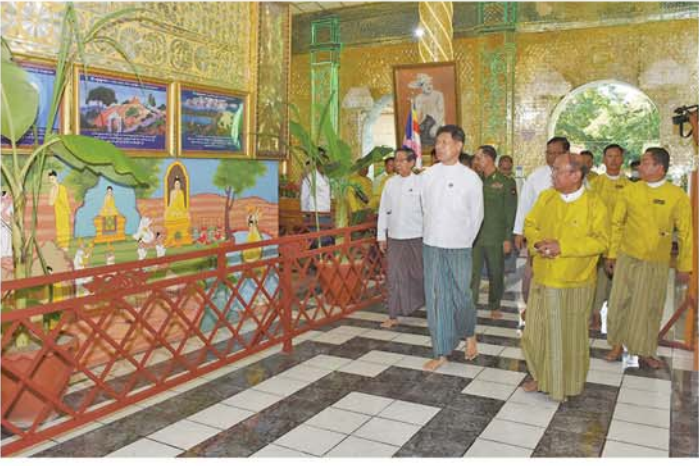
သတင်း-စာမျက်နှာ ၇