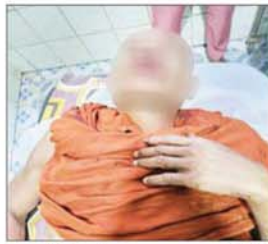
ဖာပွန်မြို့နယ် ရေပူကျေးရွာအနီး၌ အကြမ်းဖက်သမားများ ထောင်ထားသည့် ဒေသန္တရလက်လုပ်တိုက်မိုင်း တစ်လုံးအား တိုက်ခိုက်မှုကြောင့် သံဃာတော်တစ်ပါး ထိခိုက်ဒဏ်ရာ ရရှိမှု။ လုပ်ငန်းများကို တိုးမြှင့်ဆောင်ရွက်လျက် ရှိကြောင်း သတင်းရရှိသည်။ သတင်းစဉ်

အကြမ်းဖက်သမားများထောင်ထားသည့် ဒေသန္တရ လက်လုပ်တိုက်မိုင်းကြီးအား တိုက်ခိုက်၍ ပေါက်ကွဲမှုဖြစ်ပွားပြီး ထိခိုက်ဒဏ်ရာများ ရရှိခဲ့သည်။ အဆိုပါမိုင်းစထိမှန်ဒဏ်ရာရရှိခဲ့သည့် ဆရာတော်အား လုံခြုံရေးတပ်ဖွဲ့ဝင်များက ကမမောင်းမြို့ ပြည်သူ့ဆေးရုံသို့ ပို့ဆောင်ဆေးကုသမှု ခံယူစေလျက်ရှိကြောင်း၊ အကြမ်းဖက်သမားများသည် အများပြည်သူ ဆက်သွယ်အသုံးပြုလျက်ရှိသည့် လမ်းကြောင်းများတွင် ယခုကဲ့သို့ မိုင်းထောင်မှုများကြောင့် ခရီးသွားလာရေးတွင် အခက်အခဲများဖြစ်ပေါ်စေသဖြင့် ယင်းလုပ်ရပ်များကို ဒေသခံပြည်သူများက ပြင်းထန်စွာ ဆန့်ကျင်ကန့်ကွက်လျက်ရှိကြောင်းနှင့် လုံခြုံရေးတပ်ဖွဲ့ဝင်များက လိုအပ်သည့် လုံခြုံရေးနှင့် နယ်မြေစိုးမိုးရေး