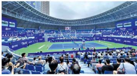
တင်းနစ်မယ်များစွာ ဝင်ရောက် ပြိုင်ပွဲ၏ လက်ရှိချန်ပီယံဖာ တူနီးရှားတင်းနစ်မယ် Ons Jabeur (အပေါ်ပုံ)(NGB) ယှဉ်ပြိုင်သွားမည် ဖြစ်သည်။

ပေကျင်း အောက်တိုဘာ ၁၀ အဆိုပါ 2024 Ningbo Open တင်းနစ်ပြိုင်ပွဲကို အောက်တိုဘာ ၁၄ရက်မှ ၂၁ရက်အထိ ၈ ရက်ကြာ ကျင်းပသွားမည် ဖြစ်သည်။ 2024 Ningbo Open တင်းနစ်ပြိုင်ပွဲသို့ နာမည်ကျော်